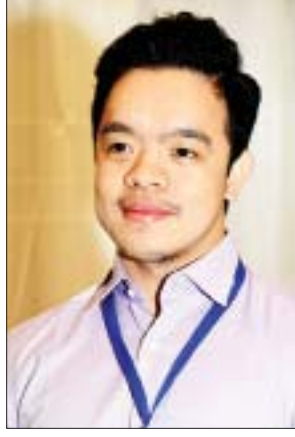
ဒေါက်တာကံသာညီမိ