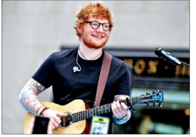
ယခင်က ဒီဂုဏ်ပြုဆုကိုရရှိခဲ့တဲ့ တေးသံရှင်တွေကတော့ ဂျက်စတင် ဘီဘာနဲ့ ပေါ့လ်မက်ကာနေတို့ ဖြစ်ကြကြောင်းလည်း သိရပါတယ်။

ဗြိတိန်ပေါ့ပ်ကြယ်ပွင့် အက်ဒီရီရန်ဟာ ယူကေရဲ့ ဆယ်စုနှစ်အတွင်း နံပါတ်တစ် တေးသံရှင်အဖြစ် ရွေးချယ်ခံခဲ့ရပါတယ်။ တေးရေးနဲ့ တေးဆိုတစ်ဦးဖြစ်သူ အက်ဒီရီရန်ရဲ့ ၂၀၁၇ ခုနှစ်အတွင်း ထုတ်လွှင့်ခဲ့တဲ့ တေးအယ်လ်ဘမ် "Shape of You" ဟာ သီတင်းပတ် ၁၀ ပတ်ကြာ နံပါတ်တစ်နေရာမှာ ရပ်တည်နိုင်ခဲ့ပြီး ၂၀၀၉-၂၀၁၉ ခုနှစ်အတွင်း ထုတ်လွှင့်ခဲ့တဲ့ ပေါ့ပ်ကြယ်ပွင့်ရဲ့ တေးအယ်လ်ဘမ် တွေဟာ ရောင်းအားအကောင်းဆုံးတေးအယ်လ်ဘမ်စာရင်းမှာ ရက်သတ္တ ၇၉ ပတ်ကြာအောင် ရပ်တည်နိုင်ခဲ့တာလည်း ဖြစ်ပါတယ်။ ဒါ့ကြောင့် အက်ဒီရီရန် ကို ယူကေရဲ့ ဆယ်စုနှစ်ရဲ့ တေးသံရှင်အဖြစ် ရွေးချယ်ဖော်ပြခဲ့တာဖြစ်တယ် လို့လည်း သိရပါတယ်။