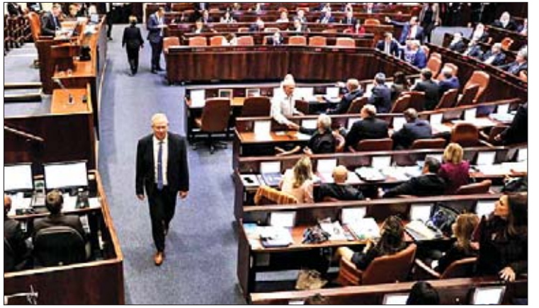
ဗိုလ်ချုပ်ကြီးဟောင်း ဘန်နီဂန်၏ ဒီဇင်ဘာ ၁၁ ရက်က အစွဲရောင်းပါတီမန်သို့ တက်ရောက် ရန် ရောက်ရှိလာစဉ်။

မတ်လတွင် ကျင်းပမည်ဖြစ်သည်။ နိုင်ငံရေးအရ မတိုးသာမဆုတ်သာ အခြေအနေနှင့်ပတ်သက်၍ အာဏာရအစိုးရနှင့်အတိုက်အခံပါတီများက အချင်းချင်းပြစ်တင်နေမှု က မဆန္ဒရှင်များကို မချင့်မရဲဖြစ်စေခဲ့သည်။ ရွေးကောက်ပွဲမှာ ၁၀ နှစ် ကြာ အုပ်ချုပ်မှုသက်တမ်းရှိပြီဖြစ်သည့် ဝန်ကြီးချုပ် နေတန်ယာဟုက လက်ရှိရာထူး ဆက်လက်ရယူနိုင်ခြင်း ရှိ မရှိဆိုသည်ကို အလေးထားမည် ဖြစ်သည်။ လာဘ်ပေးလာဘ်ယူမှု၊ လိမ်လည်မှုအပါအဝင်စွဲချက်များ ဖြင့် နေတန်ယာဟုကို စွဲချက်တင်မည်ဟုအစိုးရရှေ့နေများက နိုင်ငံတော် အတွင်းကြေညာခဲ့သည်။ နေတန်ယာဟုက တယ်လီကွန်းကုမ္ပဏီများကို မီဒီယာသတင်းရယူရာတွင် မျက်နှာသာပေးခဲ့သည်ဟု စွပ်စွဲခံနေရသည်။ သို့သော်လည်း အစွဲရောင်းဥပဒေအရ အပြစ်ရှိကြောင်းဆုံးဖြတ်ချက် ချမှတ် သည့်အထိ ၎င်းက ဝန်ကြီးချုပ်အဖြစ် ဆက်လက်၍ တာဝန်ထမ်းဆောင် နိုင်သည်။ ကိုးကား-အင်န်အိတ်ချ်ကော၊ ဘာသာပြန် - ကျော်ထိုက်စိုး