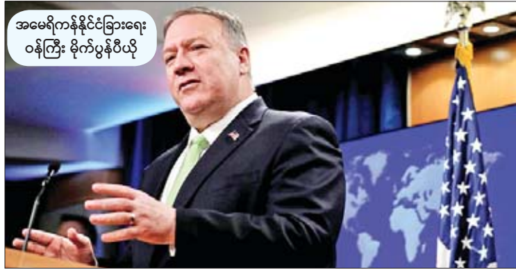
အမေရိကန်နိုင်ငံခြားရေး ဝန်ကြီး မိုက်ပွန်ပီယို