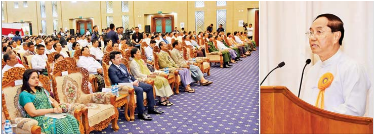
ဒုတိယသမ္မတ ဦးမြင့်ဆွေ (၂၀)ကြိမ်မြောက် မြန်မာ့တိုင်းရင်းဆေးသမားတော်များညီလာခံနှင့် နီးနှောဖလှယ်ပွဲ ဖွင့်ပွဲအခမ်းအနားတွင် အမှာစကားပြောကြားစဉ်။

မြန်မာ့တိုင်းရင်းဆေးပညာရပ်ကို ရိုးရာယဉ်ကျေးမှု အမွေအနှစ်ပညာရပ်တစ်ခုအဖြစ် ထိန်းသိမ်းစောင့်ရှောက်ရင်း အစွမ်းထက်တိုင်းရင်းဆေးဝါးများ ဖြစ်ပေါ်လာစေရန်နှင့်