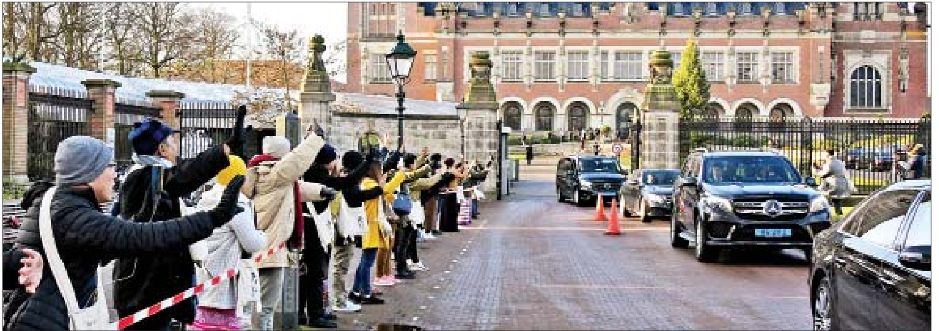
မြန်မာနိုင်ငံမှ လာရောက်ကြသောပြည်သူများနှင့် နယ်သာလန်နိုင်ငံနှင့် အခြားနိုင်ငံများမှ လာရောက်ကြသည့် ပြည်ပရောက် မြန်မာနိုင်ငံသားများက အပြည်ပြည်ဆိုင်ရာတရားရုံး(ICJ)ရှေ့ နိုင်ငံတော်၏အတိုင်ပင်ခံပုဂ္ဂိုလ် ဒေါ်အောင်ဆန်းစုကြည်အား လာရောက်ထောက်ခံအားပေးဝန်းရံကြစဉ်။

○ ရှေ့ဖိုးမှ နယ်သာလန်နိုင်ငံဆိုင်ရာ မြန်မာသံအမတ်ကြီး ဦးစိုးလင်းဟန်နှင့် မြန်မာ ကိုယ်စားလှယ်အဖွဲ့ဝင်များ၊ မြန်မာနိုင်ငံဘက်မှ လိုက်ပါဆောင်ရွက်နေကြ သည့် ပြည်တွင်း၊ ပြည်ပ ဥပဒေပညာရှင်များနှင့် ၎င်းတို့၏အထောက်အကူပြု အဖွဲ့ဝင်များ တက်ရောက်ကြသည်။ ယနေ့ ဒုတိယပိုင်းအစီအစဉ်ဖြစ်သည့် မြန်မာနိုင်ငံ၏ အပြည်ပြည်ဆိုင်ရာ တရားရုံးသို့ ဒုတိယအကြိမ် နှုတ်ဖြင့်လျှောက်ထားမှုအား ဒေသတော်ချိန် ညနေ ၄ နာရီခွဲတွင် ဆောင်ရွက်သွားမည်ဖြစ်သည်။ ယနေ့တွင်လည်း နိုင်ငံတော်၏အတိုင်ပင်ခံပုဂ္ဂိုလ်၏ဆောင်ရွက်မှုကို ထောက်ခံအားပေးဝန်းရံကြသည့် မြန်မာနိုင်ငံမှ လာရောက်ကြသော ပြည်သူ များနှင့် နယ်သာလန်နိုင်ငံနှင့် အခြားပြည်ပနိုင်ငံများမှ လာရောက်ကြသည့် မြန်မာနိုင်ငံသားများက အပြည်ပြည်ဆိုင်ရာတရားရုံး (ICJ) ရှေ့၌ လာရောက် ထောက်ခံအားပေးဝန်းရံကြသည်။ သတင်းစဉ်