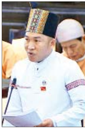
ချင်းပြည်နယ် မဲဆန္ဒနယ်အမှတ်(၁၀) မှ ဦးလားလ်မင်းထန်

စိုက်ပျိုးရေး၊ မွေးမြူရေးနှင့် ဆည်မြောင်းဝန်ကြီးဌာန ဝန်ကြီးက အဖွဲ့အစည်းရုံးများနှင့် လူနေအိမ်ရာများတည်ဆောက်ရန်အတွက် အမှုတိုပြုလုပ်၍ မြေလွတ်၊ မြေလပ်နှင့် မြေရိုင်းများ စီမံခန့်ခွဲမှုဟိုက်မတီသို့ လျှောက်ထားခြင်းသည် မူလပိုင်ရှင်ပြန်လည်ရရှိရေး နိုင်ငံတော်မှချမှတ်ထားသောမူများကို ဆန့်ကျင်ခြင်း ရှိ/မရှိနှင့် ပြည်ထောင်စုအစိုးရက မည်ကဲ့သို့ဆောင်ရွက်ပေးမည်ကို သိရှိလိုခြင်း မေးခွန်းတို့နှင့်စပ်လျဉ်း၍ စိုက်ပျိုးရေး၊ မွေးမြူရေးနှင့် ဆည်မြောင်းဝန်ကြီးဌာန ဒုတိယဝန်ကြီး ဦးလှကျော်ကလည်းကောင်း၊ ပြန်လည်ရင်းလင်းဖြေကြားခဲ့ကြသည်။