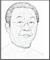
မောင်စာက

ရှေ့နေတစ်ဦးသည် မိမိလိုက်ပါဆောင်ရွက်သော မှုခင်း ကိစ္စတစ်ခုအတွက် အမှန်တရားကို ရှာဖွေ၍ အနိုင်ရယူ လိုချင်သည်။ အနိုင်ရယူဖို့ ဘယ်လိုအမှန်တရားကို ရှာဖွေမည်လဲ။ ဥပဒေပြဋ္ဌာန်းချက်တွေထဲမှာ မည်သို့ ရှာဖွေမည်နည်း။ အနှစ်ချုပ်သဘောမျှဝေပါရစေ။