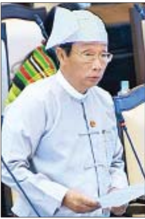
ဒုတိယဝန်ကြီး ဦးလှကျော်