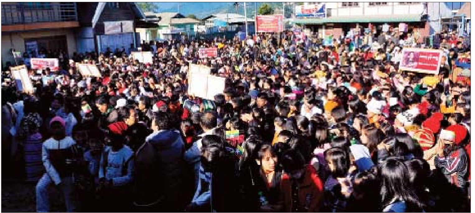
မင်းတပ်မြို့၌ နိုင်ငံတော်၏အတိုင်ပင်ခံပုဂ္ဂိုလ် ဒေါ်အောင်ဆန်းစုကြည်အား ထောက်ခံပွဲကျင်းပစဉ်။

ဂမ်ဘီယာနိုင်ငံက မြန်မာနိုင်ငံအပေါ် အပြည်ပြည်ဆိုင်ရာတရားရုံး(ICJ)တွင် တရား စွဲဆိုလျှောက်ထားမှုကို ဦးဆောင်သွားရောက် ဖြေရှင်းသည့် နိုင်ငံတော်၏အတိုင်ပင်ခံပုဂ္ဂိုလ် ဒေါ်အောင်ဆန်းစုကြည်အား လူထုထောက်ခံ ပွဲကို ဒီဇင်ဘာ ၁၀ ရက် နံနက် ၉ နာရီက မင်းတပ်မြို့ မြို့မဈေးရှေ့၌ ကျင်းပရာ “We Stand with Our Leader”၊ “We Stand with Daw Aung San Suu Kyi- We Stand with State Counsellor of Myanmar”၊ “နိုင်ငံတော်၏ အကျိုးစီးပွားကာကွယ်ရန် နိုင်ငံသားတိုင်းတွင် တာဝန်ရှိသည်”