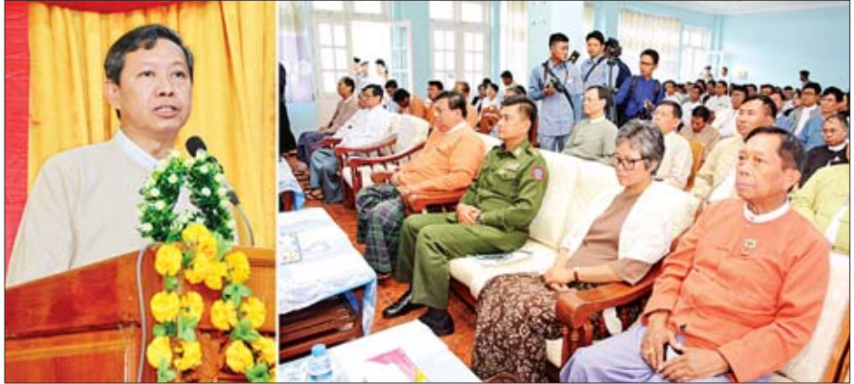
တက်မြောက်မှုများအား လူငယ်၊ လူရွယ်များအတွင်း ပိုမိုရရှိတတ်မြောက်ကြစေရန်နှင့် စက်မှုလယ်ယာကဏ္ဍ၏ လုပ်သားဈေးကွက်လိုအပ်ချက်တွင် အရည်အချင်း ပြည့်ဝသော လူ့စွမ်းအားအရင်းအမြစ်များ ရရှိနိုင်စေရန် ရည်ရွယ်၍ စက်မှုလယ်ယာနည်းပညာ AGTI သုံးနှစ် ဒီပလိုမာသင်တန်းကို ဖွင့်လှစ်ခြင်းဖြစ်သည်။

နေပြည်တော် ဒီဇင်ဘာ ၁၂ စက်မှုလယ်ယာနည်းပညာ (Farm Machinery Technology) AGTI သုံးနှစ် ဒီပလိုမာသင်တန်း ဖွင့်ပွဲအခမ်းအနားကို ယနေ့မုန်လွဲ ၁ နာရီတွင် ဧရာဝတီတိုင်းဒေသကြီး ကျိုက်လတ်မြို့ရှိ အစိုးရစက်မှုလက်မှုသိပ္ပံ(ကျိုက်လတ်)၌ ကျင်းပသည်။