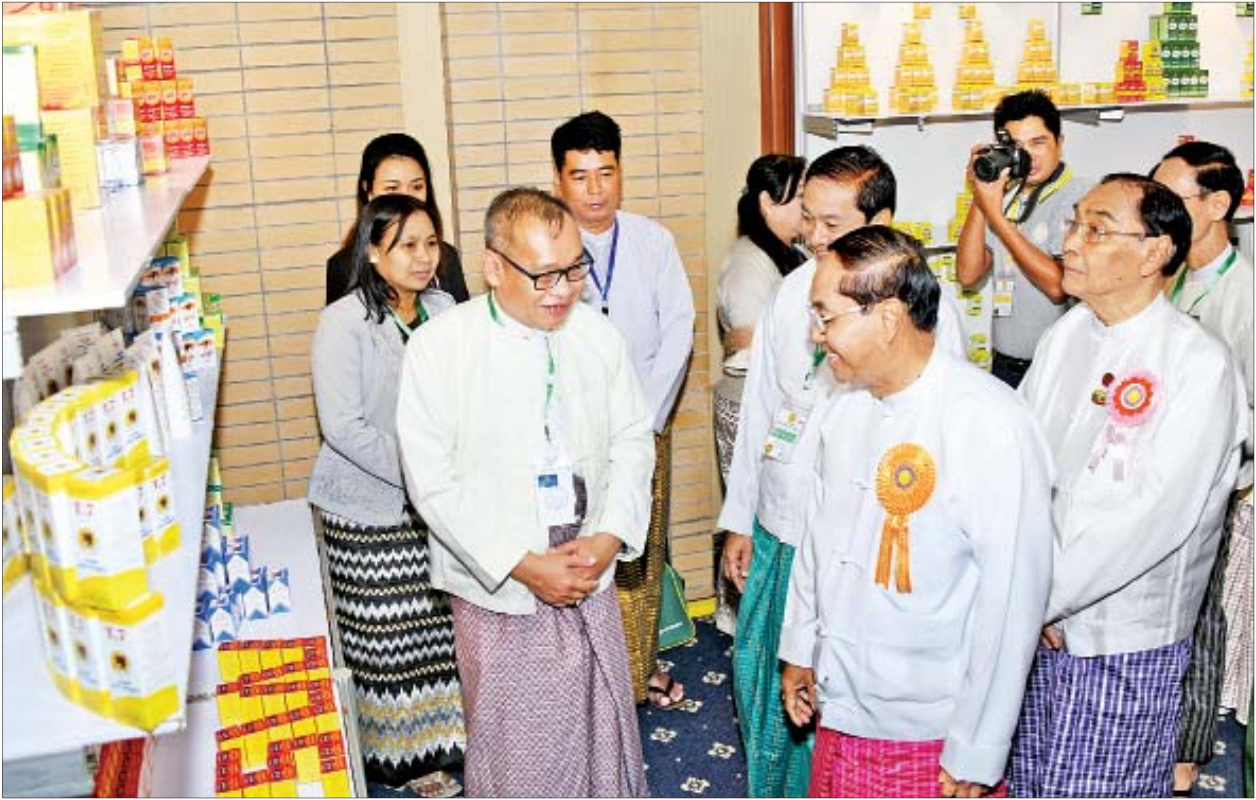
ဒုတိယသမ္မတ ဦးမြင့်ဆွေ (၂၀)ကြိမ်မြောက် မြန်မာ့တိုင်းရင်းဆေးသမားတော်များညီလာခံနှင့် နီးနှောဖလှယ်ပွဲအခမ်းအနား အမှတ် ခင်းကျင်းပြသထားသည့် ပြခန်းများကို လှည့်လည်ကြည့်ရှုစဉ်။

အခမ်းအနားတွင် ဒုတိယသမ္မတက မြန်မာ့တိုင်းရင်းဆေးသမားတော်များ ညီလာခံကို ၂၀၀၀ ပြည့်နှစ်မှစတင်၍ နှစ်စဉ်ကျင်းပခဲ့သည်မှာ ယခုဆူလျှင် (၂၀)ကြိမ်မြောက်ရှိပြီ ဖြစ်ကြောင်း၊ စာမျက်နှာ ၅ ကော်လံ ၁ သို့ *