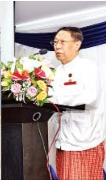
ပြည်ထောင်စုရွေးကောက်ပွဲကော်မရှင်ဥက္ကဋ္ဌ ဦးလှသိန်း ၂၀၂၀ ပြည့်နှစ် အထွေထွေရွေးကောက်ပွဲလုံခြုံရေး ကြိုတင်ပြင်ဆင်မှုဆိုင်ရာ ဆွေးနွေးပွဲတွင် အမှာစကားပြောကြားစဉ်။

ပါကြောင်း၊ ရွေးကောက်ပွဲတစ်ခု တည်ငြိမ်အေးချမ်းစွာ ကျင်းပနိုင်ရန် ကော်မရှင်တစ်ခုတည်းဖြင့် ဆောင်ရွက် ၍ မရပါကြောင်း၊ ကဏ္ဍစုံမှ ပါဝင် ပတ်သက်သူများ၏ ပူးပေါင်းပါဝင်မှု များစွာ လိုအပ်ပါကြောင်း၊ ထို့ကြောင့် ရွေးကောက်ပွဲလုပ်ငန်းစဉ်များအလိုက် ပူးပေါင်းဆောင်ရွက်ရမည့် ဝန်ကြီး ဌာနများ၊ အဖွဲ့အစည်းများနှင့် စဉ်ဆက်မပြတ် တွေ့ဆုံဆွေးနွေးရခြင်း ဖြစ်ပါကြောင်း၊ ပြည်ထောင်စု ရွေးကောက်ပွဲကော်မရှင်၏ မဟာ