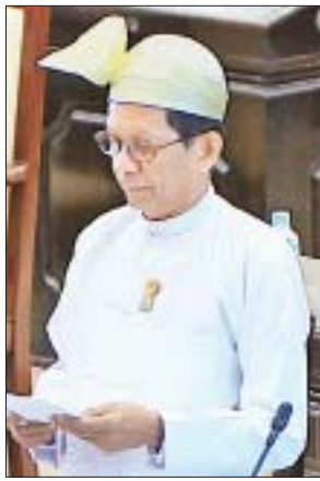
ဒုတိယဝန်ကြီး ဦးသိန်းဝင်း