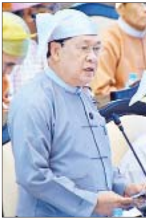
ပြည်ထောင်စုဝန်ကြီး ဦးသိန်းဝင်း

အစည်းအဝေးတွင် ချင်းပြည်နယ် မဲဆန္ဒနယ်အမှတ်(၁၀)မှ ဦးလားလ် မင်းထန်၏ အဆိုအရ ချင်းပြည်နယ် မတူပီမြို့နယ်ရှိ လေ့ရှိပျိုးပျက်၊ ဘာနိုင်တောင်ပျိုးပျက်နှင့် ရေဇာပျိုးပျက်တို့မှ MPT တာဝါတိုင်များကို Link အတွက်သာ သီးသန့်မသုံးဘဲ ဖုန်းလှိုင်းလွှင့်ပေးသော ကိရိယာထပ်တံဆိပ်ဆောင်ပေးရန် အစီအစဉ်ရှိ/မရှိမေးခွန်းနှင့် စပ်လျဉ်း၍ ပြည်ထောင်စုအဆင့် ဆက်သွယ်ရေးဝန်ကြီးဌာန ဒုတိယဝန်ကြီး ဦးသိန်းဝင်းက မြန်မာ့ဆက်သွယ်ရေးလုပ်ငန်းအနေဖြင့် လေ့ရှိပျိုးပျက်အနီးတွင် GSM စခန်းတစ်ခုကို တည်ဆောက်ထားရှိဝန်ဆောင်မှုပေးလျက်ရှိကြောင်း၊ လက်ရှိ Micro Link အတွက်သာ သီးသန့်အသုံးပြုနိုင်သော ဘာနိုင်တောင်ပျိုးပျက်နှင့် ရေဇာပျိုးပျက်တို့ရှိ မိုက်ကရိုစခန်းများ၏ တာဝါတိုင်များတွင် စက်ပစ္စည်းများထပ်တံဆိပ်ဆောင်၍ GSM စခန်းများ တည်ဆောက်ဖွင့်လှစ်ပေးရန်မှာ ရင်းနှီးမြှုပ်နှံမှုများခြင်း၊ သုံးစွဲမည့် လူဦးရေနည်းခြင်း၊ ပြန်လည်ရရှိနိုင်မည့်ဝင်ငွေနည်းပါးခြင်းတို့ကြောင့် အဆိုပါ မိုက်ကရိုစခန်းများ၏ တာဝါတိုင်များတွင် GSM စက်ပစ္စည်းများ ထပ်တံဆိပ်ဆောင်၍ GSM စခန်းများ ဖွင့်လှစ်ပေးနိုင်ရန် လက်တလောတွင် အစီအစဉ်မရှိသေးပါကြောင်း။