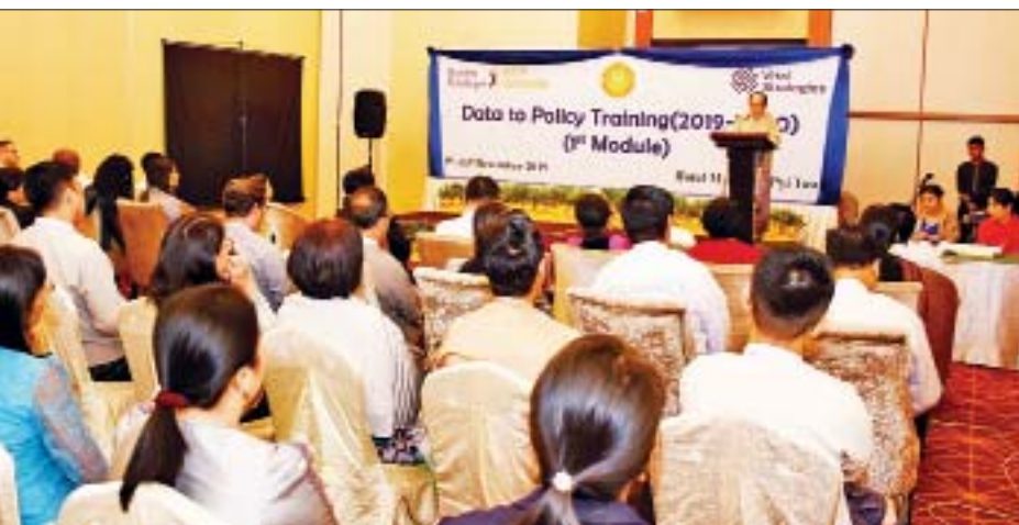
အချက်အလက်များသည်လည်း အရေးကြီးပါကြောင်း။ ထိုသို့ သတင်းအချက်အလက်များ ခိုင်မာတိကျစွာရရှိ နိုင်ရန်အတွက် ကျန်းမာရေးသတင်းအချက်အလက်စနစ်

ကျန်းမာရေးနှင့် အားကစားဝန်ကြီးဌာနနှင့် Bloomberg Data to Health Initiative တို့ ပူးပေါင်းကျင်းပသည့် “သတင်းအချက်အလက်ကိုအခြေခံ၍ မူဝါဒချမှတ်ဆောင်ရွက်ခြင်း Data to Policy (2019-2020)” သင်တန်း ဖွင့်ပွဲကို ယနေ့နံနက်ပိုင်းတွင် Hotel Max နေပြည်တော်၌ ကျင်းပသည်။ အကျိုးရှိစွာအသုံးချ ဖွင့်ပွဲ၌ ပြည်ထောင်စုဝန်ကြီး ဒေါက်တာမြင့်ထွေးက ပြောကြားရာတွင် ကျိုးကြောင်းဆိုင်လုံသည့် ဆုံးဖြတ်ချက်များ ပြုလုပ်နိုင်ရန်အတွက် တိကျမှန်ကန်သော သတင်းအချက်အလက်များကို အကျိုးရှိစွာအသုံးချနိုင်မှု စွမ်းရည်သည် အရေးကြီးပါကြောင်း၊ လက်တွေ့မြေပြင် အခြေအနေနှင့်ကိုက်ညီသင့်တော်သည့် စီမံချက်လုပ်ငန်း များ ချမှတ်နိုင်ရန်အတွက် ကိန်းဂဏန်းအချက်အလက် များသာမက ဝိသေသလက္ခဏာနှင့် အရည်အသွေးဆိုင်ရာ