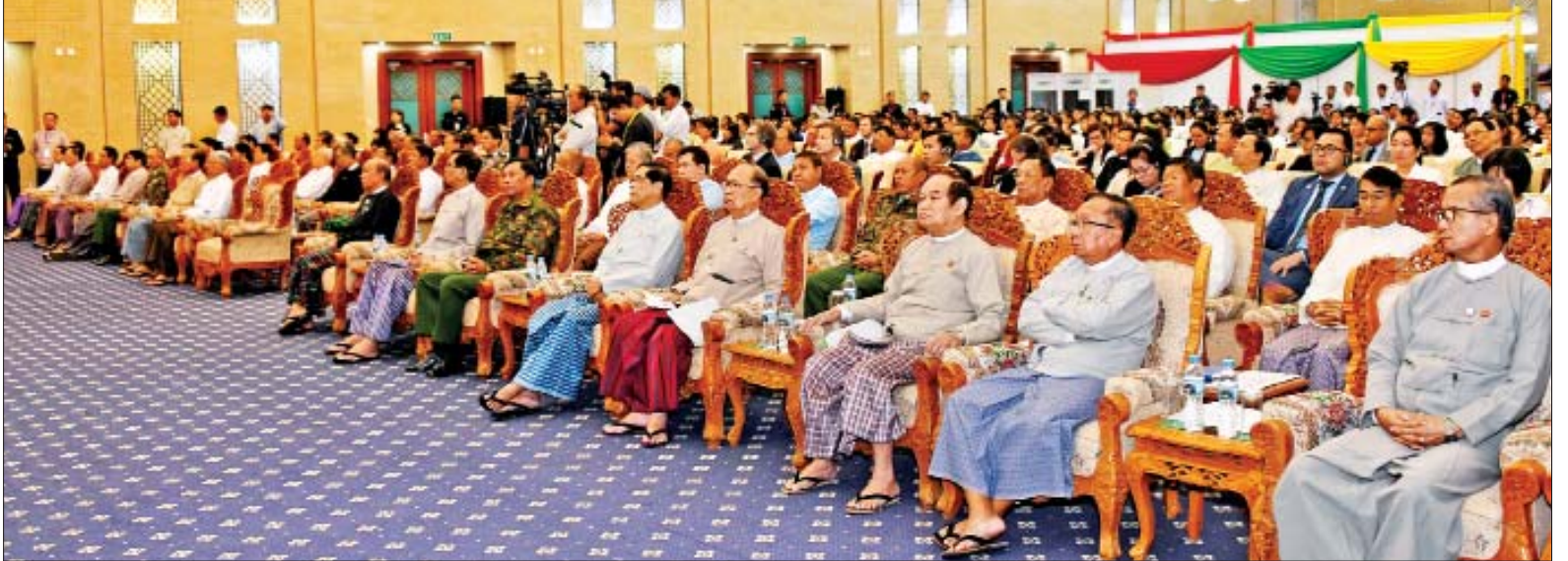
အပြည်ပြည်ဆိုင်ရာအဂတိလိုက်စားမှုတိုက်ဖျက်ရေးနေ့ အထိမ်းအမှတ်အခမ်းအနားသို့ တက်ရောက်လာသည့် ပြည်သူ့လွှတ်တော် ဒုတိယဥက္ကဋ္ဌ၊ အမျိုးသားလွှတ်တော် ဒုတိယဥက္ကဋ္ဌ၊ ပြည်ထောင်စုဝန်ကြီးများနှင့် တာဝန်ရှိသူများကို တွေ့ရစဉ်။

လိုက်နာကျင့်သုံး CPU များ ခိုင်မာအားကောင်းစွာ အလုပ်လုပ်နေခြင်းဖြင့် ဌာနဆိုင်ရာဘက်က ပြုပြင်ပြောင်းလဲရေးများ ဆောင်ရွက်နေကြပြီဖြစ်သည့်အတွက် စီးပွားရေးလုပ်ငန်းရှင်များဘက်ကလည်း အဂတိလိုက်စားမှုတိုက်ဆန့်ကျင်သောကျင့်ဝတ်များကို ကိုယ်တိုင်ရေးဆွဲ၍ ဖြောင့်မတ်တည်ကြည်မှုနှင့် တာဝန်ယူမှုရှိစွာဖြင့် လိုက်နာကျင့်သုံးသွားကြရန်လိုအပ်ကြောင်း၊ “အဂတိလိုက်စားမှုဆန့်ကျင်ရေးအတွက် ကျွန်ုပ်တို့အားလုံး စုပေါင်းညီညွတ်ကြပါစို့” ဟူသော ဆောင်ပုဒ်နှင့်အညီ ပြည်သူ့ဝန်ထမ်းများ၊ စာမျက်နှာ ၄ ကော်လံ ၁ သို့ ❖