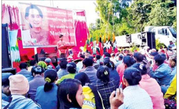
အပြည်ပြည်ဆိုင်ရာတရားရုံး(ICJ)တွင် တရားစွဲဆိုလျှောက်ထားမှုကို သွားရောက်ဖြေရှင်းသည့် နိုင်ငံတော်၏အတိုင်ပင်ခံပုဂ္ဂိုလ် ဒေါ်အောင်ဆန်းစုကြည်နှင့်အဖွဲ့အား ဝန်းရံထောက်ခံလူထုလှုပ်ရှားမှုကို ကနီမြို့ ဗိုလ်ချုပ်ပန်းခြံတွင် ကျင်းပစဉ်။ ခင်ဝင်းကြည်(ပြန်/ဆက်)