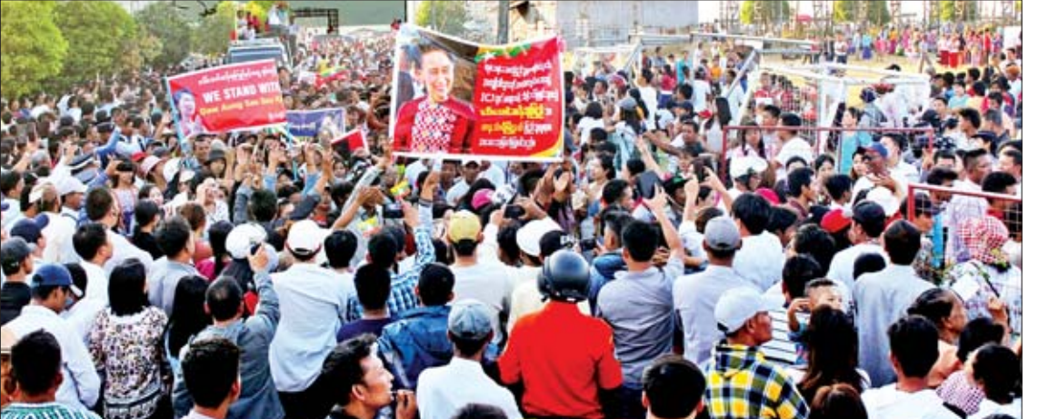
အပြည်ပြည်ဆိုင်ရာတရားရုံး(ICJ)တွင် တရားစွဲဆိုလျှောက်ထားမှုကို သွားရောက်ဖြေရှင်းသည့် နိုင်ငံတော်၏အတိုင်ပင်ခံပုဂ္ဂိုလ် ဒေါ်အောင်ဆန်းစုကြည်နှင့်အဖွဲ့အား ဝန်းရံထောက်ခံလူထုလှုပ်ရှားမှုကို မြိတ်မြို့ မြိတ်ကုန်တိုက်အနီး သဲကွင်းတွင် ကျင်းပစဉ်။ ခိုင်ထူး(ပြန်/ဆက်)