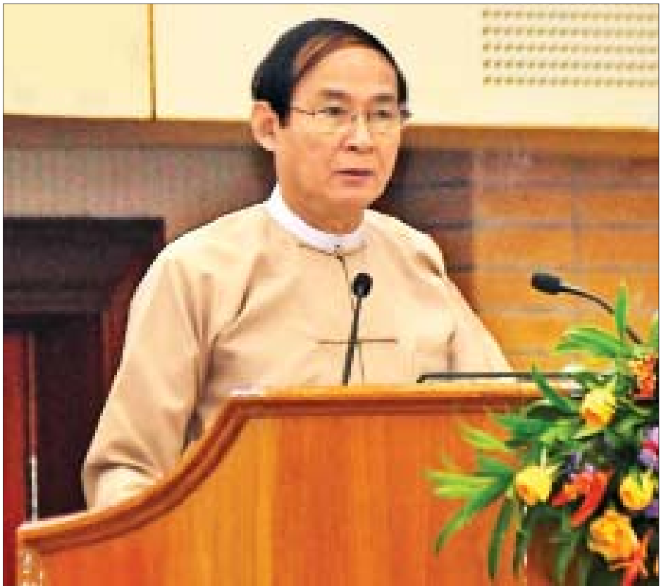
နိုင်ငံတော်သမ္မတ ဦးဝင်းမြင့် အပြည်ပြည်ဆိုင်ရာအဂတိလိုက်စားမှုတိုက်ဖျက်ရေးနေ့ အခမ်းအမှတ် အခမ်းအနားတွင် မိန့်ခွန်းပြောကြားစဉ်။

နေပြည်တော် ဒီဇင်ဘာ ၉ အပြည်ပြည်ဆိုင်ရာအဂတိလိုက်စားမှုတိုက်ဖျက်ရေးနေ့ အခမ်းအမှတ်အခမ်းအနားကို ယနေ့ နံနက် ၉ နာရီတွင် နေပြည်တော်ရှိ မြန်မာအပြည်ပြည်ဆိုင်ရာကွန်ဗင်းရှင်း ဗဟိုဌာန (၂) ဦးကျင်းပရာ နိုင်ငံတော်သမ္မတ ဦးဝင်းမြင့် တက်ရောက်မိန့်ခွန်းပြောကြားသည်။