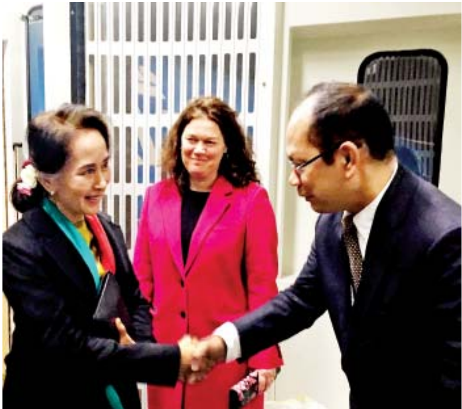
နိုင်ငံတော်၏အတိုင်ပင်ခံပုဂ္ဂိုလ် ဒေါ်အောင်ဆန်းစုကြည်အား နယ်သာလန်နိုင်ငံ နိုင်ငံခြားရေးဝန်ကြီးဌာန သံတမန်ရေးရာဌာနအကြီးအကဲ Ms. Pascal Grotenhuis နှင့် နယ်သာလန်နိုင်ငံဆိုင်ရာ မြန်မာသံအမတ်ကြီး ဦးစိုးလင်းဟန်တို့က အမ်စတာဒမ်မြို့ Schiphol အပြည်ပြည်ဆိုင်ရာလေဆိပ်၌ ကြိုဆိုနှုတ်ဆက်ကြစဉ်။

သည်ဟိတ်ဂ် ဒီဇင်ဘာ ၉ နိုင်ငံတော်၏အတိုင်ပင်ခံပုဂ္ဂိုလ်၊ နိုင်ငံခြားရေးဝန်ကြီးဌာန ပြည်ထောင်စုဝန်ကြီး ဒေါ်အောင်ဆန်းစုကြည်ဦးဆောင်သည့် ကိုယ်စားလှယ်အဖွဲ့သည် ဂမ်ဘီယာနိုင်ငံက မြန်မာနိုင်ငံအပေါ် အပြည်ပြည်ဆိုင်ရာတရားရုံး(ICJ)၌ တရားစွဲဆိုလျှောက်ထားမှုကိုတုံ့ပြန်ရာတွင် ကြားဖြတ်စီမံဆောင်ရွက်ချက် (Provisional Measures)အတွက် နှုတ်ဖြင့်လျှောက်လဲခြင်း (Oral Proceedings)ပြုလုပ်ရန် ဒီဇင်ဘာ ၈ ရက် ဒေသစံတော်ချိန် နံနက်ပိုင်းတွင် နေပြည်တော်မှထွက်ခွာပြီး ထိုင်းနိုင်ငံ ဘန်ကောက်မြို့မှတစ်ဆင့် လေကြောင်းခရီးဖြင့် ဆက်လက်ထွက်ခွာရာ ဒီဇင်ဘာ ၈ ရက် ဒေသစံတော်ချိန် ညနေ ၆ နာရီ ၁၅ မိနစ်တွင် စာမျက်နှာ ၄ ကော်လံ ၁ သို့ ❖