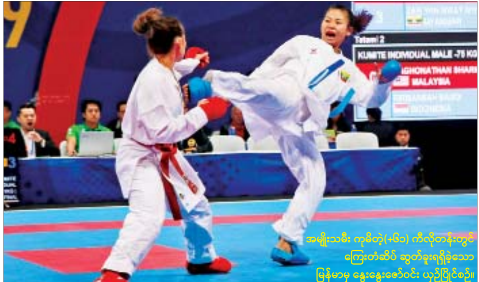
အမျိုးသမီး ကုမိတ်(၅၅) ကီလိုတန်းတွင် ကြေးတစ်ဆိပ် ဆွတ်ခူးရရှိခဲ့သော မြန်မာမှ နွေးနွေးဝေဝေ ယှဉ်ပြိုင်စဉ်။

ကရတေး အားကစားပြိုင်ပွဲ အမျိုးသား သုံးယောက်တွဲအသင်းလိုက် ပြိုင်ပွဲတွင် မြန်မာအသင်းသည် အိမ်ရှင်ဖိလစ်ပိုင်အသင်းကို ရှုံးနိမ့် ခဲ့ပြီး အမျိုးသမီး ကုမိတ်(၅၅) ကီလို