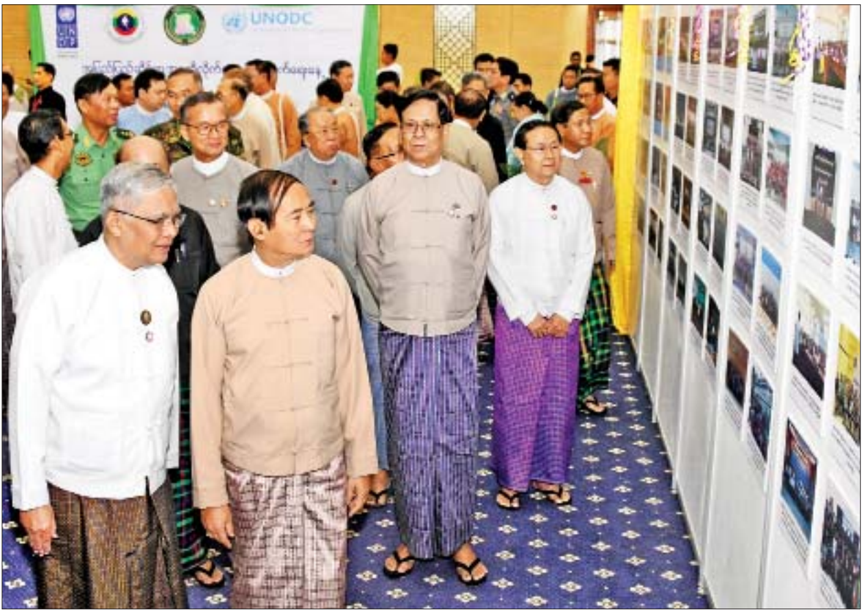
နိုင်ငံတော်သမ္မတ ဦးဝင်းမြင့် အဂတိလိုက်စားမှုတိုက်ဖျက်ရေးဆိုင်ရာ ဆောင်ရွက်ချက်မှတ်တမ်းပြခန်းကို လှည့်လည်ကြည့်ရှုစဉ်။

ထို့နောက် အဂတိလိုက်စားမှုတိုက်ဖျက်ရေးကော်မရှင် ဥက္ကဋ္ဌ ဦးအောင်ကြည်က အဂတိလိုက်စားမှုတိုက်ဖျက်ရေးမဟာဗျူဟာအကောင်အထည်ဖော်ဆောင်ရွက်မှုများနှင့် စပ်လျဉ်း၍ ရှင်းလင်းတင်ပြရာတွင် အဂတိလိုက်စားမှုတိုက်ဖျက်ရေးမဟာဗျူဟာတွင် လုပ်ငန်းဧရိယာ ၅ ရပ်ပါရှိကြောင်း၊ ယင်းတို့မှာ (၁) တားဆီးကာကွယ်ခြင်း၊ စုံစမ်းစစ်ဆေးတရားစွဲဆိုခြင်းတို့အတွက် ထိရောက်ခိုင်မာသော အခြေခံကောင်းများ တည်ဆောက်ခြင်း၊ (၂) ဖြောင့်မတ်တည်ကြည်မှုနှင့် စွမ်းဆောင်ရည် မြှင့်တင်ခြင်း၊ (၃) တားဆီးကာကွယ်တိုက်ဖျက်ရာတွင် ပြည်တွင်းနှင့် နိုင်ငံတကာအဖွဲ့အစည်းများနှင့် ပူးပေါင်းဆောင်ရွက်မှုမြှင့်တင်ခြင်း၊ (၄) နိုင်ငံတော်ပိုင်ဘဏ္ဍာရန်ပုံငွေပစ္စည်းများနှင့် နိုင်ငံသားတို့၏အကျိုးစီးပွားကို ထိရောက်စွာကာကွယ်ခြင်း၊ (၅) အဂတိလိုက်စားမှုကင်းရှင်းသော စီးပွားရေးနယ်ပယ်ဖြစ်ပေါ်စေခြင်းတို့ဖြစ်ကြောင်း။ အဆိုပါ အခြေခံကောင်းများ