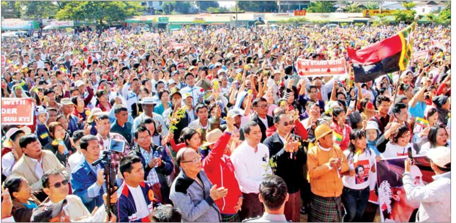
အပြည်ပြည်ဆိုင်ရာတရားရုံး(ICJ) တွင် တရားစွဲဆိုလျှောက်ထားမှုကို သွားရောက်ဖြေရှင်းသည့် နိုင်ငံတော်၏အတိုင်ပင်ခံပုဂ္ဂိုလ် ဒေါ်အောင်ဆန်းစုကြည်နှင့်အဖွဲ့အား ဝန်းရံထောက်ခံလူထု တင်စိုး(ပဲခူး)

အလားတူ နိုင်ငံတော်၏အတိုင်ပင်ခံပုဂ္ဂိုလ် ဒေါ်အောင်ဆန်းစုကြည်နှင့်အဖွဲ့အား ဝန်းရံထောက်ခံကြောင်း လူထုလှုပ်ရှားမှုကို ယနေ့