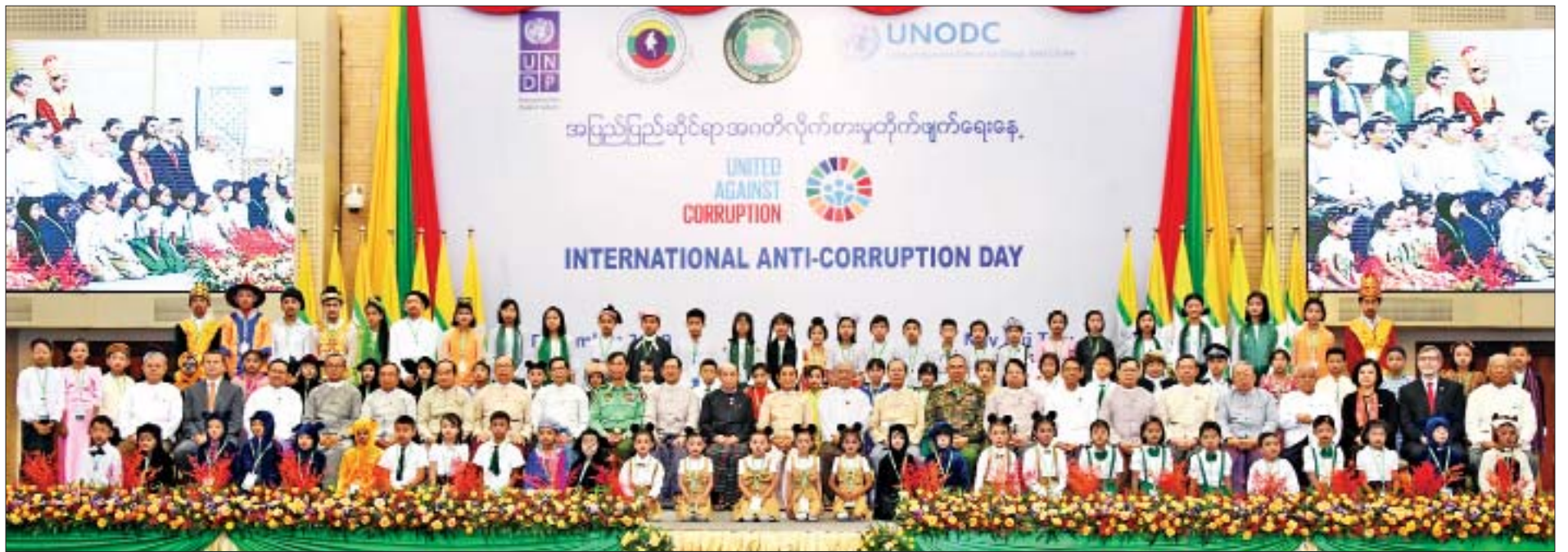
နိုင်ငံတော်သမ္မတ ဦးဝင်းမြင့် ပြည်သူ့လွှတ်တော်ဒုတိယဥက္ကဋ္ဌ၊ အမျိုးသားလွှတ်တော်ဒုတိယဥက္ကဋ္ဌ၊ ပြည်ထောင်စုဝန်ကြီးများ၊ အခမ်းအနားသို့တက်ရောက်လာကြသူများ၊ ကုလသမဂ္ဂဌာနညွှန်ကြားရေးမှူး (တာဝန်ခံ)၊ UNDP နှင့် UNODC ရုံးတို့မှ ကိုယ်စားလှယ်များ၊ ဆုရကျောင်းသား ကျောင်းသူများနှင့်အတူ စုပေါင်းမှတ်တမ်းတင်ဓာတ်ပုံရိုက်စဉ်။

❖ နိုင်ငံတော်သမ္မတတစ်ပါး အမျိုးသားလူ့အခွင့်အရေး ကော်မရှင်ဥက္ကဋ္ဌ၊ ပြည်သူ့လွှတ်တော်နှင့် အမျိုးသားလွှတ်တော်တို့မှ ကော်မတီ ဥက္ကဋ္ဌများ၊ ပြည်ထောင်စုတရားလွှတ်တော်ချုပ်တရားသူကြီး၊ ဒုတိယဝန်ကြီးများ၊ ဒုတိယရှေ့နေချုပ်၊ နေပြည်တော်ကောင်စီဝင်များ၊ နေပြည်တော်စည်ပင်သာယာရေးကော်မတီ ဒုတိယမြို့တော်ဝန်နှင့် ကော်မတီဝင်များ၊ အဂတိလိုက်စားမှု တိုက်ဖျက်ရေးကော်မရှင် အတွင်းရေးမှူးနှင့် အဖွဲ့ဝင်များ၊ မြန်မာနိုင်ငံကုန်သည်များနှင့် စက်မှုလက်မှုလုပ်ငန်းရှင်များအသင်းချုပ်ဥက္ကဋ္ဌ၊ မြန်မာနိုင်ငံသတင်းမီဒီယာကောင်စီဥက္ကဋ္ဌ၊ ဌာနဆိုင်ရာ တာဝန်ရှိသူများ၊ သံတမန်များ၊ United Nations Office on Drugs and Crime-UNODC၊ United Nations Development Programme-UNDP နှင့် အပြည်ပြည်ဆိုင်ရာအဖွဲ့အစည်းများမှ ပုဂ္ဂိုလ်များ၊ မီဒီယာများနှင့် ဖိတ်ကြားထားသည့် ဧည့်သည်တော်များ တက်ရောက်ကြသည်။ အခမ်းအနားတွင် နိုင်ငံတော်သမ္မတ ဦးဝင်းမြင့်က မိန့်ခွန်းပြောကြားသည်။ (နိုင်ငံတော်သမ္မတ ဦးဝင်းမြင့်၏ မိန့်ခွန်းကို စာမျက်နှာ ၅ တွင် ဖော်ပြထားပါသည်)