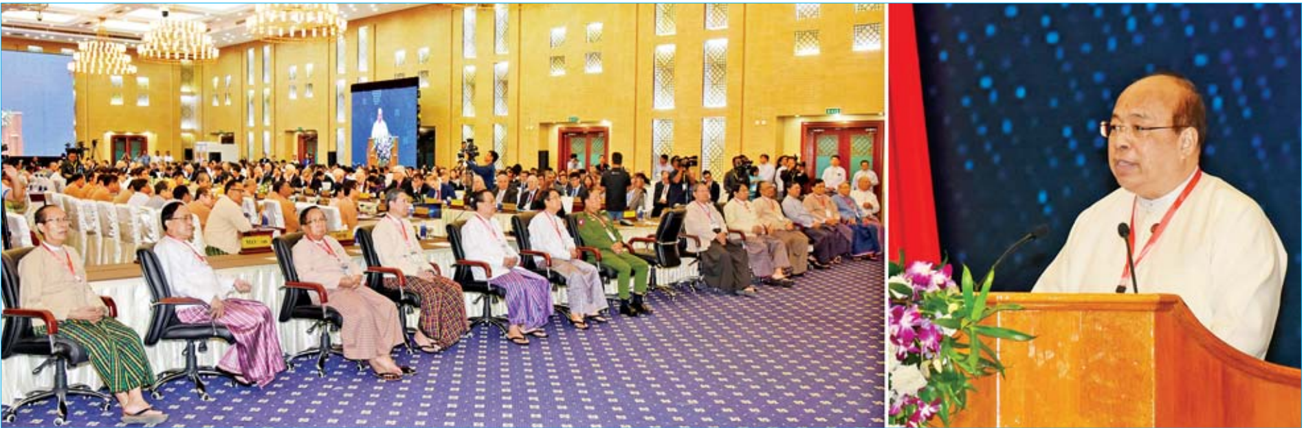
ဒုတိယအကြိမ် မြန်မာနိုင်ငံဖွံ့ဖြိုးတိုးတက်မှုစကားပိုင်းဆွေးနွေးပွဲ ဖွင့်ပွဲအခမ်းအနားတွင် ပြည်ထောင်စုဝန်ကြီး ဦးဝင်းခိုင် အမှာစကားပြောကြားစဉ်။