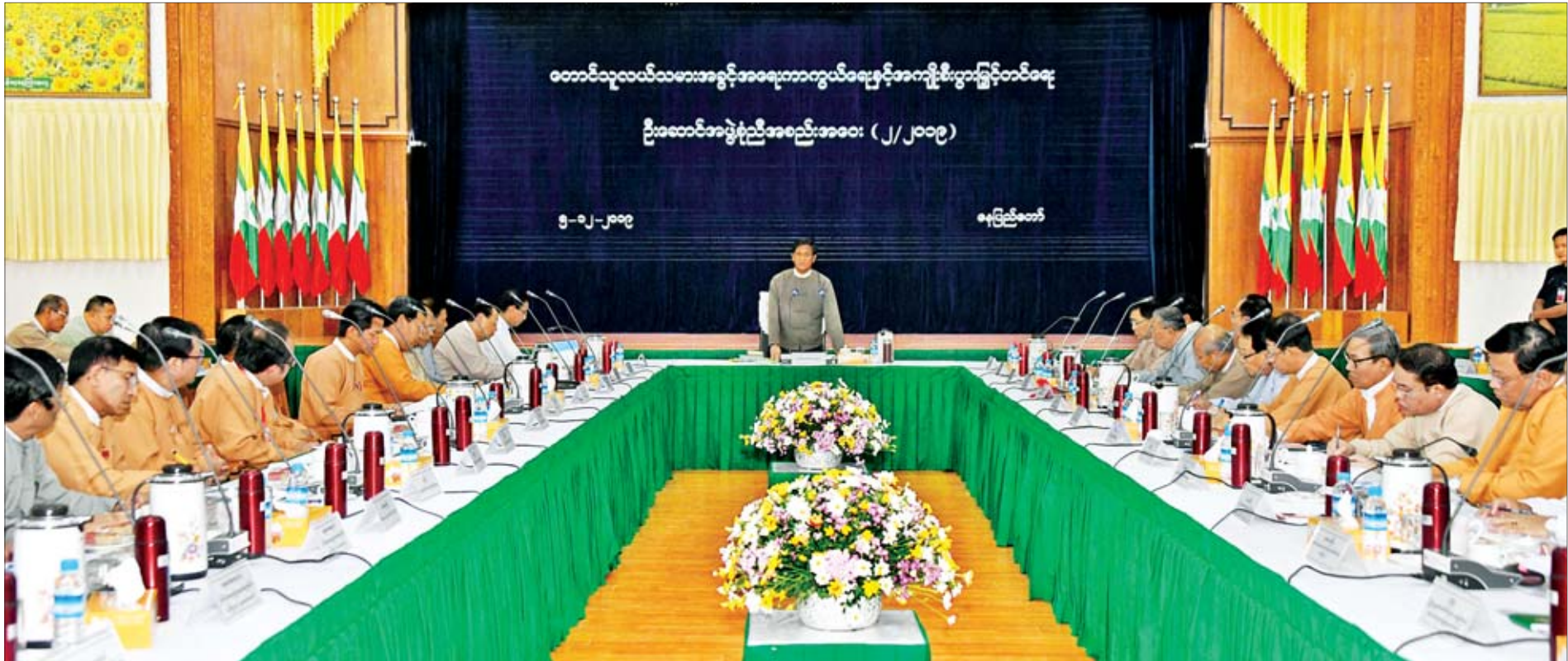
ဒုတိယသမ္မတ ဦးဟင်နရီဗန်ထီးယူ တောင်သူလယ်သမားအခွင့်အရေးကာကွယ်ရေးနှင့် အကျိုးစီးပွားမြှင့်တင်ရေး ဦးဆောင်အဖွဲ့စုံညီအစည်းအဝေးတွင် အမှာစကားပြောကြားစဉ်။

နေပြည်တော် ဒီဇင်ဘာ ၅ တောင်သူလယ်သမားအခွင့်အရေးကာကွယ်ရေးနှင့် အကျိုးစီးပွားမြှင့်တင်ရေးဦးဆောင်အဖွဲ့ စုံညီအစည်းအဝေးကို ယနေ့ မွန်းလွဲ ၃ နာရီတွင် နေပြည်တော်ရှိ စိုက်ပျိုးရေး၊ မွေးမြူရေးနှင့် ဆည်မြောင်းဝန်ကြီးဌာန အစည်းအဝေးခန်းမ၌ ကျင်းပရာ တောင်သူလယ်သမားအခွင့်အရေးကာကွယ်ရေးနှင့် အကျိုးစီးပွားမြှင့်တင်ရေးဦးဆောင်အဖွဲ့ အဖွဲ့ခေါင်းဆောင် ဒုတိယသမ္မတ ဦးဟင်နရီဗန်ထီးယူ တက်ရောက်အမှာစကားပြောကြားသည်။ တက်ရောက် အစည်းအဝေးသို့ တောင်သူလယ်သမားအခွင့်အရေးကာကွယ်ရေးနှင့် အကျိုးစီးပွားမြှင့်တင်ရေး ဦးဆောင်အဖွဲ့ အတွင်းရေးမှူး စိုက်ပျိုးရေး၊ မွေးမြူရေးနှင့် ဆည်မြောင်းဝန်ကြီးဌာန ပြည်ထောင်စုဝန်ကြီး ဒေါက်တာအောင်သူ၊ ပြန်ကြားရေးဝန်ကြီးဌာန ပြည်ထောင်စုဝန်ကြီး ဒေါက်တာဖေမြင့်၊ လျှပ်စစ်နှင့် စွမ်းအင်ဝန်ကြီးဌာန ပြည်ထောင်စုဝန်ကြီး ဦးဝင်းခိုင်၊ လူမှုဝန်ထမ်း၊ ကယ်ဆယ်ရေးနှင့် ပြန်လည်နေရာချထားရေးဝန်ကြီးဌာန ပြည်ထောင်စုဝန်ကြီး ဒေါက်တာ ဝင်းမြတ်အေး၊ ပြည်ထောင်စုရှေ့နေချုပ် ဦးထွန်းထွန်းဦး၊ စာမျက်နှာ ၄ ကော်လံ ၁ သို့ ❖