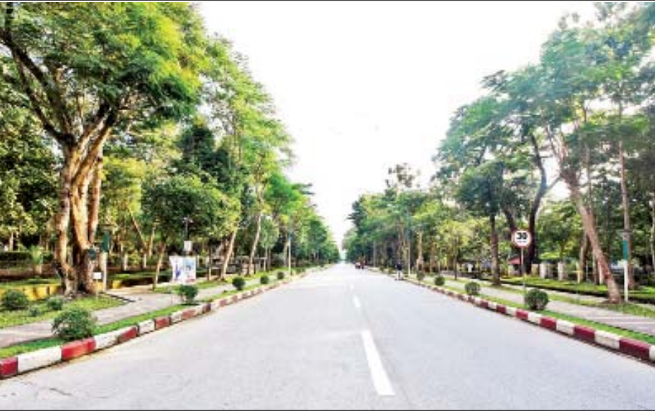
ရန်ကုန်တက္ကသိုလ် အဓိပတိလမ်းမကြီး။

(ယမန်နေမှအဆက်) ကျွန်မတို့အဆောင်တွေထဲမှာ RC လိုနားနေအခန်းတွေရှိပါတယ်။ စာသင်ဆောင်တွေရဲ့ အခန်းထောင့်တစ်ခုမှာ နားနေဆောင်လိုလုပ်ပေးထားပါတယ်။ တက္ကသိုလ်ကျောင်းသူပီပီ အရွယ်ကလည်းငယ်သေးတော့ အတော်လှချင်ကြတာပေါ့။ အဲဒီအခန်းတွေရောက်တာနဲ့ ကျွန်မတို့က အလှပြင်ကြပါတယ်။ အရင်ခေတ်ကတော့ အခုလိုမျိုး အလှပြင်ပစ္စည်းတွေမစုံသေးပါဘူး။ ဒေါ်သီသနပ်ခါးမူနဲ့ကို ဘူးလေးနဲ့ထည့်လာပြီးတော့ တို့ပတ်ကလေးပါ ပါပါတယ်။ အဲဒါနဲ့ မျက်နှာကိုရိုက်တော့တာပါပဲ။ ကျွန်မတို့ခေတ်ကတော့ အာချီဒါမှမဟုတ် ပရိုမီနာလိမ်းတဲ့ခေတ်ပါပဲ။ မျက်ခုံးမွေးဆွဲတာတွေ၊ မျက်တောင်ကော့တာတွေ၊ အခုလိုလည်း အလှအပတွေ မလုပ်တတ်ကြပါဘူး။ အာချီလိမ်းမယ် ဒါမှမဟုတ် ပရိုမီနာလိမ်းမယ်။ ပြီးရင် အပေါ်ကနေ သနပ်ခါးလူးမယ်။ ပြီးရင် နှုတ်ခမ်းနီဆိုးမယ်။ နှုတ်ခမ်းနီကိုလည်း ကျွန်မတို့ခေတ်က ထင်ရှားတဲ့ အသုံးများတဲ့ ပေါ်ပြုလာဖြစ်တဲ့ နှုတ်ခမ်းနီကတော့ Domas 27 ပါ။ ကွမ်းတံတွေးရောင်ပါ။ အဲဒီအရောင် နှုတ်ခမ်းနီဆိုးရင် အပေါ်လွင်၊ အထင်ရှားဆုံးဖြစ်သွားတာပါပဲ။