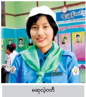
မဆုလဲ့ဝတ်