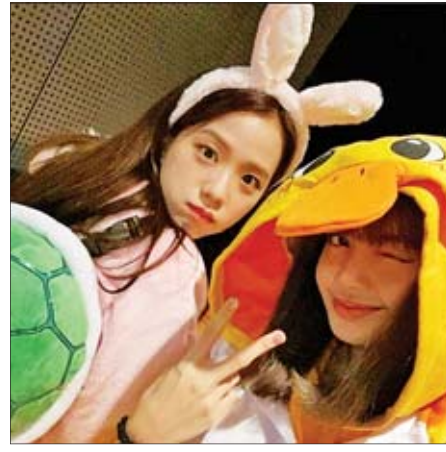
"BLACK PINK" ဟာ ဂျပန်မှာ အဖွဲ့ရဲ့ နယ်လှည့်ဖျော်ဖြေရေးပွဲတွေကို ပြုလုပ်သွားမှာဖြစ်တယ်လို့လည်း သိရပါတယ်။

တောင်ကိုရီးယားရဲ့ ကျော်ကြားတဲ့ အမျိုးသမီးတေးဂီတအဖွဲ့တစ်ဖွဲ့ဖြစ်တဲ့ "BLACK PINK" ရဲ့ အဖွဲ့ဝင်တွေဖြစ်ကြတဲ့ ဂျီဆိုးနဲ့ လီဆာတို့ဟာ ပရိသတ်ကို ပေးထားတဲ့ကတိအတိုင်း လတ်တလောမှာ ယုန်နဲ့ ဘဲလိုဝတ်ဆင်ကာ လေဆိပ်ကိုရောက်ရှိလာခဲ့ကြောင်း အောကေပေါ့ဒေဂျာနယ်ရဲ့ ရေးသားဖော်ပြချက်တွေအရ သိရပါတယ်။