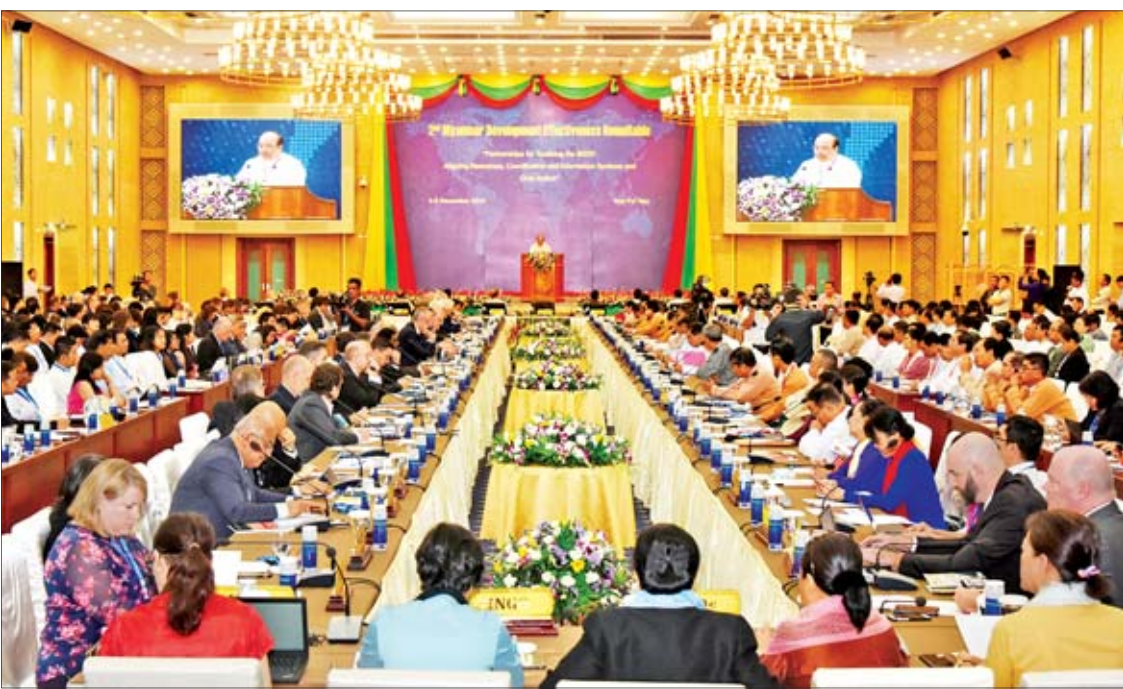
ဒုတိယအကြိမ် မြန်မာနိုင်ငံဖွံ့ဖြိုးတိုးတက်မှုစကားဝိုင်းဆွေးနွေးပွဲ ဖွင့်ပွဲအခမ်းအနား ကျင်းပစဉ်။

နေပြည်တော် ဒီဇင်ဘာ ၅ ဒုတိယအကြိမ် မြန်မာနိုင်ငံဖွံ့ဖြိုးတိုးတက်မှု စကားဝိုင်းဆွေးနွေးပွဲ၏ ဖွင့်ပွဲအခမ်းအနားကို နေပြည်တော်ရှိ မြန်မာအပြည်ပြည်ဆိုင်ရာ ကွန်ဗင်းရှင်းဗဟိုဌာန-၂၅ ကျင်းပခဲ့ရာ ဖွံ့ဖြိုးမှုအကူအညီများ ညှိနှိုင်းရေးအဖွဲ့ ဒုတိယဥက္ကဋ္ဌနှင့် ရင်းနှီးမြှုပ်နှံမှုနှင့် နိုင်ငံခြားစီးပွားဆက်သွယ်ရေး ဝန်ကြီးဌာန ပြည်ထောင်စုဝန်ကြီး ဦးသောင်းထွန်း တက်ရောက်အဖွင့်အမှာစကား ပြောကြားသည်။ အဆိုပါ ဖွင့်ပွဲအခမ်းအနားသို့ ပြည်ထောင်စုဝန်ကြီးများ၊ နေပြည်တော်ကောင်စီဥက္ကဋ္ဌ၊ တိုင်းဒေသကြီးနှင့် ပြည်နယ်ဝန်ကြီးချုပ်များ၊ ဒုတိယဝန်ကြီးများ၊ လွှတ်တော်ကိုယ်စားလှယ်များ၊ အမြဲတမ်းအတွင်းဝန်များ၊ ညွှန်ကြားရေးမှူးချုပ်များ၊ မြန်မာနိုင်ငံဆိုင်ရာသံအမတ်ကြီးများ၊ ဖွံ့ဖြိုးမှုစာမျက်နှာ ၈ ကော်လံ ၁ သို့ ❁