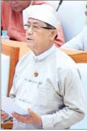
ဒုတိယဝန်ကြီး ဦးမောင်မောင်ဝင်း

ဝေါမဲဆန္ဒနယ်မှ ဦးတင်ထွေးက ဖွဲ့စည်းပုံအခြေခံဥပဒေဆိုသည်မှာ မည်မျှ အရေးကြီးကြောင်းကို အားလုံးအသိပင်ဖြစ်ပါကြောင်း၊ ယခုပြင်ဆင်ရေးအတွက် ဥပဒေမူကြမ်းတစ်ရပ်ရှိရန် ပူးပေါင်းကော်မတီက လွှတ်တော်ဖွင့်ရက်နှင့် နားရက်များတွင်လည်း မနားဘဲ စုပေါင်း၍ဆောင်ရွက်နေခြင်းကို လွှတ်တော်ကိုယ်စားလှယ်အားလုံး အသိပင်ဖြစ်ပါကြောင်း၊ နိုင်ငံတော်နှင့်နိုင်ငံသားများအတွက် အနာဂတ်အရေးကို မြှော့တွေးပြီး အပင်ပန်းခံဆောင်ရွက်နေကြခြင်းဖြစ်ပါကြောင်း၊ နိုင်ငံတော်နှင့် နိုင်ငံသားများ၏အကျိုးကိုရှေးရှု၍ အကောင်းဆုံးသော အကြံပြုချက်များကိုရယူပြီး မည်သို့ပြင်ဆင်ကြမည်ကို လုပ်ဆောင်ရမည့်အချိန်ဖြစ်ပါကြောင်း၊ ထို့ကြောင့် မိမိအနေဖြင့် ပြည်ထောင်စုလွှတ်တော်က ဖွဲ့စည်းပေးထားသည့် လေ့လာစိစစ်ရေးပူးပေါင်းကော်မတီ၏ အကြံပြုချက်သည် အလွန်သင့်မြတ်သည့် အကြံပြုချက်ဖြစ်သည့်အတွက် ထိုအကြံပြုချက်ကို ထောက်ခံပါကြောင်း ဆွေးနွေးသည်။