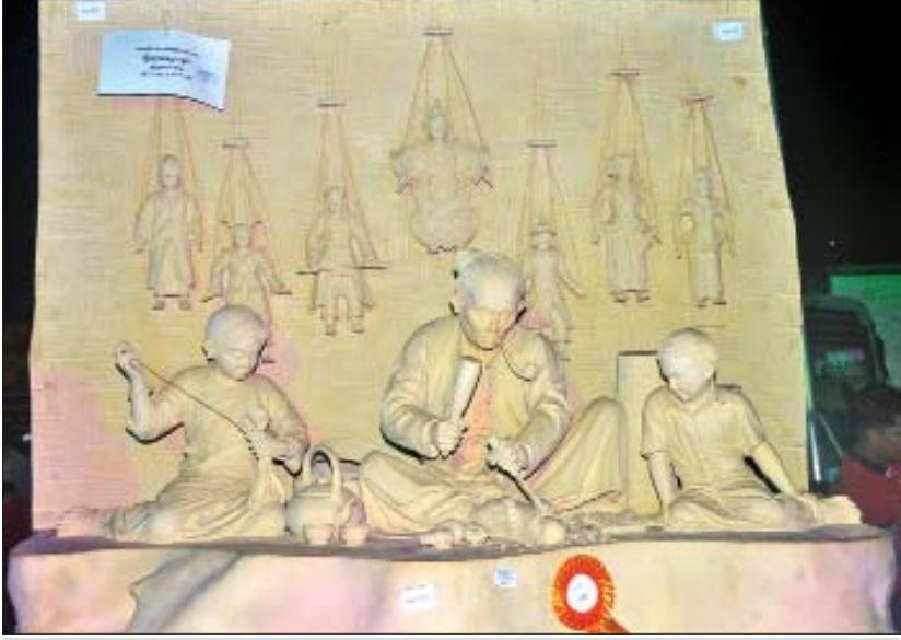
စိတ်ကြိုက်ပထမဆရာ ပန်းပုရုပ်တု