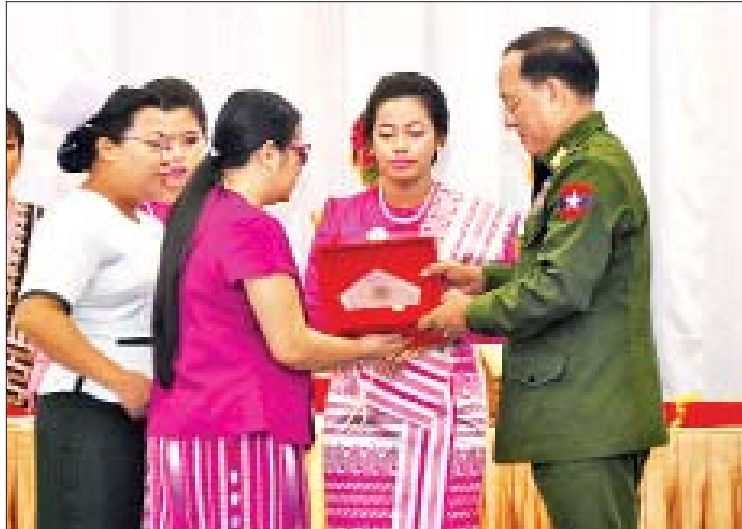
ပြည်ထောင်စုဝန်ကြီး ဒုတိယဗိုလ်ချုပ်ကြီးရဲအောင် အဆိုပြိုင်ပွဲတွင် ဆုရရှိသူတစ်ဦးအား ဆုပေးအပ်ချီးမြှင့်စဉ်။