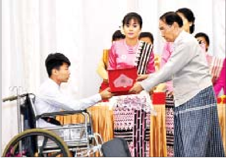
ပြည်ထောင်စုဝန်ကြီး နိုင်သက်လွင် ပန်းချီပြိုင်ပွဲတွင် ဆုရရှိသူတစ်ဦးအား ဆုပေးအပ်ချီးမြှင့်စဉ်။

ကော်မတီဥက္ကဋ္ဌ ဒုတိယသမ္မတက အလုပ်အကိုင်အခွင့်အလမ်းထူးချွန်ဆုနှင့် အလွတ်တန်းဆောင်းပါးပြိုင်ပွဲ (ဝန်ကြီးဌာန) ပထမ၊ ဒုတိယနှင့် တတိယဆုရရှိကြသူများကိုလည်းကောင်း၊ ပြည်ထောင်စုဝန်ကြီး ဒုတိယဗိုလ်ချုပ်ကြီး စိန်ဝင်းက အလွတ်တန်းဆောင်းပါးပြိုင်ပွဲ (ပြင်ပ) ပထမ၊ ဒုတိယနှင့် တတိယဆုရရှိကြသူများကို လည်းကောင်း၊ ပြည်ထောင်စုဝန်ကြီး ဒုတိယဗိုလ်ချုပ်ကြီး ရဲအောင်က အဆိုပြိုင်ပွဲ ပထမ၊ ဒုတိယနှင့် တတိယဆုရရှိကြသူများကို လည်းကောင်း၊ ပြည်ထောင်စုဝန်ကြီး နိုင်သက်လွင်က ပန်းချီပြိုင်ပွဲ ပထမ၊ ဒုတိယနှင့် တတိယဆုရရှိကြသူများကိုလည်းကောင်း၊ ကော်မတီဒုတိယဥက္ကဋ္ဌ ပြည်ထောင်စုဝန်ကြီး ဒေါက်တာဝင်းမြတ်အေးက စစ်တုရင်ပြိုင်ပွဲ ပထမ၊ ဒုတိယနှင့် တတိယဆုရရှိကြသူများနှင့် Global It Challenge The Good Award ရရှိကြသူများကို လည်းကောင်း ဆုများ ပေးအပ်ချီးမြှင့်ကြသည်။