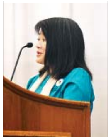
ယူနိုက်တက်ဖ်(မြန်မာ)၏ ဌာနကိုယ်စားလှယ် Ms. June Kunugiu ၂၀၁၉ ခုနှစ် အပြည်ပြည်ဆိုင်ရာမသန်စွမ်းသူများနေ့အတွက် ကုလသမဂ္ဂအထွေထွေအတွင်းရေးမှူးချုပ်ကပေးပို့သည့် သဝဏ်လွှာကို ဖတ်ကြားစဉ်။

ဖြစ်ခြင်းနှင့် လူနည်းစုတိုင်းရင်းသားဖြစ်ခြင်း စသည့်အချက်များ ထပ်ပေါင်းထည့်လိုက်ပါက မသန်စွမ်းသူများသည် ပိုမိုဆိုးရွားသည့် အခြေအနေတို့ကို ကြုံတွေ့နေရသည်ကို လေ့လာတွေ့ရှိရပါကြောင်း။