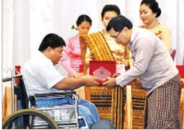
ပြည်ထောင်စုဝန်ကြီး ဒေါက်တာဝင်းမြတ်အေး စစ်တုရင်ပြိုင်ပွဲတွင် ဆုရရှိသူတစ်ဦးအား ဆုပေးအပ်ချီးမြှင့်စဉ်။