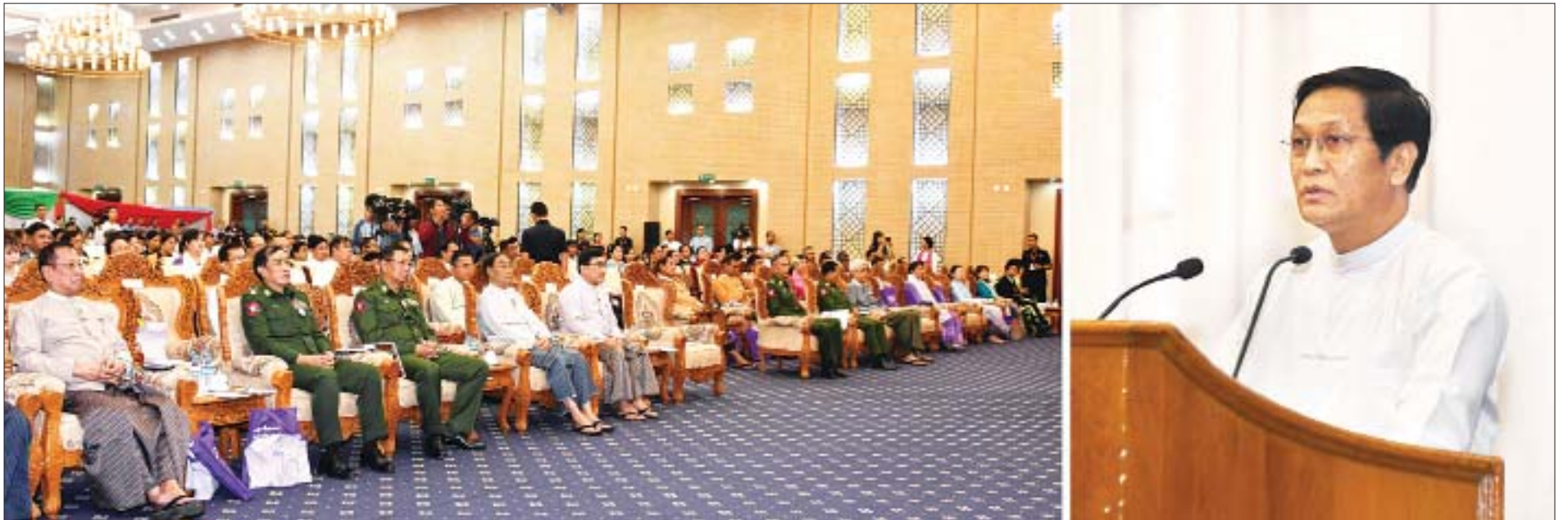
ဒုတိယသမ္မတ ဦးဟင်နရီဗန်ထီးယူ ၂၀၁၉ ခုနှစ် အပြည်ပြည်ဆိုင်ရာ မသန်စွမ်းသူများနေ့ အထိမ်းအမှတ်အခမ်းအနားတွင် အမှာစကားပြောကြားစဉ်။

○ ရှေးဦးမှ ၂၀၁၉ ခုနှစ် အပြည်ပြည်ဆိုင်ရာမသန်စွမ်းသူများနေ့ အထိမ်းအမှတ်ပြိုင်ပွဲများတွင် ဆုရရှိကြသူများ၊ မသန်စွမ်းကျောင်းများနှင့် မသန်စွမ်းအဖွဲ့အစည်းများမှ ကိုယ်စားလှယ်များနှင့် ဖိတ်ကြားထားသူများ တက်ရောက်ကြသည်။