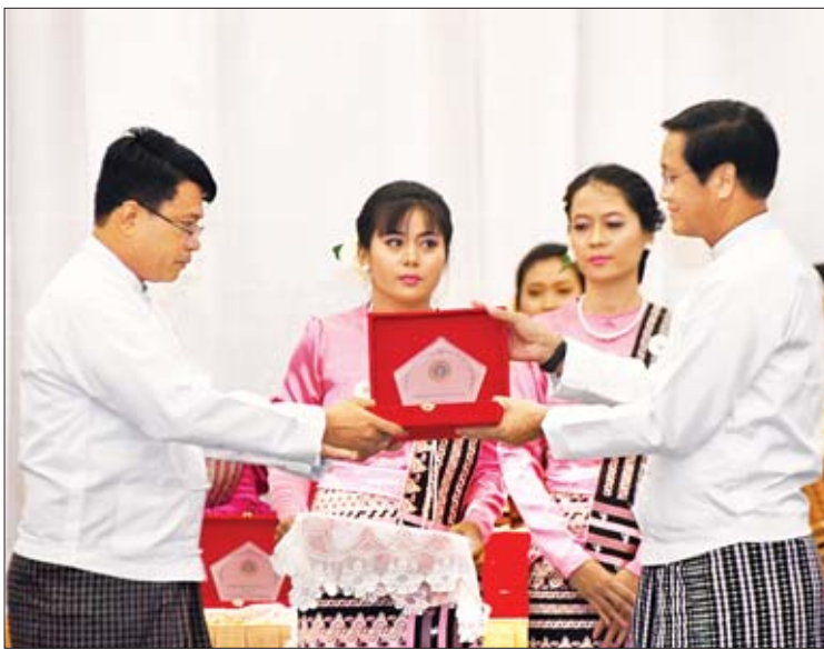
ဒုတိယသမ္မတ ဦးဟင်နရီဗန်ထီးယူ အလွတ်တန်းဆောင်းပါးပြိုင်ပွဲ (ဝန်ကြီးဌာန) တွင် ဆုရရှိသူတစ်ဦးအား ဆုပေးအပ်ချီးမြှင့်စဉ်။

ယင်းနောက် မသန်စွမ်းသူများ၏ အခွင့်အရေးများဆိုင်ရာ အမျိုးသားကော်မတီဥက္ကဋ္ဌ ဒုတိယသမ္မတ ဦးဟင်နရီဗန်ထီးယူက မိန့်ခွန်းပြောကြားရာတွင် မသန်စွမ်းသူများသည် အခြားသူများနှင့်နှိုင်းယှဉ်ပါက လူမှုရေး၊ ကျန်းမာရေးနှင့် စီးပွားရေးအခြေအနေတို့တွင် အဆိုးရွားဆုံးပုံစံများကို ရင်ဆိုင်ကြုံတွေ့နေရပါကြောင်း၊ ယင်းအဆိုးရွားဆုံးပုံစံများအပေါ် ကျား၊ မ