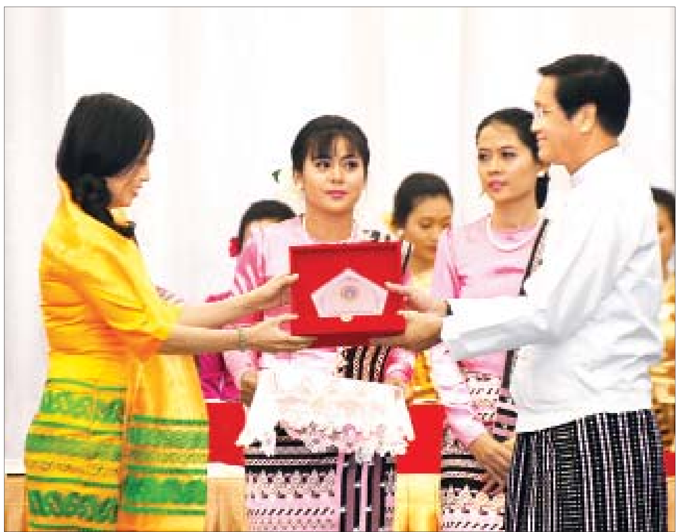
ဒုတိယသမ္မတ ဦးဟင်နရီဗန်ထီးယူ ၂၀၁၉ ခုနှစ် အပြည် ပြည်ဆိုင်ရာမသန်စွမ်းသူများနေ့ ဖြိုင်ပွဲများတွင် ဆုရရှိသူ တစ်ဦးအား ဆုပေးအပ်ချီးမြှင့်စဉ်။

တက်ရောက် အခမ်းအနားသို့ မသန်စွမ်းသူများ၏အခွင့်အရေးဆိုင်ရာ အမျိုးသားကော်မတီဥက္ကဋ္ဌ လှမှုဝန်ထမ်း၊ ကယ်ဆယ်ရေးနှင့် ပြန်လည်နေရာချထားရေးဝန်ကြီးဌာန ပြည်ထောင်စုဝန်ကြီး ဒေါက်တာဝင်းမြတ်အေး၊ ပြည်ထောင်စုဝန်ကြီးများ ဖြစ်ကြသည့် ဒုတိယဗိုလ်ချုပ်ကြီး စိန်ဝင်း၊ ဒုတိယဗိုလ်ချုပ်ကြီး ရဲအောင်နှင့် နိုင်သက်လွင်၊ ဒုတိယဝန်ကြီးများ၊ နေပြည်တော်ကောင်စီဝင်များ၊ လွှတ်တော်ကိုယ်စားလှယ်များ၊ အမြဲတမ်းအတွင်းဝန်များ၊ ဌာနဆိုင်ရာ အကြီးအကဲများ၊ သံတမန်များ၊ မြန်မာနိုင်ငံမသန်စွမ်းသူများ အသင်းချုပ်၊ မြန်မာနိုင်ငံအမျိုးသမီးများနှင့် ကလေးသူငယ်များ ဘဝမြှင့်တင်ရေးအသင်း၊ မြန်မာနိုင်ငံအမျိုးသမီးရေးရာအဖွဲ့ချုပ်၊ မြန်မာနိုင်ငံမသန်စွမ်းသူများ အားကစားအဖွဲ့ချုပ်၊ ရင်ခွင်မဲ့ကလေးများ လျှော့ချရေးနှင့် ကာကွယ်စောင့်ရှောက်ရေးအသင်းတို့မှ တာဝန်ရှိသူ များ၊ ပြည်တွင်း ပြည်ပအဖွဲ့အစည်းများမှ ကိုယ်စားလှယ်များ၊ စာမျက်နှာ ၃ ကော်လံ ၁ ၀