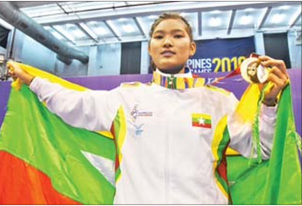
ပထမဆုံး ရွှေတံဆိပ်ရယူပေးခဲ့သည့် အိန္ဒိယအား ဆုယူအပြီး တွေ့ရစဉ်။