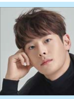
အေးပြည့် - စုစည်းသည်

လူစွမ်းကောင်းအမျိုးသမီးတစ်ဦးအဖြစ် ပါဝင်သရုပ်ဆောင်လေ့ရှိတဲ့ မင်းသမီး စကားလက်ဂျီဟန်ဆန်ဟာ ရုပ်ရှင်သစ်မှာ ရှုရှားစုံထောက်တစ်ဦးအဖြစ် ပါဝင်ထားတာဖြစ်ပါတယ်။ စကားလက်ဂျီဟန်ဆန် ခေါင်းဆောင်ပါဝင်ထားတဲ့ ရုပ်ရှင် “Black Widow” ကို လတ်တလောမှာ စမ်းသပ်ထုတ်လွှင့်ပေးခဲ့ကြောင်း စကိုင်းဒေါ့ကွန်းရဲ့ ရေးသားဖော်ပြချက်တွေအရ သိရပါတယ်။