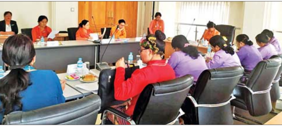
အမျိုးသမီးနှင့် ကလေးသူငယ်အခွင့်အရေးဆိုင်ရာကော်မတီတွင် မြန်မာနိုင်ငံ မိခင်နှင့်ကလေးစောင့်ရှောက်ရေး အသင်း ဗဟိုကော်မတီနှင့် တွေ့ဆုံဆွေးနွေးစဉ်။

ကျွန်မတို့ကော်မတီဟာ ပြည်သူ့လူထုအတွက် လိုအပ်တဲ့ နိုင်ငံရေး၊ စီးပွားရေး၊ လူမှုရေး၊ တိုင်းရင်းသား ရေးရာ၊ နိုင်ငံခြားရေးရာတွေအတွက် လိုအပ်မယ်ဆိုရင် လွှတ်တော်ကော်မတီတွေကို ထပ်မံဖွဲ့စည်းနိုင်တယ်ဆိုတာ ပါရှိပါတယ်။ လွှတ်တော်အစည်းအဝေးတစ်ရပ်နဲ့ တစ်ရပ် အကြားမှာ ဆောင်ရွက်ဖို့လိုအပ်ရင် ဥက္ကဋ္ဌက ကော်မတီမှာ ပါဝင်ရမယ့် လွှတ်တော်ကိုယ်စားလှယ်တွေကို ရွေးချယ် တာဝန်ပေးအပ်ပြီး အနီးကပ်ဆုံးကျင်းပမယ့် လွှတ်တော် အစည်းအဝေးမှာ အတည်ပြုချက်ရယူရမယ်လို့လည်း