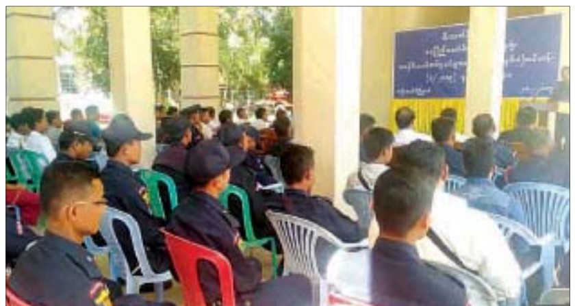
နေပြည်တော် ဒီဇင်ဘာ ၃ အရန်မီးသတ်တပ်ဖွဲ့ဝင်များ လေ့ကျင့်ရေးမွမ်းမံသင်တန်း(၁/၂၀၁၉) ဖွင့်ပွဲအခမ်းအနားကို ဒီဇင်ဘာ ၂