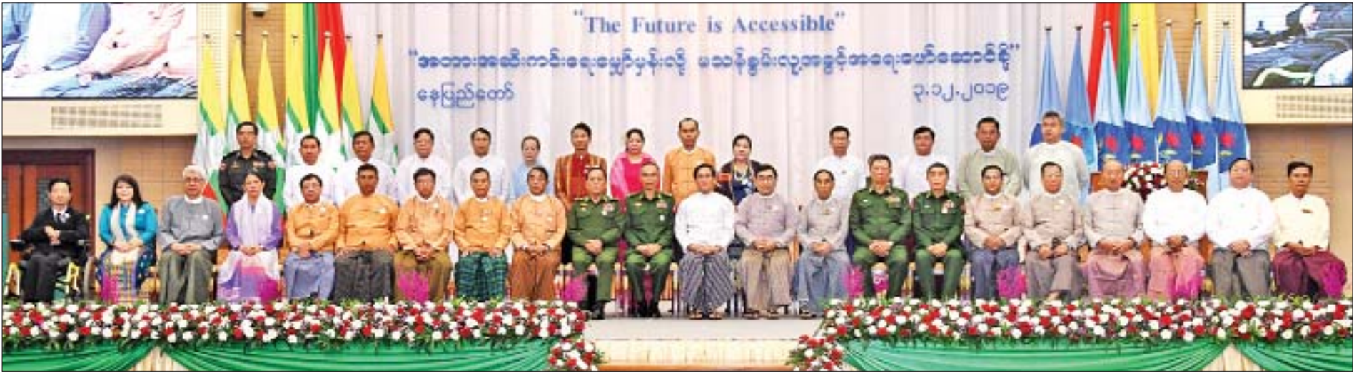
ဒုတိယသမ္မတ ဦးဟင်နရီဗန်ထီးယူနှင့် ပြည်ထောင်စုဝန်ကြီးများ၊ ယူနိုက်တက် (မြန်မာ)၏ဌာနကော်မတီဝင်များနှင့် မြန်မာနိုင်ငံမသန်စွမ်းသူများအသင်းချုပ် အထွေထွေအတွင်းရေးမှူး၊ ဒုတိယဝန်ကြီးများ၊ လွှတ်တော်ကိုယ်စားလှယ်များ၊ အမြဲတမ်းအတွင်းဝန်များ၊ ညွှန်ကြားရေးမှူးချုပ်များ၊ သံတမန်များနှင့်အတူ စုပေါင်းမှတ်တမ်းတင်ဓာတ်ပုံရိုက်စဉ်။