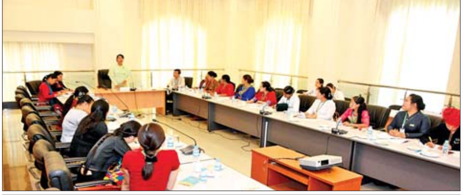
အမျိုးသမီးနှင့် ကလေးသူငယ်အခွင့်အရေးဆိုင်ရာကော်မတီတွင် IRI(International Republican Institute) အဖွဲ့နှင့် တွေ့ဆုံဆွေးနွေးစဉ်။

ကျွန်မတို့ကော်မတီမှာ အမျိုးသမီးနဲ့ ကလေးသူငယ် ဆိုင်ရာ လုပ်ဆောင်ရမယ့်လုပ်ငန်းတာဝန်တွေက များပြား ပါတယ်။ ဒါ့ကြောင့် ကျွန်မတို့ကော်မတီရဲ့ တာဝန်ဝတ္တရား တွေမှာ အမျိုးသမီးနဲ့ ကလေးသူငယ်တွေ ဘက်စုံရှင်သန် ဖွံ့ဖြိုးတိုးတက်ရေးအတွက် အဓိကထားရတာ ဖြစ်ပါတယ်။ ဒါ့အပြင် အမျိုးသမီးတွေဟာ ဘယ်ကဏ္ဍမှာဆို စီးပွားရေး၊ လူမှုရေး၊ နိုင်ငံရေး၊ ယဉ်ကျေးမှုစတဲ့ကဏ္ဍတွေမှာ အမျိုးသား တွေနဲ့ တန်းတူအခွင့်အရေးရရှိနိုင်ရေး၊ ကလေးသူငယ်တွေနဲ့ အမျိုးသမီးတွေ အကြမ်းဖက်ခံရမှုတွေက ကာကွယ် တားဆီးရေးတွေကိုလည်း သက်ဆိုင်ရာဌာနတွေနဲ့ ပူးပေါင်း ဆောင်ရွက်ရမယ့် တာဝန်လည်း ရှိပါတယ်။