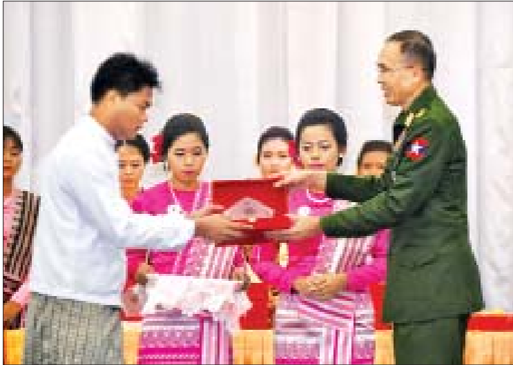
ပြည်ထောင်စုဝန်ကြီး ဒုတိယဗိုလ်ချုပ်ကြီးစိန်ဝင်း အလွတ်တန်းဆောင်းပါးပြိုင်ပွဲ (ပြင်ပ) တွင် ဆုရရှိသူတစ်ဦးအား ဆုပေးအပ်ချီးမြှင့်စဉ်။

နည်းဥပဒေများကို မိတ်ဆက်ဖြန့်ချိနိုင်ခြင်း၊ ကိုယ်အင်္ဂါချို့ယွင်း မသန်စွမ်းသူများအတွက် မှီခိုကိရိယာများ အသိပညာပေးသင်တန်းတို့ကို ဖွင့်လှစ်ပေးခြင်း၊ မသန်စွမ်းမှုဆိုင်ရာ ဝေါဟာရအသုံးအနှုန်းများ လက်စွဲလမ်းညွှန်စာအုပ်ပြုစုထုတ်ဝေခြင်း၊ မသန်စွမ်းသူများအား အလုပ်ခန့်ထားခြင်းဆိုင်ရာ မြန်မာနိုင်ငံရှိ အလုပ်ရှင်များအတွက် လက်စွဲစာအုပ်ကို ဖြန့်ချိခြင်းတို့ကိုလည်း ဆောင်ရွက်နိုင်ခဲ့ပါကြောင်း။