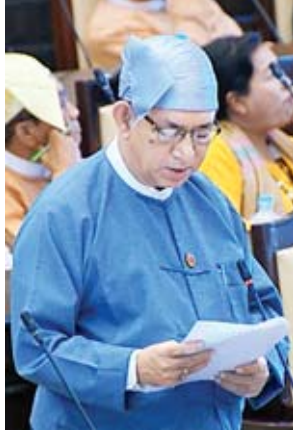
ဒုတိယဝန်ကြီး ဒေါက်တာရဲမြင့်ဆွေ