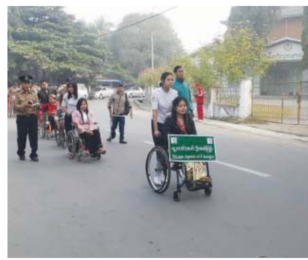
အပြည်ပြည်ဆိုင်ရာ မသန်စွမ်းနေ့ကို ကိုယ်ပြုကြိုဆိုသောအားဖြင့် နိုဝင်ဘာ ၂၈ ရက်က မိုးညှင်းမြို့ ပြည်ထောင်စုလမ်းမကြီးပေါ်တွင် မသန်စွမ်းသူများအဖွဲ့လိုက်လမ်းလျှောက်ခြင်းနှင့် ဝိုင်းရံစွမ်းရည်ပြစဉ်။