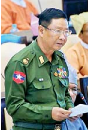
ဒုတိယဝန်ကြီး ဗိုလ်ချုပ်အောင်သူ

ယင်းနောက် ဧရာဝတီတိုင်းဒေသကြီး မဲဆန္ဒနယ်အမှတ်(၂)မှ ဦးစခင် ဇော်လင်း၏ မြန်မာနိုင်ငံတွင် တစ်စတစ်စ ပြုန်းတီးလျက်ရှိသော ကြိုးပိုင်း၊ ကြိုးပြင်တောများ အပါအဝင် သစ်ပင်သစ်တောများ ပြန်လည်ရှင်သန်စိုပြည်လာ စေရေးနှင့် သစ်ပင်သစ်တောများကို အခြေခံပြီး နိုင်ငံတော်၏ ဖွံ့ဖြိုးရေးလုပ်ငန်း များ လုပ်ဆောင်နိုင်ရန် World Bank, ADB, WWF စသည့်နိုင်ငံတကာအဖွဲ့အစည်း များထံမှ ငွေကြေးနှင့် နည်းပညာကူညီထောက်ပံ့မှုများဖြင့် ပြည်နယ်နှင့် တိုင်း ဒေသကြီးအတွင်းရှိ သစ်တောဝန်ထမ်းများ၏ စွမ်းဆောင်ရည် (Capacity)