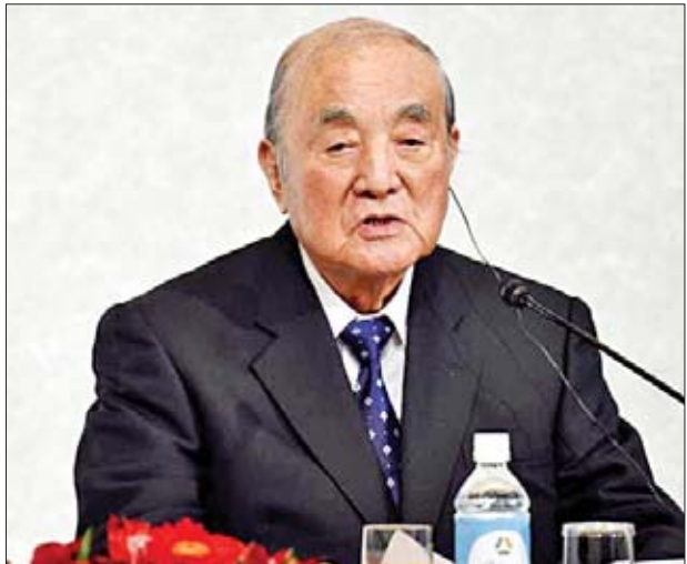
ဂျပန်ဝန်ကြီးချုပ်ဟောင်း ရာဆုဟိယို နာကာဆိုနို ကွယ်လွန်

လုံခြုံရေးကော်မတီ အဖွဲ့ဝင်တစ်ဦး၏ ပြောကြားမှုကို ကိုးကား၍ အီရန်လုံခြုံရေးတပ်ဖွဲ့ဝင်များသည် ဆန္ဒပြသမား ၇၀၀ ခန့်ကို ဖမ်းဆီးခဲ့ကြောင်း ဖော်ပြသည်။ အီရန်တွင် ဆန္ဒပြမှုများ စတင်ဖြစ်ပေါ်စဉ်ကတည်းကပင် အာဏာပိုင်များက အင်တာနက်အသုံးပြုမှုများကို ချက်ချင်းပင် ကန့်သတ်ခဲ့သည်။ သို့သော် အင်တာနက်အသုံးပြုမှုများ ကန့်သတ်မှုကို နိုဝင်ဘာ ၂၈ ရက်မှ စတင်ကာ မြို့အချို့တွင် တဖြည်းဖြည်းချင်း ဖြေလျှော့ပေးခဲ့သည်။ ယင်းသို့ အင်တာနက်အသုံးပြုမှု ကန့်သတ်မှုအား ဖြေလျှော့ပေးမှုများ၌ မြို့တော်တီဟီရန်လည်း ပါဝင်သည်။ အီရန်နိုင်ငံ အစိုးရအနေဖြင့် ၎င်းနိုင်ငံအတွင်း ဆက်လက်ဖြစ်ပွားနေသည့် ဆန့်ကျင်ဆန္ဒပြမှုများအပေါ် စိုးရိမ်ကြောင့်ကြံမှုများ ဖြစ်ပေါ်လျက် ရှိသည်။ အမေရိကန်ပြည်ထောင်စုက အီရန်နိုင်ငံအပေါ် စီးပွားရေးအရ ဒဏ်ခတ်ပိတ်ဆို့မှုများ ချမှတ်ခဲ့မှုများကြောင့် နိုင်ငံအတွင်း ကုန်ဈေးနှုန်းကြီးမြင့်မှုများနှင့်တွေ့နေရခြင်းသည် အီရန်ပြည်သူတို့ နေ့စဉ်ဘဝနေထိုင်မှုအပေါ် အခက်အခဲများ တိုးမြှင့်ဖြစ်ပေါ်စေလျက် ရှိသည်။ ကိုးကား-အင်န်အိတ်ချ်ကော့ဘာသာပြန်-ဇော်ဝင်း