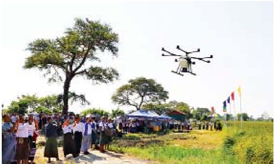
ထို့နောက် ပလိုင်ကျေးရွာတွင် မိုးစပါးစိုက်ခင်းအတွင်း ကောင်းကင်မျိုးစေ့ကြစက်ဖြင့် ရေလိုက်ကြစိုက်နည်းစနစ် စိုက်ပျိုးပြသမှုတို့ကို ကြည့်ရှုအားပေးခဲ့ပြီးနောက် ချိုပါ ကျေးရွာမျိုးသန့်ခြံအတွင်း မျိုးစေ့သန့်စင်စက်နှင့် အအေး ခန်းသို့လှောင်ရုံ ဆောက်လုပ်နေမှုတို့ကို ကြည့်ရှုစစ်ဆေး တွန်းကူကို(ယင်းမာပင်)

ဆက်လက်၍ တိုင်းဒေသကြီး ဝန်ကြီးများနှင့် ဌာန ဆိုင်ရာတာဝန်ရှိသူများက ဆောင်ရွက်ပေးနိုင်မည့်အခြေ အနေများကို ချပြရှင်းလင်းပေးခဲ့ကာ တောင်သူများ၏ တင်ပြမှုအပေါ် တိုင်းဒေသကြီးဝန်ကြီးချုပ်က ပေါင်းစပ် ညှိနှိုင်းဆောင်ရွက်ပေးခဲ့ပြီး ပလိုင်ကျေးရွာအုပ်စုနှင့် ချိုပါ ကျေးရွာအုပ်စုတို့အတွက် အားကစားပစ္စည်းများထောက်ပံ့ ပေးအပ်ခဲ့ကာ ဒေသခံပြည်သူများအား ရင်းရင်းနှီးနှီးလိုက်လံ နှုတ်ဆက်ခဲ့သည်။