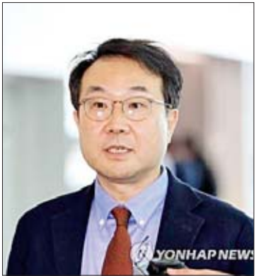
တောင်ကိုရီးယား အထူးကိုယ်စားလှယ် လီဒိုဟွန်း

ကိုရီးယားပူးတွဲစစ်ဦးစီးချုပ်များအဖွဲ့ကမူ မြောက်ကိုရီးယားနိုင်ငံသည် ယင်းခုံးကျည် နှစ်စင်းကို နိုဝင်ဘာ ၂၈ ရက် ဒေသစံတော်ချိန် ညနေ ၄ နာရီ ၅၉ မိနစ်ခန့်က နိုင်ငံ၏ အရှေ့ဘက် တောင်ပိုင်းချောင်ပြည်နယ်မှ အရှေ့ပင်လယ်ထဲသို့ ပစ်လွှတ်ခဲ့သည်ဟု