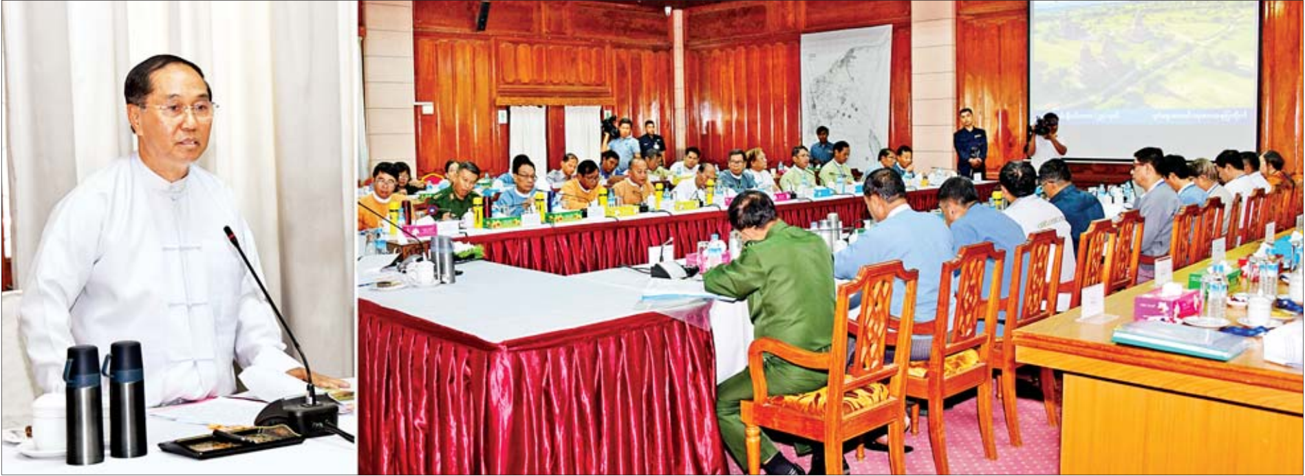
ဒုတိယသမ္မတ ဦးမြင့်ဆွေ ငလျင်ဒဏ်ကြောင့်ပျက်စီးခဲ့သည့် ပုဂံ-ညောင်ဦးဒေသရှိ ရှေးဟောင်းဘုရား၊ စေတီပုထိုးများနှင့် သာသနိကအဆောက်အအုံများ ပြုပြင်ထိန်းသိမ်းရေးဦးစီးကော်မတီ စတုတ္ထအကြိမ်မြောက်အစည်းအဝေးတွင် အမှာစကားပြောကြားစဉ်။

ပုဂံ နိုဝင်ဘာ ၂၉ ငလျင်ဒဏ်ကြောင့် ပျက်စီးခဲ့သည့် ပုဂံ -ညောင်ဦးဒေသရှိ ရှေးဟောင်းဘုရား၊ စေတီပုထိုးများနှင့် သာသနိကအဆောက်အအုံများ ပြုပြင်ထိန်းသိမ်းရေး ဦးစီးကော်မတီဥက္ကဋ္ဌ ဒုတိယသမ္မတ ဦးမြင့်ဆွေသည် ယနေ့နံနက်ပိုင်းတွင် ၂၀၁၆ ခုနှစ် ဩဂုတ်လက ဖြစ်ပွားခဲ့သည့် ငလျင်ဒဏ်ကြောင့် ပျက်စီးခဲ့သည့် ပုဂံ -ညောင်ဦးဒေသရှိ ရှေးဟောင်းဘုရား၊ စေတီပုထိုးများနှင့် သာသနိကအဆောက်အအုံများ ပြန်လည်ပြုပြင်ထိန်းသိမ်းမှုအခြေအနေများနှင့် ဆောင်ရွက်ပြီးစီးမှု အခြေအနေများကို ကြည့်ရှုစစ်ဆေးပြီး ငလျင်ဒဏ်ကြောင့် ပျက်စီးခဲ့သည့် ပုဂံ-ညောင်ဦးဒေသရှိ ရှေးဟောင်းဘုရား၊ စေတီပုထိုးများနှင့် သာသနိကအဆောက်အအုံများ ပြုပြင်ထိန်းသိမ်းရေးဦးစီးကော်မတီ၏ စတုတ္ထအကြိမ်မြောက် အစည်းအဝေးသို့ တက်ရောက်အမှာစကားပြောကြားသည်။