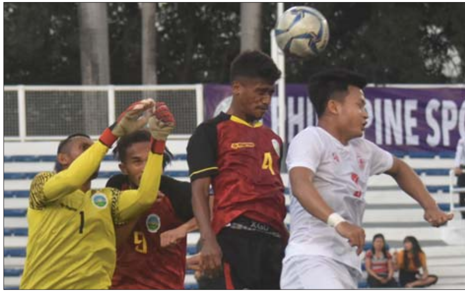
မြန်မာအသင်းနှင့် တီမောအသင်း ယှဉ်ပြိုင်နေစဉ်။

မြန်မာအသင်းသည် သုံးပွဲကစားအပြီးတွင် နှစ်ပွဲနိုင်၊ တစ်ပွဲသရေ ခုနစ်မှတ်ရထားပြီး နောက်ဆုံးပွဲအဖြစ် ဒီဇင်ဘာ ၂ ရက်တွင် ကမ္ဘောဒီးယားအသင်းနှင့် ယှဉ်ပြိုင်ကစားရမည် ဖြစ်သည်။ သတင်း-ရှိုင်းထက်ဇော်