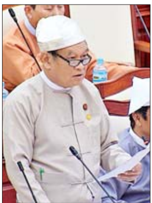
ပြည်ထောင်စုဝန်ကြီး ဒေါက်တာမြင့်ထွေး

လွှတ်တော် ကျန်းမာရေးနှင့် အားကစားဝန်ကြီးဌာနက ဖြေကြားရန်ဖြစ်ပါတယ်။ လွှတ်တော် ကျန်းမာရေးနှင့် အားကစားဝန်ကြီးဌာနက ဖြေကြားရန်ဖြစ်ပါတယ်။