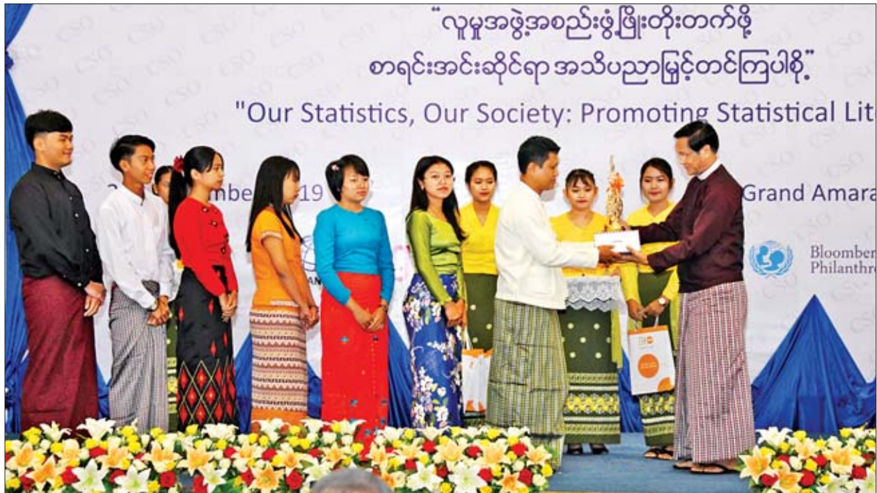
ဒုတိယသမ္မတ ဦးဟင်နရီဗန်ထီးယူ ပထမဆုံး မိတ္တီလာစီးပွားရေးတက္ကသိုလ်မှ အဖွဲ့ခေါင်းဆောင်နှင့် ကျောင်းသား ကျောင်းသူများအား ဆုပေးအပ်ချီးမြှင့်စဉ်။

က ကုလသမဂ္ဂစာရင်းအင်းကော်မရှင်က အောက်တိုဘာလ ၂၀ ရက်နေ့ကို ကမ္ဘာ့စာရင်းအင်းနေ့အဖြစ်သတ်မှတ်ပြီး ကမ္ဘာ့နိုင်ငံအသီးသီးတွင် ငါးနှစ် (၁)ကြိမ် ကျင်းပလျက်ရှိပါကြောင်း၊ မြန်မာနိုင်ငံတွင် ကမ္ဘာ့စာရင်းအင်းနေ့ကို ၂၀၁၅ ခုနှစ်တွင် ကျင်းပနိုင်ခဲ့ပြီး စာရင်းအင်းဆိုင်ရာ အချက်အလက်ထုတ်ပြန်သူများနှင့် အချက်အလက်သုံးစွဲသူများအကြား ဆက်ဆံရေးကောင်းမွန်စေရန်၊ လိုအပ်နေသည့် စာရင်းအင်းများ ဖြည့်ဆည်းရန်နှင့် အကျိုးသက်ဆိုင်သူများအကြား ပူးပေါင်းဆောင်ရွက်ရန်ပြုလုပ်သည့် Platform တစ်ရပ်အဖြစ် မြန်မာစာရင်းအင်းဖိုရမ် (၂၀၁၈)ကို ကျင်းပနိုင်ခဲ့ကြောင်း။