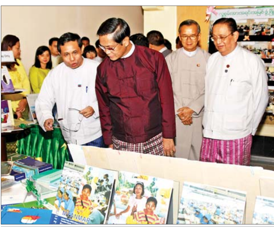
ဒုတိယသမ္မတ ဦးဟင်နရီဗန်ထီးယူ စာရင်းအင်းဆိုင်ရာ စာအုပ်စာတမ်းများ၊ စာရင်းအင်းဆိုင်ရာ လှုပ်ရှားမှုမှတ်တမ်းစာတမ်းများကို ကြည့်ရှုအားပေးစဉ်။

ခြေတင်ရေးရာ □ စာမျက်နှာ ၅ မှ စနစ်တကျ စုစည်းရေးသားသွင်းမှတ်သားခြင်းကိစ္စရပ်ကို အပိုအလုပ်သမားမမြင်ဘဲ နိုင်ငံတော်၏ယန္တရားချောမွေ့စွာ လည်ပတ်နိုင်ရေးအတွက် အလွန်အရေးကြီးသည်ဟု သိမြင်ပြီး စာရင်းအင်းဆိုင်ရာ အသိပညာနှင့် အချက်အလက်များကို အသုံးပြုသည့် အလေ့အထ (Data Culture)ကို ဌာနဆိုင်ရာများမှာသာမက အများပြည်သူနှင့် ပုဂ္ဂလိကစီးပွားရေးအဖွဲ့အစည်းများအကြားတွင်ပါပျံ့နှံ့စေရေးအတွက် Platform တစ်ခုဖြစ်ပေါ်လာအောင် မြန်မာစာရင်းအင်းဖိုရမ်ကို နှစ်စဉ်ကျင်းပဆောင်ရွက်နေခြင်း ဖြစ်ပါကြောင်း။