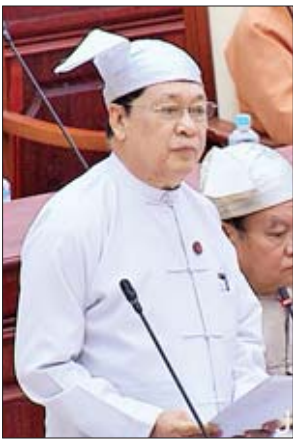
ပြည်ထောင်စုဝန်ကြီး ဦးသိန်းဆွေ

နတ်မောက်မဲဆန္ဒနယ်မှ ဦးအောင်တင်လင်း၏ နတ်မောက်မြို့နယ် ပြည်သူ့ဆေးရုံအား ခုတင်(၅၀)မှ ခုတင် (၁၀၀)ဆုံဆေးရုံအဆင့်သို့ တိုးမြှင့်ပေးရန် အစီအစဉ် ရှိ မရှိ မေးခွန်းနှင့်စပ်လျဉ်း၍ ပြည်ထောင်စုဝန်ကြီး ဒေါက်တာမြင့်ထွေး က ၂၀၁၉ ခုနှစ်တွင် ခုတင်အသုံးချမှုနှုန်း ၂၀၀ ရာခိုင်နှုန်းရှိမှသာလျှင် ဆေးရုံ အဆင့်တိုးမြှင့်မည်ဟု မူတည်မှတ်ထားပါကြောင်း၊ ယခုဆေးရုံသည် မြေဧရိယာ ၅ ဒသမ ၅၂၃ ဧကသာ ရှိပါကြောင်း၊ ဆေးရုံခုတင် ၁၀၀ တိုးမြှင့်မည်ဆိုပါက မြေဧရိယာ ၈ ဧက လိုအပ်ပါကြောင်း၊ တစ်နေ့ပျမ်းမျှအတွင်းလူနာသည်လည်း ၅၀ ဦးသာရှိပြီး သတ်မှတ်မှုနှင့်မကိုက်ညီပါကြောင်း၊ ထို့ကြောင့် ယခုအခြေ အနေအထားသည် လူနာဦးရေလည်းမများသေးသည့်အတွက် လောလောဆယ်ကာလ တွင် အဆင့်တိုးမြှင့်ရန်မရှိသေးပါကြောင်း ရှင်းလင်းဖြေကြားသည်။