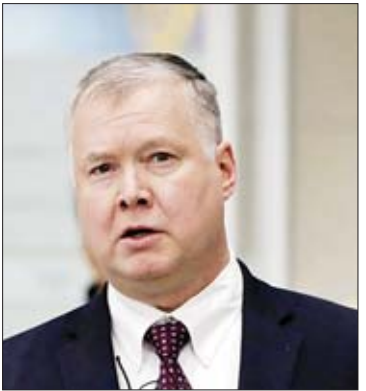
မြောက်ကိုရီးယားဆိုင်ရာ အမေရိကန် အထူးကိုယ်စားလှယ် စတီဗင်ဘီကန်

ပြောကြားသည်။ အဆိုပါ ခုံးကျည်များသည် မြေပြင်မှ အမြင့် ၉၇ ကီလိုမီတာခန့်ဖြင့် ပျံသန်းကာ ကီလိုမီတာ ၃၈၀ ခန့် ဝေးကွာသည့် ဂျပန် ပင်လယ် သို့မဟုတ် အရှေ့ပင်လယ်ထဲသို့ ကျရောက်ခဲ့ကြောင်း သိရသည်။ မြောက်