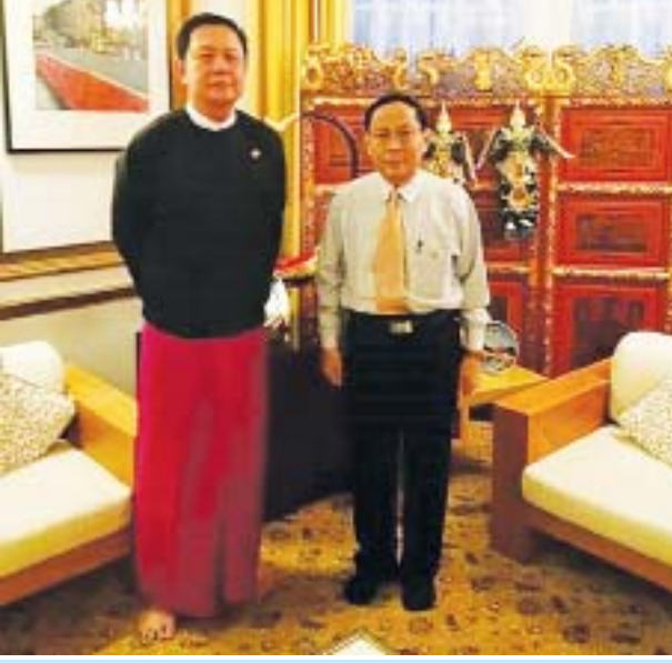
သံအမတ်ကြီး ဦးကျော်စွာမင်းနှင့်လန်ဒန်နေအိမ်၌တွေ့ဆုံစဉ်။

ပြီးခဲ့သောလက ဗြိတိန်နိုင်ငံသို့ တာဝန်နှင့် ကျွန်တော်လေ့လာရေးခရီး ရောက်ခဲ့သည်။ ဗြိတိန်နိုင်ငံဆိုင်ရာ မြန်မာသံအမတ်ကြီးမှာ ဦးကျော်စွာမင်းဖြစ် သည်။ ကျွန်တော်တို့အဖွဲ့အား သံအမတ်ကြီးက လန်ဒန်လေဆိပ်မှလာကြိုသည်။ လန်ဒန်မှာ ရှိနေစဉ်အတွင်း လိုအပ်သည်များလည်းကူညီသည်။ မြန်မာသံရုံးနှင့် သံအမတ်ကြီးနေအိမ်သို့ ကျွန်တော်ရောက်သည်။ သံအမတ်ကြီးက မန္တလေး သား၊ ပန်းချီဆရာ၊ အနုပညာသမားမို့ စာပေအနုပညာအကြောင်းတွေ ပြော ဖြစ်ကြသည်။ တာဝန်ထမ်းခဲ့သော သံအမတ်ကြီးတွေအကြောင်းလည်း မေးမြန်း ကြည့်သည်။ ရှုပါ။