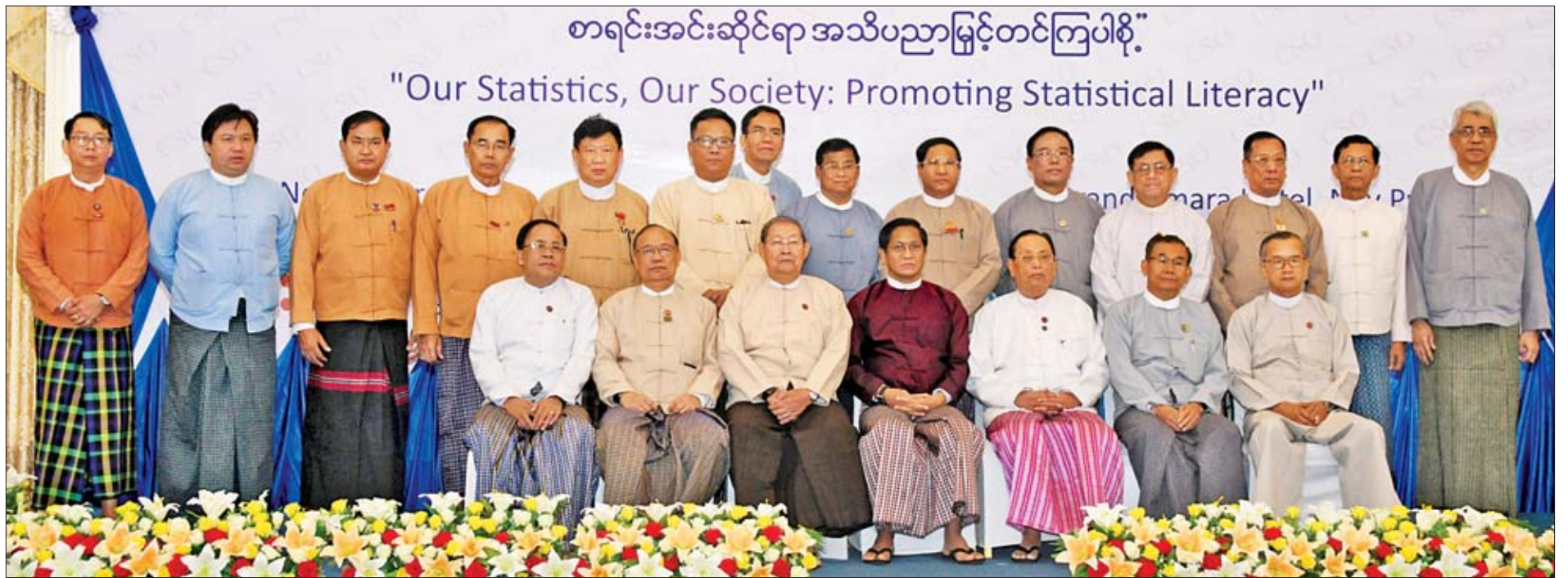
ဒုတိယသမ္မတ ဦးဟင်နရီဗန်ထီးယူ ပြည်ထောင်စုဝန်ကြီးများ၊ ဒုတိယဝန်ကြီးများ၊ တိုင်းဒေသကြီးနှင့် ပြည်နယ်စီမံကိန်းနှင့် ဘဏ္ဍာရေးဝန်ကြီးများနှင့် စုပေါင်းမှတ်တမ်းတင်ဓာတ်ပုံရိုက်စဉ်။