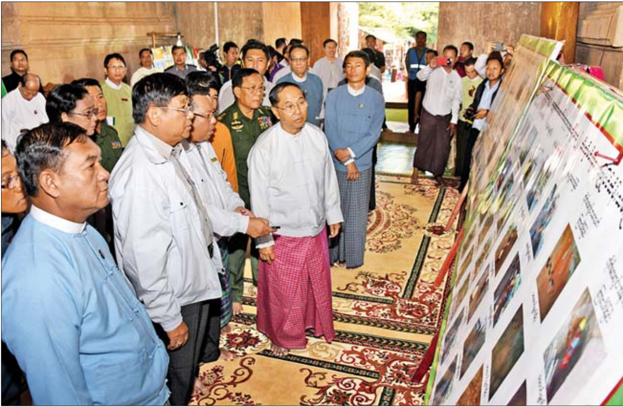
ဒုတိယသမ္မတ ဦးမြင့်ဆွေအား ထီးလိုမင်းလိုဘုရား ရှေးမူမပျက် ပြုပြင်ဆောင်ရွက်နေမှုများနှင့် ဆောင်ရွက်ပြီးစီးမှုအခြေအနေများကို တာဝန်ရှိသူများက ရှင်းလင်းတင်ပြစဉ်။