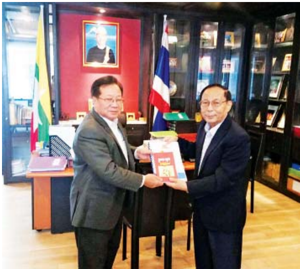
သံအမတ်ကြီး ဦးမျိုးမြင့်သန်းအား ဥပဒေသုတစာအုပ်များ လက်ဆောင်ပေးစဉ်။