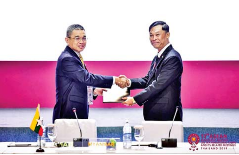
ထိုနေ့က ထိုင်းနိုင်ငံ ကာကွယ်ရေးဝန်ကြီးဌာန ဒုတိယဝန်ကြီး ဗိုလ်ချုပ်ကြီး ချန်ချိုင်းချိန်မောင်ကိုထံသို့ သဘာပတ်ဝန်းကျင် လွှဲပြောင်းပေးခဲ့သည်။ (၁၃)ကြိမ်မြောက် အာဆီယံဝန်ကြီးအဆင့် နိုင်ငံဖြတ်ကျော်မှုခင်းဆိုင်ရာအစည်းအဝေး၊ ဝန်ကြီးအဆင့်အာဆီယံ+၃၊ အာဆီယံ+တရုတ်၊ အာဆီယံ+ဂျပန်နှင့် အာဆီယံ+ကိုရီးယားနိုင်ငံတို့နှင့် နိုင်ငံဖြတ်ကျော်မှုခင်းတိုက်ဖျက်ရေး ပူးပေါင်းဆောင်ရွက်မှု အစည်းအဝေးများကို နိုဝင်ဘာ ၂၈ ရက်အထိ တစ်ဆက်တည်း ကျင်းပပြုလုပ်ခဲ့ပြီး အာရှဒေသအတွင်း တိုးတက်ဖြစ်ပေါ်လာသော အကြမ်း

နေပြည်တော် နိုဝင်ဘာ ၂၉ ပြည်ထောင်စုဝန်ကြီးဌာန ပြည်ထောင်စုဝန်ကြီး ဒုတိယဗိုလ်ချုပ်ကြီးကျော်ဆွေနှင့်အဖွဲ့သည် ထိုင်းနိုင်ငံ ဘန်ကောက်မြို့၌ နိုဝင်ဘာ ၂၅ ရက်မှ ၂၉ ရက်အထိ ကျင်းပသည့် (၁၃)ကြိမ်မြောက် အာဆီယံဝန်ကြီးအဆင့် နိုင်ငံဖြတ်ကျော်မှုခင်းဆိုင်ရာအစည်းအဝေးနှင့် ဆက်စပ်အစည်းအဝေးများ (13 th ASEAN Ministerial Meeting on Transnational Crime and Its Related Meetings-13 th AMMTC) သို့ တက်ရောက်ခဲ့ကြသည်။ တက်ရောက် အဆိုပါအစည်းအဝေးကို ထိုင်းနိုင်ငံ ဘန်ကောက်မြို့ Marriott Marquis Queen's Park Hotel တွင် ကျင်းပပြုလုပ်ရာ အာဆီယံအဖွဲ့ဝင် ၁၀ နိုင်ငံနှင့် တရုတ်၊ ဂျပန်၊ ကိုရီးယားနိုင်ငံတို့မှ ဝန်ကြီးအဆင့်များ၊ အာဆီယံဒုတိယအထွေထွေအတွင်းရေးမှူးချုပ်နှင့် တာဝန်ရှိသူများ၊ အဆင့်မြင့်အရာရှိကြီးများနှင့် ကိုယ်စားလှယ်များ ၂၀၀ ခန့် တက်ရောက်ခဲ့ကြသည်။ အစည်းအဝေး ပထမနေ့တွင် ပြည်ထောင်စုဝန်ကြီး ဒုတိယဗိုလ်ချုပ်ကြီး ကျော်ဆွေက ၂၀၁၈ ခုနှစ် နိုဝင်ဘာ ၂ ရက်မှ စတင်၍ AMMTC သဘာဝပတ်ဝန်းကျင် လက်ခံရယူတာဝန်ထမ်းဆောင်ခဲ့ရာ ၎င်းတာဝန်ယူစဉ်ကာလ အကောင်အထည်ဖော် ဆောင်ရွက်ခဲ့မှုများနှင့် ရလဒ်များ၊ ဆက်လက်ဆောင်ရွက်ရန်များကို ရှင်းလင်းဆွေးနွေး ပြောကြားခဲ့သည်။