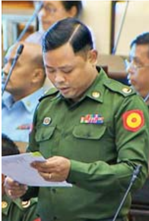
တပ်မတော်သားကိုယ်စားလှယ် ဗိုလ်မှူးထက်လင်း