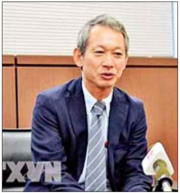
ဂျပန် နိုင်ငံခြားရေးဝန်ကြီးဌာနမှ ရှိဂယ်ကို

ခုံးကျည်စမ်းသပ်ပစ်လွှတ်မှုနှင့် ပတ်သက်၍ ကေစီအင်န်အေက အချိန်နှင့်နေရာကို တိတိ ကျကျ ဖော်ပြခြင်းမရှိသော်လည်း တောင်