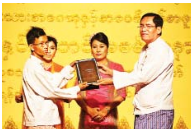
ဒုတိယဝန်ကြီး ဦးအောင်လှထွန်း စာပေဗိမာန် စာမူဆု ကဗျာပေါင်းချုပ် တတိယဆုရ အထဝါစိုး(မန္တလေး)အား ဆုပေးအပ် ချီးမြှင့်စဉ်။