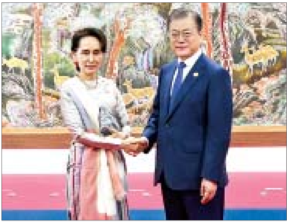
ပထမအကြိမ် မဲခေါင်-ကိုရီးယား ထိပ်သီးအစည်းအဝေးသို့ တက်ရောက်ရန် ရောက်ရှိလာသော နိုင်ငံတော်၏ အတိုင်ပင်ခံပုဂ္ဂိုလ် ဒေါ်အောင်ဆန်းစုကြည်အား ကိုရီးယားသမ္မတနိုင်ငံ သမ္မတ မစ္စတာ မွန်ဂျေအင်းက ခင်မင်ရင်းနှီးစွာ ကြိုဆိုနှုတ်ဆက်စဉ်။

နေပြည်တော် နိုဝင်ဘာ ၂၇ ကိုရီးယားသမ္မတနိုင်ငံ ဘူဆန်မြို့၌ ရောက်ရှိနေသည့် နိုင်ငံတော်၏အတိုင်ပင်ခံပုဂ္ဂိုလ် ဒေါ်အောင်ဆန်းစုကြည် သည် ယနေ့တွင် ပထမအကြိမ် မဲခေါင်-ကိုရီးယား ထိပ်သီး အစည်းအဝေးသို့ တက်ရောက်သည်။