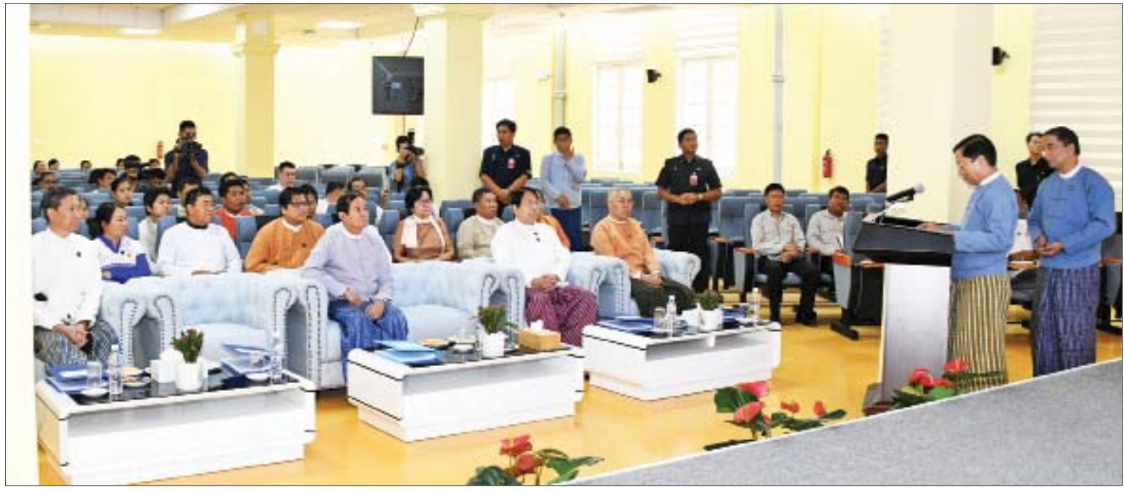
နိုင်ငံတော်သမ္မတ ဦးဝင်းမြင့်အား အမျိုးသားစာကြည့်တိုက်(ရန်ကုန်) အဆောက်အအုံ ပြင်ဆင်မွမ်းမံခြင်းလုပ်ငန်း ဆောင်ရွက်နေမှုနှင့်စပ်လျဉ်း၍ ပြည်ထောင်စုဝန်ကြီး သူရဦးအောင်ကိုက ရှင်းလင်းတင်ပြစဉ်။

စာများဖတ်စေလို နိုင်ငံတော်သမ္မတက တင်ပြချက် များနှင့်စပ်လျဉ်း၍ စာပေဗိမာန်သည် အမျိုးသားခေါင်းဆောင်ကြီး ဗိုလ်ချုပ် အောင်ဆန်း၏ အမြော်အမြင်ကြီးမားမှု ကြောင့် ပေါ်ပေါက်လာခြင်းဖြစ်ပါ ကြောင်း၊ နိုင်ငံတစ်နိုင်ငံတွင် စာပေမြင့်မှ လူမျိုးတင့်မည် ဖြစ်ပါ ကြောင်း၊ ထို့အတူ သုတေသနလုပ်ငန်း များ ဖွံ့ဖြိုးတိုးတက်မှု တိုင်းပြည် ဖွံ့ဖြိုးတိုးတက်မည်ဖြစ်ပါကြောင်း၊ စာပေဗိမာန်၏ ဆောင်ပုဒ်ဖြစ်သည့် အမှောင်ခွင်၍ အလင်းဆောင်အံ့ ဆိုသည့်အတိုင်း လက်တွေ့အကောင် အထည်ဖော်စေလိုပါကြောင်း၊ နိုင်ငံသူ နိုင်ငံသားများကို စာများများ ဖတ်စေလိုပါကြောင်း၊ ပြည်သူများ စာများများဖတ်မှ အတွေးအခေါ် အမြော်အမြင် စာမျက်နှာ ၁၀ သို့