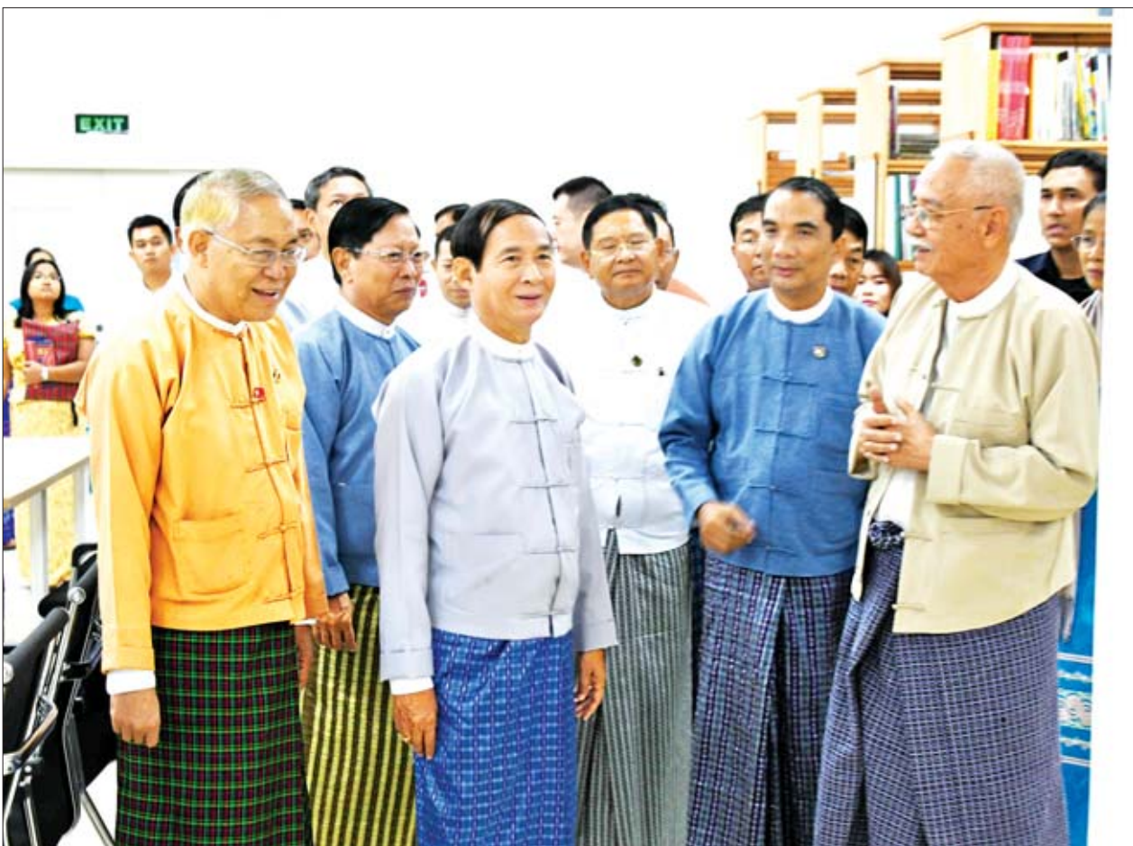
နိုင်ငံတော်သမ္မတ ဦးဝင်းမြင့် အမျိုးသားစာကြည့်တိုက်(ရန်ကုန်) အဆောက်အအုံအတွင်း ပြင်ဆင်မွမ်းမံခြင်းလုပ်ငန်းများ ဆောင်ရွက်ထားမှုနှင့် လုပ်ငန်း ပြီးစီးမှုအခြေအနေတို့ကို ကြည့်ရှုစစ်ဆေးစဉ်။

ရန်ကုန် နိုဝင်ဘာ ၂၇ နိုင်ငံတော်သမ္မတ ဦးဝင်းမြင့်သည် ယနေ့ မွန်းလွဲပိုင်းတွင် ပြည်ထောင်စု ဝန်ကြီးများဖြစ်ကြသည့် ဒေါက်တာ ဖေမြင့်၊ သူရဦးအောင်ကို၊ ဒေါက်တာ မျိုးသိမ်းကြီး၊ ရန်ကုန်တိုင်းဒေသကြီး လွှတ်တော်ဥက္ကဋ္ဌ ဦးတင်မောင်ထွန်း၊ ဒုတိယဝန်ကြီး ဦးအောင်လှထွန်း၊ တိုင်းဒေသကြီးအစိုးရအဖွဲ့ ဝန်ကြီး များ၊ ဌာနဆိုင်ရာတာဝန်ရှိသူများနှင့် အတူ ရန်ကုန်မြို့ ပန်းဘဲတန်းမြို့နယ် ကုန်သည်လမ်းရှိ အမျိုးသားစာကြည့် တိုက်(ရန်ကုန်)သို့ ရောက်ရှိကြပြီး စာကြည့်တိုက်အဆောက်အအုံ ပြင်ဆင် မွမ်းမံဆောင်ရွက်ပြီးစီးမှု အခြေအနေ ကို ကြည့်ရှုစစ်ဆေးသည်။