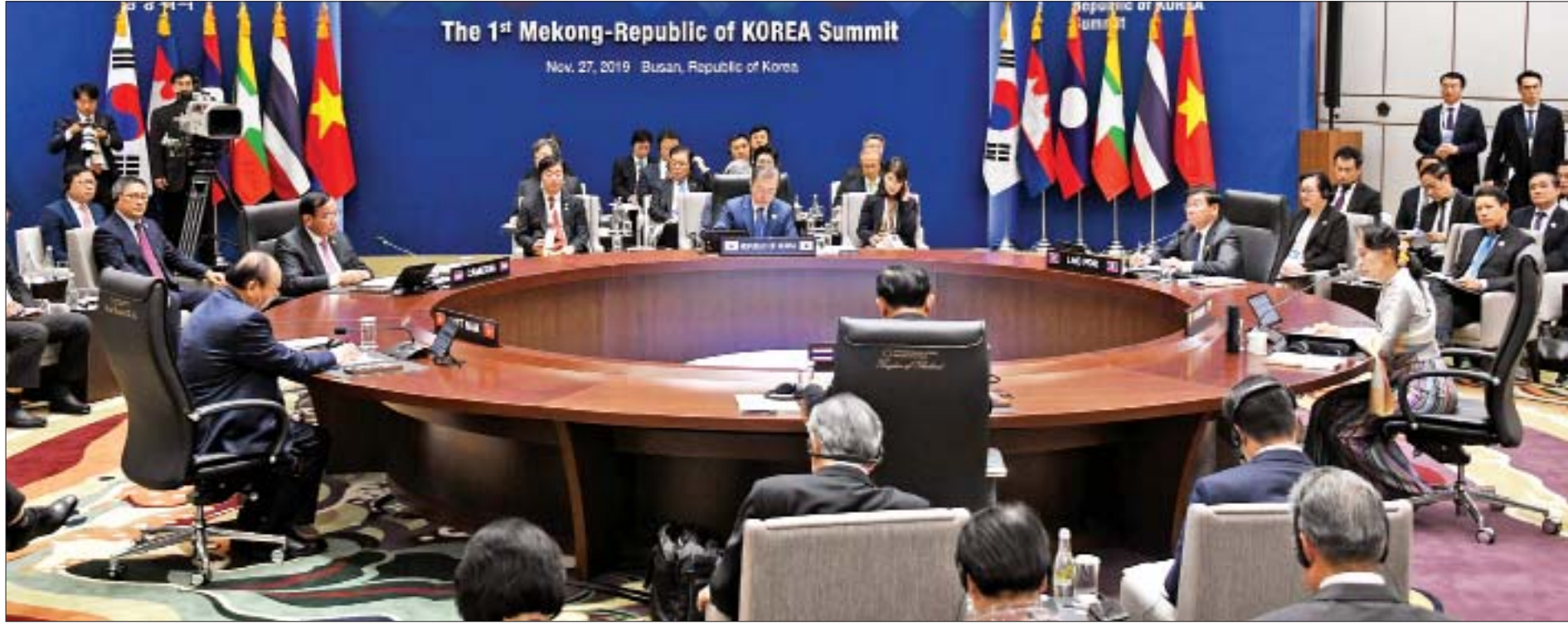
နိုင်ငံတော်၏အတိုင်ပင်ခံပုဂ္ဂိုလ် ဒေါ်အောင်ဆန်းစုကြည် မဲခေါင်- ကိုရီးယား ထိပ်သီးအစည်းအဝေးတက်ရောက်စဉ်။

ဒေသတွင်း၌ ငြိမ်းချမ်းသာယာသော ပြည်သူ့အခြေပြုလုမှုအသိုက်အဝန်းများ ထူထောင်ရေးအပေါ် များစွာအကျိုး ကျေးဇူးဖြစ်ထွန်းစေပါကြောင်း၊ ဇီဝ မျိုးစုံမျိုးကွဲ ထိန်းသိမ်းစောင့်ရှောက် ရေးနှင့်သာဘဝပတ်ဝန်းကျင် ထိန်းသိမ်း ရေးသည် နိုင်ငံများအားလုံးအတွက် အလွန်အရေးကြီးသော လုပ်ငန်းဖြစ် သည့်အားလျော်စွာ “မဲခေါင်-ကိုရီးယား ပူးပေါင်းဆောင်ရွက်မှု ဇီဝ မျိုးစုံမျိုးကွဲ ထိန်းသိမ်းစောင့်ရှောက်ရေးစင်တာ” ကို မြန်မာနိုင်ငံက အိမ်ရှင်နိုင်ငံအဖြစ် လက်ခံတည်ထောင်ရန် အဆိုပြုလိုပါ ကြောင်း၊ မဲခေါင်-ကိုရီးယား ပူးပေါင်း ဆောင်ရွက်မှုအရ မြန်မာနိုင်ငံတွင် ဆောင်ရွက်လျက်ရှိသည့် စီမံကိန်းများ အား ကိုရီးယားသမ္မတနိုင်ငံမှ ရန်ပုံငွေ ထောက်ပံ့ခြင်းအတွက် ကျေးဇူးတင်ရှိ ပါကြောင်း ဆွေးနွေးပြောကြားသည်။ စာမျက်နှာ ၄ သို့ ၀