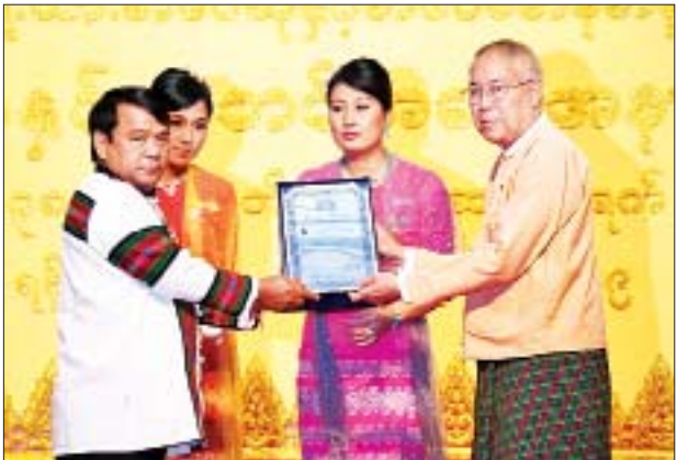
ရန်ကုန်တိုင်းဒေသကြီးလွှတ်တော်ဥက္ကဋ္ဌ ဦးတင်မောင်ထွန်း စာပေဗိမာန်စာမူဆု ဝတ္ထုရှည်ပထမဆုရ ကေ(တောင်တန်းပြာ) အား ဆုပေးအပ်ချီးမြှင့်စဉ်။