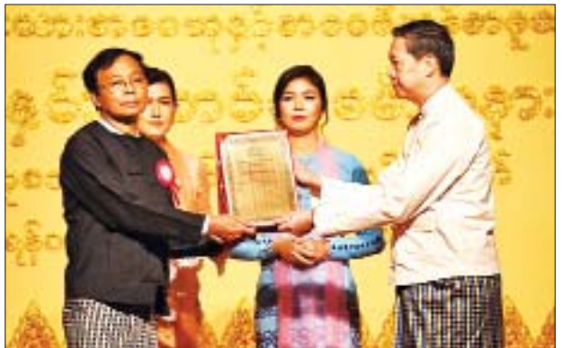
ပြည်ထောင်စုဝန်ကြီး ဒေါက်တာမျိုးသိမ်းကြီး အမျိုးသားစာပေဆု နိုင်ငံရေးစာပေဆု အောင်မြင်ဦး(မဟာဝိဇ္ဇာ) အား ဆုပေးအပ်ချီးမြှင့်စဉ်။