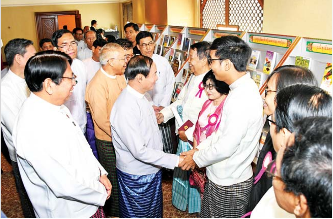
နိုင်ငံတော်သမ္မတ ဦးဝင်းမြင့် အမျိုးသားစာပေဆုရရှိကြသူများနှင့် စာပေဗိမာန်စာမူဆုရရှိကြသူများအား ရင်းရင်းနှီးနှီးနှုတ်ဆက်စဉ်။

၂၀၀၁ ခုနှစ်မှ ၂၀၁၂ ခုနှစ်အထိ အမျိုးသားစာပေတစ်သက်တာဆုကို တစ်နှစ်လျှင် စာပေပညာရှင်တစ်ဦးမှ သုံးဦးအထိ ရွေးချယ်ချီးမြှင့်ခဲ့ပါကြောင်း၊ ပြီးခဲ့သည့်နှစ်တွင် မိမိဘဝတစ်လျှောက် စာမျက်နှာ ၇ သို့ ၂