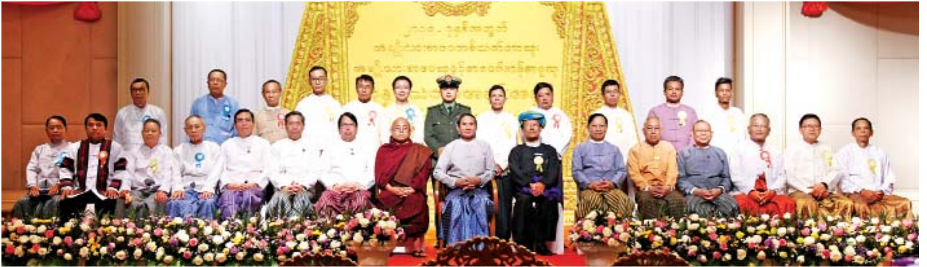
နိုင်ငံတော်သမ္မတ ဦးဝင်းမြင့်၊ ပြည်ထောင်စုဝန်ကြီးများ၊ ရန်ကုန်တိုင်းဒေသကြီး လွှတ်တော်ဥက္ကဋ္ဌ ဒုတိယဝန်ကြီး၊ ရန်ကုန်တိုင်းဒေသကြီး စီမံကိန်းနှင့် ဘဏ္ဍာရေးဝန်ကြီးတို့ စာပေဗိမာန်စာမူဆုပုဂ္ဂိုလ်များနှင့်အတူ စုပေါင်းမှတ်တမ်းတင်ဓာတ်ပုံရိုက်စဉ်။