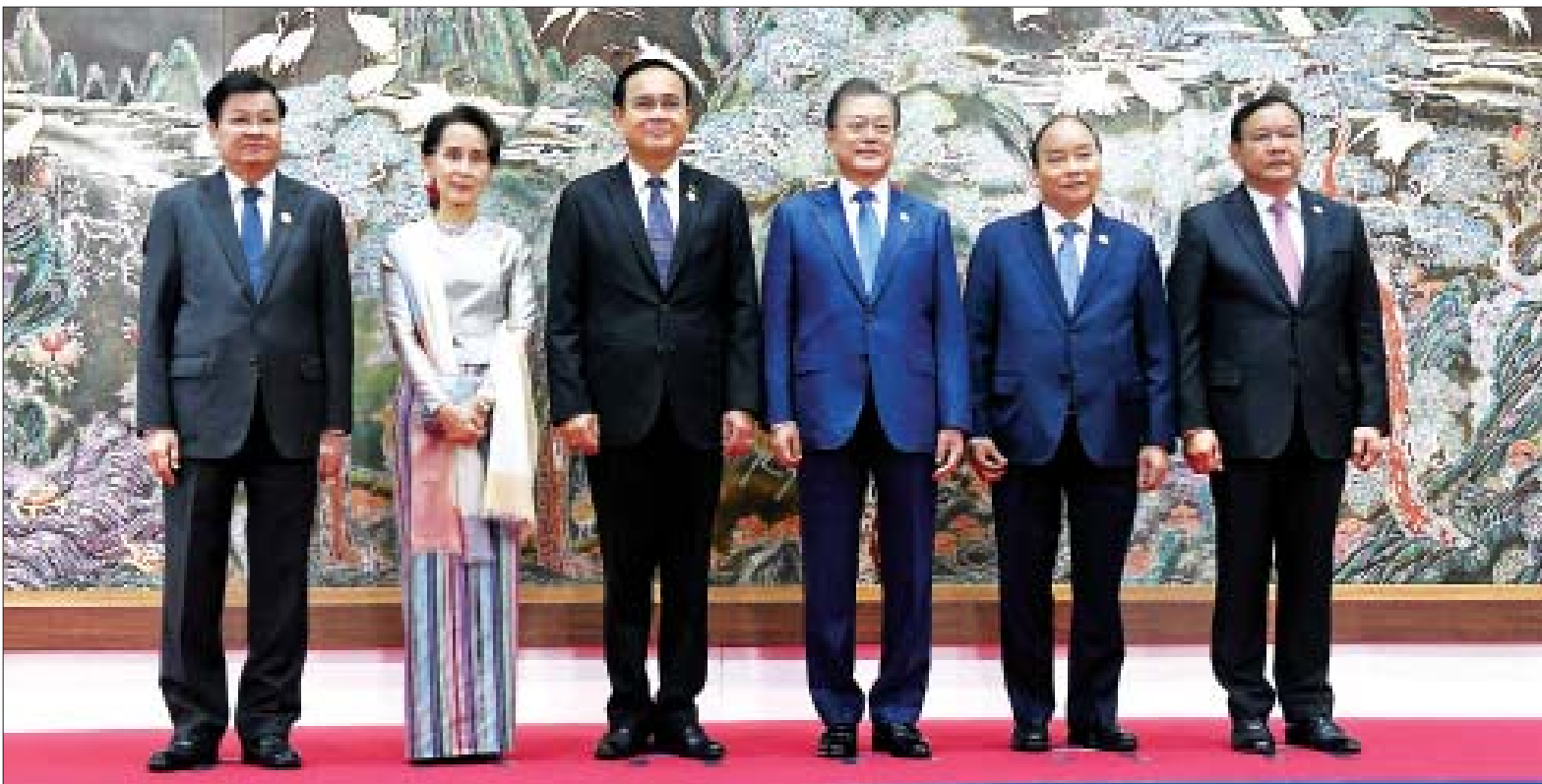
နိုင်ငံတော်၏အတိုင်ပင်ခံပုဂ္ဂိုလ် ဒေါ်အောင်ဆန်းစုကြည် ကိုရီးယားသမ္မတနိုင်ငံ သမ္မတ၊ မဲခေါင်ဒေသနိုင်ငံများမှ အစိုးရအဖွဲ့ အကြီးအကဲများနှင့်အတူ မှတ်တမ်းတင်ဓာတ်ပုံရိုက်စဉ်။

❖ နိုင်ငံတော်၏အတိုင်ပင်ခံပုဂ္ဂိုလ်မှ ကိုရီးယားသမ္မတနိုင်ငံ သမ္မတ မစ္စတာ မွန်ဂျေအင်းက ခင်မင်ရင်းနှီးစွာကြိုဆို နှုတ်ခမ်းတင်စာတံပုံ ရိုက်သည်။ ထို့နောက် နိုင်ငံတော်၏ အတိုင်ပင်ခံပုဂ္ဂိုလ်သည် ကိုရီးယား သမ္မတနိုင်ငံ သမ္မတ၊ မဲခေါင်နိုင်ငံများမှ အစိုးရအဖွဲ့အကြီးအကဲများနှင့်အတူ မှတ်တမ်းတင် ဓာတ်ပုံရိုက်သည်။ ယင်းနောက် နိုင်ငံတော်၏အတိုင်ပင်ခံ ပုဂ္ဂိုလ်သည် ပထမအကြိမ် မဲခေါင်-ကိုရီးယား ထိပ်သီးအစည်းအဝေးသို့ တက်ရောက်ပြီး ၂၀၁၁ ခုနှစ်က စတင်ခဲ့သည့် မဲခေါင်-ကိုရီးယား ပူးပေါင်းဆောင်ရွက်မှုမှာ အောင်မြင်မှု များရရှိခဲ့ပြီး မဲခေါင်ဒေသ ပြည်သူများ အတွက် အကျိုးဖြစ်ထွန်းစေခဲ့ပါ ကြောင်း၊ မဲခေါင်-ကိုရီးယား ပူးပေါင်း ဆောင်ရွက်မှု လုပ်ငန်းစဉ်များအား ထိပ်သီးအစည်းအဝေး အဆင့်သို့ မြှင့်တင်နိုင်ခြင်းသည် မဲခေါင်-ကိုရီးယား နိုင်ငံခြားဆောင်ရွက်မှု၏ မဲခေါင်-ကိုရီးယား ပူးပေါင်းဆောင်ရွက်မှုအပေါ် အလေးအနက်ထားမှုအား ပြသခြင်း ဖြစ်ပါကြောင်း၊ ကိုရီးယားနိုင်ငံ၏ New Southern Policy၊ အာဆီယံ-ကိုရီးယား ပူးပေါင်းဆောင်ရွက်မှုနှင့် မဲခေါင်-ကိုရီးယား ပူးပေါင်းဆောင်ရွက်မှုတို့ သည် တစ်ခုနှင့်တစ်ခု အပြန်အလှန် အထောက်အကူပြုနေသည့်အတွက်