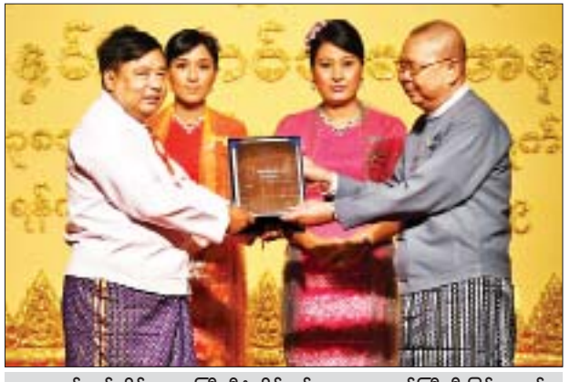
ရန်ကုန်တိုင်းဒေသကြီး စီမံကိန်းနှင့်ဘဏ္ဍာရေးဝန်ကြီး ဦးမြင့်သောင်း စာပေဗိမာန်စာမူဆု မြန်မာ့ယဉ်ကျေးမှုနှင့် အနုပညာဆိုင်ရာစာပေ ဒုတိယဆုရ ဇော်လွင်ဦး (ဟင်္သာတ)အား ဆုပေးအပ်ချီးမြှင့်စဉ်။