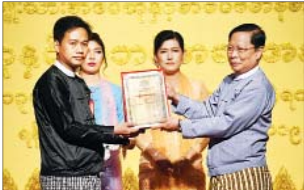
ပြည်ထောင်စုဝန်ကြီး သူရဦးအောင်ကို အမျိုးသားစာပေဆု ဘာသာပြန်(ရသ) ဆုရ ဝေယံဘုန်းအား ဆုပေးအပ်ချီးမြှင့်စဉ်။