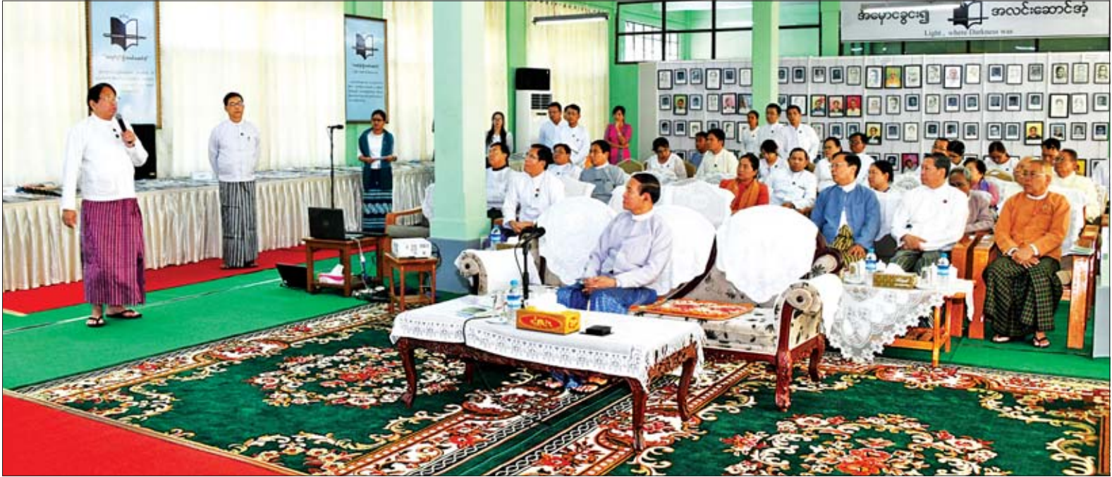
နိုင်ငံတော်သမ္မတ ဦးဝင်းမြင့်အား စာပေဗိမာန်၏ လုပ်ငန်းဆောင်ရွက်မှုအခြေအနေများနှင့်စပ်လျဉ်း၍ ပြည်ထောင်စုဝန်ကြီး ဒေါက်တာဖေမြင့်က ဖြည့်စွက်ရှင်းလင်းတင်ပြစဉ်။