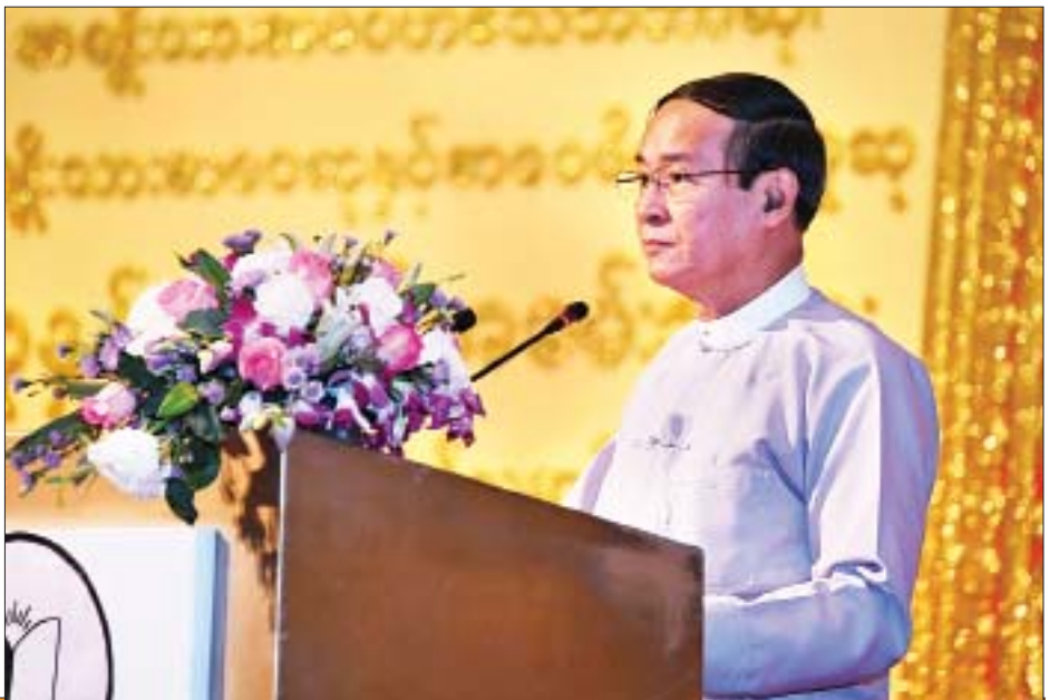
နိုင်ငံတော်သမ္မတ ဦးဝင်းမြင့် ၂၀၁၈ ခုနှစ်အတွက် အမျိုးသားစာပေတစ်သက်တာဆု၊ အမျိုးသားစာပေဆုနှင့် စာပေဗိမာန်စာမူဆုချီးမြှင့်ပွဲတွင် မိန့်ခွန်းပြောကြားစဉ်။

၂၀၁၈ ခုနှစ်အတွက် အမျိုးသားစာပေတစ်သက်တာ ဆု ရရှိခဲ့သည့် ပညာရှင်ကြီးနှစ်ဦးသည် မြန်မာစာပေလောက ဖွံ့ဖြိုးရေးနှင့် နိုင်ငံသူနိုင်ငံသားများ အသိပညာကြွယ်ဝရေး အတွက် စာကောင်းပေမွန်များကို တစ်စုံတစ်ရာ ရေးဖွဲ့ ဖန်တီးခဲ့ကြသူများဖြစ်သည့်အတွက် ဂုဏ်ယူမိပါကြောင်း၊ အမျိုးသားစာပေဆုရရှိခဲ့သည့် စာရေးသူများနှင့် စာအုပ်များ ကို ကြည့်မည်ဆိုလျှင်လည်း ခေတ်အတွေး၊ ခေတ်အမြင် များကို ထင်ဟပ်ဖော်ကျူးသည့် ရသစာပေ၊ သုတစာပေများ ကို ရေးဖွဲ့နိုင်သည့်အပြင် နိုင်ငံဖွံ့ဖြိုးရေးအတွက် ဖြည့်ဆည်းသင့်သည့် အသိပညာများ၊ အတတ်ပညာများကို ပြုစုရေးသားထားသည့် စာအုပ်များဖြစ်ကြောင်း ဆုရွေးချယ်ရေးအဖွဲ့က သုံးသပ်ထောက်ခံထားသည်ကို တွေ့ရပါကြောင်း၊ အလားတူ စာပေဗိမာန်စာမူဆုတွင်လည်း ကလောင်ရင့် စာရေးဆရာများသာမက ကလောင်နုစာရေး