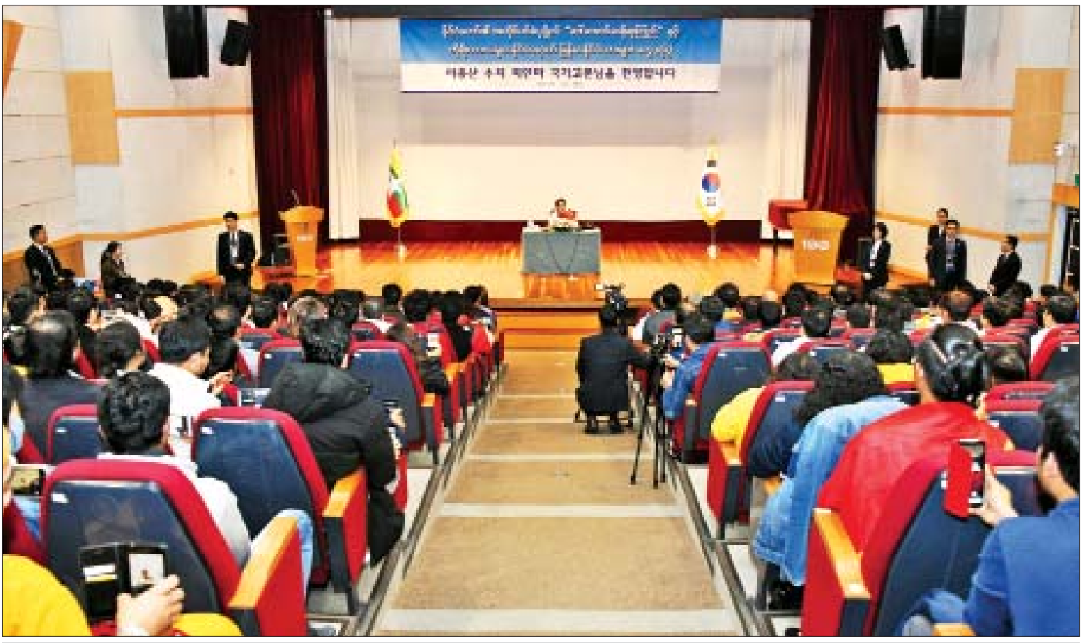
နိုင်ငံတော်၏အတိုင်ပင်ခံပုဂ္ဂိုလ် ဒေါ်အောင်ဆန်းစုကြည် ကိုရီးယားသမ္မတနိုင်ငံရောက် မြန်မာနိုင်ငံသားများနှင့် တွေ့ဆုံစဉ်။

ထုတ်ပြန်ကြေညာ အဆိုပါ ထိပ်သီးအစည်းအဝေးတွင် “မဲခေါင်မြစ်နှင့် ဟန်မြစ်ကြေညာချက်” “Mekong - Han River Declaration” ကို ထုတ်ပြန်ကြေညာခဲ့သည်။ ယင်းကြေညာချက်အရ မဲခေါင်နိုင်ငံ များနှင့် ကိုရီးယားနိုင်ငံတို့သည် လူသားအရင်းအမြစ် ဖွံ့ဖြိုးတိုးတက် ရေး၊ စိုက်ပျိုးရေးနှင့် ကျေးလက်ဒေသ ဖွံ့ဖြိုးတိုးတက်ရေး၊ သတင်းအချက် အလက်နည်းပညာ၊ အခြေခံ အဆောက်အအုံ၊ သဘာဝပတ်ဝန်းကျင် ထိန်းသိမ်းရေး၊ သမားရိုးကျမဟုတ် သော လုံခြုံရေးဆိုင်ရာနှင့် ယဉ်ကျေးမှု နှင့် ခရီးသွားလာရေးကဏ္ဍတို့တွင်