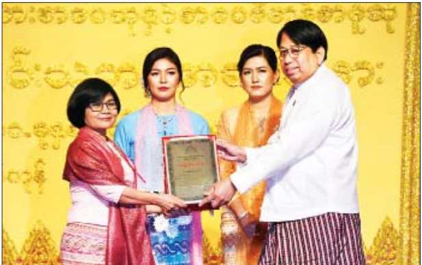
ပြည်ထောင်စုဝန်ကြီး ဒေါက်တာဖေမြင့် အမျိုးသားစာပေဆု ဝတ္ထုရှည်ဆုရ ဂျူးအား ဆုပေးအပ်ချီးမြှင့်စဉ်။