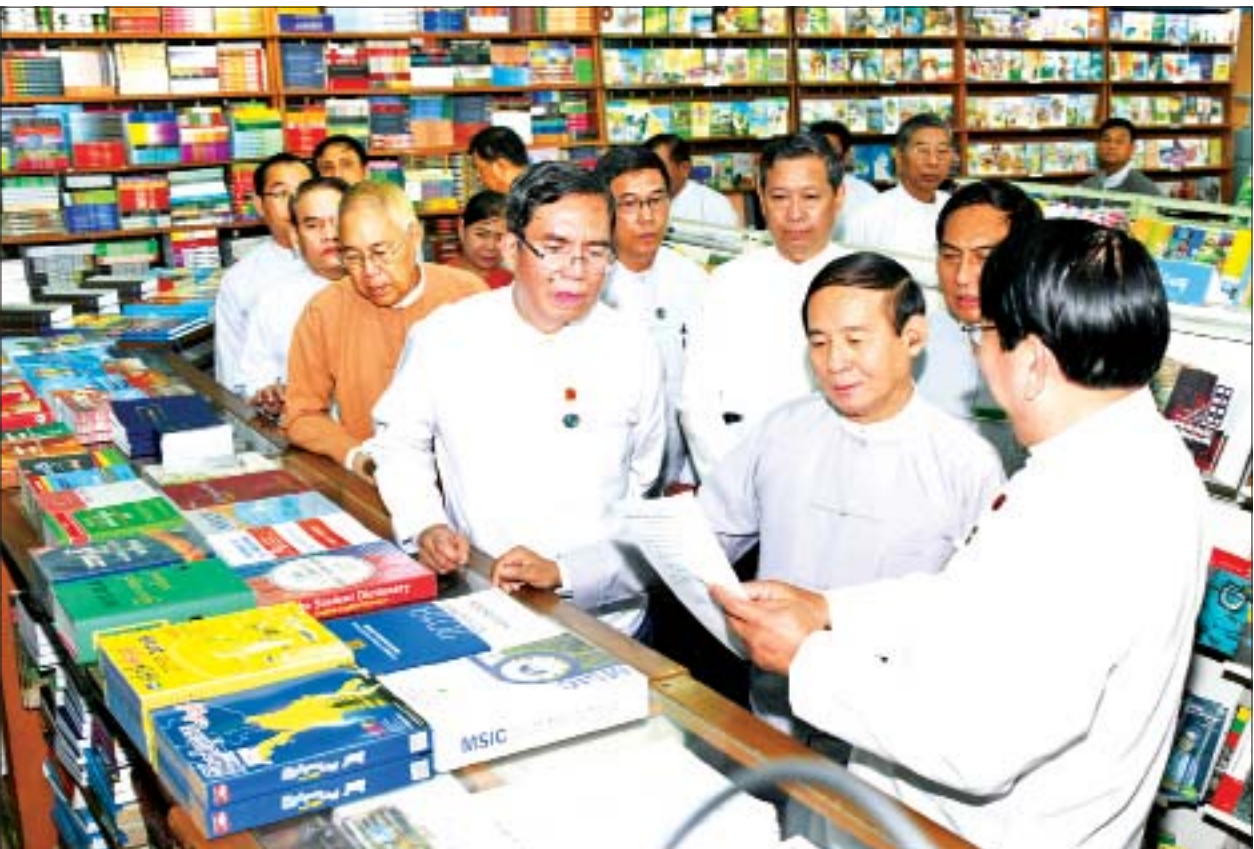
နိုင်ငံတော်သမ္မတ ဦးဝင်းမြင့် စာပေဗိမာန်ခန်းမအတွင်း ခင်းကျင်းပြသထားသည့် စာအုပ်အရောင်းဆိုင်ကို လှည့်လည်ကြည့်ရှုစဉ်။