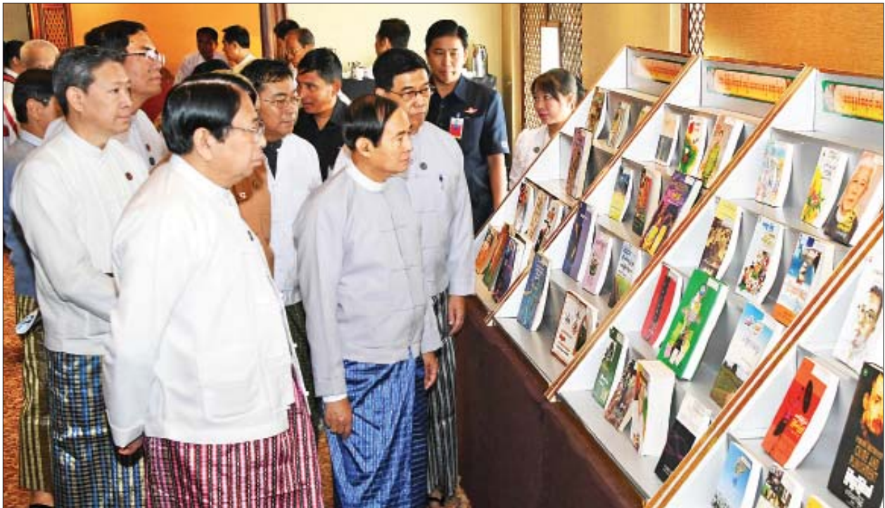
နိုင်ငံတော်သမ္မတ ဦးဝင်းမြင့် ၂၀၀၉ မှ ၂၀၁၈ ခုနှစ်အထိ အမျိုးသားစာပေဆုရစာအုပ်များ ခင်းကျင်းပြသထားမှုကို လှည့်လည်ကြည့်ရှုစဉ်။

အမိမြန်မာနိုင်ငံတွင် နှစ်စဉ်နှစ်တိုင်း နတ်တော်လဆန်း ၁ ရက်တွင် စာဆိုတော်နေ့အခမ်းအနားကို ကျင်းပလာခဲ့သည်မှာ နှစ်ပေါင်း ၇၅ နှစ်ခန့် ရှိခဲ့ပြီဖြစ်ပါကြောင်း၊ မိမိနိုင်ငံ၏ ဘာသာသာသနာ၊ လူမှုရေး၊ နိုင်ငံရေးနှင့် စီးပွားရေး၊ စာပေယဉ်ကျေးမှုအသိပညာအဖြာဖြာ တိုးတက်ဖွံ့ဖြိုးအောင် ခေတ်အဆက်ဆက်တွင် ကလောင်ကိုင်စွဲပြီး ပါဝင်ကြိုးပမ်းခဲ့ကြသည့် စာပေပညာရှင် စာဆိုတော်ကြီးများ၏ ဂုဏ်ကျေးဇူးများကို အသိအမှတ်ပြု ချီးမြှောက် ဂုဏ်ပြုသည့်အနေဖြင့် စာဆိုတော်နေ့အခမ်းအနားများကို နိုင်ငံတစ်ဝန်း ခြိမ်းခြံမိသကဲ့သို့ ပြုပါကြောင်း၊ ယခုအချိန်တွင် ယင်းအစဉ်အလာသည်