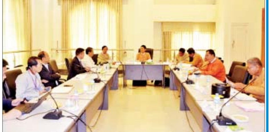
ပြည်သူ့လွှတ်တော် လှုပ်စစ်နှင့် စွမ်းအင်ဖွံ့ဖြိုးတိုးတက်ရေးကော်မတီဥက္ကဋ္ဌ ဦးကြည်မိုးနိုင် Danayarzar Co.,Ltd အဖွဲ့အား လက်ခံတွေ့ဆုံစဉ်။

ကျွန်တော်တို့ကော်မတီက လျှပ်စစ်ဖွံ့ဖြိုးတိုးတက်ရေးအတွက် နည်းလမ်းတွေ ရှာဖွေတယ်။ သက်ဆိုင်ရာဝန်ကြီးဌာန၊ လုပ်ငန်းရှင်တွေ၊ ပညာရှင်တွေနဲ့လည်း ညှိနှိုင်းဆွေးနွေးတယ်။ သူတို့နဲ့ တိုင်ပင်ဆွေးနွေးတဲ့အခါ အကြံပြုတာတွေလည်း ရှိပါတယ်။ ဒီလို ဆွေးနွေးတဲ့အခါ ကမ္ဘာ့ဘဏ်တို့၊ အာရှဖွံ့ဖြိုးရေးဘဏ်တို့က လျှပ်စစ်ဓာတ်အား