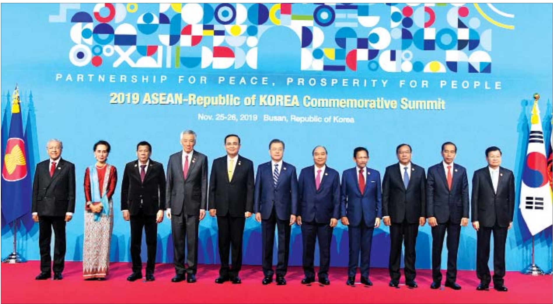
နိုင်ငံတော်၏အတိုင်ပင်ခံပုဂ္ဂိုလ် ဒေါ်အောင်ဆန်းစုကြည် ကိုရီးယားသမ္မတနိုင်ငံ သမ္မတ မစ္စတာ မွန်ဂျေအင်း၊ အာဆီယံနိုင်ငံများမှ နိုင်ငံအကြီးအကဲများ၊ အစိုးရအဖွဲ့အကြီးအကဲများနှင့်အတူ မှတ်တမ်းတင်ဓာတ်ပုံရိုက်စဉ်။

အာဆီယံ-ကိုရီးယား ဆွေးနွေးဖက်ဆက်ဆံရေး နှစ်(၃၀)ပြည့် အထိမ်းအမှတ် ထိပ်သီးအစည်းအဝေး၊ မြန်မာ-ကိုရီးယား နှစ်နိုင်ငံတွေ့ဆုံပွဲနှင့် နှစ်နိုင်ငံနားလည်မှုစာချုပ်လွှာလက်မှတ်ရေးထိုးပွဲ အခမ်းအနားသို့ တက်ရောက်