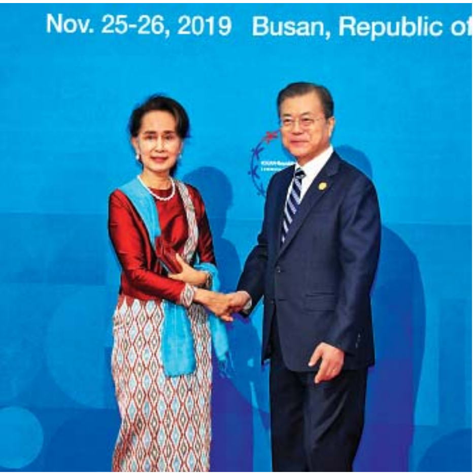
နိုင်ငံတော်၏အတိုင်ပင်ခံပုဂ္ဂိုလ် ဒေါ်အောင်ဆန်းစုကြည်အား ကိုရီးယားသမ္မတနိုင်ငံ သမ္မတ မစ္စတာ မွန်ဂျေအင်းက ရင်းရင်းနှီးနှီး နှုတ်ဆက်စဉ်။

ညစာမသုံးဆောင်မီ နိုင်ငံတော်၏အတိုင်ပင်ခံပုဂ္ဂိုလ်သည် ကိုရီးယားသမ္မတနှင့် ဇနီး၊ မဲခေါင်ဒေသနိုင်ငံများမှ အစိုးရအဖွဲ့အကြီးအကဲများနှင့် ဇနီးများနှင့်အတူ မှတ်တမ်းတင်ဓာတ်ပုံရိုက်သည်။ သတင်းစဉ်