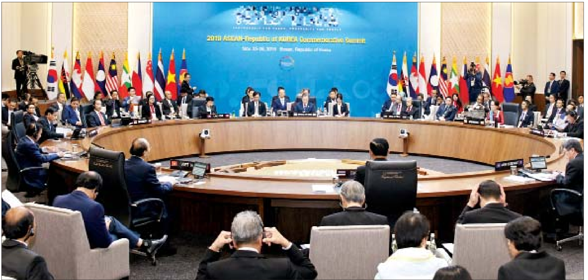
အာဆီယံ-ကိုရီးယားဆွေးနွေးဖက်ဆက်ဆံရေးနှစ်(၃၀)ပြည့်အထိမ်းအမှတ် ထိပ်သီးအစည်းအဝေး ကျင်းပစဉ်။