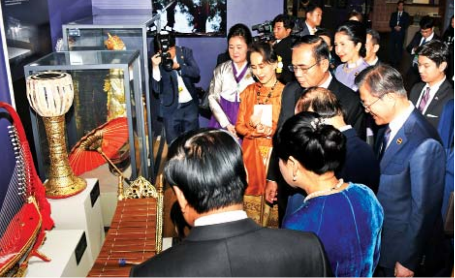
နိုင်ငံတော်၏အတိုင်ပင်ခံပုဂ္ဂိုလ် ဒေါ်အောင်ဆန်းစုကြည် ကိုရီးယားသမ္မတနိုင်ငံသမ္မတနှင့် အာဆီယံနိုင်ငံများမှ နိုင်ငံအကြီးအကဲများ၊ အစိုးရအဖွဲ့အကြီးအကဲများနှင့်အတူ ဘူဆန်မြို့ရှိ ASEAN Culture House ၌ ယဉ်ကျေးမှုပြခန်းများကို လိုက်လံကြည့်ရှုစဉ်။