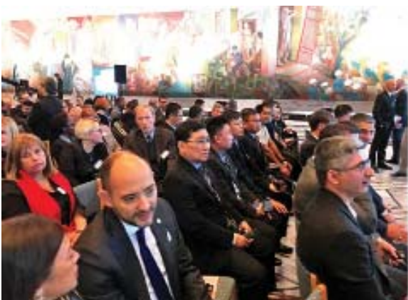
အပြည်ပြည်ဆိုင်ရာ ဖွံ့ဖြိုးတိုး တက်ရေးဝန်ကြီး Mr. Dag-Inge Ulstein တို့နှင့်