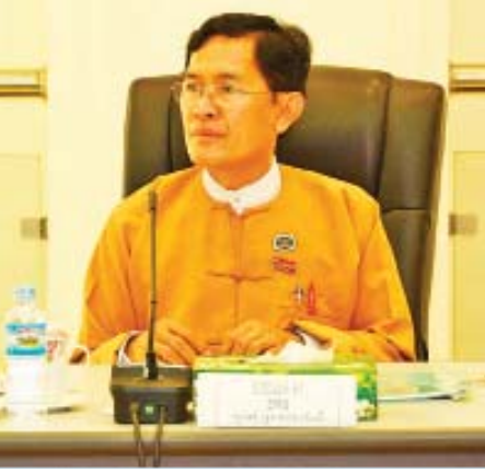
ဦးကြည်မိုးနိုင် ရေတာရှည်မဲဆန္ဒနယ်၊ ပြည်သူ့လွှတ်တော်ကိုယ်စားလှယ်

လျှပ်စစ်ဓာတ်အားခ ပြောင်းလဲကောက်ခံတဲ့ အခါ နိုင်ငံတော်က စိုက်ထုတ်မှု လျော့ပါးအောင်နဲ့ ပြည်သူ့လူထု အပေါ်မှာ ဝန်ထုပ်မပိအောင် အကြိမ်ပေါင်းများစွာ နည်းလမ်းအမျိုးမျိုးနဲ့ တိုင်ပင်ဆွေးနွေးခဲ့ပါတယ်။ ဒီလိုဆွေးနွေးပြီးမှ အားလုံးအဆင်ပြေစေမှာကို ဆောင်ရွက်ခဲ့တာ ဖြစ်ပါတယ်။