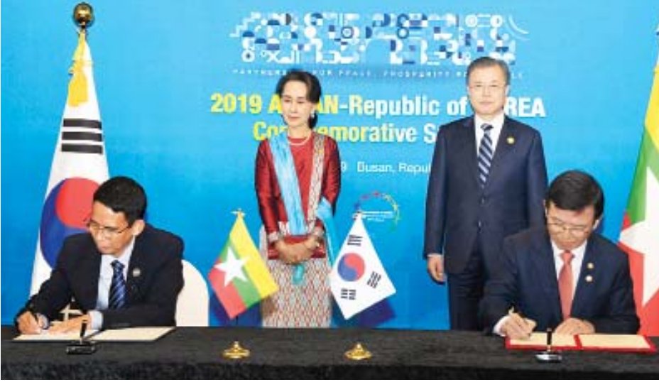
နိုင်ငံတော်၏ အတိုင်ပင်ခံပုဂ္ဂိုလ် ဒေါ်အောင်ဆန်းစုကြည်နှင့် ကိုရီးယား သမ္မတနိုင်ငံ သမ္မတ မစ္စတာမွန်ဂျေအင်းတို့ ရှေ့မှောက်၌ ပြည်ထောင်စုဝန်ကြီး ဒေါက်တာအောင်သူနှင့် ကိုရီးယားသမ္မတနိုင်ငံ ပင်လယ်သမုဒ္ဒရာနှင့် ငါးလုပ်ငန်းဝန်ကြီးဌာန ဝန်ကြီး Mr. Moon Seong-Hyeok တို့ ငါးလုပ်ငန်းဆိုင်ရာ ပူးပေါင်းဆောင်ရွက်မှုနားလည်မှုစာချုပ်လွှာ လက်မှတ်ရေးထိုးစဉ်။