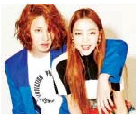
ဟီးချော(ဝဲ)နှင့် ဂိုဟာရာ(ယာ)