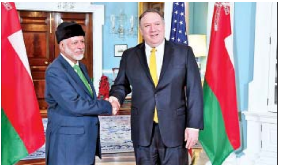
အမေရိကန်နိုင်ငံခြားရေးဝန်ကြီး မိုက်ပွန်ပီယိုနှင့် အိုမန်နိုင်ငံခြားရေးဝန်ကြီး ယူဆွတ်ဘင်အလာဝီအဗ္ဗဒူလာ တို့ တွေ့ဆုံစဉ်။

အရေးပါမှုကိုလည်း ၎င်းတို့က ဆွေးနွေးခဲ့ကြသည်။ ယခုလအစောပိုင်းတွင် ယီမင်နိုင်ငံရှိ နိုင်ငံတကာအသိအမှတ်ပြုအစိုးရအဖွဲ့သည် ဆော်ဒီအာရေဗျနိုင်ငံရှိ ယာဒ်မြို့တော်၌ တောင်ပိုင်းအသွင်ကူးပြောင်းရေးကောင်စီ(အက်စ်တီစီ)နှင့် အာဏာခွဲဝေပေးရေးစာချုပ်တစ်ခုကို လက်မှတ်ရေးထိုးခဲ့သည်။ တောင်ပိုင်း အသွင်ကူးပြောင်းရေးကောင်စီ(အက်စ်တီစီ)မှာ ယီမင်နိုင်ငံရှိ အီရန်နိုင်ငံက ထောက်ပံ့ပေးထားသော ဟူသီစစ်သွေးကြွများကို တိုက်ခိုက်ရာတွင် ဆော်ဒီအာရေဗျဦးဆောင်သည့် အာရပ်ညွန့်ပေါင်းအဖွဲ့၏ အရေးပါသောအစိတ်အပိုင်းတစ်ခုဟု ယူဆရသည်။ သဘောတူညီချက်အရ အစိုးရသစ်က ယီမင်နိုင်ငံ၏ ယာယီဆိပ်ကမ်းမြို့တော် အေဒင်မှ ပြည်သူများအတွက် တာဝန်များထမ်းဆောင်မည်ဖြစ်သည်။ ဟူသီအဖွဲ့က နိုင်ငံအတွင်းရှိ နယ်မြေအများစုကို စီးနင်းတိုက်ခိုက်ကာ ဆာနာမြို့တော်အပါအဝင် မြောက်ပိုင်းနယ်မြေများအားလုံးကို သိမ်းပိုက်ခဲ့သည့် ၂၀၁၄ ခုနှစ် နှောင်းပိုင်းကတည်းက ယီမင်နိုင်ငံ၌ ပြည်တွင်းစစ်ဖြစ်ပွားခဲ့သည်။ ကိုးကား - ဆင်ဟွာ ဘာသာပြန်- ကျော်ထိုက်စိုး