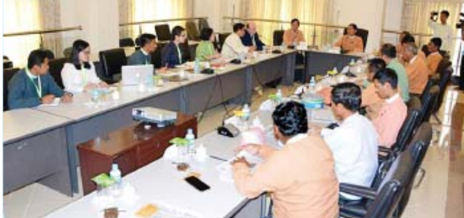
ပြည်သူ့လွှတ်တော် လျှပ်စစ်နှင့် စွမ်းအင်ဖွံ့ဖြိုးတိုးတက်ရေးကော်မတီဥက္ကဋ္ဌ ဦးကြည်မိုးနိုင် Energize Myanmar Co.,Ltd အဖွဲ့အား လက်ခံတွေ့ဆုံစဉ်။

အဖြစ် ပေါင်းလိုက်တဲ့အတွက် ဒီလိုဝေါဟာရတွေ၊ စကားရပ်တွေကအစ လက်ရှိအကောင်အထည်ဖော်ဆောင်ရွက်မှုနဲ့ ကိုက်ညီအောင် စိစစ်ရပါတယ်။ တစ်နိုင်ငံလုံး၏ လျှပ်စစ်ဓာတ်အား သုံးစွဲမှုအပေါ် နိုင်ငံတော်က စိုက်ထုတ်သုံးစွဲရတဲ့ ကုန်ကျမှုကို လွန်ခဲ့တဲ့နှစ်နှစ်ခွဲလောက်ကတည်းက ကော်မတီက ဝန်ကြီးဌာနနဲ့ လက်တွဲပြီး အသေးစိတ်လေ့လာခဲ့ကြတယ်။ ပြီးခဲ့တဲ့ ဇူလိုင်လမှာ ပြုပြင်ပြောင်းလဲရေး စတင်ခဲ့တယ်။ ဒီလို နိုင်ငံတော်က စိုက်ထုတ်မှုလျှော့ချနိုင်ဖို့ အရပ်ဘက်အဖွဲ့အစည်းတွေ၊ ပြည်တွင်း၊ ပြည်ပပညာရှင်တွေ၊ ပုဂ္ဂလိကလုပ်ငန်းရှင်တွေ အားလုံးပူးပေါင်းပြီးတော့ နိုင်ငံတကာအတွေ့အကြုံ ကိုယ့်နိုင်ငံရဲ့အခြေအနေ ဒါတွေကို နှိုင်းယှဉ်သုံးသပ်ကြတယ်။ ပြည်သူတွေလည်း