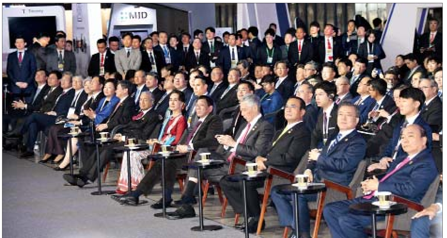
နိုင်ငံတော်၏အတိုင်ပင်ခံပုဂ္ဂိုလ် ဒေါ်အောင်ဆန်းစုကြည် ASEAN-ROK Startup Summit and Innovation Showcase 2019 ဖွင့်ပွဲအခမ်းအနားသို့ ကိုရီးယားသမ္မတ၊ အာဆီယံနိုင်ငံများမှ နိုင်ငံအကြီးအကဲများ၊ အစိုးရအဖွဲ့အကြီးအကဲများနှင့်အတူ တက်ရောက်စဉ်။