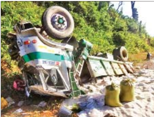
ထွေး(ခ)နိုင်ဝင်း ရွှေပြည်သာမြို့နယ် နေသူတို့သေဆုံးခဲ့ကြောင်း သိရသည်။ ဖြစ်စဉ်နှင့်ပတ်သက်၍ ၀၆မြို့နယ် ပဒါန်းနယ်မြေရဲစခန်းက အမှုဖွင့်ထားကြောင်း သိရသည်။ ဇေယျတု(မကွေး)

၀၆ နိုဝင်ဘာ ၂၆ မကွေးတိုင်းဒေသကြီး ၀၆မြို့နယ် ဂုတ်ကြီးကျေးရွာအနီး မင်းဘူး-အမ်းကားလမ်း ပေါလုကျွေတွင် ဆန်အိတ်များ တင်ဆောင်လာသည့် ကုန်တင်ယာဉ်တစ်စီး နိုဝင်ဘာ ၂၅ ရက်ည ၈ နာရီခွဲခန့်က တိုက်မောက်ခဲ့ပြီး ယာဉ်မောင်းနှင့် ယာဉ်နောက်လိုက် သေဆုံးခဲ့ကြောင်း သိရသည်။