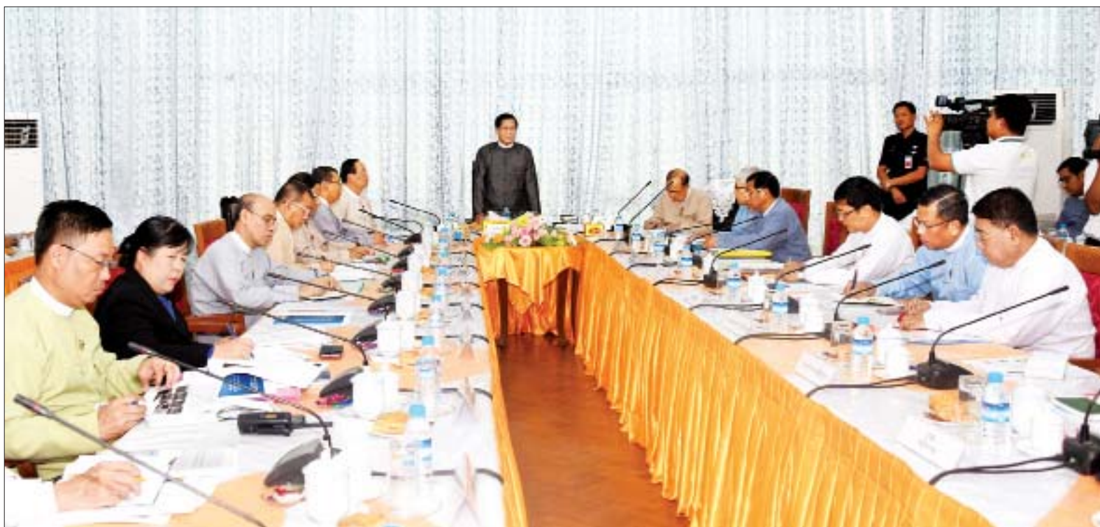
ဒုတိယသမ္မတ ဦးဟင်နရီဗန်ထီးယူ အမျိုးသားအဆင့်ရေအရင်းအမြစ် ကော်မတီ၏ ရှေ့လုပ်ငန်းစဉ် ညှိနှိုင်းအစည်းအဝေးတွင် အမှာစကားပြောကြားစဉ်။