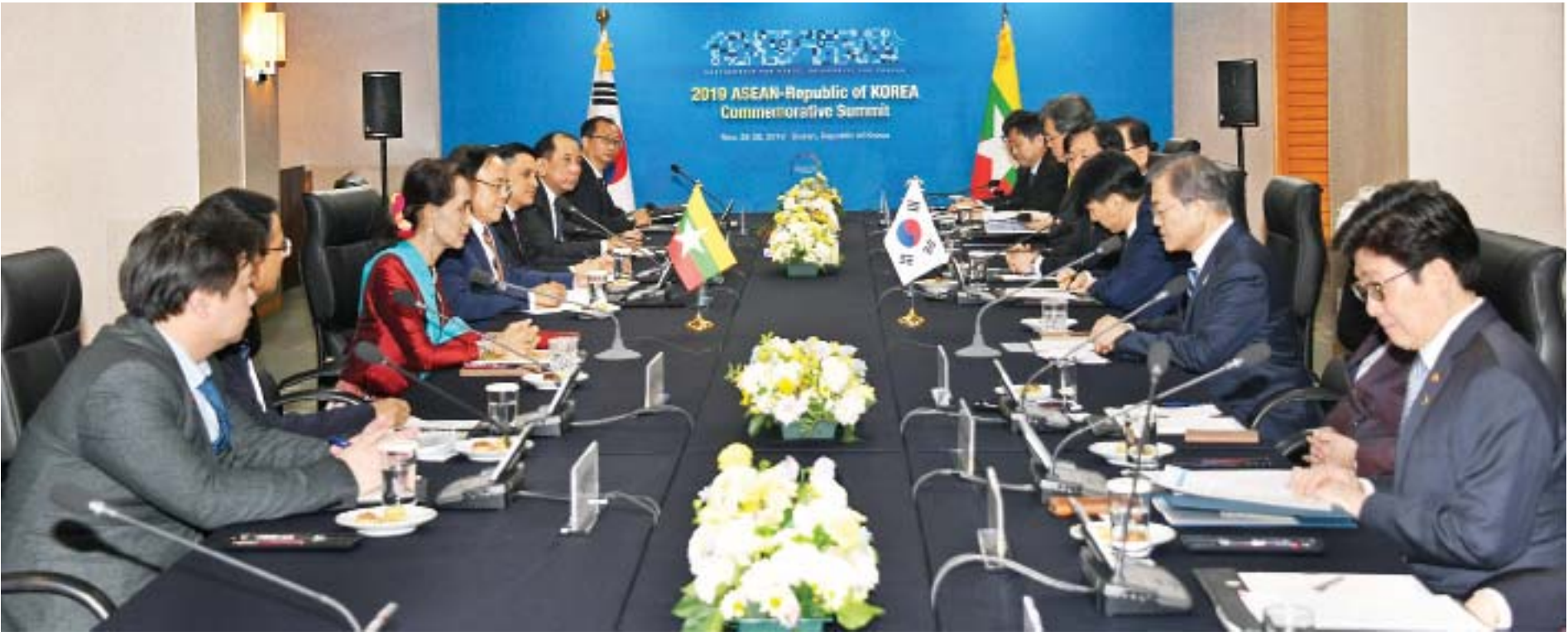
နိုင်ငံတော်၏အတိုင်ပင်ခံပုဂ္ဂိုလ် ဒေါ်အောင်ဆန်းစုကြည် ဦးဆောင်သောအဖွဲ့နှင့် ကိုရီးယားသမ္မတနိုင်ငံ သမ္မတ မစ္စတာ မွန်ဂျေအင်း ဦးဆောင်သောအဖွဲ့တို့ မြန်မာ-ကိုရီးယား နှစ်နိုင်ငံ တွေ့ဆုံဆွေးနွေးစဉ်။