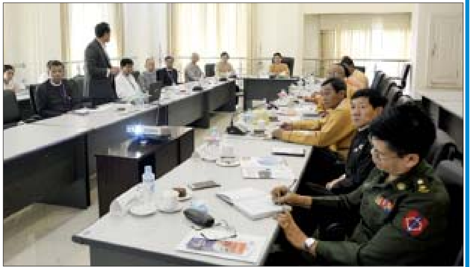
ကောက်ခံမှုနှုန်းကိုပြောင်းလဲကောက်ခံဖို့အကြံပေးခဲ့တာရှိပါတယ်။ ကျန်တဲ့ ဖွံ့ဖြိုးရေးလုပ်ငန်းတွေအတွက်လည်း အကြံပြုတာ အများကြီးရှိပါတယ်။