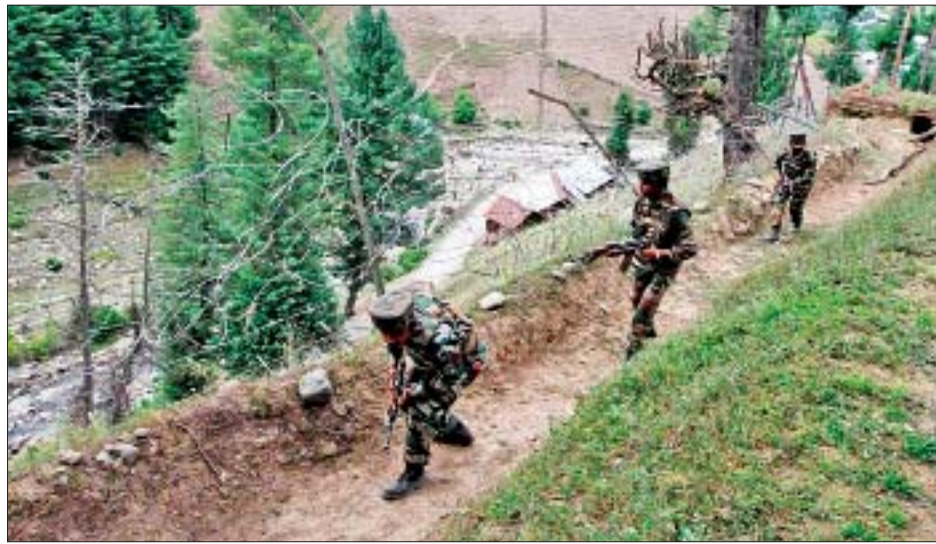
ပျက်စီးမှုများနှင့် အသက်ဆုံးရှုံးမှုသတင်းများ ထွက်ပေါ်ခြင်းမရှိပေ။ နိုဝင်ဘာ ၂၅ ရက် ဒေသစံတော်ချိန် နံနက် ၄ နာရီဝန်းကျင်တွင် ပထမအကြိမ် ပစ်ခတ်မှုများဖြစ်ပွားခဲ့ကြောင်း တာဝန်ရှိသူတစ်ဦးက ပြောကြားသည်။ ကက်ရှီမီးယားဒေသတွင် ယခုနှစ်လက်ရှိအချိန်အထိ အပစ်အခတ်ရပ်စဲမှုကို ချိုးဖောက်သည့် ပစ်ခတ်မှု အကြိမ် ၂၀၀၀ ကျော်အထိ ဖြစ်ပွားခဲ့ကြောင်း တရားဝင်မှတ်တမ်းများအရ သိရသည်။ ကိုးကား - ဆင်ဟွာ ဘာသာပြန် - ဇော်ဝင်း

ဆရီနာဂါ နိုဝင်ဘာ ၂၆ ကက်ရှီမီးယားဒေသအား ပိုင်းခြားထားသည့် ထိန်းချုပ်ရေးများ (အယ်လ်အိုစီ)အား ဖြတ်ကျော်၍ အိန္ဒိယနှင့် ပါကစ္စတန်တပ်ဖွဲ့များသည် အပြန်အလှန်ပစ်ခတ်မှုများ ပြင်းထန်စွာ ဖြစ်ပွားခဲ့ကြောင်း တာဝန်ရှိသူများက နိုဝင်ဘာ ၂၆ ရက်တွင် ပြောကြားသည်။ ဂျမူးခရိုင် အာဒ်နီဒေသတွင် အိန္ဒိယနှင့် ပါကစ္စတန်တပ်ဖွဲ့များက တစ်ဖက်တစ်ချက်စီရှိ စခန်းများနှင့် လူနေဒေသများကို ပစ်မှတ်ထားပစ်ခတ်ခဲ့ကြခြင်းဖြစ်သည်။ ဂျမူးခရိုင်တွင် အိန္ဒိယနိုင်ငံက ထိန်းချုပ်ထားသည့် ကက်ရှီမီးယားဒေသ၏ ဆောင်းရာသီမြို့တော်တည်ရှိသည်။ ပါကစ္စတန်တပ်ဖွဲ့များသည် နိုဝင်ဘာ ၂၅ ရက်က အာဒ်နီဒေသရှိ ဒိုအာနှင့် ပယ်လန်ဝါလာ အရပ်များရှိ အရပ်သားများနေထိုင်ရာနေရာများနှင့် အိန္ဒိယတပ်ဖွဲ့၏ ရှေ့တန်းစခန်းများကို ပစ်မှတ်ထားကာ ပစ်ခတ်ခဲ့ကြောင်း၊ ပါကစ္စတန်တပ်ဖွဲ့များက အပစ်အခတ်ရပ်စဲထားမှုကို ချိုးဖောက်ကာ ရန်စလှုံ့ဆော်သည့် ပစ်ခတ်မှုများ ပြုလုပ်ခဲ့ခြင်းကြောင့် မိမိတို့တပ်ဖွဲ့များကလည်း လက်တုံ့ပြန်ပစ်ခတ်ခဲ့ကြောင်း အိန္ဒိယစစ်ဘက်မှ ပြောရေးဆိုခွင့်ရှိသူက ပြောကြားခဲ့သည်။ ယင်းသို့ နှစ်ဖက်တပ်ဖွဲ့များ၏ အပြန်အလှန် ပစ်ခတ်မှုကြောင့် အိန္ဒိယပိုင် ကက်ရှီမီးယားဒေသဘက်ခြမ်းတွင်