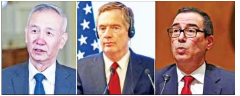
တရုတ်ဒုတိယဝန်ကြီးချုပ် လျူဟဲ၊ အမေရိကန် ကုန်သွယ်ရေးကိုယ်စားလှယ် ရောဘတ်လိုက်သီဇာနှင့် အမေရိကန် ဘဏ္ဍာရေးဝန်ကြီး စတီဗင်မနူချင်။

လုပ်ဆောင်ရန် သဘောတူခဲ့ကြသည်။ တရုတ်နိုင်ငံ၏ ဒုတိယဝန်ကြီးချုပ် လျူဟဲသည် တရုတ်ကွန်မြူနစ်ပါတီ နိုင်ငံရေးဗဟိုအဖွဲ့ဝင် တစ်ဦးဖြစ်ပြီး တရုတ်နိုင်ငံအမေရိကန်အကြား ဘက်စုံမဟာဗျူဟာ စီးပွားရေးနှင့် ကုန်သွယ်ရေးဆွေးနွေးမှုများတွင် တရုတ်ဘက်မှ ဆွေးနွေးမှုခေါင်းဆောင်တစ်ဦး ဖြစ်သည်။ အဆိုပါဆွေးနွေးမှုများတွင် တရုတ်စီးပွားရေးနှင့် ကူးသန်းရောင်းဝယ်ရေးဝန်ကြီးကြောင်ရှန်း၊ တရုတ်ပြည်သူ့ဘဏ်ဥက္ကဋ္ဌ ယီဂန်နှင့် အမျိုးသားဖွံ့ဖြိုးရေးနှင့် ပြုပြင်ပြောင်းလဲရေးကော်မရှင် ဒုတိယဥက္ကဋ္ဌ နင်ဂျီထီတို့လည်း ပါဝင်ကြကြောင်း သိရသည်။ ကိုးကား-ဆင်ဟွာ ဘာသာပြန်-ဂျေတီ