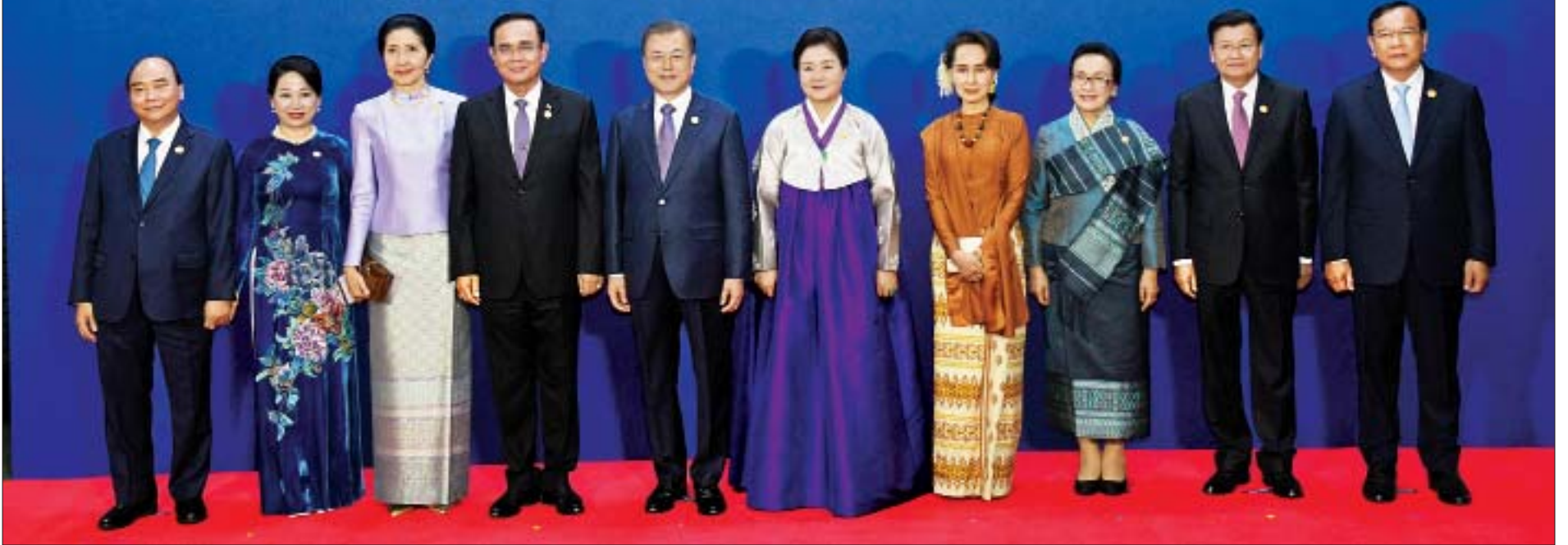
နိုင်ငံတော်၏အတိုင်ပင်ခံပုဂ္ဂိုလ် ဒေါ်အောင်ဆန်းစုကြည်၊ ကိုရီးယားသမ္မတနှင့်ဇနီး၊ မဲခေါင်ဒေသနိုင်ငံများမှ အစိုးရအဖွဲ့အကြီးအကဲများနှင့်ဇနီးများ စုပေါင်းမှတ်တမ်းတင်ဓာတ်ပုံရိုက်ကြစဉ်။ သတင်း-ရှေ့ဖုံး