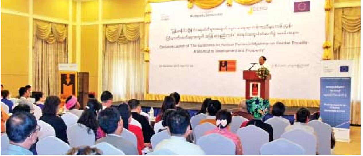
ပြည်ထောင်စုရွေးကောက်ပွဲကော်မရှင်ဥက္ကဋ္ဌ ဦးလှသိန်း “မြန်မာနိုင်ငံရှိနိုင်ငံရေးပါတီများအတွက် ကျား/မရေးရာတန်းတူညီမျှမှုလမ်းညွှန်၊ ကြီးပွား တိုးတက်ရေးအတွက် အမြန်ဆုံးနည်းလမ်း” စာအုပ်အထူးမိတ်ဆက်ပွဲ အခမ်းအနားတွင် အမှာစကားပြောကြားစဉ်။

အခမ်းအနားတွင် ပြည်ထောင်စုရွေးကောက်ပွဲကော်မရှင် ဥက္ကဋ္ဌ ဦးလှသိန်း က ဒီမိုကရေစီနိုင်ငံများတွင် နိုင်ငံသားတိုင်း တန်းတူညီမျှဖြစ်သည်ဆိုသည့် အခြေခံမူကို အလေးထားကြပါကြောင်း၊ ရွေးကောက်ပွဲတွင် ဝင်ရောက်ယှဉ်ပြိုင် အရွေးခံခြင်းနှင့် ဆန္ဒမဲပေးခြင်းတို့သည် လူသားအားလုံး ကျား/မတန်းတူညီမျှ ပါဝင်ခွင့်ရှိသော လူ့အခွင့်အရေးတစ်ရပ် ဖြစ်ပါကြောင်း၊ ကျင်းပပြီးစီးခဲ့သည့် ရွေးကောက်ပွဲများတွင် အမျိုးသမီးများ ဝင်ရောက်ယှဉ်ပြိုင်အရွေးခံခြင်းနှင့် စပ်လျဉ်း၍ ၂၀၁၀ ပြည့်နှစ် အထွေထွေရွေးကောက်ပွဲတွင် ကိုယ်စားလှယ်လောင်း ၃၀၆၉ ဦးအနက် အမျိုးသမီးဦးရေ ၁၂၇ ဦး ဝင်ရောက်ယှဉ်ပြိုင်ခဲ့ပြီး လွှတ်တော် တွင် ၄ ဒသမ ၁ ရာခိုင်နှုန်းရွေးချယ်ခဲ့ပါကြောင်း၊ ၂၀၁၅ ခုနှစ် အထွေထွေ ရွေးကောက်ပွဲတွင် ကိုယ်စားလှယ်လောင်း ၆၀၃၈ ဦးအနက် အမျိုးသမီး ဦးရေ ၈၀၀ ဝင်ရောက်ယှဉ်ပြိုင်ခဲ့ပြီး လွှတ်တော်တွင် အမျိုးသမီးရွေးချယ်ခံရမှု ၁၃ ရာခိုင်နှုန်းအထိ မြင့်တက်ခဲ့ပါကြောင်း၊ ရွေးကောက်ပွဲတွင် အမျိုးသမီးများ ပိုမိုပါဝင်လာစေရန်အတွက် နိုင်ငံရေးပါတီများအနေဖြင့် အလေးထားကူညီ ဆောင်ရွက်ပေးစေလိုပါကြောင်း၊ မြန်မာနိုင်ငံအနေဖြင့် အမျိုးသမီးများအား နည်းမျိုးစုံဖြင့် ခွဲခြားဆက်ဆံမှုပျောက်ရေးဆိုင်ရာ သဘောတူစာချုပ် The Convention on the Elimination of all Forms of Discrimination Against Women (CEDAW) ပါ အချက်အလက်များကို လိုက်နာအကောင်အထည်ဖော် ဆောင်ရွက်ရန် ၁၉၉၇ ခုနှစ်တွင် သဘောတူလက်မှတ်ရေးထိုးခဲ့ပါကြောင်း၊