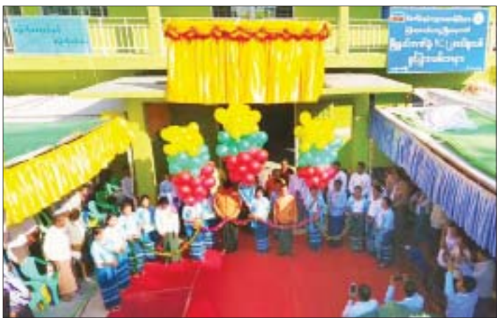
စီမံကိန်းနှင့် ဘဏ္ဍာရေးဝန်ကြီးဌာန မြန်မာ့လယ်ယာဖွံ့ဖြိုးရေးဘဏ် ရမည်းသင်းမြို့နယ် ဘဏ်ခွဲရုံးသစ်ဖွင့်ပွဲ အခမ်းအနားကို နိုဝင်ဘာ ၂၆ ရက် နံနက်ပိုင်းတွင် ကျင်းပရာ မန္တလေး တိုင်းဒေသကြီးလွှတ်တော် ဒုတိယဥက္ကဋ္ဌ ဒေါက်တာခင်မောင်ဌေး တက်ရောက်အမှာစကား ပြောကြားပြီး တာဝန်ရှိသူများက ဘဏ်ခွဲရုံးသစ်ကို ဖဲကြိုးဖြတ် ဖွင့်လှစ်ပေးကြစဉ်။ သတင်းစဉ်

နေပြည်တော် နိုဝင်ဘာ ၂၆။ ။ ယနေ့ ညနေ ၅ နာရီ ၃၅ မိနစ် ၅၇ စက္ကန့်တွင် နေပြည်တော် မြေလျင်စခန်းမှ အနောက် တောင်ဘက် ၈၇ မိုင်ခန့် ကွာဝေးသော မြန်မာနိုင်ငံပြည်တွင်း (သရက်မြို့၏အနောက်တောင်ဘက် ၁၇ မိုင်ခန့်အကွာ) မြောက် လတ္တီတွဒ် (၁၉ ဒီဂရီ ၃၅ မ ၁၉) ဒီဂရီ၊ အရှေ့လောင်ဂျီတွဒ် (၉၄ ဒီဂရီ ၅၅) ဒီဂရီ၊ အနက် ၄၂ ကီလိုမီတာကို ဗဟိုပြု၍ အင်အား ရစ်(ချုံ)တာစကေး ၅ ဒီဂရီ ၇ အဆင့်ရှိ အင်အားအသင့် အတင့်ရှိသော မြေလျင်တစ်ခု လှုပ်ရှားသွားသည်။ အလားတူ ည ၈ နာရီ မိနစ် ၃၀၊ ၄၂ စက္ကန့်တွင် သီပေါ မြေလျင်စခန်းမှ အရှေ့မြောက်ဘက် ၉၃ မိုင်ခန့် ကွာဝေးသော မြန်မာနိုင်ငံပြည်တွင်း(ကွတ်ခိုင်မြို့၏ အရှေ့မြောက်ဘက် ၂၃ မိုင်ခန့်အကွာ) မြောက်လတ္တီတွဒ် (၂၃ ဒီဂရီ ၅၅) ဒီဂရီ၊ အရှေ့ လောင်ဂျီတွဒ် (၉၈ ဒီဂရီ ၁၄) ဒီဂရီ၊ အနက် ၁၃ ကီလိုမီတာ ကို ဗဟိုပြု၍ အင်အား ရစ်(ချုံ)တာစကေး ၄ ဒီဂရီ ၂ အဆင့်ရှိ အင်အားအနည်းငယ်ရှိသော မြေလျင်တစ်ခု လှုပ်ရှားသွား ကြောင်း သိရသည်။ မိုး/ဇလ