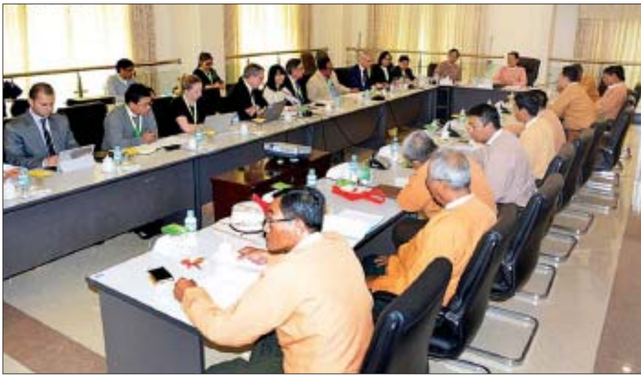
ပြည်သူ့လွှတ်တော်လှုပ်စစ်နှင့်စွမ်းအင်ဖွံ့ဖြိုးတိုးတက်ရေးကော်မတီဥက္ကဋ္ဌ ဦးကြည်မိုးနိုင် မြန်မာနိုင်ငံရေနံလုပ်ငန်းရှင်များအသင်းအား လက်ခံတွေ့ဆုံစဉ်။