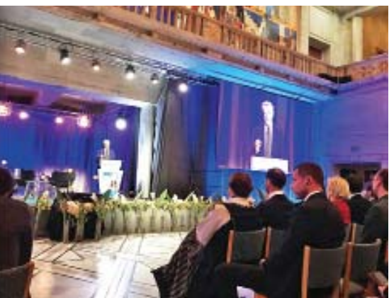
အတူ ဘယ်လ်ဂျီယံနိုင်ငံ၏ Princess Astrid of Belgium၊ ဂျော်ဒန်နိုင်ငံမှ Prince Mired Bin Raad Bin Zeid Al-Husseini UNHCR မဟာမင်းကြီး၊ ICRC၊ UNICEF အစရှိသည့် အဖွဲ့အစည်းများမှ ခေါင်းဆောင်များနှင့် နိုင်ငံ ပေါင်း ၁၆၀ ကျော်မှ ကိုယ်စားလှယ်များ တက်ရောက်ခဲ့ကြသည်။

ထားရေးနှင့် IDP စခန်းများ ပိတ်သိမ်းရေး အတွက် အမျိုးသားအဆင့် မဟာဗျူဟာကို မကြာသေးမီက မိတ်ဆက်ခဲ့ပြီးနောက် အချို့ သောနေရာများတွင် ပြန်လည်နေရာချထားရေး လုပ်ငန်းများစတင်ရန် ကြိုးပမ်းနေကြောင်း၊ ထိုသို့ဆောင်ရွက်ရာတွင် မိုင်းအန္တရာယ် အသိ ပညာပေးခြင်း၊ လူသားချင်းစာနာထောက်ထား မှုကိုအခြေခံသည့် မိုင်းရှင်းလင်းရေးဆောင်ရွက် ခြင်းတို့မှာ အရေးပါကြောင်းနှင့် မိုင်းအန္တရာယ် နှင့်ပတ်သက်၍ မြန်မာနိုင်ငံက ကြိုးပမ်းဆောင် ရွက်နေမှုများ၊ ရခိုင်ပြည်နယ်နှင့် ပတ်သက်၍ နောက်ဆုံးအခြေအနေများ၊ အာဆီယံနိုင်ငံများ၊ ကုလသမဂ္ဂအဖွဲ့အစည်းများ၊ နိုင်ငံတကာအဖွဲ့ အစည်းများနှင့် ပူးပေါင်းဆောင်ရွက်နေမှုများ၊ UEHRD ၏ ဆောင်ရွက်ချက်များနှင့် ရခိုင် ပြည်နယ်ဆိုင်ရာ အကြံပြုချက်များအပေါ် အကောင်အထည်ဖော် ဆောင်ရွက်နေမှုများနှင့် International Court of Justice (ICJ)နှင့် ပတ်သက်၍ တုံ့ပြန်ဆောင်ရွက်ရန် မြန်မာနိုင်ငံ က စီစဉ်ဆောင်ရွက်နေမှုများကို ရှင်းလင်းပြော ကြားခဲ့ရာ နော်ဝေနိုင်ငံခြားရေးဝန်ကြီးက မြန်မာနိုင်ငံ၏ ဒီမိုကရေစီပြုပြင်ပြောင်းလဲရေး နှင့် ငြိမ်းချမ်းရေးလုပ်ငန်းစဉ်များ၊ ဖွံ့ဖြိုး တိုးတက်ရေးလုပ်ငန်းစဉ်များနှင့် မိုင်းအန္တရာယ် ဆိုင်ရာ ကြိုးပမ်းမှုများတွင် ဆက်လက်ပူးပေါင်း ဆောင်ရွက်သွားမည်ဖြစ်ကြောင်း ပြောကြား သည်။