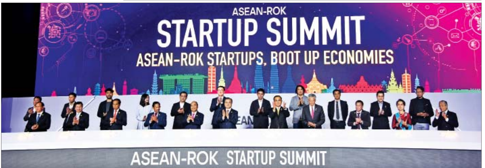
နိုင်ငံတော်၏အတိုင်ပင်ခံပုဂ္ဂိုလ် ဒေါ်အောင်ဆန်းစုကြည် ကိုရီးယားသမ္မတ၊ အာဆီယံနိုင်ငံများမှ နိုင်ငံအကြီးအကဲများ၊ အစိုးရအဖွဲ့အကြီးအကဲများနှင့်အတူ ASEAN-ROK Startup Summit and Innovation Showcase 2019 ကို ဖွင့်လှစ်ပေးစဉ်။