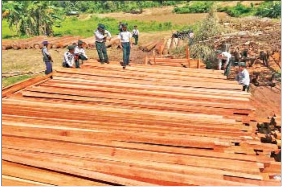
၈၆ စီး၊ ဘက်ဟိုးတစ်စီး၊ ဆိုင်ကယ် ၃၉ စီး၊ ဆင်လေးကောင်၊ ၂၀၃ စက်၊ ချိန်းဆော ၁၀၂ လက်တို့ကို သိမ်းဆည်းရမိခဲ့ တူမီးသေနတ် ၁၀ လက်၊ နောက်တွဲယာဉ် လေးစီး၊ သစ်စက် ကြောင်း သိရသည်။ လူအောင်(ကသာ)

၂၀၁၇-၂၀၁၈ ဘဏ္ဍာနှစ် ဧပြီလမှ မတ်လကုန်အထိ ပြစ်မှုကျူးလွန်သူ ၉၉၄ ဦး၊ ကား ၅၂၂ စီး၊ လယ်ထွန်စက် အစီး ၂၀၊ ထော်လာဂျီ ၂၄ စီး၊ ကန့်လန့်ဂျီ ၃၈ စီး၊ ဆိုင်ကယ် ၁၄၃ စီး၊ သုံးဘီးဆိုင်ကယ် အစီး ၃၀၊ စက်လှေမော်တော်