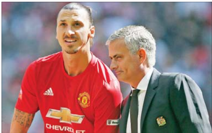
နိုင်ခဲ့မယ်ဆိုရင် အပိုဆုကြေးအဖြစ် ပေါင် နဲ့ တစ်နှစ် ပေါင် ၁၅ သန်းနဲ့ စာချုပ် ချုပ်ဆို နှစ်သန်း ထပ်ဆောင်းရရှိမှာလည်းဖြစ်ပါတယ်။ လက်ရှိမှာ နည်းပြမော်ရင်ဟိုဟာ စပါးအသင်း သက်တမ်းကုန်ဆုံးမှာ ဖြစ်ပါတယ်။

အီဘရာဟီမိုဗစ်ဟာ ရောက်တဲ့အသင်း တိုင်းမှာ ခြေစွမ်းပြပြီး ဂိုးတွေ သွင်းယူနိုင်ခဲ့ တာကြောင့် အေစီမီလန်အသင်းကလည်း ခြောက်လစာချုပ်နဲ့ ခေါ်ယူဖို့ စီစဉ်နေတာ ဖြစ်ပါတယ်။ လက်ရှိမှာ နည်းပြမော်ရင်ဟိုက လည်း စပါးအသင်းအတွက် အီဘရာဟီမိုဗစ် ကို ခေါ်ယူဖို့ ပစ်မှတ်ထားနေပြီး နည်းပြ မော်ရင်ဟိုအနေနဲ့ အခုနှစ်ဘောလုံးရာသီကုန် မှာ ပရီမီယာလိဂ်အမှတ်ပေးဇယားရဲ့ အဆင့် လေးဝင်အောင် စပါးအသင်းကို စွမ်းဆောင်ပေး