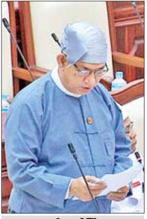
ဒုတိယဝန်ကြီး ဒေါက်တာရဲမြင့်ဆွေ