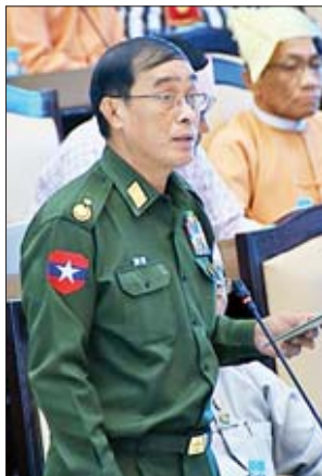
ဒုတိယဝန်ကြီး ဗိုလ်ချုပ်သန်းထွဋ်

အလားတူ ကရင်ပြည်နယ် မဲဆန္ဒနယ်အမှတ်(၇)မှ နေဦးခရစ္စထွန်း(ခ) ဒေါက်တာအားကာမိုး၏ ပြည်ထောင်စု တိုင်းရင်းသားလူမျိုးများဖွံ့ဖြိုးရေးတက္ကသိုလ်နှင့်ပြည်ထောင်စု တိုင်းရင်းသားလူငယ်များ စွမ်းရည်ဖွံ့ဖြိုးရေး ဒီဂရီကောလိပ် သင်တန်းများအတွက် သင်တန်းသားများခေါ်ယူရာတွင် ပွင့်လင်းမြင်သာမှုမရှိခြင်းနှင့် မမျှတဖြစ်ပေါ်နေမှုများကို စိစစ်ကြပ်မတ်ဆောင်ရွက်ပေးရန်နှင့် ဖွံ့ဖြိုးမှုနည်းပေးသော တိုင်းရင်းသားဒေသများမှ ဦးစားပေးခေါ်ယူပေးရန် အစီ အစဉ် ရှိ၊ မရှိ မေးခွန်းနှင့်စပ်လျဉ်း၍ နယ်စပ်ရေးရာဝန်ကြီး ဌာန ဒုတိယဝန်ကြီး ဗိုလ်ချုပ်သန်းထွဋ်က လည်းကောင်း၊ တနင်္သာရီတိုင်းဒေသကြီး မဲဆန္ဒနယ်အမှတ်(၁၂)မှ