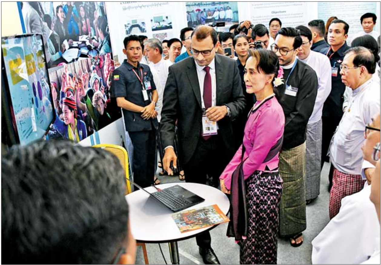
နိုင်ငံတော်၏အတိုင်ပင်ခံပုဂ္ဂိုလ် ဒေါ်အောင်ဆန်းစုကြည် မြန်မာနိုင်ငံ ကုန်သည်များနှင့် စက်မှုလက်မှုလုပ်ငန်းရှင်များအသင်းချုပ် နှစ်တစ်ရာပြည့် အထိမ်းအမှတ်အခမ်းအနားတွင် ပြသထားသည့် ပြခန်းများကို လှည့်လည်ကြည့်ရှုစဉ်။

၂၀၁၉ ခုနှစ်၊ အောက်တိုဘာ ၂၄ ရက်မှာထုတ်ပြန်ခဲ့တဲ့ ကမ္ဘာ့ဘဏ်ရဲ့ စီးပွားရေးလုပ်ငန်းများလုပ်ကိုင်ဖို့ လွယ်ကူမှု ၂၀၂၀ အစီရင်ခံစာမှာ မြန်မာနိုင်ငံရဲ့ ရမှတ်က(၄၆ ဒသမ ၈)ရရှိခဲ့ပါတယ်။ ယခင်နှစ်ရမှတ် (၄၃ ဒသမ ၅)ထက် ပျမ်းမျှ ရမှတ် (၃ ဒသမ ၃)တိုးတက်ရရှိခဲ့ပြီး ယခင်နှစ်ရရှိတဲ့ အဆင့်(၁၇၀)မှ အဆင့်