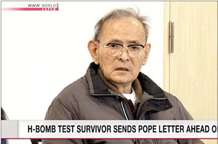
H-BOMB TEST SURVIVOR SENDS POPE LETTER AHEAD O

ကိုးကား- အင်န်အိတ်ချ်ကေ ဘာသာပြန်- ဇော်ဝင်း