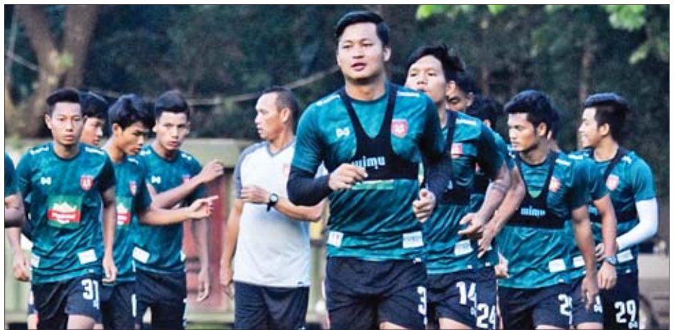
မြန်မာ ယူ-၂၂ အသင်း လေ့ကျင့်နေစဉ်။