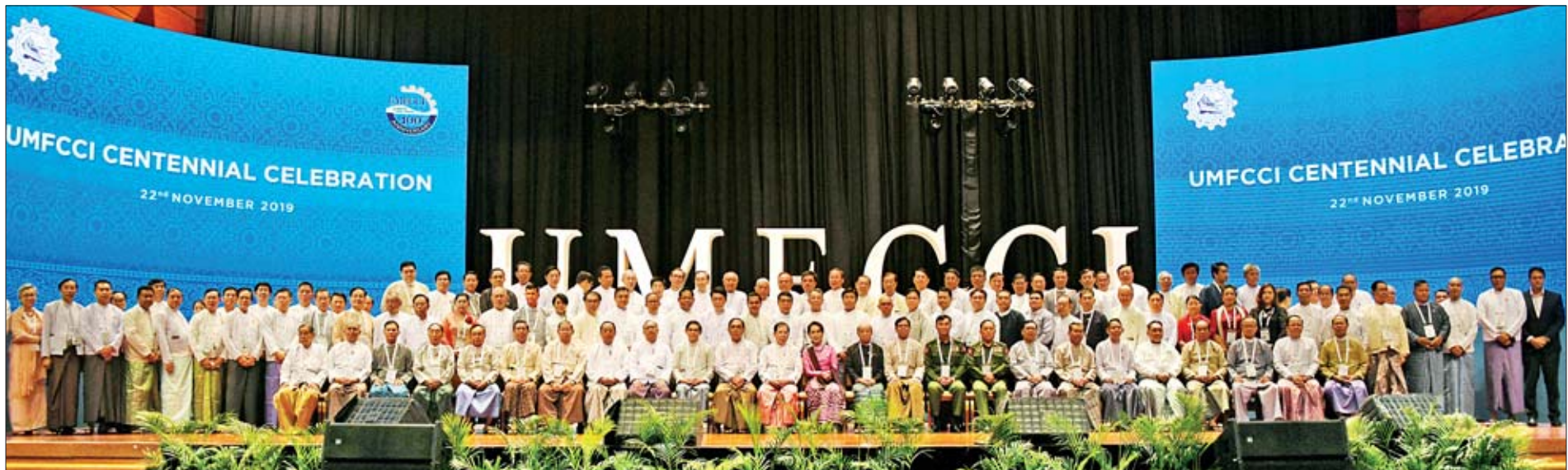
နိုင်ငံတော်၏အတိုင်ပင်ခံပုဂ္ဂိုလ် ဒေါ်အောင်ဆန်းစုကြည်၊ ပြည်သူ့လွှတ်တော်ဒုတိယဥက္ကဋ္ဌ၊ အမျိုးသားလွှတ်တော် ဒုတိယဥက္ကဋ္ဌ၊ ပြည်ထောင်စုဝန်ကြီးများ၊ ပြည်ထောင်စုရှေ့နေချုပ်၊ နေပြည်တော်ကောင်စီဥက္ကဋ္ဌ၊ အကတိလိုက်စားမှု တိုက်ဖျက်ရေးကော်မရှင်ဥက္ကဋ္ဌ၊ မြန်မာနိုင်ငံကုန်သည်များနှင့် စက်မှုလက်မှုလုပ်ငန်းရှင်များအသင်းချုပ်နာယကနှင့် ဥက္ကဋ္ဌတို့ မြန်မာနိုင်ငံကုန်သည်များနှင့် စက်မှုလက်မှုလုပ်ငန်းရှင်များအသင်းချုပ် ဒုတိယဥက္ကဋ္ဌများ၊ ဗဟိုအလုပ်အမှုဆောင်များ၊ အလုပ်အမှုဆောင်များ၊ အကြံပေးပုဂ္ဂိုလ်များနှင့် စုပေါင်းမှတ်တမ်းတင်ဓာတ်ပုံရိုက်စဉ်။

အသေးစား၊ အငယ်စားနဲ့ အလတ်စားစီးပွားရေးလုပ်ငန်းများဟာ အလုပ် အကိုင်ဖန်တီးပေးနိုင်ပြီး အမျိုးသားတို့ထွင်ဆန်းသစ်မှု၊ ကြီးပွားချမ်းသာမှု