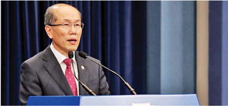
တောင်ကိုရီးယားသမ္မတ အိမ်ပြာတော်မှ အမျိုးသား လုံခြုံရေးအရာရှိ ကင်မ်ယူဂျန်

ဆိုင်းလ် နိုဝင်ဘာ ၂၂ သတင်း သဘောတူစာချုပ် သက်တမ်းကုန်ဆုံးမှုကို ဆိုင်းငံ့ တောင်ကိုရီးယားနိုင်ငံသည် ဂျပန်နှင့်စစ်ထောက်လှမ်းရေး ထားမည်ဖြစ်ကြောင်း ယင်းသဘောတူညီချက် သက်တမ်း