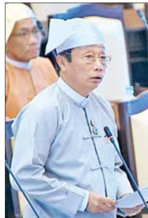
ဒုတိယဝန်ကြီး ဦးလှကျော်