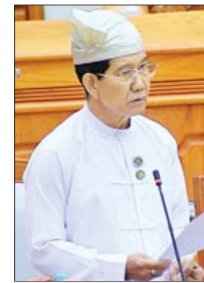
ပျော်ဘွယ်မဲဆန္ဒနယ်မှ ဦးသောင်းအေး

လွှတ်တော်က အတည်ပြုပေးနိုင်ပါရန် တင်ပြအပ်ပါကြောင်း ပြောကြားသည်။ ထို့နောက် ပြည်ထောင်စုလွှတ်တော်နာယကက ယင်း ကိစ္စနှင့်စပ်လျဉ်း၍ အတည်ပြုရန် လွှတ်တော်၏အဆုံး အဖြတ်ရယူ၍ လွှတ်တော်က သဘောတူအတည်ပြုကြောင်း ကြေညာသည်။