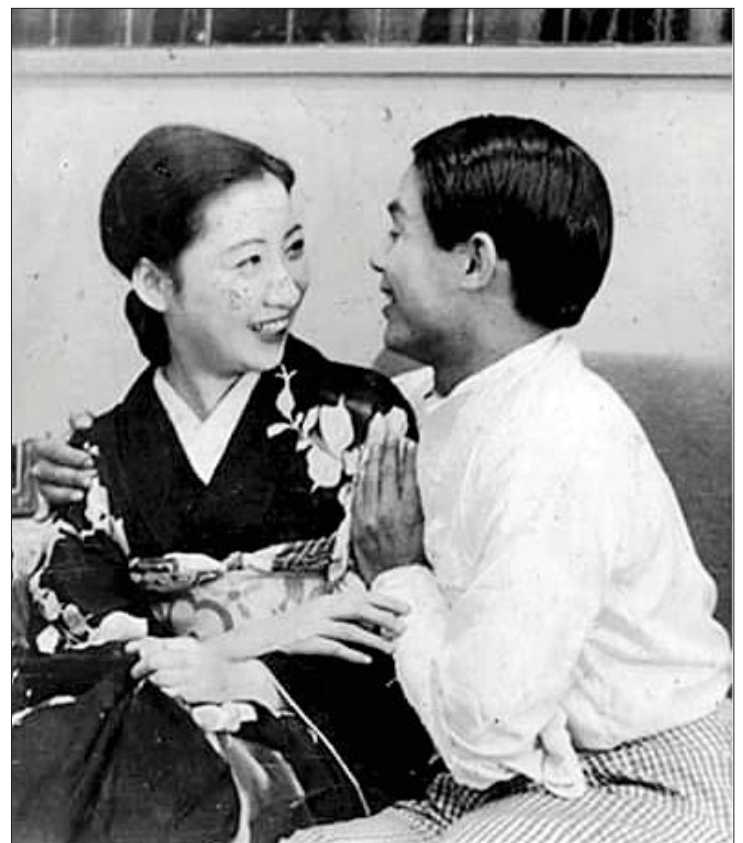
ဂျပန်ရင်သွေးရုပ်ရှင်ဇာတ်ကားမှ မင်းသား ဦးညီပုနှင့် ဂျပန်မင်းသမီး မိဆုကိုတကရီ (ခေမိစံ(ခ) အေးမိစံ)တို့၏ ဇာတ်ဝင်ခန်း။

ဂျပန်ရင်သွေးဇာတ်လမ်းကတော့ ရိုးရိုး လေးနဲ့ဆန်းပါတယ်။ လူစွန့်စားမြန်မာ ညီအစ်ကိုတွေဟာ လေယာဉ်ကို ကိုယ်တိုင် မောင်းနှင်ပြီး တောအထပ်ထပ် တောင် အသွယ်သွယ်နဲ့ သမုဒ္ဒရာကိုဖြတ်လို့ ဂျပန်ပြည်