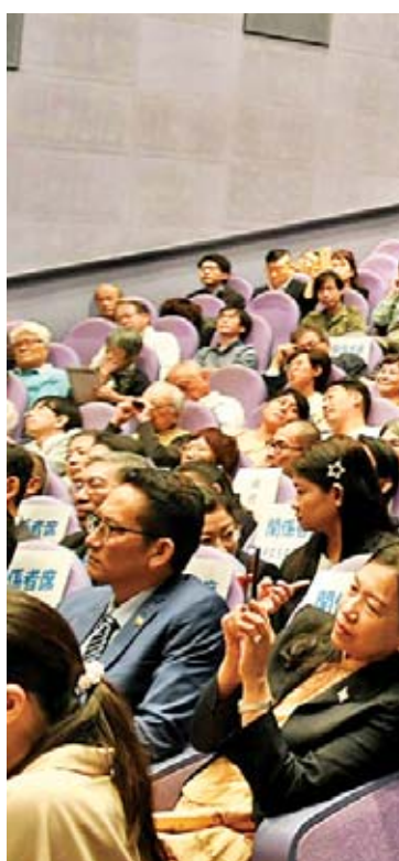
တိုကျိုမြို့၊ အမျိုးသားရုပ်ရှင်မော်ကွန်းတိုက်၌ ဂျပန်ရင်သွေး မြန်မာရုပ်ရှင်ဇာတ်ကားပြသမှုအစီအစဉ်တွင် လာရောက်ကြည့်ရှုအားပေးသူများကို တွေ့ရစဉ်။

မြေပေါ်မှာ “ဂျပန်ရင်သွေး” ရုပ်ရှင်ဇာတ်ကား ကြီးကို နည်းပညာစနစ် 2K Resolution နဲ့