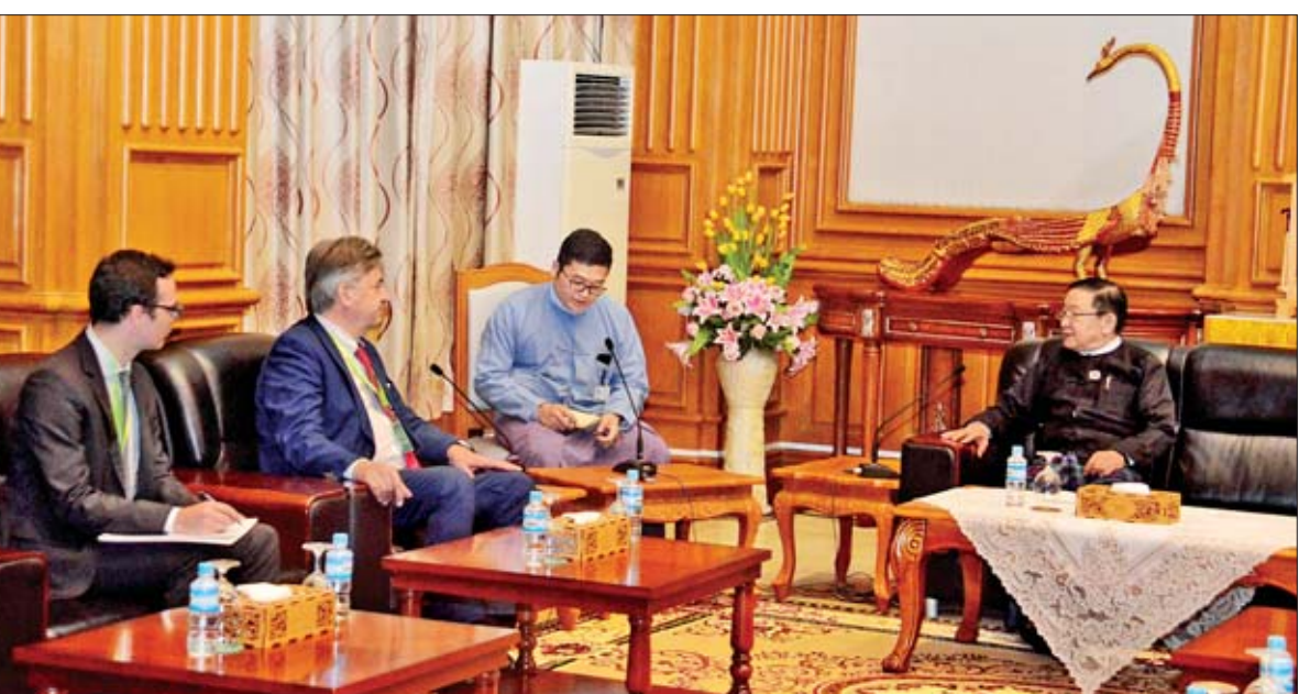
သတင်းစဉ်

တွေ့ဆုံစဉ် နှစ်နိုင်ငံအစိုးရအချင်းချင်း၊ လွှတ်တော်အချင်းချင်း ချစ်ကြည်ရင်းနှီးမှုပိုမိုတိုးတက်ခိုင်မြဲရေး၊ မြန်မာနိုင်ငံ၏ ဒီမိုကရေစီပြုပြင်ပြောင်းလဲရေး လုပ်ငန်းစဉ်များတွင် လွှတ်တော်များ ဖွံ့ဖြိုးတိုးတက်ရေးနှင့် လွှတ်တော်ကိုယ်စားလှယ်များ၊ လွှတ်တော်ရုံးဝန်ထမ်းများ၏ စွမ်းရည်မြှင့်တင်ရေးဆိုင်ရာကိစ္စရပ်များ၌ ပူးပေါင်းပါဝင်ဆောင်ရွက်လျက်ရှိသည့် အခြေအနေများနှင့်စပ်လျဉ်း၍ ရင်းနှီးပွင့်လင်းစွာ အမြင်ချင်းဖလှယ် ဆွေးနွေးခဲ့ကြသည်။