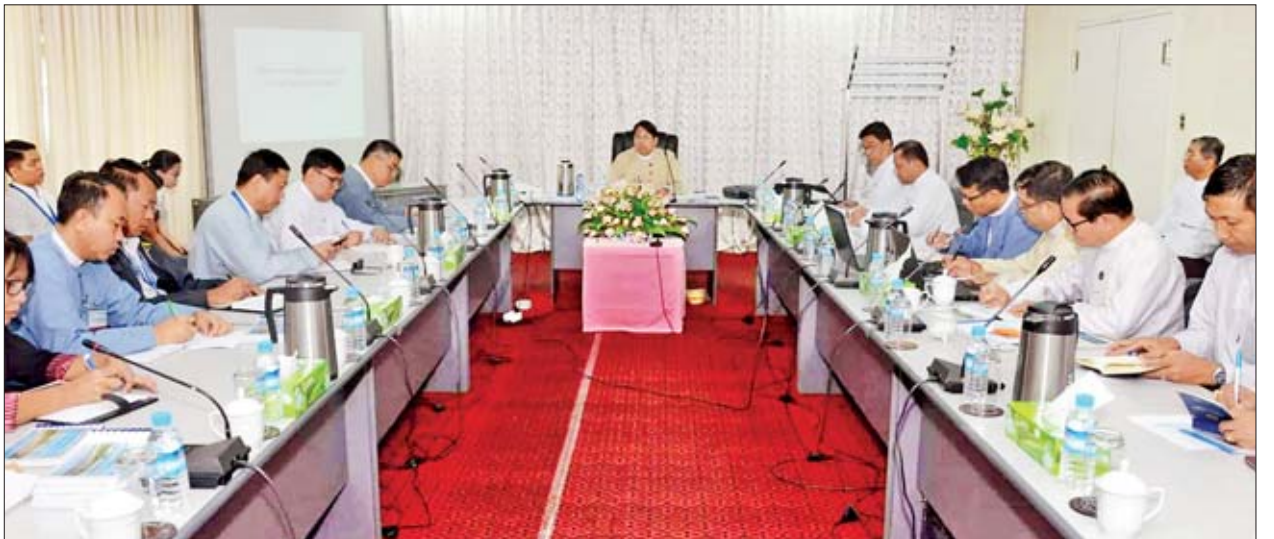
တော်နေ့ အထိမ်းအမှတ်အဖြစ် နိုဝင်ဘာ ၂၇ ရက် နံနက် ၉ နာရီတွင် ရန်ကုန်မြို့၊ ဆူးလေဘုရားလမ်းရှိ Sule Shangri-la ဟိုတယ်၌ ကျင်းပမည်ဖြစ်ပြီး အမျိုးသားစာပေတစ်သက်တာဆု နှစ်ဆု၊ အမျိုးသားစာပေဆု ၁၀ဆု၊ စာပေပိမာန် စာမူဆု ၂၄ ဆုတို့ကို ချီးမြှင့်သွားမည် ဖြစ်ကြောင်း သိရသည်။ သတင်းစဉ်

၂၀၁၈ ခုနှစ်အတွက် အမျိုးသားစာပေတစ်သက်တာဆု၊ အမျိုးသားစာပေဆုနှင့် စာပေပိမာန်စာမူဆုများအတွက် ဆုချီးမြှင့်ခြင်း အခမ်းအနားကို မြန်မာ့သက္ကရာဇ် ၁၃၈၁ ခုနှစ် နတ်တော်လဆန်း ၁ ရက်နေ့တွင် ကျရောက်မည့် စာဆို