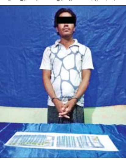
ငွေဆောင်မြို့၌ ကျပ် တစ်သောင်းတန်ငွေစက္ကူအတုများ ဖမ်းမိ