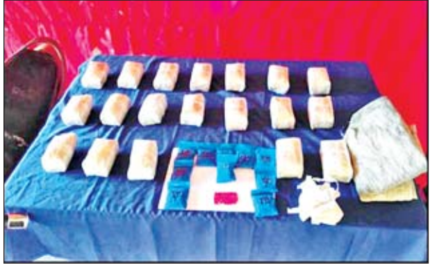
သိမ်းဆည်းရမိသည့် စိတ်ကြွေးသွပ်ဆေးပြားများအား တွေ့ရစဉ်။

ထို့အတူ ယင်းနေ့ ညနေပိုင်းတွင် မူးယစ်တပ်ဖွဲ့(၃၀) တာချီလိတ်မှ တပ်ဖွဲ့ဝင်များပါဝင်သော ပူးပေါင်းအဖွဲ့သည် တာချီလိတ်မြို့နယ် မိုင်းဟဲ ကျေးရွာအုပ်စု ကျစ်ကျေးရွာအနီးရှိ လင်းဘို(ခ)ကျဟဲ၏ တောင်ယာတဲအား ရှာဖွေရာ စိတ်ကြွေးသွပ်ဆေးပြားနှင့် သုံးကီလိုကို လည်းကောင်း သိမ်းဆည်းရမိခဲ့ သဖြင့် ၎င်းတို့အား မူးယစ်ဆေးဝါးနှင့် စိတ်ကိုပြောင်းလဲစေသော ဆေးဝါးများ ဆိုင်ရာဥပဒေအရ အရေးယူထားကြောင်း သိရသည်။