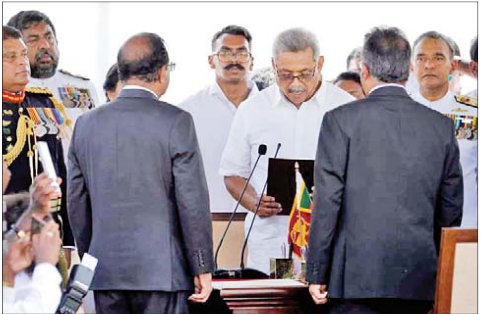
သီရိလင်္ကာသမ္မတသစ် ဂိုတာဘာယာ ရာဂျာပုဒ်ဆာ ကျမ်းသစ္စာကျိန်ဆိုစဉ်။

ဘာသာပြန်-အောင်ဇော်လင်း