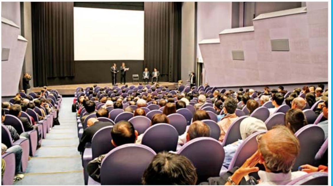
ဂျပန်နိုင်ငံ တိုကျိုမြို့၊ အမျိုးသားရုပ်ရှင်မော်ကွန်းတိုက်၌ ဂျပန်ရင်သွေး မြန်မာရုပ်ရှင်ဇာတ်ကားပြသမှုအစီအစဉ်တွင် ဂျပန်အမျိုးသား ရုပ်ရှင်မော်ကွန်းတိုက်မှ တာဝန်ရှိသူတစ်ဦး နှုတ်ခွန်းဆက်စကားပြောကြားစဉ်။

၂၀၂၀ ပြည့်နှစ် မြန်မာ့ရုပ်ရှင် ရာပြည့် အထိမ်းအမှတ်အချိန်အခါသမယမှာ မြန်မာ့