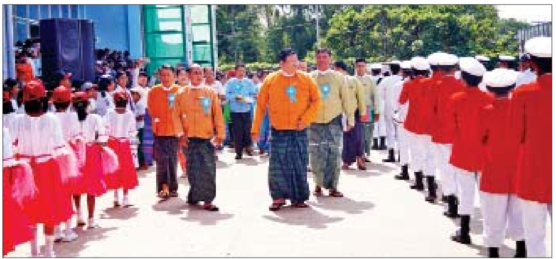
ဘဏ္ဍာနှစ်တွင် မိမိတို့ ဧရာဝတီတိုင်းဒေသကြီးအစိုးရအဖွဲ့၏ စီစဉ်မှုဖြင့် ၂၆ မြို့နယ်တွင် ကလေးစာပေပွဲတော်များ ဆောင်ရွက်လျက်

အခမ်းအနားကို ဖဲကြီးဖြတ်၍ ဖွင့်လှစ်ပေးကြသည်။ ဆက်လက်၍ ဒုတိယပိုင်းအစီအစဉ်ကို အစိုးရစက်မှုလက်မှုသိပ္ပံကျောင်း စုဝေးခန်းမ၌ ကျင်းပရာ အထက(၁)ကျိုက်လတ်ကျောင်းသားကျောင်းသားလေးများက ကလေးစာပေပွဲတော် သီချင်း (Theme Song) သီဆို၍ အခမ်းအနား ဖွင့်လှစ်ခဲ့ပြီး ဝန်ကြီးချုပ် ဦးလှမိုးအောင်က ယနေ့ ကျိုက်လတ်မြို့နယ် ကလေးစာပေပွဲတော်ကို ကလေးများ စာအုပ်စာပေ၌ နှစ်သက်မေ့လျော့ကာ ရာသက်ပန် ပညာရှာဖွေသူများဖြစ်လာစေရန်၊ ပွဲတော်ကို ပျော်ရွှင်စွာဆင်နွှဲရန်၊ စုပေါင်းအလုပ်များတွင် ဝိုင်းဝန်းပါဝင်တတ်သည့် အလေ့အထကောင်းများဖြစ်လာစေရန်၊ ပညာဗဟုသုတရောလူရည်လူသွေးပါ ပြည့်ဝ၍ အနာဂတ်တွင် တိုင်းပြည်အတွက် ဦးဆောင်ဦးရွက်ပြုသူများ ဖြစ်လာစေရန် စသည့် ရည်ရွယ်ချက်များဖြင့် ကျင်းပရခြင်းဖြစ်ကြောင်း၊ ၂၀၁၉-၂၀၂၀