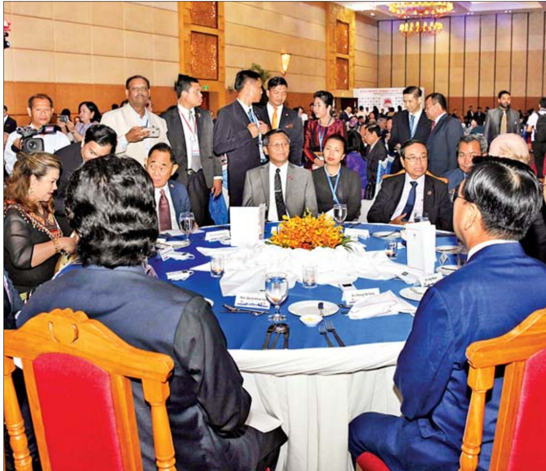
ဒုတိယသမ္မတ ဦးဟင်နရီဗန်ထီးယူ ကမ္ဘောဒီးယားနိုင်ငံ ဒုတိယဝန်ကြီးချုပ်က တည်ခင်းစဉ်ခံသည့် ညစာစားပွဲသို့ တက်ရောက်စဉ်။