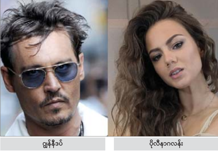
ဂျွန်နီဒပ် ပိုလီနာဂလန်း

ဂလန်းနဲ့ လမ်းခွဲခဲ့ကာ ပိုလီနာဟာ သူ့ရဲ့ဇာတိ ဖြစ်တဲ့ ရုရှားကို ပြန်သွားခဲ့ပြီဖြစ်ကြောင်း အေးရှားဝမ်းဒေါ့ကွန်းရဲ့ရေးသားဖော်ပြချက် တွေအရ သိရပါတယ်။