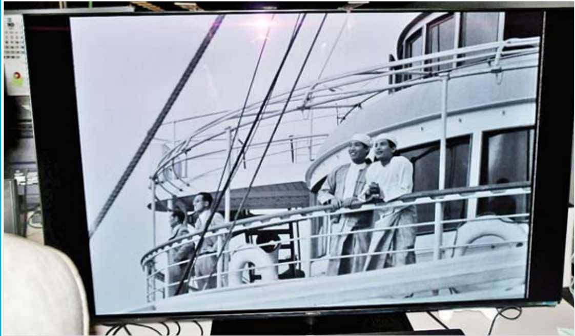
ဂျပန်ရင်သွေးရုပ်ရှင်ဇာတ်ကား၏ ပင်လယ်ကူးသင်္ဘောကြီးပေါ်တွင် ဂျပန်နိုင်ငံကို လာရောက်ကြည့်ရှု လူငယ်လေးနှစ်ဦး၏ ဇာတ်ဝင်ခန်း။

ကမ္ဘာ့ဈေးကွက်အထိ ထိုးဖောက် မိမိတို့နိုင်ငံမှာလည်း များပြားလှတဲ့ ယဉ်ကျေးမှု၊ ခိုင်မာတဲ့သမိုင်းကြောင်းတွေနဲ့ မိမိတို့ဦးတည်နေတဲ့ ဒီမိုကရေစီဖက်ဒရယ် ပြည်ထောင်စုလမ်းကြောင်းပေါ်ကို ပြည်သူ တွေ သိရှိနားလည်ပြီး ပူးပေါင်းပါဝင်ဖို့နဲ့ တစ်ကမ္ဘာလုံးက အသိအမှတ်ပြု နားလည်ပြီး လက်ခံအားပေးလာနိုင်ဖို့ ရည်မှန်းပြီး Soft Power ဖြစ်တဲ့ မြန်မာ့ရုပ်ရှင်ဇာတ်ကားတွေကို အဆင့်အတန်းမြှင့်မြှင့်၊ အရေအတွက်များများ နဲ့ ကမ္ဘာ့ဈေးကွက်အထိ ထိုးဖောက် ထုတ်လုပ်လာနိုင်မယ်ဆိုရင် ရုပ်ရှင်ဈေးကွက် သာမကဘဲ နိုင်ငံအတွက်ပါ အကျိုးကျေးဇူး များစွာရရှိမယ်လို့ တွေးနေမိရင်း မြန်မာ့ ရုပ်ရှင်ရာပြည့်ကို လှိုက်လှဲစွာကြိုဆိုလိုက်ပါ တယ်။