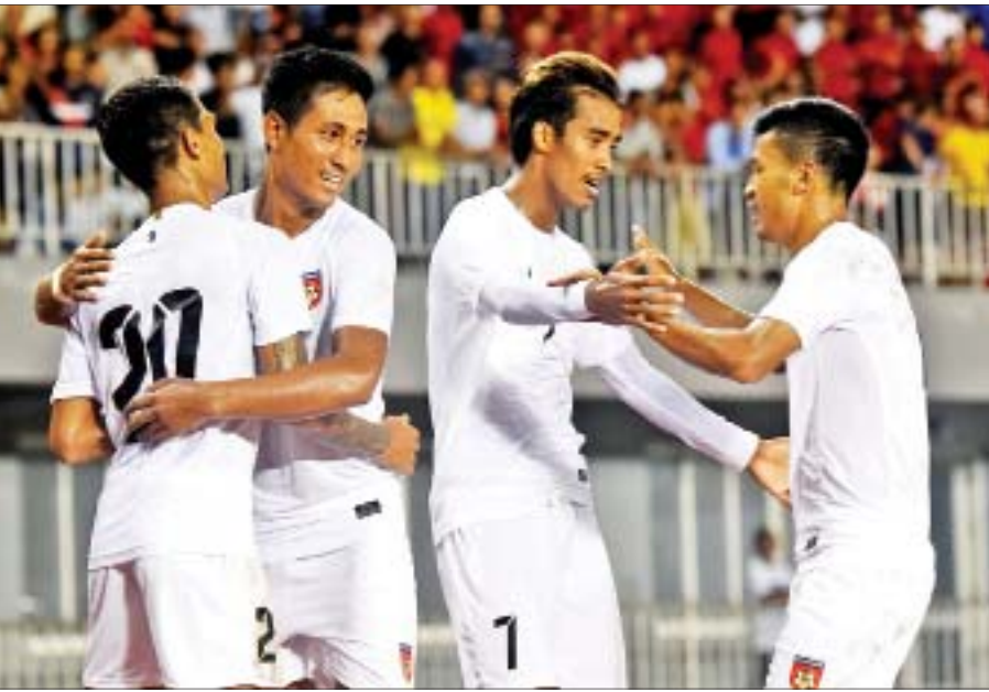
တာဂျစ်ကစွတန်အသင်းနှင့်ပွဲတွင် ရိုးသွင်းအပြီး အောင်ပွဲခံနေသည့် မြန်မာကစားသမားများ။