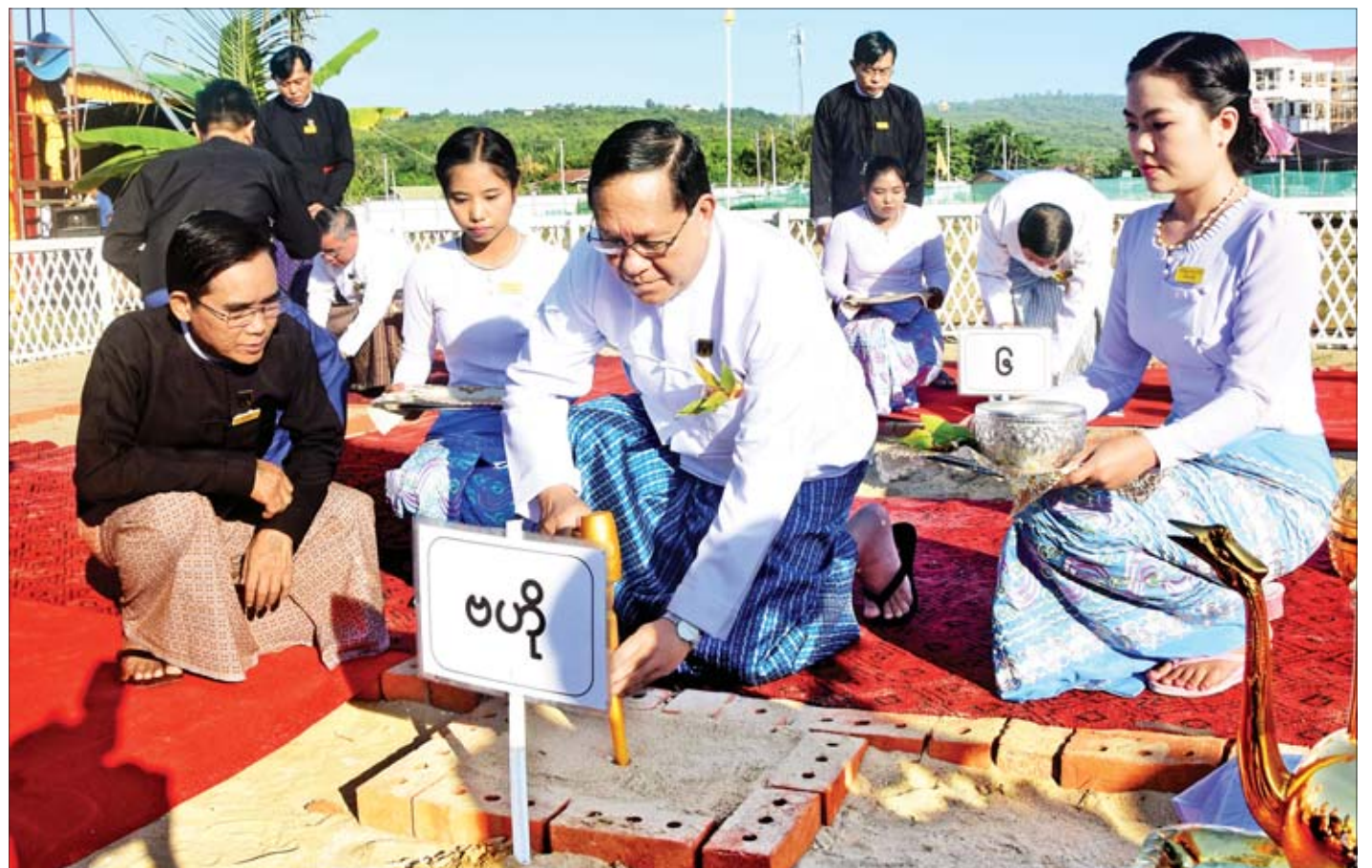
ပြည်ထောင်စုတရားသူကြီးချုပ် ဦးထွန်းထွန်းဦး ပြည်ထောင်စုတရားလွှတ်တော်ချုပ် Judicial College အဆောက်အဦ တည်ဆောက်မည့်နေရာ၌ ပန္နက်တော်တင်ပေးစဉ်။

နေပြည်တော် နိုဝင်ဘာ ၁၇ ပြည်ထောင်စုတရားလွှတ်တော်ချုပ် Judicial College အဆောက်အဦပန္နက်တော်တင် တွင်းတော်ဝန်းမင်္ဂလာအခမ်းအနားကို ယနေ့နံနက် ၈ နာရီတွင် နေပြည်တော်ကောင်စီ နယ်မြေ ဥက္ကဋ္ဌရသီရိခရိုင် ဇေယျသီရိရပ်ကွက် နေကြာလမ်း အဆိုပါအဆောက်အဦ တည်ဆောက်မည့်နေရာရှိ မင်္ဂလာမဏ္ဍပ်၌ ကျင်းပမည်။