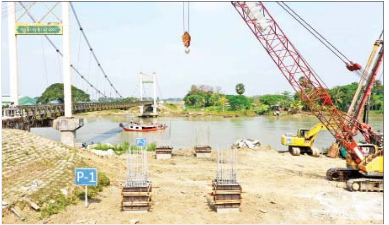
ကင်းလွတ်အကျယ် ပေ ၁၆၀ ရှိပြီး သံကူကွန်ကရစ် သံမဏိသံပေါင်တံတား အမျိုးအစားဖြစ်သည်။ အဆိုပါ ကျွန်းကုန်းတံတားသစ်ကို တံတားဦးစီးဌာန တည်ဆောက်ရေး

ဧရာဝတီတိုင်းဒေသကြီး ဖွံ့ဖြိုးရေးတွင် အရေးပါသော တည်ဆောက်ဆဲ ကျွန်းကုန်းတံတားသစ်မှာ တံတားအရှည် ၇၈၇ ပေ ၅ လက်မ၊ အကျယ် ၂၄ ပေ၊ လူသွားလမ်း တစ်ဖက်သုံးပေစီ၊ ရေလမ်းကင်းလွတ်အမြင့် ၁၈ ပေ၊ ရေလမ်း