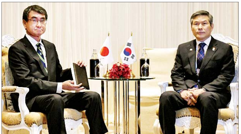
တာရိုကိုနိုနှင့် ဂျောင်ကျောင်ဒို

အပါအဝင် လက်ရှိဒေသတွင်း လုံခြုံရေးအခြေအနေကို ထည့်သွင်းစဉ်းစားရာတွင် အားနည်းသော ဆုံးဖြတ်ချက် ဖြစ်လာမည်ဆိုသော ဂျပန်အစိုးရ၏ ရပ်တည်ချက်ကို ကိုနိုက သိရှိစေမည်ဟု ယူဆရသည်။ တောင်ကိုရီးယားနိုင်ငံကိုလည်း စဉ်းစား၍ တုံ့ပြန်မှုပေးရန် ကိုနိုက တိုက်တွန်းမည်ဟု ဖော်ပြခဲ့သည်။ အဆိုပါသဘောတူညီချက်ကို ထိန်းထားပါက ဂျပန်နိုင်ငံအနေဖြင့် တင်းကျပ်ထားသော ပို့ကုန်ထိန်းချုပ်မှုများ ဖြေလျှော့ခြင်းအားဖြင့် အပေးအယူ တစ်ရပ်လုပ်ဆောင်ရန် လိုအပ်မည်ဟု ဂျောင်ကျောင်ဒိုက ရိုးတိုးရိပ်တိပ်ပြောခဲ့သည်။ သဘောတူစာချုပ် သက်တမ်းကုန်ဆုံးမှုမှာ ယခုအခါ မြေကြီးလက်ခတ်မလွှဲ ဖြစ်လာမည်ဟု ဂျပန်တာဝန်ရှိသူများက ယူဆကြသည်။ ကိုနိုနှင့် ဂျောင်ကျောင်ဒိုသည် ယနေ့ နေ့ခင်းပိုင်းတွင် အမေရိကန်ကာကွယ်ရေးဝန်ကြီး မတ်ခ် အက်စပါနှင့် သုံးဦးအဖွဲ့ဆွေးနွေးမှုများ ပြုလုပ်ခဲ့သည်။ ကိုးကား- အင်န်အိတ်ချီကော ဘာသာပြန် - ကျော်ထိုက်စိုး