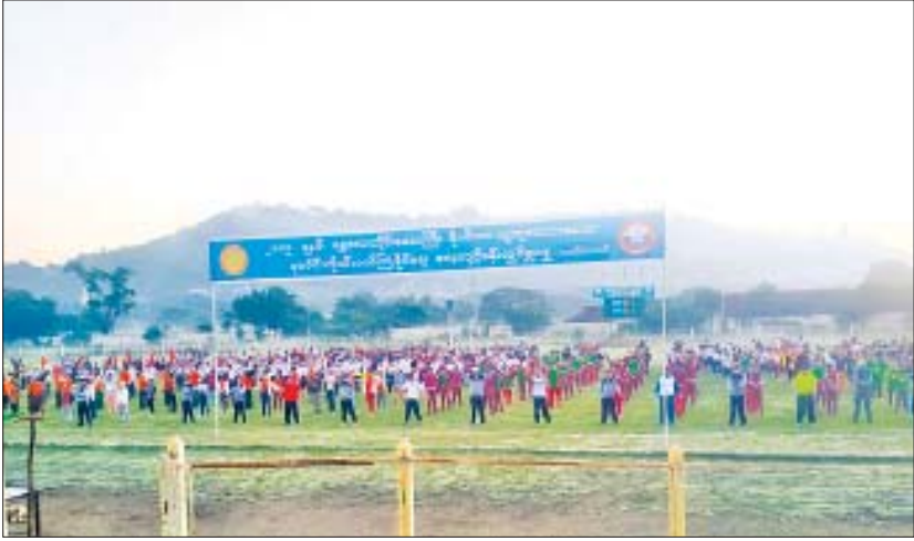
ကျောင်းသိရသည်။ ကျောင်းသူကျောင်းသားများ၊ ပြည်သူများ စုစုပေါင်း တိုင်းဒေသကြီးဝန်ကြီးများ၊ တိုင်းဒေသကြီး၊ ခရိုင်၊ ၃၀၀၀ ကျော် ပါဝင်ဆင်နွှဲခဲ့ကြသည်။ မြို့နယ်အဆင့်ဌာနဆိုင်ရာများ၊ ဆရာ ဆရာမများ၊ တင်မောင် (မန်းကိုယ်ပွား)

လမ်းလျှောက်ပွဲ ဆင်နွှဲကြသူများသည် စုရပ်မှ ၆၆ လမ်းအတိုင်း ကျေးမြောက်ဘက် ၁၂ လမ်း၊ ထိုမှ ရွှေမန်းတောင်အားကစားကွင်းအတွင်းသို့ ပျော်ရွှင် စွာ ဆင်နွှဲရောက်ရှိကြပြီး အားကစားကွင်းအတွင်း စုပေါင်းကိုယ်လက်ကြံ့ခိုင်ရေးလေ့ကျင့်ခန်းအတွဲ ၁၊ အတွဲ ၂ နှင့် Myanmar Fitness Dance လေ့ကျင့်ခန်း လှုပ်ရှားမှုများ ဆက်လက်လှုပ်ရှားဆောင်ရွက်ခဲ့ကြ