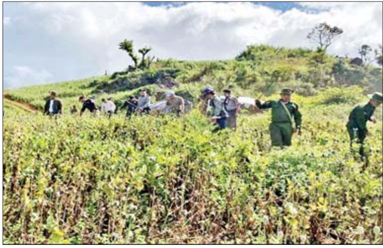
မိုင်းတုံမြို့နယ်၌ ဘိန်းစိုက်ခင်း ၁၂ ဧက ဖျက်ဆီး

သော ဆိုင်ကယ်နှင့် (စုံစမ်းဆဲ)မောင်းနှင့်လာသော သုံးဘီးဆိုင်ကယ်တို့သည် လမ်းမအလယ်တွင် မျက်နှာချင်းဆိုင်တိုက်မိရာ သုံးဘီးမောင်းသူမှာ မောင်းနှင်ထွက်ပြေးသွားသည်။ ဆိုင်ကယ်ပေါ်ပါ တင်စေထွန်းနှင့် ဖော်မြင့်ထွန်းတို့နှစ်ဦးမှာ ဒဏ်ရာများရှိသဖြင့် အင်းတော်မြို့ဆေးရုံ၌ ဆေးကုသမှုခံယူနေစဉ် အင်းတော်မြို့နယ် အောက်တောကျေးရွာနေ ဆိုင်ကယ်မောင်းသူ တင်စေထွန်းမှာ ရရှိသောဒဏ်ရာဖြင့် သေဆုံးသွားကြောင်း သိရသဖြင့် တိမ်းရှောင်နေသော သုံးဘီးယာဉ်မောင်းအား စုံစမ်းဖော်ထုတ်အရေးယူသွားမည်ဖြစ်ကြောင်း သိရသည်။ လူ့အောင်(ကသာ)