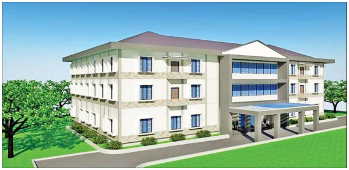
အဆင့်မြင့်တရားရေးသင်တန်းကျောင်းတစ်ခုဖြစ်သည့် Judicial College အဆောက်အအုံပုံစံကို တွေ့ရစဉ်။

များစွာအကျိုးရှိ အာဆီယံနိုင်ငံများတွင်လည်း တရားရေး သင်တန်းကျောင်း၊ တရားရေးအကယ်ဒမီ၊ တရားရေးကောလိပ်များ တည်ထောင်၍ တရားရေးဆိုင်ရာသင်တန်းများကို ပို့ချပေး လျက်ရှိပြီး အဆိုပါသင်တန်းများတွင် အခြား အာဆီယံနိုင်ငံများမှ တရားသူကြီးများကို လည်း အတွေ့အကြုံလှပလှပနိုင်ရေး ပါဝင် တက်ရောက်ရန် ဖိတ်ကြားကြကြောင်း၊ တရား သူကြီးများအနေဖြင့် ထိုသို့ သင်တန်းများ တက်ရောက်၍ အတွေ့အကြုံများဖလှယ်ခွင့် ရသည့်အတွက် အာဆီယံဒေသတွင်း တရား စီရင်ရေးပူးပေါင်းဆောင်ရွက်ရာတွင် များစွာ အကျိုးရှိပါကြောင်း ဒေါက်တာမာလာမော်က ပြောသည်။