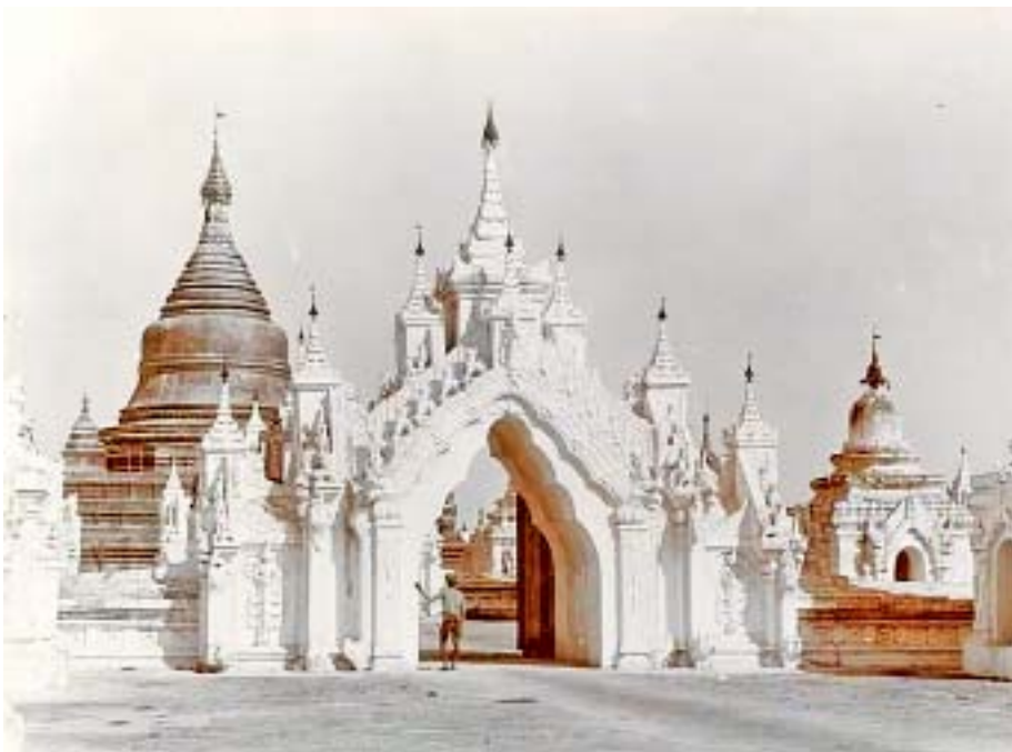
မဟာလောကမာရဇိန် ကုသိုလ်တော်

ထို့အပြင် မဟာလောကမာရဇိန် ကုသိုလ်တော်ဘုရား အရှေ့မုခ်နှင့် မျက်နှာချင်းဆိုင်မှစ၍ မြောက်မှ တောင်သို့ မဟာဝိဇယပုညကျောင်းတိုက်၊ ဝဇီရာ ရာမစိန်တုံးတိုက်၊ မတ္တရာတိုက်၊ သက်ပန်းတိုက်၊ မင်္ဂလာရာမမောင်း ထောင်တိုက်၊ မဟာဝိဇယရာမ ခင်မကန်တိုက်၊ ရွှေကူ တိုက်၊ တကောင်းတိုက်၊ မဟာဝိသုဒ္ဓါရာမ အင်းကမ်း တိုက်၊ မဟာမဇ္ဈိကာရာမ စလင်းတိုက်၊ ဝိစိတ္တာရာမ မာရ်အောင်တိုက်၊ ဆင်တဲတိုက်၊ လယ်ကင်းတိုက်၊ မက္ခရာ တိုက်၊ ငါးဆူတိုက်၊ စည်ပုတ္တရာတိုက်၊ တွင်းကြီးတိုက်၊ စလင်းတိုက်သစ်၊ လှေတိုက်-စသည့် စိန်တုံးမိဖုရား၊ လောင်းရှည်မိဖုရား၊ သက်ပန်းမိဖုရား၊ ရတနာဒေဝီ နန်းမတော်မိဖုရားကြီး၊ အနောက်နန်းမိဖုရား၊ အလယ်နန်း ရှင် ဆင်ဖြူမရင်မိဖုရား၊ တောင်နန်းမတော်မိဖုရား၊ ဒေဝီစု ဖုရားကြီး၊ ရွှေဘိုမင်းမိဖုရားခေါင်ကြီးနှင့် သီပေါမင်း စုဖုရားလတ်တို့၏ ကုသိုလ်ကျောင်းတိုက်ကြီးများသည် လည်း ဘဝရှင်မင်းတရားကြီး၏ ကုသိုလ်တော်များနှင့် တစ်ဆက်တည်း တန်းလျက်တည်ရှိသည်။ (ယခု