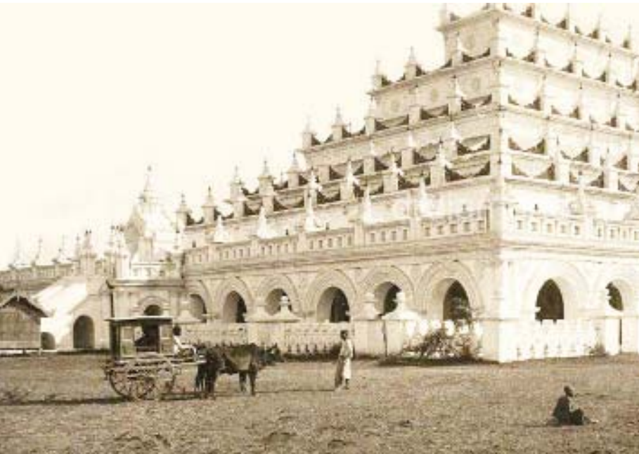
မဟာအတုလေဝယံ အတုမရှိကျောင်းတိုက်