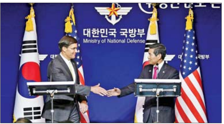
မတ်ခ်အက်စပါနှင့် ဂျောင်ကျောင်ဒို

ထုတ်ပြန်ချက်များ အကြိမ်ကြိမ်ထုတ်ပြန်ခဲ့သည်။ မြောက်ကိုရီးယားနိုင်ငံနှင့် သံတမန်ရေးဆိုင်ရာ စေ့စပ်ညှိနှိုင်းမှုများ တွန်းအားပေးလုပ်ဆောင်ရန် ကြိုးပမ်းမှုတစ်ရပ်အဖြစ် အမေရိကန်နိုင်ငံသည် ပြီးခဲ့သည့်နှစ်က စစ်ရေးလေ့ကျင့်မှုများဆိုင်ရာ ခွင့်ပြုချက်ကို ကိုးကား- အင်န်အိတ်ချီကော ဘာသာပြန် - ကျော်ထိုက်စိုး