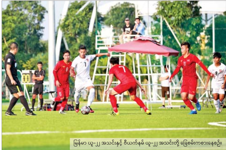
မြန်မာ ယူ-၂၂ အသင်းနှင့် ဗီယက်နမ် ယူ-၂၂ အသင်းတို့ ခြေစမ်းကစားနေစဉ်။