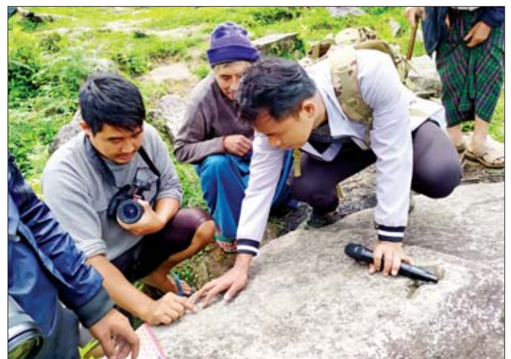
ခေါင်လန်ဖူးမြို့ကျောက်ခြေရာကုန်း၌ ကျောက်ခြေရာကို ပြသပေးနေစဉ်။

"ဒီကျောက်ခြေရာတွေက ဘယ်အချိန် က စတင်တာလဲဆိုတာကတော့ အဘိုးလည်း အတိအကျမပြောနိုင်ပါဘူး။ လူကြီးတွေ ပြောတာကတော့ ရှေးရှေးတုန်းက ခေါင်လန်ဖူး တစ်ဝိုက်ကို တိဗက်ဒေသကလူတွေ အများ ကြီး ရောက်ရှိလာကြတယ်။ အဲဒီမှာ တောင်ယာလုပ်စားလို့လည်းမဖြစ်၊ အဲဒီလိုက် လို့လည်း အဆင်မပြေတာကြောင့် ငါတို့ ဒီနေရာကနေ ရေကြည်ရာမြက်နုရာသို့