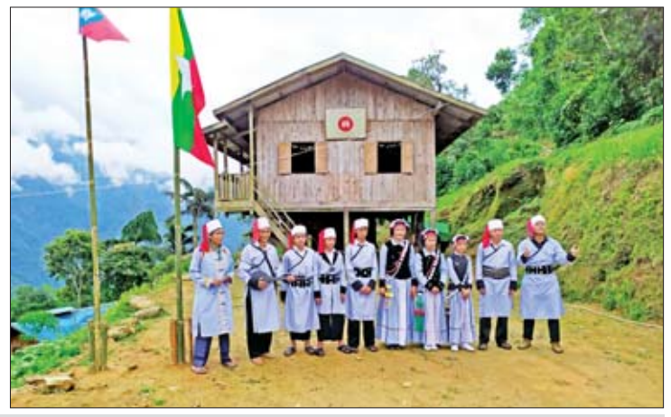
လီဆူတိုင်းရင်းသားတို့၏ရိုးရာအကကို တွေ့ရစဉ်။