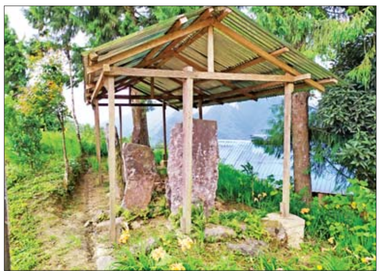
ခြေရာကုန်းပေါ်ရှိ ထူးခြားသည့် ကျောက်တုံး