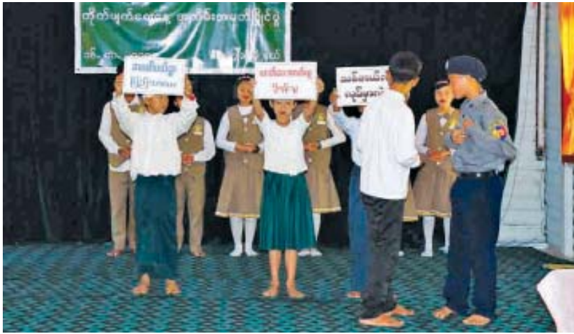
ပြောဆိုမတ်တည်ကြည်မှုသည် တစ်ခုတည်းလမ်း ဖြစ်သည် ခေါင်းစဉ်ဖြင့် အခြေခံပညာကျောင်း ငါးကျောင်း၊ မူလတန်းဆင့် ကဗျာသရုပ်ဖော်ပြိုင်ပွဲတွင် မောင်တို့မယ်တို့သာယာရေး ခေါင်းစဉ်ဖြင့် အခြေခံပညာကျောင်းခုနစ်ကျောင်း၊ မူလတန်းဆင့် Role Play ပြိုင်ပွဲတွင် လာဘ်စားတဲ့ကြောင် ခေါင်းစဉ်ဖြင့် အခြေခံပညာကျောင်းခြောက်ကျောင်း ဝင်ရောက်ယှဉ်ပြိုင်ကြသည်။ ရီရယ်(ဒီမော့ဆို)