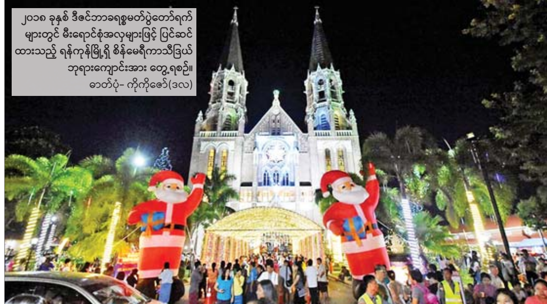
၂၀၁၈ ခုနှစ် ဒီဇင်ဘာခရစ္စမတ်ပွဲတော်ရက်များတွင် မီးရောင်စုံအလှများဖြင့် ပြင်ဆင်ထားသည့် ရန်ကုန်မြို့ရှိ စိန်မေရီကာသီဒြယ်ဘုရားကျောင်းအား တွေ့ရစဉ်။

မည့် ငါးမျိုးရရှိရေးနှင့် နည်းပညာပံ့ပိုးပေးရန် ကိစ္စရပ်များကိုလည်းကောင်း၊ လယ်ယာမြေစီမံခန့်ခွဲရေးနှင့် စာရင်းအင်းဦးစီးဌာန ညွှန်ကြားရေးမှူးချုပ် ဦးသက်နိုင်ဦးက မြေကြီးမြေပုံမှန်ကန်ရေးနှင့် ဥပဒေနှင့်ညီညွတ်သော မြေယာအသုံးပြုမှုဖြစ်စေရေး စိစစ်ဆောင်ရွက်ရန်ကိစ္စရပ်များကိုလည်းကောင်း ရှင်းလင်းတင်ပြကြသည်။ ထိုရောက်စွာကူညီမည် ထို့နောက် ပြည်ထောင်စုဝန်ကြီးက ဆွေးနွေးပြောကြားရာတွင် မိမိတို့ဝန်ကြီးဌာနအနေဖြင့် စိုက်ပျိုးမွေးမြူရေးလုပ်ကိုင်သူတောင်သူများအပါအဝင် ကျေးလက်နေပြည်သူများအား တိုက်ရိုက်အကျိုးပြုနိုင်မည့် ဦးစီးဌာနများဖြင့် ဖွဲ့စည်းထားသကဲ့သို့ လက်တွေ့ကြိုးပမ်းအကောင်အထည်ဖော်ဆောင်ရွက်လျက်ရှိကြောင်း၊ ယခုကဲ့သို့ ငြိမ်းချမ်းရေးနှင့် ဒေသဖွံ့ဖြိုးရေးလုပ်ငန်းဆောင်ရွက်နေမှုများအား ကူညီပံ့ပိုးပေးခွင့်ရသည့်အတွက် များစွာဝမ်းမြောက်ပါကြောင်း၊ လိုအပ်သည့် နည်းပညာနှင့် အကူအညီများကို ဥပဒေလုပ်ထုံးလုပ်နည်းများနှင့်အညီ ထိရောက်စွာ ကူညီဆောင်ရွက်သွားမည်ဖြစ်ကြောင်း ပြောကြားသည်။ ထို့နောက် ပြည်ထောင်စုဝန်ကြီးနှင့်အဖွဲ့သည် ကရင်ပြည်နယ်အစိုးရအဖွဲ့၏ ကြီးကြပ်မှု၊ ပြည်နယ်မွေးမြူရေးနှင့်ကုသရေးဦးစီးဌာန၏ အထောက်အပံ့ဖြင့် မွေးမြူထားသော အမှတ် (၇၇၅) မွေးမြူရေးခြံအား ကြည့်ရှုစစ်ဆေးရာ စခန်းတာဝန်ခံ စောကော်လူးက မြို့အတွင်းဆောင်ရွက်လျက်ရှိသော စိုက်ပျိုးမွေးမြူရေးလုပ်ငန်းများနှင့် လိုအပ်ချက်များအား ရှင်းလင်းတင်ပြရာ ပြည်ထောင်စုဝန်ကြီးက ညှိနှိုင်းဖြည့်ဆည်းပေးခဲ့ကြောင်း သိရသည်။ သတင်းစဉ်