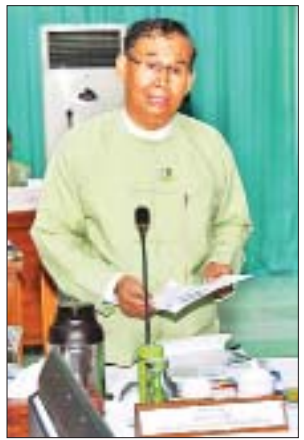
ပြည်ထောင်စုဝန်ကြီး ဦးအုန်းဝင်း ရှင်းလင်းတင်ပြစဉ်။

ထို့နောက် အမျိုးသားမြေအသုံးချမှုကောင်စီအတွင်းရေးမှူး ပြည်ထောင်စုဝန်ကြီး ဦးအုန်းဝင်းက တတိယအကြိမ် အစည်းအဝေးဆုံးဖြတ်ချက်များအပေါ် ဆောင်ရွက်ပြီးစီးမှုအခြေအနေများ၊ မြန်မာနိုင်ငံတွင် စနစ်ကျကောင်းမွန်သော မြေယာစီမံခန့်ခွဲမှုတိုးတက်ဖြစ်ပေါ်လာစေရေးအတွက် ပြည်ထောင်စုနယ်မြေ (နေပြည်တော်) နှင့် စာမျက်နှာ ၆ သို့