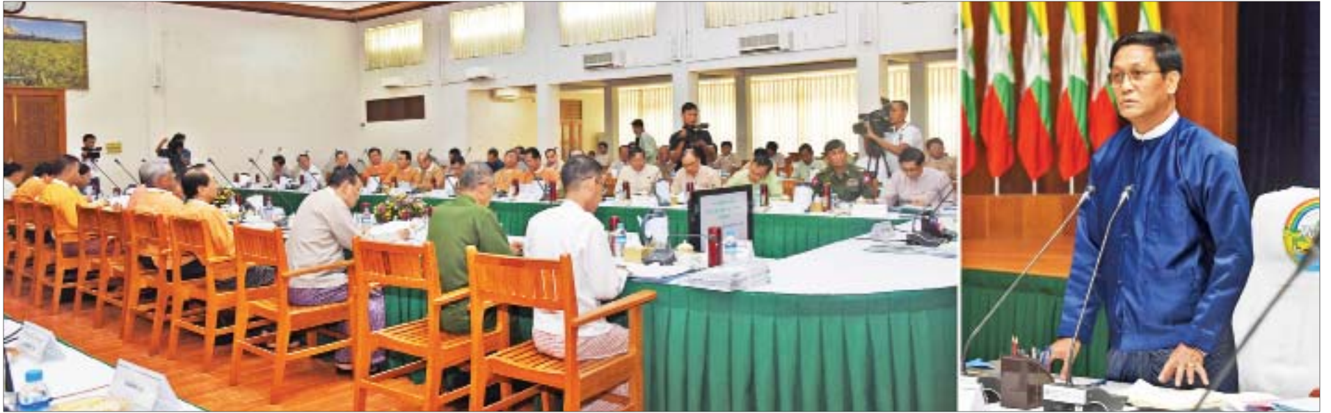
ဒုတိယသမ္မတ ဦးဟင်နရီဗန်ထီးယူ လယ်ယာမြေနှင့် အခြားမြေများ သိမ်းဆည်းခြင်းခံရမှုများ ပြန်လည်စိစစ်ရေးဗဟိုကော်မတီ လုပ်ငန်းညှိနှိုင်းအစည်းအဝေး (၂/၂၀၁၉)တွင် အမှာစကားပြောကြားစဉ်။

နေပြည်တော် နိုဝင်ဘာ ၆ လယ်ယာမြေနှင့်အခြားမြေများ သိမ်းဆည်းခြင်းခံရမှုများ ပြန်လည်စိစစ်ရေးဗဟိုကော်မတီ လုပ်ငန်းညှိနှိုင်းအစည်းအဝေး(၂/၂၀၁၉)ကို ယနေ့ မွန်းလွဲ ၁ နာရီတွင် နေပြည်တော်ရှိ စိုက်ပျိုးရေး၊ မွေးမြူရေးနှင့်ဆည်မြောင်းဝန်ကြီးဌာန အစည်းအဝေးခန်းမ၌ကျင်းပရာ လယ်ယာမြေနှင့် အခြားမြေများ သိမ်းဆည်းခြင်းခံရမှုများပြန်လည်စိစစ်ရေးဗဟိုကော်မတီဥက္ကဋ္ဌ ဒုတိယသမ္မတ ဦးဟင်နရီဗန်ထီးယူ တက်ရောက်အမှာစကားပြောကြားသည်။