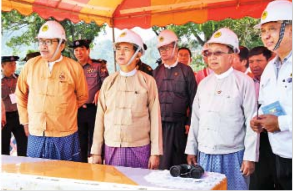
နိုင်ငံတော်သမ္မတ ဦးဝင်းမြင့်နှင့်အဖွဲ့ အတ္ထရံမြစ်ကူး (စံပယ်ဂူ) တံတားတည်ဆောက်ရေးစီမံကိန်းလုပ်ငန်းခွင်ကို ကြည့်ရှုစစ်ဆေးစဉ်။