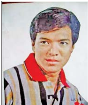
စိုးနိုင်