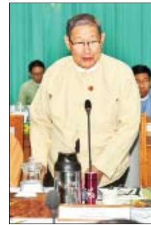
ပြည်ထောင်စုဝန်ကြီး ဦးစိုးဝင်း ရှင်းလင်းတင်ပြစဉ်။

ကော်မတီဝင်များ၊ ဌာနဆိုင်ရာအကြီးအကဲများနှင့် တာဝန်ရှိသူများ တက်ရောက်ကြသည်။