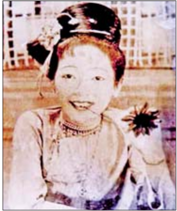
ခင်မေလေး