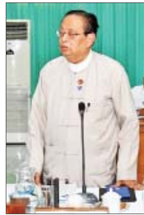
ပြည်ထောင်စုဝန်ကြီး ဦးဝင်းခိုင် ရှင်းလင်းတင်ပြစဉ်။