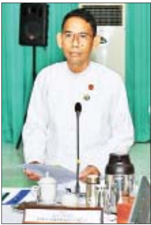
ပြည်ထောင်စုဝန်ကြီး ဒေါက်တာ အောင်သူ ရှင်းလင်းတင်ပြစဉ်။