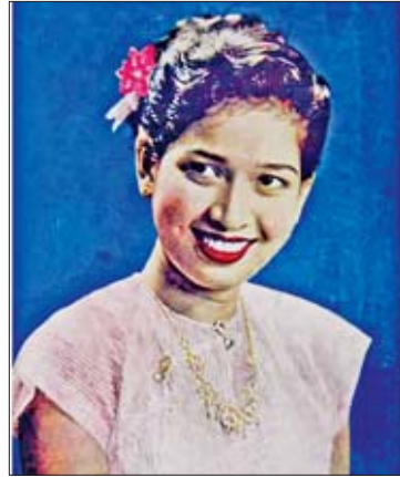
ခင်လေးဆွေ