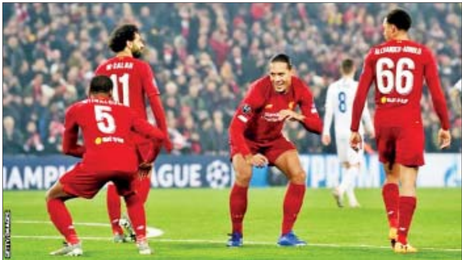
မက်ဒရစ်အသင်းကို သုံးဂိုးပြတ်နဲ့ ရှုံးနိမ့်ခဲ့ပြီး နောက်ပိုင်းမှာ အိမ်ကွင်း၌ ယှဉ်ပြိုင်ကစားခဲ့တဲ့ ဥရောပပြိုင်ပွဲ ၂၄ ပွဲစလုံး ရှုံးပွဲမရှိစံချိန်တင်နိုင်ခဲ့တာ ဖြစ်ပါတယ်။ ၂၄ ပွဲမှာ ၁၈ ပွဲနိုင်၊ ခြောက်ပွဲသရေရလဒ်ထွက်ပေါ်ထားတာ ဖြစ်ပါတယ်။