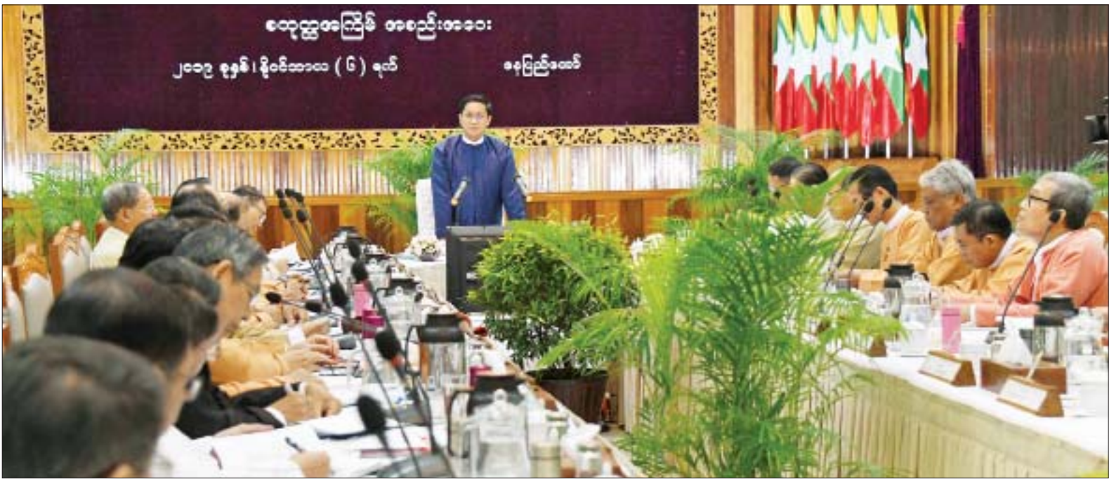
ဒုတိယသမ္မတ ဦးဟင်နရီဗန်ထီးယူ အမျိုးသားမြေအသုံးချမှုကောင်စီ စတုတ္ထအကြိမ်အစည်းအဝေးတွင် အမှာစကားပြောကြားစဉ်။

နေပြည်တော် နိုဝင်ဘာ ၆ အမျိုးသား မြေအသုံးချမှုကောင်စီ စတုတ္ထအကြိမ်အစည်းအဝေးကို ယနေ့ နံနက် ၉ နာရီတွင် နေပြည်တော်ရှိ သယံဇာတနှင့် သဘာဝပတ်ဝန်းကျင် ထိန်းသိမ်းရေးဝန်ကြီးဌာန သစ်တော ဦးစီးဌာန အင်ကြင်းခန်းမ၌ ကျင်းပရာ အမျိုးသား မြေအသုံးချမှုကောင်စီ ဥက္ကဋ္ဌ ဒုတိယသမ္မတ ဦးဟင်နရီဗန်ထီးယူ တက်ရောက်အမှာစကား ပြောကြား သည်။