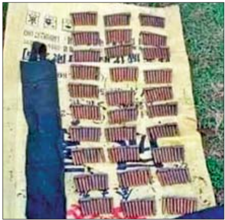
ကျော်ကျော်(မလှိုင်)

နေပြည်တော် နိုဝင်ဘာ ၆ ရန်ကုန်-နေပြည်တော် အမြန်လမ်းတွင် ကျည်ဆန်များ တွေ့ရှိခဲ့ကြောင်း အမြန်လမ်းရဲတပ်ဖွဲ့က နိုဝင်ဘာ ၅ ရက်တွင် သတင်းထုတ်ပြန်ထားကြောင်း သိရသည်။ ဖြစ်စဉ်မှာ နိုဝင်ဘာ ၅ ရက် ညနေပိုင်းက ရန်ကုန်-နေပြည်တော်လမ်း မိုင်တိုင် ၁၄၃/၆-၁၄၃/၇ အကြား တံတားအောက် လက်ယာရေထုတ်မြောင်းအတွင်း ဒေသခံ တစ်ဦးက ရေမြောင်းအတွင်း ခုံးစမ်းစဉ် ကျည်ဆန်များ တွေ့ရှိခဲ့ခြင်းဖြစ်သည်။ ယင်းနောက် ရဲတပ်ဖွဲ့က သွားရောက် စစ်ဆေးရာ ပွိုင့် ၃၀ ကျည် အတောင့် ၁၀၀ ပါ ကျည်အိတ် သုံးအိတ် စုစုပေါင်း ကျည်အတောင့် ၃၀၀ တွေ့ရှိခဲ့ကြောင်း သိရသည်။