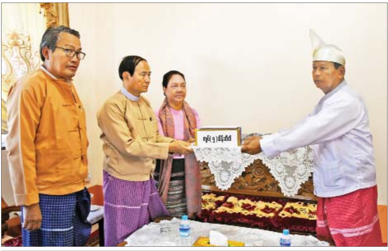
နိုင်ငံတော်သမ္မတ ဦးဝင်းမြင့်နှင့်ဇနီး ဒေါ်ချိုချို ကျိုက္ခမီရေလယ်ဘုရား ဂေါပကအဖွဲ့ထံ အလှူငွေများပေးအပ်လှူဒါန်းစဉ်။

အတ္ထရိုက်ကူး (စံပယ်ဂူ)တံတား တည်ဆောက်ပြီးစီးပါက အတ္ထရိုက်ကူး၏ အရှေ့ဘက်ကမ်းရှိ ကျေးရွာများမှ ဒေသခံပြည်သူများသည် ကျိုက်မရောမြို့သို့ အချိန် မိနစ် ၃၀ အတွင်း လွယ်လင့်တကူ ဆက်သွယ်သွားလာနိုင်ပြီး ပညာရေး၊