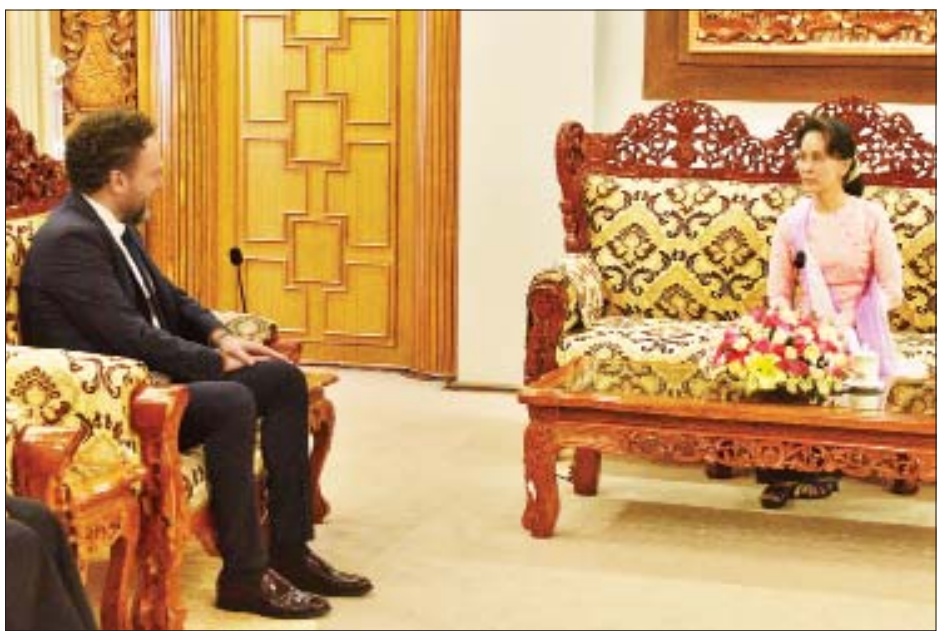
နိုင်ငံတော်၏အတိုင်ပင်ခံပုဂ္ဂိုလ် ဒေါ်အောင်ဆန်းစုကြည် မြန်မာနိုင်ငံဆိုင်ရာ ခရိုအေးရှားသံအမတ်ကြီး Mr. Kreso Glavac အား လက်ခံတွေ့ဆုံစဉ်။