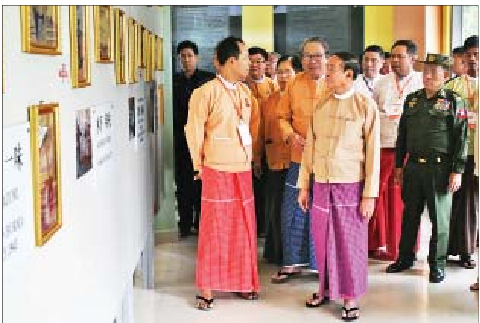
နိုင်ငံတော်သမ္မတ ဦးဝင်းမြင့်နှင့်အဖွဲ့ သံဖြူဇရပ်မြို့ရှိ မြန်မာ-ထိုင်း သေမင်းတမန်မီးရထားလမ်းပြတိုက်အတွင်း လှည့်လည်ကြည့်ရှုစဉ်။

အစဉ်အလာမပျက် ကျင်းပလျက်ရှိပြီး အဆိုပါပွဲလမ်းသဘင်များတွင် ပျော်ရွှင် စွာ ပါဝင်ဆင်နွှဲနိုင်ကြပါစေကြောင်း ဆုမွန်ကောင်းတောင်းအပ်ပါသည်။ သမိုင်းကြောင်းအရ ကရင်ပြည်နယ်တွင် ရှေးယခင်ကတည်းကပင် ကရင်မျိုးနွယ်စု (၁၁) မျိုးတို့သည် အခြားတိုင်းရင်းသားများနှင့်အတူ ချစ်ခင် ရင်းနှီးစွာ အတူတကွ ယှဉ်တွဲနေထိုင်ခဲ့ကြပါသည်။ လွတ်လပ်ရေးရပြီး နောက်ပိုင်း တိုင်းနှင့်ပြည်နယ်များ ဖွဲ့စည်းတည်ထောင်ခဲ့ရာတွင် ကရင်လူမျိုး များနေထိုင်သည့် ဒေသများကို ကရင်ပြည်နယ်အဖြစ် သတ်မှတ်ရန် စတင် ဆောင်ရွက်ခဲ့ကြပါသည်။ နိုင်ငံတော်သမ္မတ လက်မှတ်ရေးထိုးထုတ်ပြန်သည့် ၁၉၅၁ ခုနှစ်၊ ဖွဲ့စည်းအုပ်ချုပ်ပုံ စာမျက်နှာ ၃ ကော်လံ ၁ သို့