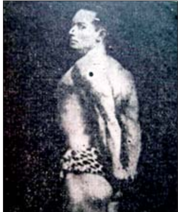
ဝေါလတာချစ်ထွန်း