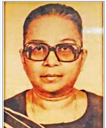
ဒေါ်မြမြ