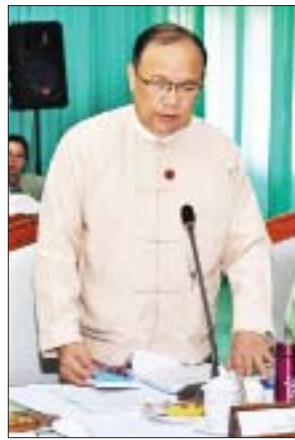
ပြည်ထောင်စုဝန်ကြီး ဦးသန့်စင်မောင် ရှင်းလင်းတင်ပြစဉ်။