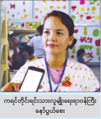
ကရင်တိုင်းရင်းသားလူမျိုးရေးရာဝန်ကြီး နော်ပွယ်စေး

ပဲခူးတိုင်းဒေသကြီး တောင်ငူမြို့ ခပေါင်းခန်းမနှင့် ကေတုမတီ မိုးလုံလေလုံအားကစားခန်းမတွင် နိုဝင်ဘာ ၂ ရက်မှ ၃ ရက်အထိ ကျင်းပသော ကလေးစာပေပွဲတော်ကို နေ့စဉ်နံနက် ၉ နာရီမှ ညနေ ၅ နာရီအထိ နေ့စဉ် စည်ကားသိုက်မြိုက်စွာ ကျင်းပလျက်ရှိရာ ကလေးစာပေပွဲတော်သို့ ပျော်ရွှင်စွာ ပါဝင်ဆင်နွှဲကြသူများ၏ ရင်တွင်းစကားသံများကို ဖော်ပြအပ်ပါသည်။