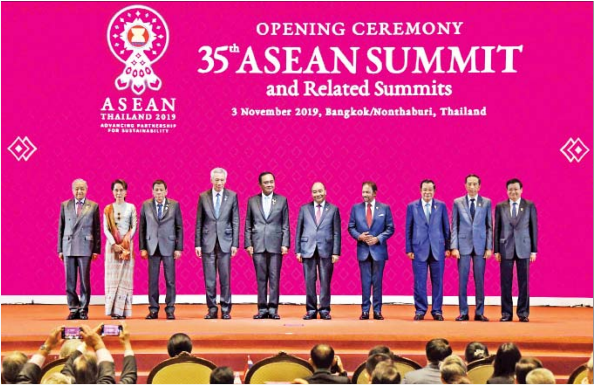
နိုင်ငံတော်၏အတိုင်ပင်ခံပုဂ္ဂိုလ် ဒေါ်အောင်ဆန်းစုကြည် (၃၅)ကြိမ်မြောက် အာဆီယံထိပ်သီးအစည်းအဝေးဖွင့်ပွဲအခမ်းအနားသို့ တက်ရောက်လာကြသည့် အာဆီယံနိုင်ငံများမှ နိုင်ငံခေါင်းဆောင်များ၊ အစိုးရအဖွဲ့အကြီးအကဲများနှင့် စုပေါင်းမှတ်တမ်းတင်ဓာတ်ပုံရိုက်စဉ်။

ကုသိုလ်ကောင်းမှုလျှင်မြန်စွာပြု စိတ်သည် မကောင်းမှုတွင် မွေ့လျော်တတ် သဖြင့် ကောင်းမှုပြုသောအခါ နုန့်နှေးတတ်ရ ကားမကောင်းမှုမှ စိတ်ကိုတားမြစ်၍ ကုသိုလ် ကောင်းမှုတို့ကို အချိန်မဆိုင်းဘဲ ဆောလျှင်စွာ ပြုလုပ်ရာ၏။ ကောင်းမှုပြုလိုသော စိတ်ဆန္ဒ ပေါ်လာလျှင် အဆောတလျှင် ပြုလုပ်နိုင်ရန် ကြိုးစားရာ၏။ လောကဝဂ်(ဓမ္မပဒ-၁၁၆)