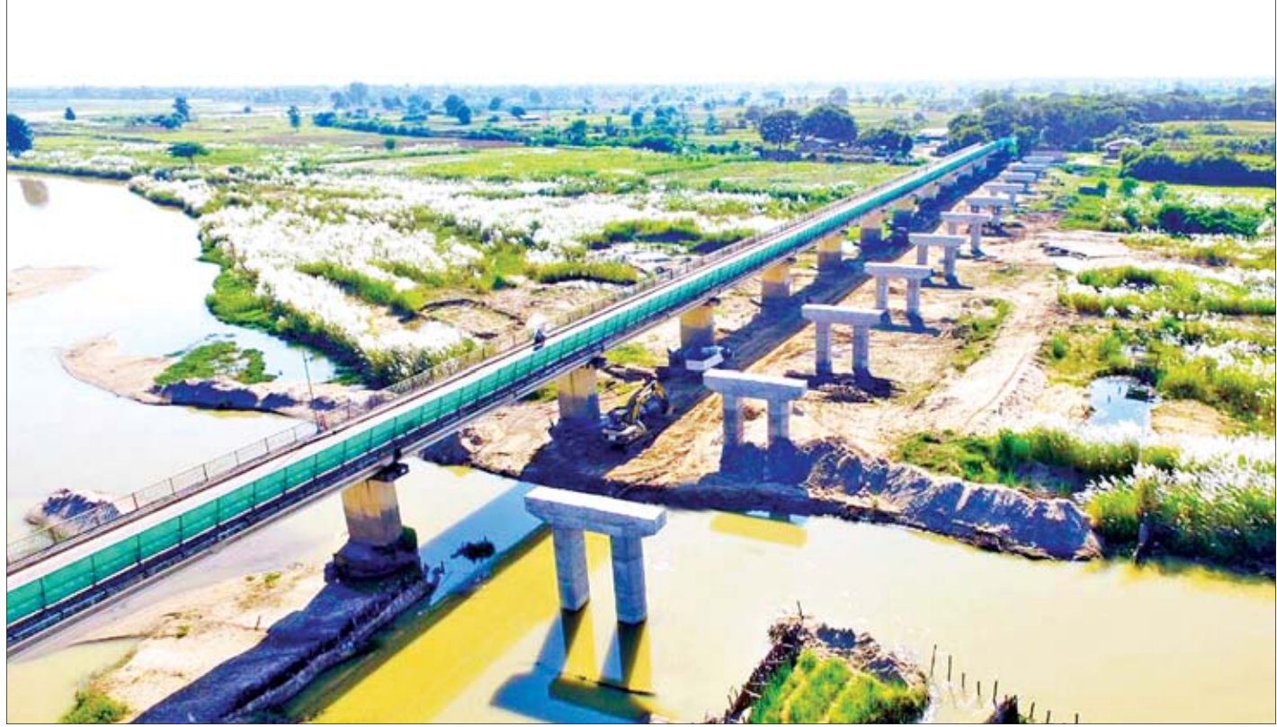
ဘုတလင်-ရေဦး-ခင်ဦးလမ်းပေါ်တွင် မူးမြစ်ကူးတံတား(ရေဦး)နှင့်အပြိုင် တည်ဆောက်နေသော တံတားတစ်စင်းကို တွေ့ရစဉ်။

ရေဦး နိုဝင်ဘာ ၃ စစ်ကိုင်းတိုင်းဒေသကြီး ဘုတလင်-ရေဦး-ခင်ဦးလမ်းပေါ်တွင် မူးမြစ်ကူးတံတား(ရေဦး)နှင့်အပြိုင် တည်ဆောက်နေသော တံတားတစ်စင်းအား ဆောက်လုပ်ရေးဝန်ကြီးဌာန တည်ဆောက်ရေးအဖွဲ့(၁)၊ တံတားအထူးအဖွဲ့(၂)မှ တာဝန်ယူတည်ဆောက်လျက်ရှိရာ ယခုအခါ တံတားတစ်စင်းလုံး၏ ၂၃ ရာခိုင်နှုန်းပြီးစီးပြီဖြစ်ကြောင်း သိရသည်။ စာမျက်နှာ ၁၁ ကော်လံ ၁ သို့ *