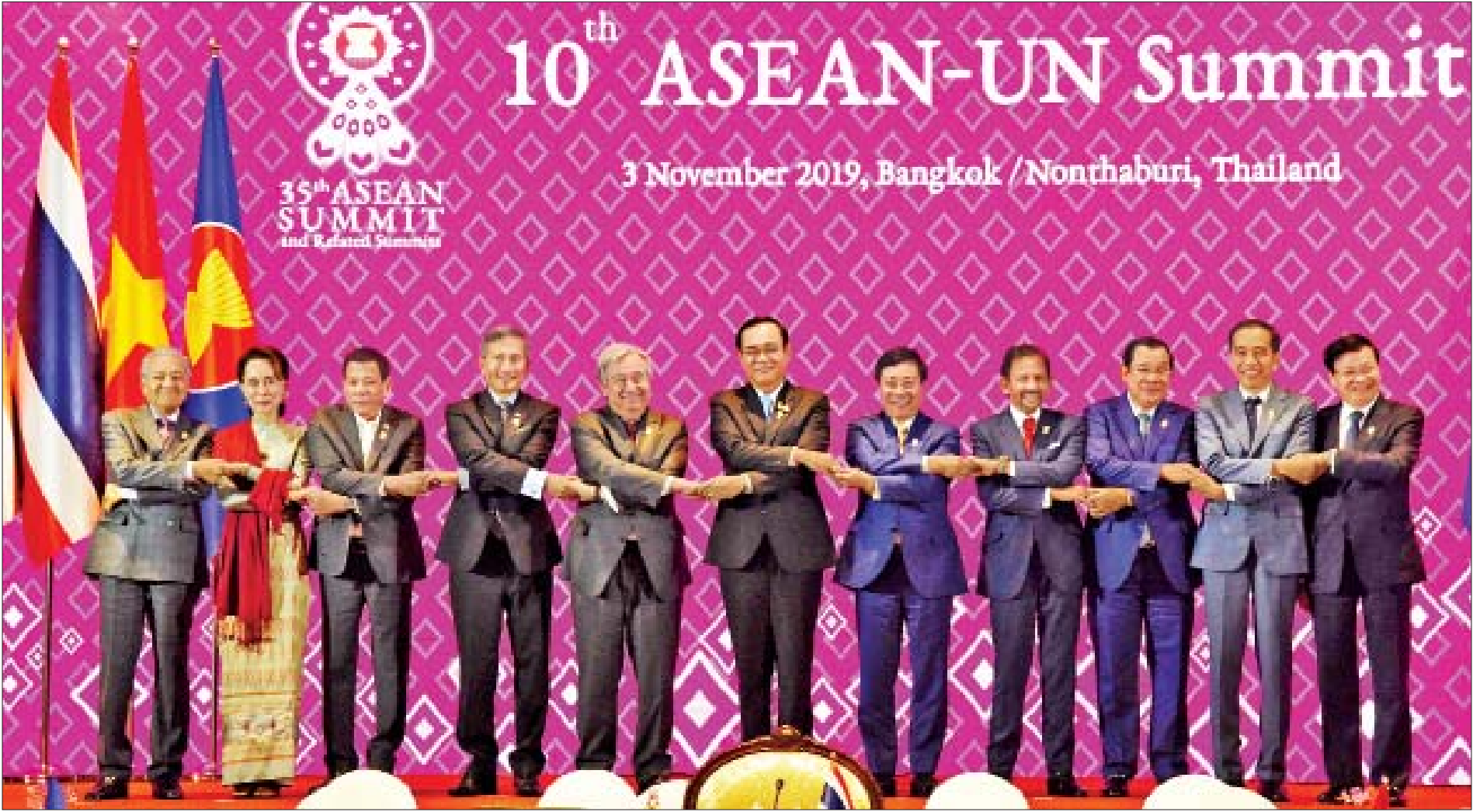
နိုင်ငံတော်၏အတိုင်ပင်ခံပုဂ္ဂိုလ် ဒေါ်အောင်ဆန်းစုကြည် (၁၀)ကြိမ်မြောက် အာဆီယံ-ကုလသမဂ္ဂထိပ်သီးအစည်းအဝေးသို့ တက်ရောက်လာကြသည့် အာဆီယံနိုင်ငံများမှ နိုင်ငံခြားရေးဝန်ကြီးအဖွဲ့အကြီးအကဲများ၊ ကုလသမဂ္ဂ အတွင်းရေးမှူးချုပ်နှင့်အတူ စုပေါင်းမှတ်တမ်းတင်ဓာတ်ပုံရိုက်စဉ်။