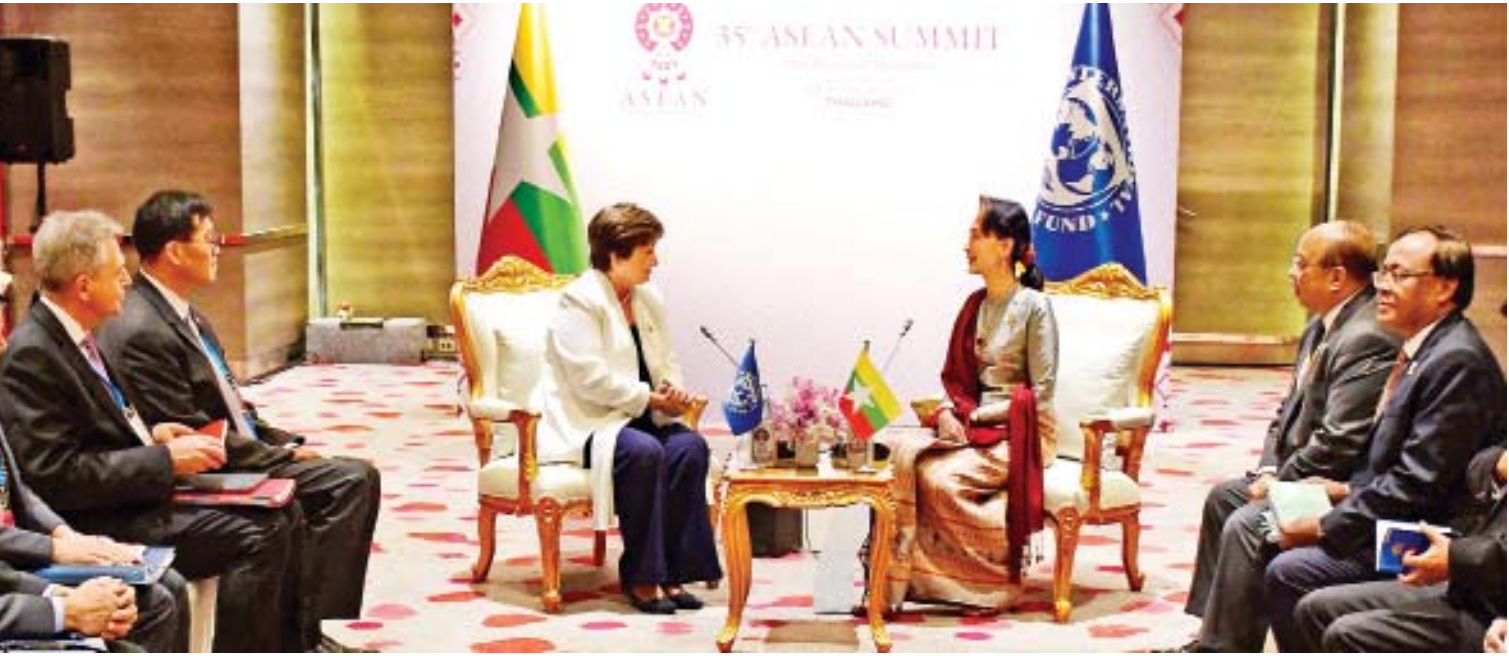
နိုင်ငံတော်၏အတိုင်ပင်ခံပုဂ္ဂိုလ် ဒေါ်အောင်ဆန်းစုကြည် အပြည်ပြည်ဆိုင်ရာငွေကြေးရန်ပုံငွေအဖွဲ့ (IMF) အကြီးအကဲ Ms. Kristalina Georgieva နှင့် တွေ့ဆုံဆွေးနွေးစဉ်။