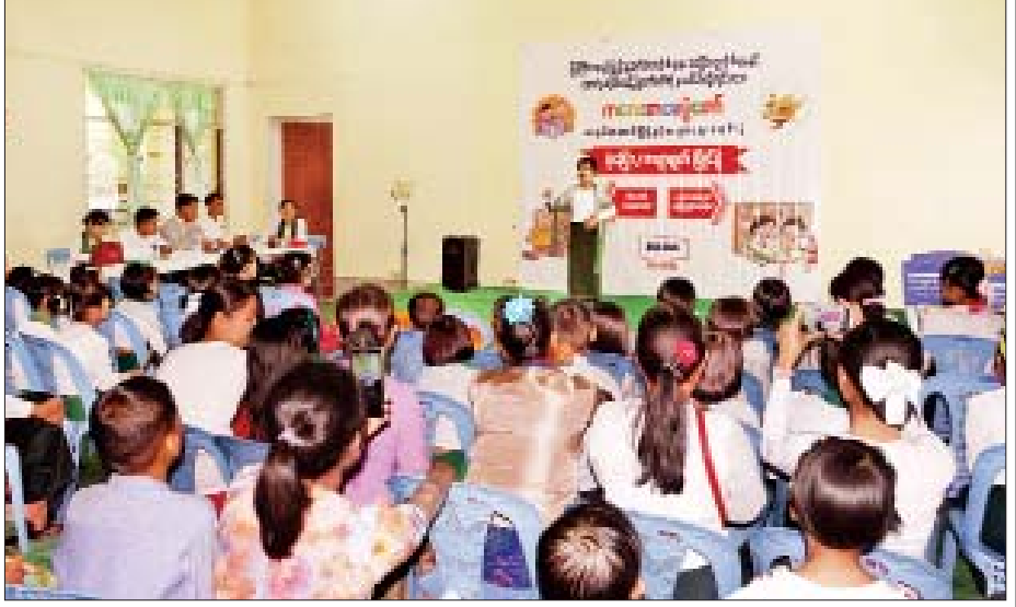
ကလေးစာပေပွဲတော် ပုံပြော၊ ကဗျာရွတ်ပြိုင်ပွဲတွင် ကျောင်းသူတစ်ဦး ပါဝင်ယှဉ်ပြိုင်နေစဉ်။