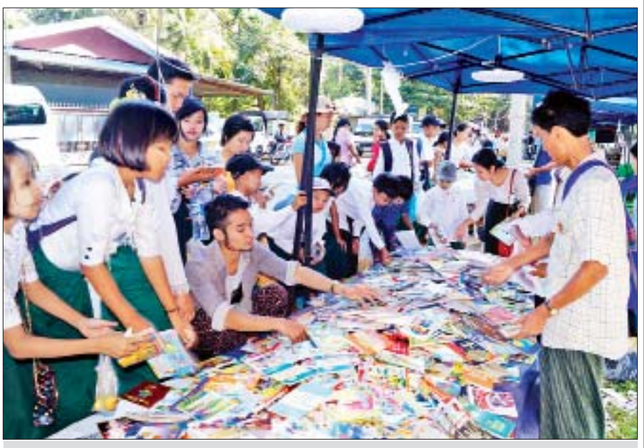
တောင်ငူမြို့ ကလေးစာပေပွဲတော် ဒုတိယနေ့တွင် ကျောင်းသား ကျောင်းသူများ စာအုပ်ဝယ်ယူအားပေးစဉ်။

ပူဖောင်းညှပ်ကစားခြင်း၊ ခါးကွင်းလှည့်ကစားခြင်းပြခန်းတို့ကို ကျောင်းပေါင်းစုံက ကျောင်းသား ကျောင်းသူ ကလေးများ လာရောက်လေ့လာကြကြောင်း သိရသည်။ ညနေပိုင်းတွင် ပါဝင်ကူညီကြသည့် အလှူရှင်များက ဆုရရှိသူများကို အမှတ်တရလက်ဆောင် ပေးအပ်ခဲ့ပြီး ကလေးစာပေပွဲတော်ကို အောင်မြင်စွာ ရုပ်သိမ်းခဲ့သည်။ ပဲခူးတိုင်းဒေသကြီးအတွင်း၌ နိုင်ငံတော်အဆင့် ကလေးစာပေပွဲတော်ကို ၂၀၁၉ ခုနှစ် မတ်လတွင် ပဲခူးတက္ကသိုလ်၌ ကျင်းပခဲ့ပြီး ခရိုင်အဆင့်အနေဖြင့် ပဲခူးပြည်၊ သာယာဝတီခရိုင်တို့တွင် လည်းကောင်း၊ မြို့နယ်အဆင့်များအနေဖြင့် ပဲခူး၊ နတ်တလင်း၊ ကျောက်တံခါးမြို့နယ်များတွင် လည်းကောင်း ကျင်းပခဲ့ကြသည်။ ထိုသို့ ကျင်းပပေးခြင်းဖြင့် ကလေးစာပေပွဲတော်တွင် ကလေးများ စာအုပ်စာပေ၌ နှစ်သက်မွှေးလျော်ကာ ရာသက်ပန် ပညာရှုမှီးသူများဖြစ်လာစေရန်၊ ပွဲတော်၌ ပျော်ရွှင်စွာဆင်နွှဲရင်း စုပေါင်းကာ ဝိုင်းဝန်း ပါဝင်ဆောင်ရွက်တတ်သည့် အလေ့အထကောင်းများ ရရှိစေရန်နှင့် ပညာဗဟုသုတ၊ အရည်အသွေးပြည့်ဝပြီး အနာဂတ်တွင် တိုင်းပြည်အတွက် ဦးဆောင်ဦးရွက်ပြုကြသူများ ဖြစ်လာစေရန် ရည်ရွယ်၍ ကျင်းပခြင်းဖြစ်ကြောင်း သိရသည်။ သူရ(တောင်ငူ)