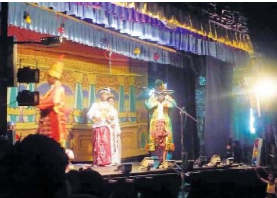
ဘုရားပွဲ အငြိမ့်

မန္တလေးမှာ သတင်းစာတွေမရှိတော့ပေမယ့် စာအုပ်တိုက်တချို့က စာအုပ်တွေထုတ်ဝေမှု အလျင်မြတ်ခဲ့ပါဘူး။ အထူးသဖြင့် လူထုကြီးပွားရေးစာအုပ်တိုက်က ပြည်သူ့ဘဝသရုပ်ဖော်စာပေတွေ၊ သမိုင်းမှတ်တမ်းတွေ၊ ပုံပြင်စာအုပ်တွေ အများဆုံးထုတ်ဝေခဲ့တဲ့အပြင် စာပေစာတမ်း၊ စာပေဝေဖန်ရေးနဲ့ ကဗျာစာအုပ်၊ ခရီးသွားဆောင်းပါးစာအုပ်တွေလည်း ထုတ်ဝေခဲ့ပါတယ်။ ဆိုလိုတာက ညီညွတ်စွာနဲ့ စာပေလုပ်ငန်းတွေ ဆောင်ရွက်လှုပ်ရှားနိုင်ခဲ့တဲ့ မန္တလေးက စာရေးဆရာတွေအဖို့