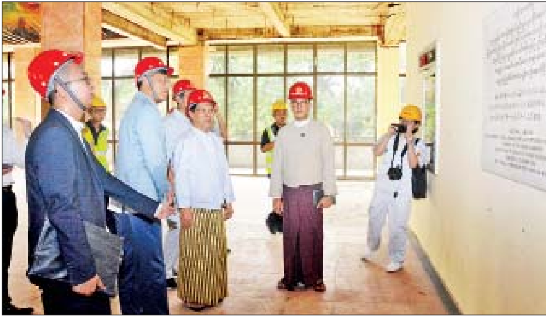
ခရီးလာရောက်ခဲ့သည့် တရုတ်ပြည်သူ့သမ္မတ အမျိုးသားဇာတ်ရုံကို မေတ္တာလက်ဆောင် ၁၉၉၀ ပြည့်နှစ် ဒီဇင်ဘာ ၂၇ ရက်တွင် နိုင်ငံ နိုင်ငံတော်သမ္မတကြီး လီရှန်နှင့်က အဖြစ် တည်ဆောက်ပေးခဲ့သည့်အတွက် တည်ဆောက်ပြီးစီးခဲ့ပြီး ၁၉၉၁ ခုနှစ် ဇန်နဝါရီ

ရန်ကုန် နိုဝင်ဘာ ၃ သာသနာရေးနှင့် ယဉ်ကျေးမှုဝန်ကြီးဌာန ပြည်ထောင်စုဝန်ကြီး သူရဦးအောင်ကိုသည် ယနေ့ မွန်းလွဲပိုင်းတွင် ရန်ကုန်တက္ကသိုလ် အားကစားရုံ၌ အောင်ဆန်းရုပ်ရှင် ရိုက်ကူး နေမှုအခြေအနေများကို ကြည့်ရှုစစ်ဆေးသည်။