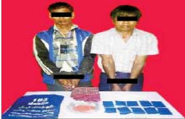
ကျိုင်းတုံ၊ ကလေးမြို့နယ်တို့တွင် စိတ်ကြွဆေးပြားများ သိမ်းဆည်းရမိ