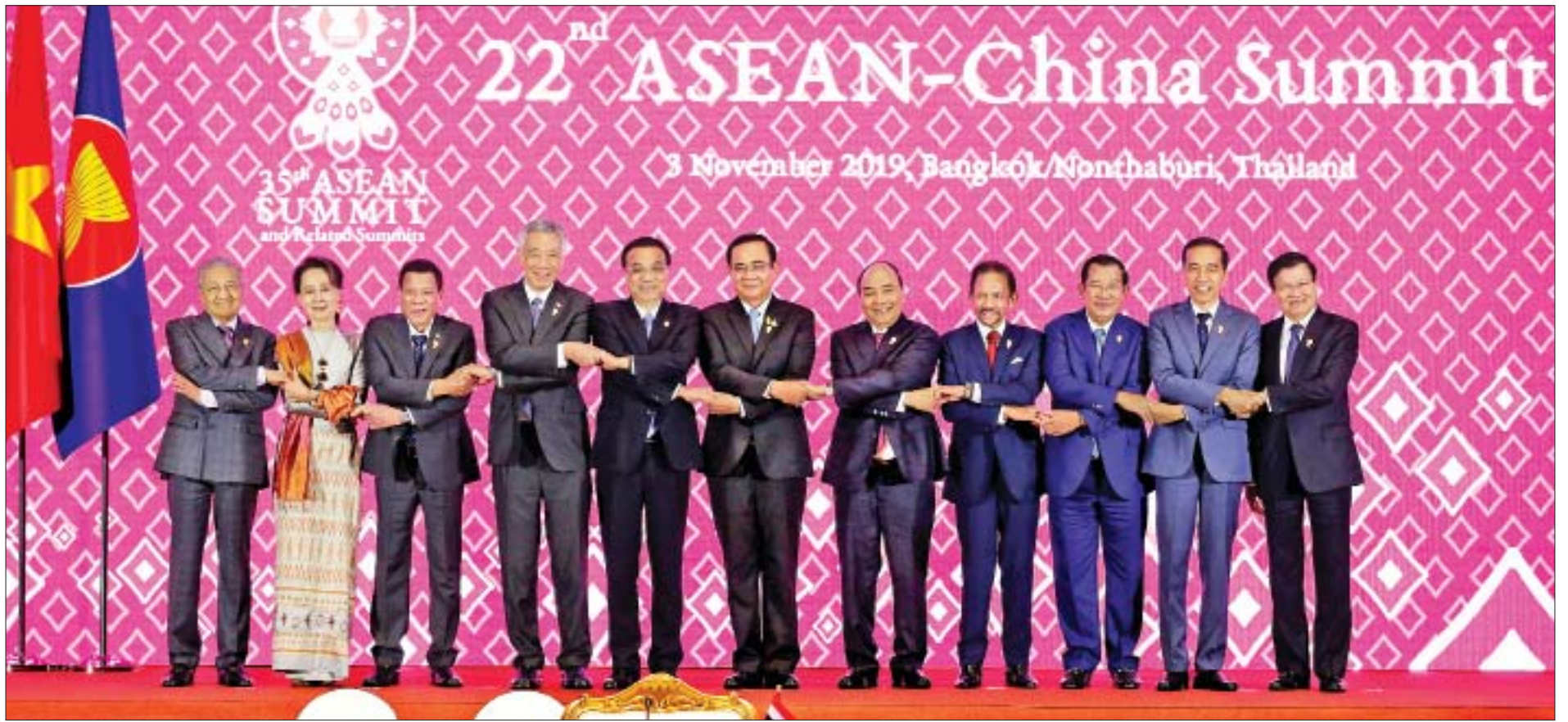
နိုင်ငံတော်၏အတိုင်ပင်ခံပုဂ္ဂိုလ် ဒေါ်အောင်ဆန်းစုကြည် (၂) ကြိမ်မြောက် အာဆီယံ - တရုတ် ထိပ်သီးအစည်းအဝေးသို့ တက်ရောက်လာကြသည့် တရုတ်နှင့် အာဆီယံနိုင်ငံများမှ နိုင်ငံခေါင်းဆောင်များ၊ အစိုးရအဖွဲ့အကြီးအကဲများနှင့် စုပေါင်းမှတ်တမ်းတင်ဓာတ်ပုံရိုက်စဉ်။