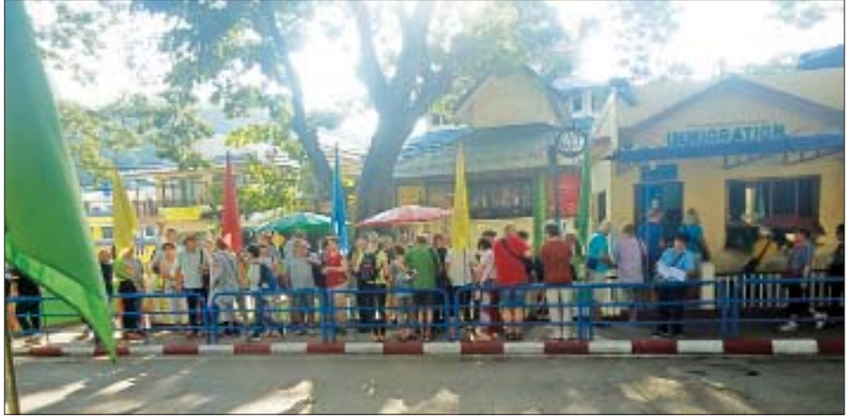
(နိုင်ငံခြားသား) ၁၃၉၈၂ ဦး၊ လန်တောင်းဘုရားသို့ ၉၄၀၄ ဦး၊ ဗီစာ(ဗီစာကင်းလွတ်ခွင့်)ဖြင့် ပြည်တွင်းခရီးစဉ် သို့ ၅၁၇၀၇ ဦး စုစုပေါင်း နိုင်ငံခြားသားခရီးသွားဧည့်သည် ၁၀၅၃၃၄၉ ဦး ဝင်ရောက်လည်ပတ်ခဲ့ကြောင်း သိရသည်။ ဝေယံလင်း(ပြန်/ဆက်)

ဘုရားသို့ ထိုင်းနိုင်ငံသား ၂၁ ဦး၊ ညအိပ်ခရီးစဉ်အဖြစ် မိုင်းဖြတ်နှင့် ကျိုင်းတုံမြို့သို့ ထိုင်းနိုင်ငံသား အများစုပါဝင် သည့် တတိယနိုင်ငံသား ကမ္ဘာလှည့်ခရီးသည် ၄၅၂ ဦး၊ ပြည်တွင်းခရီးစဉ်သို့ ဗီစာဖြင့် (ဗီစာကင်းလွတ်ခွင့်ရ) နိုင်ငံ သားအပါအဝင် နိုင်ငံခြားသားခရီးသွားဧည့်သည် ၁၀၄၃ ဦး ဝင်ရောက်လည်ပတ်ခဲ့သည်။ မြန်မာနိုင်ငံနယ်စပ်ဝင်ပေါက်အသီးသီးမှ ဝင်ရောက်ပြီး တာချီလိတ်နယ်စပ်မှ ထိုင်းနိုင်ငံ မယ်ဆိုင်မြို့သို့ ထွက်ခွာ သည့်ခရီးစဉ်အဖြစ် ယခုနှစ်အတွင်း ခရီးစဉ် ၄၆ ခုတွင် မော်တော်ယာဉ်အစီး ၁၄၀၊ မော်တော်ဆိုင်ကယ် ၁၄၉ စီး၊ လူဦးရေ ၄၈၂ ဦးတို့သည် မြဝတီ၊ တမူးနယ်စပ်မြို့များမှ ဝင်ရောက်လာပြီး ပြည်တွင်းပိုင်းသို့ သွားရောက်လည်ပတ် ကာ တာချီလိတ်မှတစ်ဆင့် ထိုင်းနိုင်ငံ မယ်ဆိုင်မြို့သို့ ထွက်ခွာခဲ့သည်။ တာချီလိတ်နယ်စပ်ဝင်ပေါက်မှ ဇန်နဝါရီ ၁ ရက်မှ အောက်တိုဘာ ၃၁ ရက်အထိ နေ့ချင်းပြန်နှင့် ညအိပ် ခရီးသည် ထိုင်းနိုင်ငံသား ၉၇၇၈၀၁ ဦး၊ တတိယနိုင်ငံသား