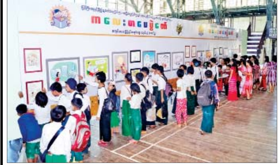
ကားတွန်းပန်းချီလက်ရာများကို လေ့လာသူများဖြင့် စည်ကားလျက်ရှိစဉ်။ ဓာတ်ပုံ-ပေါက်စ(မင်းလှ)