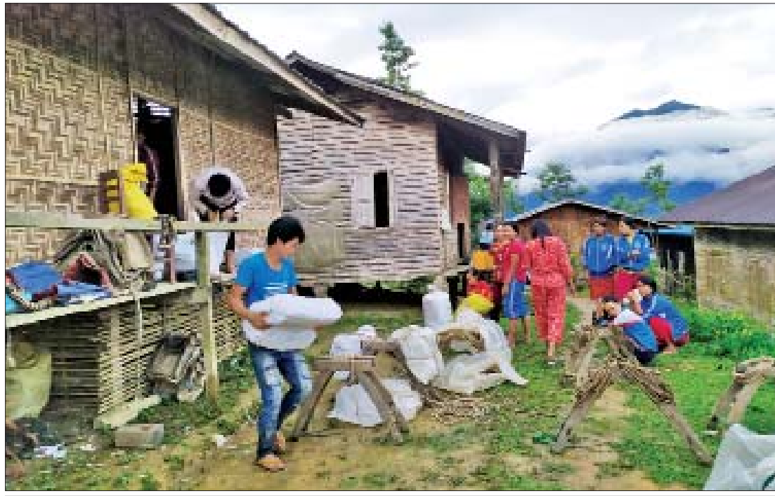
ခေါင်လန်ဖူးမြို့နယ်ပညာရေးမှူးရုံးသို့ ရောက်ရှိလာသော ပုံနှိပ်စာအုပ်များကို တာဝန်ကျ ဆရာမများနှင့် တစ်ပါတည်းထည့်ပေးလိုက်ရန် လားနှင့်တင်ပေးနိုင်ရေး ပြင်ဆင်နေကြစဉ်။

ခေါင်လန်ဖူးရောက် ဆရာဆရာမများဒုက္ခ ဆန်းလွတ်ချက် တောင်ခြေရင်း ချောင်း တစ်ကမ်းတွင် လားစခန်းရှိသော်လည်း လား များ ပုံမှန်မရှိ။ ဝန်စည်စလယ် သယ်ဆောင်ရန် လားကိုသာ အားထားနေရပြီးလားများကို လမ်းတစ်လျှောက် သယ်ဆောင်ရေးလုပ်ငန်း များ၌ အသုံးပြုနေကြရသည်။ ဆရာ ဆရာမ များ ခေါင်လန်ဖူးသို့ ရောက်ရှိကြသော်လည်း