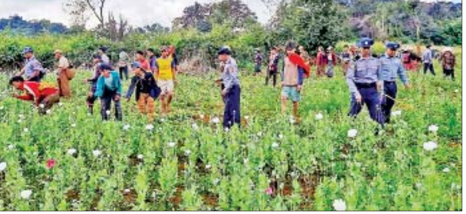
သုံးမိုင်ခန့်အကွာ အမြင့်သုံးလက်မခန့်ရှိ သက်ဆိုင်ရာ ရဲစခန်းများမှ တပ်ဖွဲ့ဝင် ဆောင်ရွက်ခဲ့ကြောင်း သိရသည်။ ဘိန်းခင်း ၁ ဒဿမ ၅ ဧကခန့်တို့အား များနှင့် ပူးပေါင်းအဖွဲ့က ဖျက်ဆီး ရဲပြန်ကြား