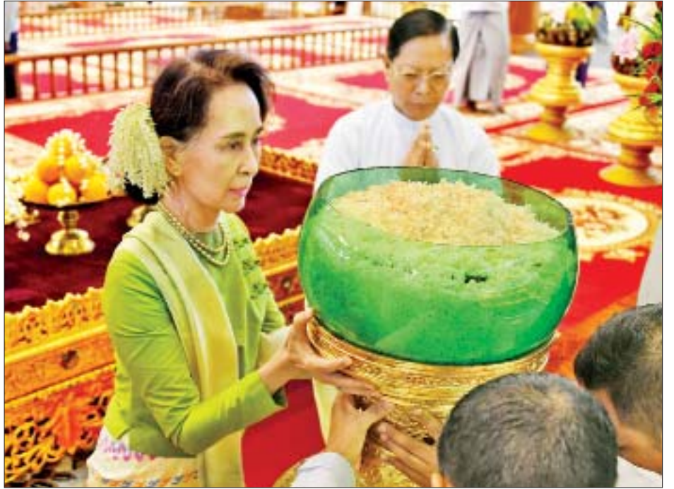
နိုင်ငံတော်၏အတိုင်ပင်ခံပုဂ္ဂိုလ် ဒေါ်အောင်ဆန်းစုကြည် သာသနာ့မဟာဗိမာန်တော်အတွင်းရှိ ဗုဒ္ဓရုပ်ပွားတော် မြတ်အား မြသပိတ်ဆွမ်းတော် ဆက်ကပ်လှူဒါန်းစဉ်။