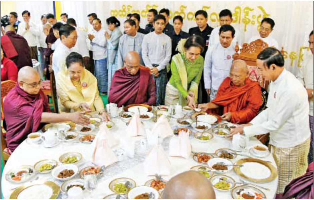
နိုင်ငံတော်သံဃမဟာနာယကအဖွဲ့ဥက္ကဋ္ဌ ဗန်းမော်ကျောင်းတိုက် ဆရာတော် ဒေါက်တာ ဘဒ္ဒန္တကုမာရာဘိဝံသ အမျိုးပြုသော ဆရာတော်၊ သံဃာတော်များအား နိုင်ငံတော်သမ္မတ ဦးဝင်းမြင့်နှင့်ဇနီး ဒေါ်ချိုချို၊ နိုင်ငံတော်၏အတိုင်ပင်ခံပုဂ္ဂိုလ် ဒေါ်အောင်ဆန်းစုကြည်နှင့် ဧည့်ပရိသတ်များက နေ့ဆွမ်းဆက်ကပ်လှူဒါန်းကြသည်။

အခမ်းအနားအပြီးတွင် နိုင်ငံတော်သံဃမဟာနာယကအဖွဲ့ဥက္ကဋ္ဌ ဗန်းမော်ဆရာတော် အမျိုးပြုသော ဆရာတော်၊ သံဃာတော်များအား နိုင်ငံတော်သမ္မတ ဦးဝင်းမြင့်နှင့်ဇနီး ဒေါ်ချိုချို၊ နိုင်ငံတော်၏အတိုင်ပင်ခံပုဂ္ဂိုလ် ဒေါ်အောင်ဆန်း