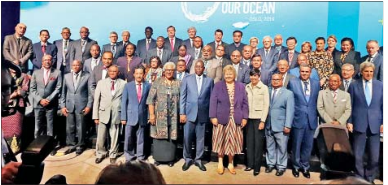
ဆောင်ရွက်မည့် အစီအစဉ်များကို ဆွေးနွေးခဲ့ကြသည်။

ယင်းနောက် ပြည်ထောင်စုဝန်ကြီးသည် တောင်ကိုရီးယားသမ္မတနိုင်ငံ ပင်လယ်၊ သမုဒ္ဒရာနှင့် ငါးလုပ်ငန်းဝန်ကြီး Mr. Moon Seong-hyeok နှင့်တွေ့ဆုံပြီး နှစ်နိုင်ငံ ငါးလုပ်ငန်းဖွံ့ဖြိုးရေးဆိုင်ရာ လုပ်ငန်းရပ်များနှင့် အပြန်အလှန် ပူးပေါင်း