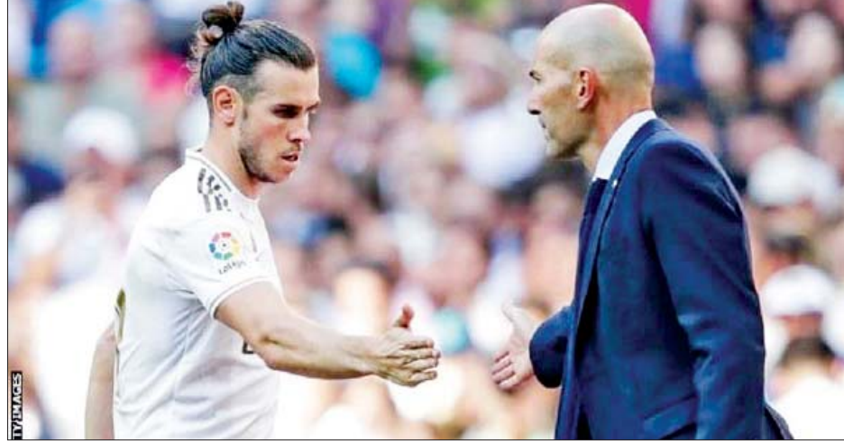
ငွေကြယ် - စုစည်းသည်

နိုင်ခဲ့တာ ဖြစ်ပါတယ်။ ရီးယဲလ်မက်ဒရစ်အသင်းဟာ တိုက်စစ်မှူးဂါရတ်ဘေးလ်ကို ၂၀၁၃ ခုနှစ် စက်တင်ဘာလက ကမ္ဘာ့စံချိန်တင်ပြောင်းရွှေ့ကြေး ပေါင် ၈၅ ဒသမ ၃ သန်းနဲ့ စပါးအသင်းဆီက နေ ခေါ်ယူခဲ့တာ ဖြစ်ပါတယ်။ တိုက်စစ်မှူး ဂါရတ်ဘေးလ်အနေနဲ့ ရီးယဲလ်မက်ဒရစ်အသင်းနဲ့အတူ ချန်ပီယံလိဂ်ဖလား လေးကြိမ်၊ ကမ္ဘာ့ကလပ်အသင်းများဖလား သုံးကြိမ်၊ ယူအီးအက်ဖ်အေစူပါဖလား သုံးကြိမ်၊ လာလီဂါဖလားတစ်ကြိမ်နဲ့ စပိန်ကိုပါဒယ်ရေးဖလား တစ်ကြိမ်တို့ကို ရယူပေးနိုင်ခဲ့တာ ဖြစ်ပါတယ်။