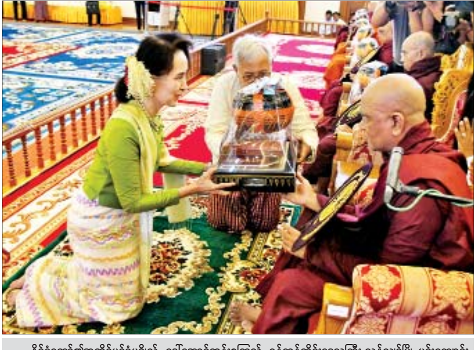
နိုင်ငံတော်၏အတိုင်ပင်ခံပုဂ္ဂိုလ် ဒေါ်အောင်ဆန်းစုကြည် ရန်ကုန်တိုင်းဒေသကြီး သန်လျင်မြို့ မင်းကျောင်း ပထမပြန်ပရိယတ္တိစာသင်တိုက် ပဓာနနာယက အဂ္ဂမဟာ ပဏ္ဍိတ အဂ္ဂမဟာသဒ္ဓမ္မဇောတိကဓဇ ဒေါက်တာ ဘဒ္ဒန္တစန္ဒိမာ တိဝံသထံ ကထိန်သင်္ကန်းနှင့် လှူဖွယ်ဝတ္ထုပစ္စည်းများ ဆက်ကပ်လှူဒါန်းစဉ်။

အခမ်းအနားသို့ နိုင်ငံတော်သံဃမဟာနာယကအဖွဲ့ဝင် ဗန္ဓုလေးမြို့ ဗန်းမော်ကျောင်းတိုက် ပဓာနနာယက အဘိဓမ္မမဟာရဋ္ဌဂုရု အဘိဓမ္မအဂ္ဂမဟာ သဒ္ဓမ္မဇောတိက ဒေါက်တာဘဒ္ဒန္တကုမာရာဘိဝံသ အမျိုးပြုသော ဆရာတော်၊ သံဃာတော်များ ကြွရောက် ချီးမြှင့်တော်မူကြပြီး ဒုတိယသမ္မတ ဦးမြင့်ဆွေနှင့်ဇနီး ဒေါ်ခင်သက်ဌေး၊ ဒုတိယသမ္မတ ဦးဟင်နရီဗန်ထီးယူ၊ အမျိုးသားလွှတ်တော်ဥက္ကဋ္ဌ မန်းဝင်းခိုင်သန်း၏ဇနီး နုန့်ကြင်ကြည်၊ ပြည်ထောင်စုတရားသူကြီးချုပ် ဦးထွန်း ထွန်းဦး၊ နိုင်ငံတော်ဖွဲ့စည်းပုံအခြေခံဥပဒေဆိုင်ရာ ခုံရုံးဥက္ကဋ္ဌ ဦးမျိုးညွန့်၊ ပြည်ထောင်စုရွေးကောက်ပွဲကော်မရှင်ဥက္ကဋ္ဌ ဦးလှသိန်းနှင့်ဇနီး ဒေါ်အေးသီတာ၊ ဒုတိယတပ်မတော်ကာကွယ်ရေးဦးစီးချုပ်၊ ကာကွယ်ရေးဦးစီးချုပ်(ကြည်း) ဒုတိယဗိုလ်ချုပ်မှူးကြီးစိုးဝင်းနှင့်ဇနီး ဒေါ်သန်းသန်းနွယ်၊ ပြည်သူ့လွှတ်တော် ဒုတိယဥက္ကဋ္ဌ ဦးထွန်းထွန်းဟိန်၏ဇနီး ဒေါက်တာစိန်စိန်သိမ်း၊ အမျိုးသား လွှတ်တော်ဒုတိယဥက္ကဋ္ဌ ဦးအေးသာအောင်၊ ပြည်ထောင်စုဝန်ကြီးများ၊ ပြည်ထောင်စုရှေ့နေချုပ်၊ ပြည်ထောင်စုစာရင်းစစ်ချုပ်၊ ပြည်ထောင်စုရာထူး ဝန်အဖွဲ့ဥက္ကဋ္ဌ၊ ငြိမ်းချမ်းရေးကော်မရှင်ဥက္ကဋ္ဌ၊ နေပြည်တော်ကောင်စီဥက္ကဋ္ဌ၊ အမျိုးသားလူ့အခွင့်အရေးကော်မရှင်ဥက္ကဋ္ဌ၊ မြန်မာနိုင်ငံတော် ဗဟိုဘဏ်ဥက္ကဋ္ဌ၊ ညှိနှိုင်းကွပ်ကဲရေးမှူး (ကြည်း၊ ရေ၊ လေ)၊ နေပြည်တော်တိုင်းစစ်ဌာနချုပ် တိုင်းမှူး၊ ဒုတိယဝန်ကြီးများ၊ ဒုတိယရှေ့နေချုပ်၊ နေပြည်တော်ကောင်စီဝင်များနှင့် ၎င်းတို့၏ဇနီးများ၊ ဌာနဆိုင်ရာ အကြီးအကဲများနှင့် တာဝန်ရှိသူများ တက်ရောက် ကြည့်ကြည့်ကြသည်။ အခမ်းအနားမစတင်မီ နိုင်ငံတော်၏အတိုင်ပင်ခံပုဂ္ဂိုလ် ဒေါ်အောင်ဆန်း စုကြည်က သာသနာ့မဟာဗိမာန်တော်အတွင်းရှိ ဗုဒ္ဓရုပ်ပွားတော်မြတ်အား မြသပိတ်ဆွမ်းတော်၊ သစ်သီး၊ ပန်းမန်၊ သောက်တော်ရေချမ်းတို့ကို ဆက်ကပ် လှူဒါန်းသည်။