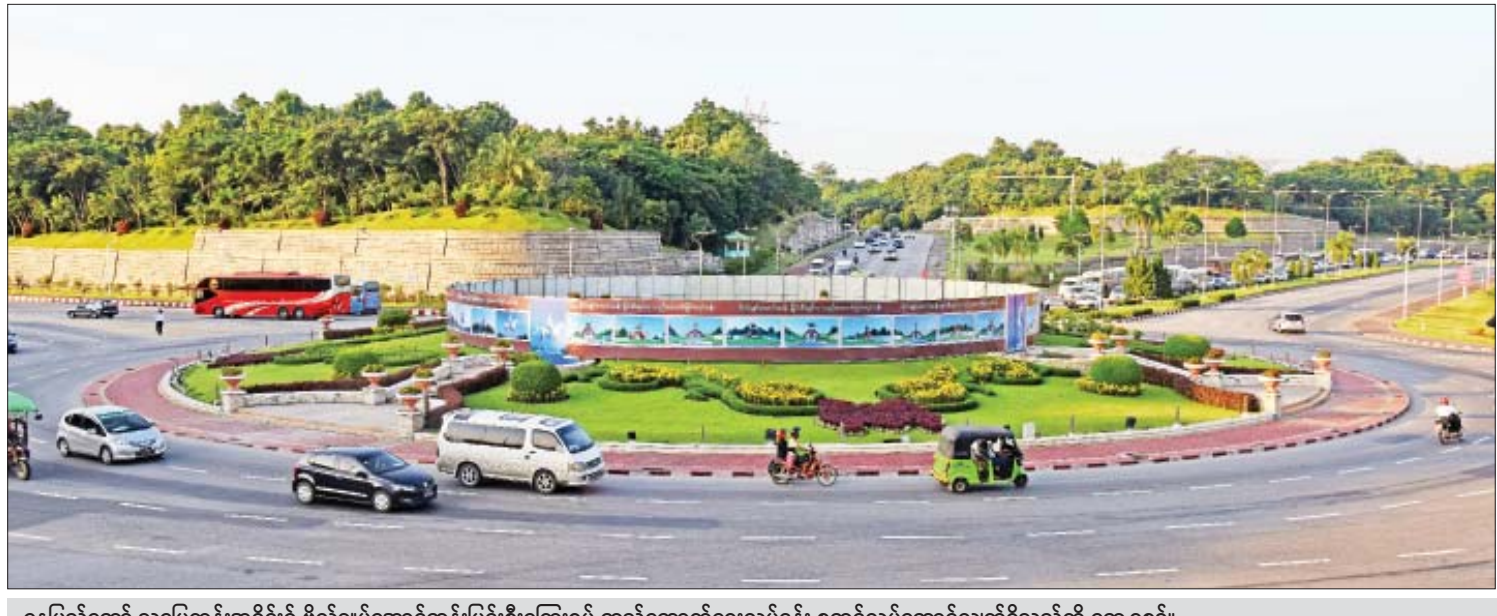
နေပြည်တော် သပြေကုန်းအပိုင်း၌ ဗိုလ်ချုပ်အောင်ဆန်းမြင်းစီးကြေးရုပ် တည်ဆောက်ရေးလုပ်ငန်း စတင်လုပ်ဆောင်လျက်ရှိသည်ကို တွေ့ရစဉ်။

ကျွန်တော်က ဆပ်ကော်မတီမှာလည်း ပါဝင်သလို ကိုယ်တိုင်ပါဝင်လျှာဒါန်းတာ လည်း ရှိပါတယ်။ ဗိုလ်ချုပ်ကြေးရုပ်တွေ ကတော့ တစ်နိုင်လုံးမှာ ထုလုပ်နေကြတာ ဖြစ်ပါတယ်။ အခု နေပြည်တော် သပြေကုန်း အပိုင်းမှာ ဗိုလ်ချုပ်မြင်းစီးကြေးရုပ် တည် ဆောက်မယ်ဆိုတော့ ကျွန်တော်တို့ စိုးလျှပ် စစ်ဖောင်းဒေးရှင်းအနေနဲ့လည်း ဝင်ရောက် လျှာဒါန်းတာ ဖြစ်ပါတယ်။ ကျွန်တော်တို့ပါဝင် လျှာဒါန်းဖြစ်တဲ့ အကြောင်းရင်းရှိပါတယ်။ ရုပ်တုဆိုတာက သက်ရှိထင်ရှားမဟုတ်ဘူး။ ဒါပေမယ့် နိုင်ငံတော်က ဘာလို့စိုက်ထု တယ်။