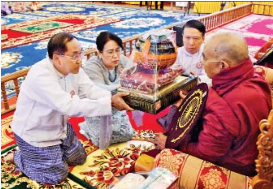
ဒုတိယသမ္မတ ဦးမြင့်ဆွေနှင့်ဇနီး ဒေါ်ခင်သက်ဌေး ဆရာတော်ထံ ကထိန်သင်္ကန်းနှင့် လှူဖွယ်ဝတ္ထုပစ္စည်းများ ဆက်ကပ်လှူဒါန်းစဉ်။