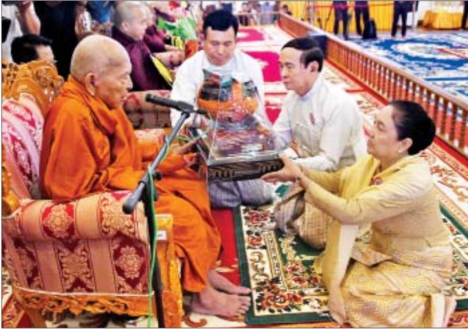
နိုင်ငံတော်သမ္မတ ဦးဝင်းမြင့်နှင့်ဇနီး ဒေါ်ချိုချို၊ နိုင်ငံတော် သံဃမဟာနာယကအဖွဲ့ဥက္ကဋ္ဌ မန္တလေးမြို့ ဗန်းမော် ကျောင်းတိုက်ဆရာတော် ဒေါက်တာဘဒ္ဒန္တကုမာရာဘိဝံသထံ ကထိန်သင်္ကန်းနှင့် လှူဖွယ်ဝတ္ထုပစ္စည်းများ ဆက်ကပ် လှူဒါန်းစဉ်။