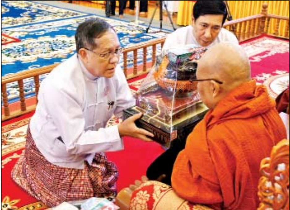
ပြည်ထောင်စုတရားသူကြီးချုပ် ဦးထွန်းထွန်းဦး ဆရာတော်ထံ ကထိန်သင်္ကန်းနှင့် လှူဖွယ်ဝတ္ထုပစ္စည်းများ ဆက်ကပ်လှူဒါန်းစဉ်။