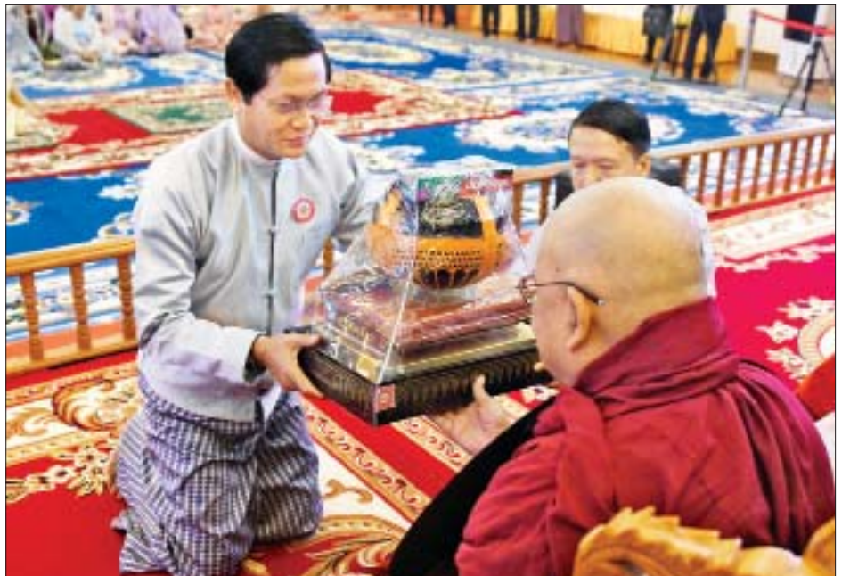
ဒုတိယသမ္မတ ဦးဟင်နရီဗန်ထီးယူ ဆရာတော်ထံ ကထိန်သင်္ကန်းနှင့် လှူဖွယ်ဝတ္ထုပစ္စည်းများ ဆက်ကပ်လှူဒါန်း စဉ်။