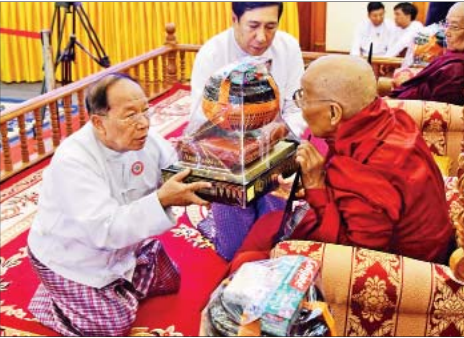
နိုင်ငံတော်ဖွဲ့စည်းပုံအခြေခံဥပဒေဆိုင်ရာခုံရုံးဥက္ကဋ္ဌ ဦးမျိုးညွန့် ဆရာတော်ထံ ကထိန်သင်္ကန်းနှင့် လှူဖွယ်ဝတ္ထုပစ္စည်းများ ဆက်ကပ်လှူဒါန်းစဉ်။