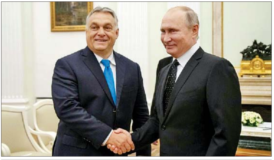
ဟန်ဂေရီဝန်ကြီးချုပ် ဗစ်တာ အော်ဘန်နှင့် ရုရှားသမ္မတ ဗလာဒီမီယာပူတင်

တစ်ခုဖြစ်ပွားခဲ့ပြီး အမေရိကန်တပ်ဖွဲ့ဝင်တစ်ဦး အပါအဝင် အခြားလူ ၁၀ ဦးထက်မနည်း သေဆုံးခဲ့ပြီးနောက် အမေရိကန်သမ္မတ ဒေါ်နယ်ထရန်က အမေရိကန်နှင့် တာလီဘန်အုပ်စုအကြား ငြိမ်းချမ်းရေးဆွေးနွေးမှုကို ပျက်သိမ်းခဲ့ခြင်းဖြစ်သည်။ ထို့အပြင် ဇာလ်မေခါလီလ်ဇော်ကို ပါကစ္စတန်ဝန်ကြီးချုပ် အိမရန်ခန်းက အောက်တိုဘာ ၂၈ ရက်တွင် လက်ခံတွေ့ဆုံခဲ့ပြီး တွေ့ဆုံစဉ်စစ်မက်ဖြစ်ပွားရာ အာဖဂန်နစ္စတန်၌ ငြိမ်းချမ်းရေးရရှိရေးနှင့် စေ့စပ်ညှိနှိုင်းမှုများအတွက် အမေရိကန်ပြည်ထောင်စု၏ ကြိုးပမ်းလုပ်ဆောင်နေမှုအပေါ် ပါကစ္စတန်အနေဖြင့် ထောက်ခံအားပေးသလို ရပ်တန့်နေသော အာဖဂန်ငြိမ်းချမ်းရေးဆွေးနွေးမှုပြန်လည်စတင်ရေးအတွက် အခက်အခဲနှင့် အဟန့်အတားများအား ဖယ်ရှားရာတွင်လည်း ပါကစ္စတန်အနေဖြင့် အကူအညီပေးမည်ဖြစ်ကြောင်း အိမရန်ခန်းက ထုတ်ဖော်ပြောကြားခဲ့သည်။ အမေရိကန်သံတမန်သည် အာဖဂန်ငြိမ်းချမ်းရေးလုပ်ငန်းစဉ်နှင့်စပ်လျဉ်း၍ ပါကစ္စတန်ခေါင်းဆောင်များနှင့် နိုင်ငံရေးသမားများအား တွေ့ဆုံခဲ့ပြီးနောက် ပါကစ္စတန်အရပ်ဘက်နှင့် စစ်ဘက်ခေါင်းဆောင်များကိုလည်း တွေ့ဆုံခဲ့ကြောင်း သိရသည်။ အာဖဂန်နစ္စတန်နယ်ဖွား အမေရိကန်ဝါရှင်တန်တစ်ဦးဖြစ်သူ ဇာလ်မေခါလီလ်ဇော်သည် အာဖဂန်နစ္စတန်နိုင်ငံမှ အမေရိကန်တပ်ဖွဲ့အများစု ရပ်သိမ်းရေးနှင့် အာဖဂန်နစ္စတန်စစ်ပွဲ အဆုံးသတ်ရေးအတွက် သဘောတူချက်တစ်ရပ် ဖော်ဆောင်နိုင်ရန် အမေရိကန်နှင့်တာလီဘန်အုပ်စုအကြား ညှိနှိုင်းဆွေးနွေးမှုများကို တစ်နှစ်ကြာ ဦးဆောင်လာခဲ့သည်။ ကိုးကား - ဆင်ဟွာ၊ ဘာသာပြန် - ဂျေတီ