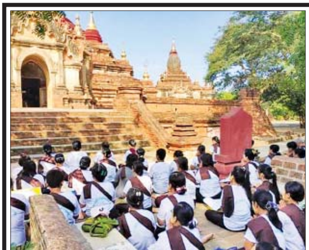
နေပြည်တော်ရှိ လက်လုပ်တောင်တောရတွင် တရားကျင့်ကြံအားထုတ် လျက်ရှိသည့် ယောဂီ ၈၅ ဦးနှင့် ဓမ္မချစ်ခင်သူတော်စင်များက ပေါင်းစုပြီး အောက်တိုဘာ ၂၇ ရက်နှင့် ၂၈ ရက်တို့တွင် ပုဂံရှိ ပြည့်ငါးပြည့်ဘုရားများ၌ စုပေါင်းကုသိုလ်ပြုခဲ့ကြသည်။ ကိုကိုရူပ (နေပြည်တော်)