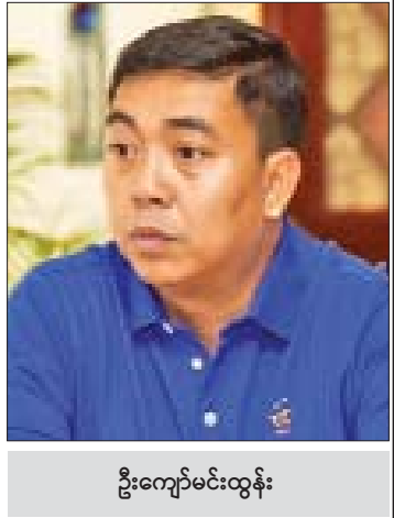
ဦးကျော်မင်းထွန်း

ပထမအဆင့်က ဗိုလ်ချုပ်ရုပ်တုအတွက် ပုံကြမ်းထုတ်ရပါသည်။ ဗိုလ်ချုပ်ပုံ ပုံကြမ်း ထုတ်ပြီးရင် သက်ဆိုင်ရာ နိုင်ငံ့အကြီးအကဲ တွေကိုပြပြီး အတည်ပြုချက် ယူရပါသည်။ ကိုယ်နေဟန်ထား၊ အသွင်အပြင် အတည်ပြု ချက်ရပါပြီ။ အတည်ပြုချက်ရပြီးဆိုရင် ဒုတိယအဆင့်က ရွံ့နဲ့လိုချင်တဲ့ ပုံစံကို အရင် ပုံဖော်ရပါသည်။ ဗိုလ်ချုပ်ရုပ်တုအတွက် ရွံ့ရုပ်လုပ် တာလည်း ပြီးစီးသွားပါပြီ။ တတိယအဆင့် အနေနဲ့ ဒီရွံ့ရုပ်ကို ကြေးသွန်းဖို့အတွက် မိုယူနေပါပြီ။ မိုထွက်ပြီဆိုတာနဲ့ ကြေးသွန်း မှာ ဖြစ်ပါတယ်။ လက်ရှိမှာ ကြေးသွန်းဖို့ အတွက် မိုယူတဲ့အဆင့်ကို ရောက်နေပါပြီ။ ကြေးသွန်းတဲ့အခါမှာတော့ ရုပ်တုကကြီးတဲ့ အတွက် အပိုင်းလိုက် ကြေးသွန်းမှာ ဖြစ်ပါ တယ်။