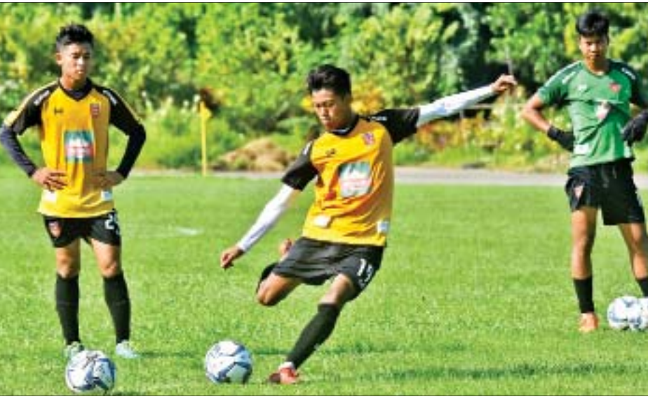
မြန်မာ ယူ-၁၉ အသင်း လေ့ကျင့်နေစဉ်။

ရန်ကုန် အောက်တိုဘာ ၃၀ မြန်မာနိုင်ငံက အိမ်ရှင်အဖြစ် လက်ခံကျင်းပမည့် ၂၀၂၀ အာရှ ယူ-၁၉ ခြေစစ်ပွဲအတွက် မြန်မာအသင်းသည် နောက်ဆုံးပြင်ဆင်မှုအဖြစ် ခြေစမ်းပွဲတစ်ပွဲ ထပ်မံကစားမည်ဖြစ်သည်။ မြန်မာ ယူ-၁၉ အသင်းသည် ခြေစစ်ပွဲမတိုင်မီ နောက်ဆုံးပြင်ဆင်မှုအဖြစ် အောက်တိုဘာ ၃၁ ရက် (ယနေ့) ညနေပိုင်းတွင် မြန်မာနေရှင်နယ်လိဂ်ကလပ် ဟံသာဝတီအသင်းနှင့် ယှဉ်ပြိုင်ကစားမည်ဖြစ်သည်။ ခြေစမ်းပွဲသုံးပွဲကစားရန် စီစဉ်ထား မြန်မာ ယူ-၁၉ အသင်းအနေဖြင့် အကောင်းဆုံး ယှဉ်ပြိုင်နိုင်ရန် အပြီးသတ်ပြင်ဆင်နေပြီး အောက်တိုဘာ နောက်ဆုံးပတ်တွင် ခြေစမ်းပွဲသုံးပွဲကစားရန် စီစဉ်ထားခြင်း ဖြစ်သည်။ မြန်မာ ယူ-၁၉ အသင်းသည် ယင်းသုံးပွဲတွင် နှစ်ပွဲကစားထားပြီးဖြစ်သောကြောင့် နောက်ဆုံးတစ်ပွဲ ကစားရန်သာ ကျန်ရှိတော့ပြီး ဟံသာဝတီအသင်းနှင့် ကစားခြင်းဖြစ်သည်။ မြန်မာ ယူ-၁၉ အသင်းသည် အောက်တိုဘာ ၂၄ ရက်တွင် ကစားသည့် ခြေစမ်းပွဲ၌ စာမျက်နှာ ၆ ကော်လံ ၃ သို့ ❖