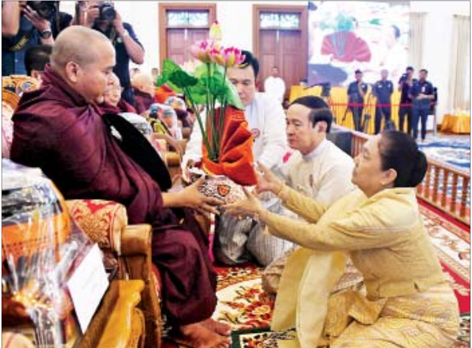
နိုင်ငံတော်သမ္မတ ဦးဝင်းမြင့်နှင့်ဇနီး ဒေါ်ချိုချို ကထိန်အလှူခံ ဆရာတော် ပျဉ်းမနားမြို့ မဟာဓမ္မိကာရာမ အနန်းတော်ကျောင်းတိုက် ပဓာနနာယက ဘဒ္ဒန္တ တိဿထံ ကထိန်လျာသင်္ကန်း ဆက်ကပ်လှူဒါန်းစဉ်။

နေပြည်တော် အောက်တိုဘာ ၃၀ ပြည်ထောင်စုသမ္မတမြန်မာနိုင်ငံတော်အစိုးရ၏ ၂၀၁၉ ခုနှစ် ကထိန်သင်္ကန်း ဆက်ကပ်လှူဒါန်းပွဲအခမ်းအနားကို ယနေ့နံနက် ၉ နာရီခွဲတွင် နေပြည်တော်ရှိ ဥပ္ပါတသန္တိစေတီတော် သာသနာ့မဟာဗိမာန်တော်၌ကျင်းပရာ နိုင်ငံတော်သမ္မတ ဦးဝင်းမြင့်နှင့်ဇနီး ဒေါ်ချိုချို၊ နိုင်ငံတော်၏အတိုင်ပင်ခံပုဂ္ဂိုလ် ဒေါ်အောင်ဆန်းစုကြည်တို့ တက်ရောက်ကြည့်ကြည့်ပြီး ကထိန်လျာသင်္ကန်း၊ ကထိန်သင်္ကန်းနှင့် လှူဖွယ်ဝတ္ထုပစ္စည်းများကို ဆက်ကပ်လှူဒါန်းကြသည်။