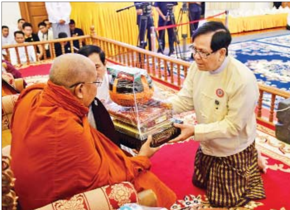
အမျိုးသားလွှတ်တော် ဒုတိယဥက္ကဋ္ဌ ဦးအေးသာအောင် ဆရာတော်ထံ ကထိန်သင်္ကန်းနှင့် လှူဖွယ်ဝတ္ထုပစ္စည်းများ ဆက်ကပ်လှူဒါန်းစဉ်။ (သတင်း-ရှေ့ဖုံး)