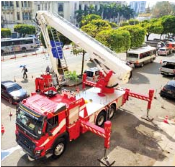
ရှာဖွေ ကယ်ဆယ်ရေးလုပ်ငန်းများ အတွက် အသုံးပြုရန်ဖြစ်ကြောင်း အောင်သူရ

ရန်ကုန် အောက်တိုဘာ ၂၀ ရန်ကုန်တိုင်းဒေသကြီး ကျောက် တံတားမြို့နယ် မီးသတ်စခန်းတွင် အောက်တိုဘာ ၂၀ ရက် နံနက် ၈ နာရီ က နိုင်ငံတကာအဆင့်မီ Hydraulic Platform Vehicle 48 meter ယာဉ် ဖြင့် ကျောက်တံတားနှင့် စမ်းချောင်း မြို့နယ်တို့မှ မီးသတ်တပ်ဖွဲ့ဝင်များ ပူးပေါင်းလေ့ကျင့်ကြသည်။ အဆိုပါယာဉ်မှာ ပိုလန်နိုင်ငံမှ ထုတ်လုပ်ပြီး အမြင့် ၄၈ မီတာရှိ ရာ မီးငြိမ်းသတ်ရေးနှင့် ရှာဖွေ ကယ်ဆယ်ရေးတွင် အသုံးပြုနိုင်မည် ဖြစ်သည်။ ၎င်းယာဉ်ကို မြန်မာနိုင်ငံ မီးသတ်တပ်ဖွဲ့ဌာနချုပ်တွင် တစ်စီး၊ ရန်ကုန်တိုင်းဒေသကြီးတွင် နှစ်စီး၊ မန္တလေးတိုင်းဒေသကြီးတွင် တစ်စီး ထားရှိပြီး မီးငြိမ်းသတ်ရေးနှင့်