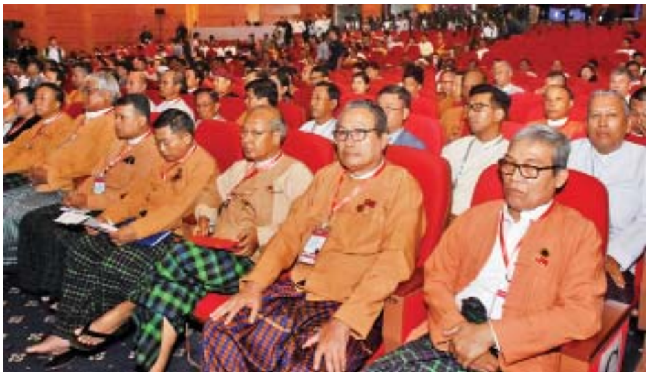
(NCA) (၄)နှစ်မြောက် နှစ်ပတ်လည်အခမ်းအနားသို့ တက်ရောက်လာကြသူများကို တွေ့ရစဉ်။