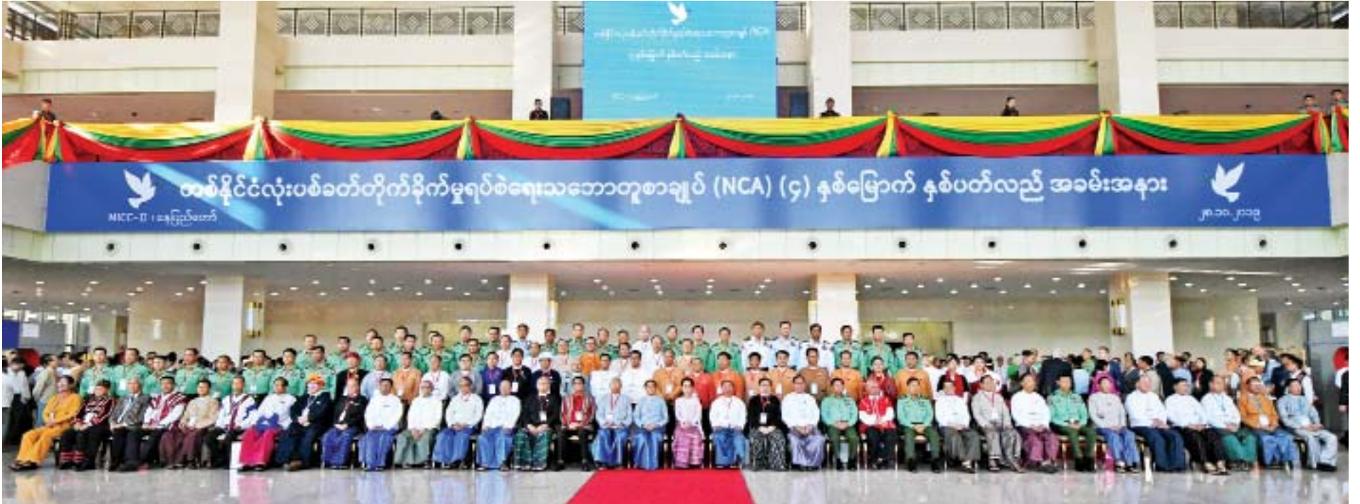
နိုင်ငံတော်သမ္မတ ဦးဝင်းမြင့်၊ နိုင်ငံတော်၏အတိုင်ပင်ခံပုဂ္ဂိုလ် ဒေါ်အောင်ဆန်းစုကြည်၊ နိုင်ငံတော်သမ္မတ(ငြိမ်း) ဦးထင်ကျော်၊ ဒုတိယသမ္မတများ၊ လွှတ်တော်ဥက္ကဋ္ဌများ၊ ပြည်ထောင်စုတရားသူကြီးချုပ်၊ တပ်မတော်ကာကွယ်ရေးဦးစီးချုပ်၊ တိုင်းရင်းသားခေါင်းဆောင်များနှင့်အဖွဲ့၊ အစိုးရ၊ လွှတ်တော်၊ တပ်မတော်ကိုယ်စားလှယ်များ စုပေါင်းမှတ်တမ်းတင်ဓာတ်ပုံရိုက်စဉ်။

အခမ်းအနားသို့ တက်ရောက်လာကြသူများအား ဂုဏ်ပြုညစာစားပွဲဖြင့် တည်ခင်းစဉ်ခံသည်။ ညစာစားပွဲသို့ နိုင်ငံတော်သမ္မတ ဦးဝင်းမြင့်၊ နိုင်ငံတော်သမ္မတ(ငြိမ်း) ဦးထင်ကျော်၊ ဒုတိယသမ္မတများ၊ လွှတ်တော်ဥက္ကဋ္ဌများ၊ ပြည်ထောင်စုတရားသူကြီးချုပ်၊ တပ်မတော်ကာကွယ်ရေးဦးစီးချုပ်၊ တိုင်းရင်းသားလက်နက်ကိုင်အဖွဲ့အစည်းများမှ ခေါင်းဆောင်များနှင့် အဖွဲ့ဝင်များ၊ ဖိတ်ကြားထားသော ဧည့်သည်တော်များ တက်ရောက်ကြသည်။ ညစာစားပွဲတွင် နိုင်ငံတော်သမ္မတ ဦးဝင်းမြင့်နှင့် နိုင်ငံတော်၏အတိုင်ပင်ခံပုဂ္ဂိုလ် ဒေါ်အောင်ဆန်းစုကြည်တို့သည် ညစာစားပွဲသို့ တက်ရောက်လာကြသူများအား ရင်းရင်းနှီးနှီး လိုက်လံနှုတ်ဆက်ကြသည်။ သတင်းစဉ်