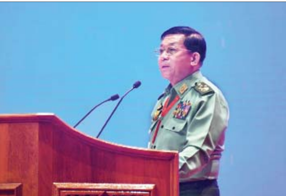
တပ်မတော်ကာကွယ်ရေးဦးစီးချုပ် ဗိုလ်ချုပ်မှူးကြီးမင်းအောင်လှိုင် အမှာစကား ပြောကြားစဉ်။

သဘောထားကွဲလွဲနေတဲ့ “ခွဲမထွက်ရ”ဆိုတဲ့စကားရပ်နဲ့ ပတ်သက်ပြီး ဘာကြောင့် လိုအပ်တယ်ဆိုတဲ့အကြောင်း၊ တိုင်းရင်းသားပြည်သူလူထုရဲ့အကျိုးကို ရှေးရှုပြီး ၂၀၁၅ ခုနှစ်အတွင်း ဖွဲ့စည်းပုံအခြေခံဥပဒေ (၂၀၀၈ ခုနှစ်) ဇယား- ၂ နဲ့ ဇယား-၅ တို့ကို ပြင်ဆင်ဖြည့်စွက်လုပ်ပိုင်ခွင့်တွေ ထပ်မံတိုးချဲ့ပုံများ၊ တပ်မတော်ရဲ့သမိုင်းနဲ့ တစ်ခုတည်း သော တပ်မတော်စွဲတို့ကို နောက်ခံသမိုင်းကြောင်းများနဲ့ တကွ ကျယ်ကျယ်ပြန့်ပြန့် ရှင်းပြပြောဆိုခဲ့ပါတယ်။ ဒါတွေ ကို ထပ်မံပြောပြရတာဟာ တပ်မတော်ရဲ့ NCA အပေါ်မှာ ရပ်တည်ချက်၊ ငြိမ်းချမ်းရေးအပေါ် သဘောထားနဲ့ ပြည်ထောင်စုဖွံ့ဖြိုးရေး၊ တိုင်းရင်းသားစည်းလုံးညီညွတ် ရေးတို့အပေါ် အလေးအနက်ထားရှိမှုကို ပိုမိုပေါ်လွင်စေချင် လို့ဖြစ်ပါတယ်။ တပ်မတော်အနေနဲ့ NCA အပေါ်မှာပဲ ရပ်တည်ပြီး ငြိမ်းချမ်းရေးလုပ်ငန်းစဉ်များကို ခိုင်ခိုင်မာမာ ဆောင်ရွက်သွားမှာ ဖြစ်ပါတယ်။