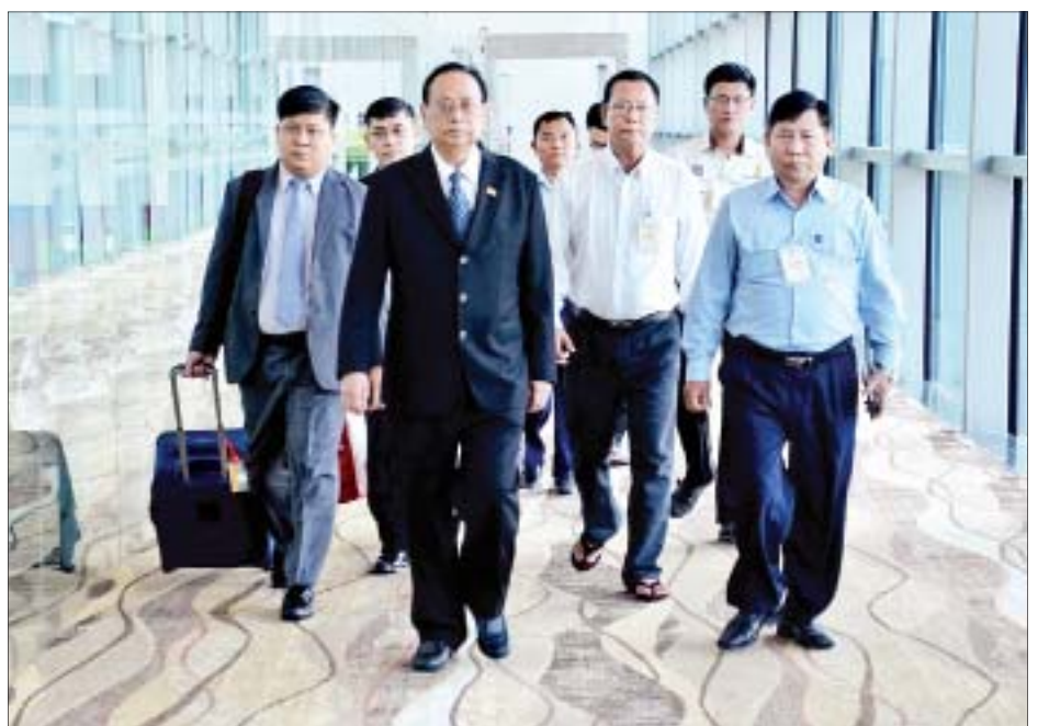
Conference & Exhibition စသည့် အစီအစဉ်များ ပါဝင်မည်ဖြစ်ပြီး ဒေသတွင်း စွမ်းအင်ဆိုင်ရာဝန်ကြီးများ၊ ကျွမ်းကျင်ပညာရှင်များ၊ စာတမ်းဖတ်ကြားသူများ၊ အပြည်ပြည်ဆိုင်ရာ ချင်းဖလှယ် ဆွေးနွေးကြမည်ဖြစ်စွမ်းအင်အဖွဲ့အစည်းများ တက်ရောက်ကြောင်း သိရသည်။ ကြမည်ဖြစ်ကာ အာရှနှင့် ကမ္ဘာ့စွမ်းအင်ရေးရာကိစ္စရပ်များကို အမြင်သတင်းစဉ်

နေပြည်တော် အောက်တိုဘာ ၂၈ စင်ကာပူနိုင်ငံတွင် အောက်တိုဘာ ၂၉ ရက်မှ နိုဝင်ဘာ ၁ ရက်အထိ ကျင်းပမည့် (၁၂)ကြိမ်မြောက် စင်ကာပူ အပြည်ပြည်ဆိုင်ရာ စွမ်းအင်ရက်သတ္တပတ်သို့ တက်ရောက်ရန် လျှပ်စစ်နှင့် စွမ်းအင်ဝန်ကြီးဌာန ပြည်ထောင်စုဝန်ကြီး ဦးဝင်းခိုင် ဦးဆောင်သော ကိုယ်စားလှယ်အဖွဲ့သည် ယနေ့နံနက်ပိုင်းက ရန်ကုန်မြို့မှ စင်ကာပူနိုင်ငံသို့ လေကြောင်းခရီးဖြင့် ထွက်ခွာသွားရာ လျှပ်စစ်နှင့် စွမ်းအင်ဝန်ကြီးဌာနမှ တာဝန်ရှိသူများက ရန်ကုန်အပြည်ပြည်ဆိုင်ရာလေဆိပ်၌ ပို့ဆောင်နှုတ်ဆက်ခဲ့ကြသည်။ အဆိုပါ (၁၂) ကြိမ်မြောက် စင်ကာပူအပြည်ပြည်ဆိုင်ရာ စွမ်းအင်ရက်သတ္တပတ်တွင် Singapore Energy Summit, Singapore International Energy Agency Forum, SIEW Energy Insights, Asia Clean Energy Summit, Asia Downstream Summit, Gas Asia Summit