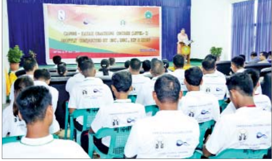
အဆိုပါ သင်တန်းကို တိုင်းဒေသကြီးနှင့် ပြည်နယ်များမှ သင်တန်းသား ၃၀၊ သင်တန်းသူ လေးဦး စုစုပေါင်း ၃၄ ဦး တက်ရောက်သင်ကြားပြီး အောက်တိုဘာ ၂၈ ရက်မှ နိုဝင်ဘာ ၅ ရက်အထိ သင်ကြားပေးသွားမည်ဖြစ်ကြောင်း သိရသည်။ သတင်းစဉ်

ယင်းနောက် အပြည်ပြည်ဆိုင်ရာ ကနူးအဖွဲ့ချုပ် (ICE) တာဝန်ပေးအပ်သူ၊ နည်းစနစ် ကျွမ်းကျင်သူ ဘူလ်ဂေးရီးယားနိုင်ငံမှ Mr.Adan Aliev က အမှာစကားပြောကြားပြီး တက်ရောက်လာကြသည့် သင်တန်းသား သင်တန်းသူများနှင့် တစ်ဦးချင်းမိတ်ဆက်ပေးသည်။