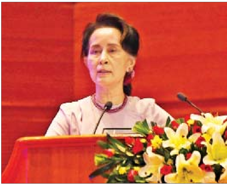
နိုင်ငံတော်၏ အတိုင်ပင်ခံပုဂ္ဂိုလ် ဒေါ်အောင်ဆန်းစုကြည် အမှာစကားပြောကြားစဉ်။

လွန်ခဲ့တဲ့ လေးနှစ်က NCA လက်မှတ်ရေးထိုးပြီး ကာလတစ်လျှောက်ကို ပြန်ပြောင်းလေ့လာကြည့်ရင် လက်ရှိ ၂၀၁၉ ခုနှစ်ဟာ တပ်မတော်နဲ့ NCA လက်မှတ်ရေးထိုးထားတဲ့ တိုင်းရင်းသားလက်နက်ကိုင်အဖွဲ့အစည်းတွေအကြား ထိတွေ့တိုက်ပွဲဖြစ်ပွားမှု အနည်းဆုံးနှစ်ဖြစ်တယ်ဆိုတာကို တွေ့ရပါလိမ့်မယ်။ ဒါကိုပြန်ပြီး သုံးသပ်ကြည့်တဲ့အခါ တပ်မတော်ရဲ့ တစ်ဖက်သတ်အပစ်ရပ်ကြေညာချက်ကြောင့်ဖြစ်သလို တစ်ဖက်မှာလည်း နိုင်ငံတော်အစိုးရနဲ့ NCA လက်မှတ်ရေးထိုးထားတဲ့ တိုင်းရင်းသားလက်နက်ကိုင်အဖွဲ့အစည်း အားလုံးအကြားမှာ တွေ့ဆုံဆွေးနွေးမှုတွေ ဆက်တိုက်ပြုလုပ်နိုင်ခဲ့ခြင်းရဲ့ အကျိုးသက်ရောက်မှုဆိုတာကို ကျွန်မတို့ တွေ့ရှိရပါတယ်။ ဒါဟာကောင်းမွန်တဲ့ တိုးတက်မှုလို့ ဆိုရမှာပါ။