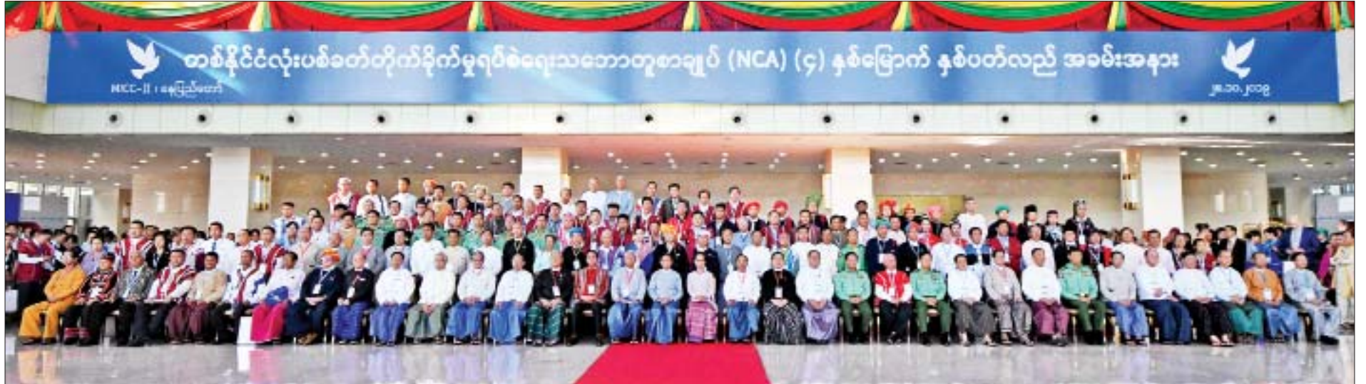
နိုင်ငံတော်သမ္မတ ဦးဝင်းမြင့်၊ နိုင်ငံတော်၏အတိုင်ပင်ခံပုဂ္ဂိုလ် ဒေါ်အောင်ဆန်းစုကြည်၊ နိုင်ငံတော်သမ္မတ(ငြိမ်း) ဦးထင်ကျော်၊ ဒုတိယသမ္မတများ၊ လွှတ်တော်ဥက္ကဋ္ဌများ၊ ပြည်ထောင်စုတရားသူကြီးချုပ်၊ တပ်မတော်ကာကွယ်ရေးဦးစီးချုပ်၊ တိုင်းရင်းသားခေါင်းဆောင်များနှင့်အဖွဲ့၊ တိုင်းရင်းသားလက်နက်ကိုင်အဖွဲ့အစည်းများ၊ JMC နှင့် UPDJC ကိုယ်စားလှယ်တို့ စုပေါင်းမှတ်တမ်းတင် ဓာတ်ပုံရိုက်စဉ်။

တိုင်းရင်းသားလူငယ်များက ဖျော်ဖြေတင်ဆက်သည်။ ထို့နောက် အမျိုးသားပြန်လည်သင့်မြတ်ရေးနှင့် ငြိမ်းချမ်းရေးဗဟိုဌာန ဥက္ကဋ္ဌ နိုင်ငံတော်၏အတိုင်ပင်ခံပုဂ္ဂိုလ် ဒေါ်အောင်ဆန်းစုကြည်က အမှာစကား ပြောကြားသည်။ (နိုင်ငံတော်၏အတိုင်ပင်ခံပုဂ္ဂိုလ် ဒေါ်အောင်ဆန်းစုကြည်၏ အမှာစကား ကို စာမျက်နှာ ၅ တွင် ဖော်ပြထားပါသည်) ယင်းနောက် တပ်မတော်ကာကွယ်ရေးဦးစီးချုပ် ဗိုလ်ချုပ်မှူးကြီး မင်းအောင်လှိုင်က အမှာစကားပြောကြားသည်။ (တပ်မတော်ကာကွယ်ရေးဦးစီးချုပ် ဗိုလ်ချုပ်မှူးကြီးမင်းအောင်လှိုင်၏ အမှာစကားကို စာမျက်နှာ ၇ တွင် ဖော်ပြထားပါသည်) ဆက်လက်၍ တစ်နိုင်လုံးပစ်ခတ်တိုက်ခိုက်မှုရပ်စဲရေး သဘောတူစာချုပ် (NCA) လက်မှတ်ရေးထိုးထားသော စာမျက်နှာ ၄ သို့ *