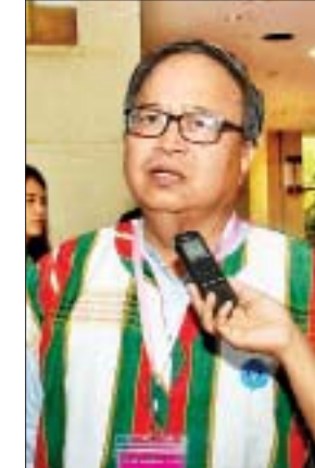
ပူးစီဇမ်း (ဥက္ကဋ္ဌ)

ပြည်ထောင်စုငြိမ်းချမ်းရေးညီလာခံ - (၂၁)ရာစုပင်လုံ တတိယအစည်းအဝေးအပြီးတွင် နိုင်ငံရေးဆွေးနွေးပွဲများ၊ ပစ်ခတ်တိုက်ခိုက်မှု ရပ်စဲရေးလုပ်ငန်းစဉ်များနှင့်စပ်လျဉ်းပြီး ပြန်လည်သုံးသပ်ခြင်း၊ ပြန်လည်ဆွေးနွေးခြင်း၊ ဘုံနားလည်မှုရှာဖွေခြင်းများအတွက် တွေ့ဆုံဆွေးနွေးမှုကြိမ်ဖန်များစွာ ပြုလုပ်ကာ ပြည်ထောင်စုငြိမ်းချမ်းရေးညီလာခံ - (၂၁)ရာစုပင်လုံ စတုတ္ထအစည်းအဝေး ကျင်းပနိုင်ရန် ဆောင်ရွက်လျက်ရှိသည်။