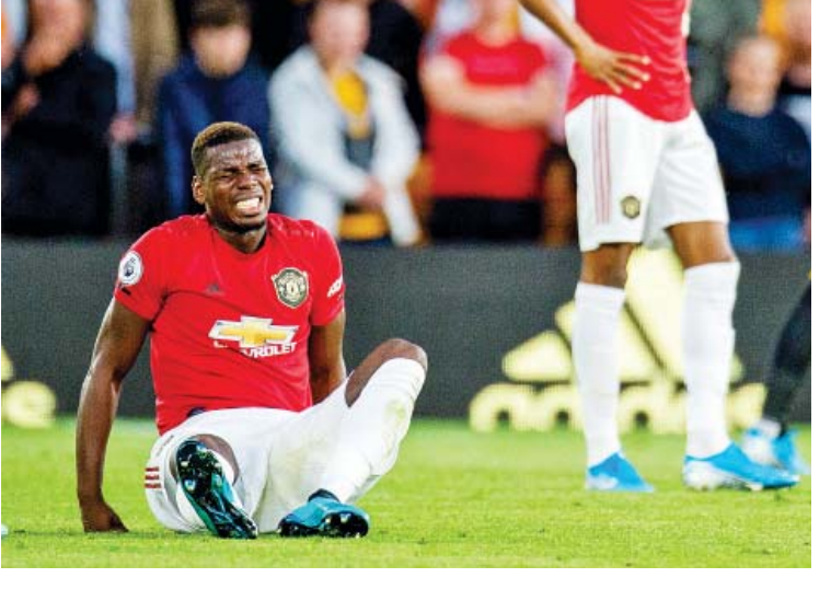
ငွေကြယ် - စုစည်းသည်

မန်ယူအသင်းရဲ့ ကွင်းလယ်ကစားသမား ပေါ့ဘာဟာ ခြေချင်းဝတ်ဒဏ်ရာရရှိထားတာ ကြောင့် ဒီဇင်ဘာလအထိ မန်ယူအသင်းနဲ့အတူ ပါဝင်လာနိုင်မှာမဟုတ်ဘူးလို့ သိရပါတယ်။ အသက် ၂၆ နှစ် အရွယ်ရှိ ပေါ့ဘာဟာ ၂၀၁၆ ခုနှစ်က မန်ယူအသင်းကို ပြောင်းရွှေ့ကြေးပေါင် ၈၉ သန်းနဲ့ ဂျူဗင်တပ်အသင်းကနေ ပြန်လည် ပြောင်းရွှေ့ခဲ့တာဖြစ်ပြီး စက်တင်ဘာလ ကုန်ပိုင်းက အာဆင်နယ်အသင်းနဲ့ သရေပွဲဖြစ် ခဲ့တဲ့ ပရီမီယာလိဂ်ပွဲစဉ်နောက်ပိုင်း မန်ယူ အသင်းနဲ့အတူ ပါဝင်မလာခဲ့တာဖြစ်ပါတယ်။ ဒီဇင်ဘာလမတိုင်မီ အသင်းနဲ့အတူ ပါဝင် လာမှာ မဟုတ်ကြောင်းနဲ့ ဒဏ်ရာအပြည့်အဝ ပြန်လည် သက်သာလာဖို့အတွက်လည်း အချိန် ယူရဦးမယ်လို့ နည်းပြ ဆိုးရှားက ပြောကြား ထားပါတယ်။