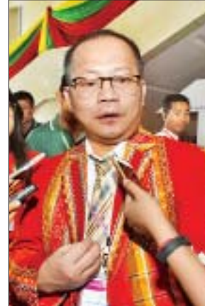
ဒေါက်တာဆလောင်းဌာနကျုံးလျနီ