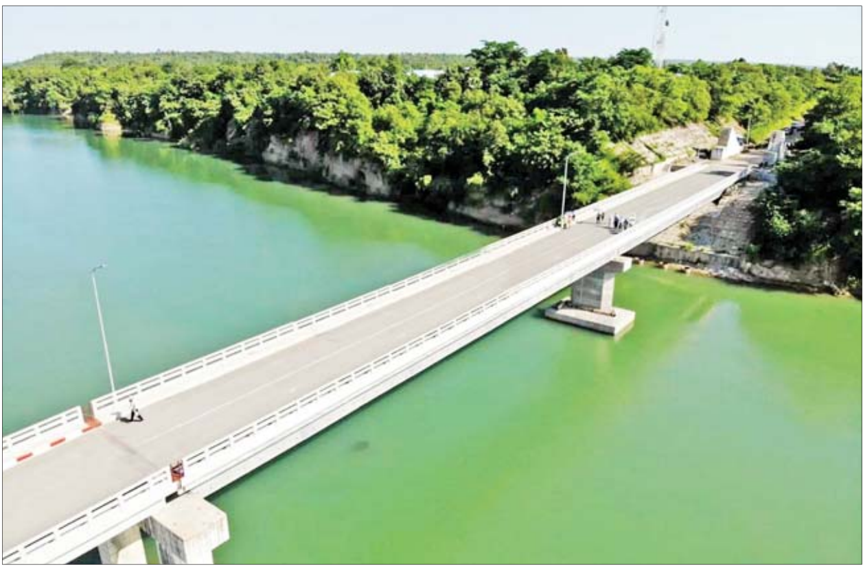
ယနေ့နံနက်ပိုင်းက ဖွင့်လှစ်လိုက်သည့် မဲလီတံတားကို တွေ့ရစဉ်။

မကွေး အောက်တိုဘာ ၂၈ မကွေးတိုင်းဒေသကြီး မင်းဘူးခရိုင် ဖွင့်ဖြူမြို့နယ် ပုသိမ်-မုံရွာလမ်း မိုင်တိုင်အမှတ် (၂၉၅) ရှိ မဲလီ ကြီးတံတား အဆင့်မြှင့်တင်ပြီး ပြန်လည်တည်ဆောက်ခြင်းလုပ်ငန်း ကို ဆောက်လုပ်ရေးဝန်ကြီးဌာန တံတားဦးစီးဌာန တည်ဆောက်ရေး အဖွဲ့(၃)က တည်ဆောက်ခဲ့ရာ တံတားတည်ဆောက်မှုလုပ်ငန်းပြီးစီး သွားပြီဖြစ်၍ ယနေ့နံနက် ၇ နာရီက ကုန်တင်ယာဉ်ကြီးများ အပါအဝင် ယာဉ်ငယ်များ ဖြတ်သန်းမောင်းနှင် နေကြပြီဖြစ်သည်။ အဆိုပါတံတားသစ်ဖွင့်ပွဲသို့ တိုင်း ဒေသကြီးလွှတ်တော်ဥက္ကဋ္ဌ ဦးတာ၊ တိုင်းဒေသကြီးအစိုးရအဖွဲ့မှ တာဝန် ရှိသူများ၊ လွှတ်တော်ကိုယ်စားလှယ် များနှင့် ဒေသခံပြည်သူများ တက်ရောက်ကြကြောင်း သိရသည်။ မူလကြီးတံတားအရှည် ပေ ၄၀၀ အား Steel Box Girder တံတား အမျိုးအစားဖြင့် အစားထိုး အဆင့်မြှင့် တင်လျက် ယာဉ်သွားလမ်းအကျယ် ကိုလည်း မူလ ပေ ၂၀ မှ ၂၄ ပေအထိ စာမျက်နှာ ၉ ကော်လံ ၁ သို့ □