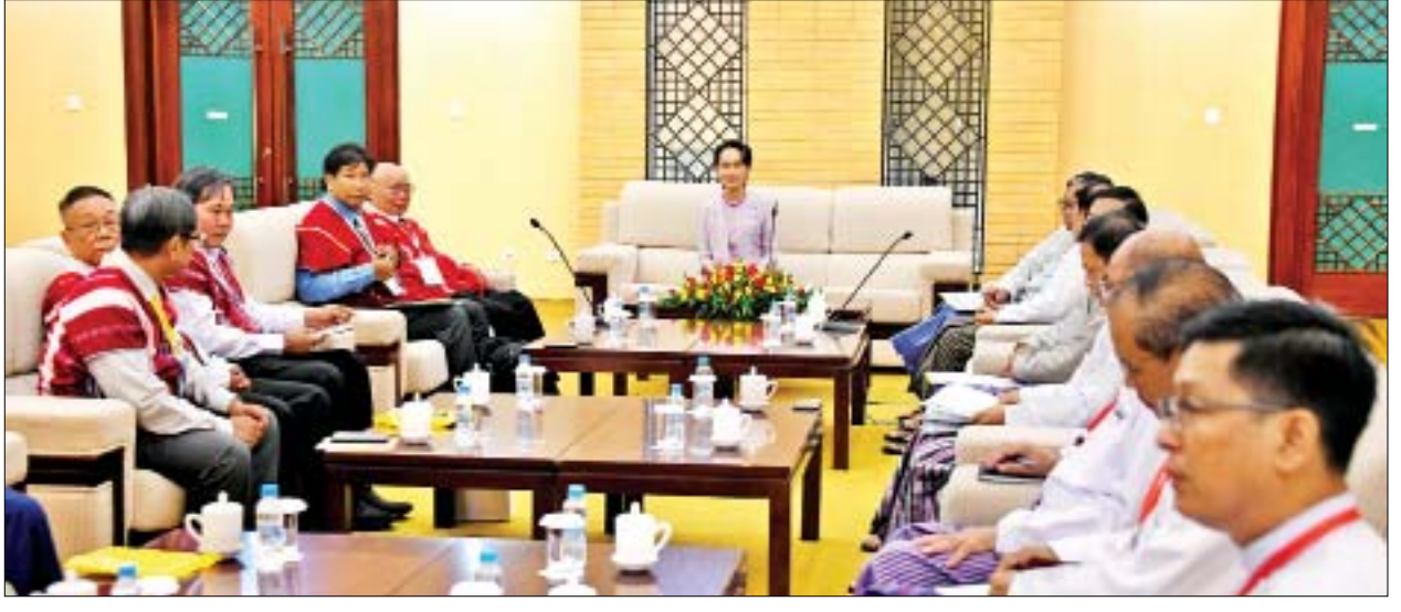
အမျိုးသားပြန်လည်သင့်မြတ်ရေးနှင့် ငြိမ်းချမ်းရေးဗဟိုဌာနဥက္ကဋ္ဌ နိုင်ငံတော်၏ အတိုင်ပင်ခံပုဂ္ဂိုလ် ဒေါ်အောင်ဆန်းစုကြည် KNU ကရင်အမျိုးသားအစည်းအရုံးဥက္ကဋ္ဌ စောမူတူးစေးဖိုးနှင့် ကိုယ်စားလှယ်အဖွဲ့အား လက်ခံတွေ့ဆုံသည်။

တွေ့ဆုံပွဲသို့ နိုင်ငံတော်၏အတိုင်ပင်ခံပုဂ္ဂိုလ်နှင့်အတူ အမျိုးသားပြန်လည်သင့်မြတ်ရေးနှင့် ငြိမ်းချမ်းရေးဗဟိုဌာန ဒုတိယဥက္ကဋ္ဌများဖြစ်ကြသည့် ပြည်ထောင်စုဝန်ကြီး ဦးကျော်တင့်ဆွေ၊ ငြိမ်းချမ်းရေးကော်မရှင်ဥက္ကဋ္ဌ ဒေါက်တာတင်မျိုးဝင်းနှင့် ပြည်ထောင်စုရှေ့နေချုပ် ဦးထွန်းထွန်းဦး၊ ပြည်ထောင်စုအစိုးရအဖွဲ့ရုံးဝန်ကြီးဌာန ပြည်ထောင်စုဝန်ကြီး ဦးမင်းသူ၊ ဒုတိယဝန်ကြီး ဦးခင်မောင်တင်နှင့် ဦးလှမော်ဦး၊ ညွှန်ကြားရေးမှူးချုပ်