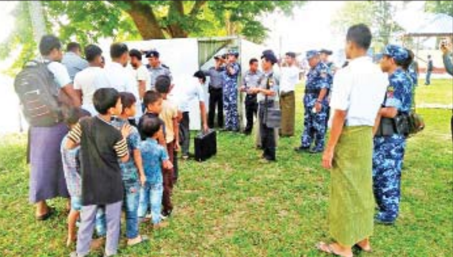
မိမိတို့သဘောဆန္ဒအရ ပြန်လည်ဝင်ရောက်လာသည့် နေရပ်စွန့်ခွာသူများအား လုံခြုံရေးတာဝန်ရှိသူများက သတ်မှတ်နေရာ၌ တစ်ဦးချင်း လုံခြုံရေးဆိုင်ရာ ရှာဖွေစစ်ဆေးမှုများ ပြုလုပ်စဉ်။