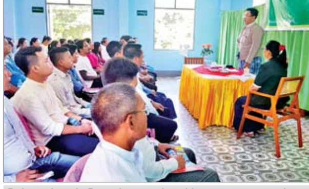
ပြည်ထောင်စုနယ်မြေအတွင်းရှိ မြို့နယ်အခွန်ဦးစီး ဌာနမှူးရုံးများတွင် အခွန်ထမ်းဆောင်နေကြသည့် အခွန်အမှတ်တံဆိပ် ကပ်နှိပ်ရောင်းချလျက်ရှိသည့် ဟိုတယ်၊ တည်းခိုခန်း၊ စားသောက်ဆိုင်၊ ရွှေဆိုင်၊ ဟန်းဆက်နှင့် ဆက်စပ်ပစ္စည်းရောင်းချသော လုပ်ငန်းရှင်များအား အောက်တိုဘာ ၂၃ ရက်က ပြည်ထောင်စုနယ်မြေ အခွန်ဦးစီးဌာနမှူး သူရဦးထင်ကျော်မိုးက ၂၀၁၉ ခုနှစ် ပြည်ထောင်စုအခွန်အကောက်ဥပဒေပါ လိုက်နာဆောင်ရွက်ရန် အချက်များကို ရှင်းလင်းပြောကြားစဉ်။