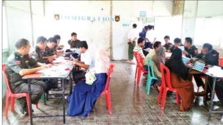
မိမိတို့သဘောဆန္ဒအရ ပြန်လည်ဝင်ရောက်လာသည့် နေရပ်စွန့်ခွာသူများအား လူဝင်မှုကြီးကြပ်ရေးဆိုင်ရာ လုပ်ငန်းစဉ်များ စိစစ်မှတ်တမ်းတင်ခြင်း ဆောင်ရွက်စဉ်။

မောင်တော အောက်တိုဘာ ၂၃ ရခိုင်ပြည်နယ် မောင်တောမြို့နယ် တောင်ပြုလက်ဝဲ ပြန်လည်လက်ခံရေးစခန်း၌ အောက်တိုဘာ ၂၂ ရက် နံနက် ၈ နာရီ ၁၅ မိနစ်က မိမိတို့သဘောဆန္ဒအရ ပြန်လည်ဝင်ရောက်လာသည့် နေရပ်စွန့်ခွာသူ အိမ်ထောင်စု ငါးစုမှ ကျား ၁၈ ဦး၊ မ ၁၁ ဦး စုစုပေါင်း ၂၉ ဦးအား ပြန်လည်စိစစ်လက်ခံရေးလုပ်ငန်းစဉ်များအတိုင်း သက်ဆိုင်ရာတာဝန်ရှိသူများက စိစစ်လက်ခံဆောင်ရွက်ပေးခဲ့သည်။ ယင်းသို့ လက်ခံဆောင်ရွက်ရာတွင် ရှေးဦးစွာ လုံခြုံရေးတာဝန်ရှိသူများက သတ်မှတ်နေရာ၌ တစ်ဦးချင်း လုံခြုံရေးဆိုင်ရာရှာဖွေစစ်ဆေးမှုများ ပြုလုပ်သည်။