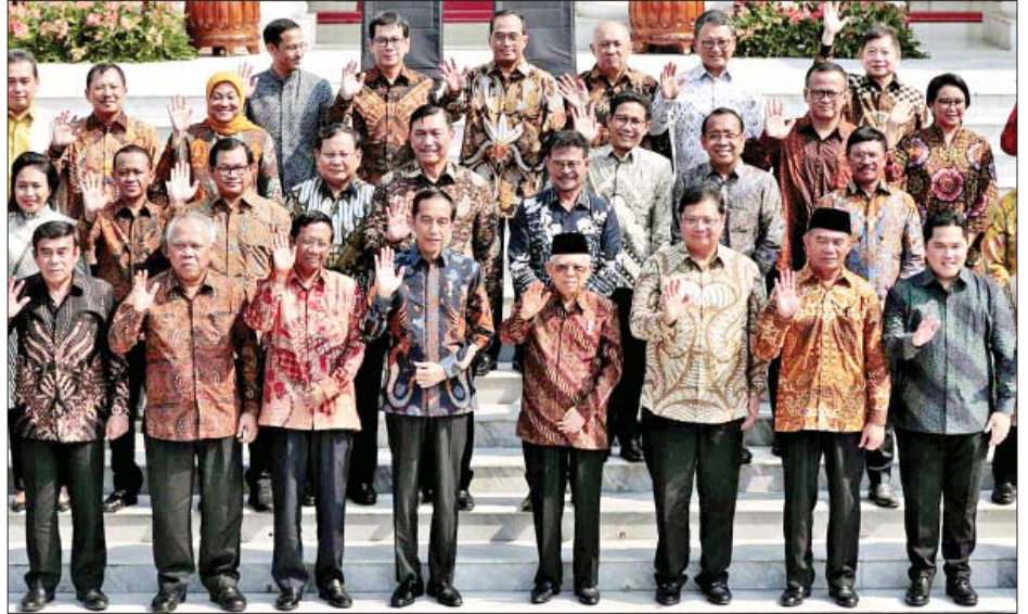
အနေများကြောင့် အကြမ်းဖက်ပါဒါ၊ အကျင့်ပျက်ခြစားမှု နှင့် သောင်းကျန်းမှုတို့မှာ သက်တမ်းသစ်အတွင်း သမ္မတ ဝီဒိုဒို ရင်ဆိုင်နေရသော အဓိကစိန်ခေါ်မှုများဖြစ်သည်။ ကိုးကား- ဆင်ဟွာ၊ ဘာသာပြန် - ကျော်ထိုက်စိုး

ကမ္ဘာ့စီးပွားရေးမသေချာမှု ကြုံတွေ့နေရချိန် အင်ဒိုနီးရှားနိုင်ငံ၏ ယိမ်းယိုင်လာသော စီးပွားရေးအခြေ