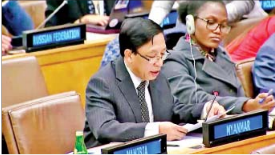
ကုလသမဂ္ဂဆိုင်ရာမြန်မာအမြဲတမ်းကိုယ်စားလှယ် သံအမတ်ကြီး ဦးဟောကိဒိုဆွမ်း တုံ့ပြန်မိန့်ခွန်း ပြောကြားစဉ်။

ကုလသမဂ္ဂဆိုင်ရာ မြန်မာအမြဲတမ်းကိုယ်စားလှယ် သံအမတ်ကြီး ဦးဟောကိဒိုဆွမ်းက မြန်မာနိုင်ငံလူ့အခွင့်အရေးအခြေအနေဆိုင်ရာ အထူးအစီရင်ခံစာတင်သွင်းသူ မစ္စ ယန်ဟီလီ၊ ယခင် မြန်မာနိုင်ငံဆိုင်ရာ အချက်အလက်ရှာဖွေရေးအဖွဲ့ ဥက္ကဋ္ဌ မစ္စတာ မာဇူကီဒါရူစမန်တို့နှင့် သီးခြားစီပြုလုပ်သည့် အပြန်အလှန်ဆွေးနွေးမှုများတွင် ၎င်းတို့၏ ဆွေးနွေးမှုများအပေါ် တုံ့ပြန်မိန့်ခွန်းများ ပြောကြားခဲ့သည်။