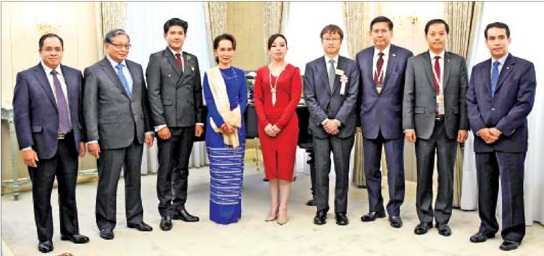
နိုင်ငံတော်၏အတိုင်ပင်ခံပုဂ္ဂိုလ် ဒေါ်အောင်ဆန်းစုကြည်နှင့် ဂျပန်ဧကရာဇ်၏ ညီမတော် တော်ဝင်မင်းသမီး ယိုကိုတို့ အဖွဲ့ဝင်များနှင့်အတူ စုပေါင်းမှတ်တမ်းတင်ဓာတ်ပုံရိုက်စဉ်။

ကမ္ဘာပေါ်ရှိ ငြိမ်းချမ်းရေးကို မြတ်နိုးသော နိုင်ငံများက ကုလသမဂ္ဂအဖွဲ့ကြီးအား လွန်ခဲ့သည့် (၇၄) နှစ်၊ ၁၉၄၅ ခုနှစ်၊ အောက်တိုဘာလ(၂၄)ရက်နေ့တွင် တည်ထောင်ခဲ့ကြပါသည်။ အဖွဲ့ဝင်နိုင်ငံများအနေဖြင့် ကုလသမဂ္ဂပဋိညာဉ်တွင် ပြဋ္ဌာန်းထားသည့်အတိုင်း အပြည်ပြည်ဆိုင်ရာငြိမ်းချမ်းရေးနှင့် လုံခြုံရေးကိုထိန်းသိမ်းပြီး တန်းတူညီမျှရှိသည့် သဘောတရားကို အခြေခံ၍ နိုင်ငံများအကြား ချစ်ကြည်ရင်းနှီးမှုတိုးတက်ရေးနှင့် အပြည်ပြည်ဆိုင်ရာ ပြဿနာများအား ပူးပေါင်းဆောင်ရွက်မှုဖြင့် ဖြေရှင်းရန် အဖွဲ့ဝင်နိုင်ငံများက သန့်ဋ္ဌာန်ချခဲ့ကြပါသည်။ စာမျက်နှာ ၄ ကော်လံ ၁ သို့ ❖