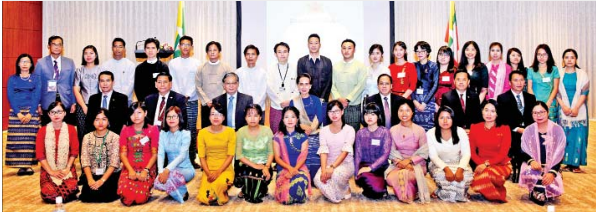
နိုင်ငံတော်၏အတိုင်ပင်ခံပုဂ္ဂိုလ် ဒေါ်အောင်ဆန်းစုကြည်၊ ပြည်ထောင်စုဝန်ကြီး ဦးကျော်တင့်ဆွေ၊ ဒုတိယဝန်ကြီး ဦးဆက်အောင်၊ ဂျပန်နိုင်ငံဆိုင်ရာ မြန်မာသံအမတ်ကြီး ဦးမြင့်သူနှင့် တာဝန်ရှိသူများ ဂျပန်နိုင်ငံရောက် ပညာတော်သင်ကျောင်းသား ကျောင်းသူများနှင့်အတူ စုပေါင်းမှတ်တမ်းတင် ဓာတ်ပုံရိုက်စဉ်။