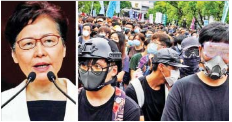
အစောပိုင်းက ဟောင်ကောင် အရေးပေါ်အခြေအနေ အတွင်း ပထမဆုံး အသုံးပြုခြင်းဖြစ်သည်။ ဥပဒေ ထုတ်ပြန်ခြင်းဖြစ်သည်။ ယင်းစည်းကမ်း ကိုးကား-အင်န်အိတ်ချ်ကော ဘာသာပြန်-အောင်ဇော်လင်း သတ်မှတ်ချက်ကို ဥပဒေပြုအဖွဲ့က နှစ်ပေါင်း ၅၀ ကျော်

ဥပဒေပြုအမတ်များက ဆန္ဒပြပွဲများတွင် မျက်နှာပုံး မတပ်ရဟုတားမြစ်သည့် စည်းကမ်းသတ်မှတ်ချက်ကို ဆွေးနွေးရန် စီစဉ်နေကြသည်။ ယင်းစည်းကမ်းသတ်မှတ် ချက်သည် ပြင်းပြင်းထန်ထန် ဝေဖန်မှုခံခဲ့ရပြီး ပြီးခဲ့သည့်လ