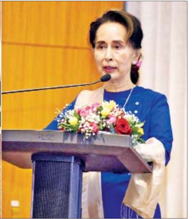
နိုင်ငံတော်၏အတိုင်ပင်ခံပုဂ္ဂိုလ် ဒေါ်အောင်ဆန်းစုကြည် ဂျပန်နိုင်ငံရောက် ပညာတော်သင် ကျောင်းသား ကျောင်းသူများအား အမှာစကားပြောကြားစဉ်။