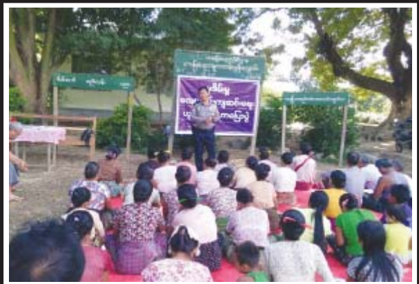
အောက်တိုဘာ ၂၀ ရက် နံနက် ၉ နာရီက ပန်းတင်ကျေးရွာ(မြောက်)ဘုန်းတော်ကြီးကျောင်းဓမ္မာရုံ၌ သာဝတ္ထိနယ်မြေရဲစခန်းမှ ဓမ္မစခန်းမှူး ဒု- ရဲအုပ်မျိုးသက်ဦးနှင့် ရဲတပ်ဖွဲ့ဝင်များသည်လည်းကောင်း၊ မွန်းလွဲ ၂ နာရီတွင် ချောင်းတီနီကျေးရွာ၌ သစ်ပုပ်ပင်နယ်မြေရဲစခန်းမှူး ရဲအုပ်မြင့်ဆွနှင့် တပ်ဖွဲ့ဝင်များသည်လည်းကောင်း ဒေသခံပြည်သူများအား သက်ငယ်မှီခိုမှု ဖြစ်ပွားစေရေးနှင့် လူကုန်ကူးမှုအကြောင်း သိကောင်းစရာများ အသိပညာပေးဟောပြောခဲ့ကြောင်း သိရသည်။

လွှတ်တော်ကိုယ်စားလှယ်များနှင့် ဌာနဆိုင်ရာများပူးပေါင်းကာ ပြည်သူ့လူထုနှင့် တွေ့ဆုံပွဲကို အောက်တိုဘာ ၂၂ ရက်က မယ်စွဲမြို့နယ် ကျောက်စုကျေးရွာနှင့် မယ်ဆည်နယ်ကျေးရွာတို့၌ ကျင်းပသည်။