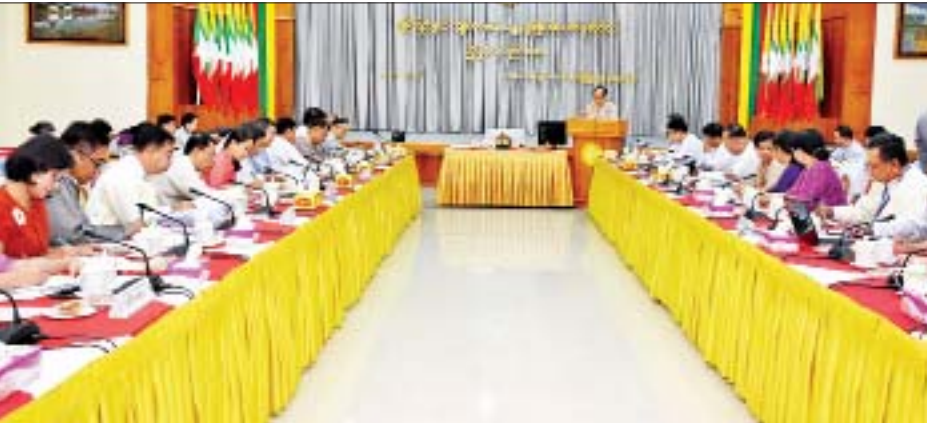
တွင် ရခိုင်ပြည်နယ်၏ လူမှုရေးဆိုင်ရာ ပဋိပက္ခနှင့် မတည် ငြိမ်မှုများ၊ လုံခြုံရေးဆိုင်ရာနှင့် အမြဲပြတ်ပြောင်းလဲနေ သော အခြေအနေများကို အလေးပေးထည့်သွင်းစဉ်းစားရ မည်ဖြစ်ကြောင်း၊ ကယ်ဆယ်ရေးစခန်းများတွင် ဆွေးနွေးပွဲ များပြုလုပ်၍ လိုအပ်ချက်၊ အခက်အခဲနှင့် အမြင်များကို သိရှိဖော်ထုတ်နိုင်မည်ဖြစ်ပြီး မှန်ကန်သော လုပ်ငန်းစဉ်များ ချမှတ်ဆောင်ရွက်နိုင်မည်ဖြစ်ကြောင်း၊ ထို့ပြင် ကျန်းမာရေး သည် ငြိမ်းချမ်းတည်ငြိမ်ရေးအတွက် ပေါင်းကူးတံတား ဖြစ်သည်ဆိုသည့်အတိုင်း ကျန်းမာရေးကဏ္ဍဖွံ့ဖြိုးရေးကို

အစည်းအဝေးတွင် ပြည်ထောင်စုဝန်ကြီး ဒေါက်တာ မြင့်ထွေးက ယနေ့ဆွေးနွေးပွဲတွင် ကျွမ်းကျင်မှုပိုင်းဆိုင်ရာ၊ လူမှုရေး၊ အုပ်ချုပ်ရေး၊ စီမံခန့်ခွဲရေးနှင့် ဌာနပေါင်းစုံ၊ ဝန်ကြီး ဌာနပေါင်းစုံ ပူးပေါင်းဆောင်ရွက်မှု ရှုထောင့်အမျိုးမျိုးမှ သုံးသပ်ပြီး ရခိုင်ပြည်နယ် ကျန်းမာရေးကဏ္ဍ ဖွံ့ဖြိုးတိုးတက် ရေးအတွက် ရှေ့လုပ်ငန်းစဉ်များကို ချမှတ်နိုင်ရေး ဦးတည်ဆွေးနွေးရန် လိုအပ်ကြောင်း၊ ဝန်ကြီးဌာနမှ ကျန်းမာရေးစီမံချက်အသီးသီး၏ မန်နေဂျာများ၊ ဌာနခွဲ များမှ တာဝန်ရှိသူများနှင့် ရခိုင်ပြည်နယ်လူမှုရေးဝန်ကြီး နှင့် ပြည်နယ် ပြည်သူ့ကျန်းမာရေးနှင့် ကုသရေးဦးစီးဌာနမှ တာဝန်ရှိသူများ ယခုကဲ့သို့ တွေ့ဆုံဆွေးနွေးခြင်းဖြင့် လက်တွေ့ကျသော လုပ်ငန်းစဉ်များကို ချမှတ်နိုင်မည်ဖြစ် ကြောင်း၊ ရခိုင်ပြည်နယ် ပြည်သူ့ကျန်းမာရေးနှင့် ကုသရေး ဦးစီးဌာနနှင့် ဗဟိုကူးစက်ရောဂါတိုက်ဖျက်ရေး ဌာနမှ ကျန်းမာရေးစီမံချက်မန်နေဂျာများ ပူးပေါင်းညှိနှိုင်း ဆောင်ရွက်သွားရမည်ဖြစ်ကြောင်း။