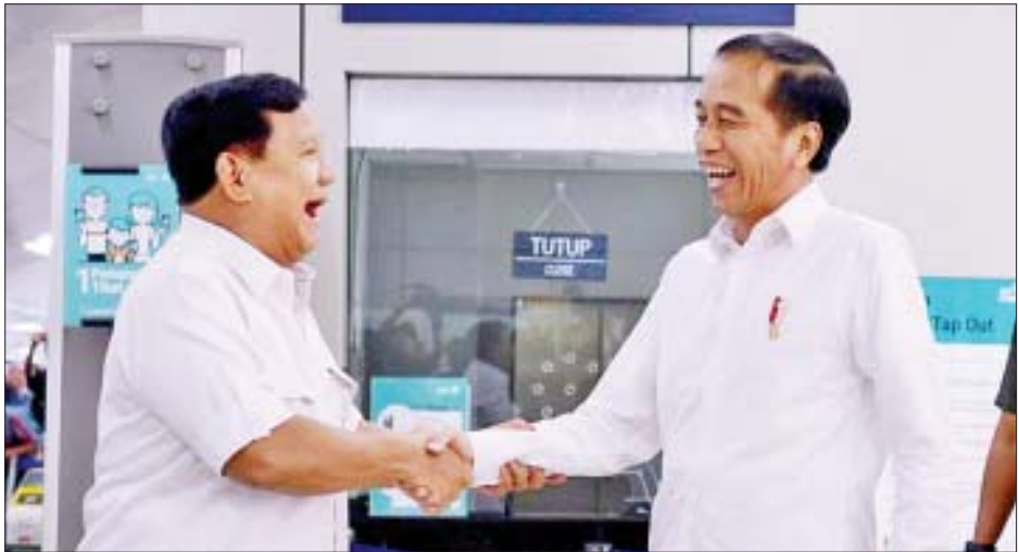
ကြည်းတပ်ဗိုလ်ချုပ်ကြီးဟောင်း ပရာဘိုဝိုဆူဗီရန်တို့နှင့် သမ္မတ ဂျိုကိုဝီဒို

၎င်းတို့အနေဖြင့် အစိုးရအဖွဲ့သစ်တွင် တာဝန် ထမ်းဆောင်ရန် ကမ်းလှမ်းခြင်းခံခဲ့ရသည်ဟု ဝန်ကြီးလောင်း များက သတင်းထောက်များကို ပြောကြားခဲ့သော်လည်း မည်သည့်ဝန်ကြီးနေရာများတွင် ခန့်အပ်ကြောင်း ပြောဆို ခြင်းမရှိခဲ့ချေ။ ဂျိုကိုဝီက တွေ့ဆုံမေးမြန်းခဲ့သောသူများမှာ အခြေခံဥပဒေဆိုင်ရာ တရားသူကြီး မိုဟာမက်မာဖတ်၊ ဂိုးဂျက်ဆိုင်ကယ်တက္ကစီ တည်ထောင်သူ နာဒင်းမကာရင်း၊