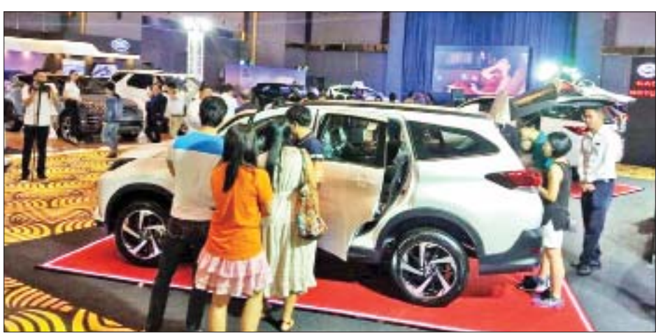
ပထမအကြိမ်ကျင်းပခဲ့သော ကားပြပွဲကြီးအား တွေ့ရစဉ်။