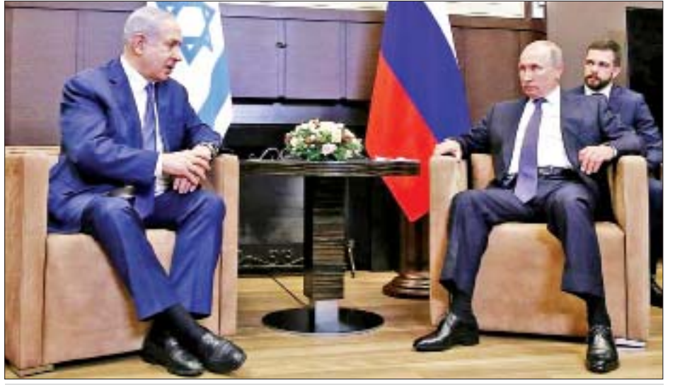
အစွဲရေးဝန်ကြီးချုပ် ဘင်ဂျမင်နေတန်ယာဟုနှင့် ရုရှားသမ္မတ ဗလာဒီမာပူတင်