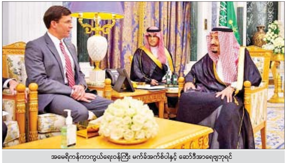
အမေရိကန်ကာကွယ်ရေးဝန်ကြီး မက်ခီအက်စ်ပါနှင့် ဆော်ဒီအာရေဗျဘုရင်

၂၀၁၈ အာရှအားကစားပွဲအခမ်းအနားများ၏ တီထွင် အင်တာမီလန်အသင်း၏ ပိုင်ရှင်တို့ဖြစ်သည်။ ဖန်တီးမှုဆိုင်ရာ ဒါရိုက်တာ ဝတ်ချ်နုတာမာ၊ စီးပွားရေး လုပ်ငန်းရှင် အဲရစ်သိုဟာနှင့် အီတလီစီးရီးအေကလပ် ကိုးကား-ကျိုဒို ဘာသာပြန်-စိုးသူရ