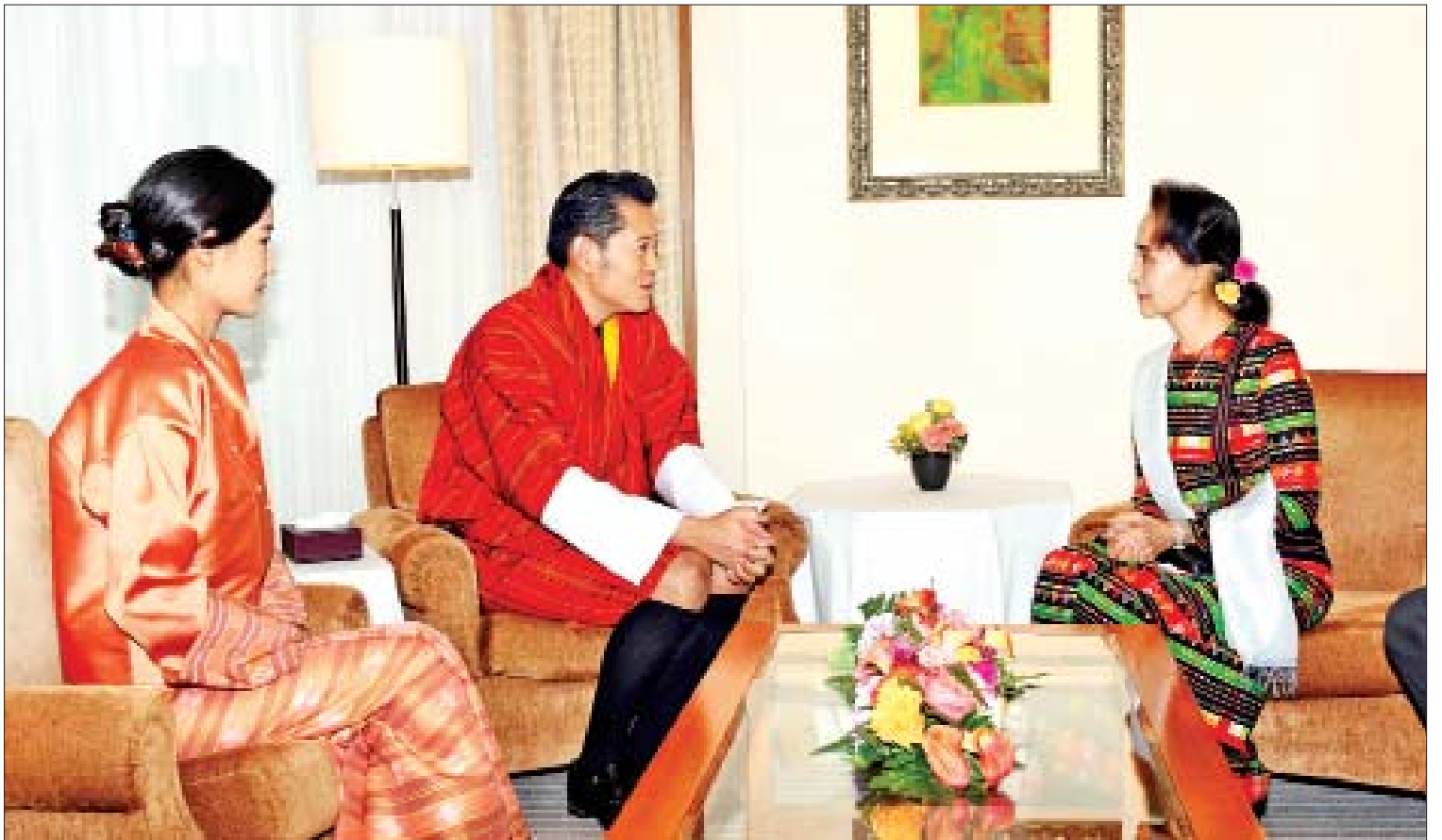
နိုင်ငံတော်၏အတိုင်ပင်ခံပုဂ္ဂိုလ် ဒေါ်အောင်ဆန်းစုကြည် ဘူတန်ဘုရင် Jigme Khesar Namgyel Wangchuck နှင့် တွေ့ဆုံစဉ်။

နိုင်ငံတော်၏ အတိုင်ပင်ခံပုဂ္ဂိုလ် ဒေါ်အောင်ဆန်းစုကြည်၊ ဂျပန်-မြန်မာ လွှတ်တော်ချင်း ချစ်ကြည်ရေးအသင်းဥက္ကဋ္ဌ Mr. Ichiro Aisawa၊ ပြည်ထောင်စုဝန်ကြီး ဦးကျော်တင်ဆွေ၊ ဒုတိယဝန်ကြီး ဦးဆက်အောင် နှင့် ဂျပန်နိုင်ငံဆိုင်ရာ မြန်မာသံအမတ်ကြီး ဦးမြင့်သူနှင့် တာဝန်ရှိသူများ စုပေါင်းမှတ်တမ်းတင်ဓာတ်ပုံ ရိုက်စဉ်။