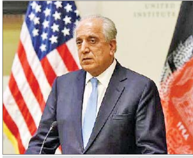
အမေရိကန်သံတမန် ဇာလ်မေခါလီးလ်ဇော်