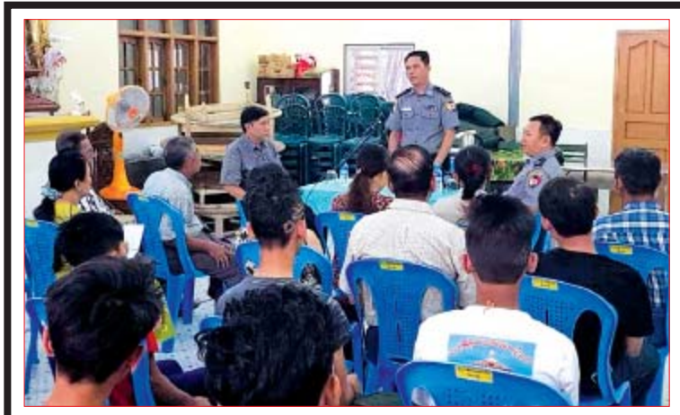
ရန်ကုန်တိုင်းဒေသကြီး စိုက်ပျိုးရေးဦးစီးဌာနမှ ဦးစီးမှုဖြင့် အောက်တိုဘာ ၂၀ ရက်က အမှတ် (၅) ရပ်ကွက် မွှာရုံတွင် သက်ငယ်မုဒိမ်းမှုကျဆင်းရေး၊ မူးယစ်ဆေးဝါးအန္တရာယ်တားဆီးကာကွယ်ရေးတို့ကို အသိပညာပေးဟောပြောခဲ့ကြောင်း သိရသည်။