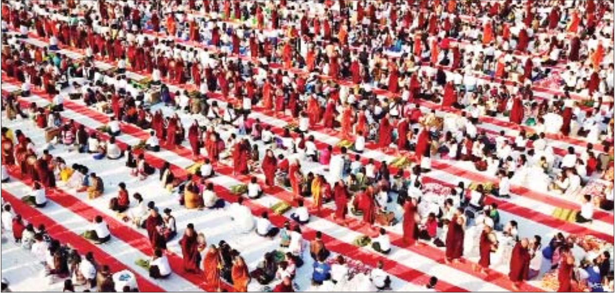
၂၀၁၈ ခုနှစ်က သံဃာအပါး နှစ်သောင်းအား ဆွမ်းဆန်စိမ်းလောင်းလှူပွဲကြီးကို ချမ်းမြသာစည်လေယာဉ်ကင်းအတွင်း စည်ကားသိုက်မြိုက်စွာ ကျင်းပခဲ့စဉ်။

"သံဃာအပါး သုံးသောင်း ဆွမ်းဆန်စိမ်းလောင်းလှူပွဲမှာ သံဃာတော်တွေ တစုတဝေးတည်း စုပေါင်းပြီး ပရိတ်ရွတ်ဆိုသံကို ကြည့်ညှိသဒ္ဓါပွားများစွာ နာယူခွင့်ရကြမှာ ဖြစ်ပါတယ်။ ထိုင်းနိုင်ငံက သံဃာအပါး ၆၀ နဲ့ ၁၀၀ အကြား ကြွရောက်လာကြမှာဖြစ်ပြီး ကျန်တဲ့သံဃာတော်တွေကိုတော့ မန္တလေးခရိုင် အတွင်းမှာရှိတဲ့ ဝါဆိုသံဃာတော်တွေကို ပင့်ဖိတ်လောင်းလှူသွားမှာ ဖြစ်ပါတယ်။ ဒီလောင်းလှူပွဲကြီး အောင်မြင်စွာ ကျင်းပနိုင်ဖို့ နာယကကော်မတီ၊ ဦးစီးကော်မတီ၊ အခမ်းအနားကျင်းပရေးကော်မတီ၊ အထောက်အကူပြုကော်မတီတွေ ပွဲစည်းပြီး ဒီအဖွဲ့တွေရဲ့ အောက်မှာ အဖွဲ့ခွဲတွေ အဆင့်ဆင့်ပွဲစည်းပြီး ဆောင်ရွက် သွားမှာပါ။ သံဃာတစ်ပါးစီအတွက် လောင်းလှူမည့် နဝကမ္မ သုံးသောင်းကျပ်နဲ့ အရက်ဆွမ်း၊ နေ့ဆွမ်းအတွက် ငွေကျပ် သုံးထောင်၊ စုစုပေါင်း သံဃာတစ်ပါးစီ အတွက် ငွေကျပ် ၃၃၀၀၀ ကို မြန်မာနိုင်ငံနဲ့ ထိုင်းနိုင်ငံက တစ်ဝက်စီ အကုန်အကျခံ လှူဒါန်းတာဖြစ်ပါတယ်။" ဟု ၎င်းက ပြောသည်။