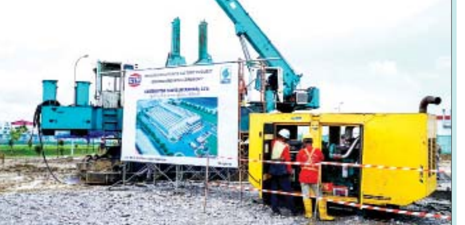
ဖြစ်ပြီး အနာဂတ်ကာလတွင် အလားတူစက်ရုံများကို တည်ဆောက်မည့် အစီအစဉ်များရှိသည်။ ကမ္ဘောဒီးယား၊ လာအိုနှင့် ဘင်္ဂလားဒေ့ရှ်နိုင်ငံတို့၌ ကိုးကား-ဗန်ကောက်ပို့စ်၊ ဘာသာပြန် - ကျော်ထိုက်စိုး

“မြန်မာနိုင်ငံက လွန်ခဲ့တဲ့ငါးနှစ်ကတည်းက စီးပွားရေး နဲ့ ရင်းနှီးမြှုပ်နှံမှုတွေအတွက် လမ်းဖွင့်ပေးခဲ့ပြီး လုပ်ငန်း တိုးချဲ့မယ့် စီမံကိန်းကြီးတွေ များစွာရှိပါတယ်” ဟု ၎င်းက ဆိုသည်။ မြန်မာနိုင်ငံ၏ အိမ်သုတ်ဆေးဈေးကွက် တန်ဖိုးမှာ အကြမ်းဖျင်းအားဖြင့် ဘတ်သန်း ၃၀၀ ခန့်ရှိပြီး TCP က ဈေးကွက်ဝေစု ၇၀ ရာခိုင်နှုန်းခန့် ရရှိထားသည်။ မြန်မာ နိုင်ငံ၌ စက်ရုံသစ်တည်ဆောက်မည့် အစီအစဉ်မှာ TCP က ပြည်ပ၌ လုပ်ငန်းတိုးချဲ့မည့်စီမံချက်၏ တစ်စိတ်တစ်ဒေသ