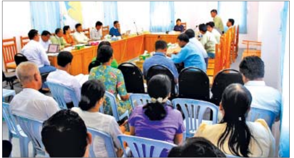
ရေးလုပ်ငန်းရှင်များ၊ တိုင်းဒေသကြီးနှင့် ပြည်နယ်များရှိ စီးပွားရေးလုပ်ငန်းရှင်များ၊ တိုင်းရင်းသားအဖွဲ့အစည်းများအား ဖိတ်ကြားမည်ဖြစ်ပြီး ရင်းနှီးမြှုပ်နှံမှုဖိရမ်လာရောက်ကြသည့်ဧည့်သည်များအား မြတ်ခရိုင်အတွင်းရှိ ရင်းနှီးမြှုပ်နှံမှုလုပ်ငန်းများကို လေ့လာရေးပို့ဆောင်ပေးသွားမည်ဖြစ်ရာ ရင်းနှီးမြှုပ်နှံမှုဖိရမ်တက်ရောက်ရန် နိုင်ငံတကာမှ စတင်ချိတ်ဆက်ဆောင်ရွက်လာကြကြောင်း သိရသည်။ နိုင်ထူး(မြတ် မြန်/ဆက်)

ရင်းနှီးမြှုပ်နှံမှုဖိရမ်ကို နိုင်ငံတကာပညာရှင်များ၊ စီးပွား