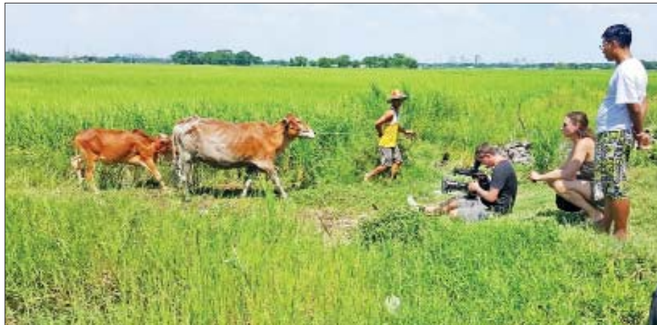
ဆွီဒင်နိုင်ငံမှ ရိုက်ကူးရေးအဖွဲ့ ဒေသမြို့နယ်ရှိ ဒေသခံများ လယ်ယာလုပ်ကိုင်နေပုံအား သတင်းမှတ်တမ်းရိုက်ကူးစဉ်။