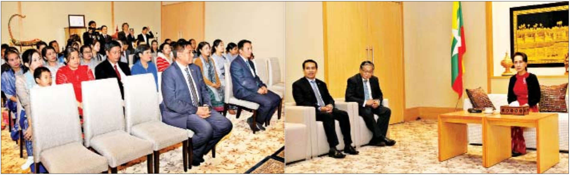
နိုင်ငံတော်၏အတိုင်ပင်ခံပုဂ္ဂိုလ် ဒေါ်အောင်ဆန်းစုကြည် ဂျပန်နိုင်ငံဆိုင်ရာ မြန်မာသံအမတ်ကြီး ဦးမြင့်သူ ဦးဆောင်သော မြန်မာသံရုံးနှင့် စစ်သံရုံးတို့မှ ဝန်ထမ်းများ၊ သံရုံးမိသားစုဝင်များနှင့် ရင်းရင်းနှီးနှီးတွေ့ဆုံစဉ်။ (သတင်း-ရှေ့ဖုံး)