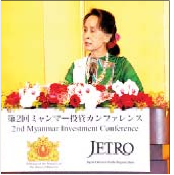
နိုင်ငံတော်၏အတိုင်ပင်ခံပုဂ္ဂိုလ် ဒေါ်အောင်ဆန်းစုကြည် ဒုတိယအကြိမ်မြောက် မြန်မာနိုင်ငံရင်းနှီးမြှုပ်နှံမှုဆိုင်ရာ ဆွေးနွေးပွဲတွင် အဖွင့်မိန့်ခွန်းပြောကြားစဉ်။

သည့် အားသာချက်များနှင့် မြန်မာ နိုင်ငံတွင် လာရောက်ရင်းနှီးမြှုပ်နှံ နိုင်မည့် အခွင့်အလမ်းများကို ရှင်းလင်း ပြောကြားသည်။