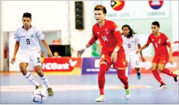
မြန်မာအသင်းနှင့် တီမောအသင်းတို့ ယှဉ်ပြိုင်နေစဉ်။

မြန်မာဖူဆယ်အသင်းသည် အုပ်စုအဖွင့်ပွဲ တွင် ဂိုးပြတ်အနိုင်ရခဲ့သောကြောင့် ဆီမီးဖိုင်နယ် တက်ရောက်ရန် အခြေအနေကောင်းသွားခဲ့ သည်။ တီမောအသင်း၏ ရုန်းကန်မှုကြောင့် မြန်မာအသင်းသည် ပထမပိုင်းတွင် ခက်ခက် ခဲခဲကစားခဲ့ရသော်လည်း ဒုတိယပိုင်းတွင် ကစားပုံ စာမျက်နှာ ၁၀ ကော်လံ ၁ သို့ *