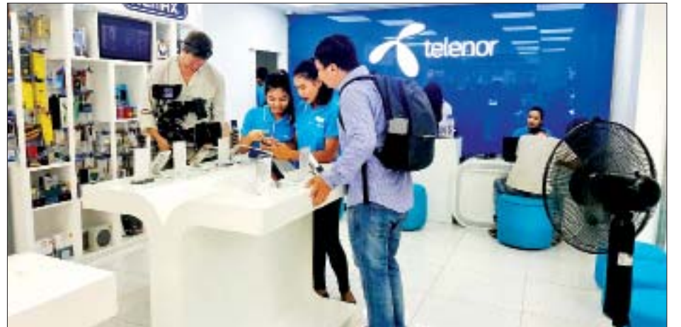
ဆွီဒင်နိုင်ငံမှ ရိုက်ကူးရေးအဖွဲ့ Telenor Myanmar ဆိုင်ခန်းတွင် ကွန်ရက်ချိတ်ဆက်နေပုံအား သတင်းမှတ်တမ်းရိုက်ကူးစဉ်။

ရန်ကုန် အောက်တိုဘာ ၂၁ ဆွီဒင်နိုင်ငံ Seventy Agency မှ ရိုက်ကူးရေးအဖွဲ့သည် ယနေ့တွင် ရန်ကုန်တိုင်းဒေသကြီး လှိုင်သာယာမြို့နယ်ရှိ လှိုင်သာယာစက်မှုဇုန်ရှင်းနှင့် စက်မှုဇုန်ဖွံ့ဖြိုးတိုးတက်မှု အခြေအနေ၊ ၎င်းစက်မှုဇုန်ရှိ Season One Co.,Ltd. နှင့် UPG Co.,Ltd. စက်ရုံများတွင် သတင်းမှတ်တမ်းရိုက်ကူးသည်။ အဆိုပါရိုက်ကူးရေးအဖွဲ့သည် ယမန်နေ့က ဒေသမြို့နယ်