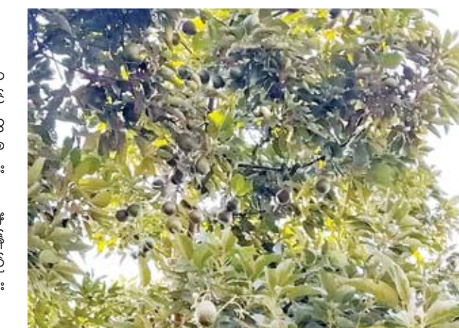
နှစ်ရှည်သီးနှံပင်ဖြစ်ခြင်းကြောင့် စိုက်ပျိုးသည့်တောင်သူများအတွက် အကျိုးဖြစ်ထွန်းသော သီးနှံတစ်ခုဖြစ်ပြီး မန္တလေးတိုင်းဒေသကြီးအတွင်း၌ မိုးကုတ်၊ ပြင်ဦးလွင်တို့တွင် အများဆုံးစိုက်ပျိုးကာ တစ်နိုင်လုံးအတိုင်းအတာအနေဖြင့် ထောပတ်စိုက်ပျိုးမှုဧကမှာ ၆၀၀ ခန့်သာရှိသေးကြောင်း သိရသည်။

ထောပတ်ပင်အား ပင်လယ်ရေမျက်နှာပြင်အထက် ပေ ၃၀၀၀ နှင့် ပေ ၄၀၀၀ ရှိသည့်မည်သည့်ဒေသတွင်မဆို စိုက်ပျိုးနိုင်ပြီး မျိုးစေ့အနေဖြင့် ပြည်တွင်းမျိုးနှင့် ပြည်ပမျိုး ခွဲခြားကာ စိုက်ပျိုးနိုင်ကြောင်းနှင့် ပြည်တွင်းမျိုးမှာ တစ်ဧကလျှင် အပင် ၁၀၀ စိုက်ပျိုးပါက ငွေကျပ်ရှစ်သိန်းခန့် ကုန်ကျမည်ဖြစ်ပြီး ပြည်ပမျိုးစိုက်ပျိုးလျှင် ၁၅ သိန်းခန့်ကျင်ခန့် ကုန်ကျနိုင်ကြောင်းသိရသည်။ ထို့ပြင် ထောပတ်သီးအပင်၏ သက်တမ်းမှာ နှစ် ၅၀ ခန့်အထိရှိသော