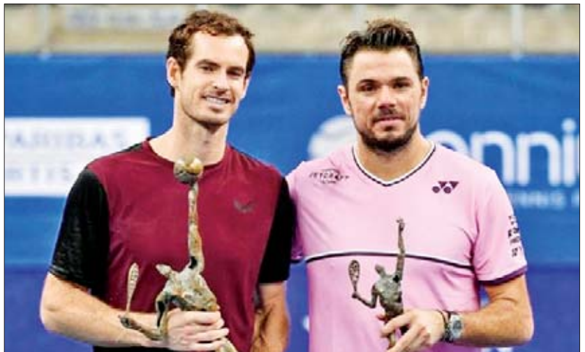
အန်ဒီမာရေးနှင့် ဝေါရင်ကာ

နိုင်ခဲ့တဲ့အပြင် လာမယ့်လအတွင်းမှာ မက်ဒရစ်မြို့၌ ကျင်းပမယ့် ဒေးဗစ်လားပြိုင်ပွဲမှာ ဗြိတိန်ကိုယ်စား ပြုဝင်ရောက်ယှဉ်ပြိုင်မယ်လို့လည်း သိရပါတယ်။