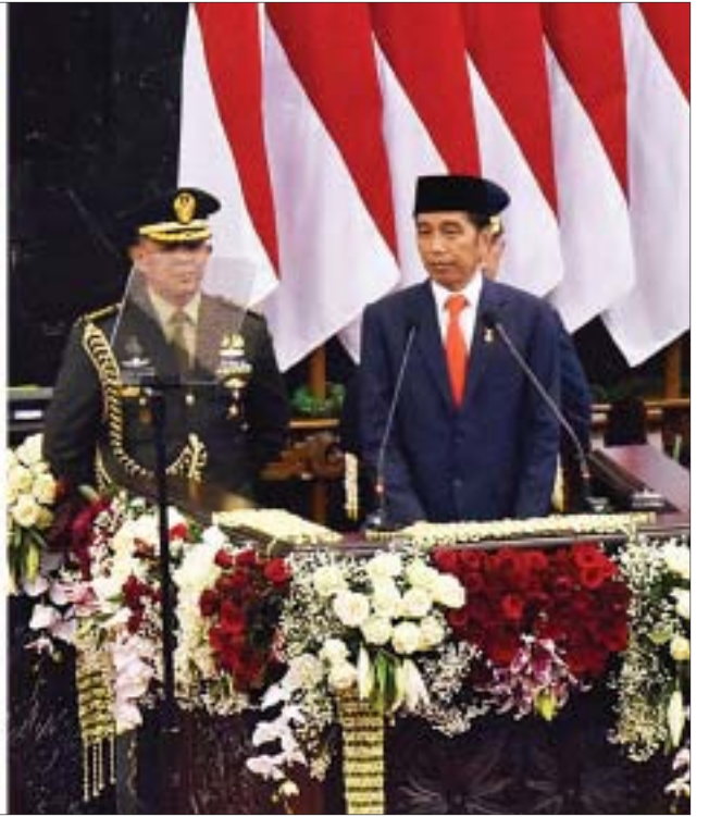
ဒုတိယသမ္မတ ဦးဟင်နရီဗန်ထီးယူနှင့် အာဆီယံနိုင်ငံများ၊ အာဆီယံနှင့် မိတ်ဖက်နိုင်ငံများမှ နိုင်ငံအကြီးအကဲ၊ အစိုးရအဖွဲ့အကြီးအကဲများ အင်ဒိုနီးရှားသမ္မတနိုင်ငံ အစိုးရသစ်ကျမ်းသစ္စာကျိန်ဆိုပွဲ အခမ်းအနားသို့ တက်ရောက်စဉ်နှင့် အင်ဒိုနီးရှားသမ္မတနိုင်ငံသမ္မတ မစ္စတာ ဂျိုကိုဝီဒိုဒို မိန့်ခွန်းပြောကြားစဉ်။

ဂျကာတာ အောက်တိုဘာ ၂၀ အင်ဒိုနီးရှားသမ္မတနိုင်ငံ ဂျကာတာမြို့တွင် ရောက်ရှိနေသည့် ဒုတိယသမ္မတ ဦးဟင်နရီဗန်ထီးယူသည် ယနေ့မွန်းလွဲ ၃ နာရီခွဲတွင် ဂျကာတာမြို့ရှိ ပြည်သူ့ အတိုင်ပင်ခံလွှတ်တော်၌ ကျင်းပသည့် အင်ဒိုနီးရှားသမ္မတနိုင်ငံ အစိုးရသစ် ကျမ်းသစ္စာကျိန်ဆိုပွဲ အခမ်းအနားသို့ တက်ရောက်သည်။