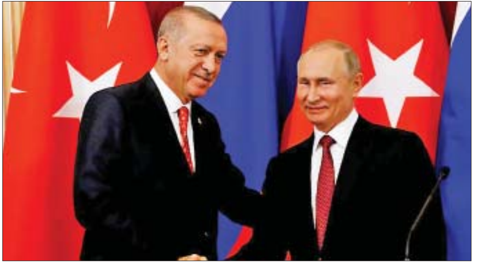
ရုရှားသမ္မတ ဗလာဒီမာပူတင်နှင့် တူရကီသမ္မတ အာဒိုဂန်တို့ တွေ့ဆုံစဉ်။

ရုရှားနိုင်ငံသည် ယခုအခါ တူရကီ၊ ကာဒ်တပ်ဖွဲ့နှင့် ဆီးရီးယားအစိုးရတို့အကြား ကြားဝင်စေ့စပ်ပေးလျက်ရှိ သည်။ ဆီးရီးယားနိုင်ငံမြောက်ပိုင်း၌ ငါးရက်ကြာ ထိုးစစ်ဆင်မှုရပ်ဆိုင်းရန် တူရကီနှင့် အမေရိကန်နိုင်ငံတို့က အောက်တိုဘာ ၁၇ ရက်တွင် သဘောတူခဲ့သည်။ တိုက်ခိုက် မှုများ ရပ်တန့်ခြင်းမရှိကြောင်း တူရကီနှင့် ကာဒ်တပ်ဖွဲ့တို့က အပြန်အလှန်စွာလျက်ရှိသည်။ ဆီးရီးယားနယ်စပ်မှ အကြမ်းဖျင်းအားဖြင့် ကီလိုမီတာ ၃၀ အကွာအထိ ကာဒ်တပ်ဖွဲ့များကို ဖယ်ရှား၍ တူရကီက ထိန်းချုပ်မည့် “အပစ်အခတ်ရပ်စဲရေးဇုန်” တစ်ခု တည်ထောင်ရန် တူရကီနိုင်ငံက ရည်မှန်းနေသည်။ ကိုးကား-အင်န်အီတီချီကော၊ ဘာသာပြန် - ကျော်ထိုက်စိုး