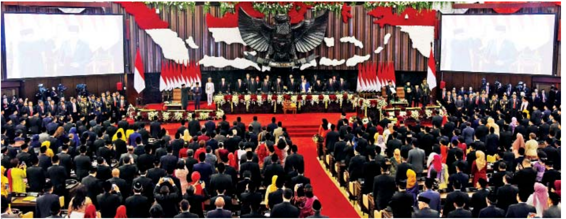
အင်ဒိုနီးရှားသမ္မတနိုင်ငံ အစိုးရသစ်ကျမ်းသစ္စာကျိန်ဆိုပွဲ အခမ်းအနား ကျင်းပစဉ်။

အင်ဒိုနီးရှားသမ္မတနိုင်ငံမှ နိုင်ငံအကြီးအကဲများ၊ အစိုးရအဖွဲ့ အကြီးအကဲများ၊ အာဆီယံနှင့် မိတ်ဖက်နိုင်ငံများမှ အစိုးရအဖွဲ့အကြီးအကဲများနှင့် တာဝန်ရှိသူများက တစ်ဦးချင်းအလှည့်ကျ နှုတ်ဆက်ကြရာ ဒုတိယသမ္မတ ဦးဟင်နရီဗန်ထီးယူကလည်း အင်ဒိုနီးရှားနိုင်ငံသမ္မတနှင့် ဒုတိယသမ္မတတို့အား ရင်းရင်းနှီးနှီးနှုတ်ဆက်ပြီး ဂုဏ်ယူဝမ်းမြောက်စကားပြောကြားသည်။