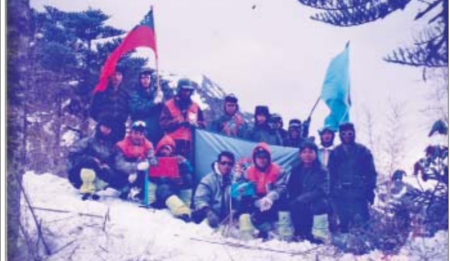
အီမောဘွန်းရေခဲတောင် အမြင့်ပေ ၁၃၃၅၀ မြန်မာနိုင်ငံနှင့် တရုတ်နိုင်ငံနယ်စပ်၊ ရန်ကုန်တက္ကသိုလ်ခြေလျင်တောင်တက်အသင်း (ဧပြီလ-၂၀၀၀) နှင့် (နိုဝင်ဘာလ-၂၀၀၀)