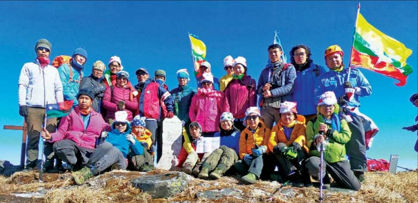
စာရာမေတီတောင် အမြင့်ပေ ၁၂၅၅၃၊ အိန္ဒိယ-မြန်မာနယ်စပ် နယ်နိမိတ်ကျောက်တိုင်အမှတ်(၁၃၈)၊ တက္ကသိုလ်ခြေလျင်တောင်တက်အသင်း၊ သဘာဝခေါ်သံဖောင်ဒေးရှင်း

ထိုသို့ခက်ခဲကြမ်းတမ်းသည့် သဘာဝတရားကို ယှဉ်ပြိုင်ခြင်းဖြင့် ခြေလျင်တောင်တက်အားကစားသမားများသည် တစ်ဦးနှင့်တစ်ဦး ပူးပေါင်းဆောင်ရွက်တတ်လာခြင်း၊ အတ္တမာနကို လျှော့ချနိုင်ခြင်း၊ ချစ်ခင်စည်းလုံးတတ်လာခြင်း၊ အများအတွက်ကြည့်မြင်တတ်သော စိတ်ဓာတ်များ ဖွံ့ဖြိုးလာခြင်း စသောအကျိုးတရားများ ရရှိလာသလို အခက်အခဲဟူသမျှကို မလျှော့သော ဇွဲသတ္တိတို့ဖြင့် ရင်ဆိုင်ကျော်ဖြတ်ကာ အောင်မြင်မှုကို ရယူလိုသော စိတ်ဓာတ်ကောင်းများကို ပြုစုပျိုးထောင် တည်ဆောက်ပေးနေသောကြောင့် လူငယ်လူရွယ်များ အတွက် ကာယ၊ ဉာဏ၊ စိတ်ဓာတ်စွမ်းအားမြင့်မားစေရန် လေ့ကျင့်ပေးနေသော အားကစားနည်းဖြစ်သည်။ ကိုယ်ခန္ဓာရပ်ပိုင်းဖွံ့ဖြိုးရေးသာမက စိတ်အားသတ္တိကိုပါ