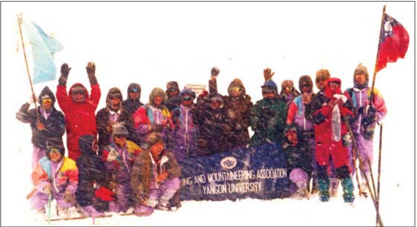
ဖွဲ့စည်းရေးခေတ် အမြင့်ပေ ၁၁၈၀၀၊ ရန်ကုန်တက္ကသိုလ်ခြေလျင်တောင်တက်အသင်း ( ၂၄ - မတ် - ၁၉၉၈ )

မိမိပိုင်ဆိုင်ရာနေရာ အိမ်ခြံဝင်းပင်ဖြစ်သော်လည်း လူနေသည်မှာ ကြာလာပါက ကျူးကျော်ဝင်ရောက်နေထိုင်သူများရှိလာနိုင်သည့် သဘာဝအတိုင်း မိမိနိုင်ငံ၊ မိမိပိုင်နက်ဟုဆိုသော်လည်း မိမိတို့နိုင်ငံသားများ မရောက်ရှိသည်မှာ ကြာလာပါက အခြားနိုင်ငံသားများ ကျူးကျော်ကာ သဘာဝတွင်းထွက်သယံဇာတများ