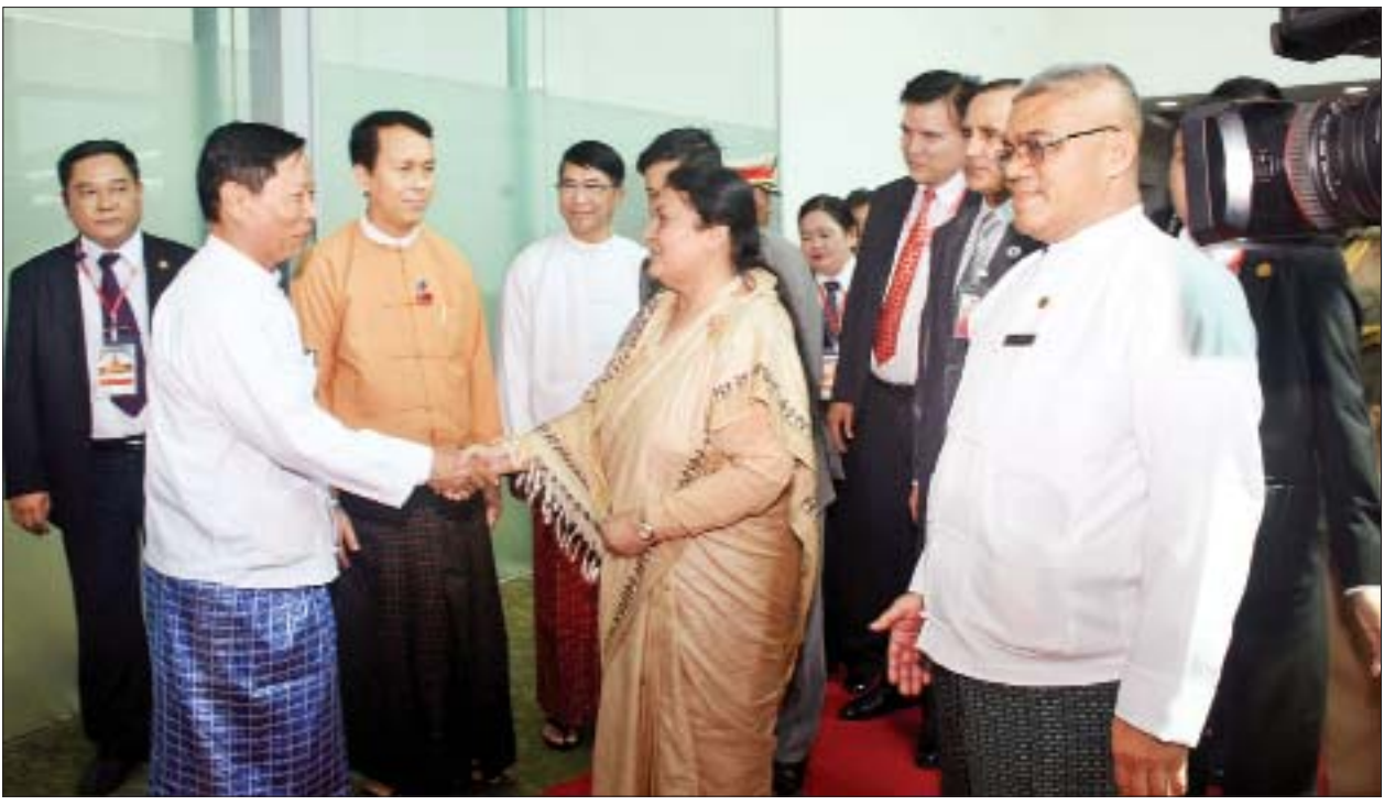
နီပေါဖက်ဒရယ် ဒီမိုကရက်တစ်သမ္မတနိုင်ငံ သမ္မတ မစ္စင် ဘီဒီယာ ဒေဗီ ဘန်ဒါရီ ဦးဆောင်သည့် ချစ်ကြည်ရေး ကိုယ်စားလှယ်အဖွဲ့အား ပြည်ထောင်စုဝန်ကြီး သူရ ဦးအောင်ကို၊ ရန်ကုန်တိုင်းဒေသကြီး ဝန်ကြီးချုပ် ဦးဖြိုးမင်းသိန်းနှင့် တာဝန်ရှိသူများက ရန်ကုန်အပြည်ပြည်ဆိုင်ရာလေဆိပ်၌ ပို့ဆောင်နှုတ်ဆက်ကြစဉ်။

နေပြည်တော် အောက်တိုဘာ ၂၀ မြန်မာနိုင်ငံ၌ တရားဝင်ချစ်ကြည်ရေး ခရီးရောက်ရှိနေသော နီပေါဖက်ဒရယ် ဒီမိုကရက်တစ်သမ္မတနိုင်ငံ သမ္မတ မစ္စင် ဘီဒီယာ ဒေဗီ ဘန်ဒါရီ ဦးဆောင် သည့် ချစ်ကြည်ရေးကိုယ်စားလှယ် အဖွဲ့သည် ချစ်ကြည်ရေးခရီးစဉ် ပြီးဆုံး၍ ယနေ့ မွန်းလွဲ ၁၂ နာရီ ၂၂ မိနစ်တွင် လေကြောင်းခရီးဖြင့် ရန်ကုန် မြို့မှ ပြန်လည်ထွက်ခွာသွားသည်။ နီပေါနိုင်ငံ သမ္မတနှင့်အဖွဲ့အား သာသနာရေးနှင့် ယဉ်ကျေးမှုဝန်ကြီး ဌာန ပြည်ထောင်စုဝန်ကြီး သူရ ဦးအောင်ကို၊ ရန်ကုန်တိုင်းဒေသကြီး ဝန်ကြီးချုပ် ဦးဖြိုးမင်းသိန်းနှင့် တိုင်းဒေသကြီးဝန်ကြီးများ၊ မြန်မာ နိုင်ငံဆိုင်ရာ နီပေါသံအမတ်ကြီး မစ္စတာ ဘင်းကော့ဒက်စ်၊ နီပေါနိုင်ငံ ဆိုင်ရာ မြန်မာသံအမတ်ကြီး သီရိပျံချို ဦးထွန်းနေလင်းနှင့် တာဝန်ရှိသူများက ရန်ကုန်အပြည်ပြည်ဆိုင်ရာ လေဆိပ်၌ ပို့ဆောင်နှုတ်ဆက်ကြသည်။ ထိုသို့ ပို့ဆောင်စဉ်လေဆိပ်အညှိခန်းမ ၌ နီပေါနိုင်ငံသမ္မတ မစ္စင် ဘီဒီယာ ဒေဗီ ဘန်ဒါရီအား ပြည်ထောင်စု ဝန်ကြီး သူရဦးအောင်ကိုက မြန်မာ