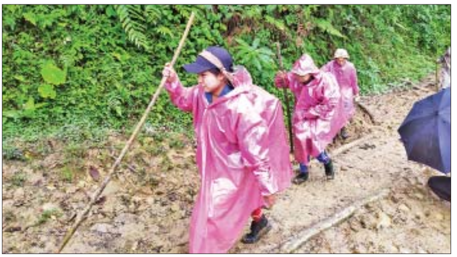
ဖူးလွမ်းကျေးရွာသို့ တောင်တက်ခရီးနှင့်နေသော ဆရာ ဆရာမများ။