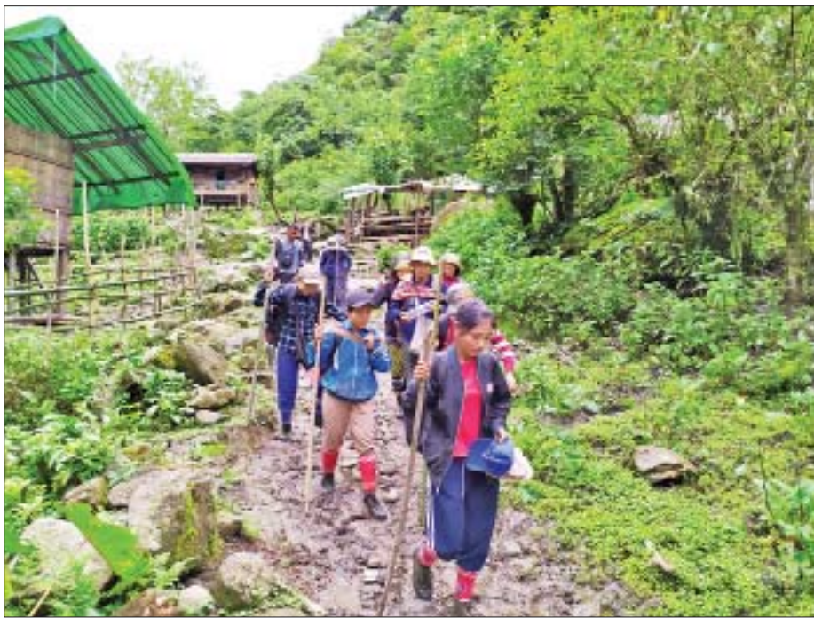
နုဝမ်ဂေါင်စခန်းမှ စတင်ထွက်ခွာလာသော ဆရာ ဆရာမများ။

ထိုလီဆူအမျိုးသမီးလေးများမှာ လွန်စွာချောမောကြသူများမဟုတ်။ အတန်အသင့်ရွက်ကြမ်းရေကျိုအလှမျိုးဖြစ်သည်။ တောသူတောင်သားများပီပီ ဖြိုးလိမ်းခြယ်သထားခြင်းမရှိ။ သို့သော် ရေမြေကိုလိုက်၍ အသားအရေမှာ ဝင်းဝါစိုပြည်နေသဖြင့် ကြည့်ကောင်းနေသည်။ ထိုမိန်းမပျိုလေးနှစ်ဦးမှာ မီးခိုးတလူလူနှင့် မီးဖိုကြီးဘေးတွင် ဖင်ထိုင်ခုံအသေးလေးများဖြင့် ကျကျနနထိုင်ပြီး ကျွန်တော်တို့ ဧည့်သည်များကို ရေနေ့ကြမ်း၊ ကော်ဖီတို့ဖြင့် ဧည့်ခံသည်။ မိသားစုဝင်များအားလုံးက ၎င်းတို့အား ဝိုင်းရံထားကြသည်။ ဤသို့ဧည့်ခံခြင်းမှာ လီဆူတိုင်းရင်းသားတို့၏ ရိုးရာယဉ်ကျေးမှုတစ်ရပ်ဟု ဆိုသည်။ ရိုးရာအစားအစာ တစ်မျိုးအဖြစ် ဒေသဆန်နှင့်ပြုလုပ်ထားသော မုန့်ဖြင့် ဧည့်ခံသည်။ ကျွန်တော်တို့ဆီက ပလာတာနှင့်တူသည်။ တစ်ခုစားထားလျှင် အဆာအလွန်ခံသည်ဟုဆိုသည်။ သို့သော် တစ်ခုကုန်အောင် မနည်းစားရသည်။ ထိုအစားအစာနှင့် ကော်ဖီ၊ ရေနေ့ကြမ်းတို့သုံးဆောင်ပြီး စကားစမြည်ပြောကာ ခရီးဆက်ကြသည်။