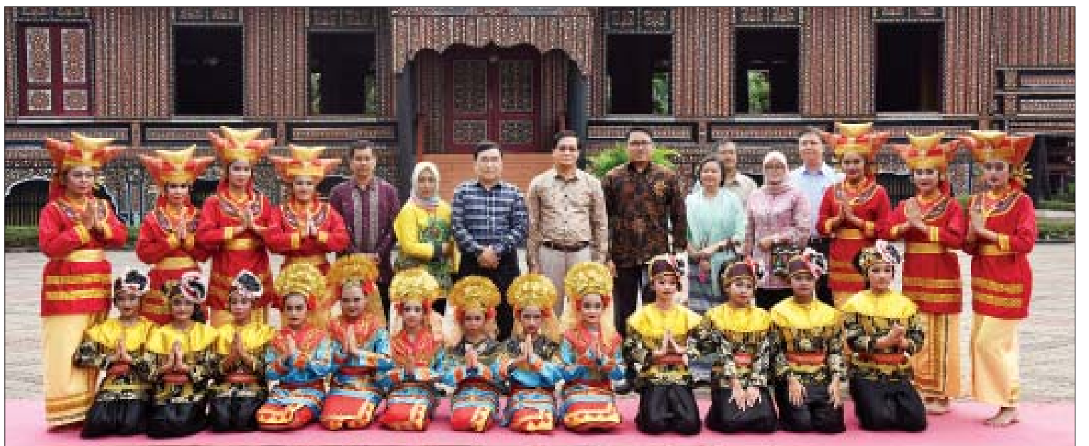
ဒုတိယသမ္မတ ဦးဟင်နရီဗန်ထီးယူ၊ ပြည်ထောင်စုဝန်ကြီး ဒေါက်တာဝင်းမြတ်အေးနှင့် တာဝန်ရှိသူများ စုမားကြား(အနောက်)ပြတိုက်တွင် တိုင်းရင်းသားရိုးရာယဉ်ကျေးမှုအကအဖွဲ့များနှင့်အတူ စုပေါင်းမှတ်တမ်းတင်ဓာတ်ပုံရိုက်စဉ်။

ဒုတိယသမ္မတ ဦးဟင်နရီဗန်ထီးယူနှင့်အဖွဲ့ အင်ဒိုနီးရှားယဉ်ကျေးမှုပြတိုက်အတွင်း ပြသထားသည့် အင်ဒိုနီးရှားတိုင်းရင်းသားများ၏ ရိုးရာယဉ်ကျေးမှုပြခန်းများအား ကြည့်ရှုလေ့လာစဉ်။