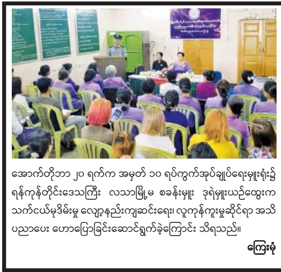
အောက်တိုဘာ ၂၀ ရက်က အမှတ် ၁၀ ရပ်ကွက်အုပ်ချုပ်ရေးမှူးရုံး၌ ရန်ကုန်တိုင်းဒေသကြီး လသာမြို့မ စခန်းမှူး ဒုရဲမှူးယဉ်ထွေးက သက်ငယ်မုဒိမ်းမှု လျော့နည်းကျဆင်းရေး၊ လူကုန်ကူးမှုဆိုင်ရာ အသိပညာပေး ဟောပြောခြင်းဆောင်ရွက်ခဲ့ကြောင်း သိရသည်။

မင်းထက်အောင်(မန်းကိုယ်ပွား)