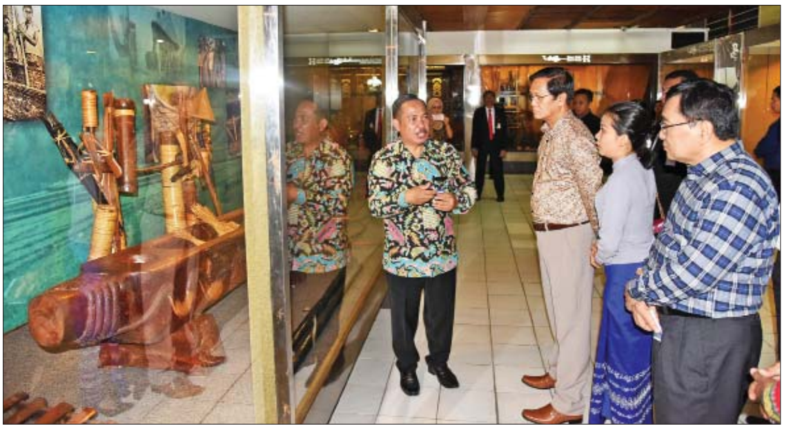
ယဉ်ကျေးမှုဝတ်စုံများကို ပြသထားသည်။ ထို့နောက် ဒုတိယသမ္မတသည် အာဆီယံဆိုင်ရာ မြန်မာအမြဲတမ်းကိုယ်စားလှယ် ဦးမင်းလွင်က တည်ခင်းစည်ခံသည့် နေ့လယ်စာစားပွဲသို့ တက်ရောက်သည်။ သတင်းစဉ်

ပြသထားတမန်းမိနီယပ်ကျေးမူဥယျာဉ်ကို ၁၉၇၅ ခုနှစ်တွင် စတင်ဖွင့်လှစ်ခဲ့ပြီး ဥယျာဉ်အတွင်း အင်ဒိုနီးရှားနိုင်ငံရှိ ပြည်နယ်ဒေသများ၏ ရိုးရာယဉ်ကျေးမှုပြခန်းများကို တည်ဆောက်ထားကာ ပြခန်းများတွင် သက်ဆိုင်ရာ ဒေသခံများ၏ လူနေမှုဘဝများကို ထင်ဟပ်စေသည့် အသုံးအဆောင်ပစ္စည်းများ၊ လက်ထပ်ဝတ်စုံများ၊ အဆို၊ အကသုံး တူရိယာများနှင့် ရိုးရာ