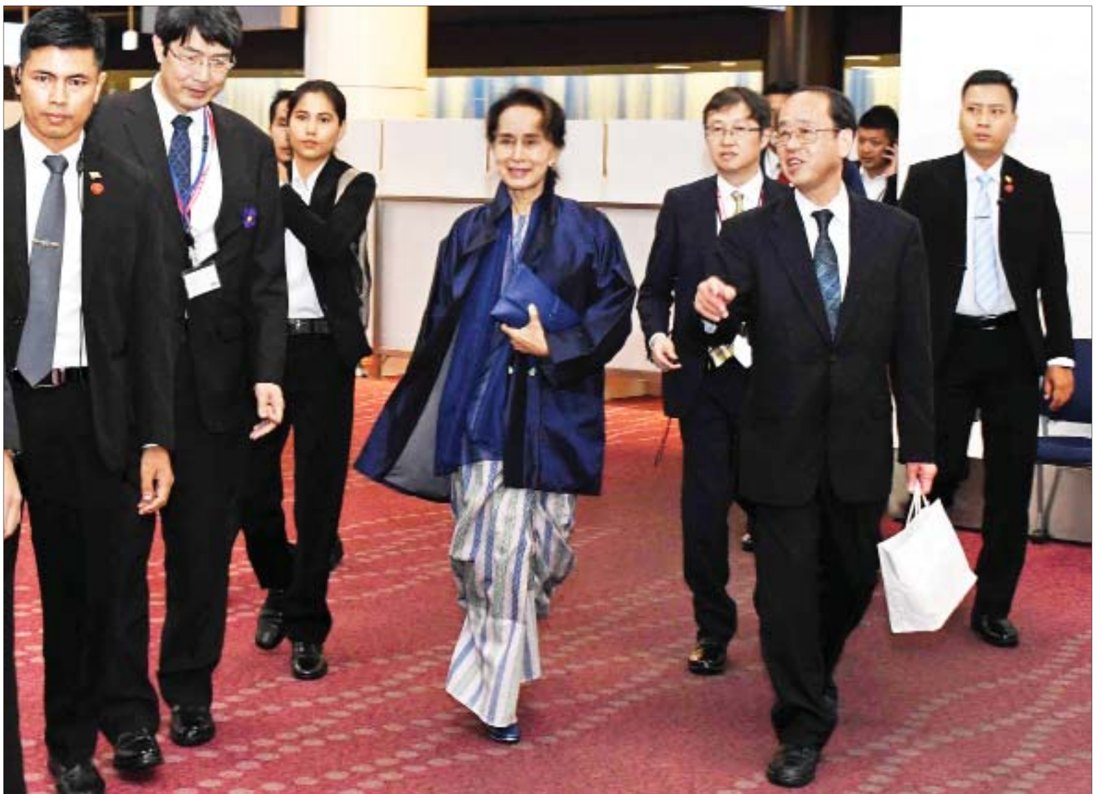
နိုင်ငံတော်၏အတိုင်ပင်ခံပုဂ္ဂိုလ် ဒေါ်အောင်ဆန်းစုကြည်နှင့်အဖွဲ့အား ဂျပန်နိုင်ငံဝန်ကြီးချုပ်၏ အထူးအကြံပေးပုဂ္ဂိုလ် Mr. Hiroto Izumi နှင့် တာဝန်ရှိသူများက ဟာနီဒါအပြည်ပြည်ဆိုင်ရာလေဆိပ်၌ ကြိုဆိုနှုတ်ဆက်ကြစဉ်။

တိုကျို အောက်တိုဘာ ၂၀ နိုင်ငံတော်၏အတိုင်ပင်ခံပုဂ္ဂိုလ် ဒေါ်အောင်ဆန်းစုကြည်သည် ဂျပန်အစိုးရ၏ ဖိတ်ကြားချက်အရ ဂျပန်ဧကရာဇ် နာရှုဟီတို၏ ထီးနန်းတက်ပွဲအခမ်းအနားသို့ တက်ရောက်ရန် ယနေ့နံနက် ၈ နာရီခွဲတွင် အထူးလေယာဉ်ဖြင့် နေပြည်တော်မှ ထွက်ခွာရာ ပြည်ထောင်စုအစိုးရအဖွဲ့ရုံးဝန်ကြီးဌာန ပြည်ထောင်စုဝန်ကြီးဦးမင်းသူ၊ နေပြည်တော်ကောင်စီဥက္ကဋ္ဌ ဒေါက်တာမျိုးအောင်နှင့်