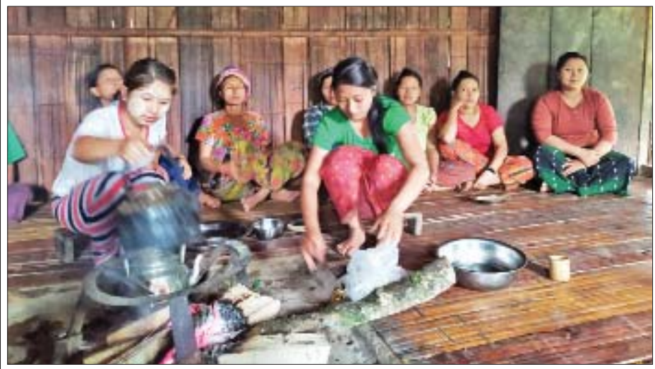
ဖူးလွမ်းရွာမှ လီဆူမိန်းမပျိုလေးများနှင့် မိသားစုတို့၏ ဧည့်ခံမှု။

ဒီဒေသက ကလေးတွေကို ပညာတတ်တွေ ဖြစ်စေချင်ပါတယ်။ ဖြစ်အောင် လည်း စနစ်သစ်ရဲ့ သင်ယူမှု၊ သင်ကြားမှုနဲ့အတူ ကိုယ်စွမ်းညာဏ်စွမ်း ရှိသရွေ့ သင်ကြားပေးသွားမှာ ဖြစ်ပါတယ်။ ဘယ်လိုပဲကြမ်းတမ်းတဲ့ ခရီး ဖြစ်ပါစေ ခေါင်လန်ဖူးဒေသက ကလေးတွေ ပညာတတ်စေချင်တဲ့ စေတနာ ကတော့ ဘယ်အရာနဲ့မှ လဲလို့ရတော့မှာ မဟုတ်တော့ပါဘူး။ ဘာလို့လဲ ဆိုတော့ ဒီခရီးဟာ အလွန်ခက်ခဲကြမ်းတမ်းလှပြီး အသက်နဲ့ရှင်းနှီး ပေးဆပ်ပြီး လာခဲ့ရတဲ့ခရီးဖြစ်နေလို့ပါ