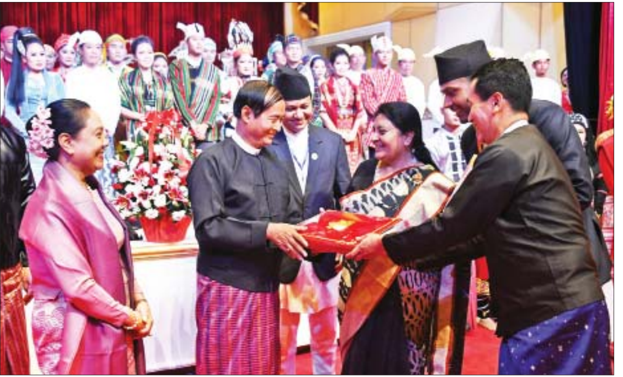
နိုင်ငံတော်သမ္မတ ဦးဝင်းမြင့်နှင့် ဇနီး ဒေါ်ချိုချိုတို့က နီပေါဖက်ဒရယ်ဒီမိုကရက်တစ်သမ္မတနိုင်ငံ သမ္မတ မစ္စစ် ဘီဒီယာ ဒေဗီ ဘန်ဒါရီထံ ခရီးစဉ် မှတ်တမ်းဓာတ်ပုံ အယ်လ်ဘမ်ကို ပေးအပ်စဉ်။

မိတ်ဆွေမြန်မာနိုင်ငံအနေဖြင့် ကဏ္ဍစုံတွင်သိသာထင်ရှားသည့် ရလဒ် ကောင်းများကို တွေ့မြင်ရသည့်အတွက်ကြောင့် အထူးဝမ်းမြောက်မိပါကြောင်း။