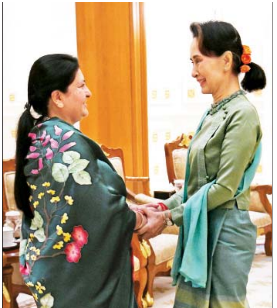
နိုင်ငံတော်၏အတိုင်ပင်ခံပုဂ္ဂိုလ် ဒေါ်အောင်ဆန်းစုကြည် နီပေါဖက်ဒရယ် ဒီမိုကရက်တစ်သမ္မတနိုင်ငံ သမ္မတ မစ္စစ် ဘီဒီယာ ဒေဗီ ဘန်ဒါရီအား ရင်းရင်းနှီးနှီးနှုတ်ဆက်စဉ်။