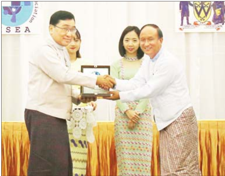
အရေးများ ခံစားခွင့်နှင့် ဥက္ကဋ္ဌရည်မသန်စွမ်း စီးပွားကို ဆောင်ရွက်ပေးရန် မိဘ သို့မဟုတ် ကလေးသူငယ်များ၏ အကောင်းဆုံးအကျိုး အုပ်ထိန်းသူများက ကိုယ်စားစီစဉ်ဆောင်ရွက်

ညီလာခံတွင် လူမှုဝန်ထမ်း၊ ကယ်ဆယ် ရေးနှင့် ပြန်လည်နေရာချထားရေးဝန်ကြီးဌာန ပြည်ထောင်စုဝန်ကြီး ဒေါက်တာဝင်းမြတ်အေး က မသန်စွမ်းသူတိုင်းတွင် မသန်သော်လည်း စွမ်းနိုင်မှုတစ်ခုခုရှိကြရာ စွမ်းနိုင်သူမျှစွမ်း အောင် မြှင့်တင်ပေးရန်နှင့် မည်သည့်မသန်စွမ်း မှုအမျိုးအစားဖြစ်စေ မသန်စွမ်းသူများ၏ အခွင့်အရေးများအပြည့်အဝရရှိရန် လိုအပ် ကြောင်း၊ မသန်စွမ်းကလေးသူငယ်များအတွက် ကလေးသူငယ်အခွင့်အရေးများဆိုင်ရာ ဥပဒေ ၂၀၁၉ ၌ ကလေးသူငယ်များ၏အခြေခံအခွင့်