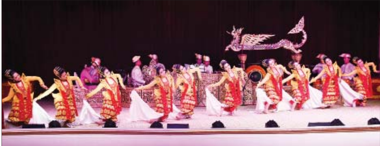
သာသနာရေးနှင့် ယဉ်ကျေးမှုဝန်ကြီးဌာန အနုပညာဦးစီးဌာနမှ အနုပညာရှင်များက ယဉ်ကျေးမှုပဒေသာကပြုဖြင့် ဧည့်ခံဖျော်ဖြေစဉ်။