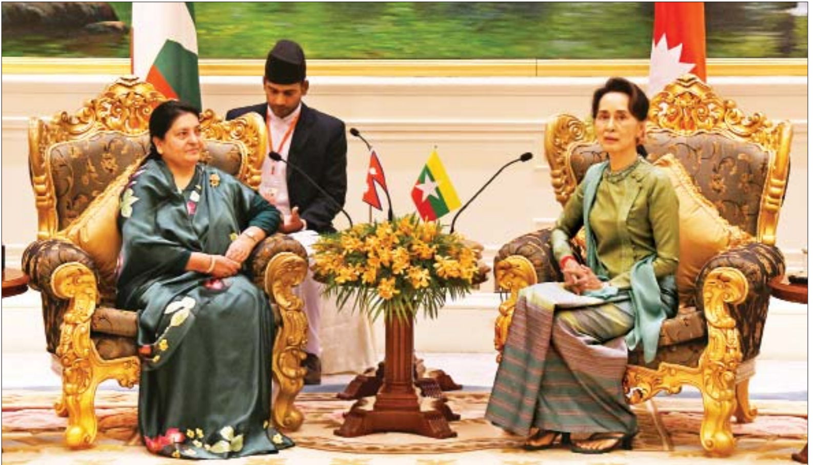
နိုင်ငံတော်၏အတိုင်ပင်ခံပုဂ္ဂိုလ် ဒေါ်အောင်ဆန်းစုကြည်နှင့် နီပေါဖက်ဒရယ် ဒီမိုကရက်တစ်သမ္မတနိုင်ငံ သမ္မတ မစ္စစ် ဘီဒီယာ ဒေဗီ ဘန်ဒါရီတို့ တွေ့ဆုံဆွေးနွေးကြစဉ်။

အဆိုပါ လက်မှတ်ရေးထိုးပွဲတွင် နိုင်ငံတော်၏ အတိုင်ပင်ခံပုဂ္ဂိုလ်နှင့် နီပေါဖက်ဒရယ် ဒီမိုကရက်တစ် သမ္မတနိုင်ငံ သမ္မတတို့ ရှေ့မှောက်၌ ပြည်ထောင်စုသမ္မတမြန်မာနိုင်ငံတော် အစိုးရနှင့် နီပေါဖက်ဒရယ်ဒီမိုကရက်