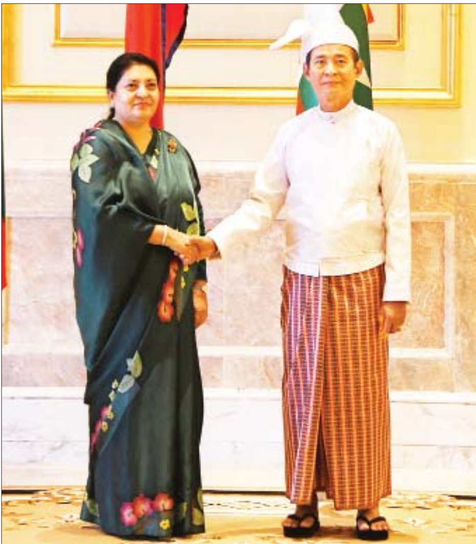
နိုင်ငံတော်သမ္မတ ဦးဝင်းမြင့်နှင့် နီပေါဖက်ဒရယ် ဒီမိုကရက်တစ်သမ္မတနိုင်ငံ သမ္မတ မစ္စစ် ဘီဒီယာ ဒေဗီ ဘန်ဒါရီတို့ မှတ်တမ်းတင်ဓာတ်ပုံရိုက်ကြစဉ်။