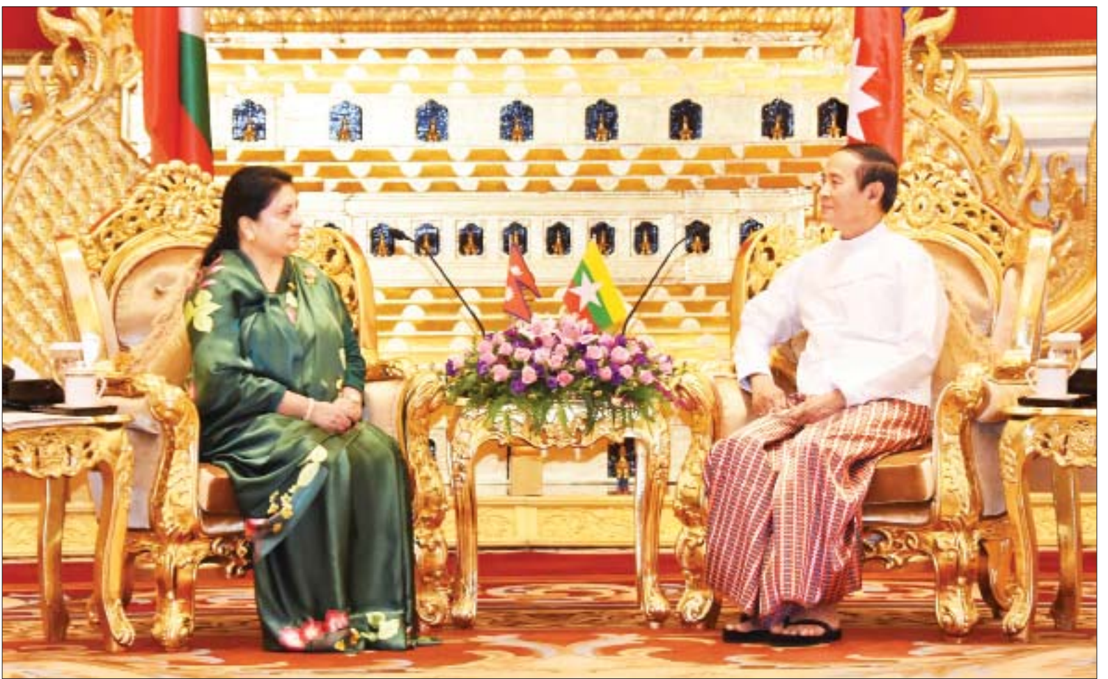
နိုင်ငံတော်သမ္မတ ဦးဝင်းမြင့်နှင့် နီပေါဖက်ဒရယ် ဒီမိုကရက်တစ်သမ္မတနိုင်ငံ သမ္မတ မစ္စစ် ဘီဒီယာ ဒေဗီ ဘန်ဒါရီတို့ တွေ့ဆုံဆွေးနွေးစဉ်။

အမြင်ချင်းဖလှယ်ဆွေးနွေး တွေ့ဆုံစဉ် နှစ်နိုင်ငံချစ်ကြည် ရင်းနှီးမှုနှင့် ပူးပေါင်းဆောင်ရွက်မှု ပိုမိုတိုးတက်ခိုင်မာရေး၊ ကုန်သွယ်ရေး နှင့် ရင်းနှီးမြှုပ်နှံမှုကဏ္ဍတိုးမြှင့်ရေး၊ မြန်မာ-နီပေါ နှစ်နိုင်ငံ သံတမန် ဆက်ဆံရေးထူထောင်မှု နှစ်(၆၀)ပြည့် အခမ်းအနားများနှင့်အတူ ခရီးသွား ကဏ္ဍမြှင့်တင်ရေးနှင့် ယဉ်ကျေးမှု ဖလှယ်ရေး အထိမ်းအမှတ်ပွဲများ ကျင်းပရေး၊ နီပေါနိုင်ငံ၏ ခရီးသွားနှစ်