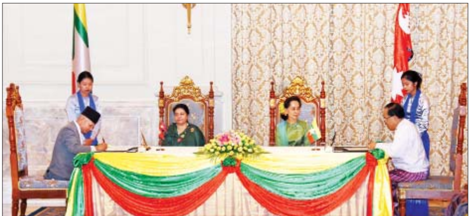
နိုင်ငံတော်၏အတိုင်ပင်ခံပုဂ္ဂိုလ် ဒေါ်အောင်ဆန်းစုကြည်နှင့် နီပေါဖက်ဒရယ် ဒီမိုကရက်တစ်သမ္မတနိုင်ငံ သမ္မတ မစ္စစ် ဘီဒီယာ ဒေဗီ ဘန်ဒါရီတို့ ရှေ့မှောက်၌ နှစ်နိုင်ငံအကြား ခရီးသွားလုပ်ငန်း ပူးပေါင်းဆောင်ရွက်ရေးဆိုင်ရာ နားလည်မှုစာချုပ်လွှာကို အပြည်ပြည်ဆိုင်ရာ ပူးပေါင်းဆောင်ရွက်ရေးဝန်ကြီးဌာန ပြည်ထောင်စုဝန်ကြီး ဦးကျော်တင်နှင့် နီပေါနိုင်ငံခြားရေးဝန်ကြီး မစ္စတာ ပရာဒိပ် ကူမာ ဂျန်ဝါရီတို့က လက်မှတ်ရေးထိုးကြစဉ်။