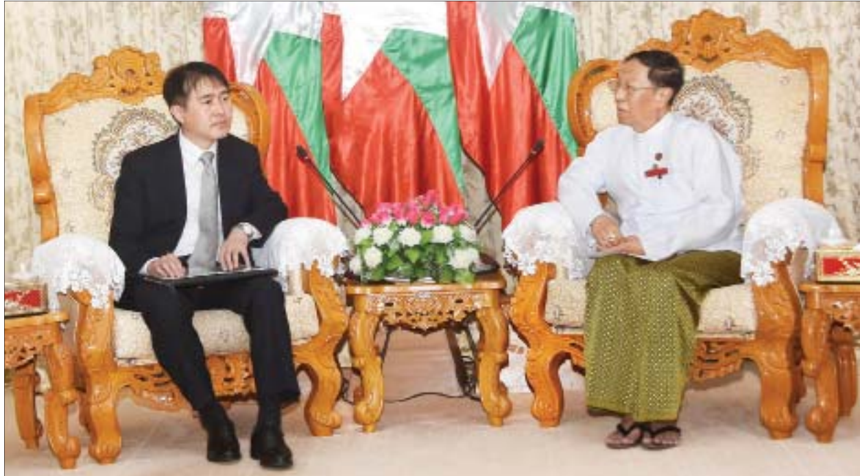
ပြည်ထောင်စုရွေးကောက်ပွဲကော်မရှင် ဥက္ကဋ္ဌ ဦးလှသိန်း ကိုရီးယားသမ္မတနိုင်ငံ သံအမတ်ကြီး မစ္စတာလီဆွန်ဟွာအား လက်ခံတွေ့ဆုံစဉ်။