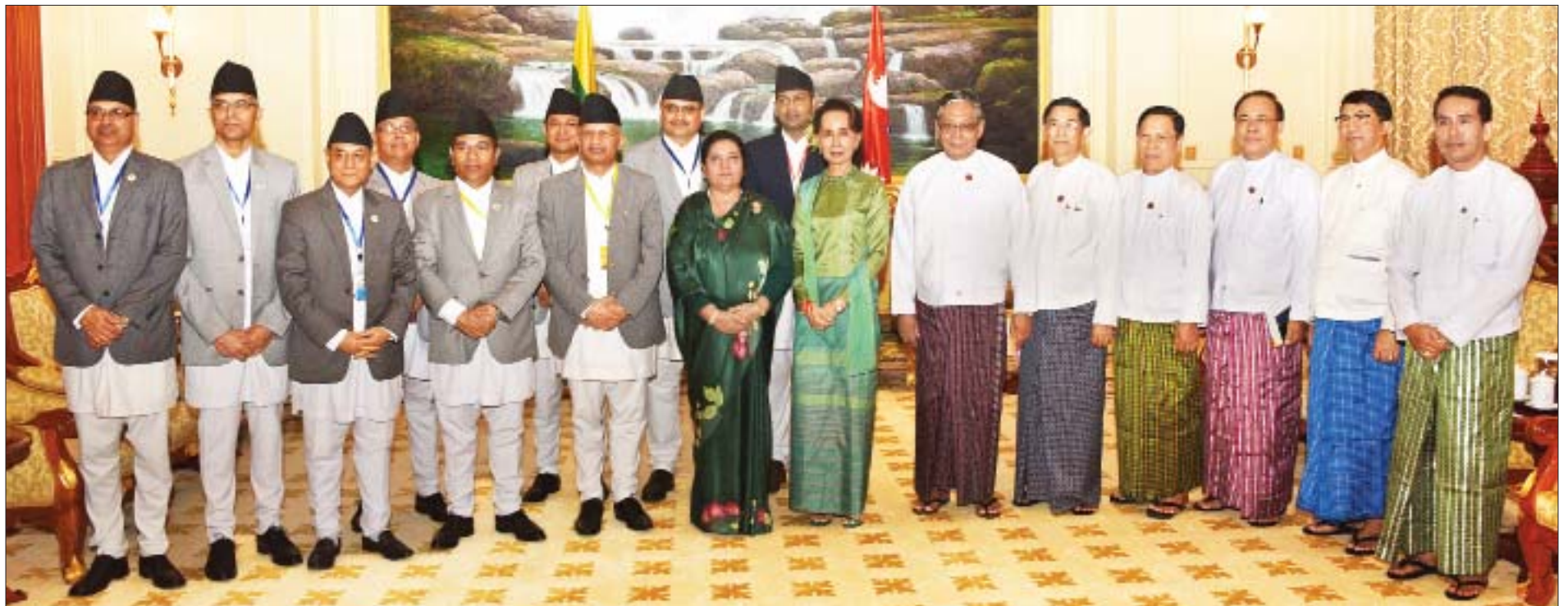
နိုင်ငံတော်၏အတိုင်ပင်ခံပုဂ္ဂိုလ် ဒေါ်အောင်ဆန်းစုကြည်နှင့် နီပေါဖက်ဒရယ် ဒီမိုကရက်တစ်သမ္မတနိုင်ငံ သမ္မတ မစ္စစ် ဘီဒီယာ ဒေဗီ ဘန်ဒါရီတို့ အဖွဲ့ဝင်များနှင့်အတူ စုပေါင်းမှတ်တမ်းတင် ဓာတ်ပုံရိုက်စဉ်။