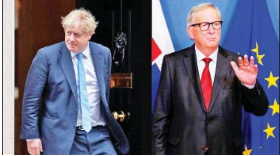
ဗြိတိန်ဝန်ကြီးချုပ် ဘောရစ်ဂျွန်ဆင် ဥရောပကော်မရှင်ဥက္ကဋ္ဌ ဂျန်ကာ

နောက် ကျင်းပသွားမည်ဟု စီစဉ်ထားသော်လည်း တိုင်းဖွန်း ဟာဂီဘစ်အလွန် ပြန်လည်ထူထောင်ရေးလုပ်ငန်းများ လုပ်ဆောင်ရမည်ဖြစ်သည့်အတွက် နိုဝင်ဘာ ၁၀ ရက်မှသာ ကျင်းပနိုင်မည်ဖြစ်ကြောင်း အစိုးရအဖွဲ့က ဆိုသည်။ နန်းတက်ပွဲအခမ်းအနားတွင် ဂျပန်ဧကရာဇ်က မိန့်ခွန်းတစ်ရပ် ပြောကြားမည်ဖြစ်သည်။ နန်းတက်ပွဲ အခမ်းအနားကျင်းပမှုနှင့် အောင်ပွဲခံ စီတန်းလှည့်လည် ခြင်းများနှင့်ပတ်သက်ပြီး အစီအစဉ်အတိအကျကို အောက်တိုဘာ ၁၈ ရက်တွင် ကျင်းပမည့် အစိုးရအဖွဲ့ အစည်းအဝေးတွင် အတည်ပြုမည်ဖြစ်ကြောင်း သိရသည်။ ကိုးကား - အင်န်အိတ်ချ်ကေ ဘာသာပြန် - အောင်ကျော်ကျော်