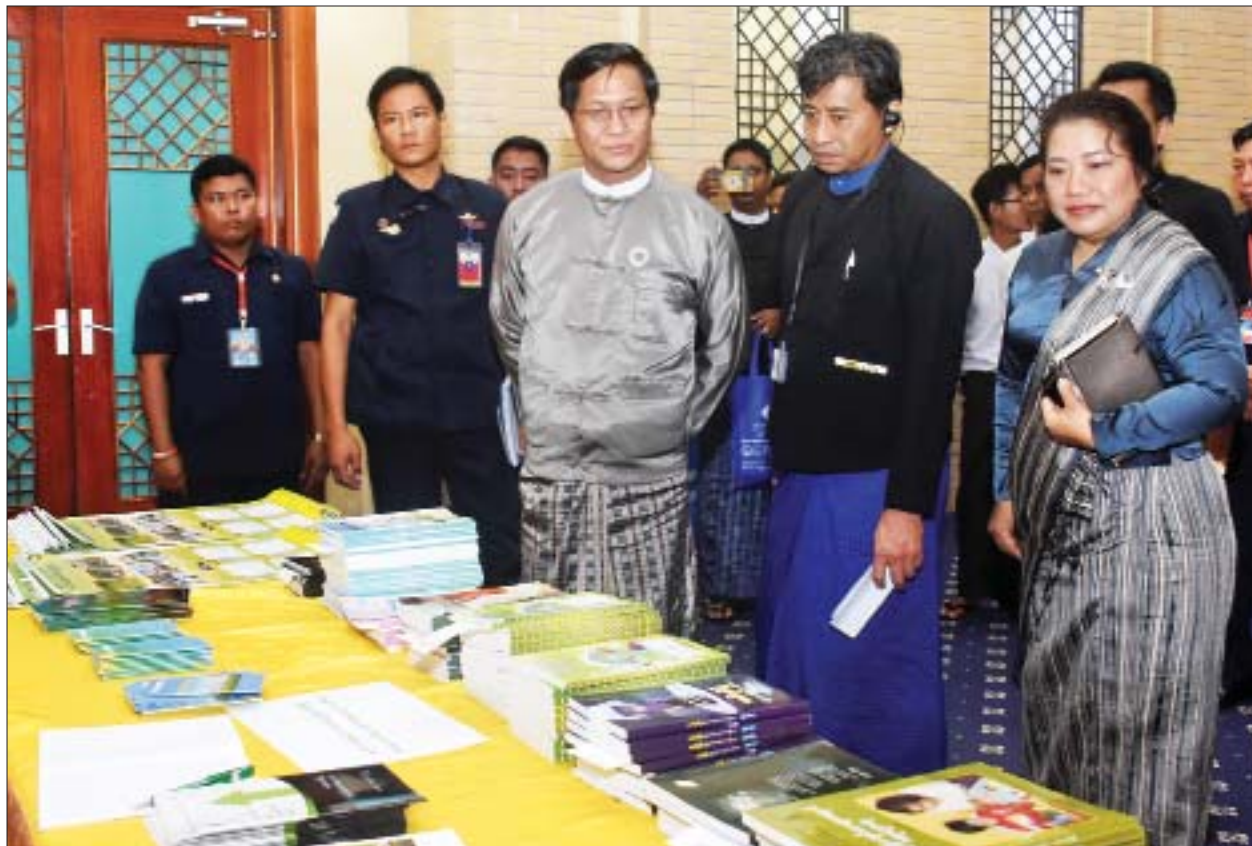
ဒုတိယသမ္မတ ဦးဟင်နရီဗန်ထီးယူနှင့်ဇနီး ဒေါက်တာအဲန်နာရွှေလွမ်း၊ ဒုတိယအကြိမ် မြန်မာနိုင်ငံ ဉာဏ်ရည်မသန်စွမ်းသူများဆိုင်ရာ ပညာရေးညီလာခံတွင် ခင်းကျင်းပြသထားသည့် ပြခန်းများကို လှည့်လည်ကြည့်ရှုစဉ်။

ရသကဲ့သို့ ပူးပေါင်းဆောင်ရွက်မှုဆိုင်ရာအစီအစဉ်များတွင် ဖယ်ကြည့်ချက်လုပ် ထားခြင်းခံနေရသည့်အတွက် ကမ္ဘာတစ်ဝန်းရှိ မသန်စွမ်းသူတိုင်း လူ့အခွင့် အရေးများနှင့် အခြေခံလွတ်လပ်ခွင့်များကို ညီမျှစွာ အပြည့်အဝရရှိရေးတို့ကို ကာကွယ်စောင့်ရှောက်ရန်၊ တိုးမြှင့်လုပ်ဆောင်နိုင်ရန်၊ သေချာစေရန်နှင့် မသန် စွမ်းသူများ၏ မွေးရာပါဂုဏ်သိက္ခာကို ပိုမိုလေးစားမှုရှိရန်ရည်ရွယ်ပြီး ကုလ သမဂ္ဂအထွေထွေညီလာခံမှ မသန်စွမ်းသူများ၏ အခွင့်အရေးများဆိုင်ရာ ကုလသမဂ္ဂကွန်ဗင်းရှင်း - United Nations Convention on the Rights of the Persons with Disabilities (UNCRPD) ကို ၂၀၀၆ ခုနှစ် ဒီဇင်ဘာ ၁၃ ရက် တွင် အတည်ပြုပြဋ္ဌာန်းပေးခဲ့ပါကြောင်း။