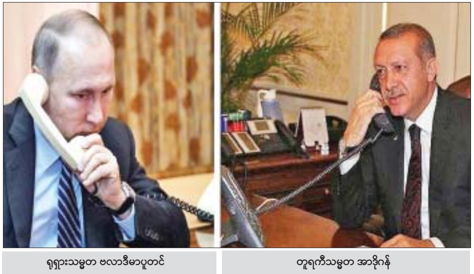
ရုရှားသမ္မတ ဗလာဒီမာပူတင်

မန်ဘစ်၌ ကင်းလှည့်စောင့်ကြပ်လျက်ရှိသည်။ အောက်တိုဘာ ၁၅ ရက်တွင် ဆီးရီးယားတပ်ဖွဲ့များ၏ စိန်ပြောင်းဖြင့် တိုက်ခိုက်မှုကြောင့် တူရကီတပ်ဖွဲ့ဝင် နှစ်ဦးကျဆုံးခဲ့သည်။ တူရကီနှင့် ဆီးရီးယားတပ်ဖွဲ့ကြား တိုက်ခိုက်မှုများ တားဆီးရန် ရုရှားနိုင်ငံက ကင်းလှည့်စောင့်ကြပ်မှုတွင် ပူးပေါင်းခဲ့သည်ဟု လေ့လာသူများက ပြောသည်။ ရုရှားနိုင်ငံက နယ်စပ်ဒေသတစ်လျှောက် လုံခြုံရေးထိန်းသိမ်းသည့် တူရကီနိုင်ငံ၏ လိုအပ်ချက်များကို နားလည်သဘောပေါက်သော်လည်း လိုအပ်ချက်မှာ တရားဝင်ဖို့ လိုအပ်ကြောင်း လာရော့ဗ်က ပြောကြားခဲ့သည်။ ရုရှားသမ္မတ ဗလာဒီမာပူတင်နှင့် တူရကီသမ္မတ အာဒိုဂန်တို့သည် လာမည့် အောက်တိုဘာ ၂၂ ရက်တွင် ရုရှားနိုင်ငံ၌ တွေ့ဆုံမည်ဖြစ်သည်။ ကိုးကား- အင်န်အိတ်ချ်ကော့ဘာသာပြန် - ကျော်ထိုက်စိုး