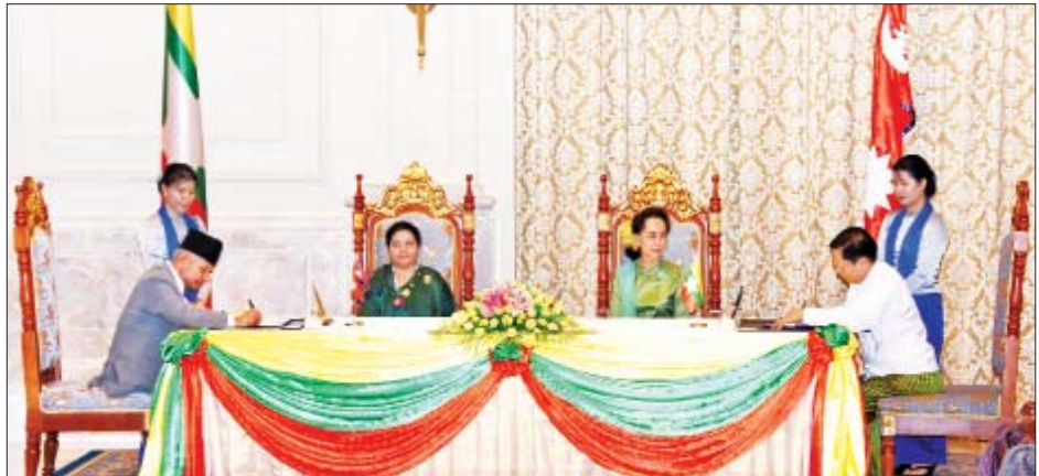
နိုင်ငံတော်၏အတိုင်ပင်ခံပုဂ္ဂိုလ် ဒေါ်အောင်ဆန်းစုကြည်နှင့် နီပေါဖက်ဒရယ် ဒီမိုကရက်တစ်သမ္မတနိုင်ငံ သမ္မတ မစ္စစ် ဘီဒီယာ ဒေဗီ ဘန်ဒါရီတို့ ရှေ့မှောက်၌ နှစ်နိုင်ငံအကြား ယဉ်ကျေးမှု ပူးပေါင်းဆောင်ရွက်ရေးဆိုင်ရာ နားလည်မှု စာချုပ်လွှာကို သာသနာရေးနှင့် ယဉ်ကျေးမှုဝန်ကြီးဌာန ပြည်ထောင်စုဝန်ကြီး သူရဦးအောင်ကိုနှင့် နီပေါနိုင်ငံခြားရေး ဝန်ကြီး မစ္စတာ ပရာဒိပ် ကူမာ ဂျန်ဝါရီတို့က လက်မှတ်ရေးထိုးကြစဉ်။

ဝန်ကြီး မစ္စတာ ပရာဒိပ် ကူမာ ဂျန်ဝါရီ တို့ကလည်းကောင်း လက်မှတ်ရေးထိုး ကြပြီး အပြန်အလှန်လဲလှယ်ကြ သတင်းစဉ်