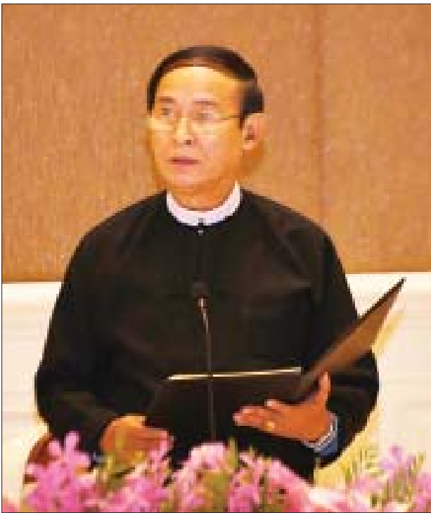
နိုင်ငံတော်သမ္မတ ဦးဝင်းမြင့် နှုတ်ခွန်းဆက်စကား ပြောကြားစဉ်။

ပြီးခဲ့သည့်နှစ်ကာလများအတွင်း အဆင့်အသီးသီးမှ ကိုယ်စားလှယ်များ ၏ အပြန်အလှန်ခရီးစဉ်များသည် မိမိတို့နှစ်နိုင်ငံအကြား ရှိရင်းစွဲချစ်ကြည် ရင်းနှီးသည့် ဆက်ဆံရေးကို ပိုမိုခိုင်မာစေပြီး ကဏ္ဍစုံပူးပေါင်းဆောင်ရွက်မှု များကို ပိုမိုနက်ရှိုင်းစေခဲ့သည်ကို ဝမ်းမြောက်ဖွယ် တွေ့မြင်ရပါကြောင်း၊ ယနေ့ အစောပိုင်းတွင် အဆွေတော်သမ္မတကြီးနှင့် မိမိတို့တွေ့ဆုံခဲ့စဉ် မိမိတို့နှစ်နိုင်ငံ နှင့် ပြည်သူများ၏ အကျိုးစီးပွားကို အကောင်းဆုံးဖော်ဆောင်ပေးသွားနိုင်ရေး