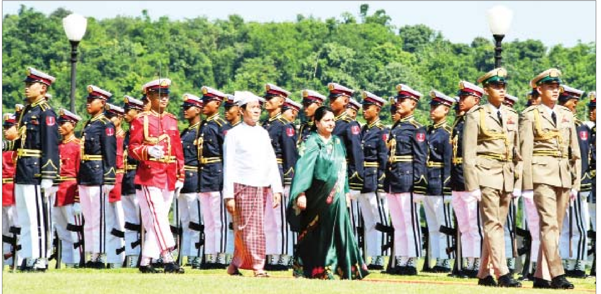
နိုင်ငံတော်သမ္မတ ဦးဝင်းမြင့်နှင့် နီပေါဖက်ဒရယ် ဒီမိုကရက်တစ်သမ္မတနိုင်ငံ သမ္မတ မစ္စစ် ဘီဒီယာ ဒေဗီ ဘန်ဒါရီတို့ ဂုဏ်ပြုတပ်ဖွဲ့ကို စစ်ဆေးကြစဉ်။