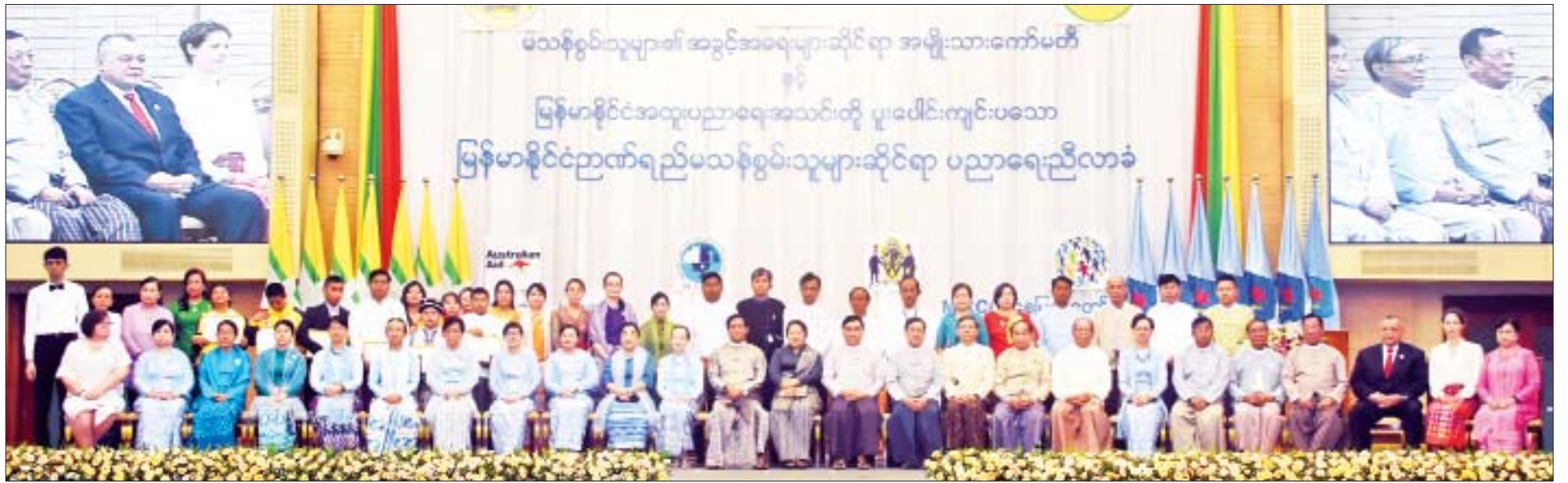
ဒုတိယသမ္မတ ဦးဟင်နရီဗန်ထီးယူနှင့်ဇနီး ဒေါက်တာအဲန်နာရွှေလွမ်း၊ ပြည်ထောင်စုဝန်ကြီးများနှင့် ဒုတိယအကြိမ် မြန်မာနိုင်ငံ ဉာဏ်ရည်မသန်စွမ်းသူများဆိုင်ရာ ပညာရေးညီလာခံဖွင့်ပွဲအခမ်းအနားသို့ တက်ရောက်လာကြသူများ စုပေါင်းမှတ်တမ်းတင်ဓာတ်ပုံရိုက်စဉ်။

* ကျော့ဖုံးမှ တစ်ဦးနှုန်းပါဝင်နေပြီး မသန်စွမ်းကလေးသူငယ် ၈၀ ရာခိုင်နှုန်းသည် ဖွံ့ဖြိုးဆဲ နိုင်ငံများတွင် နေထိုင်လျက်ရှိသည်ကို ဖော်ပြထားပါကြောင်း၊ ကမ္ဘာတစ်ဝန်းတွင် ရှိသော မသန်စွမ်းသူများသည် ရုပ်ပိုင်းဆိုင်ရာ၊ လူမှုရေးပိုင်းဆိုင်ရာ၊ စီးပွားရေး ပိုင်းဆိုင်ရာနှင့် စိတ်သဘောထားပိုင်းဆိုင်ရာ အတားအဆီးများကို ရင်ဆိုင် ကြုံတွေ့နေရပြီး လူ့အသိုက်အဝန်းအတွင်း၌ အပြည့်အဝ ပါဝင်ဆောင်ရွက်ခွင့် မရရှိကြပါကြောင်း၊ မသန်စွမ်းသူများသည် ကမ္ဘာ့အဆင်းရဲဆုံးလူသားများထဲ တွင် အချိုးအစားကြီးမားစွာပါဝင်နေပြီး ပညာရေး၊ အလုပ်အကိုင်၊ ကျန်းမာရေး စောင့်ရှောက်မှု၊ လူမှုရေးနှင့် ဥပဒေပိုင်းဆိုင်ရာ စသည့် အခြေခံလိုအပ်ချက် အရင်းအမြစ်များကို ပြည့်ဝစွာမရရှိကြသည့်အပြင် သေဆုံးမှုနှုန်းမှာလည်း မြင့်မားနေပါကြောင်း။