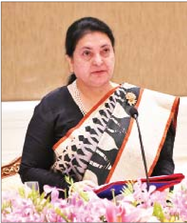
နီပေါဖက်ဒရယ်ဒီမိုကရက်တစ်သမ္မတနိုင်ငံ သမ္မတ မစ္စင် ဘီဒီယာ ဒေဗီ ဘန်ဒါရီ နှုတ်ခွန်းဆက်စကား ပြောကြားစဉ်။

အတွက် ဆက်ဆံမှုတိုးတက်ခိုင်မာစေရေးနှင့် ပူးပေါင်းဆောင်ရွက်မှု ပိုမိုတိုးမြှင့် ဆောင်ရွက်ရေးဆိုင်ရာကိစ္စရပ်များကို ရင်းနှီးပွင့်လင်းစွာ ဆွေးနွေးအမြင်ချင်း ဖလှယ်နိုင်ခဲ့ပါကြောင်း၊ မိမိတို့ အတူတကွ ကြိုးပမ်းအားထုတ်မှုဖြင့် ကုန်သွယ် မှုနှင့် ရင်းနှီးမြှုပ်နှံမှု၊ ခရီးသွားလာရေး၊ ပို့ဆောင်ရေး၊ စက်မှုနှင့် ယဉ်ကျေးမှု စသည့် နယ်ပယ်များတွင် အပြည့်အဝ ပူးပေါင်းဆောင်ရွက်သွားနိုင်မည်ဟု မိမိ အနေဖြင့် အခိုင်အမာယုံကြည်ထားပါကြောင်း။