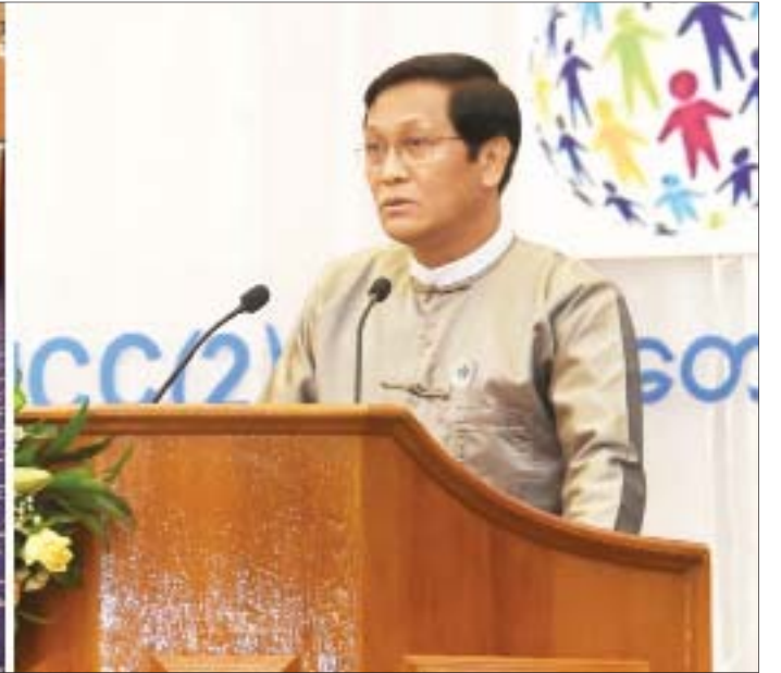
ဒုတိယသမ္မတ ဦးဟင်နရီဗန်ထီးယူ ဒုတိယအကြိမ် မြန်မာနိုင်ငံ ဉာဏ်ရည်မသန်စွမ်းသူများဆိုင်ရာ ပညာရေးညီလာခံဖွင့်ပွဲအခမ်းအနားတွင် အမှာစကားပြောကြားစဉ်။