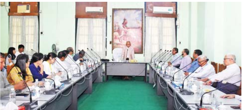
ဖတ်ပွဲ အောင်မြင်စွာကျင်းပနိုင်ရေးအတွက် လုပ်ငန်းတာဝန် များ ခွဲဝေသတ်မှတ်ခြင်း၊ စာတမ်းဖတ်ပွဲကို နိုဝင်ဘာ ၂ ရက်နှင့် ၃ ရက်တို့တွင် ကျင်းပရန်အတည်ပြုခြင်းစသည့် အကြောင်းအရာများကို ဆွေးနွေးကြပြီး Success

အစည်းအဝေးတွင် စာတမ်းဖတ်ကြားမည့် စာတမ်းရှင် များနှင့် စာတမ်းအမည်များအား အတည်ပြုခြင်း၊ စာတမ်း ဖတ်ပွဲသဘာပတိများ ရွေးချယ်အတည်ပြုခြင်း၊ စာတမ်း