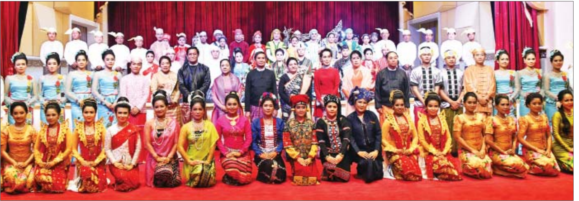
နိုင်ငံတော်သမ္မတ ဦးဝင်းမြင့်နှင့် ဇနီး ဒေါ်ချိုချို၊ နီပေါဖက်ဒရယ်ဒီမိုကရက်တစ်သမ္မတနိုင်ငံ သမ္မတ မစ္စစ် ဘီဒီယာ ဒေဗီ ဘန်ဒါရီ၊ နိုင်ငံတော်၏အတိုင်ပင်ခံပုဂ္ဂိုလ် ဒေါ်အောင်ဆန်းစုကြည်၊ ဒုတိယသမ္မတ ဦးမြင့်ဆွေနှင့် ဇနီး ဒေါ်ခင်သက်ဌေး၊ ဒုတိယသမ္မတ ဦးဟင်နရီဗန်ထီးယူနှင့် ဇနီး ဒေါက်တာရွှေလွှမ်းနှင့် ဖျော်ဖြေတင်ဆက်ကြသည့် အနုပညာရှင်များ စုပေါင်းမှတ်တမ်းတင်ဓာတ်ပုံရိုက်စဉ်။