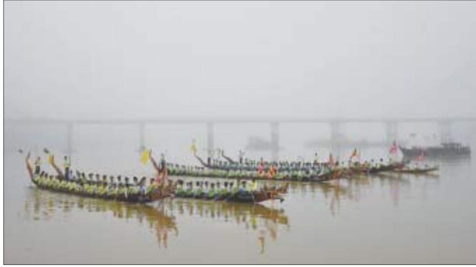
၂၀၁၈ ခုနှစ်က နဂါးလှေသဘင်ပွဲတော် ကျင်းပနေစဉ်။