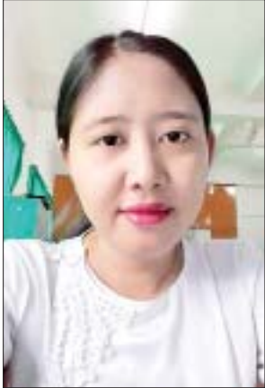
မာင်းသွဲ့

ထိုသို့ လုပ်ငန်းခွင်အသီးသီးဝင်ရောက်ကြရတော့မည် ဖြစ်သည့် အတွက် မိမိတို့ရောက်ရှိလည်ပတ်ရာ၊ အပန်းဖြေအနားယူရာ နေရာများမှ ပြန်လည်ထွက်ခွာလာကြသည့် ခရီးသွားပြည်သူတို့ဖြင့် ပြည့်နှက်နေသည့် စင်းလုံးငှားယာဉ်များ၊ ခရီးသည်တင်အထူးယာဉ်ကြီးများ၊ ကိုယ်ပိုင်မော်တော်ယာဉ်များကို အဝေးပြေးလမ်းမများပေါ်တွင် တွေ့နေရသည့်အပြင် နယ်အသီးသီးရှိ အဝေးပြေးကားဂိတ်များ၊ ရထားဘူတာရုံများ၊ သင်္ဘောဆိပ်များတွင်လည်း နေရပ်ပြန်မည့် ခရီးသွားစည်းသည်များဖြင့် ပြည့်လို့နေသည်။