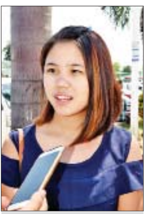
မအိအိဖြူ

ညီမက သီတင်းကျွတ်ရုံးပိတ်ရက်အတွင်းမှာ သာဂရမှာရှိတဲ့ မိဘတွေဆီ သွားရောက်ကန်တော့ အနားယူပြီး အခုရန်ကုန်ကို ပြန်မှာပါ။ သာဂရကိုရောက်ဖြစ်တဲ့ အချိန်မှာတော့ ဘုရားသွားကျောင်းတက်ပြီး ကုသိုလ်ဆည်းပူးဖြစ်ပါတယ်။ မိဘတွေနဲ့အတူ သက်ကြီးရွယ်အိုတွေကို ကန်တော့ဖြစ်ပါတယ်။ အခုလိုအနားယူလိုက်တော့လည်း လုပ်ငန်းခွင်ကို ပြန်ဝင်ရောက်ဖို့အတွက် အားရှိသွားတာပေါ့။ ကျွန်မတို့လို ဘဝကိုရုန်းကန်နေရတဲ့သူတွေတင်မက အားလုံးအခုလို သီတင်းကျွတ်အခါသမယမှာ ပျော်ရွှင်ကြပါစေလို့