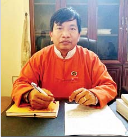
ဦးအောင်ကျော်ကျော်ဦး ပြည်သူ့လွှတ်တော် ကိုယ်စားလှယ်

ပြည်သူ့လွှတ်တော် ရင်းနှီးမြှုပ်နှံမှုနှင့် စက်မှုလက်မှုဖွံ့ဖြိုးတိုးတက်ရေးကော်မတီကို ပြည်သူ့လွှတ်တော် ပထမပုံမှန် အစည်းအဝေး၏ (၁၁) ရက်မြောက်နေ့ဖြစ်သည့် ၂၀၁၆ ခုနှစ် ဖေဖော်ဝါရီ ၂၄ ရက်တွင် အမိန့်ကြော်ငြာစာအမှတ် ၃၀/၂၀၁၆ ဖြင့် စတင်ဖွဲ့စည်းခဲ့သည်။ ကော်မတီ၏ သက်တမ်းကို တစ်နှစ်သတ်မှတ်ထားသည့်အတွက် ၂၀၁၇ ခုနှစ် ဖေဖော်ဝါရီ ၂၄ ရက်တွင် တစ်ကြိမ်၊ ၂၀၁၈ ခုနှစ် ဖေဖော်ဝါရီ ၂၄ ရက်တွင် တစ်ကြိမ်၊ ၂၀၁၉ ခုနှစ် ဖေဖော်ဝါရီ ၂၄ ရက်တွင် တစ်ကြိမ် သက်တမ်းသုံးကြိမ် တိုးမြှင့် ခဲ့ပြီးဖြစ်သည်။