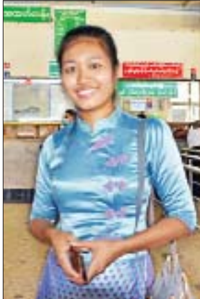
မထွဋ်မြတ်ဝေလွင်