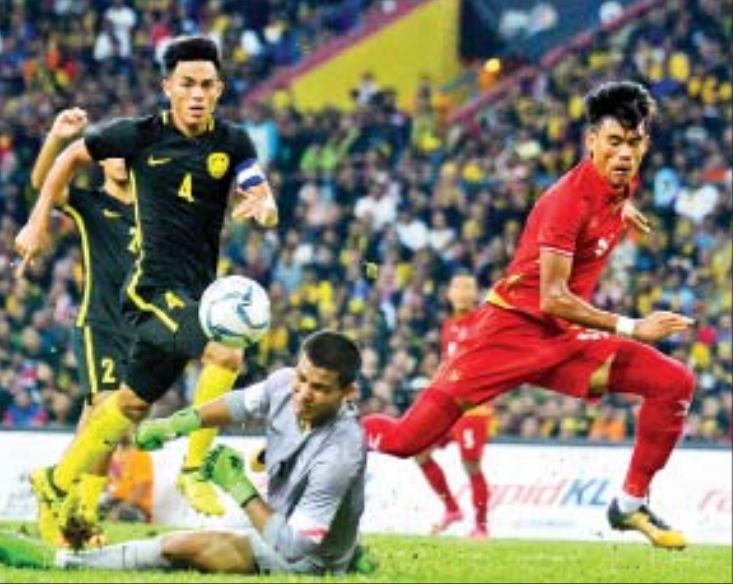
၂၀၁၇ ဆီးဂိမ်းပြိုင်ပွဲတွင် မြန်မာနှင့် မလေးရှား တွေ့ဆုံခဲ့စဉ်။

ရန်ကုန် အောက်တိုဘာ ၁၅ ၂၀၁၉ ဆီးဂိမ်းအမျိုးသား ဘောလုံးပြိုင်ပွဲ အုပ်စုများ ထွက်ပေါ်လာပြီဖြစ်ပြီး မြန်မာ အသင်းသည် အုပ်စု (က) တွင် ပါဝင်ခဲ့သည်။ ဖိလစ်ပိုင်နိုင်ငံက အိမ်ရှင်အဖြစ် လက်ခံကျင်းပ မည့် အကြိမ် (၃၀) မြောက် ဆီးဂိမ်းပြိုင်ပွဲ အုပ်စုခွဲပွဲအခမ်းအနားကို ယနေ့နံနက်ပိုင်းက မနီလာမြို့၌ ကျင်းပခဲ့သည်။ မြန်မာအသင်းသည် ထိပ်သီးအသင်းများ ကို ရှောင်ရှားနိုင်ခဲ့ပြီး အိမ်ရှင်ဖိလစ်ပိုင်နှင့် မလေးရှားတို့ ပါဝင်သည့် အုပ်စု (က) သို့ ကျရောက်ခဲ့သည်။ အုပ်စုခွဲဝေထားမှုအရ မြန်မာအသင်းသည် အုပ်စု (က) တွင် ဖိလစ်ပိုင်၊ မလေးရှား၊ ကမ္ဘောဒီးယား၊ တီမောအသင်းတို့ နှင့် ကျရောက်နေပြီး အုပ်စု (ခ) တွင်မူ ထိုင်း၊ အင်ဒိုနီးရှား၊ ဗီယက်နမ်၊ လာအို၊ ဘရူနိုင်းနှင့် စင်ကာပူအသင်းတို့ ပါဝင်နေသည်။ မြန်မာ အသင်းအနေဖြင့် အုပ်စုအနေအထားအရ စာမျက်နှာ ၁၁ ကော်လံ ၃ သို့ ❖