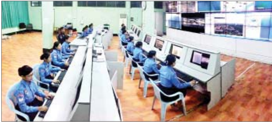
မြန်မာနိုင်ငံ မီးသတ်ဌာနချုပ် ညွှန်ကြားရေးမှူး(ဦးစီး) ရန်ကုန် ဦးသိန်းထွန်းဦးက ပြောသည်။ အဆိုပါ "191 Report" ဖုန်းအပလီကေးရှင်းကို အဆင့်ဆင့် Register လုပ်ကာ မှတ်ပုံတင်ပြီး နိုင်ငံတစ်ဝန်း

ရန်ကုန် အောက်တိုဘာ ၁၅ မီးဘေးအန္တရာယ် အပါအဝင် အခြားဘေးအန္တရာယ်တစ်ခုခု အရေးပေါ် အခြေအနေဖြစ်ပေါ်နေပါက ဖုန်းအပလီကေးရှင်းဖြင့် ချိတ်ဆက်ကာ " 191 Report" ဖုန်းအပလီကေးရှင်းမှ တစ်ဆင့် မြန်မာနိုင်ငံမီးသတ်တပ်ဖွဲ့သို့ အကူအညီတောင်းခံနိုင်ပြီးဖြစ်ကြောင်း မြန်မာနိုင်ငံမီးသတ်ဌာနချုပ် (ရန်ကုန်)မှ သိရသည်။