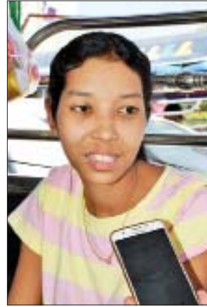
မအေးအေးသင်း