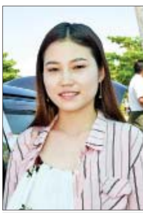
မအေးသန္တာ