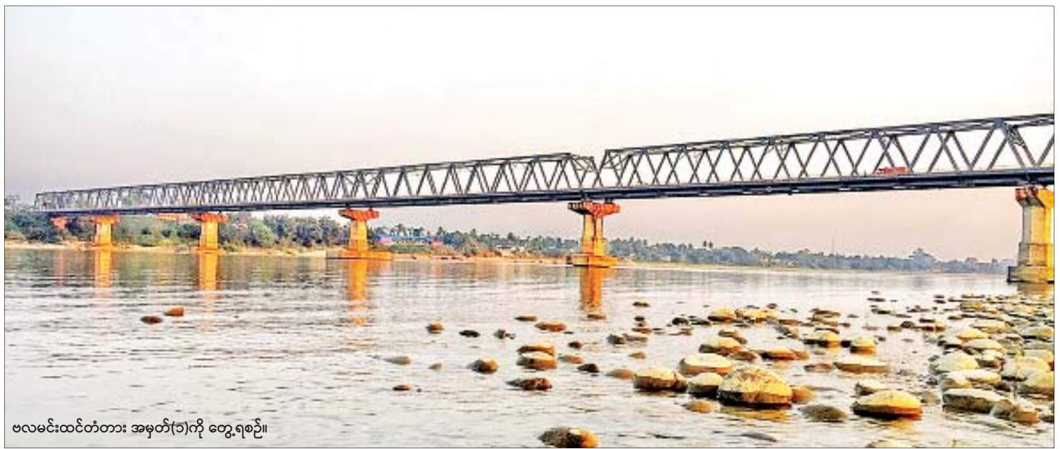
ဗလမင်းထင်တံတား အမှတ်(၂)ကို တွေ့ရစဉ်။

မြစ်ကြီးနား အောက်တိုဘာ ၁၅ ဗလမင်းထင်တံတား အမှတ်(၂)တည်ဆောက်ရန်အတွက် ၂၀၁၉-၂၀၂၀ ဘဏ္ဍာနှစ်အတွင်း ဖြစ်တန်စွမ်းတိုင်းတာမှုလုပ်ငန်းများ စတင်ဆောင်ရွက်နေပြီဖြစ်ကြောင်း ကချင်ပြည်နယ်အခြေစိုက် တံတားအထူးအဖွဲ့(၁) တံတားဦးစီးဌာနမှ သိရသည်။ စာမျက်နှာ ၃ ကော်လံ ၁ သို့ ၀