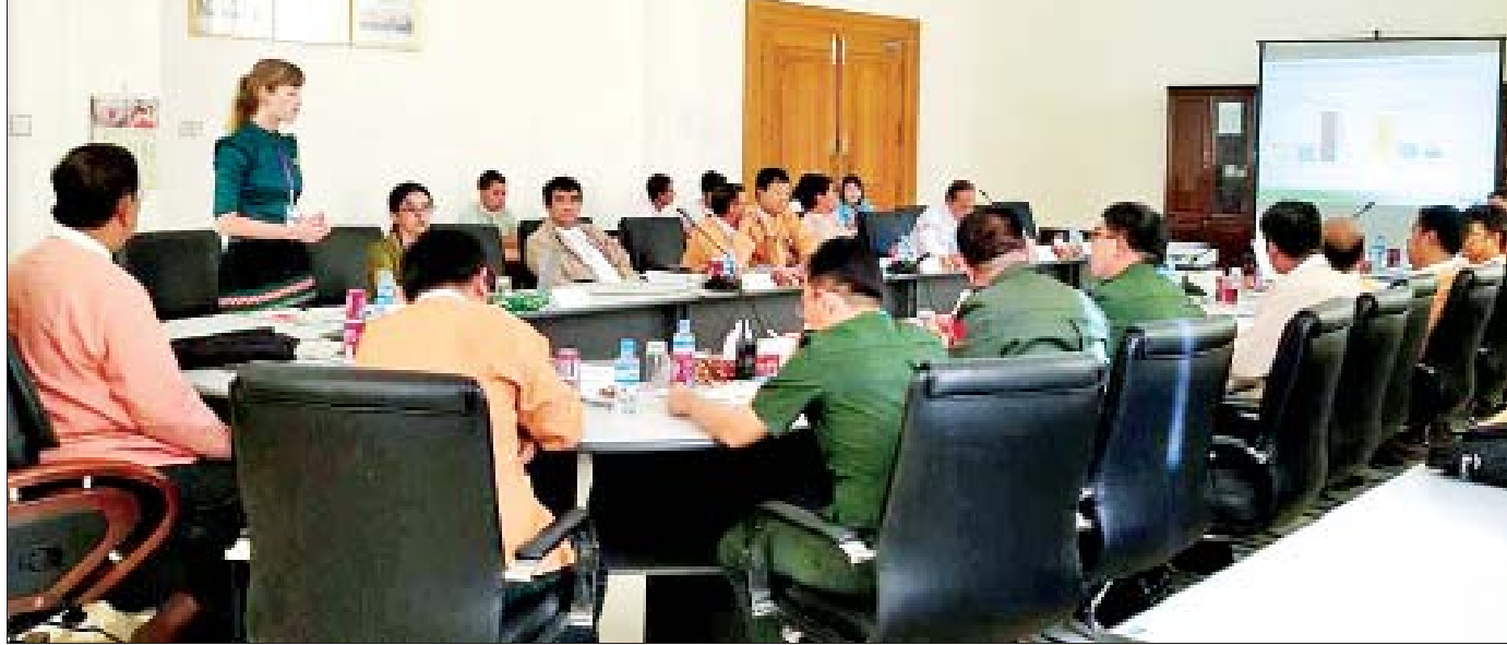
ပြည်သူ့လွှတ်တော်ရင်းနှီးမြှုပ်နှံမှုနှင့် စက်မှုလက်မှုဖွံ့ဖြိုးတိုးတက်ရေးကော်မတီဥက္ကဋ္ဌ၊ အတွင်းရေးမှူးနှင့် အဖွဲ့ဝင်များ Heineken Group မှ တာဝန်ရှိသူများနှင့်တွေ့ဆုံစဉ်။

ထို့ပြင် ကော်မတီအနေဖြင့် ရင်းနှီးမြှုပ်နှံမှုနှင့် စက်မှုလက်မှုလုပ်ငန်းများဖွံ့ဖြိုးတိုးတက်ရေး၊ သိပ္ပံနှင့် နည်းပညာဖွံ့ဖြိုးတိုးတက်ရေး၊ လက်မှုလယ်ယာမှ စက်မှု လယ်ယာသို့ ကူးပြောင်းနိုင်ရေး၊ အသေးစားစက်မှုလက်မှု လုပ်ငန်းများ ဖွံ့ဖြိုးတိုးတက်ရေးအတွက် လိုအပ်သည်များ ကူညီဖြည့်ဆည်းပေးလျက်ရှိသည်။