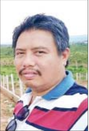
ကိုသန့်စင်