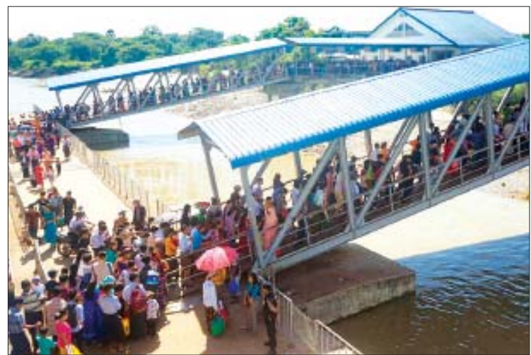
လိုက်ပါစီးနင်းမှု များပြားလျက်ရှိသည်။ ကူးသန်းသွားလာကြပြီး လူအစည်ကားဆုံးနှင့် စီးပွားရေးမြို့တော် ရန်ကုန်မြို့သို့ ဝင်ပေါက်၊ ဝင်ငွေအကောင်းဆုံး ဆိပ်ကမ်းတစ်ခု ထွက်ပေါက်တစ်ခုအဖြစ် နေ့စဉ်နှင့်အမျှ ဖြစ်ကြောင်း သိရသည်။ နိုင်ငံခြား(ဒလ)