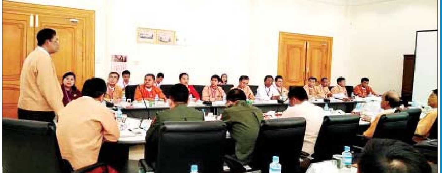
ပြည်သူ့လွှတ်တော် ရင်းနှီးမြှုပ်နှံမှုနှင့် စက်မှုလက်မှုဖွံ့ဖြိုးတိုးတက်ရေးကော်မတီဥက္ကဋ္ဌ၊ အတွင်းရေးမှူးနှင့် အဖွဲ့ဝင်များ ရန်ကုန်တိုင်းဒေသကြီးလွှတ်တော် ဘဏ္ဍာရေး၊ စီမံကိန်းနှင့် စီးပွားရေးကော်မတီမှ ကိုယ်စားလှယ်အဖွဲ့နှင့် မြန်မာနိုင်ငံစက်မှုကုန်ထုတ်လုပ်သူများအသင်းတို့မှ တာဝန်ရှိသူများနှင့် တွေ့ဆုံစဉ်။

လာမယ့် (၁၄)ကြိမ်မြောက် လွှတ်တော် အစည်းအဝေးတွေမှာ အသေးစား၊ အလတ်စားစက်မှုလုပ်ငန်းဥပဒေ၊ စီးပွားရေးလုပ်ငန်းဥပဒေ၊ SME လုပ်ငန်းမှာ အငယ်စား(micro) တစ်ခု ထပ်ထည့်ပြီး MSME အဖြစ် ပြောင်းလဲနိုင်ဖို့ ကြိုးစားသွားမှာဖြစ်ပါတယ်။ ဘာဖြစ်လို့ ဒီလိုဆောင်ရွက်ရတာလဲဆိုတော့ ကျွန်တော်တို့နိုင်ငံမှာက အသေးစားလုပ်ငန်းတွေ အများကြီး ရှိပါတယ်။ ဒီလုပ်ငန်းတွေက ဥပဒေထဲမှာ အကျိုးမဝင်တော့ အကျိုးခံစားခွင့် မရရှိသေးဘူးဖြစ်နေတယ်။ ပြီးတော့ စက်မှုလုပ်ငန်းဥပဒေကိုလည်း လာမယ့် အစည်းအဝေးအတွင်းမှာ ရေးဆွဲသွားမှာဖြစ်