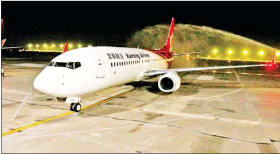
ကူမင်းလေကြောင်းလိုင်း၏ Boeing 738 အမျိုးအစားလေယာဉ်ကို တွေ့ရစဉ်။

၃၅ လိုင်းမှ အပြည်ပြည်ဆိုင်ရာခရီးစဉ် ၃၃ ခုအား ချိတ်ဆက်ပျံသန်းလျက်ရှိသည်။ Kunming Aviation Co., Ltd. သည် Kunming Changshui အပြည်ပြည်ဆိုင်ရာလေဆိပ်မှ စီမံခန့်ခွဲနေသော တရုတ်အရပ်ဘက်လေကြောင်းအုပ်ချုပ်ရေးအဖွဲ့အစည်းမှ ၂၀၀၇ ခုနှစ် ဖေဖော်ဝါရီ ၂၅ ရက်တွင် အသိအမှတ်ပြုထားသော အရပ်ဘက်လေကြောင်း သယ်ယူပို့ဆောင်ရေးလုပ်ငန်းစဉ်ဖြစ်သည်။ ကူမင်းလေကြောင်းလိုင်းကို စတင်တည်ထောင်ခဲ့သည့်အချိန်မှစ၍ ၎င်းသည် ဘေးကင်းလုံခြုံမှု၊ ကြိုတင်ကာကွယ်မှု၊ နည်းစနစ်ပိုင်းဆိုင်ရာ စီမံခန့်ခွဲမှု စသည့် ကဏ္ဍများကို ဦးစားပေးလုပ်ဆောင်ခဲ့သည်။ လက်ရှိတွင် ကူမင်းလေကြောင်းလိုင်းမှ ဘိုးရင်းအမျိုးအစားလေယာဉ် ၂၆ စင်းဖြင့် ပြေးဆွဲလျက်ရှိပြီး တစ်နှစ်လျှင် လေယာဉ်အစင်းအရေအတွက် ၁၆ ဒသမ ၁၂ ရာခိုင်နှုန်း မြင့်တက်ရုံသာမက ချိတ်ဆက်ပျံသန်းနေသော မြို့ပေါင်း ၄၀ ခန့်ရှိသည်။ ကြေးမုံ