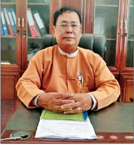
ဦးဝင်းသိန်းဇော် ပြည်သူ့လွှတ်တော် ကိုယ်စားလှယ်

ကော်မတီဥက္ကဋ္ဌ ပြည်သူ့လွှတ်တော်ကိုယ်စားလှယ် ဦးဝင်းသိန်းဇော်