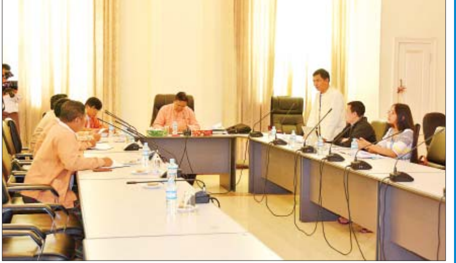
ပြည်သူ့လွှတ်တော် ရင်းနှီးမြှုပ်နှံမှုနှင့် စက်မှုလက်မှုဖွံ့ဖြိုးတိုးတက်ရေးကော်မတီဥက္ကဋ္ဌ၊ အတွင်းရေးမှူးနှင့် အဖွဲ့ဝင် များ ရန်ကုန်နိုင်ငံရေးသိပ္ပံကျောင်းမှ တာဝန်ရှိသူများနှင့်တွေ့ဆုံစဉ်။

ကော်မတီကစိစစ်ရသည့် ဥပဒေများအနက် ဓာတု ပစ္စည်းနှင့် ဆက်စပ်ပစ္စည်းများအန္တရာယ်မှ တားဆီး ကာကွယ်ရေးဥပဒေ၊ တျိုလ်လာဥပဒေ၊ စက်မှုဒီဇိုင်းမူပိုင်ခွင့် ဥပဒေ၊ ကုန်အမှတ်တံဆိပ်မူပိုင်ခွင့်ဥပဒေနှင့် တီထွင်မှု မူပိုင်ခွင့်ဥပဒေတို့သည် ပြဋ္ဌာန်းပြီးဖြစ်သော်လည်း စက်မှုဇုန်ဥပဒေကြမ်းကို ကော်မတီအနေဖြင့် ဆောင်ရွက်ပြီး ဖြစ်ပြီး ပုဂ္ဂလိကစက်မှုလုပ်ငန်းဥပဒေကို စက်မှုလုပ်ငန်းဥပဒေအဖြစ် ကော်မတီက ဆောင်ရွက် သွားရန်လည်း ရှိသည်။