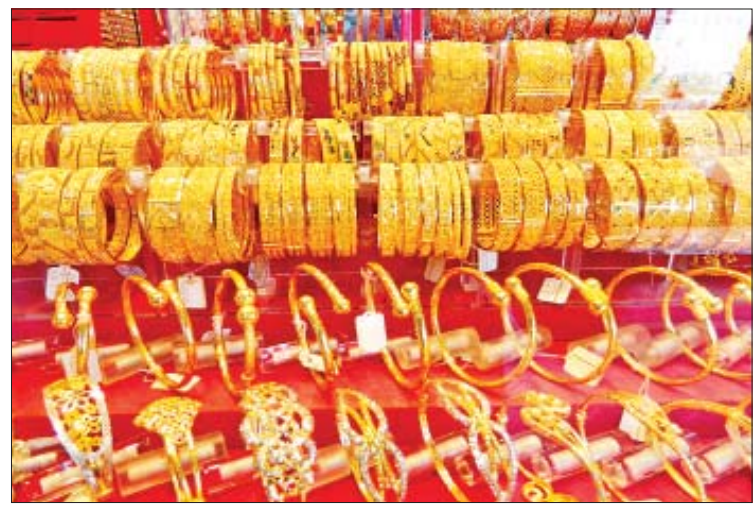
အမြင့်ဆုံးနှုန်း ကျပ် ၁၂၆၀၅၀၀ နှင့် စက်တင်ဘာလတွင် ပြည်တွင်းရွှေဈေးမှာ အနိမ့်ဆုံးနှုန်း ကျပ် ၁၁၂၃၈၀၀၊ အမြင့်ဆုံးနှုန်း ကျပ် ၁၃၀၇၀၀၀ တို့ဖြစ်ကြောင်း ရွှေရောင်းဝယ်သူများထံမှ သိရသည်။

မှာ ကမ္ဘာ့ရွှေဈေး မြင့်တက်မှုနှင့်အတူ စံချိန်သစ်များ ထပ်ကာထပ်ကာ ချိုးလာခဲ့ရာ ၂၀၁၉ ခုနှစ် နှစ်စ ဇန်နဝါရီ ၁၇ ရက်မှ ဖေဖော်ဝါရီ ၂၁ ရက်အတွင်း ကျပ် ၁၀ သိန်း ကျော်၊ ဇွန် ၂၂ ရက်မှ ဩဂုတ် ၅ ရက်အတွင်း ကျပ် ၁၁ သိန်းကျော်၊ ဩဂုတ် ၇ ရက်မှ စက်တင်ဘာ ၄ ရက်အတွင်း ကျပ် ၁၂ သိန်းကျော်အထိ စံချိန်သစ်များ ဖြစ်ပေါ်ခဲ့ပြီး ဆက်လက် မြင့်တက်လာရာ စက်တင်ဘာ ၅ ရက်တွင်မူ ယခင် ချိုးထားသည့် စံချိန်များထက် ကျော်လွန်၍ ကျပ် ၁၃ သိန်းကျော်အထိ ဖြစ်ပေါ်ခဲ့သည်။ ပြီးခဲ့သည့် သုံးလက ရွှေဈေးကို ပြန်ကြည့်ပါက ဇူလိုင်လတွင် ပြည်တွင်းရွှေဈေးမှာ အနိမ့်ဆုံးနှုန်း ကျပ် ၁၀၉၉၀၀၊ အမြင့်ဆုံးနှုန်း ကျပ် ၁၁၄၉၄၀၊ ဩဂုတ်လတွင် ပြည်တွင်းရွှေဈေးမှာ အနိမ့်ဆုံးနှုန်း ကျပ် ၁၁၄၉၀၀ ၊