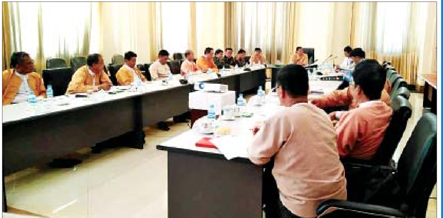
ပြည်သူ့လွှတ်တော် ရင်းနှီးမြှုပ်နှံမှုနှင့် စက်မှုလက်မှုဖွံ့ဖြိုးတိုးတက်ရေးကော်မတီဥက္ကဋ္ဌ၊ အတွင်းရေးမှူးနှင့် အဖွဲ့ဝင်များ စက်မှုဝန်ကြီးဌာနမှ တာဝန်ရှိသူများနှင့်တွေ့ဆုံစဉ်။

“ကျွန်တော်တို့ ကော်မတီအနေနဲ့ စက်မှုကဏ္ဍနဲ့ ပတ်သက်ပြီး အကျွမ်းတဝင်ရှိတယ်။ သေချာထိန်းကျောင်းနိုင်တယ်။ ဒါပေမယ့် ရင်းနှီးမြှုပ်နှံမှုကဏ္ဍကျတော့ အားနည်းချက်ရှိတယ်။ ကျွန်တော်တို့ကော်မတီ စိစစ်ရမယ့်အထဲမှာ ရင်းနှီးမြှုပ်နှံမှုဥပဒေ မပါရှိသေးပါဘူး။ ဒီဥပဒေပါရှိဖို့ လိုအပ်နေပါတယ်။ ပြီးတော့ ရင်းနှီးမြှုပ်နှံမှုလုပ်ငန်းတွေကို ထိန်းကျောင်းနိုင်အောင်၊ ရင်းနှီးမြှုပ်နှံမှု