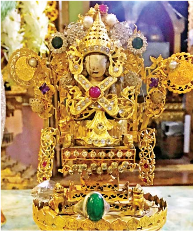
ပခန်းကြီး စည်သူရှင်သရက္ခာန်ဘုရား

လွန်ခဲ့တဲ့ ၂၇ နှစ်တုန်းက မကွေးတိုင်းဒေသကြီး ရေစကြိုမြို့မှာ တာဝန်ထမ်းဆောင်ရင်း သုံးနှစ်နီးပါးနေခဲ့ဖူးပါတယ်။ အခုအချိန်နဲ့ ပြန်တွက်ကြည့်ရင် နှစ်ပေါင်း ၃၀ လောက် ကြာခဲ့ပြီမို့ ပြောင်းလဲတိုးတက်မှုတွေလည်းရှိနေခဲ့ပြီလို့ ဆိုရမှာပါ။ ရေစကြိုမြို့နဲ့ ကင်းကွာခဲ့တာ အဲဒီလောက် ကြာခဲ့ပြီလားဆိုတော့ မဟုတ်ပါဘူး။ ရေစကြိုမှာ နေထိုင်ခဲ့စဉ်က သံယောဇဉ်ရှိခဲ့ဖူးတဲ့ ဆရာသမားတွေနဲ့ မိတ်ဆွေရင်းချာတွေဆီ သွားရောက်ဂါရဝပြု လည်ပတ်ရင်းနဲ့ မကြာမကြာ ပြန်ရောက်ဖြစ်ခဲ့ပါတယ်။ အဲဒီလို ပြန်ရောက်ဖြစ်တိုင်းလည်း ပခုက္ကူ-ရေစကြိုတစ်ကြောက သရက္ခာန်ဘုရားတွေကို ဝင်ရောက်ဖူးမြော်ဖြစ်ခဲ့ပါတယ်။ ရှင်မတောင်နဲ့ ရှင်မတောင်ပေါ်မှာရှိတဲ့ သရက္ခာန်ဘုရားကို တက်ရောက်ဖူးမြော်ခြင်းမှအပပေးလေ။