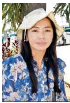
မလဲ့လဲ့ခိုင်