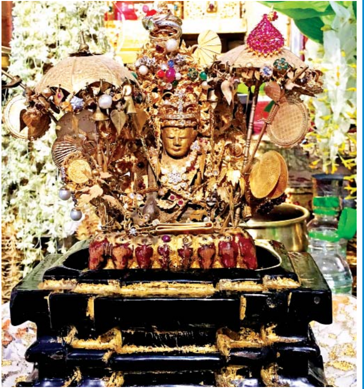
ရွှေတန်တစ်သရက္ခာန်ဘုရား

ဒါကလည်း မသွားချင်လို့တော့ မဟုတ်ပါဘူး။ အခြားသွားရလာရမယ့်အချိန်တွေကို တွက်ဆပြီးတော့သာ မရောက်ဖြစ်ခဲ့တာပါ။ ဒီတစ်ခါတော့ ရှင်မတောင်အပေါ် ရောက်အောင်သွားပြီး ဘုရားဖူးကြမယ်လို့ အစီအစဉ်ဆွဲပြီးသွားခဲ့တာ မကြာသေးခင်တကမ တတိယအခေါက် ရောက်ဖြစ်ခဲ့ပါတယ်။ တောင်ခြေကနေ ပင်လယ်ရေမျက်နှာပြင်အထက် ၁၇၂၃ ပေမြင့်တဲ့ တောင်ထိပ်အထိ ကတ္တရာလမ်းခင်းထားတာမို့ ကားနဲ့ အလွယ်တကူပဲ တက်ရောက်နိုင်ခဲ့ပါတယ်။ ၁၉၉၂ ခုနှစ်လောက်တုန်းက ကားလမ်းဖောက်ဖို့ စီစဉ်နေဆဲကာလဖြစ်လို့ ဖုန်အလိမ်းလိမ်းနဲ့ သည်းထိတ်ရင်ဖို တက်ခဲ့ရတဲ့လမ်းပါ။ အခုတော့ ကားစီးရင်းနဲ့ ပတ်ဝန်းကျင်က သဘာဝရှုခင်းတွေကို ကြည့်ရှုခံစားနိုင်ပါပြီ။