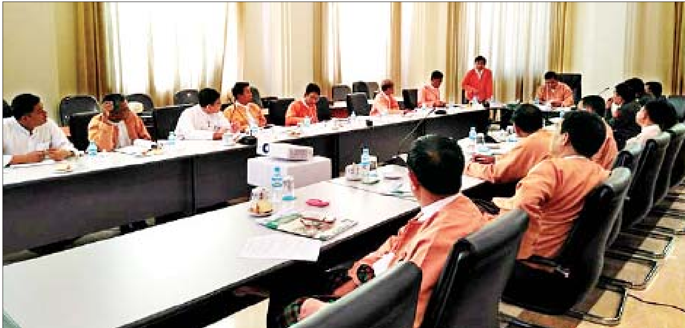
ပြည်သူ့လွှတ်တော် ရင်းနှီးမြှုပ်နှံမှုနှင့် စက်မှုလက်မှုဖွံ့ဖြိုးတိုးတက်ရေးကော်မတီဥက္ကဋ္ဌ၊ အတွင်းရေးမှူးနှင့် အဖွဲ့ဝင်များ လုပ်ငန်းညှိနှိုင်းအစည်းအဝေးပြုလုပ်စဉ်။

ပေးပို့လာသည့် တိုင်ကြားစာများနှင့်စပ်လျဉ်း၍ ဆောင်ရွက်ပေးလျက်ရှိသည်။ ကော်မတီသို့ ပေးပို့လာသည့် တိုင်ကြားစာ ၂၉ စောင်ရှိပြီး အဆိုပါတိုင်ကြားစာများနှင့် စပ်လျဉ်း၍ သက်ဆိုင်ရာဌာန၊ အဖွဲ့အစည်းများသို့ မှတ်ချက်ပြုပေးပို့ထားကြောင်း သိရသည်။