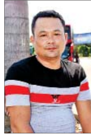
ကိုရဲခိုး