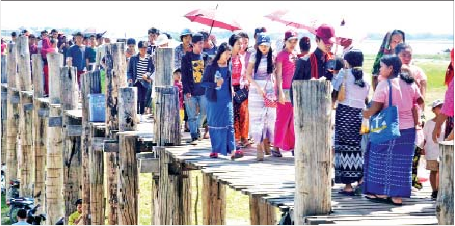
ဦးပိန်တံတားတွင် လာရောက်လေ့လာအပ်နှံခြေစူးများဖြင့် စည်ကားလျက်ရှိသည်ကို တွေ့ရစဉ်။

မန္တလေး အောက်တိုဘာ ၁၄ ယခုနှစ်သီတင်းကျွတ်ပွဲတော် ရုံးပိတ်ရက်ကာလများဖြစ်သည့် အောက်တိုဘာ ၁၁ ရက်မှ ၁၅ ရက်အတွင်း မန္တလေးတိုင်းဒေသကြီး အမရပူရမြို့နယ်အတွင်းရှိ ရှေးဟောင်းယဉ်ကျေးမှုအမွေအနှစ်ဒေသ ကမ္ဘာကျော် တောင်သမန်အင်းနှင့် ဦးပိန်တံတားသို့ ပြည်တွင်းခရီးသွားများ ဝင်ရောက်လေ့လာအပ်နှံခြေစူးများဖြင့် အထူးစည်ကားလျက်ရှိကြောင်း သိရသည်။ အဆိုပါတောင်သမန်အင်းနှင့် ဦးပိန်တံတားသို့ နေ့စဉ်ပြည်တွင်းပြည်ပခရီးသွားများ ပုံမှန်ဝင်ရောက်လေ့ရှိသော်လည်း ယခု သီတင်းကျွတ်ကာလတွင် ရုံးပိတ်ရက်ရက်နှင့် သီတင်းကျွတ်ကျောင်းပိတ်ရက်တို့ တိုက်ဆိုင်သည့် ကာလဖြစ်သည့်အတွက် အနယ်နယ်အရပ်ရပ်မှ ပြည်တွင်းခရီးသွားများ ဝင်ရောက်လေ့လာမှုကြောင့် ပိုမိုများပြားလာကြောင်း ဦးပိန်တံတားအနီးတွင် ဖွင့်လှစ်ရောင်းချနေသည့် အမှတ်တရ လက်ဆောင်ပစ္စည်းအရောင်းဆိုင်များမှ သိရသည်။ နွေးထွေးကြင်နာမှုတွေ ဖြစ်စေ "သီတင်းကျွတ်ကာလမှာ ကျောင်းတွေလည်း ပိတ်တယ်။ ကျွန်တော်တို့