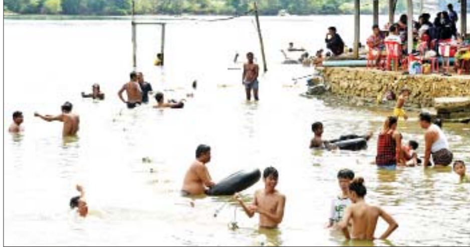
နေပြည်တော် လှေခင်းတောင်ရေဆိပ်တွင် ရေကူးကစားကြသူများဖြင့် စည်ကားလျက်ရှိသည်ကို တွေ့ရစဉ်။

တို့ သွားတာထက်စာရင် လှေခင်း တောင်ကိုလာရတာ ကုန်ကျစရိတ်ပိုမို သက်သာပါတယ်။ ဒီကိုလာရင်းနဲ့ လည်း တစ်ဆက်တည်း ဒီက ဘုရား တွေပါ တစ်ခါတည်းဖူးလို့ရပါတယ်။ ဒါကြောင့် တခြားသူတွေကိုလည်း နေပြည်တော်ကို လာရောက်လည်ပတ် ဖို့၊ အပန်းဖြေဖို့ ဖိတ်ခေါ်ပါတယ်” ဟု ပြောသည်။