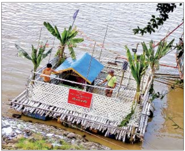
မျိုးဝင်းထွန်း (မုံရွာ)

ကျင်းပခဲ့ခြင်းဖြစ်ကြောင်း သိရသည်။ "မြန်မာပြည် အောက်ပိုင်းက ပင်လယ်တွေမှာ ဖောင်အကြီးကြီး လုပ်ကြတယ်။ ဆန်ဆီဆီလည်း တတ်နိုင်ရင် တတ်နိုင်သလောက် ဆန်အိတ်လိုက်၊ ဆီပုံးလိုက် လှူကြ တာပါ" ဟု ၎င်းက ဆက်ပြောသည်။ ရှင်ဥပဂုတ္တပူဇော်ပွဲကို ချင်းတွင်း မြစ်ရေလယ်အထိ မော်တော်နှင့်ဆွဲပြီး အောက်ပိုင်းကို မျှောလိုက်ကြရာ လမ်းတစ်လျှောက် ရွာများက ပူဇော် ချင်လျှင် ဖောင်ကိုကမ်းဆွဲပြီး ပူဇော် ကြသည့် မြန်မာ့ရိုးရာ ပူဇော်ပွဲ ဖြစ်သည်။