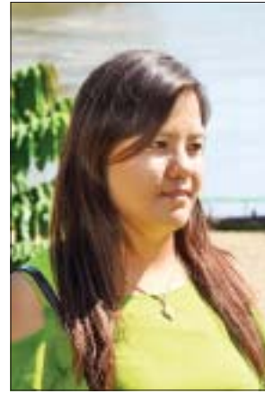
မဥမ္မာမြင့်