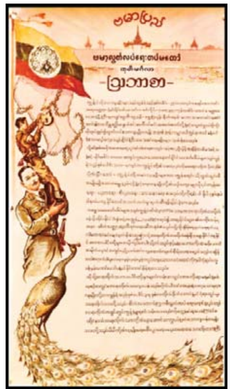
ဗမာ့လွတ်လပ်ရေးတပ်မတော်၏ ထုတ်မင်္ဂလာ ဩဘာစာမှ ပန်းချီဦးငွေကိုင်၏လက်ရာ

၁၉၄၁ ခုနှစ်မှာ ဗိုလ်ချုပ်အောင်ဆန်းနဲ့ ရဲဘော်သုံးကျိပ်ဦးဆောင်တဲ့ ဗမာ့လွတ်လပ်ရေးတပ်မတော် (BIA)ကိုဖွဲ့စည်းတယ်။ ပြီးတော့ အဲဒီအချိန်က ဂျပန် လက်အောက်မှာရှိနေတဲ့ ထိုင်းနိုင်ငံ ဗန်ကောက်မြို့မှာ