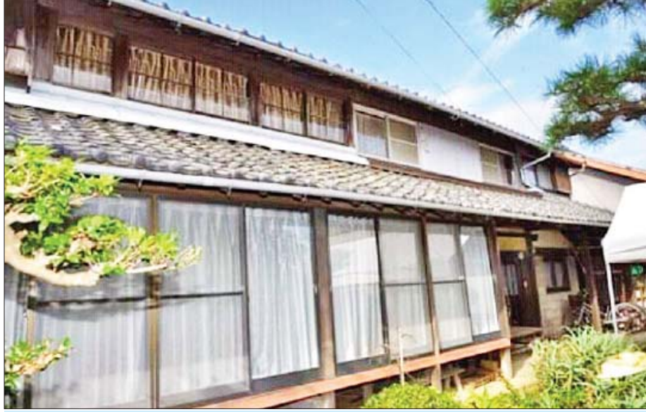
ဗိုလ်မှီးကြီးခေါ် (ကာနယ်ဆူဇုကီ)၏ နေအိမ်

“သူ့မိခင် မြန်မာနိုင်ငံကို အောင်ဆန်းတံခွန်ဘွဲ့ လက်ခံဖို့ ရောက်စဉ်က မှတ်တမ်းမှတ်ရာ တွေကို ပြပါတယ်။ အဲဒီအထဲမှာ ဗမာ့လွတ်လပ်ရေး တပ်မတော် က ထုတ်ပြန်တဲ့ ဗိုလ်မှီးကြီးကို နှုတ်ဆက်ဩဘာ စာမိတ္တူနဲ့ ဗိုလ်လက်ျာရဲ့ ပန်းချီကားတချို့ မိတ္တူပုံတွေလည်း ပါတယ်။ ဗိုလ်လက်ျာရဲ့ အဆင့်ရှိတဲ့ လက်ရာတွေကိုလည်း အဲဒီ ရောက်မှ မြင်ဖူးတယ်။ ဒါတွေ အားလုံး စစ်သမိုင်းပြတိုက်က ကူးယူရရှိ”