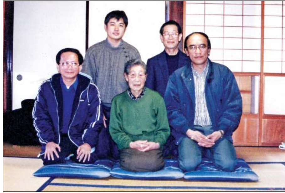
ကာတွန်းငွေကြည်၊ ဗိုလ်မှူးကြီးဇနီး၊ ဒေါက်တာတင်ထွန်းဦး (ရှေ့တန်းဝဲမှယာ)၊ နောက်တန်းယာစွန်-ဗိုလ်မှူးကြီးသား

ဗိုလ်မှူးကြီးခေါ် ဗိုလ်မှူးကြီးဆူဇုကီးရဲ့ အမည်ဟာ ကျွန်တော်တို့ မြန်မာတွေနဲ့ အလွန်ရင်းနှီးပါတယ်။ ကာနယ်ဆူဇုကီးဟာ မြန်မာ့လွတ်လပ်ရေးသမိုင်းနဲ့ မြန်မာ့တပ်မတော်သမိုင်းမှာ အရေးပါတဲ့ ပုဂ္ဂိုလ်ကြီး ဖြစ်