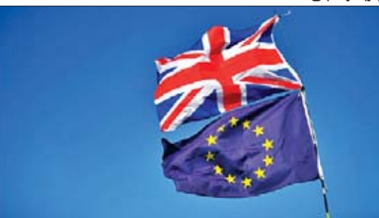
ဘရက်ဆစ်ဆိုင်ရာ ညှိနှိုင်းရေးမျိုးချုပ်ဖြစ်သူ မိုက်ကယ်ဘာနီယာက ဘရက်ဆစ်အရေး ဆွေးနွေးပွဲများသည် အားကောင်းပြီး အပြုသဘော ဆောင်ကြောင်း အီးယူသံတမန်များအား ပြောကြားခဲ့သည်။ ၎င်းက ဘရက်ဆစ်အရေး အောင်မြင်ရန်အတွက် လုပ်ငန်းများစွာ လုပ်ဆောင်ရန် ကျန်နေသေးကြောင်း ဆိုသည်။

များ၏ အစည်းအဝေးမတိုင်မီရရှိရန် ကြိုးပမ်းလျက်ရှိသည်။ သဘော တူညီချက်တော့ ဒီလအတွင်းရရှိနိုင်ကြောင်း အိုင်ယာလန် ဒုတိယ ဝန်ကြီးချုပ် ဆိုင်မွန်ကိုဘေကီက လူစင်ဘာတ်တွင် ကျင်းပသော အီးယူ နိုင်ငံခြားရေးဝန်ကြီးများ၏ အစည်းအဝေးတွင် ပြောကြားသည်။