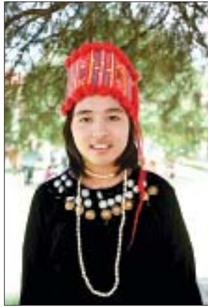
မသရဖီစိုး