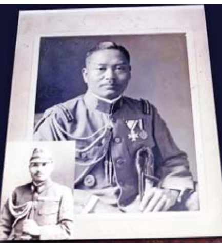
ဗိုလ်မှူးကြီး(ကာနယ်ဆူဇုကီး)ငယ်စဉ်က

တိုကျိုမှာဖွင့်ထားတဲ့ မြန်မာထမင်းဆိုင်နဲ့ ဗီယက်နမ်စားသောက်ဆိုင်၊ နာမည်ကြီးလွန်းလို့ နာရီဝက်လောက်ထိုင်စောင့်ပြီး အလှည့်ကျစားခဲ့ရတဲ့ တိုကျိုချိုင်းနားတောင်း (တရုတ်တန်း)က ပီစာဆိုင်၊ မတ်တတ်ရပ်တန်းစီပြီးစားခဲ့ရတဲ့ နာမည်ကျော်ရေဘဲပြုတ်ဆိုင်၊ ဘားကောင်တာလိုနေရာမှာ ခွဲတွေနဲ့ထိုင်ပြီး ကိုယ့်ရေမှာတင် အသီးအနှံနဲ့သားငါးတွေကိုသိတ်ထိုးချက်ချင်းကြော် တစ်ပြုပြီးတစ်ပြု လာချပေးတာကို ထမင်းလွတ်စားခဲ့ရတဲ့အကြောင်းဆိုင် စုံနေတာပါ။