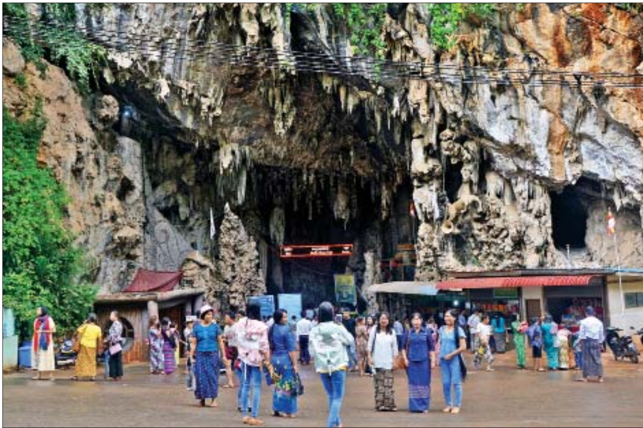
ထမ်ဆမ်းလိုဏ်ဂူတော်တွင် ဘုရားဖူးပြည်သူများဖြင့် စည်ကားလျက်ရှိသည်ကို တွေ့ရစဉ်။

စေတီတော်တွေရဲ့ တည်ထားမှုပုံစံကလည်း ဘုရားခြေတော်ရာပုံစံနဲ့ဆင်တူတယ်။ အကျယ်အဝန်းအရိယာကတော့ ၉ ဧကလောက် ရှိတယ်။ ဒီလိုထူးခြားတဲ့ စေတီတော်တွေနဲ့အတူ ဆုတောင်းပြည့်စေတီတော်လည်းရှိတော့ ဘုရားဖူး တွေက ဆုပန်ကြတာရှိတယ်။ နှစ်စဉ်နှစ်တိုင်းတော့ ဘုရားဖူးတွေ များပါတယ်။ ဒီနှစ်ကတော့ ရုံးပိတ်ရက်ရှည်လည်းဖြစ်တော့ ပိုများတယ်လို့ ပြောလိုရတယ်။