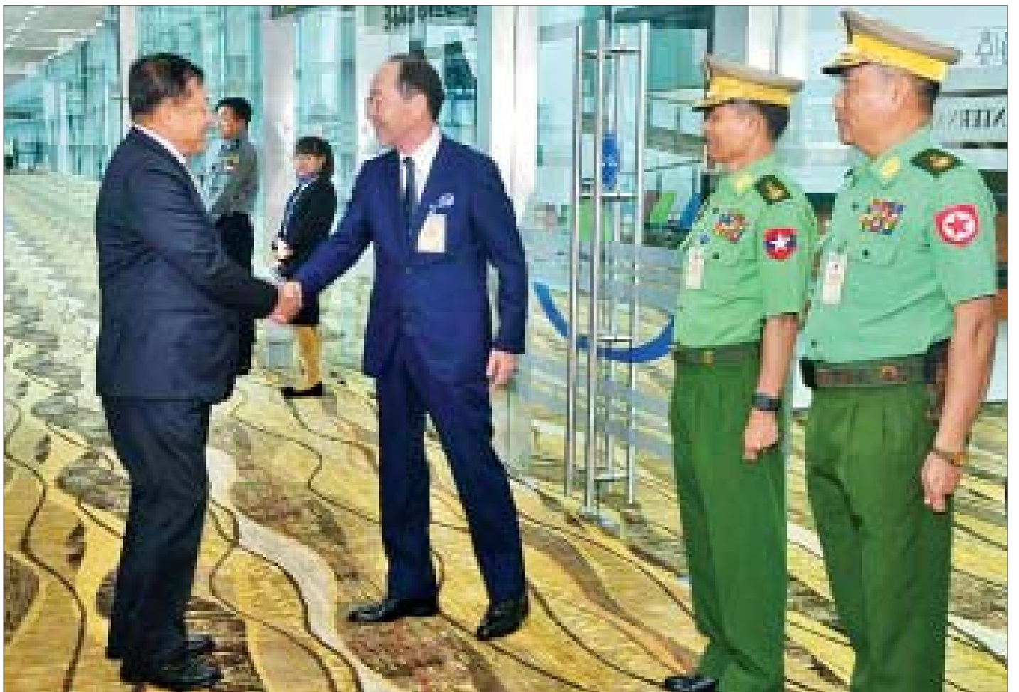
တပ်မတော်ကာကွယ်ရေးဦးစီးချုပ် ဗိုလ်ချုပ်မှူးကြီး မင်းအောင်လှိုင်အား ကာကွယ်ရေးဦးစီးချုပ်(ကြည်း)မှ ဒုတိယဗိုလ်ချုပ်ကြီး မင်းနောင်၊ ရန်ကုန်တိုင်းစစ်ဌာနချုပ်တိုင်းမှူး ဗိုလ်ချုပ် သက်ပုံနှင့် မြန်မာနိုင်ငံဆိုင်ရာ ဂျပန်နိုင်ငံသံအမတ်ကြီး Mr. Ichiro Maruyama တို့က ရန်ကုန်အပြည်ပြည်ဆိုင်ရာလေဆိပ်တွင် ကြိုဆိုနှုတ်ဆက်ကြစဉ်။