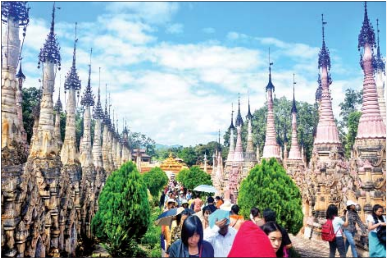
ရှေးဟောင်းသမိုင်းဝင် မွေတော်ကတ္တူဘုရား၌ ဘုရားဖူးပြည်သူများဖြင့် စည်ကားလျက်ရှိသည်ကို တွေ့ရစဉ်။

"မွေတော်ကတ္တူဘုရားမှာ ဘုရားစေတီတော်ပေါင်း ၂၄၇၈ ဆူရှိပါတယ်။