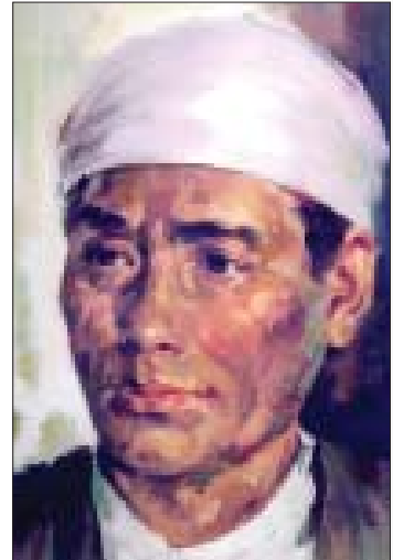
ဗြိတိသျှဘားမားရုပ်ရှင်မှ ပထမဆုံးရုပ်ရှင်ကား ရိုက်ကူးသူ ဒါရိုက်တာ ဆရာခန့်

ပထမဦးဆုံး မေတ္တာနှင့်သူရာ ရုပ်ရှင် ကားကို အောက်တိုဘာလ ၁၃ ရက်နေ့တွင် ရုံတင်ပြသပြီး ဒုတိယမြောက်ရုပ်ရှင်ကား ကျေးတောသူမနုကို ၁၉၂၁ ခုနှစ် မတ်လတွင် ရုံတင်ပြသနိုင်သည်။ မငွေမြိုင်မှာ ကျေးတော သူ မနု ဇာတ်ကားထဲမှ မနုနာမည်ကို အသိ အမှတ်ပြုကြပြီး မင်းသမီးခင်ခင်နုဟူ၍ နာမည်ကြီးသွားသည်။ မေတ္တာနှင့်သူရာ ဇာတ်ကား ရုံတင်ပြသစဉ်က အောက်မှ စန္ဒရားတစ်လုံးဖြင့် ပုံပိုးတီးခတ်ပေးသော် လည်းကျေးတောသူမနု ရုံတင်ပြသသည့်အခါ တွင် စန္ဒရား၊ မယ်ဒလင်၊ တယောဟူ၍ တူရိယာ သုံးမျိုးနှင့် ဇာတ်ပို့တီးခတ်ပေးသည်။ ပထမဆုံး ဇာတ်လမ်းနှင့်လိုက်ဖက်သည်များ သီဆိုနိုင်ရန် အဆိုတော်ဦးမြိုးကိုပါ ထည့်သွင်း အားဖြည့်သဖြင့် ပထမဆုံး ရုပ်ရှင်တေး အဆိုတော်ကို မှတ်တမ်းတင်ရမည်ဖြစ်သည်။