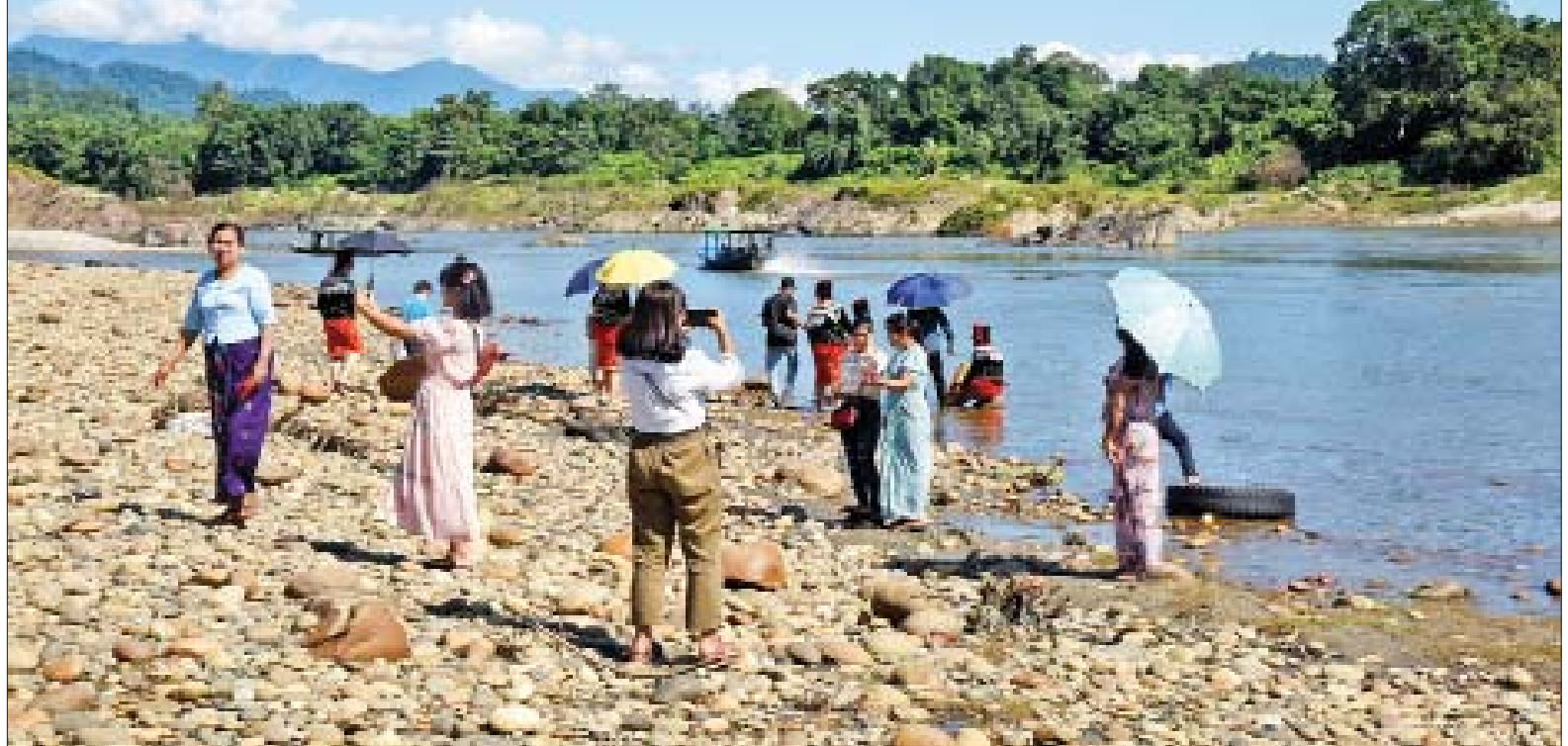
မြစ်ဆုံအပန်းဖြေစခန်းသို့ လာရောက်လည်ပတ်ကြသူများကို တွေ့ရစဉ်။

တွေ့နဲ့ ပထမဆုံးအကြိမ်အဖြစ် အလည်လာတာပါ။ မန္တလေးမှာ ဒီလိုမျိုးမရှိတော့ ရောက်တဲ့အချိန် အမှတ်တရဖြစ်ချင်လို့ ရိုးရာ ဝတ်စုံလေးတွေဝတ်ပြီး ဓာတ်ပုံရိုက် ဖြစ်တယ်။ မန္တလေးက လာတုန်းက ကားအကြာကြီးစီးရတော့ ကားမူး ပြီး ပင်ပန်းတယ်။ ဒီရောက်တော့ အပြင်မှာ တစ်ခါမှ မမြင်တွေ့ဖူးတဲ့ သာယာတဲ့မြင်ကွင်းကို တွေ့ရတော့ ပျော်သွားတယ်။ ပင်ပန်းတာတွေ ပျောက်သွားတယ်။ နောင်လည်း သူငယ်ချင်းတွေနဲ့ ထပ်လာလည်ဖို့ ဆုံးဖြတ်ထားတယ်။