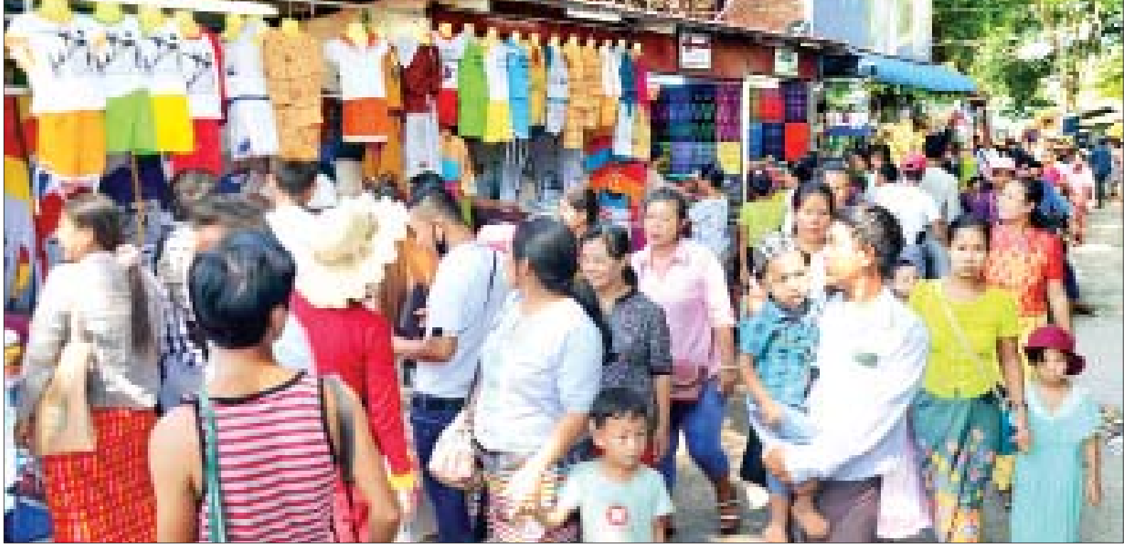
ဦးပိန်တံတားအနီး ဖွင့်လှစ်ရောင်းချသည့် အမှတ်တရ လက်ဆောင်ပစ္စည်းအရောင်းဆိုင်များတွင် စည်ကားလျက်ရှိသည်ကို တွေ့ရစဉ်။

တောင်သမန်အင်းနှင့် ဦးပိန်တံတားသို့ လာရောက်လည်ပတ်ကြသည့် ပြည်တွင်းခရီးသွားများသည် အင်းအတွင်း ငှက်လှေစီးခြင်း၊ ဦးပိန်သစ်သားတံတားပေါ် လမ်းလျှောက်၍ အပ်နှံခြေခြင်း၊ အမှတ်တရ ဓာတ်ပုံရိုက်ကူးခြင်းများအပြင် တောင်သမန်အင်းပတ်လည်တွင် ရောင်းချနေကြသည့် ဒေသထွက်ကုန်ပစ္စည်းများနှင့် အမှတ်တရလက်ဆောင်ပစ္စည်းများအား ဝယ်ယူမှုများဖြင့် စည်ကားလျက်ရှိသည်။