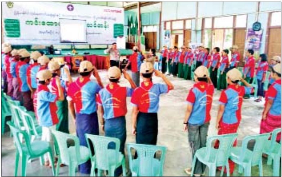
ရပ်ရွာအခြေပြုကင်းထောက်သင်တန်းကို စစ်ကိုင်းတိုင်းဒေသကြီး ဆားလင်းကြီးမြို့နယ်တွင် ဖွင့်လှစ်ရာ မြန်မာနိုင်ငံကင်းထောက်အဖွဲ့ချုပ်မှ သင်တန်းသားများအား လေ့ကျင့်သင်ကြားပေးနေစဉ်။

ရှိ ကျေးရွာပေါင်း ၃၀ မှ ကျေးရွာလူငယ်ခေါင်းဆောင် ၃၀၊ အခြေခံပညာအထက်တန်းကျောင်း ဆားလင်းကြီးမှ လူငယ် ၂၀ စုစုပေါင်း ၅၀ တက်ရောက်ပြီး သင်တန်းကာလမှာ အောက်တိုဘာ ၁၂ ရက်မှ ၁၅ ရက်အထိ ကမ္ဘာ့ကင်းထောက်အဖွဲ့နှင့် မြန်မာကင်းထောက်အဖွဲ့တို့ လှုပ်ရှားမှုများ၊ ပြည်သူ့အကျိုးပြုကင်းထောက်ပညာရပ်များ၊ စခန်းချခြင်း၊ ကင်းထောက်တေးသီချင်းများသီဆိုမှု အပါအဝင် စာတွေ့လက်တွေ့ လေ့ကျင့်သင်ကြားပေးမည်ဖြစ်သည်။ မြန်မာနိုင်ငံတွင် ၂၀၁၂ ခုနှစ်မှစတင်ပြီး ကင်းထောက်သင်တန်းများကို အခြေခံပညာကျောင်းများကို အခြေပြု၍ ဖွင့်လှစ်သင်ကြားပေးခဲ့ရာ ၂၀၁၄ ခုနှစ်တွင် တက္ကသိုလ်အခြေပြုကင်းထောက်သင်တန်းများအဖြစ် တိုးချဲ့ဖွင့်လှစ်နိုင်ခဲ့သည်။ ၂၀၁၈-၂၀၁၉ ခုနှစ်တွင် ရပ်ရွာအခြေပြုကင်းထောက်အခြေခံသင်တန်းများအဖြစ် ပြည်သူ့အခြေပြုလူမှုအကျိုးပြုကင်းထောက်သင်တန်းများ တိုးချဲ့ဖွင့်လှစ်သည့် အစီအစဉ်အရ ပြည်နယ်နှင့်တိုင်းဒေသကြီး မြို့နယ်အသီးသီးရှိ ကျေးရွာရပ်ကွက်များတွင် ယခုကဲ့သို့ ရပ်ရွာအခြေပြုကင်းထောက်သင်တန်းများ ဖွင့်လှစ်ခြင်းဖြစ်ကြောင်း မြန်မာနိုင်ငံကင်းထောက်အဖွဲ့ချုပ်မှ သိရသည်။