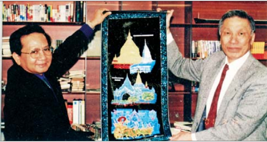
တိုကျိုမြို့အနီးရှိ ဝူဒူဒူအား အမှတ်တရလက်ဆောင်ပေးနေစဉ်။

လိုင်းကား၊ တက္ကစီကားတွေအပြင် အထပ်ခြောက်ထပ်ရှိတဲ့ ရထားလိုင်းတွေ၊ မြေပေါ်ရထား၊ မြေအောက်ရထား၊ ကျည်ဆန်ရထားတွေနဲ့လည်း တစ်မြို့ပြီးတစ်မြို့