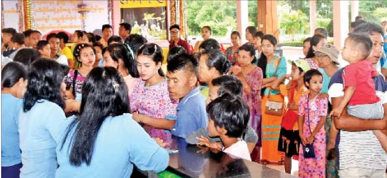
သီတင်းကျွတ်လပြည့်ကျော် ၁ ရက်တွင် အမျိုးသားအထိမ်းအမှတ်ဥယျာဉ်(နေပြည်တော်)သို့ လာရောက်ကြသူများကို တွေ့ရစဉ်။

ရောက်တာရှိသလို၊ မိသားစုနဲ့ လာရောက်အပန်းဖြေတာလည်း ရှိပါတယ်။ ကျွန်တော်တို့လို နေပြည်တော်နဲ့ ပတ်ဝန်းကျင်မြို့တွေမှာ နေထိုင်သူ တွေအနေနဲ့ ချောင်းသာတို့ ငွေဆောင်