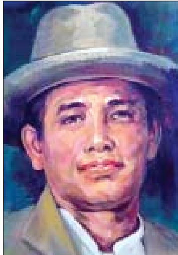
ပထမဆုံး နှစ်ကိုယ်ခွဲ သရုပ်ဆောင်သူ ကိုဘတင် (ဒဂုန်ပ ဦးတင်)