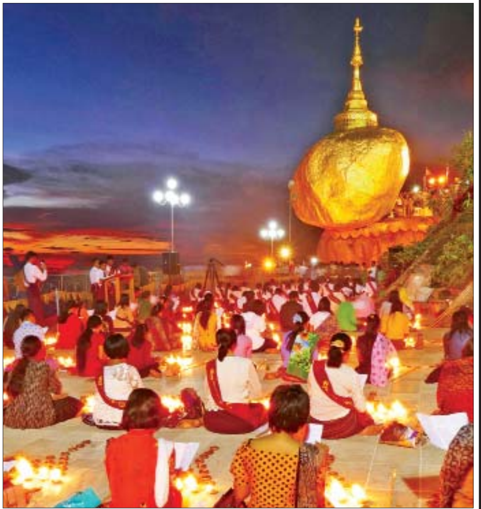
သီတင်းကျွတ်လပြည့်ညက ကျိုက်ထီးရိုးဆံတော်ရှင်စေတီတော်၌ တရားဘာဝနာပွားများ အားထုတ်နေကြစဉ်။