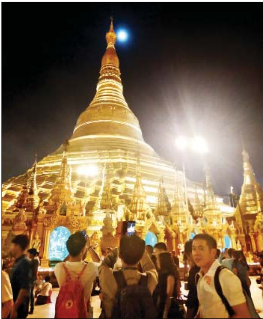
သီတင်းကျွတ်လပြည့်ည ရွှေတိဂုံစေတီတော်တွင် ဘုရားဖူးလာပြည်သူများဖြင့် စည်ကားလျက်ရှိစဉ်။