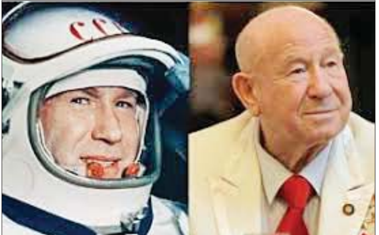
ကိုးကား-အင်န်အိတ်ချ်ကေ၊ ဘာသာပြန်-ဇော်ဝင်း

မော်စကို အောက်တိုဘာ ၁၃ လွန်ခဲ့သည့် နှစ်ပေါင်း ၅၄ နှစ်ခန့်က အာကာသအတွင်း ပထမဦးဆုံး လမ်းလျှောက်ခဲ့သည့် ဆိုဗီယက်ခေတ်မှ အာကာသယာဉ်မှူးဟောင်းကြီး အလက်ဇီလီယိုနော့ဗ် အသက် (၈၅)နှစ်သည် အောက်တိုဘာ ၁၁ ရက်တွင် ကွယ်လွန်သွားခဲ့ကြောင်း အင်န်အိတ်ချ်ကေသတင်းတွင် ဖော်ပြသည်။ အာကာသယာဉ်မှူးဟောင်းကြီး လီယိုနော့ဗ်သည် ကာလရှည်ကြာစွာ နာမကျန်းဖြစ်ခဲ့ပြီးနောက် အောက်တိုဘာ ၁၁ ရက်တွင် ရုရှားနိုင်ငံမြို့တော် မော်စကိုရှိဆေးရုံတစ်ရုံ၌ ကွယ်လွန်ခဲ့ခြင်းဖြစ်သည်။ ၎င်းအား ၁၉၄၄ ခုနှစ်တွင် ဆိုဗီယက်ယူနိုက်တက်ပြည်ထောင်စုအတွင်း အသက် ၂၀ ကျော်တွင် ဆိုဗီယက်လေတပ်တွင် လေယာဉ်မှူးအဖြစ် တာဝန်ထမ်းဆောင်ခဲ့စဉ် ဆိုဗီယက်ယူနိုက်တက် ပထမဆုံး အာကာသယာဉ်မှူးအုပ်စုအတွက် ရွေးချယ်ခြင်းခံခဲ့ရသည်။ ၁၉၆၅ ခုနှစ်တွင် လီယိုနော့ဗ်အား ဗော့စ်ဟုဒ်-၂ အမည်ရှိ အာကာသယာဉ်ဖြင့် အာကာသအတွင်းသို့ စေလွှတ်ခြင်းခံခဲ့ရပြီး ယင်းအချိန်၌ ၎င်းမှာ အသက် ၃၀ နှစ်ရှိပြီဖြစ်သည်။ ယင်းအာကာသခရီးစဉ်အတွင်း၌ ၎င်း၏ ထူးခြားသောလုပ်ဆောင်မှုမှာ အာကာသယာဉ်မှ လုံခြုံရေးကြိုးဖြင့် ချိတ်ဆက်ချည်နှောင်ကာ အာကာသအတွင်း၌ ၁၀ မိနစ်ခန့် ပထမဆုံးအကြိမ် လမ်းလျှောက်ခဲ့ခြင်းဖြစ်သည်။ ၁၉၇၅ ခုနှစ်တွင် အလက်ဇီလီယိုနော့ဗ်သည် ဆိုဗီယက်အာကာသယာဉ်မှူးများအဖွဲ့ကို ဦးဆောင်ကာ အပိုလို-ဆိုယုစ်မစ်ရှင်တွင် ဆိုဗီယက်အာကာသယာဉ်နှင့် အမေရိကန် အာကာသထိပ်ဖူးယာဉ်တို့ကို ချိတ်ဆက်ခဲ့သည်။ ၎င်းသည် နောက်ပိုင်းကာလများ၌ အာကာသယာဉ်မှူးများကို လေကျင့်သင်ကြားမှုများ လုပ်ဆောင်ခဲ့သည်။