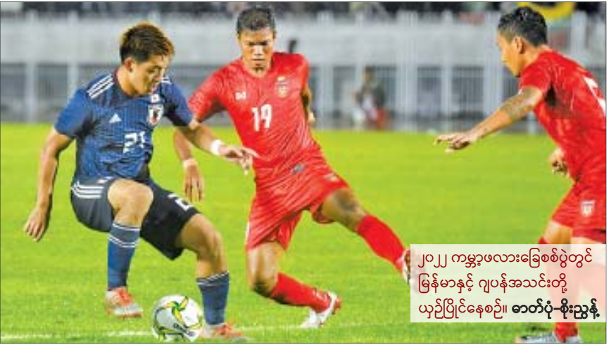
၂၀၂၂ ကမ္ဘာ့ဖလားခြေစစ်ပွဲတွင် မြန်မာနှင့် ဂျပန်အသင်းတို့ ယှဉ်ပြိုင်နေစဉ်၊ ဓာတ်ပုံ-စိုးညွန့်