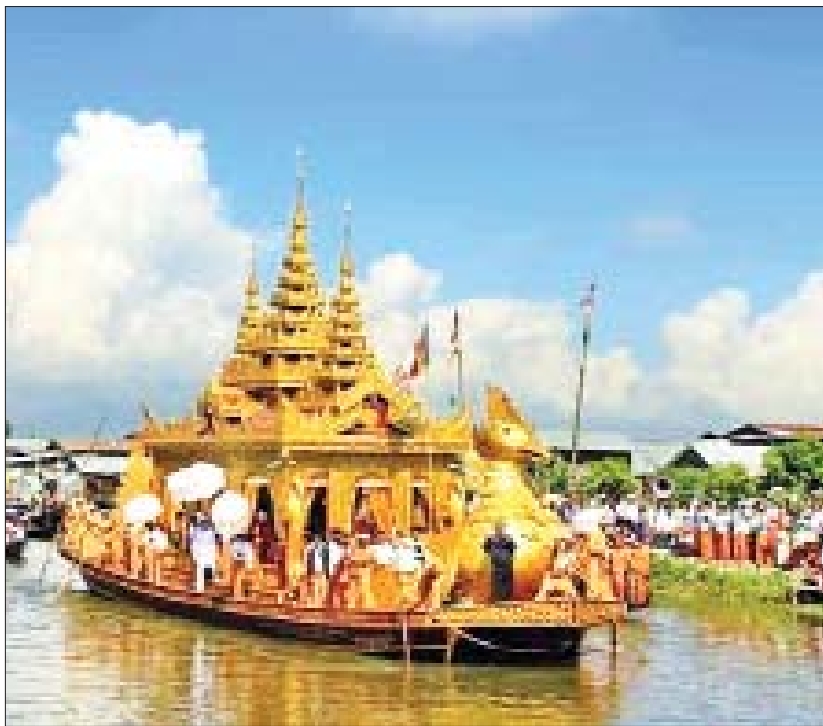
သီတင်းကျွတ်လပြည့်နေ့တွင် အင်းလေးမောင်တော်ဦး မြတ်စွာဘုရား ဒေသစာရီ ကြွချီအပူဇော်ခံစဉ်။