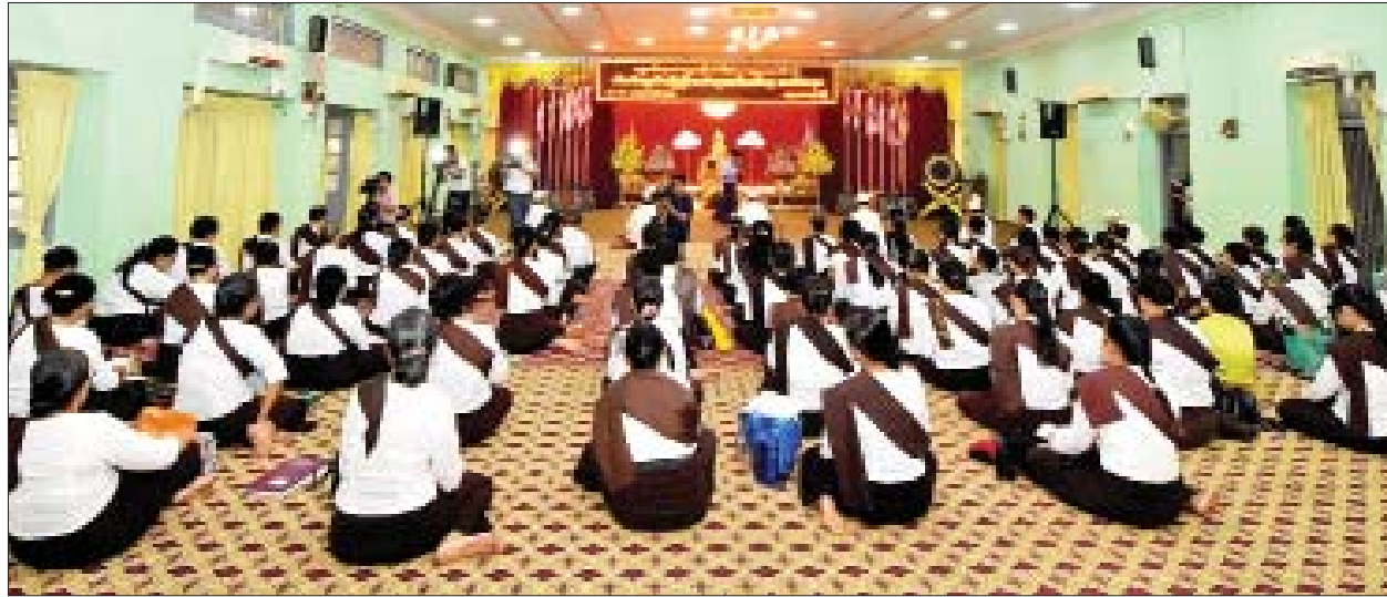
သီတင်းကျွတ်လပြည့်နေ့တွင် ရန်ကုန်မြို့၊ သီရိမင်္ဂလာကမ္ဘာအေးစေတီတော်၌ ဝတ်အသင်းအဖွဲ့များက ဓမ္မပူဇာတရားတော်များကို ရွတ်ဆိုပူဇော်ကြစဉ်။

ရှေးယခင်မှ ယနေ့ထက်တိုင် ဗုဒ္ဓဘာသာဝင်များက ပူဇော်ကြခြင်းဖြစ်သည်။ ရွှေတိဂုံစေတီတော်၏ ၁၃၈ ခုနှစ် သီတင်းကျွတ်လပြည့် အဘိဓမ္မာအခါ တော်နေ့ အခမ်းအနားကို ယနေ့နံနက်ပိုင်းမှစတင်၍ ရင်ပြင်တော်ရှိ သတ်မှတ် နေရာအသီးသီး၌ ကျင်းပကြသည်။