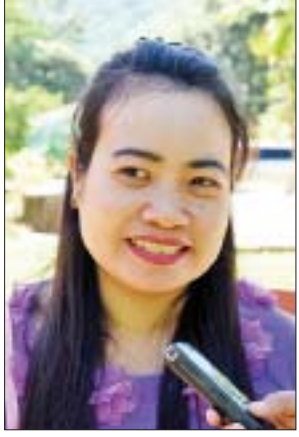
မအိအိလှိုင်

အခုလို အများပြည်သူရုံးပိတ်ရက်မှာ မြစ်ကြီးနားက ဆွေမျိုးတွေဆီ အလည်လာရင်းနဲ့ ဆန်းစစ်ရေးတံခွန်ကို အလည်လာဖြစ်တာပါ။ တစ်ခါမှ မရောက်ဖူးဘူး။ ဒီရောက်တော့ ဆန်းစစ်ရေးတံခွန်ကြီးကိုမြင်တော့ အတော်ကို အံ့ဩသွားတယ်။ အံ့ဩသွားလောက်အောင်လည်း ဆန်းက တကယ်လှပါတယ်။ ပြည်တွင်းခရီးသွားတွေသာမက ပြည်ပခရီးသွားတွေကို ဆွဲဆောင်နိုင်တဲ့ မြန်မာနိုင်ငံရဲ့ လှပတဲ့နေရာလေးတစ်ခုပါ။ ရေတံခွန်ပတ်ဝန်းကျင်က စိမ်းစိုစိုစိုနဲ့ တောတောင်တွေက အေးချမ်းနေတယ်။ ပင်ပန်းသမျှတွေ လန်းဆန်းစေနိုင်တဲ့ နေရာလေးတစ်ခုပါ။ ကိုယ့်အရပ်ဒေသနဲ့ ခြားနားတဲ့ သဘာဝရှုခင်းတွေ အများကြီး ရှိပါတယ်။ နောက်ထပ်တစ်ကြိမ်လည်း လာလည်ချင်သေးတယ်။ အခုက အရင်ကလို ဆန်းလာလည်ဖို့လည်း မခက်တော့ပါဘူး။ လမ်းပန်းဆက်သွယ်ရေး တွေလည်း ကောင်းနေပါပြီ။ လာလည်ရတာ တန်ပါတယ်။