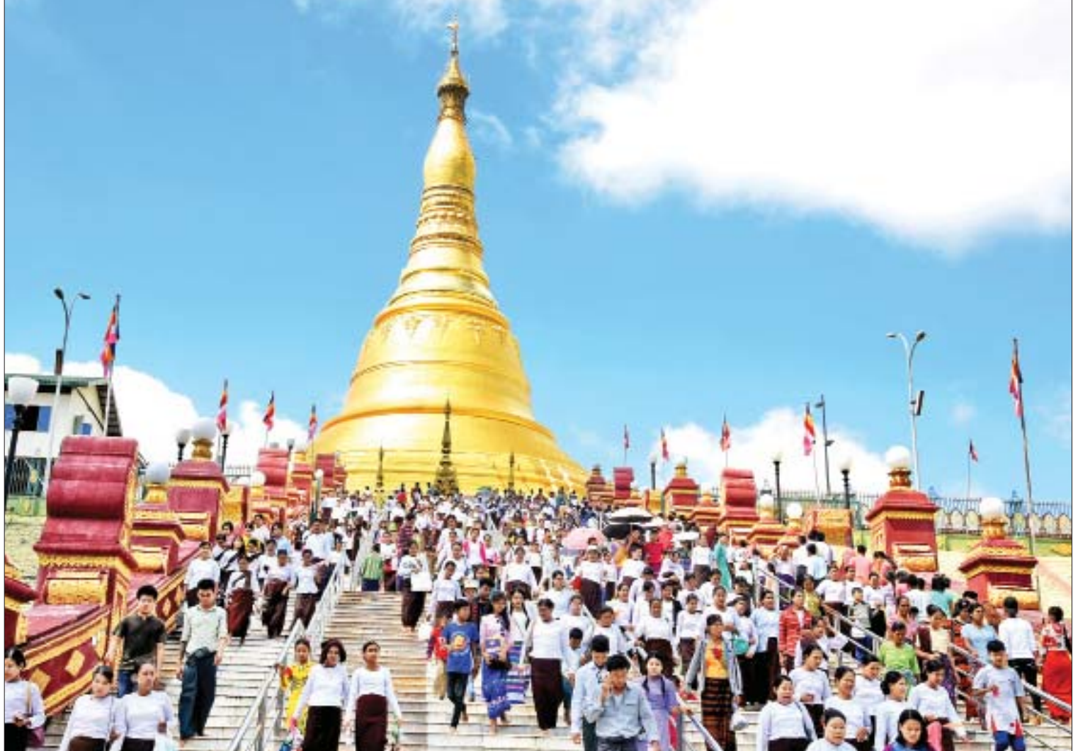
ဒါနသံများဖြင့် သောသောညံလျက်ရှိသည်။ ဩဂုဏ္ဍပုဏ္ဏား ယနေ့ နံနက်ပိုင်းမှစတင်၍ နေပြည်တော်ကောင်စီနယ်မြေအတွင်းရှိ ရန်အောင်မြင်ရွှေလက်လှစေတီတော်၊ ကိုးနဝင်းစေတီတော်၊ ဆုတောင်းပြည့် လောကမာရဇိန်စေတီတော်၊ ဓာတုစယဓာတ်ပေါင်းစုစေတီတော်၊ သံသရာ ငြိမ်းအေးစေတီတော်၊ ဘုရားကိုးဆူ၊ ကိုးခန်းကြီးဘုရား၊ အောင်မင်းခေါင်ဘုရား၊ မင်းဝံတောင်ဘုရား၊ စူဠာမဏိဘုရား၊ မဟာသကျရံသီရိပတော်မူရုပ်ရှင်တော်မြတ်ကြီး၊ သတ္တသတ္တာမဟာမဟာဗောဓိစေတီတော်နှင့် သံဝေဇနိယလေးဌာနတို့တွင် တရားဘာဝနာအားထုတ်ကြသူများ၊ ကုသိုလ်ကောင်းမှုပြုသူများ၊ ဘုရားဖူးလာပြည်သူများဖြင့် ကြက်ပျံမကျ စည်ကားလျက်ရှိသည်။ ဆီမီးရောင်များ လင်းထိန်ညှိုင်းတွင် အဆိုပါဘုရားများ၌ ဆီမီးပူဇော်ပွဲများ၊ နေပြည်တော်အတွင်းရှိ ဝန်ကြီးဌာနရုံးများနှင့် အထင်ကရနေရာများတွင် လျှပ်စစ်မီးအလှဆင်ထွန်းညှိခြင်း၊ ဝန်ထမ်းအိမ်ရာများနှင့် ရပ်ကွက်များရှိ နေအိမ်များ၌ မြတ်စွာဘုရားရှင်အား ရည်မှန်း၍ ဆီမီးနှင့်မီးရောင်စုံများ ထွန်းညှိပူဇော်ကြရာ နေပြည်တော်တစ်ဝန်းလုံး ဆီမီးရောင်များဖြင့် နေ့နှင့်မခြား လင်းထိန်လျက်ရှိသည်။ သတင်း - ကျော်သူထက်

၁၃၈၁ ခုနှစ် သီတင်းကျွတ်လပြည့်နေ့ (အဘိဓမ္မာအခါတော်နေ့)တွင် နေပြည်တော်အတွင်းရှိ ဘုရားစေတီများ၊ ဘုန်းတော်ကြီးကျောင်းများ၌ ဥပုသ်သီလဆောက်တည်ကြသူများ၊ အလှူဒါနပြုကြသူများ၊ အနယ်နယ်အရပ်ရပ်မှ ဘုရားဖူးလာပြည်သူများဖြင့် စည်ကားလျက်ရှိသည့်အပြင် ဝန်ထမ်းအိမ်ရာများနှင့် ရပ်ကွက်များတွင် ဝါတွင်းသုံးလပြုလုပ်ခဲ့သည့် ဆွမ်းလောင်းလှူပွဲများ၏ အောင်ပွဲအဖြစ် တရားသဘင်များကျင်းပခြင်း၊ သံဃာတော်အရှင်သူမြတ်များအား ဆွမ်းဆက်ကပ်လှူဒါန်းခြင်း၊ ပဋ္ဌာန်းဒေသနာတော်နှင့် ပရိတ်တရားတော်များကို နာယူရွတ်ပွားပူဇော်ခြင်း စသည့် ကုသိုလ်ဒါနပြုလုပ်ကြသူများ၏ သီလ