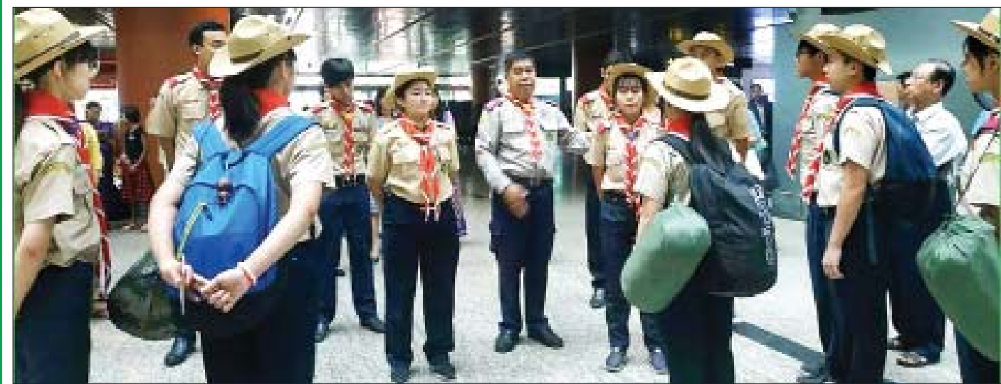
နိုင်ငံတကာသင်တန်းများသို့ တက်ရောက်ကြမည့် ကင်းထောက်အဖွဲ့ဝင်များအား ရန်ကုန်အပြည်ပြည်ဆိုင်ရာလေဆိပ်၌ ပို့ဆောင်နှုတ်ဆက်သူများနှင့်အတူ တွေ့ရစဉ်။

အစိုးရ ဆရာ၊ မိဘ၊ ကျောင်းသား၊ အရပ်ဘက် လူအဖွဲ့အစည်းများအားလုံး နိုင်ငံအတွက် ကင်းထောက် လုပ်ငန်းရှင်သန်စေရေး ဝိုင်းဝန်းတွန်းအားပေးကြပါရန် မေတ္တာရပ်ခံအပ်ပါသည်။ ။