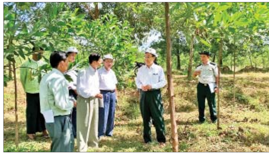
ဆောင်ရွက်မှုအဖွဲ့အစည်း (Asia Forest Cooperation Organization) ၏ ဒေသအဆင့် လေ့ကျင့်ပညာပေးရေး သင်တန်းကျောင်း (Regional Education and Training Center - RETC) သို့ရောက်ရှိရာ တာဝန်ရှိသူများက သင်တန်း ကျောင်း လေ့ကျင့်ရေးသစ်တော (Training Forest) တည် ထောင်ရန် ဆောင်ရွက်ထားရှိမှုများကိုလည်းကောင်း၊

နေပြည်တော် အောက်တိုဘာ ၁၃ သယံဇာတနှင့် သဘာဝပတ်ဝန်းကျင် ထိန်းသိမ်းရေး ဝန်ကြီးဌာန ပြည်ထောင်စုဝန်ကြီး ဦးအုန်းဝင်းသည် အောက်တိုဘာ ၁၁ ရက် နံနက်ပိုင်းတွင် ရန်ကုန်တိုင်းဒေသ ကြီး တိုက်ကြီးမြို့နယ် လိမ္မော်ခြံကျေးရွာအနီး လှိုင်ရိုးမ တောင်ပေါ်ကြိုးပိုင်း အကွက်အမှတ်(၁၅) အတွင်းရှိ သစ် တောထွက်ပစ္စည်းဖက်စပ်ကော်ပိုရေးရှင်းလီမိတက်၏ ပုဂ္ဂလိကသစ်မာစိုက်ခင်း ဧက ၁၀၀၀ အတွင်း စိုက်ခင်း ပြန်လည်ဆယ်တင်စိုက်ပျိုးသည့်အနေဖြင့် ၂၀၁၇ ခုနှစ် မန်ဂျန်ရှားသစ်မာစိုက်ခင်း ဧက ၁၅၀ နှင့် ၂၀၁၈ ခုနှစ် မန်ဂျန်ရှားသစ်မာစိုက်ခင်း ၂၅၅ ဧကကိုလည်းကောင်း၊ ၂၀၁၉ ခုနှစ် စိုက်ခင်းဆယ်တင်စိုက်ပျိုးခြင်း မန်ဂျန်ရှား (ဗီယက်နမ်မျိုးစိတ်) သစ်မာ ဧက ၁၅၀ စိုက်ပျိုးရှင်သန်နေ မှုများကိုလည်းကောင်း ကြည့်ရှုစစ်ဆေးသည်။ မွန်းလွဲပိုင်းတွင် ပြည်ထောင်စုဝန်ကြီးနှင့်အဖွဲ့သည် မှော်ဘီမြို့နယ် လှည်းငုပ်ချောင်းကျေးရွာအုပ်စု ရေတွင်း ကုန်းကျေးရွာ ရန်ကုန်-ပြည်လမ်း မိုင်တိုင်အမှတ်(၃၅)အနီး သစ်တောဦးစီးဌာန သစ်စေ့နှင့်ပျိုးပင်ထုတ်လုပ်ရေးစခန်း ဝင်းအတွင်း အာရှဒေသသစ်တောကဏ္ဍ ပူးပေါင်း