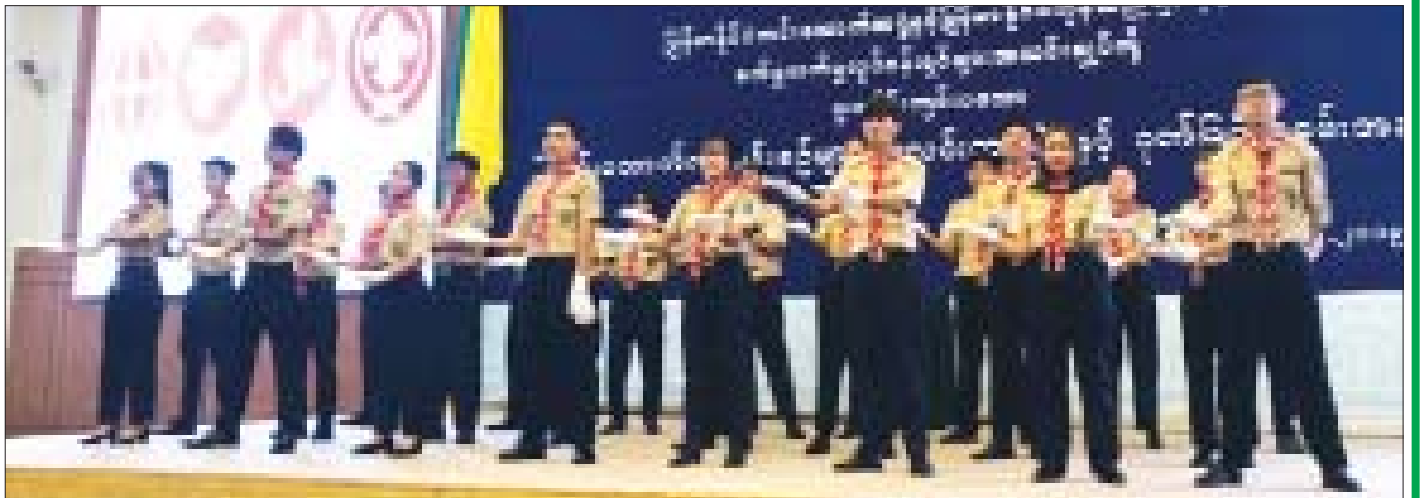
ငြိမ်းချမ်းရေးသံတမန်သီချင်းဆိုနေသော ကင်းထောက်များ။

ကင်းထောက်စိတ်ဓာတ်သည် သူတစ်ပါးထက် သာအောင်လုပ်ရန်မဟုတ်။ သူတစ်ပါးကို အနိုင်ကျင့် စော်ကားရန် မဟုတ်။ အမှီခိုကင်းကင်းနှင့် သူတစ်ပါးကို ကူညီနိုင်ရန်၊ ယုံကြည်ချက်တူသူများနှင့် စိတ်ပါလက်ပါ အတူလက်တွဲလုပ်ကိုင်တတ်ရန်၊ လုပ်ငန်းတစ်ခုစီပြီးလျှင် ပြီးဆုံးအောင် လုပ်ကိုင်တတ်ရန်၊ မာနထောင်လွှားခြင်း