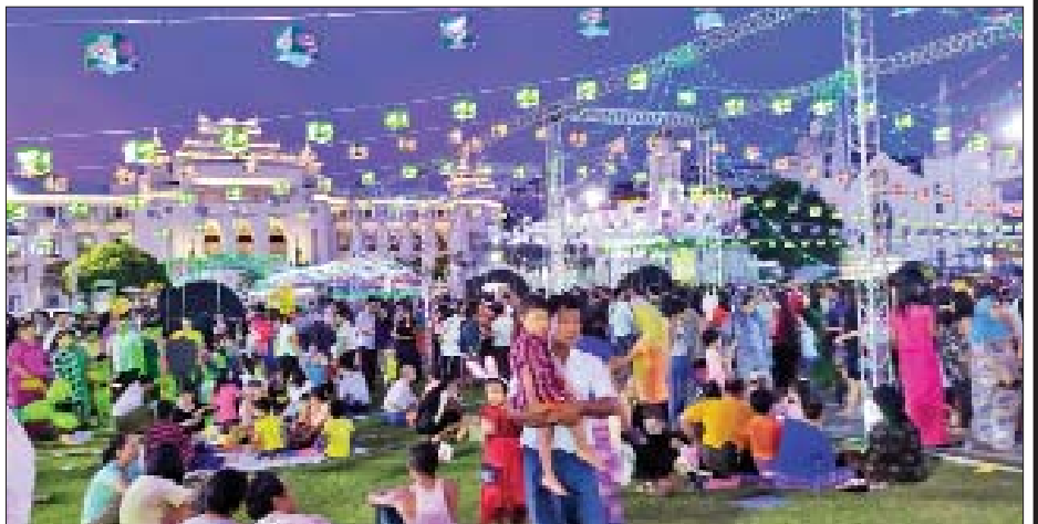
ရန်ကုန်မြို့ မဟာဗန္ဓုလပန်းခြံ၌ ရောင်စုံမီးပန်းများဖြင့် သီတင်းကျွတ်မီးထွန်းပွဲတော် ကျင်းပစဉ်။