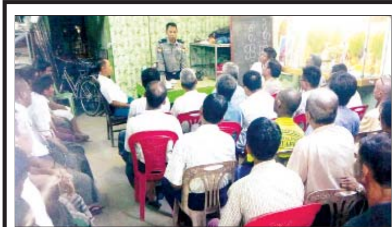
အောက်တိုဘာ ၁၁ ရက် ည ၈ နာရီက သုဝဏ္ဏ (ခ) ရပ်ကွက် အုပ်ချုပ်ရေးမှူးရုံး၌ မှုခင်းအသိပညာပေး ဟောပြောပွဲ ကျင်းပစဉ်။