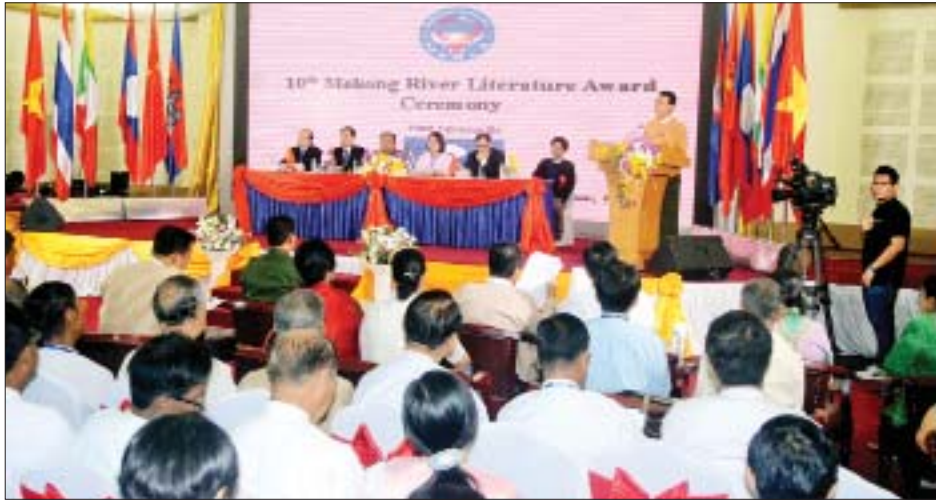
တာဝန်ရှိသူများနှင့် ဖိတ်ကြားထားသူများ တက်ရောက်ကြသည်။

ရန်ကုန် အောက်တိုဘာ ၁၃ (၁၀)ကြိမ်မြောက် မဲခေါင်စာပေဆုချီးမြှင့်ပွဲ အခမ်းအနားကို အောက်တိုဘာ ၁၂ ရက် နံနက်ပိုင်းက ရန်ကုန်မြို့ ဗဟန်း မြို့နယ် ဆရာစံပလာစာ(၅)လွှာရှိ CBC (Ballroom)၌ ကျင်းပသည်။