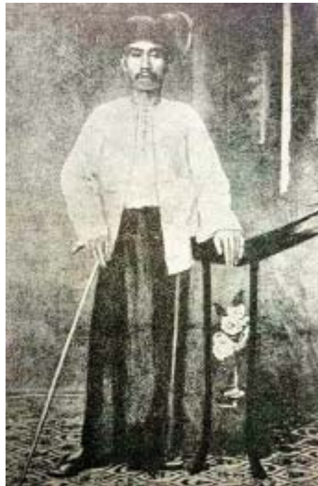
သာယာဝတီ ဂဠုန်လယ်သမားပုန်ကန်မှုကြီးကို ဦးဆောင်ခဲ့သည့် ဆရာဖွဲ့

မြန်မာနိုင်ငံလည်း ပါဝင်လာစေမည့်စနစ်တစ်ခုဖြစ်သည်။ ထိုအုပ်ချုပ်မှုပြင်ပြောင်းလဲမှုစီမံချက်အရ အကောင် အထည်ဖော်မည့် ဗြိတိသျှတို့၏ ဆာအေအက်ဖ်ပိုက် ခေါင်းဆောင်သည့် ပိုက်ကော်မတီကို GCBA က သပိတ် မမှောက်ခဲ့သော်လည်း ၁၉၂၃ ခုနှစ် ဇန်နဝါရီလ ၁ ရက်နေ့တွင် ဒိုင်အာခီသည် အတည်ဖြစ်ခဲ့သည်။ ဒိုင်အာခီအုပ်ချုပ်ရေးအရ ၁၉၂၂ ခုနှစ်အတွက် ရည်ရွယ်ကျင်းပသော ဥပဒေပြုကောင်စီ ရွေးကောက်ပွဲနှင့် ဥပဒေပြုကောင်စီများလည်း ပေါ်ပေါက် လာပြီး ၎င်းရွေးကောက်ပွဲများတွင် မြန်မာကိုယ်စားလှယ် များ ဝင်ရောက်ယှဉ်ပြိုင်ရွေးချယ်ခံရသည့် အခြေအနေများ ဖြစ်ပေါ်ခဲ့ပါသည်။