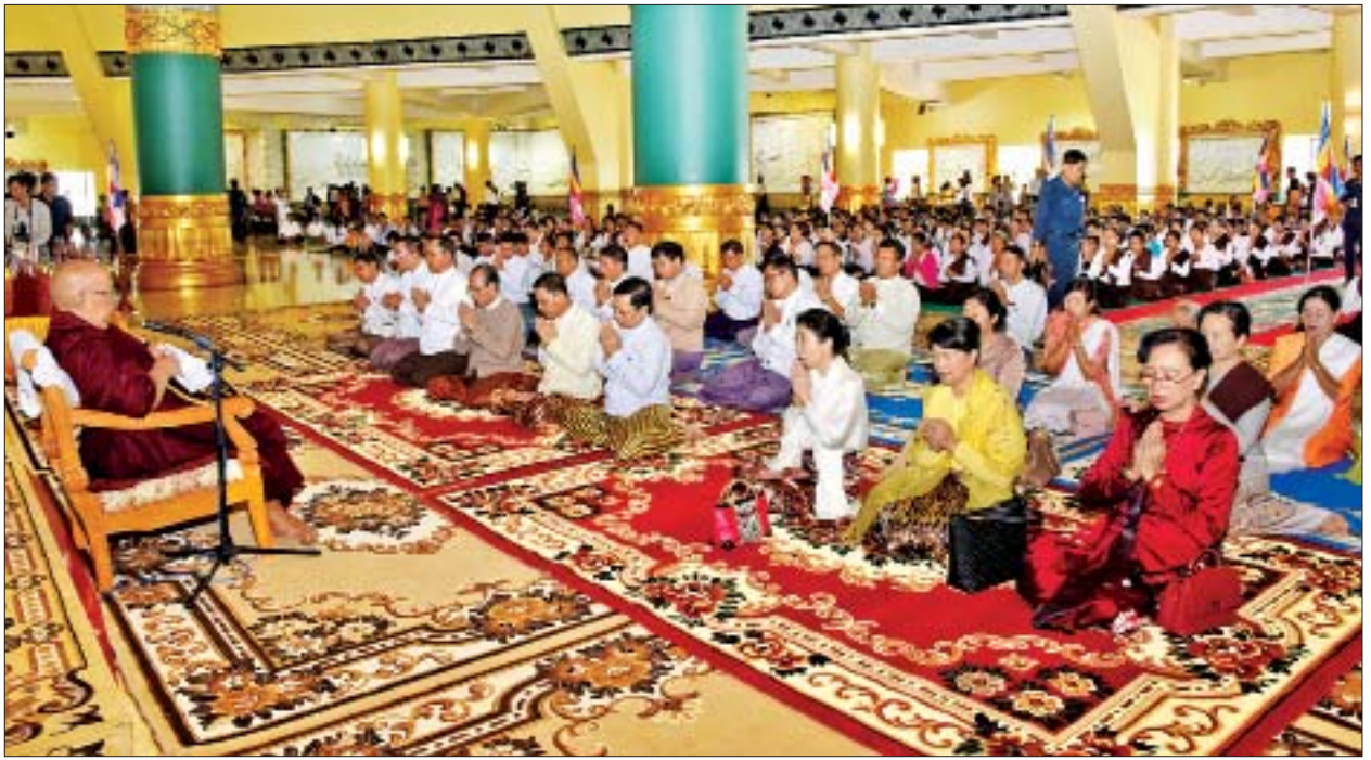
ထို့နောက် အဘိဓမ္မာရတနာဂုဏ္ဍာဒန္တဇနိန္ဒထံမှ အဘိဓမ္မာအခါတော်နေ့ တရားတော်ကို နာယူကြည်ညိုကြပြီး လှူဒါန်းမှုအစုအတွက် ရေစက်သွန်းလောင်း အမျှပေးဝေကြသည်။ ယင်းနောက် ပြည်ထောင်စုဝန်ကြီး သူရဦးအောင်ကိုနှင့် တာဝန်ရှိသူများက လယ်ဝေးမြို့ ပေါက်မြိုင်ကျောင်းတိုက် ပဓာနနာယကဆရာတော် အဘိဓမ္မာရတနာဂုဏ္ဍာဒန္တဇနိန္ဒအမှူးပြုသော ဆရာတော်၊ သံဃာတော်များအား နေ့ဆွမ်းဆက်ကပ်လှူဒါန်းကြသည်။ သတင်းစဉ်

ထို့နောက် သာသနာရေးနှင့် ယဉ်ကျေးမှုဝန်ကြီးဌာန ပြည်ထောင်စုဝန်ကြီး သူရဦးအောင်ကိုနှင့် ဇနီး၊ ပြည်ထောင်စုရှေ့နေချုပ် ဦးထွန်းထွန်းဦးနှင့် ဇနီး၊ နေပြည်တော်ကောင်စီဥက္ကဋ္ဌ ဒေါက်တာမျိုးအောင်နှင့် ဇနီး၊ နေပြည်တော်တိုင်းစစ်ဌာနချုပ် တိုင်းမှူး ဗိုလ်ချုပ်မြင့်မော်၊ ဆောက်လုပ်ရေးဝန်ကြီးဌာန ဒုတိယဝန်ကြီး ဦးကျော်လင်းနှင့် စေတီတော်ဂေါပကအဖွဲ့၏ နာယကအဖွဲ့ဝင်များက ဘဒ္ဒန္တဇနိန္ဒအမှူးပြုသော ဆရာတော်၊ သံဃာတော်များအား လှူဖွယ်ပစ္စည်းများ ဆက်ကပ်လှူဒါန်းကြသည်။