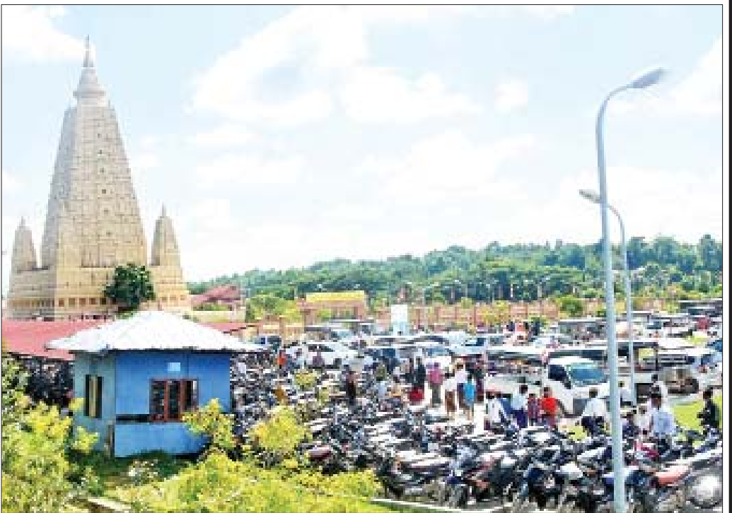
နေပြည်တော် ဗုဒ္ဓဂါယာ၌ ဘုရားဖူးပြည်သူများဖြင့် စည်ကားနေသည်ကို တွေ့ရစဉ်။