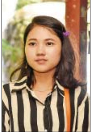
မအေးအေးမြင့်