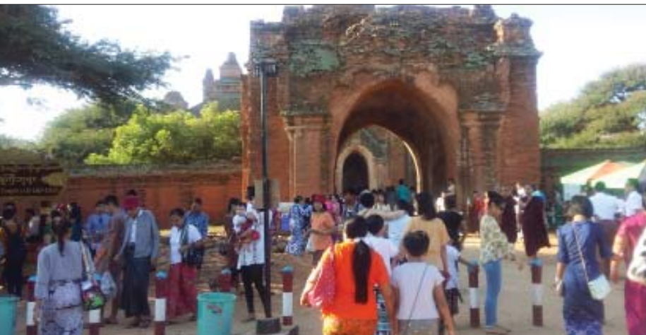
ပုဂံရှေးဟောင်းယဉ်ကျေးမှုနယ်မြေ၌ ဘုရားဖူးပြည်သူများဖြင့် စည်ကားနေသည်ကိုတွေ့ရစဉ်။