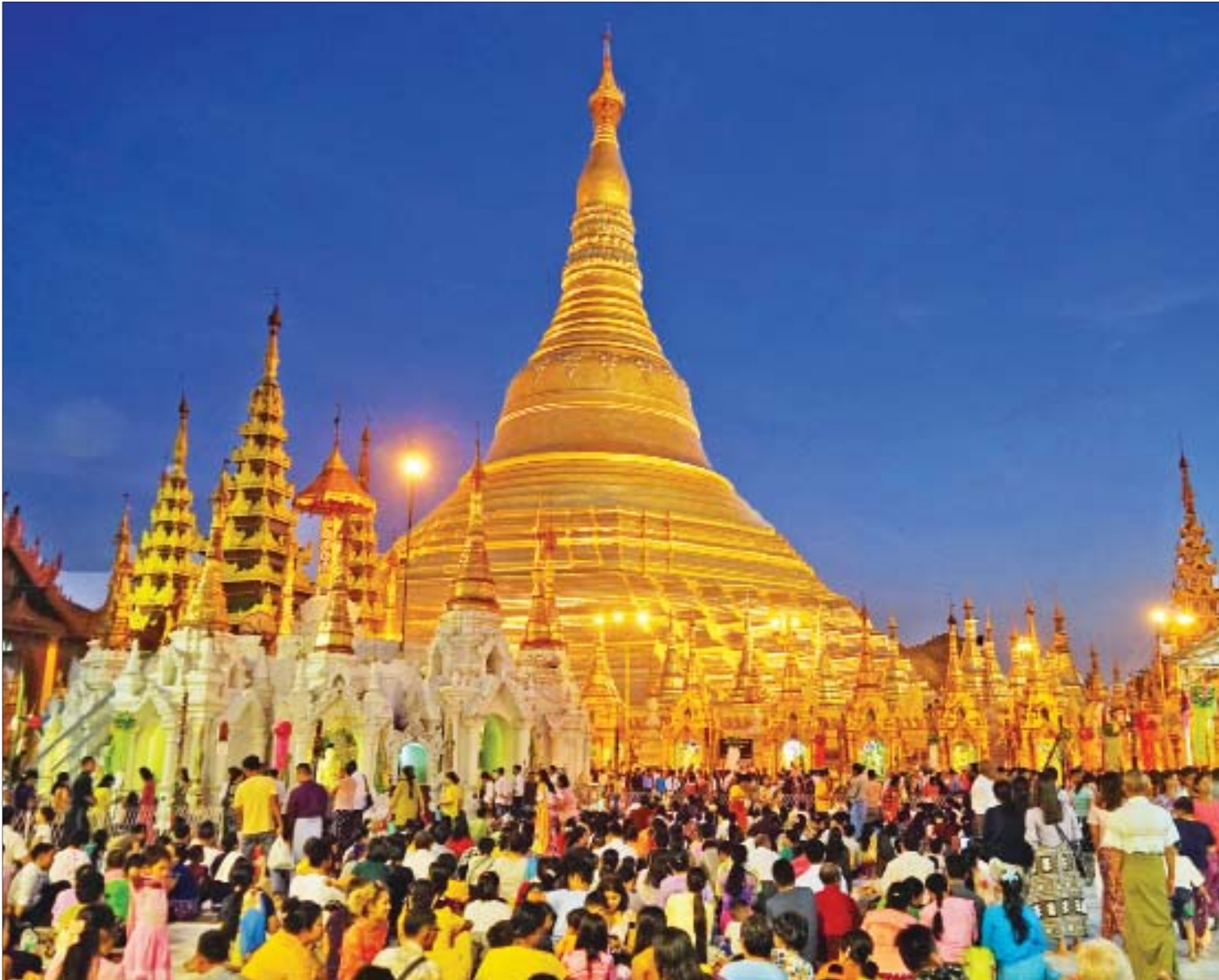
သီတင်းကျွတ်လပြည့်နေ့ည ရန်ကုန်မြို့ ရွှေတိဂုံစေတီတော်၌ ဘုရားဖူးလာပြည်သူများဖြင့် စည်ကားလျက်ရှိသည်ကို တွေ့ရစဉ်။