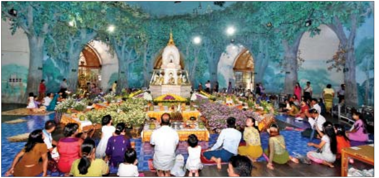
သီတင်းကျွတ်လပြည့်နေ့တွင် ရန်ကုန်မြို့၊ မဟာဝိဇယစေတီတော်၌ ဘုရားဖူးလာပြည်သူများဖြင့် စည်ကားလျက်ရှိသည်ကို တွေ့ရစဉ်။

သာဝတ္ထိပြည်၌ ရှိကြကုန်သော လူပရိသတ်အပေါင်းသည်လည်း သက်သာသို့ရောက်ရှိကာ မြတ်စွာဘုရားအား ဖူးမြော်ကြည့်ညို့ ကြိုဆိုကြ ကုန်သည်။ ဤပူဇော်ပွဲကို အစွဲပြု၍ မြန်မာ့ယဉ်ကျေးမှုရာသီပွဲတော်အဖြစ် သီတင်းကျွတ်လပြည့်နေ့တွင် မြတ်စွာဘုရားကို ရည်မှန်းကာ ဆီမီးများဖြင့်