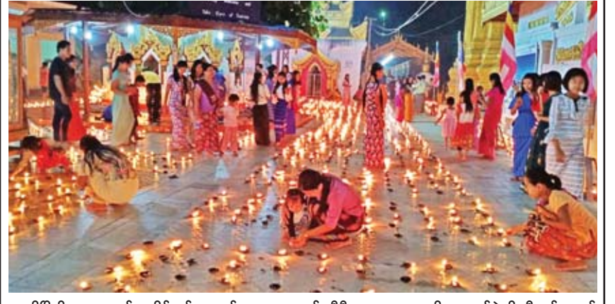
ရွှေဘိုမြို့ရှိ ရှေးဟောင်းသမိုင်းဝင် ရွှေတန်ဆာဘုရားတွင် ဆီမီး ၉၀၀၀ ဗုဒ္ဓပူဇော်ပွဲကို သီတင်းကျွတ် လဆန်း ၁၄ ရက်နှင့် သီတင်းကျွတ်လပြည့် နှစ်ရက်တိုင် ကျင်းပလျက်ရှိရာ သီတင်းကျွတ်လပြည့်နေ့က ဆီမီးပူဇော်ပွဲလာပြည်သူများဖြင့် စည်ကားနေသည်ကို တွေ့ရစဉ်။ မိုးသောက်(ရွှေဘို)