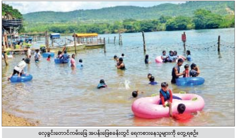
လှေခင်းတောင်ကမ်းခြေ အပန်းဖြေစခန်းတွင် ရေကစားနေသူများကို တွေ့ရစဉ်။

ကျွန်တော်က လှေခင်းတောင် ကမ်းခြေအပန်းဖြေစခန်း ရေလုပ်သား (လှေမောင်း)ပါ။ ဒီပိတ်ရက်တွေမှာ လာရောက်လည်ပတ်သူ နေ့တိုင်း ၇၀၀ ကနေ ၁၀၀၀ လောက်ထိရှိပါ တယ်။ ပေါင်းလောင်းဆိပ်ကမ်းသာ ဆိုင်လေးကတော့ တစ်နေ့ကုန် ဖွင့်ပါ