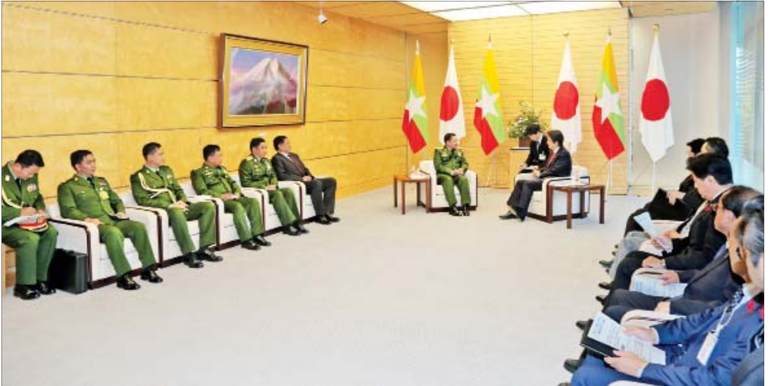
တပ်မတော်ကာကွယ်ရေးဦးစီးချုပ် ဗိုလ်ချုပ်မှူးကြီး မင်းအောင်လှိုင်နှင့် ဂျပန်နိုင်ငံဝန်ကြီးချုပ် မစ္စတာ ရှင်ဇိုအာဘေးတို့ တွေ့ဆုံဆွေးနွေးစဉ်။

နေပြည်တော် အောက်တိုဘာ ၁၀ ဂျပန် ကိုယ်ပိုင်ကာကွယ်ရေးတပ်ဖွဲ့ များ၏ ပူးတွဲစစ်ဦးစီးချုပ် General Koji Yamasaki ၏ ဖိတ်ကြားချက် အရ တပ်မတော်ကာကွယ်ရေးဦးစီးချုပ် ဗိုလ်ချုပ်မှူးကြီး မင်းအောင်လှိုင် ဦးဆောင်သော မြန်မာ့တပ်မတော် ချစ်ကြည်ရေး ကိုယ်စားလှယ်အဖွဲ့ သည် ဂျပန်နိုင်ငံသို့ ချစ်ကြည်ရေးခရီး သွားရောက်ရန် အောက်တိုဘာ ၈ ရက် နံနက်ပိုင်းက ရန်ကုန်အပြည်ပြည် ဆိုင်ရာလေဆိပ်မှ ထွက်ခွာကြပြီး ညပိုင်းတွင် ဂျပန်နိုင်ငံ Tokyo မြို့ရှိ Haneda လေဆိပ်သို့ ရောက်ရှိကြရာ ဂျပန်နိုင်ငံဆိုင်ရာ မြန်မာနိုင်ငံ သံအမတ်ကြီး ဦးမြင့်သူ၊ ဂျပန် ကာကွယ်ရေးဝန်ကြီးဌာနမှ Colonel Ishiwata၊ နီယူနီယော့ဒေဂျင်းဥက္ကဋ္ဌ Mr. Yohei Sasakawa၊ ဂျပန်-မြန်မာ ချစ်ကြည်ရေးအသင်းဥက္ကဋ္ဌ Mr. Hideo Watanabe၊ မြန်မာစစ်သံ (ကြည်း၊ ရေ၊ လေ) ဗိုလ်မှူးကြီး တင်စိုး နှင့် တာဝန်ရှိသူများက လေဆိပ်၌ ကြိုဆိုနှုတ်ဆက်ကြသည်။ စာမျက်နှာ ၄ ကော်လံ ၁ သို့ ◻