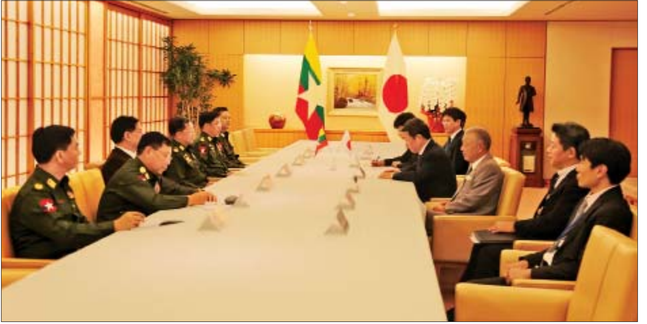
တပ်မတော်ကာကွယ်ရေးဦးစီးချုပ် ဗိုလ်ချုပ်မှူးကြီးမင်းအောင်လှိုင်နှင့် ဂျပန်နိုင်ငံ နိုင်ငံခြားရေးဝန်ကြီး Mr.Toshimitsu Motegi တို့ တွေ့ဆုံဆွေးနွေးစဉ်။

တွေ့ဆုံစဉ် တပ်မတော်နှစ်ရပ်အကြား ပူးပေါင်းဆောင်ရွက်မှုဖြင့်တင်ရေး