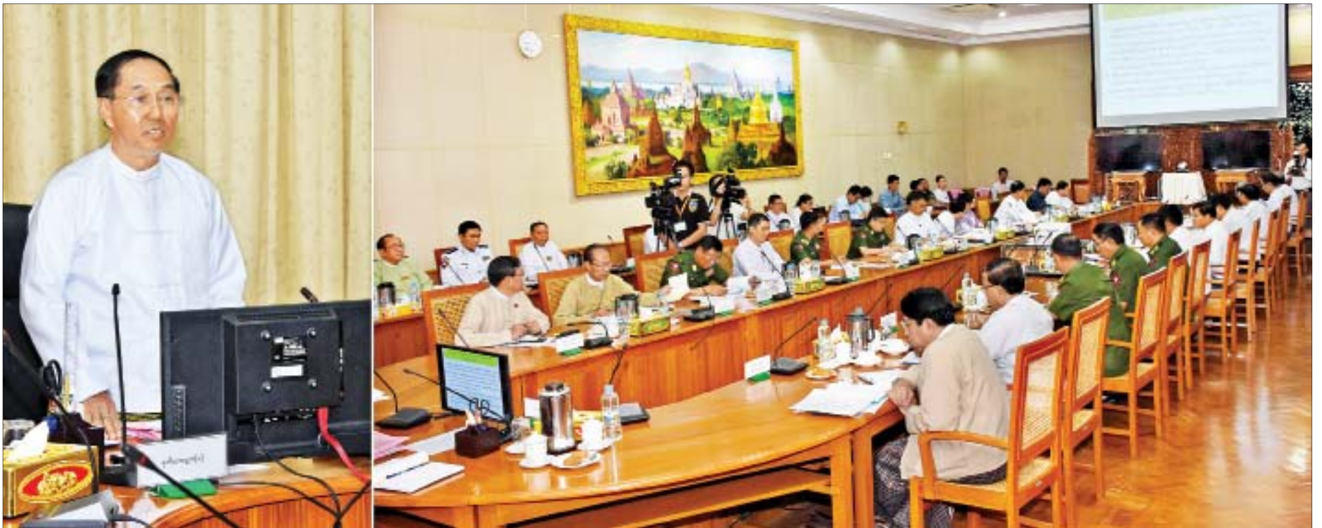
ဒုတိယသမ္မတ ဦးမြင့်ဆွေ ၂၀၂၀ ပြည့်နှစ် (၇၂)နှစ်မြောက် လွတ်လပ်ရေးနေ့ကျင်းပရေးဗဟိုကော်မတီ ပထမအကြိမ် ညှိနှိုင်းအစည်းအဝေးသို့ တက်ရောက်အမှာစကားပြောကြားစဉ်။

နေပြည်တော် အောက်တိုဘာ ၁၀ ၂၀၂၀ ပြည့်နှစ် (၇၂)နှစ်မြောက် လွတ်လပ်ရေးနေ့ကျင်းပရေးဗဟိုကော်မတီ၏ ပထမအကြိမ် ညှိနှိုင်းအစည်းအဝေးကို ယနေ့နံနက် ၉ နာရီခွဲတွင် နေပြည်တော်ရှိ ပြည်ထောင်စုအစိုးရအဖွဲ့ရုံး၊ အစည်းအဝေးခန်းမ၌ကျင်းပရာ (၇၂)နှစ်မြောက် လွတ်လပ်ရေးနေ့ကျင်းပရေး ဗဟိုကော်မတီဥက္ကဋ္ဌ ဒုတိယသမ္မတ ဦးမြင့်ဆွေ တက်ရောက်အမှာစကားပြောကြားသည်။