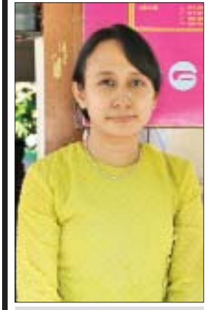
မဇွန်စိုးထူး