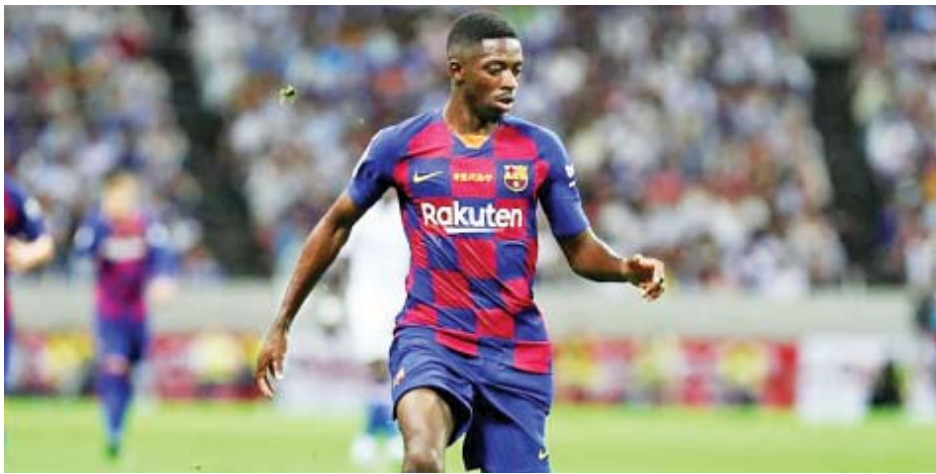
ပယ်ပြစ်ဒဏ်ကျခံထားရတာကြောင့် ဘာစီလိုနာအသင်းနဲ့ အီဘားအသင်းတို့ပွဲစဉ်မှာ လွဲချော်မှာဖြစ်ပါတယ်။ ပီကေးဟာ ဆီဗီလာအသင်းနဲ့ပွဲစဉ်မှာ ဒီရာသီရဲ့ ငါးကြိမ်မြောက် အပါကတ်ပြုသခံခဲ့ရတာကြောင့် တစ်ပွဲပယ် ပြစ်ဒဏ်

ချမှတ်ခဲ့တာ ဖြစ်ပါတယ်။ အဲဒီလို နှစ်ပွဲပယ် ပြစ်ဒဏ်ကျခံခဲ့ရတာကြောင့် တိုက်စစ်မှူး ဒမ်ဘီလီဟာ အောက်တိုဘာ ၁၉ ရက်မှာ ကစားမယ့် အီဘားအသင်းနဲ့ အဝေးကွင်းပွဲစဉ်နဲ့ အောက်တိုဘာ ၂၆ ရက်မှာ ကစားမယ့် ရိုးယဲလ်မက်ဒရစ်အသင်းနဲ့ အိမ်ကွင်းပွဲစဉ်တွေမှာ လွဲချော်ရတော့မှာ ဖြစ်ပါတယ်။ ရိုးယဲလ်မက်ဒရစ်အသင်းနဲ့ ဘာစီလိုနာအသင်းတို့ဟာ လာလီဂါရှစ်ပွဲကစားအပြီးမှာ ရိုးယဲလ်မက်ဒရစ်အသင်းက အမှတ်ပေးဇယားအဆင့်(၁)နဲ့ ဘာစီလိုနာအသင်းက အဆင့်(၂)နေရာတို့မှာ အသီးသီးရပ်တည်နေတာလည်း ဖြစ်ပါတယ်။ ရော်နယ်အာရောဂျီနဲ့ ဂျရက်ပီကေးတို့လည်း တစ်ပွဲ