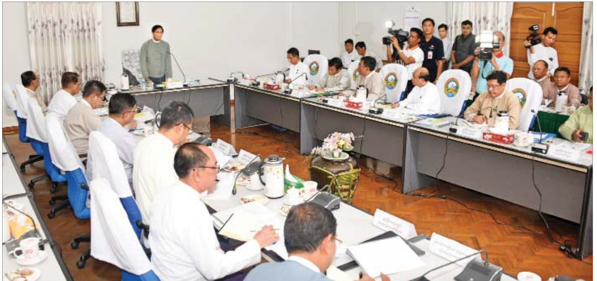
ဒုတိယသမ္မတ ဦးဟင်နရီဗန်ထီးယူ သကြားကဏ္ဍနှင့် ငါးကဏ္ဍဖွံ့ဖြိုးတိုးတက်ရေးလုပ်ငန်းညှိနှိုင်းအစည်းအဝေးတွင် အမှာစကားပြောကြားစဉ်။

နေပြည်တော် အောက်တိုဘာ ၉ သကြားကဏ္ဍနှင့် ငါးကဏ္ဍဖွံ့ဖြိုးတိုးတက်ရေး လုပ်ငန်းညှိနှိုင်းအစည်းအဝေးကို ယနေ့ မွန်းလွဲ ၁ နာရီတွင် နေပြည်တော်ရှိ စိုက်ပျိုးရေး၊ မွေးမြူရေးနှင့် ဆည်မြောင်းဝန်ကြီးဌာန၌ ကျင်းပရာ တောင်သူလယ်သမားအခွင့်အရေး ကာကွယ်ရေးနှင့် အကျိုးစီးပွားမြှင့်တင်ရေးဦးဆောင်အဖွဲ့ အဖွဲ့ခေါင်းဆောင် ဒုတိယသမ္မတ ဦးဟင်နရီဗန်ထီးယူ တက်ရောက်အမှာစကားပြောကြားသည်။ အစည်းအဝေးသို့ ပြည်ထောင်စုဝန်ကြီးများဖြစ်ကြသည့် ဒေါက်တာ