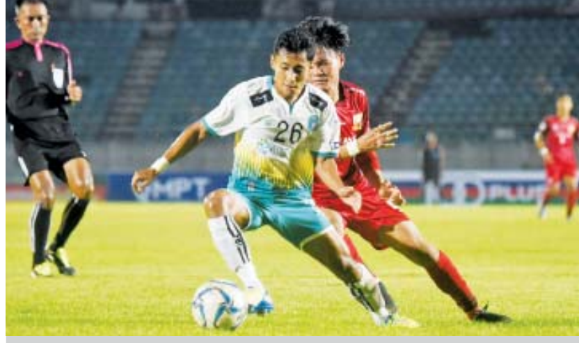
ရှုံးထွက်ဗိုလ်လုပွဲတွင် ရန်ကုန်အသင်းနှင့် ရှမ်းအသင်း တွေ့ဆုံခဲ့စဉ်။

ယင်းနှစ်သင်းသည်ချာရတီဖလားပြိုင်ပွဲတွင် လေးကြိမ်မြောက် တွေ့ဆုံခြင်းဖြစ်ပြီး ရှမ်းအသင်း က နှစ်ကြိမ် အနိုင်ရပြီး ရန်ကုန်အသင်းက တစ်ကြိမ် အနိုင်ရခဲ့သည်။ နောက်ဆုံးသုံးကြိမ်ဆက် တွေ့ဆုံ ခြင်းဖြစ်ပြီး ပြီးခဲ့သည့် နှစ်ကြိမ်စလုံး ပယ်နယ်တီ အဆုံးအဖြတ်ဖြင့် တစ်ကြိမ်စီ အနိုင်ရထားသည်။ နှစ်သင်းစလုံး လာမည့်ရာသီတွင် အာရှအဆင့်