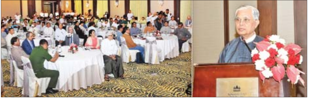
မေတ္တာရပ်ခံကြောင်း ပြောကြားသည်။

ယခုအခါ ပြည်ထောင်စုဝန်ကြီးဌာန ၁၇ ခုနှင့် ပြည်ထောင်စုအဆင့် အဖွဲ့ အစည်း ၄၆ ခုတွင် CPU အဖွဲ့ ၃၇ ခု ဖွဲ့စည်းပြီးဖြစ်သည့်အပြင် ယင်း CPU များ အတွက် ရည်မှန်းချက်တာဝန် သုံးရပ်၊ လုပ်ငန်းစဉ် ခြောက်ချက်တို့ကိုလည်း ချမှတ်ထားပြီးဖြစ်ကြောင်း၊ ယနေ့မှစတင်၍ အရေးကြီးသောပြည်ထောင်စု ဝန်ကြီးဌာန ၁၀ ခုသည် CPU Toolkit များကို မြို့နယ်တစ်ချို့တွင် စတင်စမ်းသပ် ဆောင်ရွက်သွားမည်ဖြစ်ကြောင်း၊ ကျန်ပြည်ထောင်စုဝန်ကြီးဌာနများသည် လည်း မကြာမီစတင်စမ်းသပ်ဆောင်ရွက်ရန် ကြိုးပမ်းလျက်ရှိကြောင်း၊ အကတ် လိုက်စားမှုတိုက်ဖျက်ရေးလုပ်ငန်းစဉ်တွင် "တားဆီးကာကွယ်ခြင်း" သည် တရားစွဲဆိုအရေးယူဆောင်ရွက်ခြင်းထက် များစွာပိုမိုထိရောက်မှုရှိကြောင်း၊ နိုင်ငံ့ဝန်ထမ်းအား ပြစ်မှုမဖြစ်ပွားမီ ကြိုတင်တားဆီးကာကွယ်နိုင်ခြင်းဖြင့် သက်ဆိုင်သူတစ်ဦးချင်းစီအတွက်သာမက နိုင်ငံတော်အတွက်ပါ ထိခိုက်နစ်နာမှု ကို နည်းပါးသက်သာစေပါကြောင်း၊ ထို့ကြောင့် CPU များ အလုပ်လုပ်နိုင်ရန် တာဝန်ရှိသူများက မိသားစုစိတ်ဓာတ်ဖြင့် ကူညီပေးကြရန် အလေးအနက်