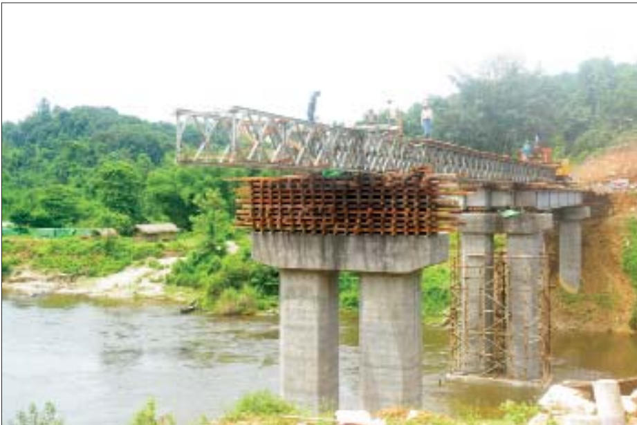
မချမ်းဘော့မြို့နယ်အတွင်းတည်ဆောက်ဆဲ ထီးခတံတား။

ကျွန်တော်တို့ သတင်းရိုက်ကူးရေးအဖွဲ့သည် ထန်ဂါး