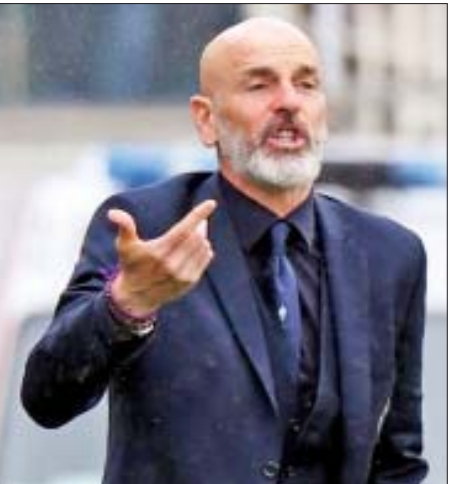
နည်းပြ မော်ရင်ဟိုဟာ အခုနှစ်ဘောလုံးရာသီ မစတင်မီက အသင်းဟောင်း ရီးယဲလ်မက်ဒရစ်အသင်း နည်းပြအဖြစ် တာဝန်ယူလိုတယ်လို့ ဆိုပါတယ်။ ဒါပေမယ့် လက်ရှိအချိန်အထိတော့ ဘယ်အသင်းကမှ ခေါ်ယူလိုကြောင်း ပွင့်ပွင့်လင်းလင်း မပြောကြားသေးတာ ဖြစ်ပါတယ်။ ရီးယဲလ်မက်ဒရစ်ကလည်း လက်ရှိနည်းပြ ဇီဒီနိုလက်ထက်မှာ လာလီဂါမှာ ရလဒ်ပိုင်းတွေ ပြန်လည်ကောင်းမွန်နေပြီ ဖြစ်ပါတယ်။

ဝင်ရောက်ယှဉ်ပြိုင်ခွင့်ရရှိထားခဲ့ပေမယ့် ဥရောပဘောလုံးစည်းမျဉ်းတွေကို မလိုက်နာတဲ့အတွက် ဥရောပကစားခွင့် တစ်နှစ်ပိတ်ပင်ခံထားရတာ ဖြစ်ပါတယ်။ နည်းပြဂီအမ်ပါအိုလိုဟာ ပြီးခဲ့တဲ့ဘောလုံးရာသီက ဆမ်းဒိုးရီးယားအသင်းကို အီတလီစီးရီးအေ အဆင့် (၉) နေရာကို ရပ်တည်နိုင်အောင်စွမ်းဆောင်ပေးခဲ့ပြီး ဆမ်းဒိုးရီးယားအသင်းကနေ ထွက်ခွာကာ အေစီမီလန်အသင်း နည်းပြအဖြစ် ပြောင်းရွှေ့တာဝန်ယူခဲ့တာ ဖြစ်ပါတယ်။ လက်ရှိမှာတော့ အေစီမီလန်အသင်းက ဂီအမ်ပါအိုလိုကို ထုတ်ပယ်လိုက်ပြီး အင်တာမီလန်အသင်းနည်းပြဟောင်း စတီဖာနိုပီအိုလိုဟာ အေစီမီလန်အသင်းနည်းပြအဖြစ် ခန့်အပ်လိုက်တာ ဖြစ်ပါတယ်။