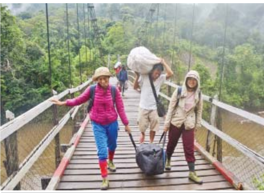
မဂ္ဂဇေကြီးတံတားပေါ်မှ အထုပ်ကိုယ်စီနှင့် ဆရာ ဆရာမများ ထွက်ခွာလာကြစဉ်။

"ကျွန်တော်တို့ခရိုင်အတွင်းမှာတော့ မြို့နယ် ၀းခန့် မြို့ တစ်မြို့တို့ပါဝင်ဖွဲ့စည်းထားပါတယ်။ မြို့နယ်တွေက