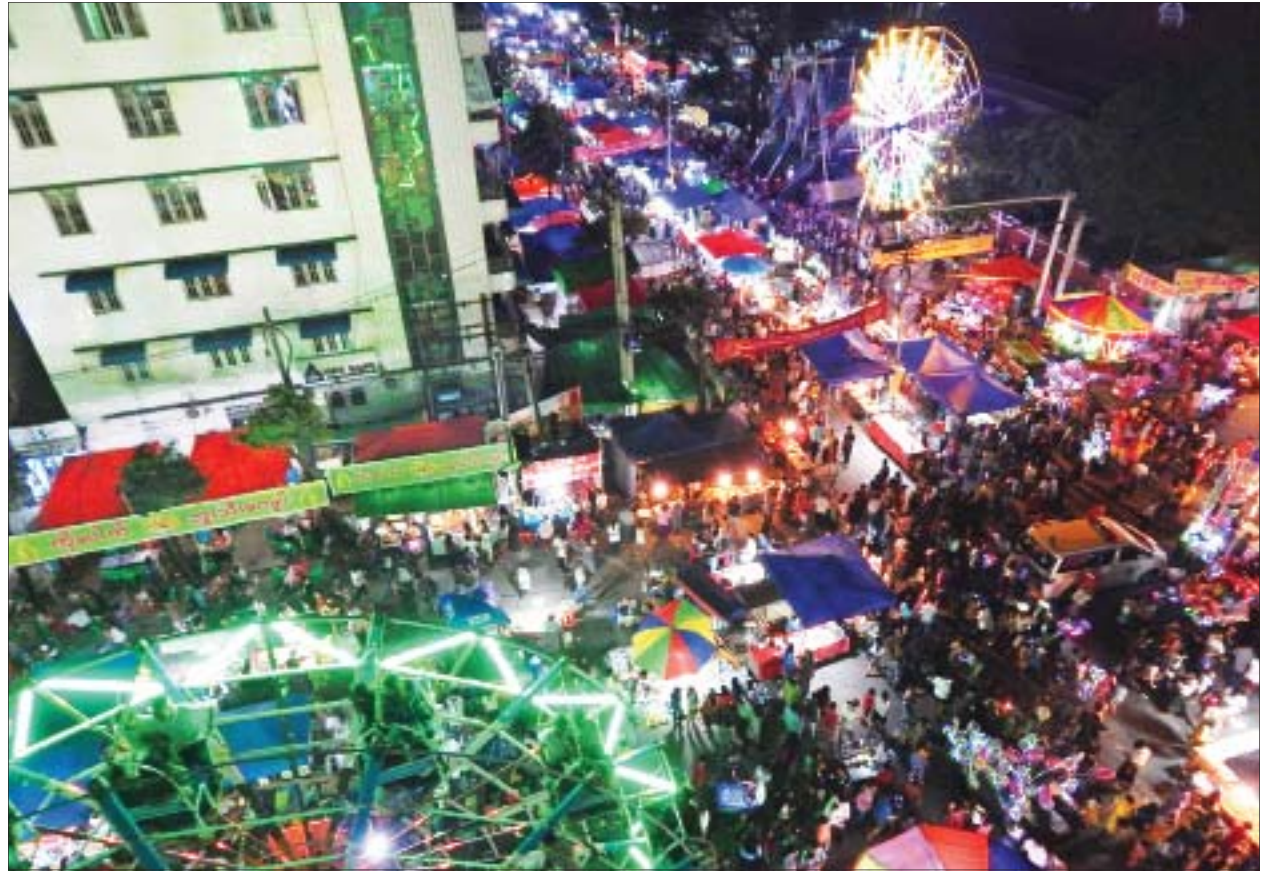
ယခင်နှစ်က ကျင်းပခဲ့သည့် ရေကျော်သီတင်းကျွတ်မီးထွန်းပွဲတော်ကို တွေ့ရစဉ်။

ယခုနှစ် ရေကျော်သီတင်းကျွတ်မီးထွန်းပွဲတော်ကို သိမ်ဖြူမီးပွိုင့်မှ စတင်ကာ ဗိုလ်တထောင်ဘုရားလမ်းထိပ်အထိ ဗိုလ်ချုပ်လမ်းမကြီးတစ်လျှောက် ရေကျော်လမ်းမှ အထက်ပုဇွန်တောင်လမ်းအထိ ပျော်ပွဲရွှင်ပွဲများ၊ ကလေးကစားစရာမျိုးစုံ၊ မြန်မာမုန့်မျိုးစုံနှင့် စာမျက်နှာ ၂၀ ကော်လံ ၁ သို့