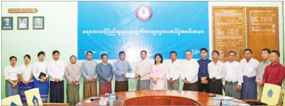
ဆယ်ရေးနှင့် ပြန်လည်နေရာချထားရေးဝန်ကြီးဌာန အစည်းအဝေးခန်းမ၌ ပေးအပ်လှူဒါန်းရာ ဒုတိယဝန်ကြီး ဦးစိုးအောင်က လှူဒါန်းငွေများကို လက်ခံရယူပြီး ဂုဏ်ပြုမှတ်တမ်းလွှာ ပြန်လည်ပေးအပ်ခဲ့သည်။ သတင်းစဉ်

နေပြည်တော် အောက်တိုဘာ ၉ မြန်မာနိုင်ငံတွင် ဖြစ်ပွားခဲ့သော ရေကြီးရေလျှံမှုများနှင့် မြေပြိုမှုများကြောင့် ဘေးသင့်ဒေသများအတွက် လူသားချင်း စာနာထောက်ထားမှုနှင့် ပြန်လည်ထူထောင်ရေးလုပ်ငန်းများ ဆောင်ရွက်ပေးနိုင်ရန် အလှူရှင်များက အလှူငွေနှင့် ပစ္စည်းများ လှူဒါန်းလျက်ရှိသည်။ ထိုသို့ လှူဒါန်းလျက်ရှိရာတွင် မြန်မာနိုင်ငံလုံးဆိုင်ရာ ကျောက်မီးသွေးလုပ်ငန်းရှင်များအသင်းက ငွေကျပ် ၅၉ သိန်းကို ယနေ့ မွန်လုံပိုင်းတွင် နေပြည်တော်ရှိ လူမှုဝန်ထမ်း၊ ကယ်