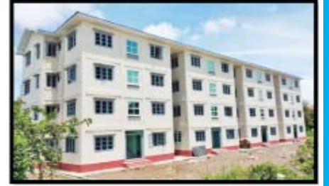
စစ်တွေဆေးရုံကြီးတိုးချဲ့ (၄)ထပ် ဝန်ထမ်းအိမ်ရာ တည်ဆောက်ပြီးစီးမှု

စစ်တွေအထွေထွေရောဂါကုဆေးရုံကြီး တိုးချဲ့ဆောက်လုပ်ခြင်းအနေဖြင့် (၄)ထပ် တိုးချဲ့လူနာဆောင်သစ် ဆောက်လုပ်ခြင်း၊ (၈)ခန်းတွဲ (၄)ထပ် ဝန်ထမ်းအိမ်ရာ ဆောက်လုပ်ခြင်းလုပ်ငန်းမှာ (၉၉%) ပြီးစီးပြီဖြစ်ပြီး၊ ပြည်နယ် ကုသရေးဦးစီးဌာနမှ (၂)ထပ်ဆောင်သစ်ဆောက်လုပ်ခြင်းလုပ်ငန်းမှာ (၁၀၀%) ပြီးစီးပြီ ဖြစ်ပါသည်။