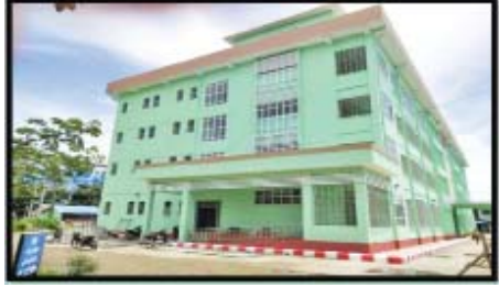
စစ်တွေအထွေထွေရောဂါကုဆေးရုံကြီးတိုးချဲ့ (၄)ထပ်ဆောင်တည်ဆောက်ပြီးစီးမှု