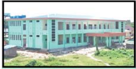
ကျောက်ဖြူပြည်သူ့ဆေးရုံ တိုးချဲ့(၂)ထပ်ဆောင် တည်ဆောက်ပြီးစီးမှု