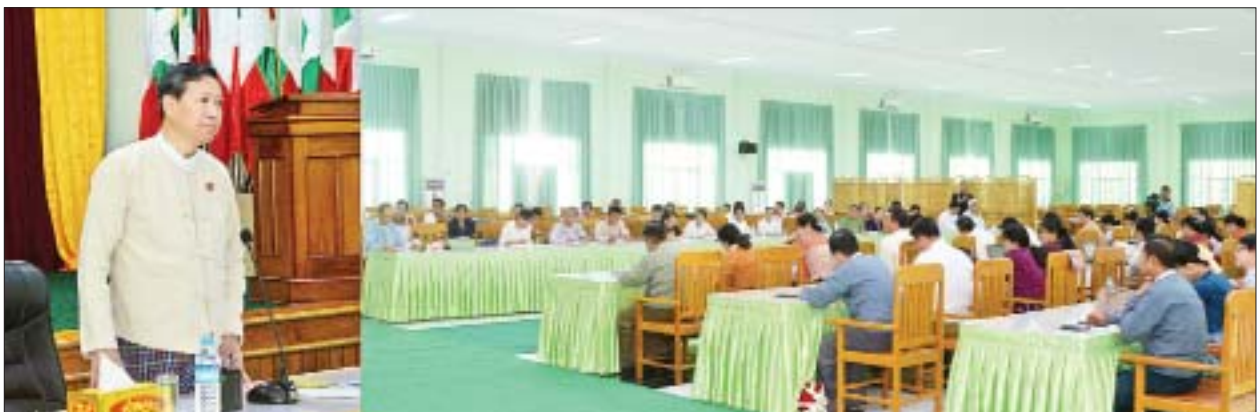
သတိပြုစေလိုပါကြောင်း။

ရှေးဦးစွာ ပညာရေးဝန်ကြီးဌာန ပြည်ထောင်စုဝန်ကြီး ဒေါက်တာမျိုးသိမ်းကြီး က ရာထူးတိုး/ပြောင်း စသည်များ ဆောင်ရွက်ရာတွင် ဘက်မလိုက်ဘဲ တရားမျှတမှု ရှိအောင် ဆောင်ရွက်ကြရမည်ဖြစ်ကြောင်း၊ စီမံခန့်ခွဲရေးအရည်အချင်း ကောင်းမွန်သူ၊ ပူးပေါင်းဆောင်ရွက်မှု အားကောင်းသူ၊ တက္ကသိုလ်ဖွံ့ဖြိုးတိုးတက် ရေး နိုင်ငံဖွံ့ဖြိုးတိုးတက်ရေးအတွက် ဆောင်ရွက်နိုင်စွမ်းရှိသူ၊ ကျောင်းသား၊ ဆရာများ၏ အရေးကိစ္စများ ပူးပေါင်းဖြေရှင်းဆောင်ရွက်နိုင်စွမ်းရှိသူ ဆရာ ဆရာမများကို အားပေးဆောင်ရွက်စေလိုပါကြောင်း၊ တက္ကသိုလ်အသီးသီးတွင် သုတေသနနှင့် သင်ယူတတ်မြောက်မှု ကောင်းမွန်ရေးဘက်တွင်သာမက စီမံခန့်ခွဲ ရေးဆိုင်ရာ၊ ဘဏ္ဍာရေးဆိုင်ရာ ဆောင်ရွက်မှုလုပ်ငန်းများတွင်လည်း ပူးပေါင်း ဆောင်ရွက်တတ်သူများဖြစ်အောင် လေ့ကျင့်ပေးကြရန် လိုအပ်ပါကြောင်း၊ တက္ကသိုလ်များအနေဖြင့် ကျောင်းသား ကျောင်းသူများအား လုပ်ငန်းခွင်အတွက် အဆင်သင့်ဖြစ်စေမည့် ကျွမ်းကျင်မှုများရှိအောင် ပြုစုပျိုးထောင်ပေး ထုတ်ပေး ကြရမည်ဖြစ်ပါကြောင်း၊ မိမိတို့တက္ကသိုလ် ဖွံ့ဖြိုးတိုးတက်ရေးလုပ်ငန်းများ ဆောင်ရွက်ရာတွင် ဂုဏ်သိက္ခာ၊ လုပ်ထုံးလုပ်နည်းများနှင့်အညီ ဆောင်ရွက်ကြရန် လိုပါကြောင်း၊ ဘဏ္ဍာငွေကြေးဆိုင်ရာလုပ်ငန်းများကိုလည်း အကျိုးရှိ ထိရောက် စွာ ဘဏ္ဍာရေးစည်းမျဉ်းစည်းကမ်းများ၊ စာရင်းစစ်စည်းမျဉ်းစည်းကမ်းများ နှင့်အညီ ဆောင်ရွက်ရန်လိုပါကြောင်း၊ ပညာရေးတွင် လိုအပ်ချက်များ၊ အခက် အခဲများ၊ မပြည့်စုံမှုများရှိနေသဖြင့် ဖြစ်ချင်သည်နှင့် လုပ်ချင်သည်ကို လုပ်ထုံး လုပ်နည်းနှင့်မကိုက်ညီဘဲ လုပ်ဆောင်မိပါက အခက်အခဲကြုံရတတ်သည်ကို