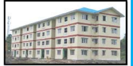
ကျောက်ဖြူပြည်သူ့ဆေးရုံ (၈)ခန်းတွဲ (၄)ထပ် ဝန်ထမ်းအိမ်ရာ တည်ဆောက်ပြီးစီးမှု

ကျောက်ဖြူပြည်သူ့ဆေးရုံ တိုးချဲ့(၂)ထပ် လူနာဆောင်သစ်ဆောက်လုပ်ခြင်းလုပ်ငန်းမှာ (၉၆%) ပြီးစီးပြီဖြစ်ပြီး၊ (၈)ခန်းတွဲ (၄)ထပ် ဝန်ထမ်းအိမ်ရာ ဆောက်လုပ်ခြင်းလုပ်ငန်းမှာ (၉၈%) ပြီးစီးပြီဖြစ်ပါသည်။