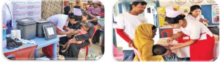
ရခိုင်ပြည်နယ်အတွင်း ကာကွယ်ဆေးထိုးလုပ်ငန်းများ ဆောင်ရွက်ပေးမှု