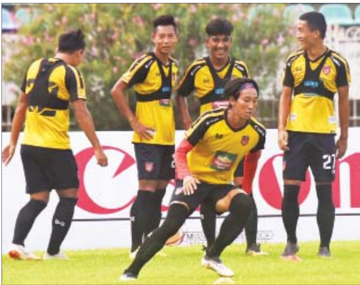
ဆီးဂိမ်းပြိုင်ပွဲယှဉ်ပြိုင်မည့် မြန်မာ ယူ-၂၂ အသင်း လေ့ကျင့်နေစဉ်။