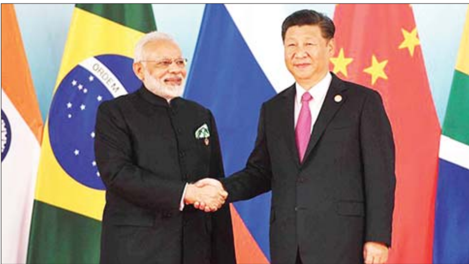
တရုတ်သမ္မတ ရှီကျင့်ဖျင်နှင့် အိန္ဒိယဝန်ကြီးချုပ် နာရန်ဒရာမိုဒီတို့ ၂၀၁၇ ခုနှစ်က BRICS အစည်းအဝေးမကျင်းပမီ တွေ့ဆုံစဉ်။

အိန္ဒိယနိုင်ငံ အရှေ့မြောက်ဘက်ပြည်နယ်နှင့် ဆက်သွယ်ထားသည့် ဆီလီဂူရီစက်လမ်းအနီး၌ ကားလမ်း