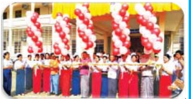
(ဆက်လက်ဖော်ပြပါမည်)

တောင်ကုတ်မြို့ ခုတင် (၅၀) ပြည်သူ့ဆေးရုံကို (၉-၆-၂၀၁၉) ရက်နေ့တွင် ခုတင် (၁၀၀) ပြည်သူ့ ဆေးရုံအဖြစ် အဆင့်တိုးမြှင့် ဖွင့်လှစ်ခဲ့ပါသည်။