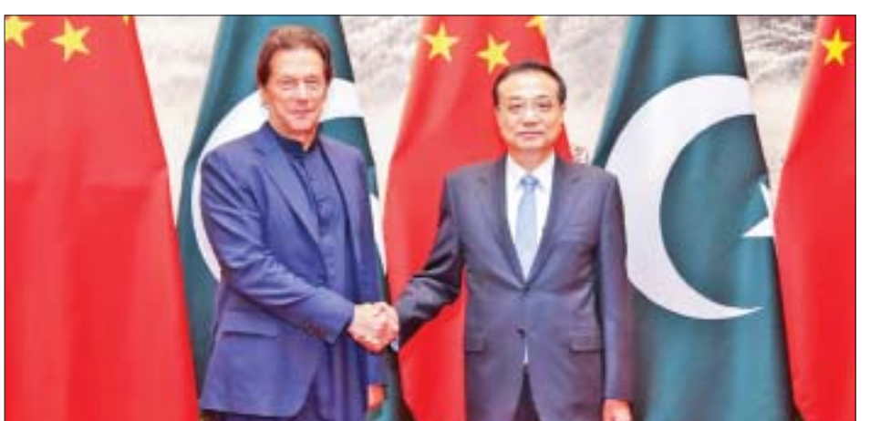
နယ်ပယ်များ၌ ပူးပေါင်းဆောင်ရွက်မှု တိုးမြှင့်ရေးအတွက် တရုတ်နိုင်ငံနှင့် အတူတကွ လုပ်ကိုင်ဆောင်ရွက်ရန် ဆန္ဒရှိကြောင်း ထည့်သွင်းပြောကြားသည်။