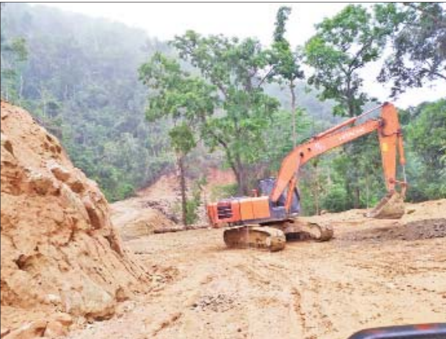
မဂ္ဂဇ-ခေါင်လန်ဖူးလမ်း ဖောက်လုပ်နေမှုမြင်ကွင်း။

ထိုတောင်ကို မည်သို့မည်ပုံ ကျော်ဖြတ်ကြမလဲ။ စိတ်ဝင်စားစရာ ကောင်းနေသည်။ ကြောက်မက်ဖွယ်ရာ အလွန်ကောင်းသည်။ ကံမကောင်းလျှင် အသက်ပါပျောက် သွားနိုင်သည်။ မကြာသေးမီက ထိုတောင်၌ မြေပြိုကျမှု ကြောင့် လူနှစ်ယောက် ပျောက်ကွယ်သွားခဲ့သည်။ ယနေ့ တိုင် အလောင်းတစ်လောင်းသာ တွေ့သေးသည်။ အခက် အခဲများစွာ ရှိနေသည်။ ထိုတောင်တက်ခရီးသည် အလွန် ကြမ်းတမ်းလှ၏။ အားလုံးကစဉ်းစားတွေးတောရင်း ရင်မောကြရသည်။ ။