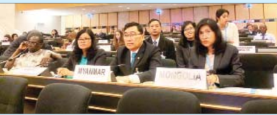
ပြန်လည်သင့်မြတ်ရေးနှင့် ငြိမ်းချမ်းရေးသည် အစိုးရ၏ အဓိကဦးစားပေးလုပ်ငန်းစဉ်ဖြစ်ပြီး လက်နက်ကိုင်ပဋိပက္ခ များ အဆုံးသတ်နိုင်ပါက ပြည်တွင်းနှင့် နိုင်ငံပြင်ကျော် နေရပ်စွန့်ခွာမှုများကိုလည်း ဖြေရှင်းနိုင်မည်ဟု ယုံကြည်ပါ ကြောင်း။

နေပြည်တော် အောက်တိုဘာ ၉ အကြိမ်(၇၀)မြောက် ကုလသမဂ္ဂဒုက္ခသည်များဆိုင်ရာ မဟာမင်းကြီးရုံး(UNHCR)၏ အမှုဆောင်ကော်မတီအစည်း အဝေး ဖွင့်ပွဲအခမ်းအနားကို ဆွစ်ဇာလန်နိုင်ငံ ဂျီနီဗာမြို့ရှိ ကုလသမဂ္ဂအဆောက်အအုံ Assembly Hall ၌ အောက်တိုဘာ ၇ ရက် နံနက် ၁၀ နာရီတွင် ကျင်းပခဲ့ရာ လူမှုဝန်ထမ်း၊ ကယ်ဆယ်ရေးနှင့် ပြန်လည်နေရာချထားရေးဝန်ကြီးဌာန ပြည်ထောင်စုဝန်ကြီး ဒေါက်တာဝင်းမြတ်အေး ဦးဆောင် သော မြန်မာကိုယ်စားလှယ်အဖွဲ့ ပါဝင်တက်ရောက်ခဲ့သည်။