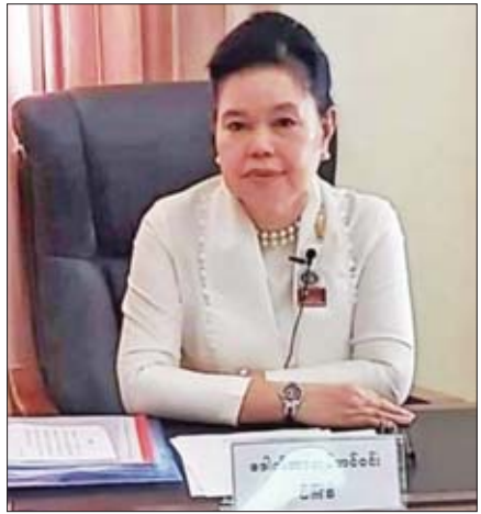
ဒေါက်တာတင်တင်ဝင်း အမျိုးသားလွှတ်တော်ကိုယ်စားလှယ်

အမျိုးသားလွှတ်တော်ကိုယ်စားလှယ် ဒေါက်တာတင်တင်ဝင်း