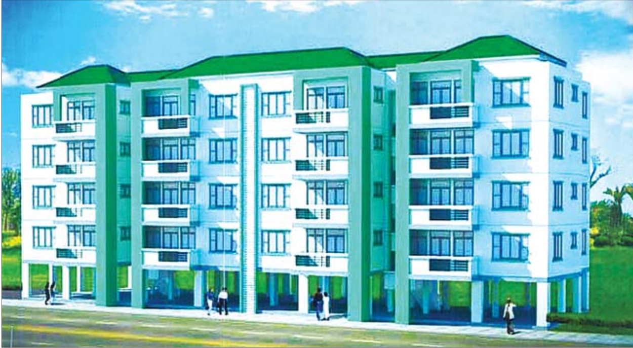
လှိုင်သာယာမြို့နယ် ကျန်စစ်မင်းအိမ်ရာရှိ တိုက်ခန်းနမူနာပုံစံငယ်များကို တွေ့ရစဉ်။

ရန်ကုန် အောက်တိုဘာ ၈ လှိုင်သာယာမြို့နယ်သည် ယခင်က လယ်မြေများ၊ ကျေးရွာများသာဖြစ်သည်။ မြို့သစ်စီမံကိန်းအတွက် ၁၉၈၉ ခုနှစ်တွင် ထန်းတပင်မြို့နယ်အတွင်းမှ ရွှေလင်ပန်း၊ အင်းဂလိုင်သောင်ကြီး(မြောက်)၊ သောင်ကြီး(တောင်)၊ ရေညွှတ်၊ ညောင်ရွာ၊ အတွင်းပဒါ၊ အပြင်ပဒါကွင်းများမှ စုစည်းပေးလှူဒါန်းခဲ့ပြီး ၂၀၁၂ ခုနှစ်တွင် နိုင်ငံတော်က လယ်မြေအား မြို့မြေအဖြစ်သို့ အသုံးပြောင်းလဲကြောင်း လက်မှတ်ထုတ်ပေးခဲ့သည်။