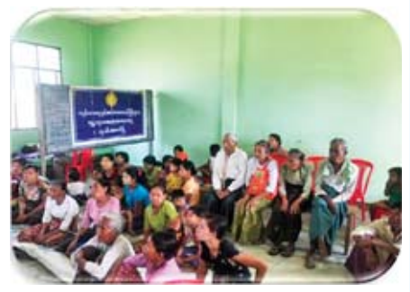
ရွှေလျားဆေးကုသရေးအဖွဲ့မှ ဘူးသီးတောင်မြို့တွင် ကျန်းမာရေးစောင့်ရှောက်ပေးမှု