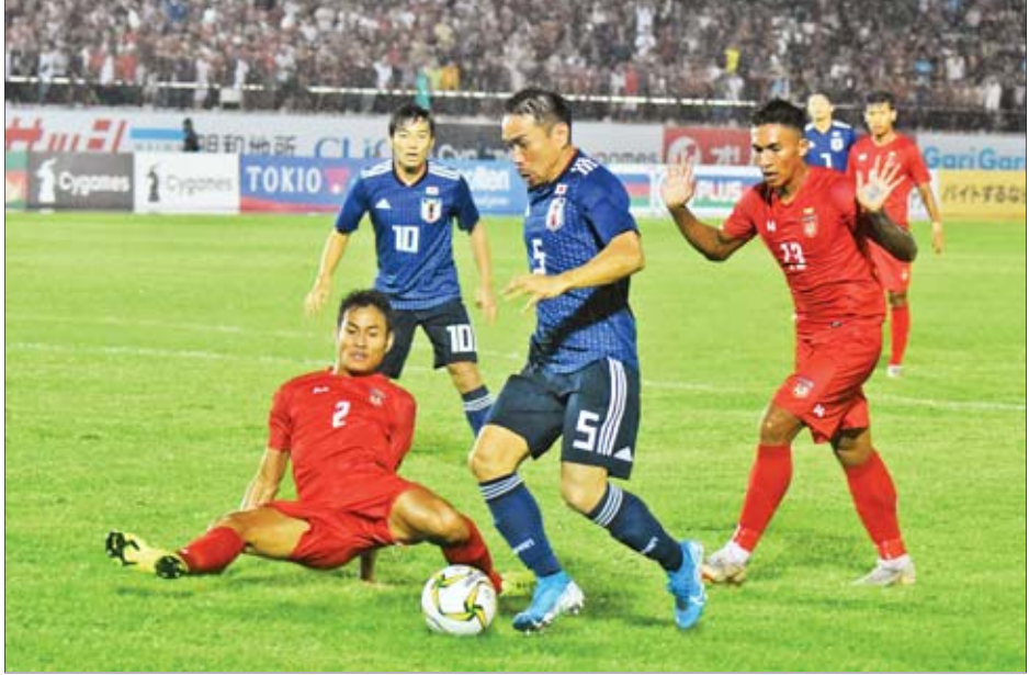
၂၀၂၂ ကမ္ဘာ့ဖလားခြေစစ်ပွဲတွင် မြန်မာနှင့် ဂျပန်အသင်း ယှဉ်ပြိုင်နေစဉ်။