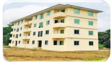
တောင်ကုတ်ဒီဂရီကောလိပ် (၄)ခန်းတွဲ (၄)ထပ် ဆရာ၊ ဆရာမများဆောင် တည်ဆောက်ပြီးစီးမှု