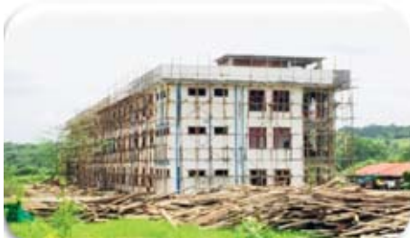
တောင်ကုတ်ဒီဂရီကောလိပ် (၃)ထပ်စာသင်ဆောင် တည်ဆောက်ပြီးစီးမှု

(၃)ထပ်စာသင်ဆောင် ဆောက်လုပ်ခြင်းလုပ်ငန်း (၉၁ %) (၄)ခန်းတွဲ (၄)ထပ် ဆရာ/ဆရာမ နေအိမ် ဆောက်လုပ်ခြင်းလုပ်ငန်း (၉၈ %) (၇)ခန်းတွဲ စားသောက်ဆိုင် ဆောက်လုပ်ခြင်းလုပ်ငန်း (၉၉%) မိုးလုံလေလုံအားကစားရုံ ဆောက်လုပ်ခြင်းလုပ်ငန်း (၁၀၀%) ပြီးစီးပြီ ဖြစ်ပါသည်။