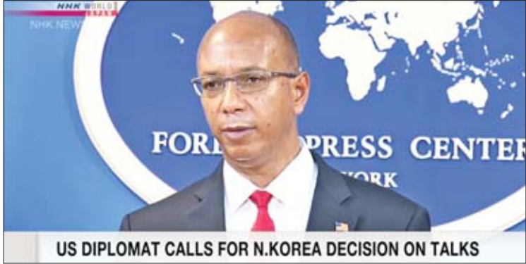
US DIPLOMAT CALLS FOR N.KOREA DECISION ON TALKS