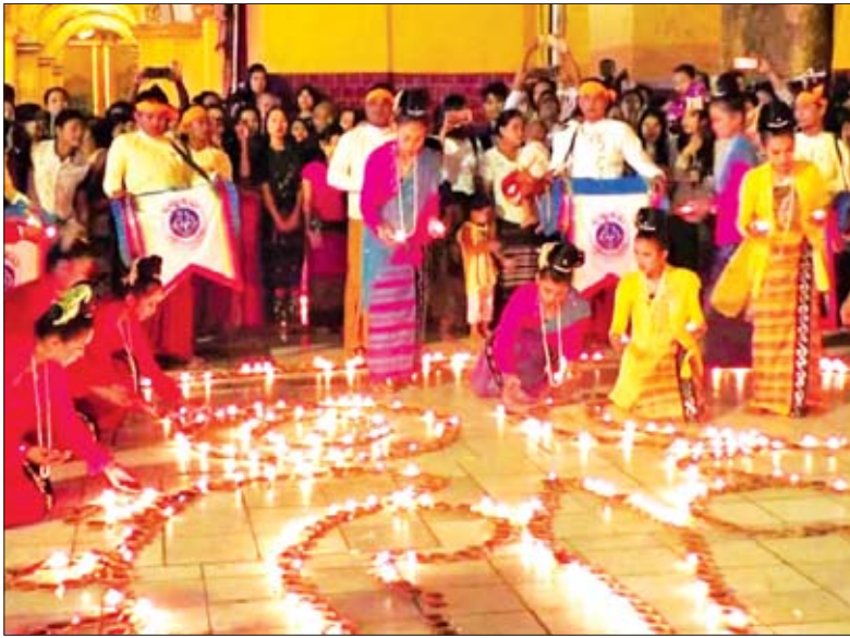
ယမန်နှစ် သီတင်းကျွတ်ပွဲတော်ကာလတွင် ရခိုင်တိုင်းရင်းသားလူငယ်များအဖွဲ့ မဟာမုနိဘုရားတွင် ဆီမီးကပ်လှူပွဲစဉ်။

မန္တလေး အောက်တိုဘာ ၈ သီတင်းကျွတ်ပွဲတော်ကာလအတွင်း မဟာမုနိဘုရားရင်ပြင်တော်ပေါ်တွင် အလှူရှင်များ၏ စုပေါင်းလှူဒါန်းမှုများဖြင့် ဆီမီးကပ်လှူပွဲကို ညစဉ် ၆ နာရီမှ ၈ နာရီအထိ ကျင်းပသွားမည်ဖြစ်ကြောင်း မဟာမုနိဘုရားဂေါပကအဖွဲ့မှ သိရသည်။