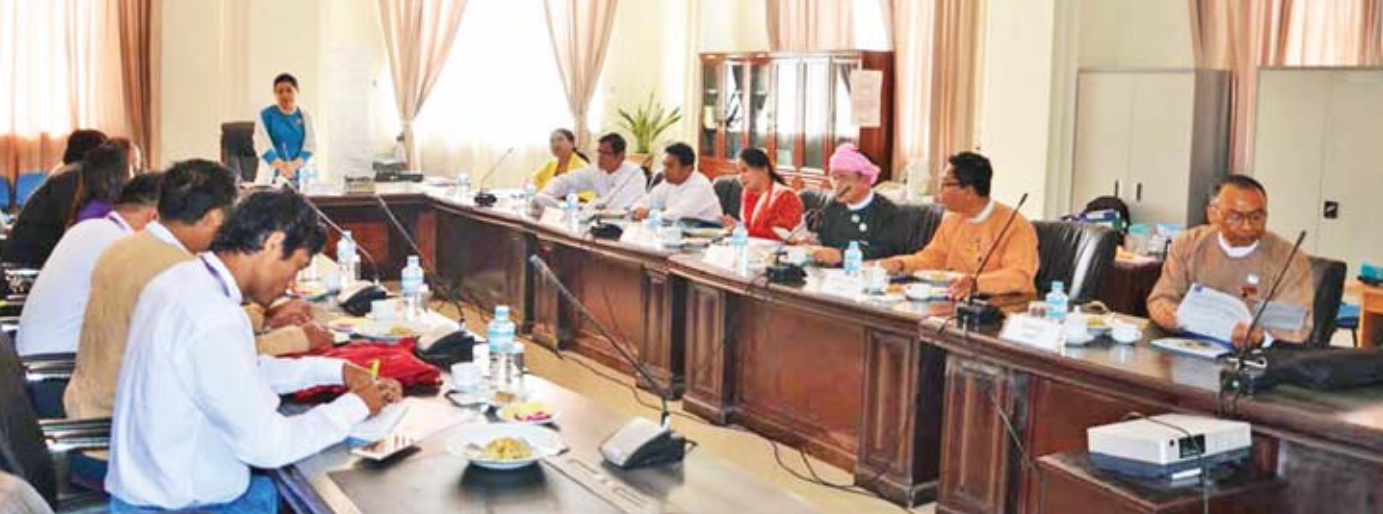
၃၀-၁-၂၀၁၉ ရက် ပြန်လည်ကုစားပေးလျော်မှုအလုပ်အဖွဲ့မှ တာဝန်ရှိသူများနှင့် တွေ့ဆုံဆွေးနွေးကြစဉ်။

ပထမဦးဆုံး ကျွန်ုပ်တို့မှာ ကိုယ့် မဲဆန္ဒနယ်က ပြည်သူတွေကို ကိုယ်စားပြုရတယ်။ မဲဆန္ဒနယ် ကိုသွားတယ်။ အားလုံးရဲ့ အရေး ကိစ္စတွေကို နားထောင်တယ်။ အထူးသဖြင့် အမျိုးသမီးနဲ့ ကလေးသူငယ်တွေရဲ့အရေးကိစ္စ တွေကိုနားထောင်တယ်။ သူတို့ရဲ့ အသံကို လွှတ်တော်ကို ယူလာပြီး အဆိုတွေ၊ မေးခွန်းတွေ၊ အကြံ ပေးစရာရှိတာတွေကို ဆွေးနွေး ဆောင်ရွက်