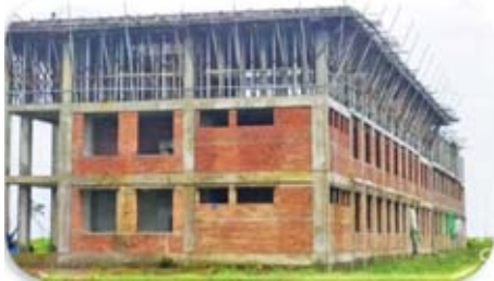
စစ်တွေတက္ကသိုလ် (၃)ထပ်စာသင်ဆောင် တည်ဆောက် ပြီးစီးမှု

(၃)ထပ်စာသင်ဆောင် ဆောက်လုပ်ခြင်းလုပ်ငန်း (၅၂ %) (၇)ခန်းတွဲ စားသောက်ဆိုင် ဆောက်လုပ်ခြင်းလုပ်ငန်း (၁၀၀ %) မိတာ(၄၀၀) ပြေးလမ်းနှင့် ရေနုတ်မြောင်းပါ ဘောလုံးကွင်းဆောက်လုပ်ခြင်းလုပ်ငန်း (၃၀%) ပြီးစီးပြီးဖြစ် ပါသည်။