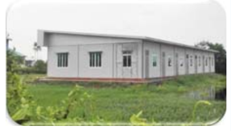
စစ်တွေတက္ကသိုလ် (၇)ခန်းတွဲ စားသောက်ဆိုင် တည်ဆောက်ပြီးစီးမှု