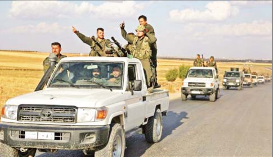
သို့သော် ထရန်က အကယ်၍ တူရကီအနေဖြင့် မိမိမကြိုက်သော အရာတစ်ခုခု လုပ်ဆောင်ခဲ့ပါက တူရကီ၏ စီးပွားရေးကို ဖျက်ဆီးပစ်မည်ဟု တွစ်တာစာမျက်နှာပေါ်တွင် အောက်တိုဘာ ၇ ရက်က ရေးသားဖော်ပြထားသည်။ ထို့အပြင် အိမ်ဖြူတော်က ဆီးရီးယားနိုင်ငံအတွင်းရှိ

ကာဒ်စစ်သွေးကြွအုပ်စုသည် အိုင်အက်စစ်စစ်သွေးကြွအုပ်စုအပေါ် တိုက်ခိုက်မှုတွင် အမေရိကန်၏ အဓိကမဟာမိတ်ဖြစ်ပြီး နယ်စပ်ဒေသများမှ အမေရိကန်တပ်ဖွဲ့ ရုပ်သိမ်းရန် ထရန်၏ ရည်ရွယ်ချက်သည် ကာဒ်တပ်ဖွဲ့အား လက်လွှတ်လိုက်ခြင်းပင်ဖြစ်သည်ဟု ဝေဖန်ရေးသမားများက ရှုမြင်သုံးသပ်ခဲ့ကြသည်။