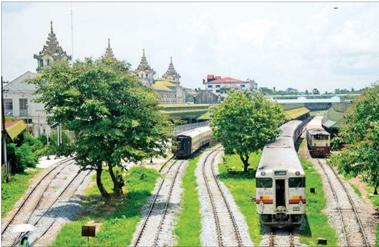
ရန်ကုန်ဘူတာကြီးကို တွေ့ရစဉ်။

ရန်ကုန်-မန္တလေးခရီးစဉ်အတွက် အမှတ်(၁၁/၁၂) (၅/၆) (၃/၄)အစုန်/အဆန် အမြန်ရထားများကိုလည်း ပုံမှန်အတိုင်း နေ့စဉ်ပြေးဆွဲပေးသွားမည် ဖြစ်ပြီး ရထားစီးခရီးသွားပြည်သူများ မိမိတို့လိုရာခရီးကို အဆင်ပြေစွာ သွားလာနိုင်ရေးအတွက် မြန်မာ့မီးရထားမှ ကြိုးစားဆောင်ရွက်လျက်ရှိကြောင်း သိရသည်။ ဗွင့်သခွာ