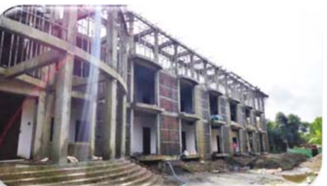
နည်းပညာ တက္ကသိုလ် (စစ်တွေ)(၃)ထပ် ပင်မဆောင် တည်ဆောက်ပြီးစီးမှု

(၃)ထပ် စာသင်ဆောင် ဆောက်လုပ်မှု လုပ်ငန်းမှာ (၆၆%) ကျောင်းတွင်း စားသောက် ဆိုင်ခန်းများ ဆောက်လုပ်မှု လုပ်ငန်း (၁၀၀ %) ပြီးစီးပြီဖြစ် ပါသည်။