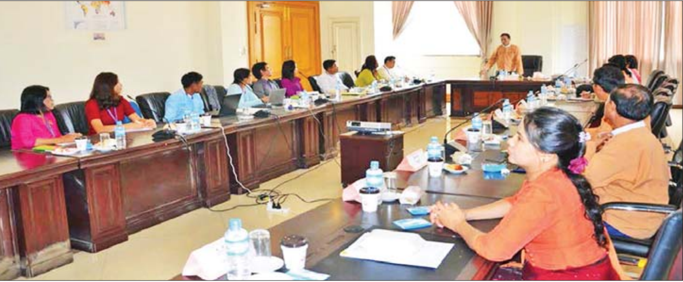
၁၉-၆-၂၀၁၈ ရက် UN AIDS Myanmar မှ တာဝန်ရှိသူများနှင့် တွေ့ဆုံဆွေးနွေးကြစဉ်။

အမျိုးသမီးနှင့်ကလေးသူငယ်အခွင့်အရေးဆိုင်ရာ ကော်မတီ၏ လုပ်ဆောင်ချက်များ မြန်မာနိုင်ငံအတွင်းရှိ အမျိုးသမီးနှင့် ကလေး သူငယ်များ၏ ရပိုင်ခွင့်နှင့် အခွင့်အရေးကဏ္ဍများ မြှင့်တင် ပေးနိုင်ရန်နှင့် ၎င်းတို့ရရှိမည့် အခွင့်အရေးများ ပြည့်ဝစွာ ခံစားနိုင်စေရန် လိုအပ်နေသည့် အမျိုးသမီးများနှင့် ကလေးသူငယ်ကာကွယ်ရေးဥပဒေများ ပြဋ္ဌာန်းနိုင်ရေး တို့ကို အကောင်အထည်ဖော်ဆောင်ရွက်နိုင်ရန် ရည်ရွယ်၍ အမျိုးသားလွှတ်တော် အမျိုးသမီးနှင့် ကလေးသူငယ် အခွင့်အရေးဆိုင်ရာကော်မတီကို ဖွဲ့စည်းခဲ့သည်။ အမျိုးသားလွှတ်တော်ဆိုင်ရာ ဥပဒေပုဒ်မ ၂၇၊ အမျိုးသားလွှတ်တော်ဆိုင်ရာ နည်းဥပဒေ ၁၀၆၊ ၁၀၇ နှင့် အမျိုးသားလွှတ်တော်အစည်းအဝေးဆုံးဖြတ်ချက် တို့အရ အမျိုးသမီးနှင့် ကလေးသူငယ်အခွင့်အရေးဆိုင်ရာ ကော်မတီကို ၂၀၁၇ ခုနှစ် ဇူလိုင်လတွင် အဖွဲ့ဝင် ၁၄ ဦး ဖြင့် ပြင်ဆင်ဖွဲ့စည်းခဲ့သည်။