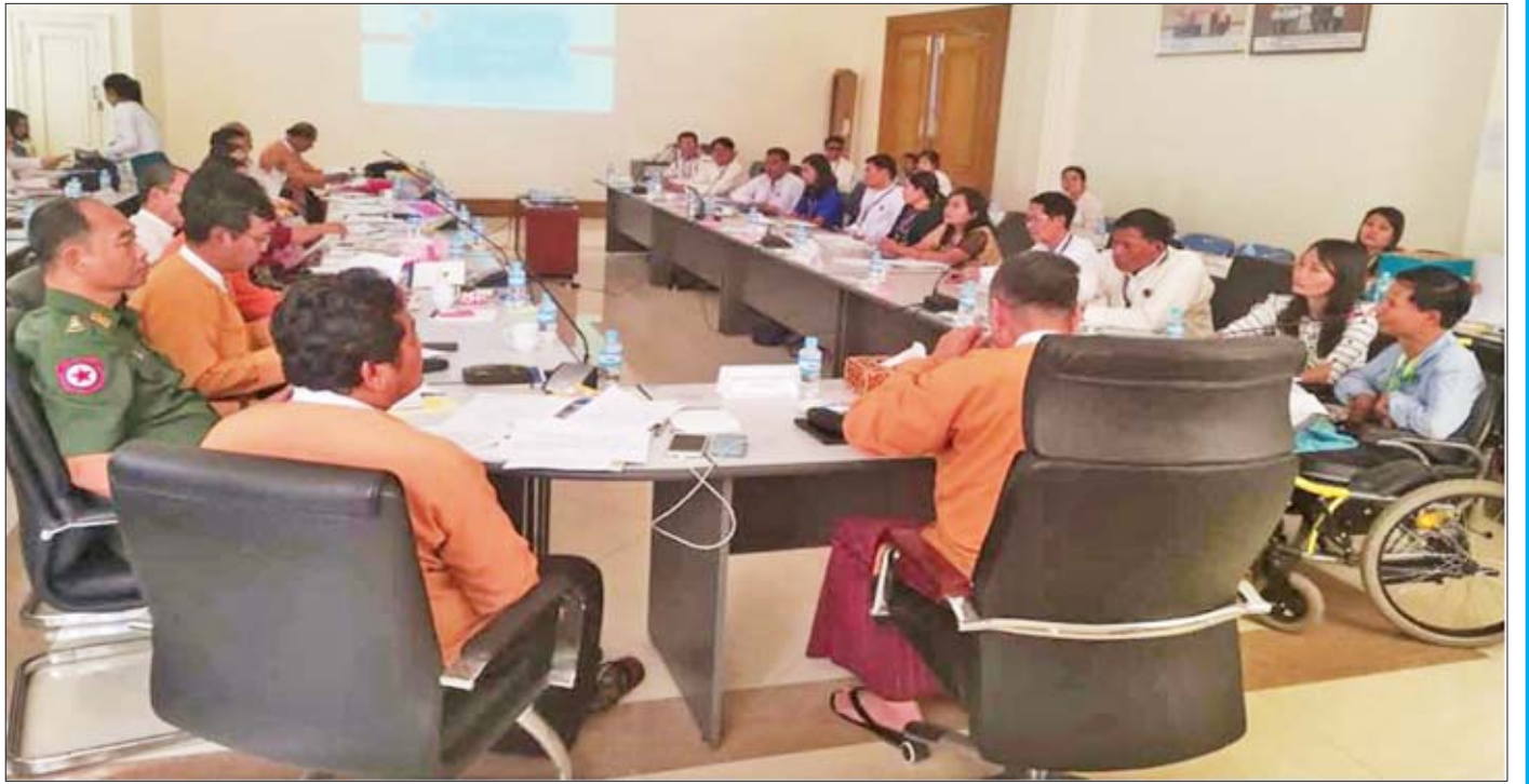
မြန်မာနိုင်ငံ မသန်စွမ်းသူများအသင်းချုပ်နှင့် ညှိနှိုင်းဆွေးနွေးစဉ်။

ဖြေ။ ။ ကျွန်တော်တို့ကော်မတီကို ပြည်သူတွေက တိုင်ကြားစာတွေ ပေးပို့ကြတာရှိပါတယ်။ ဒီတိုင်ကြားစာတွေကို ဖြေရှင်းဆောင်ရွက်ပေးနိုင်ဖို့ ကော်မတီမှာ ညှိနှိုင်းအစည်းအဝေးတွေ ပြုလုပ်ပါတယ်။ တိုင်ကြားစာ အားလုံးပေါင်း ၆၀၀ ကျော်လောက်ရှိပါတယ်။ ဒီလိုညှိနှိုင်းဆွေးနွေးကြရင်းနဲ့ တိုင်ကြားစာတွေနဲ့ ပတ်သက်လို့ လိုအပ်ရင်ရဲတပ်ဖွဲ့နဲ့ သက်ဆိုင်တာတွေဆိုရင် မြန်မာနိုင်ငံရဲတပ်ဖွဲ့၊ ဥပဒေနဲ့သက်ဆိုင်တာတွေဆိုရင်