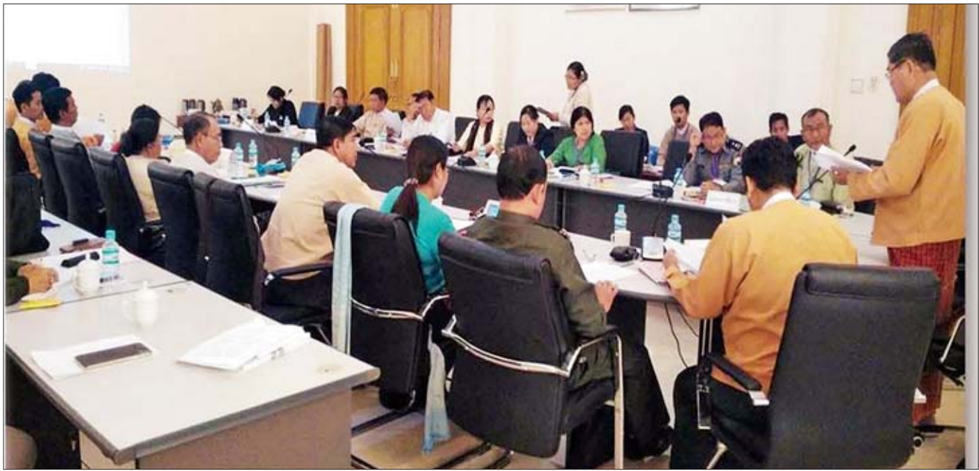
လောင်းကစားဥပဒေနှင့်စပ်လျဉ်း၍ သက်ဆိုင်ရာဝန်ကြီးဌာနများနှင့် ညှိနှိုင်းဆွေးနွေးစဉ်။

ကျွန်တော်တို့ ကော်မတီကို တိုက်ရိုက်တိုင်ကြားမှုမရှိဘဲ မိတ္တူပေးပို့တိုင်ကြားလာတဲ့ တိုင်ကြားစာတွေကို မှတ်တမ်းအဖြစ် ထားရှိပါတယ်။ ကော်မတီကို ပေးပို့ထားတဲ့ တိုင်ကြားစာတွေကို စိစစ်မှတ်ချက်ပြုပြီး သက်ဆိုင်ရာဌာန၊ အဖွဲ့အစည်းတွေကို ပေးပို့ထားတာ ၃၀၀ ကျော် ရှိပါတယ်။ သက်ဆိုင်ရာဌာနဆိုင်ရာတွေက အကြောင်းပြန်ကြား၍ ဖြေရှင်းဆောင်ရွက်ပြီး တိုင်ကြားသူထံ ပြန်လည်ပေးပို့တာက ၂၀၀ ကျော် ရှိပါတယ်။