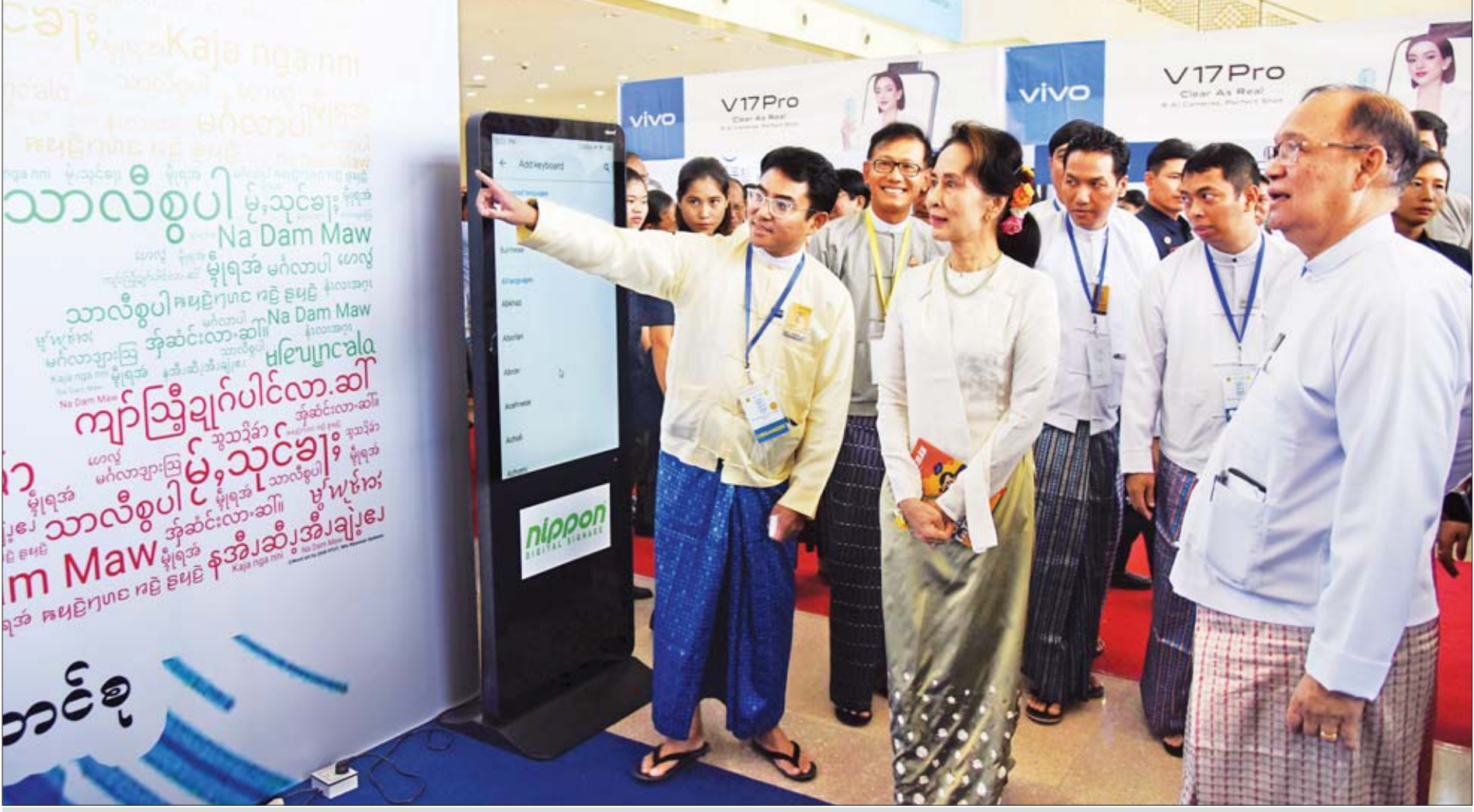
နိုင်ငံတော်၏အတိုင်ပင်ခံပုဂ္ဂိုလ် ဒေါ်အောင်ဆန်းစုကြည် ဆက်သွယ်ရေးကုမ္ပဏီများမှ ခင်းကျင်းပြသထားသည့် မြန်မာယူနီကုဒ်စံစနစ်ကူးပြောင်းခြင်းဆိုင်ရာ ပြခန်းများကို လှည့်လည်ကြည့်ရှုစဉ်။

နေပြည်တော် အောက်တိုဘာ ၁ မြန်မာယူနီကုဒ်စံစနစ် ကူးပြောင်းအသုံးပြုခြင်းအခမ်းအနားကို ယနေ့ နံနက် ၉ နာရီခွဲတွင် နေပြည်တော်ရှိ မြန်မာအပြည်ပြည်ဆိုင်ရာကွန်ဗင်းရှင်းဗဟိုဌာန-၂ ၌ ကျင်းပရာ e-Government ဦးဆောင်ကော်မတီနာယက နိုင်ငံတော်၏ အတိုင်ပင်ခံပုဂ္ဂိုလ် ဒေါ်အောင်ဆန်းစုကြည် တက်ရောက်မိန့်ခွန်းပြောကြား သည်။ အခမ်းအနားသို့ ပြည်ထောင်စုဝန်ကြီးများဖြစ်ကြသည့် ဒုတိယဗိုလ်ချုပ် ကြီးစိန်ဝင်း၊ ဒုတိယဗိုလ်ချုပ်ကြီးရဲအောင်၊ ဒေါက်တာမေမြင့်၊ ဦးမင်းသူ၊ သူရ ဦးအောင်ကို၊ ဒေါက်တာအောင်သူ၊ ဦးသန့်စင်မောင်၊ ဦးအုန်းဝင်း၊ ဦးဝင်းခိုင်၊ ဒေါက်တာသန်းမြင့်၊ ဒေါက်တာမြင့်ထွေး၊ ဦးစိုးဝင်း၊ ဦးဟန်ဇော်၊ ဦးအုန်းမောင်၊ ပြည်ထောင်စုရှေ့နေချုပ် ဦးထွန်းထွန်းဦး၊ ပြည်ထောင်စုစာရင်းစစ်ချုပ် ဦးမော်သန်း၊ ပြည်ထောင်စုရာထူးဝန်အဖွဲ့ဥက္ကဋ္ဌ ဦးဝင်းသိမ်း၊ နေပြည်တော်