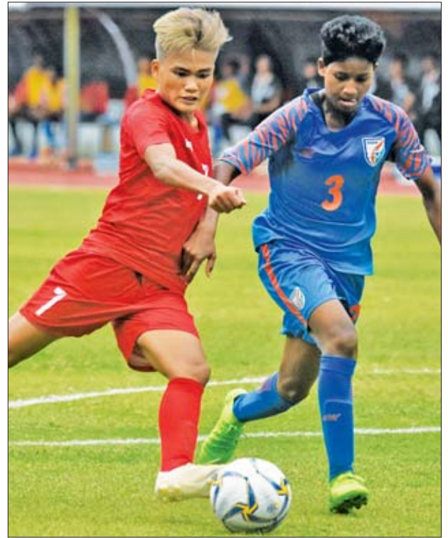
၂၀၂၀ အိုလံပစ်ခြေစစ်ပွဲတွင် မြန်မာအမျိုးသမီးအသင်း ယှဉ်ပြိုင်နေစဉ်။