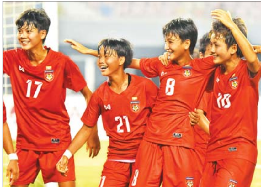
မြန်မာယူ-၁၉ အမျိုးသမီးအသင်း ကစားသမားများကို တွေ့ရစဉ်။

ရန်ကုန် အောက်တိုဘာ ၁ မြန်မာယူ-၁၉ အမျိုးသမီးအသင်းသည် ၂၀၁၉ အာရှ ယူ-၁၉ အမျိုးသမီးပြိုင်ပွဲ နောက်ဆုံးအဆင့်အတွက် နောက်ဆုံးပြိုင်ဆင်မှုအဖြစ် မန္တလေးမြို့၌ ပြည်တွင်း၊ ပြည်ပ ခြေစမ်းပွဲ လေးပွဲယှဉ်ပြိုင်ကစားမည်ဖြစ်သည်။ ခြေစမ်းပွဲများ ယှဉ်ပြိုင်ကစားမည် မြန်မာယူ-၁၉ အမျိုးသမီးအသင်းသည် အောက်တိုဘာ ပထမပတ်မှစ၍ လေ့ကျင့်နေပြီး မန္တလေးသို့ရောက်ရှိပြီး ခြေစမ်းပွဲများ ယှဉ်ပြိုင်ကစားမည် ဖြစ်သည်။ မြန်မာယူ-၁၉ အမျိုးသမီးအသင်းသည် ပြည်ပခြေစမ်းပွဲအဖြစ် အောက်တိုဘာ ၁၁ ရက်နှင့် ၁၃ ရက်တို့တွင် ဗီယက်နမ်ယူ-၁၉ အမျိုးသမီးအသင်း နှင့် ခြေစမ်းပွဲနှစ်ပွဲ ကစားမည်ဖြစ်သည်။ ဗီယက်နမ် ယူ-၁၉ အမျိုးသမီးအသင်းသည် အာရှခြေစမ်းပွဲ အောင်မြင်ထားသည့်အသင်းဖြစ်ပြီး မြန်မာ အမျိုးသမီးအသင်းအတွက် အကျိုးရှိမည့် ခြေစမ်းပွဲ လည်းဖြစ်သည်။ မြန်မာယူ-၁၉ အမျိုးသမီးအသင်းသည် ဗီယက်နမ်နှင့် ခြေစမ်းပွဲပြီးပါက ပြည်တွင်းခြေစမ်းပွဲ စာမျက်နှာ ၁၄ ကော်လံ ၃ သို့ ၂