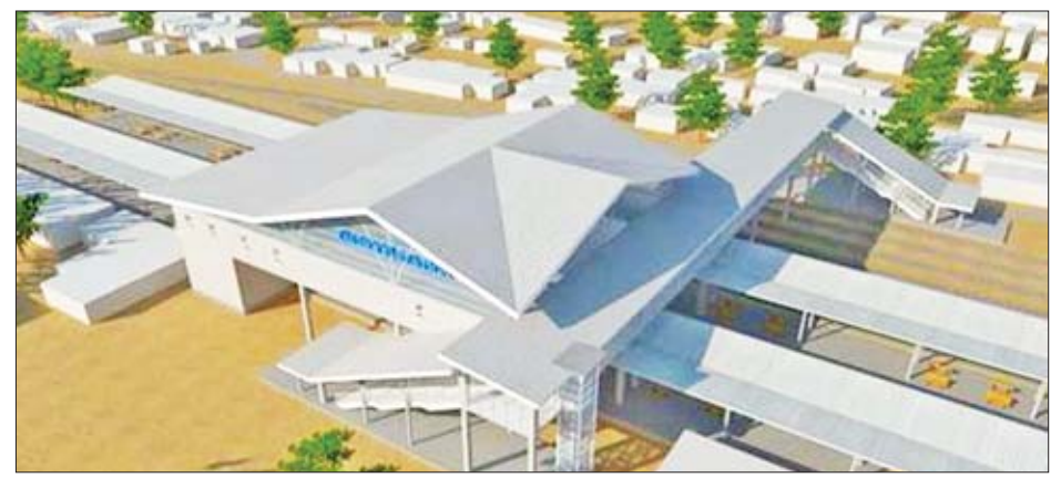
ရန်ကုန်-မန္တလေးရထားလမ်း အဆင့်မြှင့်တင်ရေးစီမံကိန်းဆောင်ရွက်ပြီးစီးပါက တောင်ငူဘူတာရုံသစ်အား မြင်တွေ့ ရမည့် ပုံစံပုံစံ။

ရန်ကုန် အောက်တိုဘာ ၁၁ ရထားစီး ခရီးသွားပြည်သူများ သွားလာရေးအဆင်ပြေစေရန်အတွက် မိုင်အရှည် ၃၈၅ ဒသမ ၅ မိုင် ရှည်လျားသော ရန်ကုန်-မန္တလေး ရထားလမ်း အဆင့်မြှင့်တင်ရေး စီမံကိန်းရှိ ရထားလမ်းပိုင်းစီမံကိန်း (အဆင့်-၁)ဖြစ်သော ရန်ကုန်- တောင်ငူ လမ်းပိုင်းအရှည် ၁၆၆ မိုင်ကို ယနေ့မှစတင်၍ စီမံကိန်းအဆင့်မြှင့် တင်ရေးလုပ်ငန်းများ စတင်ဆောင် ရွက်နေပြီဖြစ်ရာ ရန်ကုန်-တောင်ငူ လမ်းပိုင်းရှိ ရထားလမ်းဘူတာ ၁၀ ခုကို အသစ်ပြန်လည်တည်ဆောက် သွားမည်ဖြစ်ကြောင်း မြန်မာ့မီးရထား မှ သိရသည်။