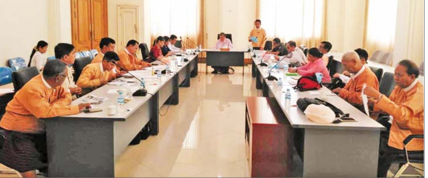
ပြည်သူ့လွှတ်တော် ပြည်သူ့ရေးရာစီမံခန့်ခွဲမှုကော်မတီ လုပ်ငန်းညှိနှိုင်းအစည်းအဝေး ကျင်းပစဉ်။