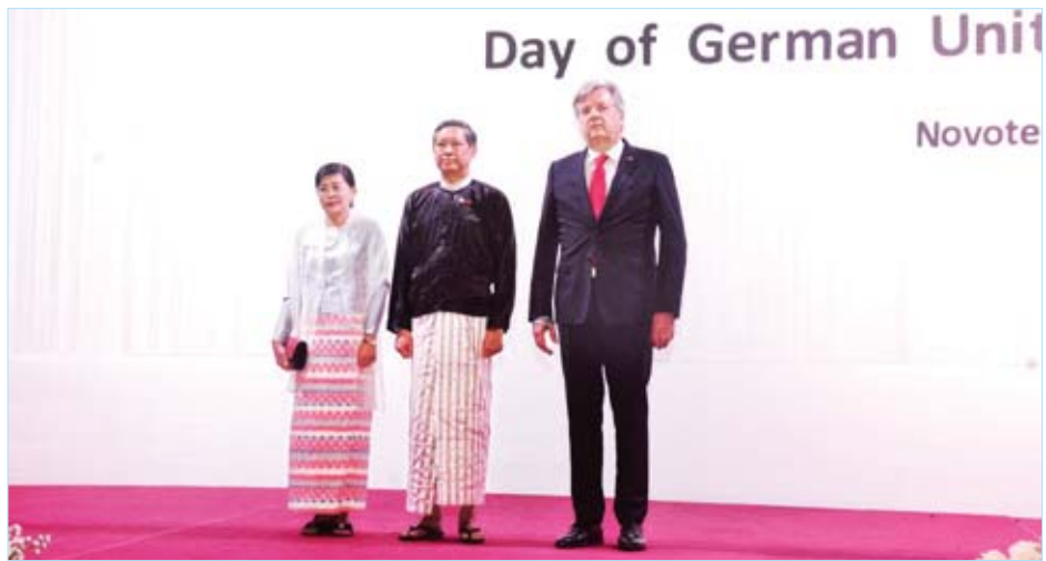
Day of German Unit Novote

လုပ်ငန်းညှိနှိုင်းအစည်းအဝေးအရ ၂၀၁၉-၂၀၂၀ ပြည့်နှစ် အတွင်း အခြေခံ ရည်ညွှန်းစာချုပ်ချုပ်ဆိုရေးကို စပါးအစိုဓာတ် ၁၄ ရာခိုင်နှုန်းရှိပြီး စပါးတစ်တင်းလျှင် ၄၆ ပေါင်ကိုက် စပါး အရည်အသွေးဆိုင်ရာ သတ်မှတ်ချိန်စံညွှန်းများနှင့် ကိုက်ညီသည့် စပါးတင်း ၁၀၀ လျှင် သတ်မှတ်မည့်ဈေးနှုန်းနှင့် အဆိုပါ အခြေခံရည်ညွှန်းစာချုပ်ချုပ်ဆိုရေးကို အောက်တိုဘာ ၁၅ ရက်မတိုင်မီ ထုတ်ပြန်နိုင်ရေးဆောင်ရွက်သွား မည်ဖြစ်ကြောင်း သိရသည်။ သတင်းစဉ်