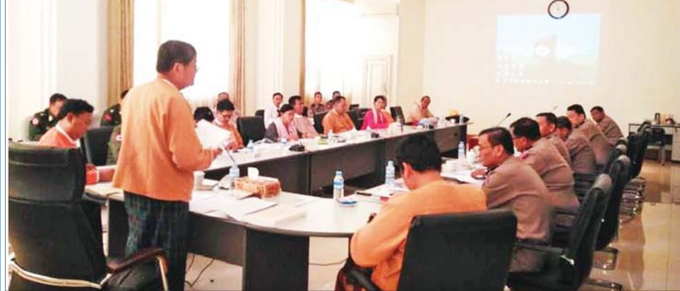
အကျဉ်းသားများ စနစ်တကျ စိစစ်လျှော့ချရေးနှင့်စပ်လျဉ်း၍ အကျဉ်းဦးစီးဌာနနှင့် ညှိနှိုင်းဆွေးနွေးစဉ်။

ဆက်စပ်ပြီးတော့ ဆောင်ရွက်နေပါတယ်။ အခုလက်ရှိ လွှတ်တော်မှာ ပြဋ္ဌာန်းပြီးသွားတဲ့ လောင်းကစားဥပဒေ၊ ငြိမ်းချမ်းစွာ စုဝေးခွင့်နှင့် ငြိမ်းချမ်း စွာစီတန်းလှည့်လည်ခွင့်ဆိုင်ရာဥပဒေ ဒါတွေဟာ ကျွန်တော်တို့ကော်မတီက ကိုင်တွယ်ရတဲ့ဥပဒေဝေမှာ ပါတဲ့ ဥပဒေတွေဖြစ်ပါတယ်။ ကျွန်တော်တို့ ကော်မတီ စတင်တာဝန်ယူစဉ်က ကော်မတီက ဥပဒေ ၈၀ တာဝန် ယူပါတယ်။ အခုတော့ ၅၁ ခုပဲ တာဝန်ယူရပါတယ်။ ဘာဖြစ်လို့ လျော့သွားတာလဲဆိုတော့ အခုပြည်သူ့ လွှတ်တော်မှာ ကော်မတီတွေ ထပ်မံဖွဲ့စည်းခဲ့တဲ့ အတွက် ပါ။ ပြည်ထောင်စု အစိုးရအဖွဲ့ရုံး ဝန်ကြီးဌာနနဲ့ သက်ဆိုင် တဲ့ ဥပဒေက ၁၈ ခု၊ ပြည်ထဲရေးဝန်ကြီးဌာနနဲ့ သက်ဆိုင် တဲ့ ဥပဒေက ၂၈ ခု၊ လူမှုဝန်ထမ်း၊ ကယ်ဆယ်ရေးနှင့် ပြန်လည်နေရာချထားရေးဝန်ကြီးဌာနနဲ့ သက်ဆိုင်တဲ့ ဥပဒေက လေးခု၊ အဂတိလိုက်စားမှုတိုက်ဖျက်ရေး ကော်မရှင်နဲ့ သက်ဆိုင်တဲ့ ဥပဒေကတစ်ခု စုစုပေါင်း ၅၁ ခုပါ။ အဓိက ကတော့ ပြည်သူနဲ့ တိုက်ရိုက်ထိစပ်တဲ့ ဥပဒေတွေကို ကိုင်တွယ်တာဖြစ်ပါတယ်။