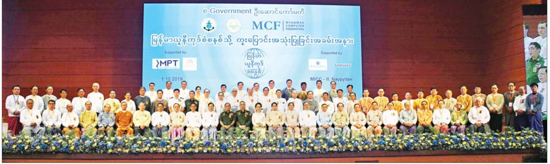
နိုင်ငံတော်၏အတိုင်ပင်ခံပုဂ္ဂိုလ် ဒေါ်အောင်ဆန်းစုကြည် ပြည်ထောင်စုဝန်ကြီးများ၊ မြန်မာနိုင်ငံ ကွန်ပျူတာအသင်းချုပ်နာယကနှင့် ဥက္ကဋ္ဌ မြန်မာနိုင်ငံ ကုန်သည်များနှင့် စက်မှုလက်မှုလုပ်ငန်းရှင်များအသင်းချုပ်ဥက္ကဋ္ဌ၊ ရုပ်ရှင်၊ ဂီတ၊ သဘင်အစည်းအရုံးဥက္ကဋ္ဌ၊ ဒုတိယဝန်ကြီးများ၊ တိုင်းဒေသကြီးနှင့် ပြည်နယ်အစိုးရအဖွဲ့ဝင် ဝန်ကြီးများ၊ ဌာနဆိုင်ရာအကြီးအကဲများနှင့် စုပေါင်းမှတ်တမ်းတင်ဓာတ်ပုံရိုက်စဉ်။