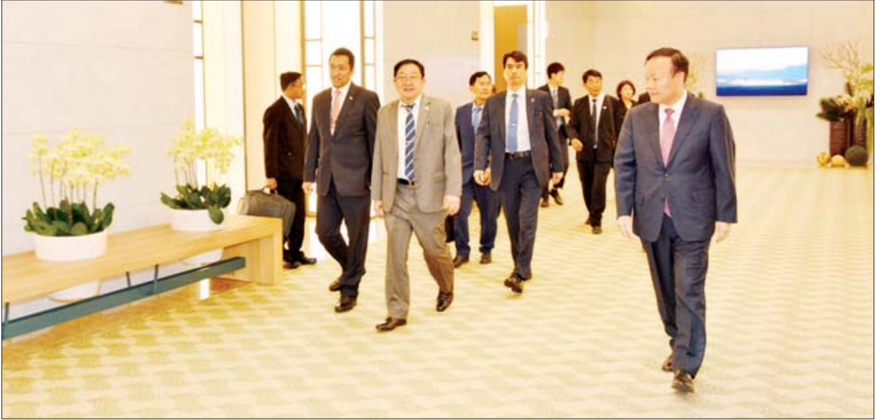
အဆိုပါလေ့လာရေးအစီအစဉ်များတွင် ပြည်သူ့လွှတ်တော်ဥက္ကဋ္ဌနှင့်အဖွဲ့ ပြည်သူ့လွှတ်တော် တရားစီရင်ရေးနှင့် ဥပဒေရေးရာကော်မတီဥက္ကဋ္ဌ ဦးတင်ထွေး၊ လျှပ်စစ်နှင့် စွမ်းအင်ဖွံ့ဖြိုးတိုးတက်ရေးကော်မတီဥက္ကဋ္ဌ ဦးကြည်မိုးနိုင်၊

ထို့နောက် ပြည်သူ့လွှတ်တော်ဥက္ကဋ္ဌနှင့်အဖွဲ့သည် မွန်းလွဲ ၂ နာရီခွဲတွင် ဆူဝမ်မြို့ရှိ Hwaseong Haeng-Gung နန်းတော်သို့ လည်းကောင်း၊ ညနေ ၄ နာရီတွင် Samsung Innovation Museum သို့ လည်းကောင်း သွားရောက် လေ့လာသည်။