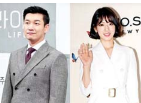
ပြသသွားမယ့် အစီအစဉ်တွေကို လတ်တလော ထုတ်ဖော် အသိပေးခဲ့ခြင်းမရှိဘူးလို့လည်း သိရပါတယ်။

"Sisyphus: The Myth" လို့ အမည်ရတဲ့ သိပ္ပံ ဇာတ်လမ်းတွဲမှာ ချိုဆန်ဂူးနဲ့ ပျံခရိုင်ဟေးတို့ တွဲဖက် ပါဝင်သွားမှာဖြစ်ပြီး ဒီဇာတ်လမ်းတွဲဟာ သူတို့နှစ်ဦး ပထမ ဆုံးအကြိမ် တွဲဖက်ပါဝင်ထားတဲ့ ဇာတ်လမ်းတွဲလည်း ဖြစ်တယ်လို့ သိရပါတယ်။