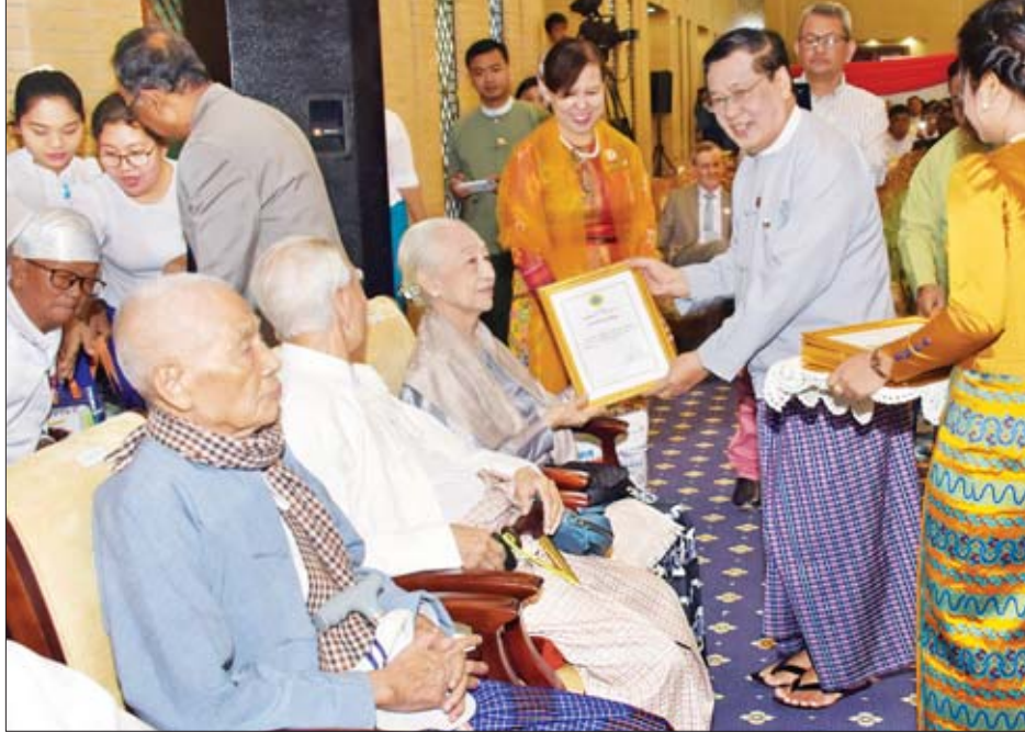
ပြည်ထောင်စုဝန်ကြီး ဦးသိန်းဆွေ ထူးချွန်အားအဘွားများနှင့် ဂုဏ်ပြုခံအဘွားများထံ ဂုဏ်ပြုမှတ်တမ်းလွှာ ပေးအပ်ချီးမြှင့်စဉ်။

များနေ့အခမ်းအနားကို ပိုမိုအနှစ်သာရပြည့်ဝစေရန်အတွက် ကုလသမဂ္ဂအဖွဲ့ကြီးက "The Journey to Age Equality" "အသက်ကြောင့် မခွဲခြား တိုးတိုးဘွား၊ စွမ်းအားတူညီ လျှောက်လှမ်းမည်"ဟူ၍ ယခုနှစ်အတွက် ဆောင်ပုဒ်အဖြစ် သတ်မှတ်ပေးခဲ့ပါကြောင်း၊ နိုင်ငံများအကြား အသက်အရွယ်၊ ကျား/မ၊ လူမျိုးရေး၊ ဘာသာရေး၊ စီးပွားရေးနှင့် အခြားအခြေအနေများအပေါ် မူတည်ပြီး ခွဲခြားဆက်ဆံမှု ပပျောက်ရေးနှင့် မညီမျှမှုများကို လျှော့ချနိုင်ရန်အတွက် စဉ်ဆက်မပြတ် ဖွံ့ဖြိုးတိုးတက်မှုပန်းတိုင် (၁၀)တွင် ဖော်ပြထားပါကြောင်း၊ ထို့ကြောင့် သက်ကြီးရွယ်အိုများကိုလည်း အသက်အရွယ်ကြောင့် ခွဲခြားခြင်းမရှိဘဲ လူမှုရေး၊ စီးပွားရေး၊ နိုင်ငံရေးကဏ္ဍတို့တွင် ချန်လှပ်ထားမှုမရှိဘဲ အတူတကွ ပါဝင်ဆောင်ရွက်ခွင့်ပေးရန် လိုအပ်ပါကြောင်း၊ ယခုဆောင်ပုဒ်၏ အနှစ်သာရများနှင့်အညီ သက်ကြီးရွယ်အိုအရေးကိစ္စများ ဆောင်ရွက်သည့်နေရာတွင် အလေးထားဆောင်ရွက်သွားနိုင်ရန် လိုအပ်မည်ဖြစ်ပါကြောင်း။