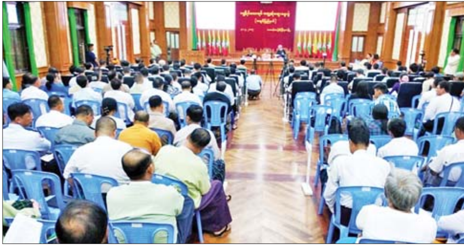
တရားဥပဒေပြုရေးဆိုင်ရာကဏ္ဍများနှင့် တရားစီရင်ရေး ဆိုင်ရာ ကဏ္ဍများတွင် အများပြည်သူသိသည့် သတင်းအချက်အလက်များကို ထုတ်ပြန်ပေးနိုင်ရေး အချက်အလက်များကို ဥပဒေ၊ နည်းဥပဒေများအတိုင်း

မြစ်ကြီးနား အောက်တိုဘာ ၁၁ မြန်မာနိုင်ငံသတင်းမီဒီယာကောင်စီ(Myanmar Press Council)က ဦးဆောင်၍ မဏ္ဍိုင်လေးရပ် တွေ့ဆုံဆွေးနွေးပွဲ ကို စက်တင်ဘာ ၃၀ ရက် မွန်းလွဲ ၁ နာရီက မြစ်ကြီးနားမြို့ ဧရာဝတီကွက် ကချင်ပြည်နယ်အစိုးရအဖွဲ့ရုံး မေခခန်းမ၌ ကျင်းပသည်။