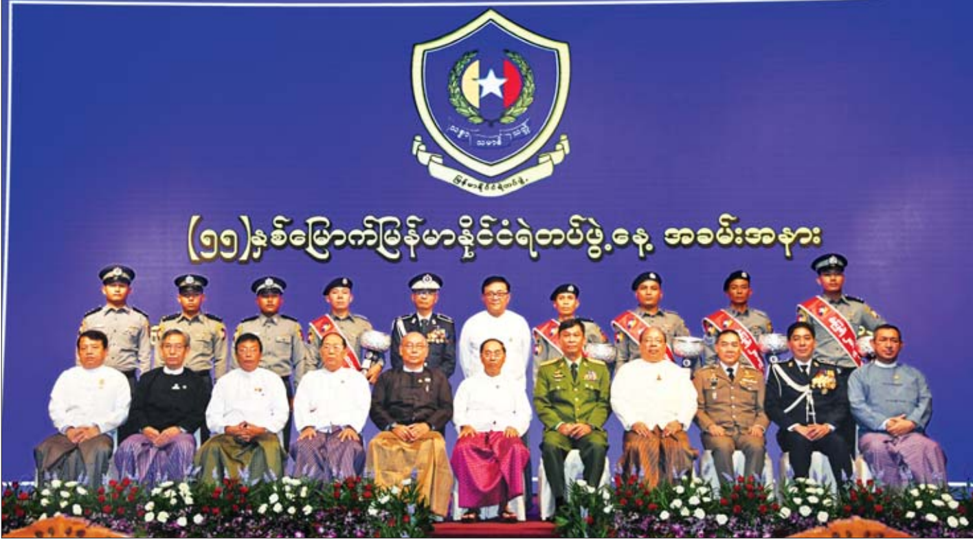
ဒုတိယသမ္မတ ဦးမြင့်ဆွေ၊ အမျိုးသားလွှတ်တော် ဥက္ကဋ္ဌ မန်းဝင်းခိုင်သန်း၊ နိုင်ငံတော်ဖွဲ့စည်းပုံအခြေခံဥပဒေဆိုင်ရာ ခုံရုံးဥက္ကဋ္ဌ ဦးမျိုးညွန့်၊ ပြည်ထောင်စုဝန်ကြီးများနှင့် (၅၅)နှစ်မြောက် မြန်မာနိုင်ငံရဲတပ်ဖွဲ့နေ့အခမ်းအနားသို့ တက်ရောက်လာကြသူများ စုပေါင်းမှတ်တမ်းတင် ဓာတ်ပုံရိုက်စဉ်။

ထို့အပြင် ကမ္ဘာတစ်ဝန်း၌လည်း သမားရိုးကျနှင့် သမားရိုးကျမဟုတ်သည့် လုံခြုံရေးဆိုင်ရာ ပြဿနာများ ရင်ဆိုင်နေရပြီး နိုင်ငံဖြတ်ကျော်မှုခင်းများသည် အဖွဲ့အစည်းတစ်ခု၊ နိုင်ငံတစ်ခုတည်းဖြင့် ဖြေရှင်းနိုင်သည့် ပြဿနာမဟုတ်တော့ဘဲ ဒေသတွင်းနှင့် နိုင်ငံတကာ ပူးပေါင်းဆောင်ရွက်ရမည့် မူခင်းပြဿနာမျိုးများ ဖြစ်လာပါကြောင်း၊ ထို့ကြောင့် ကုလသမဂ္ဂ၏ မူခင်းကြိုတင်ကာကွယ်ရေးဆိုင်ရာ သဘောတရား(၈)ချက်နှင့်အညီ “မြန်မာနိုင်ငံ၏ အမျိုးသားအဆင့် မူခင်းကြိုတင်ကာကွယ်ရေးဆိုင်ရာ မဟာဗျူဟာ (၂၀၁၈-၂၀၂၀)” ကို ၂၀၁၉ ခုနှစ် မတ်လ ၁၅ ရက်တွင် ရေးဆွဲပြဋ္ဌာန်းခဲ့ပြီး အဆိုပါ မဟာဗျူဟာလုပ်ငန်းစဉ်များနှင့်အညီ တိုင်းဒေသကြီးနှင့်ပြည်နယ်အဆင့်၊ ခရိုင်