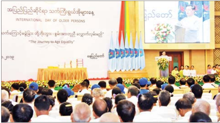
ပြည်ထောင်စုဝန်ကြီး ဦးသိန်းဆွေ ၂၀၁၉ ခုနှစ် အပြည်ပြည်ဆိုင်ရာသက်ကြီးရွယ်အိုများနေ့အခမ်းအနားတွင် အမှာစကားပြောကြားစဉ်။

ယခုနှစ်တွင် အပြည်ပြည်ဆိုင်ရာသက်ကြီးရွယ်အို