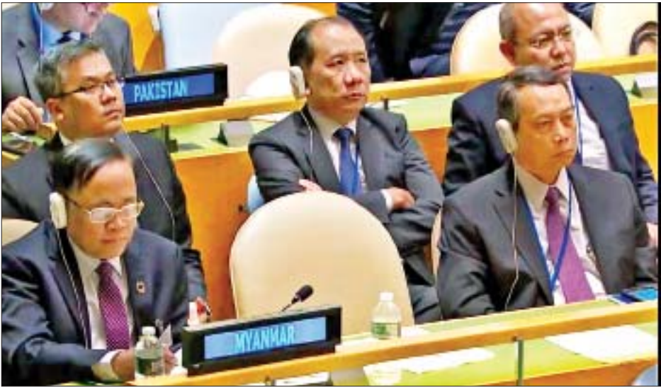
(၇၄) ကြိမ်မြောက် ကုလသမဂ္ဂအထွေထွေညီလာခံ အထွေထွေမူဝါဒရေးရာဆွေးနွေးပွဲသို့ မြန်မာကိုယ်စားလှယ်အဖွဲ့ တက်ရောက်စဉ်။

သဘာပတိကြီးခင်ဗျား- ဆင်းရဲနွမ်းပါးမှု ပုံစံအားလုံး ပပျောက်ရေးဟာ ကမ္ဘာ့အကြီးမားဆုံး စိန်ခေါ်မှုဖြစ်ပြီး စဉ်ဆက်မပြတ်ဖွံ့ဖြိုးမှုအတွက် မရှိမဖြစ် လိုအပ်တဲ့ အရာတစ်ခုလည်း ဖြစ်ပါတယ်။ မြန်မာနိုင်ငံအနေနဲ့ ဆင်းရဲမှုကို ဖြေရှင်းဖို့ အခိုင်အမာ ဆုံးဖြတ်ထားသည့်အားလျော်စွာ တစ်ဖက်မှာ စီးပွားရေးနဲ့ လူမှုရေးကဏ္ဍ ဖွံ့ဖြိုးတိုးတက်ရေးအတွက် ဆောင်ရွက်နေသလို အခြားတစ်ဖက်မှာလည်း ပတ်ဝန်းကျင်ထိန်းသိမ်းရေးနဲ့ ရေရှည်တည်တံ့ရေးတို့ကို အလေးဂရုပြုပြီး ချိန်ညှိဆောင်ရွက်နေပါတယ်။ စီးပွားရေးတိုးတက်မှု ရရှိစေဖို့သာမက ယင်းထက် ပိုမျှော်မှန်းချက်ထားတဲ့ မဟာဗျူဟာများစွာကိုလည်း ချမှတ်ဖော်ဆောင်လျက်ရှိပါတယ်။ ဒါ့ကြောင့် မြန်မာနိုင်ငံရဲ့ ဆင်းရဲမှုဟာ ၂၀၀၅ ခုနှစ်က ၄၈ ဒသမ ၂ ရာခိုင်နှုန်းရှိခဲ့ရာမှ ၂၀၁၇ ခုနှစ်မှာ ၂၄ ဒသမ ၈ ရာခိုင်နှုန်းသို့ ထက်ဝက်ကျဆင်းခဲ့တဲ့အတွက် ကျွန်တော်တို့ရဲ့ ကြိုးပမ်းမှုများ အကျိုးရလဒ်ကောင်းတွေ ထွက်ပေါ်နေပြီဆိုတာကို