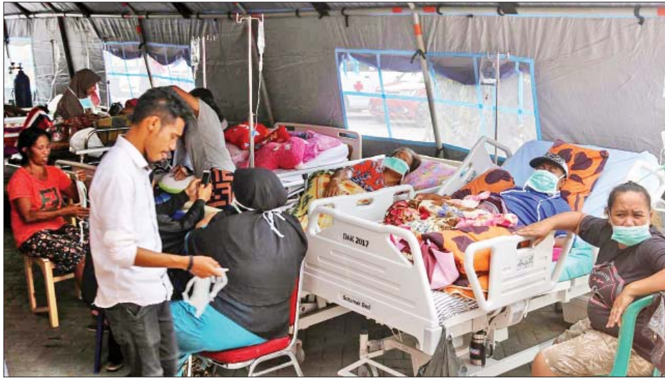
ရေးလုပ်ငန်းများ ဆောင်ရွက်ရာတွင် အဆင်ပြေ ချောမွေ့ ကြေညာခဲ့သည်။ စေရန် ရည်ရွယ်ကာအိမ်ဘွန်မြို့တော်၌ စက်တင်ဘာ ၂၆ နောက်ဆက်တွဲငလျင်များ ဆက်တိုက်လှုပ်ခတ်မှုကြောင့် ဆူနာမီ ဖြစ်ပေါ်လာနိုင်မှု၊ အိမ်များပျက်စီး

ဂျကာတာ စက်တင်ဘာ ၂၉ အင်ဒိုနီးရှားနိုင်ငံ အရှေ့ပိုင်း မာလူကူပြည်နယ်တွင် လွန်ခဲ့သောသုံးရက်က ပြင်းအား ၆ ဒဿ ၅ အဆင့်ရှိ ငလျင်တစ်ခုလှုပ်ပြီးနောက် သေဆုံးသူအရေအတွက်မှာ ၃၀ အထိ ရှိလာခဲ့ပြီး ၁၅၆ ဦး ဒဏ်ရာရရှိကာ လူပေါင်း ၂၅၀၀၀ ဝန်းကျင်မှာ ငလျင်ရှောင်စခန်းများတွင် ခိုလှုံနေရကြောင်း အမျိုးသားသဘာဝဘေးအန္တရာယ် စီမံခန့်ခွဲရေး အေဂျင်စီမှ အဆင့်မြင့်တာဝန်ရှိသူတစ်ဦးက ယနေ့ ပြောကြားလိုက်သည်။