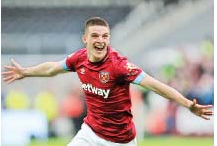
ငွေကြယ် - စုစည်းသည်

နဲ့ ဒီကလန်ရိုက်ကိုခေါ်ယူမယ်ဆိုရင် ဝက်စ် ဟမ်းက တောင်းဆိုထားတဲ့ဈေးနှုန်းကိုပေးရ မယ့် အနေအထားဖြစ်ပါတယ်။ မန်စီးတီး အသင်းကလည်း ဒီကလန်ရိုက်ကိုခေါ်ယူဖို့ ပစ်မှတ်ထားနေပြီး လာမယ့်ဇန်နဝါရီဈေးကွက် မှာတော့ မဝယ်ယူသေးဘူးလို့ နည်းပြ ဂွာဒီ ယိုလာက ဆိုပါတယ်။