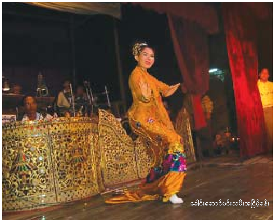
ခေါင်းဆောင်မင်းသမီးအငြိမ့်ခန်း

ဒီတော့ ကြည့်ချင်ပွဲအစဉ်အလာဆိုတာကို မသိ ကြတော့တာ မရိုင်းဘူးပေါ့...။