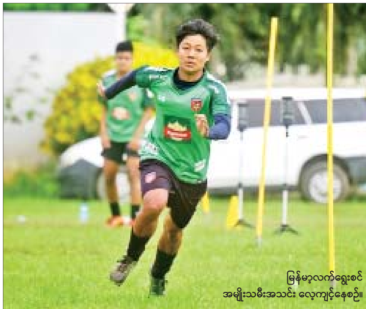
မြန်မာ့လက်ရွေးစင် အမျိုးသမီးအသင်း လေ့ကျင့်နေစဉ်။

ရန်ကုန် စက်တင်ဘာ ၂၉ ၂၀၁၉ ဖိလစ်ပိုင် ဆီးဂိမ်းပြိုင်ပွဲအတွက် စခန်းဝင်လေ့ကျင့်နေသည့် မြန်မာ့လက်ရွေးစင် အမျိုးသမီးအသင်းသည် ပြီးခဲ့သည့်ရက်ပိုင်းက ကစားသမားများလျှော့ချကာ ကစားသမား ၃၀ ဖြင့် လေ့ကျင့်ပြင်ဆင်လျက်ရှိသည်။