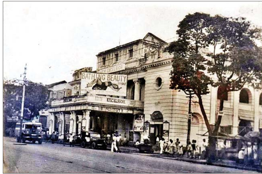
New Excelsior ရုပ်ရှင်ရုံ၊ မောင်ဂိုမာရီလမ်း(ယခု ဗိုလ်ချုပ်အောင်ဆန်းလမ်း)

ရုပ်ရှင်အလုပ်ဆိုတာ စုပေါင်း လုပ်တဲ့ အလုပ်၊ တစ်ယောက် တည်းလုပ်လို့ ဘာမှကို မရတာ။ တစ်ယောက်တည်း ကိုယ်ကတော်နေပေမယ့် ဒါရိုက်တာ၊ ဇာတ်ညွှန်း၊ သရုပ် ဆောင် အဘက်ဘက်က တော်မှ၊ ကောင်းမှ၊ တေးဂီတ ကလည်း တော်မှ အဘက်ဘက်က ပြည့်စုံမှ ဇာတ်ကားတစ်ကား ကောင်းမှာ။ အားလုံးက ညီညွတ်ဖို့ လိုပါတယ်။ ဘာအလုပ်ပဲလုပ်လုပ် ညီညီညွတ်ညွတ်လုပ်ဖို့ တိုက်တွန်းချင်