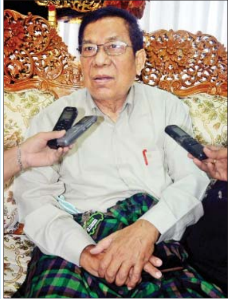
ဒါရိုက်တာကြည်စိုးထွန်း

သုံးနှစ်လောက်က ဟိုယောင်ယောင် ဒီယောင်ယောင်နဲ့ပါ။ နောက်တော့ ကိုယ့်နဲ့သက်ဆိုင်တဲ့ ပလက်ဖောင်းရတာပေါ့။ ဒီနေရာအထိပါပဲ။ အကယ်ဒမီ ငါးခု ရခဲ့ပါတယ်။ ဒါရိုက်တာဖြစ်တဲ့အချိန်မှာ ရိုက်ချင်သလို ရိုက်လို့မရဘူး။ အခုခေတ်ကတော့ ကြိုက်သလောက် ရိုက်လို့ရတယ်။ ကျွန်တော်တို့တုန်းက နက်ဂတစ် ပေပေါင်း သုံးသောင်းလောက်ပဲရတယ်။ သုံးနာရီစာလောက်ရတယ်။ ဥပမာ ဘဝသံသရာရိုက်တယ်ဆိုရင် ဦးသူခက ဖလင် တစ်သိန်းလောက်ဖြုန်းနိုင်ခဲ့တယ်။ ကျွန်တော်တို့က ဖလင် အဲဒီလောက်မဖြုန်းနိုင်ဘူး။ သုံးသောင်းလောက်ပဲ သုံးနိုင်တာ။ ချွေတာပြီးရိုက်ခဲ့ရတယ်။ သေသေချာချာ ရိုက်ခဲ့ရတယ်။ မှားလို့ မရဘူးပေါ့။ အဲဒါလေးတွေပါ။ ထူးခြားတဲ့အတွေ့အကြုံပါ။