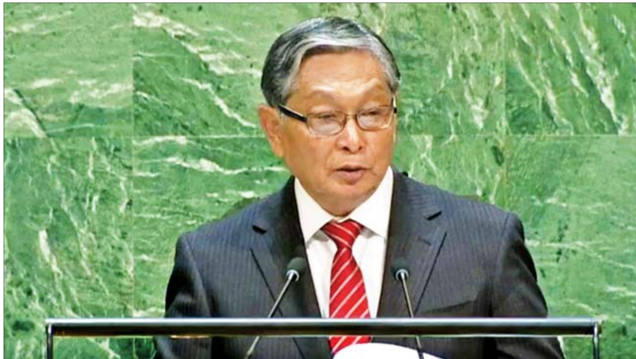
ပြည်ထောင်စုဝန်ကြီး ဦးကျော်တင့်ဆွေ (၇၄) ကြိမ်မြောက် ကုလသမဂ္ဂအထွေထွေညီလာခံ အထွေထွေမူဝါဒရေးရာဆွေးနွေးပွဲတွင် မိန့်ခွန်းပြောကြားစဉ်။

(၇၄) ကြိမ်မြောက် ကုလသမဂ္ဂအထွေထွေညီလာခံ အထွေထွေမူဝါဒရေးရာဆွေးနွေးပွဲ၏ ပဉ္စမနေ့အစည်းအဝေးကို စက်တင်ဘာ ၂၈ ရက်တွင် နယူးယောက်မြို့၊ ကုလသမဂ္ဂဌာနချုပ်၌ ကျင်းပရာ မြန်မာကိုယ်စားလှယ်အဖွဲ့ ခေါင်းဆောင် နိုင်ငံတော်အတိုင်ပင်ခံရုံးဝန်ကြီးဌာန ပြည်ထောင်စုဝန်ကြီး ဦးကျော်တင့်ဆွေ တက်ရောက်၍ အထွေထွေမူဝါဒရေးရာ မိန့်ခွန်းတစ်ရပ် ပြောကြားခဲ့သည်။