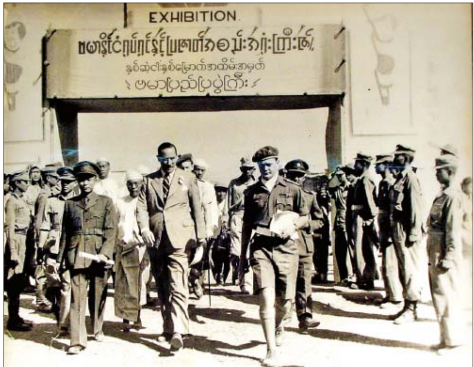
၁၉၄၇ ခုနှစ်တွင် ရုပ်ရှင်ငွေရတုသဘင်ပွဲတော်ကို ရွှေတိဂုံဘုရား အနောက်ဘက်မုခ်၌ စက်မှုလက်မှုပြပွဲနှင့်အတူ ပူးတွဲကျင်းပရာ ဗိုလ်ချုပ်အောင်ဆန်း တက်ရောက်အားပေးစဉ်။

“မေတ္တာနှင့် သူရာ” ဇာတ်ကားတွင် ယနေ့ဇာတ်ကားများကဲ့သို့ ဒါရိုက်တာ၊ ဓာတ်ပုံဆရာနှင့် သရုပ်ဆောင်များကို ဖော်ပြခြင်းမရှိသေးဘဲ မြန်မာဘာသာဖြင့် ဘားမားဖလင်မှ ရိုက်ကူးသော “မေတ္တာနှင့်သူရာ” ဟူ၍လည်းကောင်း၊ အင်္ဂလိပ်ဘာသာဖြင့် “Burma Film Presents' Love and Liquor' ” ဟူ၍သာ ခေါင်းစီးစာတန်းထိုးပြသည်။ ဇာတ်ကားတွင် သရုပ်ဆောင်များ ပါးစပ်လှုပ်၍ စကားပြောသည့်အခါတိုင်းတွင် ပြောစကားများကို အင်္ဂလိပ်-မြန်မာနှစ်ဘာသာဖြင့် စာတန်းထိုးပြသည်။ ဇာတ်ကား၏ နောက်ခံတီးလုံးများကို ဇာတ်ကွက်နှင့်အလျဉ်းသင့်သလို တီးပေးထားသည်။