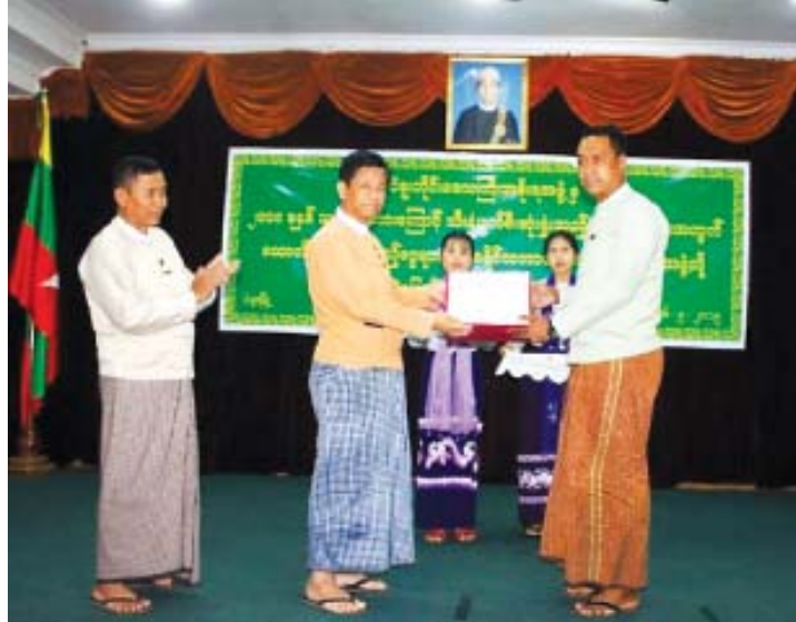
ပဲခူး စက်တင်ဘာ ၂၉

ပဲခူးတိုင်းဒေသကြီးအတွင်း မိုးရာသီကာလ သဘာဝဘေးကြောင့် ထိခိုက်ပျက်စီးခဲ့ ရသော တောင်သူများထံ ထောက်ပံ့ငွေများ ပေးအပ်ခြင်းအခမ်းအနားကို တိုင်းဒေသကြီး