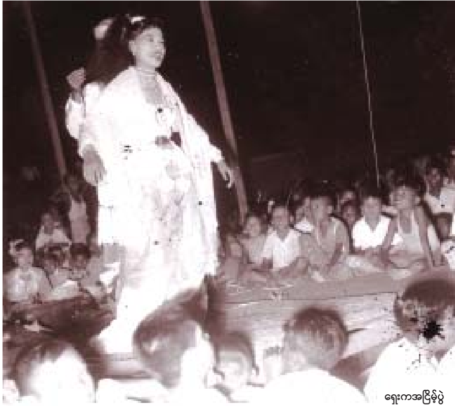
ရှေးကအငြိမ့်ပွဲ

ပါတော်မူပြီးနောက် နန်းတော်တွင်းမှာ အစဉ်အလာ အရ တီးမှုတ်ခဲ့တဲ့စည်တော်ကြီး သမားစဉ်ပညာတွေကို အဆက်ဆက် လက်ဆင့်ကမ်းသင်ကြားပြီး မင်္ဂလာ