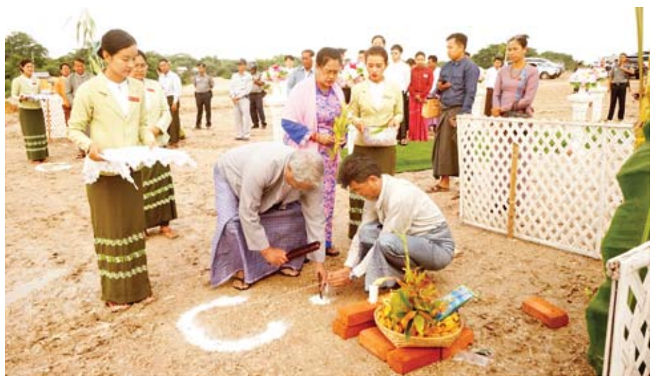
ထွန်းကိုကို(ယင်းမာပင်)

က ဆောက်လုပ်ရေးလုပ်ငန်းစဉ်များကို အသီးသီးရှင်းလင်း တင်ပြကြသည်။ ထို့နောက် တိုင်းဒေသကြီးဝန်ကြီးချုပ် ဒေါက်တာ မြင့်နိုင်နှင့် တာဝန်ရှိသူများက စီမံကိန်းဧရိယာ အတွင်းရှိ သတ်မှတ်နေရာအသီးသီး၌ ပန္နက်တင်များကို စိုက်ထူ ပေးခဲ့ကြပြီး အမွှေးနံ့သာရည်များ ပတ်ဖျန်းပေးကြ သည်။ အဆိုပါ "A star is reborn." Shwebo City" စီမံကိန်း သည် တိုင်းဒေသကြီး အစိုးရအဖွဲ့နှင့် Global Biz Link Co.,Ltd. တို့ပူးပေါင်းပြီး စစ်ကိုင်းတိုင်းဒေသကြီးအတွင်း မြို့ရွာများဖွံ့ဖြိုးတိုးတက်ရေး၊ တောင်သူလယ်သမားများ ဘဝ ဖွံ့ဖြိုးတိုးတက်ရေးနှင့် အလုပ်အကိုင်အခွင့်အလမ်း ရရှိရေးတို့ကို အဓိကရည်ရွယ်၍ ရွှေဘိုစီးပွားရေးဇုန်အဖြစ် တိုင်းဒေသကြီးအစိုးရနှင့် အကျိုးတူဆောင်ရွက်ခြင်းဖြစ် ကြောင်း သိရသည်။