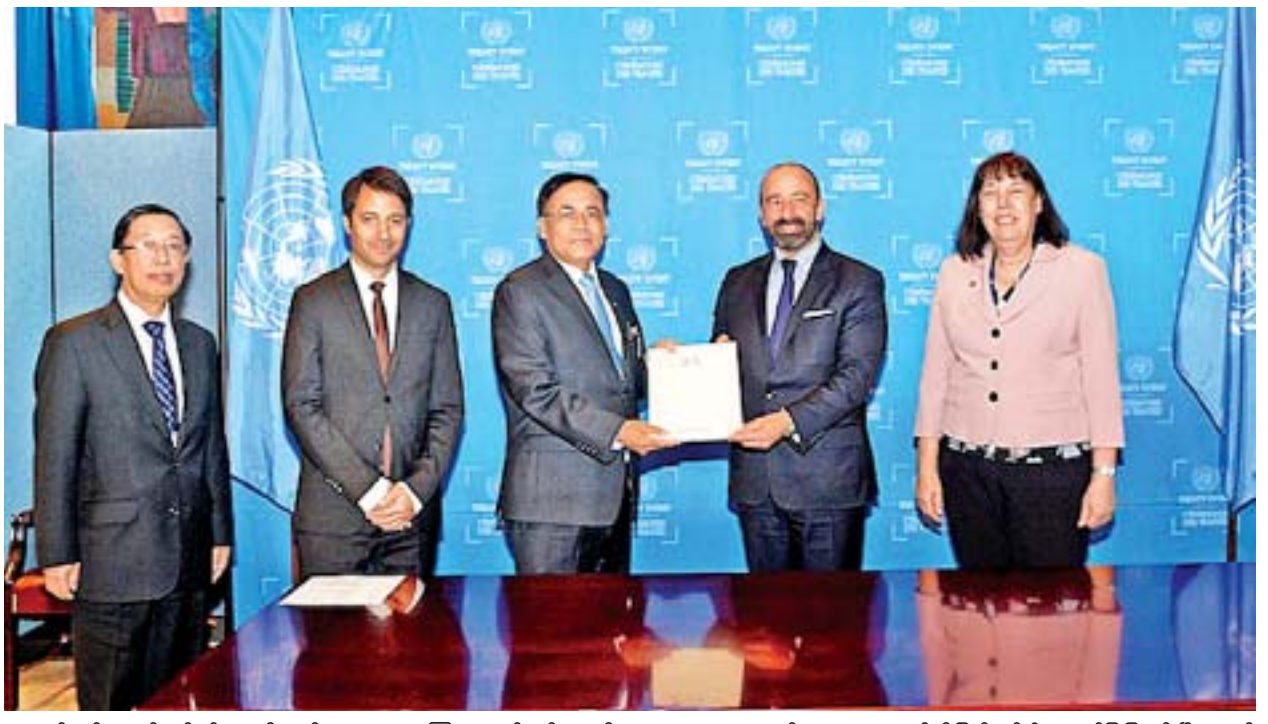
အထည်ဖော်ဆောင်ရွက်ရန် အာတီကယ် ၃(၂) အား "ကြေညာချက်"နှင့် အာတီကယ် ၄ အား "အဓိပ္ပာယ်ရှင်းလင်း ကြေညာချက်" တို့ကို ထုတ်ပြန်လျက် အတည်ပြုပါဝင်ခဲ့သည်။ မြန်မာနိုင်ငံအနေဖြင့် ၂၀၁၉ ခုနှစ် ဇူလိုင်လအတွင်း ကလေးသူငယ်အခွင့်

မြန်မာနိုင်ငံသည် အဆိုပါနောက်ဆက်တွဲ အခြေပြစာချုပ်ကို အတည်ပြုသည့် ၁၆၉ နိုင်ငံမြောက် အဖွဲ့ဝင်နိုင်ငံဖြစ်လာပြီး မြန်မာနိုင်ငံအနေဖြင့် နောက်ဆက်တွဲစာချုပ်ကို ပြည်တွင်းအခြေအနေများနှင့်လျော်ညီစွာ အကောင်