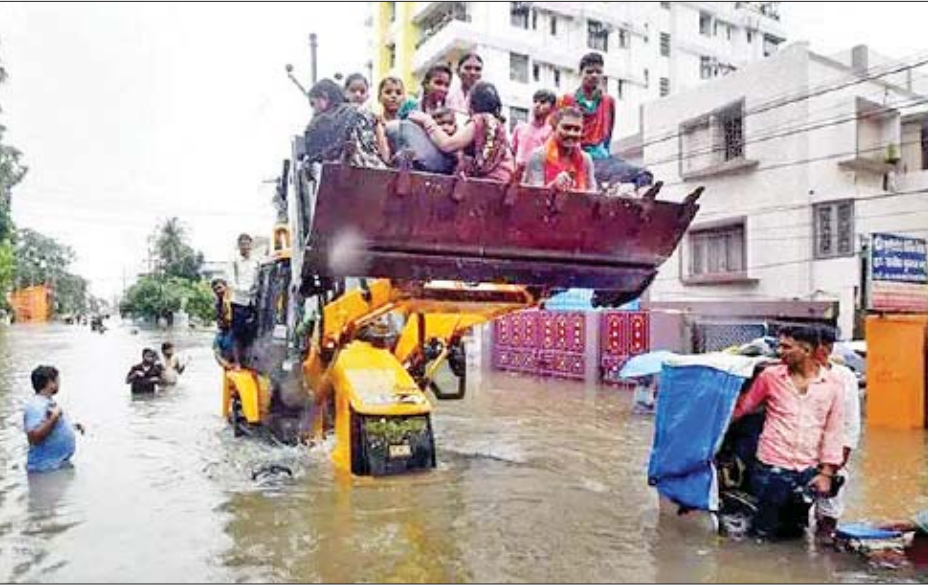
သိရသည်။ အိန္ဒိယနိုင်ငံ ဘီဟာပြည်နယ်တွင် စက်တင်ဘာ ၂၇ ရက် ကတည်းက မိုးသည်းထန်စွာ ရွာသွန်းလျက်ရှိပြီး ယင်း မိုးရွာသွန်းမှုကြောင့် ပြည်နယ် အတွင်း ဒေသအစိတ်အပိုင်း အများ အပြားတွင် ရေကြီးရေလျှံမှုများ ဖြစ်ပွားခဲ့ကြောင်း သိရသည်။ ဒေသဆိုင်ရာ အစိုးရသည် ကူညီ ကယ်ဆယ်ရေးအဖွဲ့များကို ရေကြီး ရေလျှံမှုများ ဖြစ်ပွားသည့် နေရာများ သို့ စေလွှတ်ကာ ကူညီကယ်ဆယ်ရေး လုပ်ငန်းများကို အင်တိုက်အားတိုက် လုပ်ဆောင်လျက်ရှိကြောင်း သိရ သည်။ ကိုးကား - ဆင်ဟွာ ဘာသာပြန် - ဂျေတီ

နယူးဒေလီ စက်တင်ဘာ ၂၆ မိုးသည်းထန်စွာ ရွာသွန်းမှုကြောင့် အိန္ဒိယနိုင်ငံအရှေ့ဘက် ဘီဟာ ပြည်နယ်တွင် တစ်ရက်အတွင်း လူ ၁၄ ဦး သေဆုံးခဲ့ကြောင်း ဒေသ ဆိုင်ရာ မီဒီယာများက သတင်းဖော်ပြ သည်။