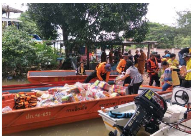
ရေကြီးမှုတွင် ပိတ်မိကျန်ရှိနေသည့် ရေဘေးဒုက္ခသည် ၂၀၆၂၀ ကို ဘေးလွတ်ရာ သို့ ရွှေ့ပြောင်းရန် သဘာဝဘေးကာကွယ်ရေး နှင့် လျှော့ချရေးဌာနအနေဖြင့် စစ်ဘက်နှင့် အရပ်ဘက်အဖွဲ့အစည်းများနှင့် ပူးပေါင်း ဆောင်ရွက်လျက်ရှိကြောင်းနှင့် ဒုက္ခသည်

အဆိုပါ အပူပိုင်းမုန်တိုင်းများနှင့် မုတ်သုံတိုက်မုန်တိုင်းကြောင့် အိမ်ထောင်စု ၄၁၅၄၄ စုကို ဘေးဒုက္ခရောက်စေခဲ့ပြီး ၃၄ ဦး သေဆုံးကာ အများအပြားဒဏ်ရာရရှိ ခဲ့ကြောင်း ၎င်းက ဆက်လက်ပြောကြားသည်။