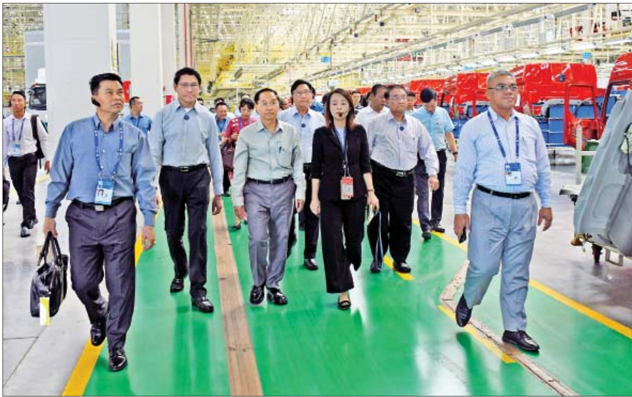
ဒုတိယသမ္မတ ဦးမြင့်ဆွေနှင့်အဖွဲ့ တွဲဖက်ဖွဲ့စည်းမော်တော်ယာဉ်ထုတ်လုပ်ရေးစက်ရုံအတွင်း လှည့်လည်ကြည့်ရှုစဉ်။

* ရှေ့ဖွဲ့မှ တုန့်ဖုန်းမော်တော်ယာဉ် ထုတ်လုပ်ရေးစက်ရုံမှ ထုတ်လုပ်ထားသည့် လုပ်ငန်းသုံးမော်တော်ယာဉ်အမျိုးမျိုးကို လှည့်လည်ကြည့်ရှုရာ တာဝန်ရှိသူများက မော်တော်ယာဉ်ထုတ်လုပ်မှုအဆင့်ဆင့်၊ စံချိန်စံညွှန်း၊ အရည်အသွေး၊ ကြံ့ခိုင်မှု၊ လုံခြုံမှု၊ တန်ဖိုးနှင့် ဈေးကွက်အခြေအနေများကို လိုက်လံရှင်းလင်းပြသကြသည်။