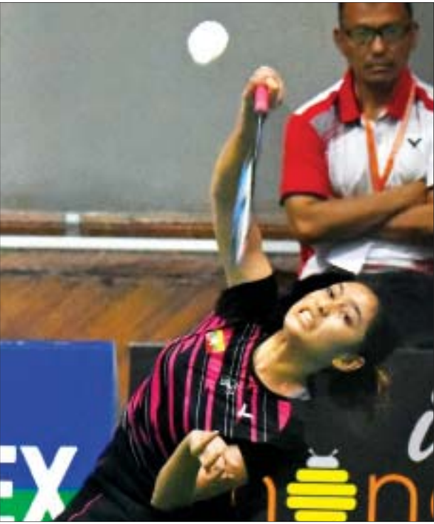
သက်ထားသူဇာကို မြန်မာနိုင်ငံ၌ ကျင်းပသည့် International Series ပြိုင်ပွဲ ယှဉ်ပြိုင်စဉ်က တွေ့ရစဉ်။

သတင်း- ရှိုင်းထက်ဇော်