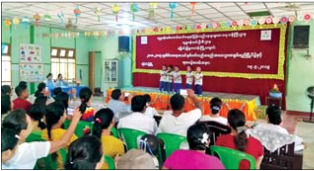
ပါဝင်ဆောင်ရွက်မှုများရရှိစေရန်ရည်ရွယ်ပြီး ကျင်းပပေးခြင်းဖြစ်ပါတယ်”ဟု မြောင်းမြခရိုင် လူမှုဝန်ထမ်းဦးစီးဌာန မူကြိုကျောင်းအုပ်ဆရာမကြီးက ပြောသည်။

မြောင်းမြ စက်တင်ဘာ ၁၉ ဧရာဝတီတိုင်းဒေသကြီး လူမှုဝန်ထမ်းဦးစီးဌာန မြောင်းမြမြို့နယ်ကြိုကျောင်း၌ ၂၀၁၈-၂၀၁၉ ပညာသင်နှစ် မိဘဆရာအသင်း နှစ်ပတ်လည်စည်းဝေးပွဲနှင့် ရင်သွေးငယ်များ၏ ကာယ၊ ဉာဏ၊ စွမ်းရည်ပြိုင်ပွဲနှင့် ဆုပေးပွဲအခမ်းအနားကို ယနေ့ နံနက် ၉ နာရီက ကျင်းပသည်။ အဆိုပါအခမ်းအနားတွင် မူကြိုကလေးငယ်များက တစ်ဦးချင်း ကဗျာရွတ်ဆိုခြင်း၊ ပုံပြောပြိုင်ပွဲ၊ အငယ်ဆင့် အဖွဲ့လိုက် စုပေါင်းသီချင်း ဆိုခြင်းတို့ကို ယှဉ်ပြိုင်ခဲ့ကြပြီး ဆုရရှိသောကလေးငယ်များကို တာဝန်ရှိသူ များက ဆုများ ချီးမြှင့်ပေးခဲ့ကြသည်။ “ရင်သွေးငယ်သားသမီးလေးတွေကို လူအများရှေ့မှာ ရဲရဲဝံ့ဝံ့ ပြောဆို တတ်စေရေး၊ ထူးချွန်ထက်မြက်ပြီး ကာယ၊ ဉာဏ၊ စာရိတ္တ ဘက်စုံဖွံ့ဖြိုးစေရေး နဲ့ ကလေးတိုင်းမှာ စွမ်းရည်ရှိကြောင်း၊ ကလေးသူငယ်အခွင့်အရေးဖြစ်သော