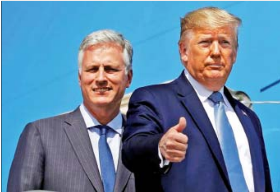
ဌာန၏ ဓားစာခံလွတ်မြောက်ရေးကိစ္စရပ်များကို ဆောင်ရွက် ခဲ့ပြီးနောက် ယခုကဲ့သို့ အမျိုးသားလုံခြုံရေးအကြံပေး အရာရှိအဖြစ် ရွေးချယ်ခံရခြင်းဖြစ်သည်။

အိုဘာရီယန်သည် အမေရိကန် နိုင်ငံခြားရေးဝန်ကြီး