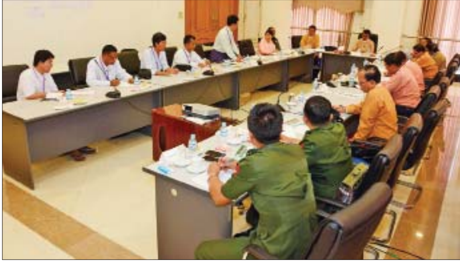
နိုင်ငံသားများ၏ မူလအခွင့်အရေးဆိုင်ရာကော်မတီနှင့် ဆေးဘက်ဆိုင်ရာဓာတ်ခွဲပညာရှင်များ လူမှုရေးအသင်းတို့ တွေ့ဆုံဆွေးနွေးစဉ်။

နိုင်ငံတကာလူ့အခွင့်အရေး စံနှုန်းတွေကို များများ ဖြည့်ဆည်းနိုင်ခြင်းကြောင့် နိုင်ငံပုံရိပ် ပိုမိုတိုးတက် ကောင်းမွန်လာပြီး နိုင်ငံရဲ့ နိုင်ငံရေး၊ စီးပွားရေး၊ လူမှုရေး၊ နိုင်ငံတကာဆက်ဆံရေး ပိုမိုကောင်းမွန်ဖွံ့ဖြိုးလာမှာ ဖြစ်တဲ့အတွက် နိုင်ငံသားအားလုံး ကြိုးစားအကောင်အထည် ဖော်ရမှာဖြစ်