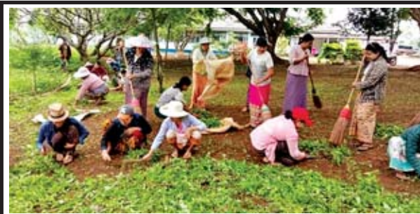
(၅၅)နှစ်မြောက် မြန်မာနိုင်ငံရဲတပ်ဖွဲ့နေ့ကို ကြိုဆိုရက်ပြုသောအားဖြင့် စက်တင်ဘာ ၁၇ ရက်က ကျောက်မဲခရိုင် နောင်ချိုမြို့နယ်ရဲတပ်ဖွဲ့မှ တပ်ဖွဲ့ဝင်များ၊ မိသားစုဝင်များ စုစုပေါင်းအင်အား ၆၅ ဦးတို့က မြို့နယ် ပြည်သူ့ဆေးရုံဝင်းအတွင်း စုပေါင်းသန့်ရှင်းရေး ဆောင်ရွက်စဉ်။ မြို့နယ် (ပြန်/ဆက်)