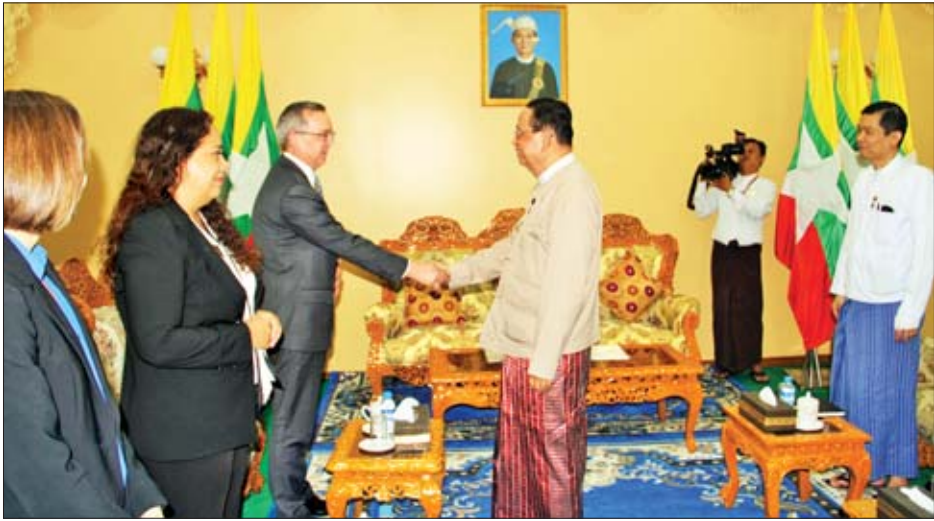
ပူးပေါင်းဆောင်ရွက်မည့်ကဏ္ဍများ၊ အမြစ်ဖွံ့ဖြိုးတိုးတက်မှုဖြင့်တင်ရေး နိုင်ရေးကိစ္စနှင့်စပ်လျဉ်း၍ ညှိနှိုင်း နည်းပညာဆိုင်ရာနှင့် လူသားအရင်း အတွက် ပံ့ပိုးပေးဆောင်ရွက် ဆွေးနွေးခဲ့ကြသည်။ သတင်းစဉ်

နေပြည်တော် စက်တင်ဘာ ၁၇ လျှပ်စစ်နှင့် စွမ်းအင်ဝန်ကြီးဌာန ပြည်ထောင်စုဝန်ကြီး ဦးဝင်းခိုင်သည် မြန်မာနိုင်ငံဆိုင်ရာ အမေရိကန်နိုင်ငံ သံအမတ်ကြီး မစ္စတာ စကော့ မာစီရယ်အား ယနေ့ မွန်းလွဲ ၂ နာရီ တွင် လျှပ်စစ်နှင့် စွမ်းအင်ဝန်ကြီးဌာန ရုံးအမှတ် (၂၇) ပြည်ထောင်စုဝန်ကြီး ၏ ဧည့်ခန်းမ၌ လက်ခံတွေ့ဆုံ သည်။