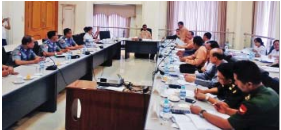
နိုင်ငံသားများ၏ မူလအခွင့်အရေးဆိုင်ရာကော်မတီ၏ လုပ်ငန်းညှိနှိုင်းအစည်းအဝေးကျင်းပစဉ်။