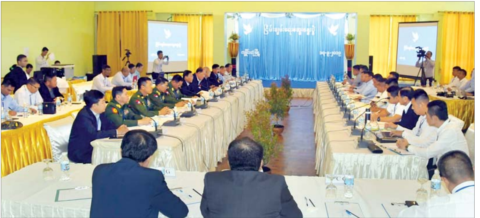
အမျိုးသားပြန်လည်သင့်မြတ်ရေးနှင့် ငြိမ်းချမ်းရေးဗဟိုဌာန (NRPC) ကိုယ်စားလှယ်အဖွဲ့နှင့် KIO၊ MNTJF၊ PSLF၊ ULA တို့ ပစ်ခတ်တိုက်ခိုက်မှု ရပ်စဲရေးသဘောတူညီချက် လက်မှတ်ရေးထိုးနိုင်ရေးအတွက် အစည်းအဝေးကျင်းပစဉ်။

ကျိုင်းတုံ စက်တင်ဘာ ၁၇ အမျိုးသားပြန်လည်သင့်မြတ်ရေးနှင့် ငြိမ်းချမ်းရေးဗဟိုဌာန (NRPC) ကိုယ်စားလှယ်အဖွဲ့နှင့် KIO (ကချင်ပြည်လွတ်မြောက်ရေးအဖွဲ့)၊ MNTJF (မြန်မာနိုင်ငံ အမှန်တရားနှင့် တရားမျှတသော အမျိုးသားပါတီ)၊ PSLF (ပလောင်ပြည်နယ် လွတ်မြောက်ရေးတပ်ဦး) နှင့် ULA (ရခိုင်အမျိုးသားအဖွဲ့ချုပ်) တို့သည် ယနေ့နံနက် ၁၀ နာရီက ရှမ်းပြည်နယ် ကျိုင်းတုံမြို့ရှိ Amazing Kengtong Resort တွင် တွေ့ဆုံ၍ ပစ်ခတ်တိုက်ခိုက်မှုရပ်စဲရေး သဘောတူညီချက် (Bilateral Ceasefire Agreement) လက်မှတ်ရေးထိုးနိုင်ရေးနှင့်ပတ်သက်၍ အစည်းအဝေး ကျင်းပသည်။