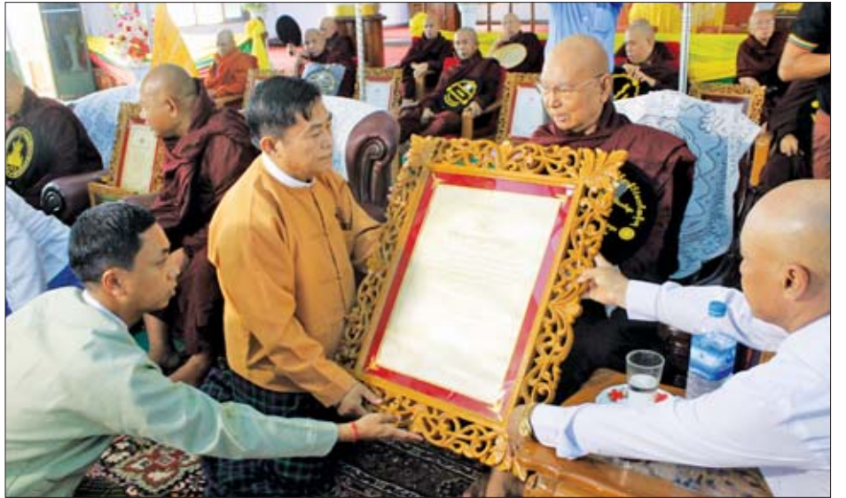
တစ်ပါး၊ ဂန္ထဝါစကပဏ္ဍိတဘွဲ့ဆရာတော် သုံးပါးနှင့် သီလရှင် တစ်ပါး၊ သဒ္ဓမ္မဇောတိကဇောဘွဲ့ တစ်ပါး၊ ကမ္မဋ္ဌာနာစရိယဘွဲ့ နှစ်ပါး၊ မဟာကမ္မဋ္ဌာနာစရိယဘွဲ့ တစ်ပါး၊ စုစုပေါင်း ရဟန်း ၁၉ ပါးနှင့် သီလရှင် တစ်ပါး ရရှိခဲ့ကြောင်း သိရ သည်။

ပဲခူးတိုင်းဒေသကြီးအတွင်းမှ ၂၀၁၉ ခုနှစ် သာသနာ တော်ဆိုင်ရာ ဘွဲ့တံဆိပ်တော်ရရှိမှုအနေဖြင့် အဂ္ဂမဟာ ပဏ္ဍိတဘွဲ့ သုံးပါး၊ အဂ္ဂမဟာသဒ္ဓမ္မဇောတိကဇောဘွဲ့ တစ်ပါး၊ အဂ္ဂမဟာဂန္ထဝါစက ပဏ္ဍိတဘွဲ့ နှစ်ပါး၊ မဟာဂန္ထ ဝါစက ပဏ္ဍိတဘွဲ့ လေးပါး၊ မဟာသဒ္ဓမ္မဇောတိကဇောဘွဲ့