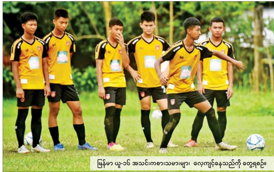
မြန်မာ ယူ-၁၆ အသင်းကစားသမားများ လေ့ကျင့်နေသည်ကို တွေ့ရစဉ်။

၂၀၂၀ အာရှ ယူ-၁၆ ခြေစစ်ပွဲ အုပ်စု(K) ပွဲစဉ်များကို စက်တင်ဘာ ၁၈ ရက်မှ ၂၂ ရက်အထိ ရန်ကုန်မြို့ရှိ သုဝဏ္ဏကွင်း၌ ကျင်းပမည်ဖြစ်ပြီး မြန်မာ၊ တောင်ကိုရီးယား၊ ထိုင်းနှင့် တရုတ်(တိုင်ပေ) တို့ ယှဉ်ပြိုင်ကစားမည်ဖြစ်သည်။