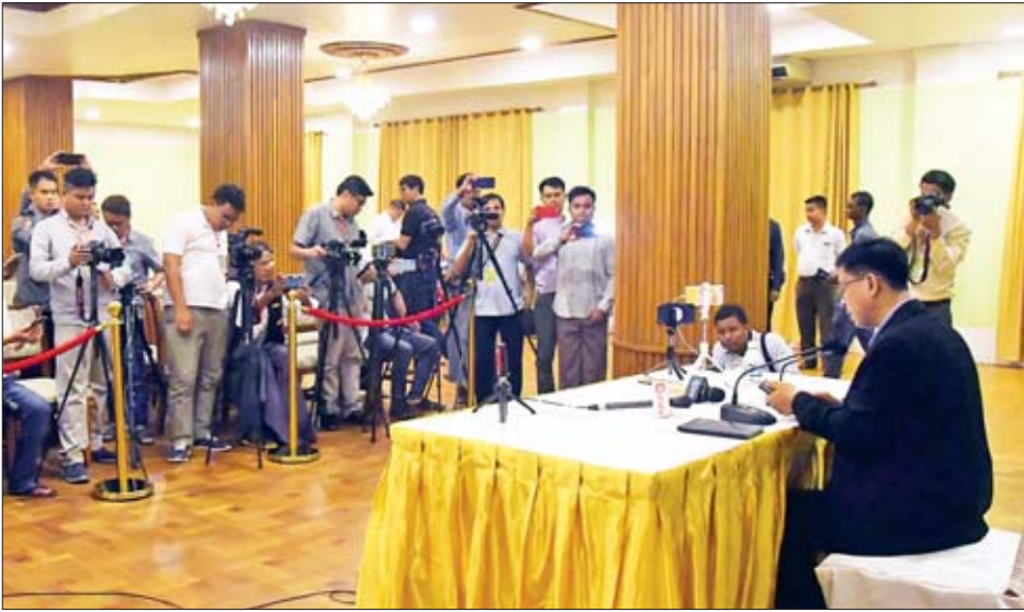
နိုင်ငံတော်အတိုင်ပင်ခံရုံးဝန်ကြီးဌာန ညွှန်ကြားရေးမှူးချုပ် ဦးဇော်ဌေး ပြည်တွင်း၊ ပြည်ပ မီဒီယာများ၏ မေးမြန်းမှုများကို ဖြေကြားစဉ်။

နှစ်ပတ်လည်ပွဲ လုပ်ဖို့ရှိပါတယ်။ နောက်အချက်က ကျွန်တော်တို့ လက်မှတ်ရေးထိုးထားတဲ့အဖွဲ့တွေနဲ့ ၂၀ ရာစု ပင်လုံညီလာခံလုပ်ငန်းစဉ်တွေ ပြန်လည်စတင်ဖို့ ဆွေးနွေးနေတာတွေရှိပါတယ်။ ပြန်တွေ့ဖို့လည်း ရှိပါတယ်။ နောက်တစ်ပိုင်းကတော့ UPDJC အတွင်းရေးမှူးအဖွဲ့တွေ ပြည်ပလေ့လာရေးခရီးသွားဖို့ရှိတယ်။ အဲဒီရက်တွေနဲ့ ချိန်ပြီး ဘယ်ရက်၊ ဘယ်ကာလဆိုတာ သူ့ဘက်ကိုယ့်ဘက် အဆင်ပြေမယ့်နေရာကို ပြန်ပြီးညှိကြမယ်ဆိုပြီး နောက် တစ်ချိန် ပြန်တွေ့ဖို့ ကျွန်တော်တို့ သဘောတူကြပါတယ်။ အတိုချုပ်အားဖြင့်တော့ ဒီနေ့ လေးကြိမ်မြောက် အစည်း အဝေးမှာ သဘောတူညီချက် ခုနစ်ချက်ကို ရရှိတယ်။ ပြီးခဲ့တဲ့ အစည်းအဝေးမှာတော့ ကျွန်တော်တို့ ပူးတွဲ ထုတ်ပြန်ကြေညာချက်ထုတ်ပြန်ခဲ့ပေမယ့် တကယ်ရေဆက် ပြီးတော့သွားမယ့် လုပ်ငန်းစဉ်တွေနဲ့ပတ်သက်လို့ အကျေ အလည်ဆွေးနွေးပြီး သဘောတူညီချက်တွေ ချမှတ်နိုင်တဲ့ အတွက် ယေဘုယျခြုံငုံပြီးပြောရင် အပြုသဘော ဆောင်တယ်။ တဖြည်းဖြည်းချင်းနဲ့ ကျွန်တော်တို့ ကြားမှာ တွေ့ဆုံဆွေးနွေးမှုတွေ စိပ်လာတာနဲ့အမျှ နှစ်ဖက် နားလည်မှုကလည်း ပိုပြီးမြင့်တက်လာတယ်။ ရင်းရင်း နီးနီး ပွင့်ပွင့်လင်းလင်း ဆွေးနွေးကြတယ်ဆိုတဲ့ သဘော ကျွန်တော်တို့ တွေ့ပါတယ်။