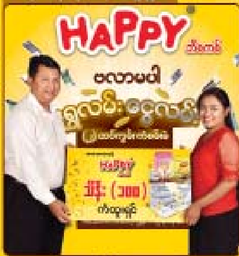
မတနုဦး (မန္တလေး) HB-XCD-CPJ-BKXU