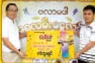
ကိုကျော်ကျော် (ရန်ကင်း) HB-7BJ-45A-KTXK