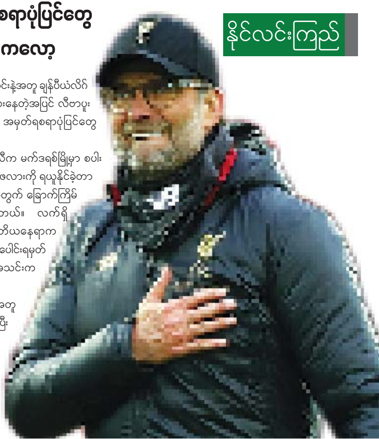
နိုင်လင်းကြည်

လီဗာပူးအသင်းနည်းပြ ကလော့ဟာ လီဗာပူးအသင်းနဲ့အတူ ချန်ပီယံလိဂ် ဖလားကို ခုနှစ်ကြိမ်မြောက်ရယူနိုင်ဖို့ ပစ်မှတ်ထားနေတဲ့အပြင် လီဗာပူး ကစားသမားတွေကိုလည်း အနာဂတ်ကာလမှာ အမှတ်ရစရာပုံပြင်တွေ ဖန်တီးဖို့ တောင်းဆိုလိုက်တယ်လို့ သိရပါတယ်။ ကလော့ရဲ့လီဗာပူးအသင်းဟာ ပြီးခဲ့တဲ့ရာသီက မက်ဒရစ်မြို့မှာ စပါး အသင်းကို နှစ်ဂိုးပြတ်နဲ့ အနိုင်ရရှိပြီး ချန်ပီယံလိဂ်ဖလားကို ရယူနိုင်ခဲ့တာ ဖြစ်ပါတယ်။ အဲဒီဖလားဟာ လီဗာပူးအသင်းအတွက် ခြောက်ကြိမ် မြောက်ရရှိခဲ့တဲ့ ဥရောပဖလားလည်းဖြစ်ပါတယ်။ လက်ရှိ ပရီမီယာလိဂ် အမှတ်ပေးဇယားမှာလည်း ဒုတိယနေရာက မန်စီးတီးအသင်းကို ငါးမှတ်အထိဖြတ်ထားပြီး စုစုပေါင်းရမှတ် ၁၅ မှတ်နဲ့ အမှတ်ပေးဇယားကို လီဗာပူးအသင်းက ဦးဆောင်နေခဲ့တာ ဖြစ်ပါတယ်။ နည်းပြ ကလော့ဟာ လီဗာပူးအသင်းနဲ့အတူ စာချုပ်သက်တမ်းက ၂၀၂၂ ခုနှစ်မှာ ကုန်ဆုံးမှာဖြစ်ပြီး လက်ရှိအချိန်အထိ အောင်မြင်မှုတွေ ရယူနိုင်ခဲ့ ဖြစ်နေတာမို့ လီဗာပူးအသင်းနည်းပြအဖြစ် ဆက်လက်တာဝန်ယူသွားဖို့ ရှိတယ်လို့လည်း ဆိုပါတယ်။ ဒါပေမယ့် လီဗာပူးအသင်းဟာ ဥရောပရဲ့ အကောင်းဆုံးအသင်းမဟုတ်ဘူးလို့ လည်း ကလော့က ပြောခဲ့ပါတယ်။