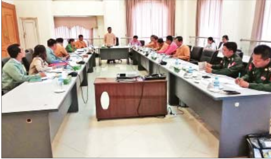
နိုင်ငံသားများ၏ မူလအခွင့်အရေးဆိုင်ရာကော်မတီနှင့် ပြည်ထောင်စုရွေးကောက်ပွဲကော်မရှင်တို့ ဆွေးနွေးစဉ်။

နိုင်ငံတကာကွန်ဗင်းရှင်းတွေ၊ နိုင်ငံတကာသဘောတူ စာချုပ်တွေနဲ့ ကိုက်ညီအောင်လည်း ဆွေးနွေးပေးရပါ တယ်။ ကော်မတီမှာ တိုင်ကြားစာတွေလည်း ရှိပါတယ်။ တိုင်ကြားစာတွေအပေါ်မှာ ကော်မတီဝင်တွေက ခွဲဝေပြီး