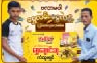
ကိုဦးကျော် (မန္တလေး) HB-8LU-058-03TR