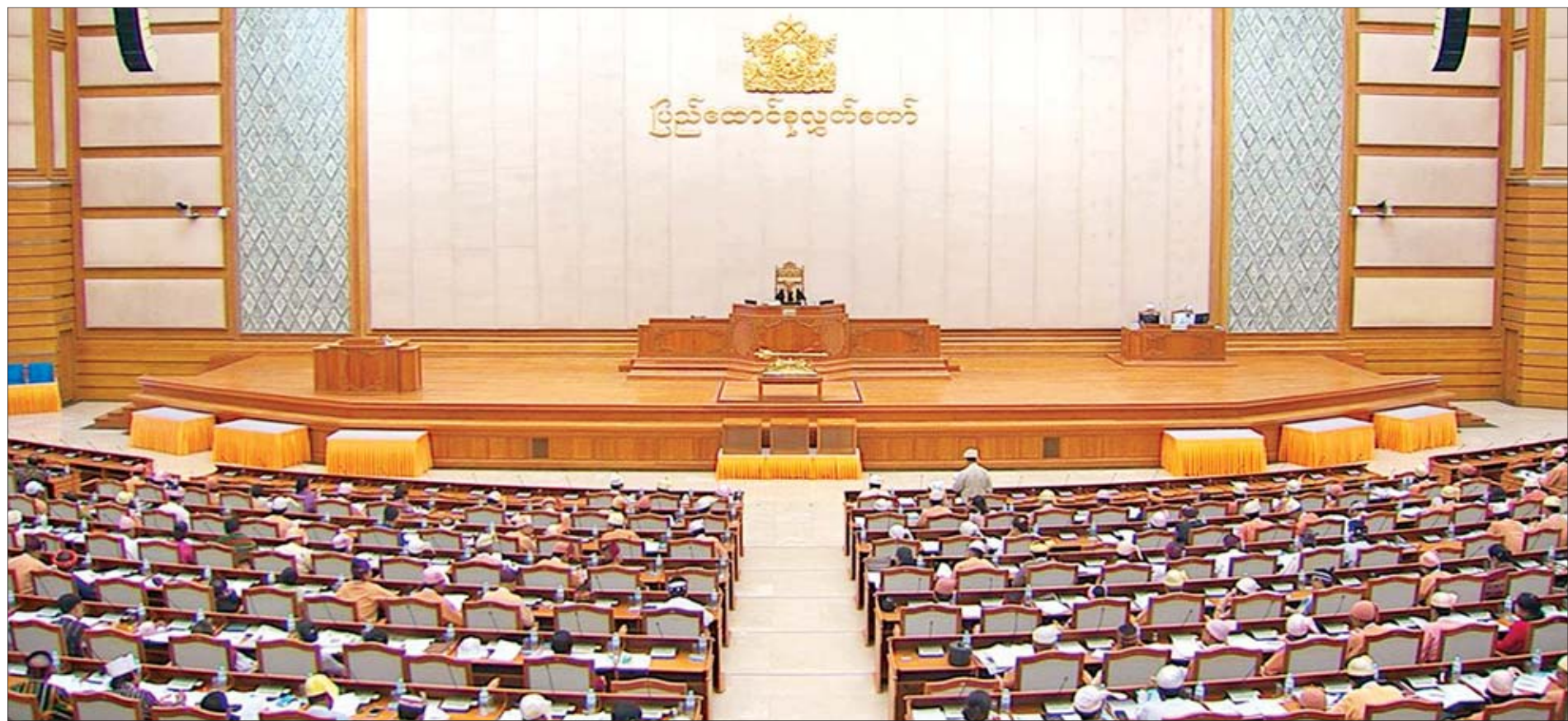
ဒုတိယအကြိမ် ပြည်ထောင်စုလွှတ်တော် (၁၃)ကြိမ်မြောက် ပုံမှန်အစည်းအဝေး (၂၄) ရက်မြောက်နေ့ ကျင်းပစဉ်။

ကိုယ်စားလှယ် ဗိုလ်မှူးချုပ်မောင်မောင် အပါအဝင် တပ်မတော်သားလွှတ်တော် ကိုယ်စားလှယ် ၁၄၄ ဦးက လက်မှတ်ရေးထိုးပြီး ပေးပို့တင်ပြထားသည့် ဖွဲ့စည်းပုံအခြေခံဥပဒေကို ဒုတိယအကြိမ် ပြင်ဆင်သည့် ဥပဒေမူကြမ်းတစ်ရပ်အား ၂၀၁၉ ခုနှစ် စက်တင်ဘာ ၁၀ ရက်တွင် စာမျက်နှာ ၃ ကော်လံ ၁ သို့ *