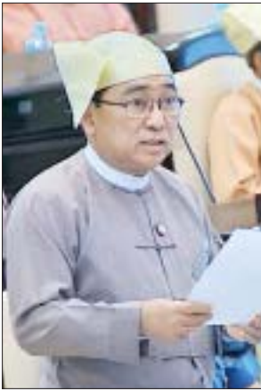
ပြည်ထောင်စုဝန်ကြီး ဒေါက်တာဝင်းမြတ်အေး

ကျေးလက်ဒေသဖွံ့ဖြိုးတိုးတက်ရေးဦးစီးဌာနအနေဖြင့် တိုက်ပွဲရှောင် ဒေသများ အပါအဝင် ရခိုင်ပြည်နယ်အတွင်း ၂၀၁၈-၂၀၁၉ ဘဏ္ဍာနှစ်တွင် ငွေလုံးငွေရင်း ရန်ပုံငွေကျပ်သန်း ၂၁၀ ဖြင့် ကျေးလက်အိမ်ရာအလုံး ၃၀၀ ကို ပြည်နယ်အစိုးရအဖွဲ့၏ အစီအမံဖြင့် အကောင်အထည်ဖော်ဆောင်ရွက်ပေးလျက်ရှိပါကြောင်း၊ ပြည်ထဲရေးဝန်ကြီးဌာနအနေဖြင့် ရခိုင်ပြည်နယ်အတွင်းတိုက်ပွဲများဖြစ်ပွားမှုကြောင့် တိုက်ပွဲရှောင် ယာယီစုရပ်များတွင် သွားရောက်နိုလုံနေကြသည့် တိုက်ပွဲရှောင်တိုင်းရင်းသားများ ဘေးကင်းလုံခြုံရေးအတွက် ရခိုင်ပြည်နယ်ရဲတပ်ဖွဲ့ အမှတ်(၁၊ ၂၊ ၃)၊ နယ်ခြားစောင့်ရဲကွပ်ကဲမှုအဖွဲ့နှင့် လုံခြုံရေးရဲတပ်ဖွဲ့များအနေဖြင့် နယ်မြေတည်ငြိမ်အေးချမ်းရေးနှင့် လုံခြုံရေး၊ တရားဥပဒေစိုးမိုးရေး၊ ရပ်ရွာအေးချမ်းသာယာရေးတို့ကို ဆောင်ရွက်ပေးလျက်ရှိပါကြောင်း။