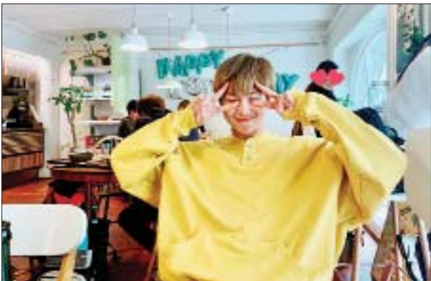
ရေးသားဖော်ပြခဲ့ကြသလို လူ့ဒါန်းမှုတွေလည်း ပြုလုပ်ပေးခဲ့ကြကြောင်း သိရပါတယ်။ တောင်ကိုရီးယားနဲ့ ဖိလစ်ပိုင်က ပရိသတ်တွေက သစ်ပင်စိုက်တဲ့ အဖွဲ့အစည်းတွေကို စတင်ဖွဲ့စည်းခဲ့ကြတယ်လို့လည်း သိရပါတယ်။

တောင်ကိုရီးယားရဲ့ ကျော်ကြားတဲ့ အမျိုးသားတေးဂီတအဖွဲ့တစ်ဖွဲ့ဖြစ်တဲ့ "BTS" ရဲ့အဖွဲ့ဝင်တစ်ဦးဖြစ်သူ RM က သူ့ရဲ့မွေးနေ့အပြီးမှာ ပရိသတ်တွေကို ကျေးဇူးတင်ကြောင်း လက်ရေးနဲ့ ရေးသားဖော်ပြခဲ့တဲ့ စာတစ်စောင်အတွင်း ထည့်သွင်းရေးသားဖော်ပြခဲ့တယ်လို့ အီးအွန်လိုင်းဒေါ့ကွန်းရဲ့ ရေးသား ဖော်ပြချက်တွေအရ သိရပါတယ်။ ပြီးခဲ့တဲ့ စက်တင်ဘာ ၁၁ ရက်မှာ RM ဟာ ၂၅ နှစ်ပြည့်ခဲ့တာ ဖြစ်ပါတယ်။ သူ့ရဲ့မွေးနေ့ပွဲအတွက် ပရိသတ်တွေကို ကျေးဇူးတင်ကြောင်း စက်တင်ဘာ ၁၂ ရက်မှာ RM က သူ့ရဲ့ လူမှုကွန်ရက်စာမျက်နှာ တွစ်တာ ပေါ်မှာ လက်ရေးနဲ့ရေးသားဖော်ပြခဲ့တဲ့ စာတစ်စောင်အတွင်း ထည့်သွင်း ရေးသားဖော်ပြခဲ့ပါတယ်။ ဒါ့အပြင် RM က သူ့ရဲ့ မွေးနေ့မှာ မိဘတွေကို ကျေးဇူးတင်ရှိကြောင်းလည်း ထည့်သွင်းရေးသားဖော်ပြခဲ့ပါတယ်။ RM ရဲ့မွေးနေ့မှာ ဒေသတွင်းက ပရိသတ်တွေသာမက ကမ္ဘာတစ်ဝန်းက ပရိသတ်တွေကပါ မွေးနေ့အမှတ်တရတွေ ပြုလုပ်ပေးခဲ့ကြပါတယ်။ မွေးနေ့ ဆုတောင်းစကားတွေကို လူမှုကွန်ရက်စာမျက်နှာတွေပေါ်ကနေတစ်ဆင့်