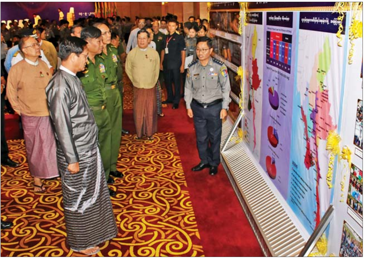
ဒုတိယသမ္မတ ဦးဟင်နရီဇန်ထီးယူ သတ္တမအကြိမ်မြောက် မြန်မာနိုင်ငံလူကုန်ကူးမှုတိုက်ဖျက်ရေးအဖွဲ့အစည်းအဖွဲ့ဝင်များကို လှည့်လည်ကြည့်ရှုစဉ်။

လူကုန်ကူးမှုဖြစ်စဉ်များတွင် ပြောင်းလဲသွားသည့် အခြေအနေများကို တွေ့ရှိရပြီး နှစ်စဉ်သိသိသာသာလျော့ပါးသွားခြင်းမရှိဘဲ ဆက်လက်ဖြစ်ပွား