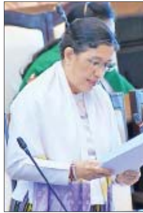
ဒုတိယဝန်ကြီး ဒေါက်တာမြလေးစိန်