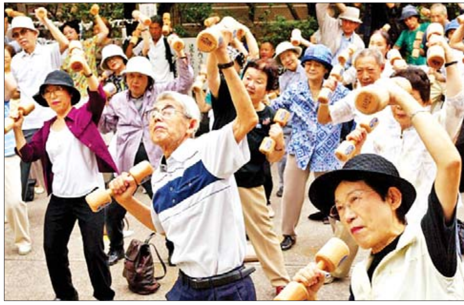
အသက်အကြီးဆုံး အမျိုးသမီးမှာ နိုင်ငံအနှောက်အဖျားအို ကာနဲတာနာကာဖြစ်ပြီး အသက်အကြီးဆုံးအမျိုးသားမှာ နီအိဂျီတာခရိုင် ဂျေးအဲဆုမြို့မှ အသက်

ယင်းအရေအတွက်သည် ယမန်နှစ်က ကောက်ယူရရှိသည့် အသက် ၁၀၀ နှင့်အထက် ဘိုးဘွားများဦးရေထက် ၁၄၅၃ ဦး ပိုမိုများပြားလာခြင်းဖြစ်ပြီး အသက် ၁၀၀ ကျော် ဘိုးဘွားများထဲတွင် အမျိုးသမီးသက်ကြီးရွယ်အိုများမှာ ၈၈ ရာခိုင်နှုန်းဖြစ်ကြောင်း ကျန်းမာရေးဝန်ကြီးဌာနက ပြောကြားသည်။