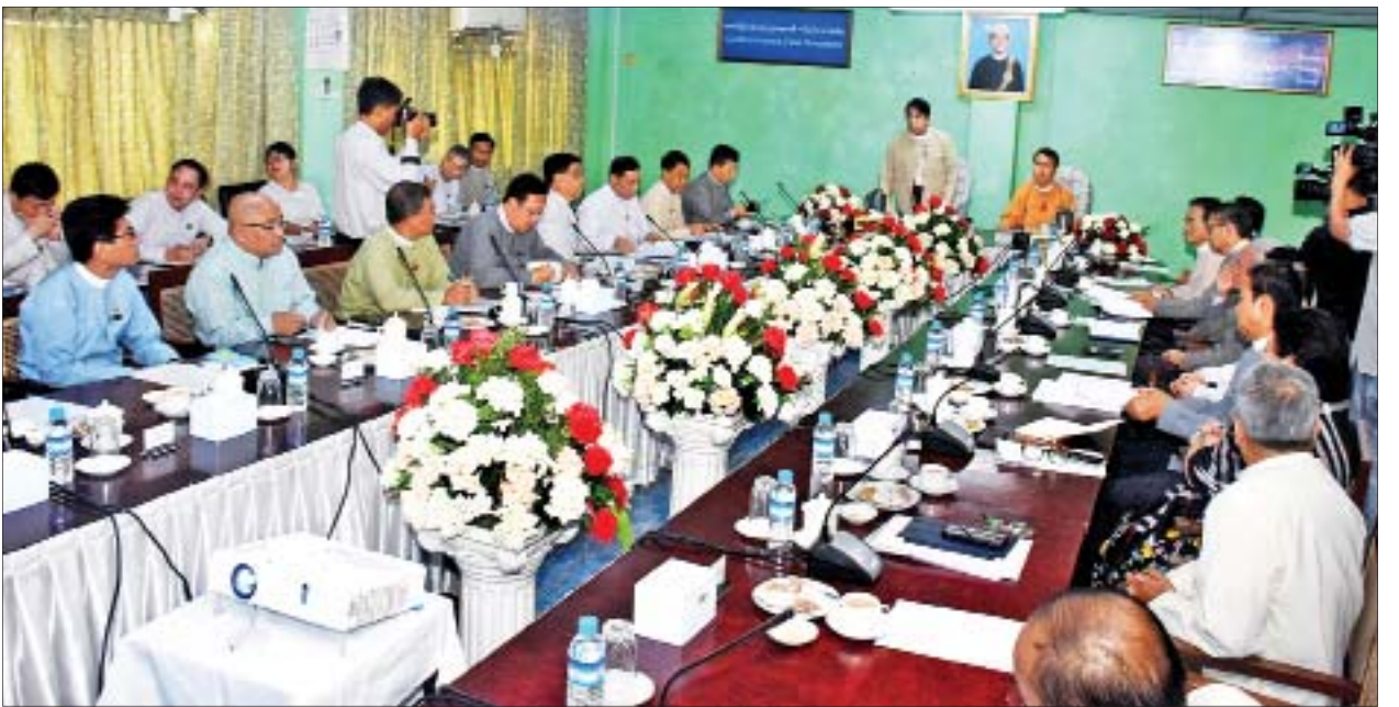
ပြည်ထောင်စုဝန်ကြီး ဒေါက်တာဖေမြင့် မြန်မာ့ရုပ်ရှင် ရာပြည့်အခမ်းအနားကျင်းပနိုင်ရေး ယာယီကော်မတီ၏ လုပ်ငန်းညှိနှိုင်းအစည်းအဝေးတွင် ဆွေးနွေးပြောကြားစဉ်။

ရှေးဦးစွာ မြန်မာ့ရုပ်ရှင် ရာပြည့်အခမ်းအနားကျင်းပနိုင်ရေး ယာယီ ကော်မတီဥက္ကဋ္ဌ ပြည်ထောင်စုဝန်ကြီး ဒေါက်တာဖေမြင့်က မြန်မာ့ရုပ်ရှင် ရာပြည့်အခမ်းအနားကျင်းပနိုင်ရေး ယာယီကော်မတီကို ယခုနှစ် ဩဂုတ်လ တွင် ဖွဲ့စည်းခဲ့ပြီး လုပ်ငန်းတာဝန်(၄)ရပ် သတ်မှတ်ဆောင်ရွက်နေခြင်း ဖြစ်ကြောင်း၊ အဆိုပါ အခမ်းအနားကျင်းပနိုင်ရေးအတွက် ဦးစီးကော်မတီ၊ လုပ်ငန်းကော်မတီနှင့် ဆပ်ကော်မတီများဖွဲ့စည်းနိုင်မီ ယာယီကော်မတီမှ ဦးစွာဆောင်ရွက်ခြင်းဖြစ်ကြောင်း၊ မြန်မာ့ရုပ်ရှင် ရာပြည့်အချိန်အခါ ရောက်ရှိချိန်တွင် မိမိတို့ ပါဝင်ဆောင်ရွက်ခွင့်ရရှိခြင်းအပေါ် ဂုဏ်ယူတန်ဖိုး ထားပြီး ဆောင်ရွက်ကြရမည်ဖြစ်ကြောင်း၊ ယခင်ကျင်းပပြီးစီးခဲ့သည့် မြန်မာ့ရုပ်ရှင် ငွေရတု၊ ရွှေရတု၊ စိန်ရတု အခမ်းအနား ကျင်းပမှုမှတ်တမ်းများသည် ယခုကျင်းပမည့် မြန်မာ့ရုပ်ရှင် ရာပြည့်အခမ်းအနားအတွက် များစွာအထောက် အပံ့ဖြစ်ပါကြောင်း၊ ယခင် ဆောင်ရွက်မှုများကို နမူနာယူဆောင်ရွက်မှုအပြင် နိုင်ငံတကာတွင် ကျင်းပနေသည့် ယခုကဲ့သို့ ပွဲတော်ကျင်းပမှုများကိုလည်း လေ့လာဆောင်ရွက်ကြရမည်ဖြစ်ကြောင်း၊ နှစ်တစ်ရာသက်တမ်းတစ်လျှောက် တွင် ထူထောင်တည်ဆောက်ခဲ့ကြသည့် ဘိုးဘေးမိဘများက ပေးခဲ့သော ရုပ်ရှင်အမွေအနှစ်များကို အလေးထားပြီး ယခုကျင်းပမည့်ပွဲတော်တွင် ပါဝင်