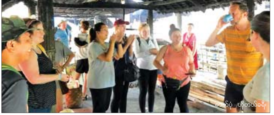
ခေတ်ပုံ - တိုက်လယ်ခရီး

လန်တောင်းဘုရားသို့ နေ့ချင်းပြန် ထိုင်းနိုင်ငံသား ၂၈၇ ဦး၊ မိုင်းဖုန်း နေ့ ချင်းပြန်ခရီးစဉ်အဖြစ် ထိုင်းနိုင်ငံသား ၁၁၃ ဦး၊ မိုင်းဖြတ်နှင့် ကျိုင်းတုံခရီး စဉ်တွင် ၇၈၈၅ ဦး၊ ဗီဇာ (ဗီဇာကင်း လွတ်ခွင့်)ဖြင့် ပြည်တွင်းခရီးစဉ်သို့ ၄၄၄၄၄ ဦး စုစုပေါင်း နိုင်ငံခြားသား ခရီးသွားဧည့်သည် ၈၆၄၆၆၁ ဦး ဝင် ရောက်လည်ပတ်ခဲ့ကြောင်း သိရ သည်။ ဝေယံလင်း(ပြန်/ဆက်)