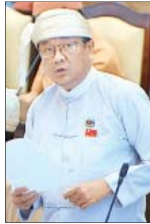
မွန်ပြည်နယ် မဲဆန္ဒနယ်အမှတ်(၉)မှ ဒေါက်တာဇော်လင်းထွဋ်

လွှတ်တော်ကိုယ်စားလှယ်၏ မေးခွန်းနှင့်စပ်လျဉ်း၍ တိုက်ပွဲရှောင်စခန်းများ စုရပ်များတွင် ရောက်ရှိနိုလုံနေသော တိုက်ပွဲရှောင် ပြည်သူများ မိမိမူလ နေထိုင်ခဲ့သော ဒေသများသို့ပြန်သွားနိုင်ရေး လုံခြုံရေးအခြေအနေအရ တည်ငြိမ်အေးချမ်းပြီးဖြစ်သော မူလနေထိုင်ခဲ့ရာ နေရာများစာရင်းကို ပြုစုလျက်ရှိပြီး ရရှိပါက မူလနေရပ်များသို့ ၎င်းတို့ဆန္ဒအရ ပြန်လည်ပို့ဆောင်ပေးသွားမည်ဖြစ်ပါကြောင်းနှင့် ကျန်ရှိသူများအား ပြည်နယ်အစိုးရအဖွဲ့ အစီအမံဖြင့် ဖွင့်လှစ်ရန် စီစဉ်ထားသော တိုက်ပွဲရှောင်စခန်းများတွင် စနစ်တကျ နေထိုင်နိုင်ရေး စီစဉ်ဆောင်ရွက်ပေးသွားမည်ဖြစ်ပါကြောင်း ဖြေကြားသည်။