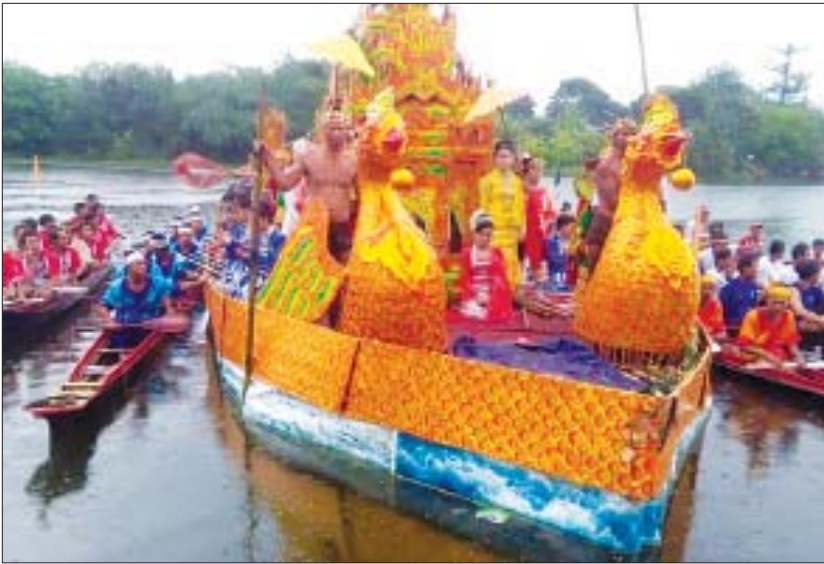
(၂၀၄) ကြိမ်မြောက် ဗုဒ္ဓပူဇော်ပွဲတွင် လှေခင်းသဘင်ပွဲနှင့် လှေပြိုင်ပွဲကျင်းပခဲ့စဉ်။

ရွှေဘို စက်တင်ဘာ ၁၂ တတိယမြန်မာနိုင်ငံတော်ကို ထူထောင်ခဲ့သော အလောင်းမင်းတရားကြီး ဦးအောင်ဇေယျ တည်ထားကိုးကွယ်တော်မူခဲ့သည့် ရွှေဘိုမြို့ ရှိ မော်စောမြင်သာမြို့ထောင်စေတီတော် (၂၀၅) ကြိမ်မြောက် ဗုဒ္ဓပူဇော်ပွဲတွင် နှစ်စဉ်ကျင်းပ မြဲဖြစ်သော တော်သလင်းလပြည့်ကျော် ၇ ရက်မှ သီတင်းကျွတ်လဆန်း ၁ ရက်နေ့အထိ စည်ကား