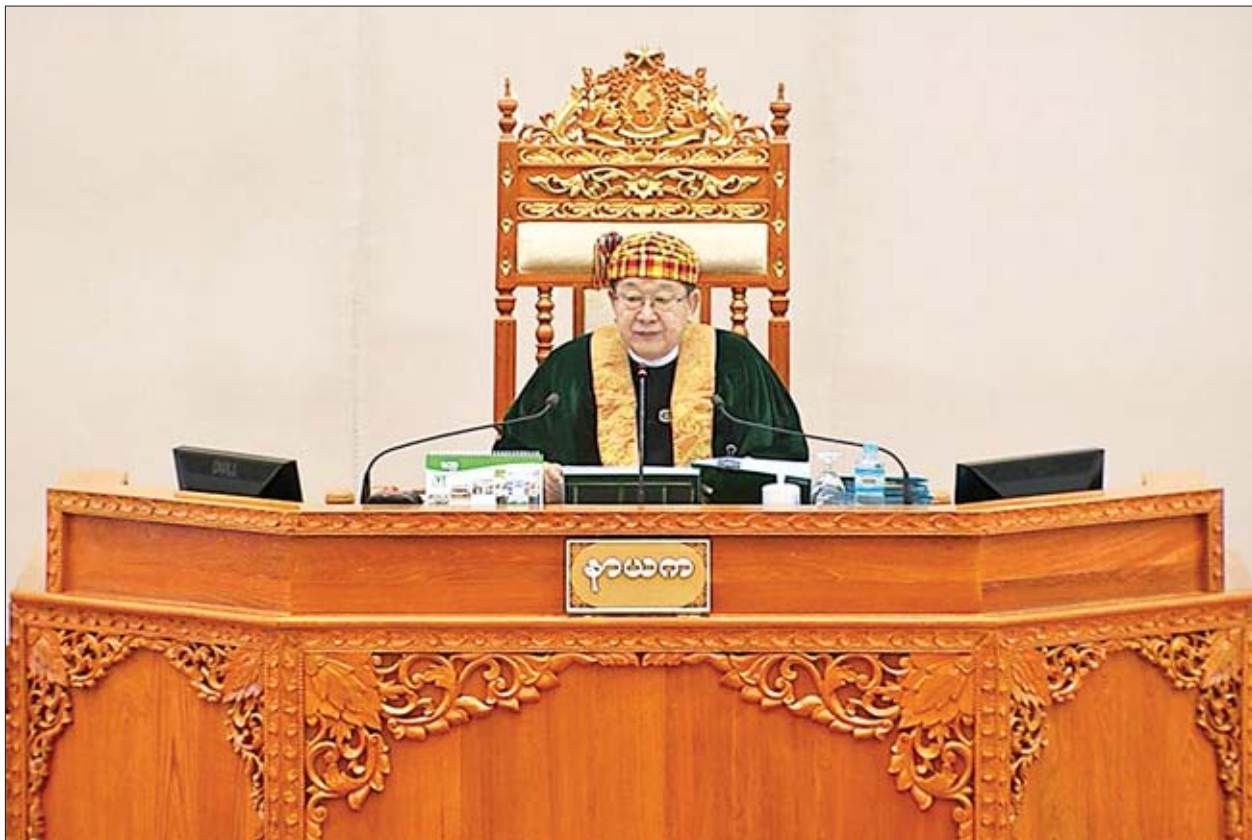
ပြည်ထောင်စုလွှတ်တော်နာယက ဦးတီခွန်မြတ်