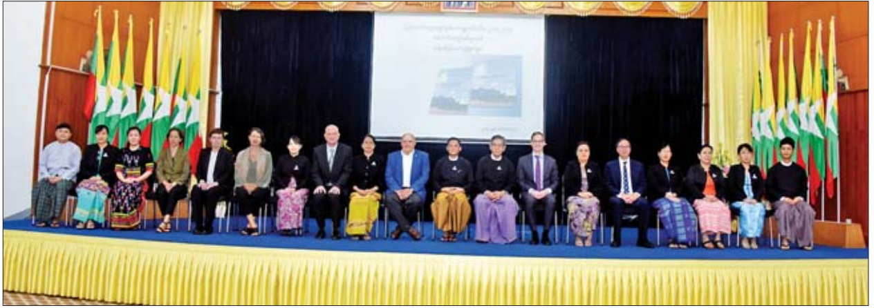
အချက်၊ ပြင်ဆင်သင့်သည်အချက်များကိုသိရှိပြီး ပြည်ထောင်စုရှေ့နေချုပ်ရုံး၏ လုပ်ငန်းစွမ်းဆောင်ရည်များ ပိုမိုတိုးတက်ကောင်းမွန်အောင် ဆောင်ရွက်နိုင်မည်ဖြစ်ကြောင်း ပြောကြားသည်။ အခမ်းအနားသို့ ပြည်ထောင်စုရှေ့နေချုပ်ရုံးမှ ဒုတိယရှေ့နေချုပ်၊

အခမ်းအနားတွင် ပြည်ထောင်စုရှေ့နေချုပ် ဦးထွန်းထွန်းဦးက ပြည်ထောင်စုရှေ့နေချုပ်ရုံးသည် တရားဥပဒေစိုးမိုးရေးလုပ်ငန်းများကို အထောက်အကူပြုရန်ရည်ရွယ်၍ “တရားဥပဒေစိုးမိုးရေးဆီသို့” ဟူသည့် မဟာဗျူဟာစီမံကိန်း ၂၀၁၅-၂၀၁၉ ကို ရေးဆွဲအကောင်အထည်ဖော်ဆောင်ရွက်ခဲ့ပါကြောင်း၊ ပြည်ထောင်စုရှေ့နေချုပ်ရုံးနှင့် ဥပဒေရုံးအဆင့်ဆင့်တို့သည် “တရားဥပဒေစိုးမိုးရေးအတွက် ဥပဒေဖြင့် ကာကွယ်စောင့်ရှောက်ခြင်း” ဟူသော မျှော်မှန်းချက်ထားရှိ၍ မဟာဗျူဟာစီမံကိန်းကို အကောင်အထည်ဖော်ဆောင်ရွက်ခဲ့ပြီး စီမံကိန်းအကောင်အထည်ဖော်မှု အကဲဖြတ်ဆန်းစစ်ခြင်း လုပ်ငန်းကို UNDP ၏ အကူအညီဖြင့် ၂၀၁၉ ခုနှစ် ဖေဖော်ဝါရီလမှ ဧပြီလ အထိ ဆောင်ရွက်ခဲ့ပါကြောင်း၊ အကဲဖြတ်ဆန်းစစ်ခြင်းမှရရှိလာသော ရလဒ်များအပေါ်အခြေခံ၍ ဒုတိယမဟာဗျူဟာစီမံကိန်းတွင် ဖြည့်စွက်သင့်သည်