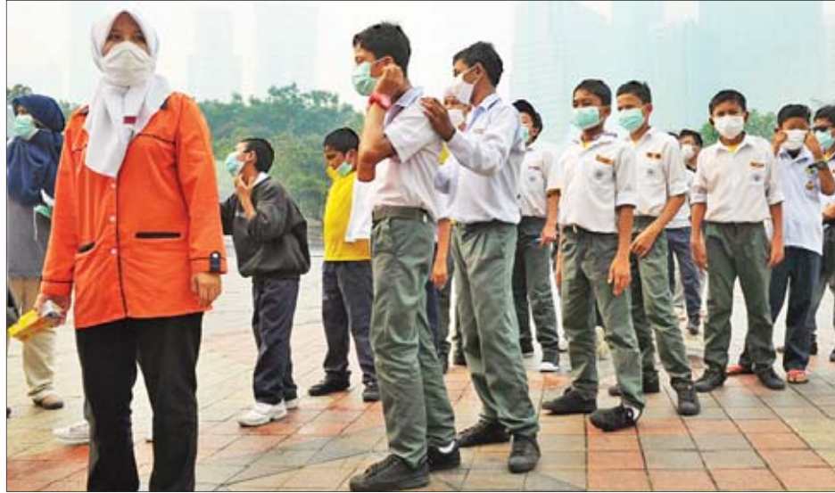
ဖြစ်ကြောင်း ဒေသတွင်း သတင်းများ၌ ဖော်ပြသည်။ သွန်းမှု အလွန်နည်းပါးခြင်းသည်လည်း အကြောင်းရင်းတစ်ခုဖြစ်သည်။ လောင်ကျွမ်းနေသည့် တောမီးများကို

ဂျကာတာ စက်တင်ဘာ ၁၂ အင်ဒိုနီးရှားနိုင်ငံတွင် လနှင့်ချီကာလောင်ကျွမ်းနေသည့် တောမီးများမှ ထွက်ပေါ်လာသည့် မီးခိုးမြူများသည် ၎င်းနိုင်ငံ၏ ပတ်ဝန်းကျင်ရှိ နိုင်ငံများတို့တိုင် ပျံ့နှံ့ကာ ကျန်းမာရေးဆိုင်ရာ ပြဿနာများဖြစ်ပေါ်စေခဲ့ကြောင်း သတင်းတွင် ဖော်ပြသည်။ အင်ဒိုနီးရှားနိုင်ငံရှိ ဆူမားတြားနှင့် ဘော်နီယိုကျွန်းများတွင် နှစ်စဉ်ဖြစ်ပွားသည့် တောမီးလောင်ကျွမ်းမှုများကြောင့် ထွက်ပေါ်လာသည့် ထူထပ်လှသော မီးခိုးမြူများသည် စိုးရိမ်ရသည့် ကျန်းမာရေးဆိုင်ရာ ပြဿနာများ ဖြစ်ပေါ်စေသည့် အကြောင်းရင်းဖြစ်သည်။ ခြောက်သွေ့ရာသီအတွင်း စိုက်ပျိုးမြေများ ချဲ့ထွင်နိုင်ရေးအတွက် တောမီးများရှို့ပြီး စိုက်ပျိုးမြေများ ဖော်ထုတ်ခြင်းကြောင့် ယင်းဖြစ်ရပ်များ ဖြစ်ပွားခဲ့ခြင်းဖြစ်သည်။ အင်ဒိုနီးရှားနိုင်ငံတွင် တောမီးများ စတင်လောင်ကျွမ်းမှုဖြစ်ကတည်းက လက်ရှိအချိန်တွင် သစ်တောခြေဖိုယာဟက်တာပေါင်း ၉၃၀၀၀၀ ခန့် မီးလောင်ဆုံးရှုံးခဲ့ရပြီး