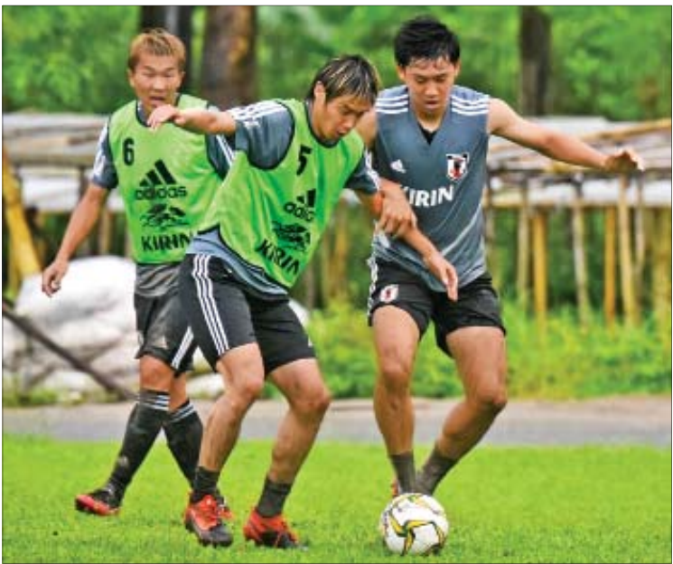
ဂျပန်လက်ရွေးစင်အသင်း သုဝဏ္ဏလေ့ကျင့်ရေးကွင်း၌ လေ့ကျင့်နေစဉ်။