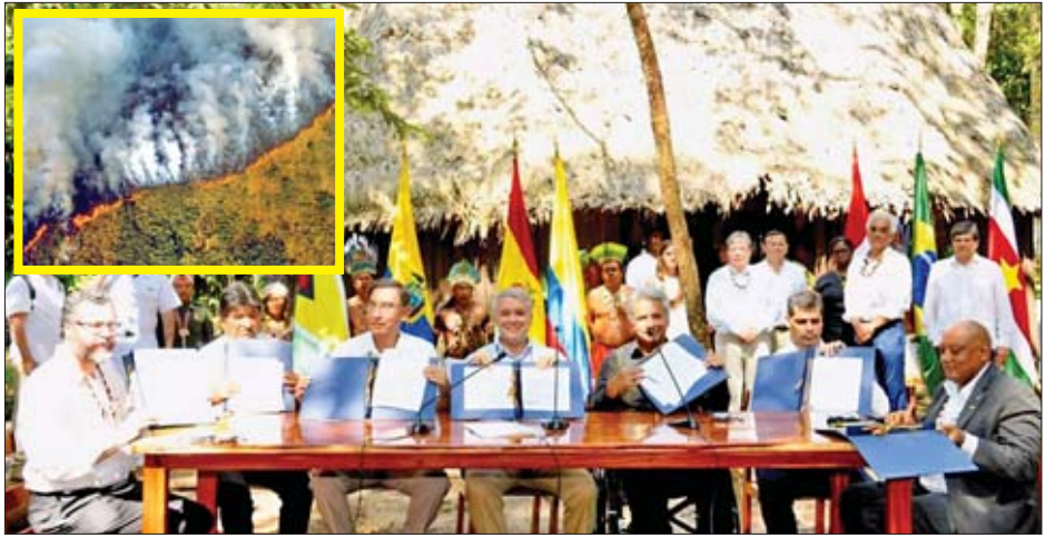
ယခုနှစ်အတွင်း အမေဇွန်မိုးသစ်တောဧရိယာအတွင်း နိုင်ငံအတွင်း၌ ၄၄၀၀၀ စတုရန်းကီလိုမီတာ ရှိခဲ့သည်။ မီးလောင်ဆုံးရှုံးခဲ့ရသည့် ဧရိယာပမာဏသည် ဘရာဇီး ကိုးကား-အင်န်အိတ်ချ်ဂေ၊ ဘာသာပြန်-ဇော်ဝင်း

လွန်ခဲ့သည့် ဩဂုတ်လအတွင်းက ဘရာဇီးနိုင်ငံ ပိုင်နက်အတွင်း တည်ရှိခဲ့သော အမေဇွန်မိုးသစ်တောများ အား မီးလောင်ကျွမ်းခဲ့သည့်ပမာဏမှာ လွန်ခဲ့သည့်နှစ် အတွင်း မီးလောင်ကျွမ်းမှုဖြစ်ပွားသည့်ပမာဏ၏ သုံးဆ ဖြစ်ကြောင်း ယင်းနိုင်ငံအတွင်းရှိ သုတေသန အဖွဲ့တစ်ဖွဲ့က ပြောကြားခဲ့သည်။