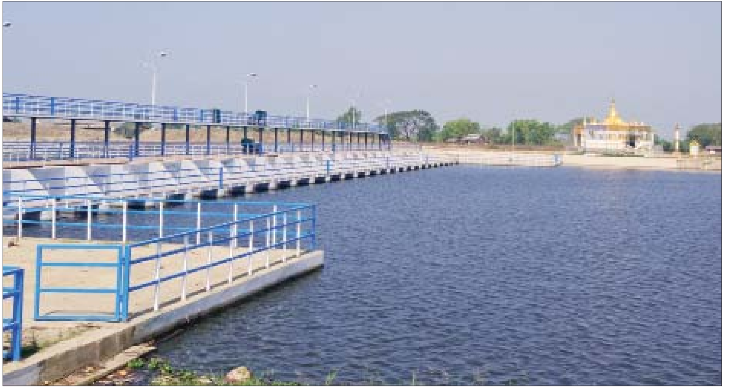
ငမိုးရိပ်ရေထိန်းတံခါး(စစ်ပင်တောင်)အားတွေ့ရစဉ်။

ရန်ကုန်မြို့တော် စည်ပင်သာယာရေးကော်မတီ အနေဖြင့် EOI ရောင်းချပေးမှုကို ဩဂုတ် ၂၇ ရက်က နိုင်ငံပိုင်သတင်းစာများမှ တရားဝင်ကြေညာခဲ့ပြီး စာမျက်နှာ ၁၁ ကော်လံ ၅ သို့