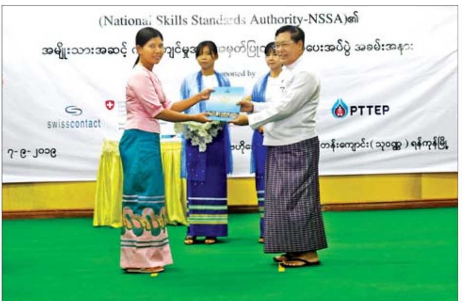
NSSA လုပ်ငန်းစတင်ခဲ့သည့် ၂၀၁၄ ခုနှစ်မှစပြီး ကျွမ်းကျင်မှုအလိုက် စစ်ဆေးအကဲဖြတ်ပေးခဲ့ရာ ၂၀၁၄ ခုနှစ်မှ ၂၀၁၉ ခုနှစ် ဩဂုတ်လအထိ မြန်မာနိုင်ငံတစ်ဝန်း အလုပ်အကိုင် ၂၃ မျိုးမှ အမျိုးသားကျွမ်းကျင်မှု အဆင့်(၁) နှင့် (၂)အတွက် အမျိုးသား ၉၃၈၇ ဦး၊ အမျိုးသမီး ၃၇၇၉ ဦး စုစုပေါင်း ၁၃၁၄၆ ဦးကို အရည်အချင်းပြည့်မီကြောင်း စစ်ဆေးအကဲဖြတ်ပေးနိုင်ခဲ့ကြောင်း သိရသည်။ သတင်းစဉ်

ယင်းနောက် ပြည်ထောင်စုဝန်ကြီးနှင့် တာဝန်ရှိသူများ က ၂၀၁၈ ခုနှစ် အောက်တိုဘာလမှ ၂၀၁၉ ခုနှစ် ဧပြီလ အတွင်း ရန်ကုန်တိုင်းဒေသကြီးနှင့် အောက်မြန်မာပြည်ရှိ NSSA ၏ စစ်ဆေးအကဲဖြတ်ရေးဌာနများတွင် စစ်ဆေး ခဲ့သည့် အလုပ်အကိုင် ၁၄ မျိုးမှ အရည်အချင်းပြည့်မီသည့် လုပ်သား ၁၀၄၄၄ ဦးအား အမျိုးသားအဆင့် ကျွမ်းကျင်မှု အသိအမှတ်ပြုလက်မှတ်ပေးအပ်ခြင်းနှင့် အလုပ်အကိုင် ဆိုင်ရာ ကျွမ်းကျင်မှုစစ်ဆေးအကဲဖြတ်ရေးဌာန ခြောက်ခု နှင့် စစ်ဆေးအကဲဖြတ်သူ ၁၈ ဦးတို့အား အသိအမှတ်ပြု လက်မှတ်များပေးအပ်ကြပြီး လုပ်သားများကိုယ်စားလှယ်များ တစ်ဦးနှင့် အလုပ်ရှင်များကိုယ်စား ကိုယ်စားလှယ်တစ်ဦး တို့က ကျေးဇူးတင်စကားပြောကြားကြသည်။