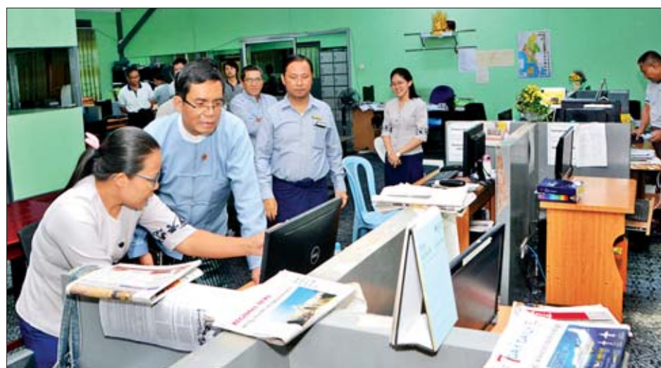
ပြန်ကြားရေးဝန်ကြီးဌာန ဒုတိယဝန်ကြီး ဦးအောင်လှထွန်း The Global New Light of Myanmar သတင်းစာတိုက် စာတည်းခန်းကို ကြည့်ရှုစစ်ဆေးစဉ်။

ရန်ကုန် စက်တင်ဘာ ၇ ပြန်ကြားရေးဝန်ကြီးဌာန ဒုတိယဝန်ကြီး ဦးအောင်လှထွန်း သည် ယနေ့ နံနက် ၁၀ နာရီ ၄၅ မိနစ်တွင် ရန်ကုန်မြို့ ဗဟန်းမြို့နယ် ငါးထပ်ကြီးဘုရားလမ်းရှိ ဖိုတိုလစ်သိုပုံနှိပ် စက်ရုံသို့ရောက်ရှိပြီး ပုံနှိပ်စက်ခန်းများရှိ ပတ်လည်စက် များ၊ ရွက်ထိုးစက်များဖြင့် ပညာရေးဝန်ကြီးဌာနက အပ်နှံ ထားသည့် တစ်နိုင်လုံးအတွက် အခြေခံပညာကျောင်းသုံး ပြဋ္ဌာန်းစာအုပ်များ ရိုက်နှိပ်ချုပ်လုပ်နေမှု၊ ၂၀၂၀ အထွေထွေရွေးကောက်ပွဲအတွက် ဆန္ဒမဲစာအိတ်များ ပုံနှိပ်နေမှု၊ အသစ်တပ်ဆင်ထားသည့် CTP စက် အသုံးပြု နေမှုနှင့် စက္ကူလုံးသိုလှောင်ရုံများကို ကြည့်ရှုစစ်ဆေး သည်။