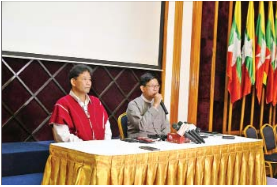
နိုင်ငံတော်အတိုင်ပင်ခံရုံးဝန်ကြီးဌာန ညွှန်ကြားရေးမှူးချုပ် ဦးဇော်ဌေး မီဒီယာများ၏ မေးမြန်းမှုများကို ဖြေကြားစဉ်။

ဒီလိုဆောင်ရွက်ရာမှာ ကျွန်တော်တို့အကြားမှာ ဘုံသဘောတူညီချက်အဖြစ် ပဋိညာဉ်ချမှတ်ထားတဲ့ တစ်နိုင်ငံလုံးပစ်ခတ်တိုက်ခိုက်မှုရပ်စဲရေး သဘောတူ စာချုပ်(NCA)ကို မဏ္ဍိုင်ပြုပြီးတော့ ကျွန်တော်တို့ ဆောင်ရွက်ခဲ့တာပဲဖြစ်ပါတယ်။ အနာဂတ်မှာဖြစ်ထွန်း ပေါ်ပေါက်လာမယ့် ဒီမိုကရေစီဖက်ဒရယ်ပြည်ထောင်စု တည်ဆောက်ဖို့အတွက် လွယ်လွယ်ကူကူ ချောချောမွေ့မွေ့ မဟုတ်ဘူးဆိုတာကိုတော့ ကျွန်တော်တို့အားလုံး မျှော်လင့် ထားပြီးဖြစ်ပါတယ်။ နှစ်ပေါင်းများစွာ လက်နက်ကိုင် ပဋိပက္ခနဲ့ ဖြေရှင်းလို့မရနိုင်ခဲ့တဲ့ အခြေအနေတစ်ခုကို နိုင်ငံ ရေးဆွေးနွေးပွဲတွေကနေတစ်ဆင့်သာ ဖြေရှင်းနိုင်မယ် ဆိုတာ ကျွန်တော်တို့အားလုံး လက်ခံထားကြပြီး ဖြစ်ပါ တယ်။ ဘယ်လိုပဲ မတူညီကြုံပြားခြားနားမှုတွေ ရှိပါစေ။ မတူညီမှုတွေကနေ တူညီမှု ကွဲပြားခြားနားမှုတွေကနေ တူညီမှုတွေကို ကျွန်တော်တို့ကိုယ်တိုင် ညှိနှိုင်းအဖြေရှာ နိုင်ခဲ့ကြလို့လည်း NCA စာချုပ် ပြည်ထောင်စုသဘောတူ စာချုပ် အစိတ်အပိုင်း(၁)၊ အစိတ်အပိုင်း(၂)တွေ ရရှိခဲ့ တာပဲ ဖြစ်ပါတယ်။ မဖြစ်နိုင်ဘူးလို့ ထင်ခဲ့တာတွေ၊ ခက်ခဲပါ တယ်ဆိုတဲ့အရာတွေကို ကျွန်တော်တို့ လုပ်နိုင်ခဲ့ပါတယ်။ နိုင်ငံရေးဆွေးနွေးပွဲနဲ့ ပစ်ခတ်တိုက်ခိုက်မှုရပ်စဲရေးဆိုင်ရာ လက်တွေ့အကောင်အထည်ဖော်မှု လုပ်ငန်းစဉ်တွေဟာ ကျွန်တော်တို့ နှစ်ဖက်သဘောတူညီချက်နဲ့ ဖော်ဆောင် ခဲ့တာပဲ ဖြစ်ပါတယ်။