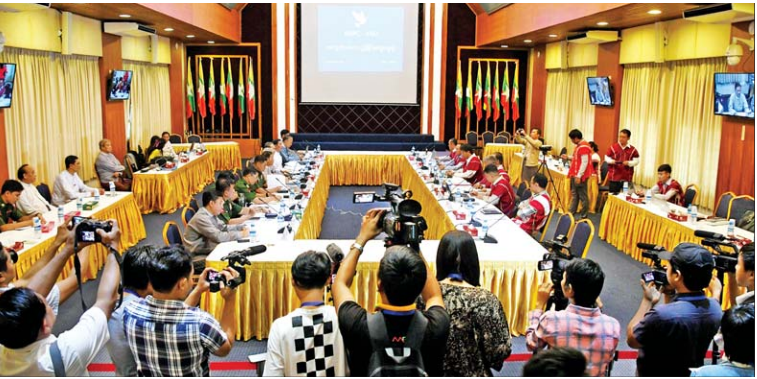
အမျိုးသားပြန်လည်သင့်မြတ်ရေးနှင့် ငြိမ်းချမ်းရေးဗဟိုဌာန(NRPC)ကိုယ်စားလှယ်အဖွဲ့နှင့် ကရင်အမျိုးသားအစည်းအရုံး(KNU)ကိုယ်စားလှယ်အဖွဲ့တို့ ငြိမ်းချမ်းရေးလုပ်ငန်းစဉ် ကိစ္စရပ်များနှင့်ပတ်သက်၍ အလွတ်သဘော ညှိနှိုင်းဆွေးနွေးစဉ်။

ရန်ကုန် စက်တင်ဘာ ၇ အမျိုးသားပြန်လည်သင့်မြတ်ရေးနှင့် ငြိမ်းချမ်းရေးဗဟိုဌာန(NRPC) ကိုယ်စားလှယ်အဖွဲ့နှင့် ကရင်အမျိုးသား အစည်းအရုံး(KNU)ကိုယ်စားလှယ်အဖွဲ့တို့သည် ယနေ့နံနက် ၁၀ နာရီက ရန်ကုန်မြို့၊ ရွှေလီလမ်းရှိ အမျိုးသားပြန်လည်သင့်မြတ်ရေးနှင့် ငြိမ်းချမ်းရေးဗဟိုဌာန (NRPC)တွင် ငြိမ်းချမ်းရေးလုပ်ငန်းစဉ် ကိစ္စရပ်များနှင့် ပတ်သက်၍ အလွတ်သဘော ညှိနှိုင်းဆွေးနွေးခဲ့ကြသည်။ အမျိုးသား ပြန်လည်သင့်မြတ်ရေးနှင့် ငြိမ်းချမ်းရေးဗဟိုဌာန ဒုတိယဥက္ကဋ္ဌ ပြည်ထောင်စုရှေ့နေချုပ် ဦးထွန်းထွန်းဦးက နှုတ်ခွန်းဆက်စကား ပြောကြားရာတွင် “ကျွန်တော်တို့ နိုင်ငံတော်အစိုးရအနေနဲ့ ပြည်ထောင်စုငြိမ်းချမ်းရေးညီလာခံ(၂၁)ရာစု ပင်လုံ တတိယအစည်းအဝေးနောက်ပိုင်းမှာ NCA လက်မှတ်ရေးထိုးထားတဲ့ တိုင်းရင်းသား လက်နက်ကိုင်အဖွဲ့အစည်းတွေနဲ့ စဉ်ဆက်မပြတ် တွေ့ဆုံဆွေးနွေးမှုပြုလုပ်ပြီး ရေရှည် တည်တံ့ခိုင်မြဲတဲ့ ငြိမ်းချမ်းရေး ဖော်ဆောင်နိုင်ဖို့ စာမျက်နှာ ၃ ကော်လံ ၁ သို့ ❖