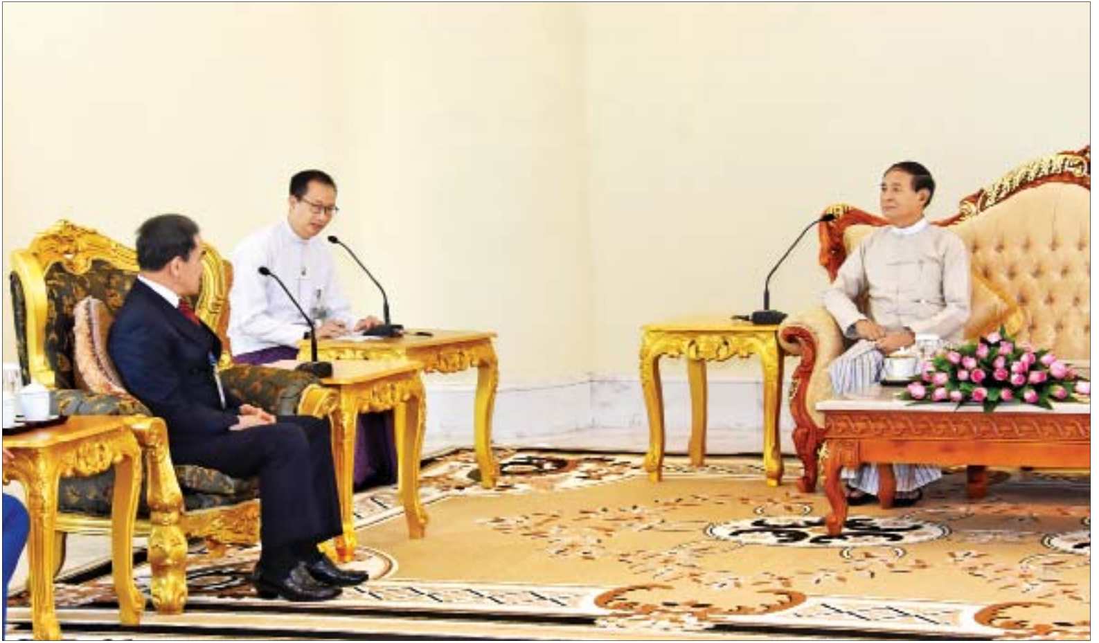
နိုင်ငံတော်သမ္မတ ဦးဝင်းမြင့် မြန်မာနိုင်ငံဆိုင်ရာ ဘရူနိုင်းဒါရူဆလမ်နိုင်ငံ သံအမတ်ကြီး Mr. Pehin Orang Kaya Seri Pahlawan Colonel (Rtd.) Dato Paduka Haji Abdu'r Rahmani bin Dato Paduka Haji Basir အား လက်ခံတွေ့ဆုံစဉ်။

နေပြည်တော် စက်တင်ဘာ ၆ နိုင်ငံတော်သမ္မတ ဦးဝင်းမြင့်သည် တာဝန်ပြီးဆုံး၍ ပြန်လည်ထွက်ခွာတော့မည့် မြန်မာနိုင်ငံဆိုင်ရာ ဘရူနိုင်းဒါရူဆလမ်နိုင်ငံ သံအမတ်ကြီး Mr. Pehin Orang Kaya Seri Pahlawan Colonel (Rtd.) Dato Paduka Haji Abdu'r Rahmani bin Dato Paduka Haji Basir အား ယနေ့ နံနက် ၁၀ နာရီတွင် နေပြည်တော်ရှိ နိုင်ငံတော်သမ္မတအိမ်တော် ဧည့်ခန်းမဆောင်၌ လက်ခံတွေ့ဆုံသည်။