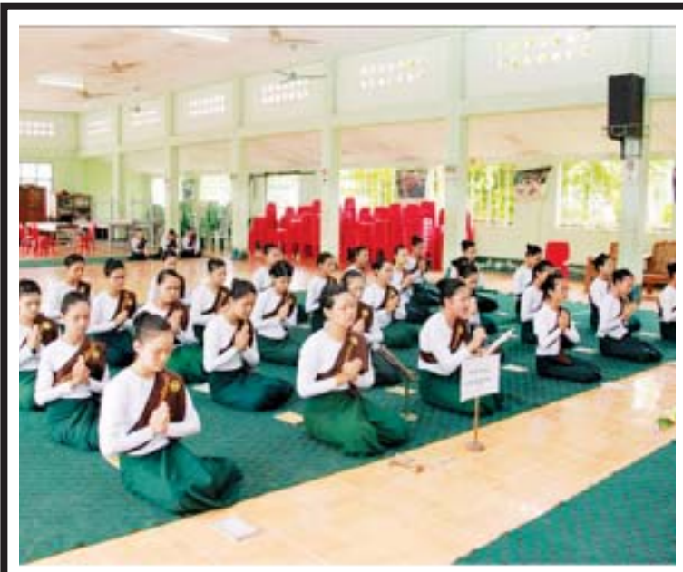
ရန်ကုန်အရှေ့ပိုင်းခရိုင် တောင်ဥက္ကလာပမြို့နယ် ပညာရေးမှူးရုံး၏ ကြီးကြပ်မှုဖြင့် (၇) ကြိမ်မြောက် မေ့စကြာရွတ်ဆိုပြိုင်ပွဲကို စက်တင်ဘာ ၃ ရက်က ပြုလုပ်ရာ မြို့နယ်အတွင်းရှိ အထက်တန်း၊ အလယ်တန်းကျောင်းများမှ ကျောင်းသား၊ ကျောင်းသူလေးများက အဖွဲ့လိုက် ရွတ်ဆိုယှဉ်ပြိုင်ကြစဉ်။ ကိုဝဏ္ဏ(တောင်ဥက္ကလာ)

များအနေဖြင့်လည်း တက္ကသိုလ်ဝင်တန်းအောင်မြင်အောင်ကြိုးစားနိုင်ခြင်းမှာ ဘဝရဲ့ အခြေခံလှေကားထစ်တစ်ခုကို ဖြတ်ကျော်ဖို့ကြိုးစားခြင်းဖြစ်၍ ကြိုးစားမှုရလဒ်များနှင့်အညီ ဂုဏ်ပြုဆုချီးမြှင့်ရသည်မှာ ဝမ်းမြောက်ဂုဏ်ယူကြောင်း ပြောကြားသည်။ ထို့နောက် မြို့သန့်ရှင်းသာယာလှပရေး၊ အမှိုက်ပုံလုံးဝကင်းစင်ရေးဆုရရှိသည့် မြို့နယ်များနှင့် တက္ကသိုလ်ဝင်စာမေးပွဲ၌ ထူးချွန်စွာအောင်မြင်ခဲ့ကြသော စည်ပင်သာယာရေးဝန်ထမ်းမိသားစုဝင် သားသမီးများအား တိုင်းဒေသကြီးဝန်ကြီးနှင့်တာဝန်ရှိသူများက ဆုများပေးအပ်ချီးမြှင့်ကြကြောင်း သိရသည်။ ဌေးနိုင်(ပဲခူး)