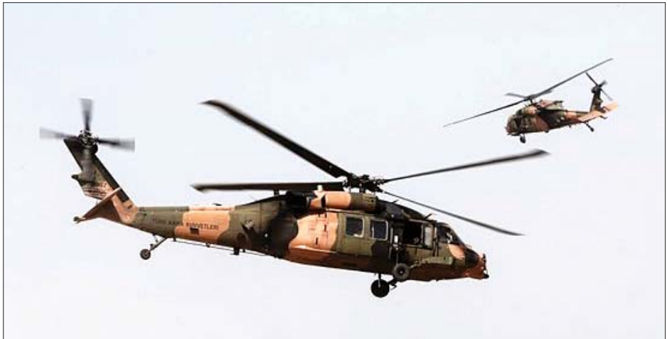
မြောက်ဘက်ပိုင်း၌ ပျံသန်းမှုများ စတင်ပြုလုပ်ခဲ့သည်။ အာဒိုဂန်၏ ပြောရေးဆိုခွင့်ရှိသူ အီဘရာဟင် ကာလင်က အမေရိကန်နှင့် တူရကီ ပူးပေါင်းတပ်ဖွဲ့များသည် ယူဇရေးတီးစစ်အရှေ့ပိုင်းတွင် ပူးတွဲပျံသန်းမှုများ မကြာမီ စတင်ပြုလုပ်မည်ဖြစ်ကြောင်း တူရကီသမ္မတ

လေကြောင်းမှ ပျံသန်းထောက်လှမ်းမှုကို လုပ်ဆောင်ခဲ့ ကြောင်း တူရကီကာကွယ်ရေးဝန်ကြီး ဟူလူစီအက်ကာက အစောပိုင်းတွင် ပြောကြားခဲ့သည်။ ဆီးရီးယားနိုင်ငံမြောက်ပိုင်းဒေသတွင် လုံခြုံရေးဇုန် တစ်ခုတည်းထောင်ရန် အမေရိကန်နှင့် တူရကီနိုင်ငံတို့ ဩဂုတ် ၇ ရက်တွင် သဘောတူညီခဲ့ကြပြီး ယင်းသဘော တူညီချက်အရ ယင်းဒေသတွင် ငြိမ်းချမ်းရေးစင်္ကြံတစ်ခု ထူထောင်မည်ဖြစ်သည်။ ယင်းလုံခြုံရေးဇုန်တည်ထောင်မှုသည် လတ်တလော တွင် ဇာတိနယ်မြေဖြစ်သော ဆီးရီးယားနိုင်ငံတွင်းမှ တူရကီနိုင်ငံတွင်းသို့ ရွှေ့ပြောင်းဝင်ရောက်နေထိုင်သူများ ဌာနေပြန်ရေးအကြောင်းနှင့်လည်း ဆက်နွှယ်လျက် ရှိသည်။ အမေရိကန်နှင့် သဘောတူညီမှုရရှိထားသည့် လုံခြုံရေးဇုန်တည်ထောင်ရေး သဘောတူညီချက်၏ အစိတ်အပိုင်းတစ်ခုအဖြစ် တူရကီ မောင်းသမားလေယာဉ် များသည် စက်တင်ဘာ ၄ ရက်တွင် ဆီးရီးယားနိုင်ငံ