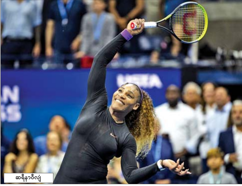
ဆရီနာဝီလျံ

အမေရိကန်တင်းနစ်မယ် ဆရီနာဝီလျံကတော့ အမေရိကန်အိုးပင်းတင်းနစ်ပြိုင်ပွဲမှာ ဆုဖလား ခြောက်ကြိမ် အထိ ရယူဆွတ်ခူးထားပြီး ဩစတြေးလျအိုးပင်းတင်းနစ် ပြိုင်ပွဲမှာ ဆုဖလား ခုနစ်ကြိမ်၊ ပြင်သစ်အိုးပင်းတင်းနစ် ပြိုင်ပွဲမှာ ဆုဖလား သုံးကြိမ်နဲ့ ဝင်ဘယ်ဒန် တင်းနစ်ပြိုင်ပွဲမှာ ဆုဖလား ခုနစ်ကြိမ် အသီးသီးရယူဆွတ်ခူးထားသူလည်း ဖြစ်ပါတယ်။ ဆရီနာဝီလျံဟာ လက်ရှိအချိန်အထိ ဂရုန်း ဆလမ်းတင်းနစ်ဆုဖလားစုစုပေါင်း ၂၃ ကြိမ်အထိ ဆွတ်ခူး ထားပြီး အခုယှဉ်ပြိုင်ကစားမယ့်ပိုလ်လုပွဲမှာ အနိုင်ရပြီး ချန်ပီယံဖြစ်ဖို့ ရေပန်းစားနေသူဖြစ်ပါတယ်။ အမေရိကန် အိုးပင်းအမျိုးသမီးတစ်ဦးချင်း တင်းနစ်ပြိုင်ပွဲမှာ ဆုဖလား ရရှိခဲ့မယ်ဆိုရင် ဆရီနာဝီလျံဟာ ဆုဖလားရရှိမှု စုစုပေါင်း