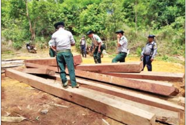
အုတ်တွင်းမြို့နယ် အုတ်တွင်း- ပေါက်ခေါင်းလမ်းမိုင်တိုင်(၇၆/၅)၊ (၆၃/၂)အနီး ခပေါင်းကြီးပိုင်းအကွက် အမှတ်(၉၄)နှင့်(၅၈)တို့မှ တရားမဝင် ကျွန်း/သစ်ကဖော်(၆၃)ခွဲခြမ်း/ ချောင်း ၆ ဒသမ ၂၅၅၈ တန်၊ မန္တလေး တိုင်းဒေသကြီး ပြင်ဦးလွင်ခရိုင် စဉ့်ကူးမြို့နယ် အောက်မတ္တရာတိုးချဲ့ ကြီးပိုင်း(၃၁/၆၁/၆၂) အတွင်း ဆည်တော်ကြီးကန်အနီးဝန်းကျင်

ပြည်သူပူးပေါင်းပါဝင်မှုဖြင့် လူထု အခြေပြုစောင့်ကြပ်ကြည့်ရှုသတင်း ပို့စနစ်-CMRS ဖြင့် သတင်းပေးပို့ ချက်အရ စက်တင်ဘာ ၂ ရက်မှ ၅ ရက်အတွင်း သစ်တောဝန်ထမ်းများ၊ သစ်တောလုံခြုံရေးရဲတပ်ဖွဲ့ဝင်များ၊ မြန်မာနိုင်ငံရဲတပ်ဖွဲ့ဝင်များ၊ ကျေးရွာ အုပ်ချုပ်ရေးအဖွဲ့ဝင်များပါဝင်သော ပူးပေါင်းအဖွဲ့က တရားမဝင်သစ်များ သိမ်းဆည်းရမိခဲ့ကြောင်း သိရသည်။