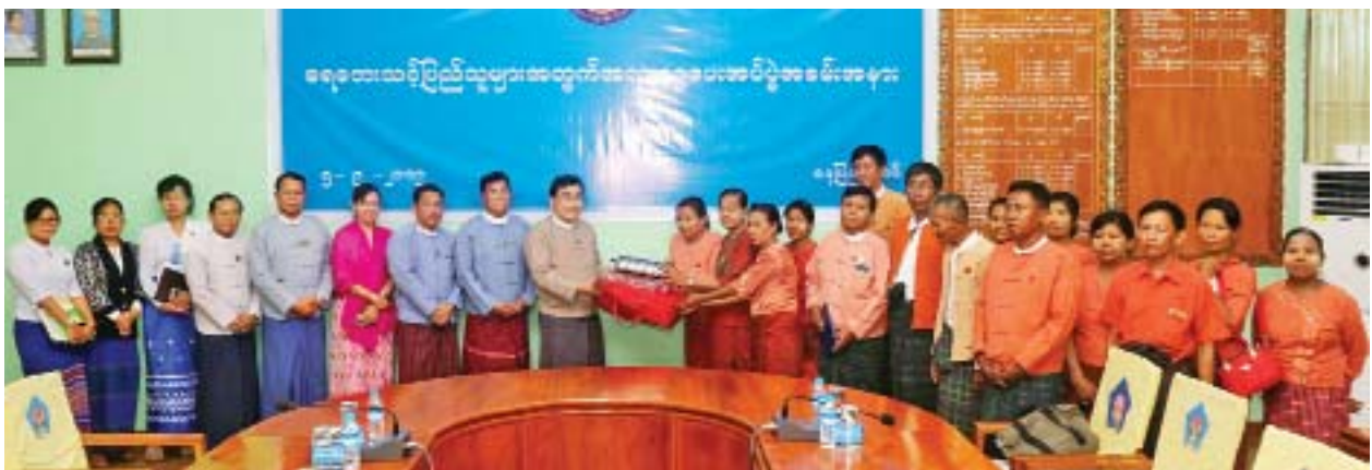
သဘာဝဘေးအန္တရာယ်ဆိုင်ရာစီမံခန့်ခွဲမှုကော်မတီ၏ ဘဏ္ဍာငွေရှာဖွေရေးနှင့် ရန်ပုံငွေထိန်းသိမ်းရေးလုပ်ငန်းကော်မတီဥက္ကဋ္ဌ ပြည်ထောင်စုဝန်ကြီး ဒေါက်တာဝင်းမြတ်အေးက လက်ခံ၍ ကျေးဇူးတင်စကားပြောကြားကာ ဂုဏ်ပြုမှတ်တမ်းလွှာ ပြန်လည်ပေးအပ်သည်။ သတင်းစဉ်

နေပြည်တော် စက်တင်ဘာ ၆ မြန်မာနိုင်ငံအတွင်း ရေဘေးဒဏ်ခံရသည့်ဒေသများ ပြန်လည်ထူထောင်ရေးလုပ်ငန်းများ ဆောင်ရွက်ရာတွင် အသုံးပြုနိုင်ရန်အတွက် အလှူရှင်များက အလှူငွေများ လှူဒါန်းလျက်ရှိသည်။