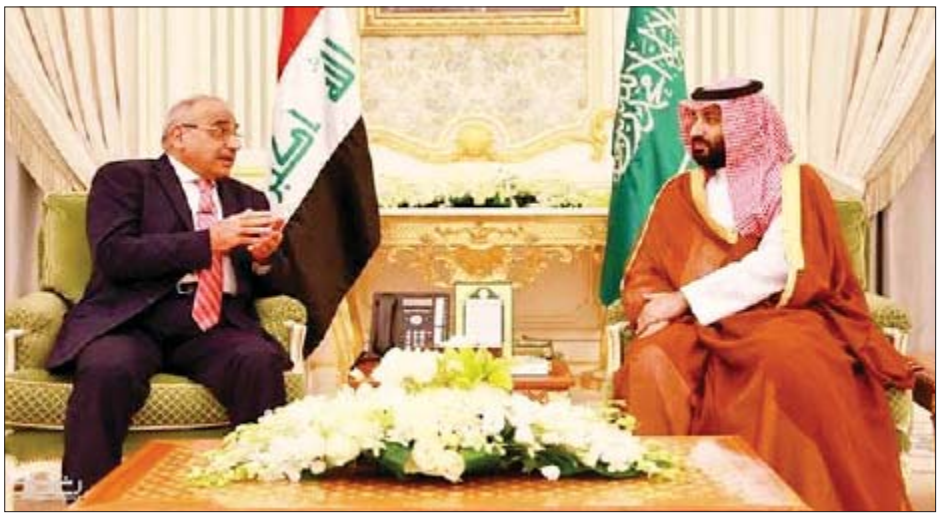
အီရတ်ဝန်ကြီးချုပ် အာဒယ်လ်အဗ္ဗူဒင်မာဒီနှင့် ဆော်ဒီအာရေဗျနိုင်ငံ၏ အိမ်ရှေ့မင်းသား မိုဟာမက် ဘင်ဆာလ်မန် အယ်လ်ဆောက်တို့ ယခုနှစ် ဧပြီလအတွင်းက တွေ့ဆုံဆွေးနွေးခဲ့ကြသည်ကို တွေ့ရစဉ်။

ဆော်ဒီအာရေဗျ နိုင်ငံသည် အမေရိကန်ပြည်ထောင်စုက အီရန် ပင်လယ်ကွေ့ဒေသအတွင်း တင်းမာမှု အရှိန်မြင့်မားနေစဉ် ရေနံဈေးကွက်