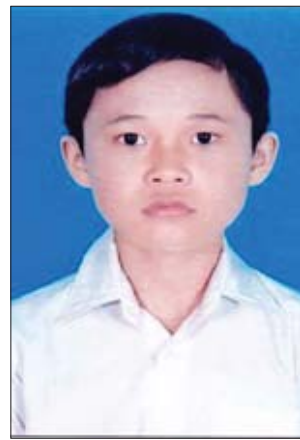
တတိယဆုရ မောင်ကောင်းထက်သော်