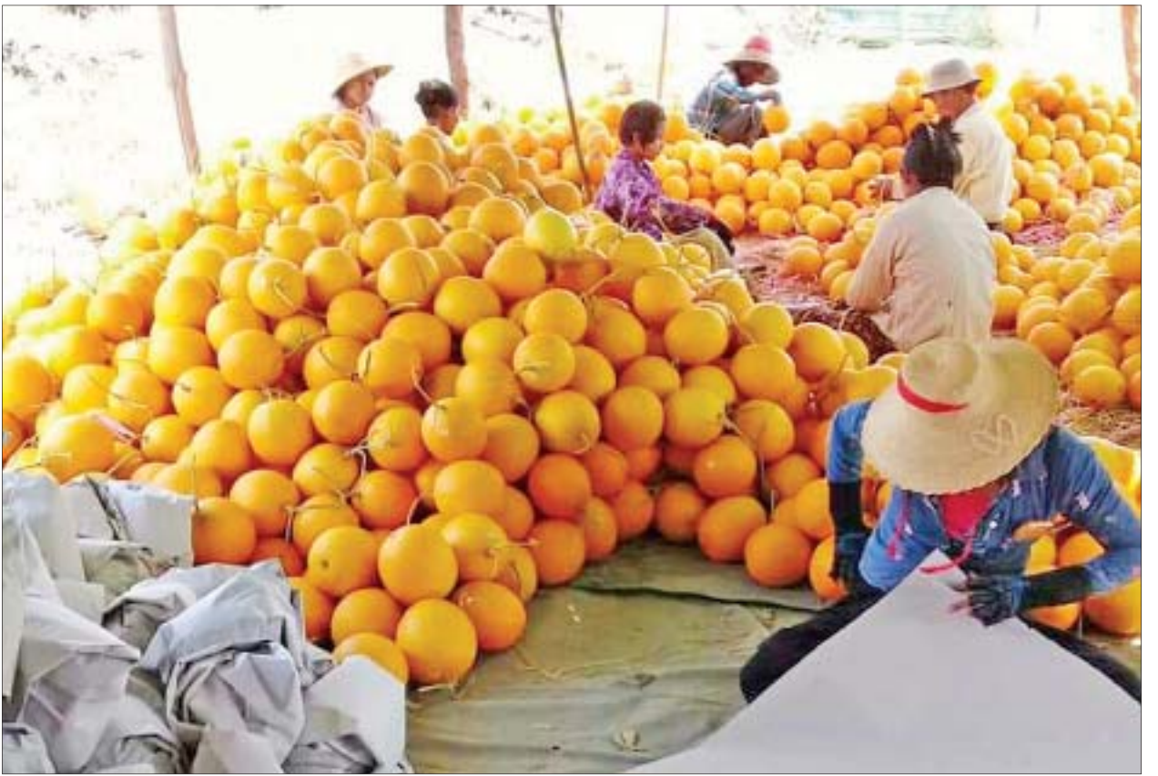
ယမန်နှစ်က စစ်ကိုင်းတိုင်းဒေသကြီးမှ ထွက်ရှိသည့် သခွားမွေးသီးများ တင်ပို့ရန် ထုပ်ပိုးနေသည်ကို တွေ့ရစဉ်။