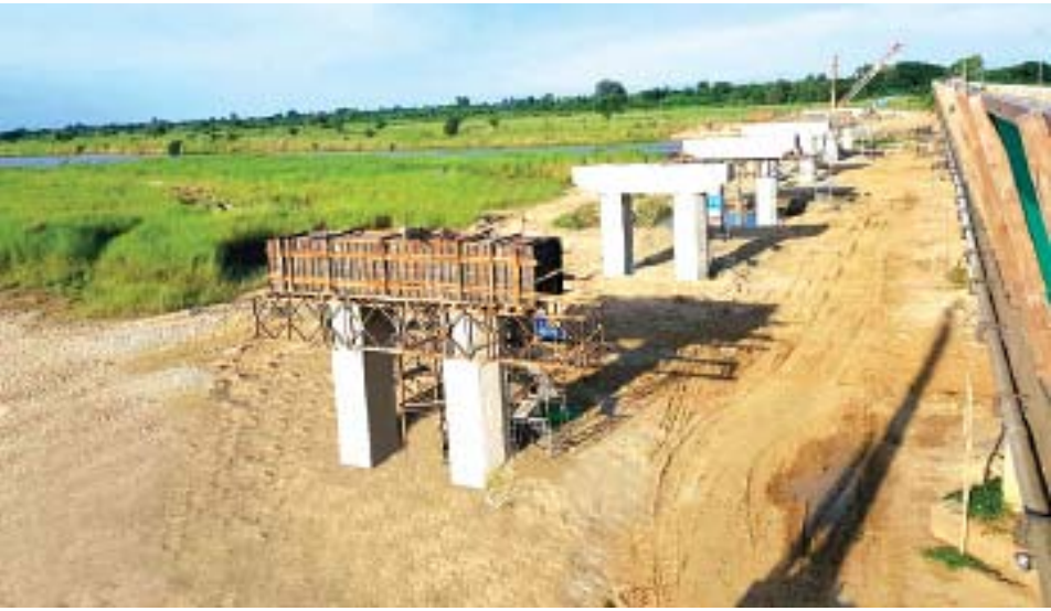
မြန်မာနိုင်ငံအလယ်ပိုင်းဒေသများသို့အလွယ်တကူဆက်သွယ်သွားလာနိုင်မည်ဖြစ်ပြီး ကုန်စည်စီးဆင်းမှုနှင့် ခရီးသည် ပို့ဆောင်ရေးလုပ်ငန်းများ ပိုမိုမြန်ဆန်မည်ဖြစ်ကြောင်း သိရသည်။ ဝင်းဦး(ဇေယျာတိုင်း)

၎င်းတံတားအား တည်ဆောက်ပြီးစီးပါက အိန္ဒိယနိုင်ငံနယ်စပ် တမူးမြို့ကလေးမြို့မှတစ်ဆင့် ချင်းပြည်နယ်သို့လည်းကောင်း၊ ရေဦး၊ တန့်ဆည်၊ ဒီပဲယင်းမြို့နယ်များမှ ကချင်ပြည်နယ်သို့လည်းကောင်း၊ ရွှေဘိုမြို့မှတစ်ဆင့်