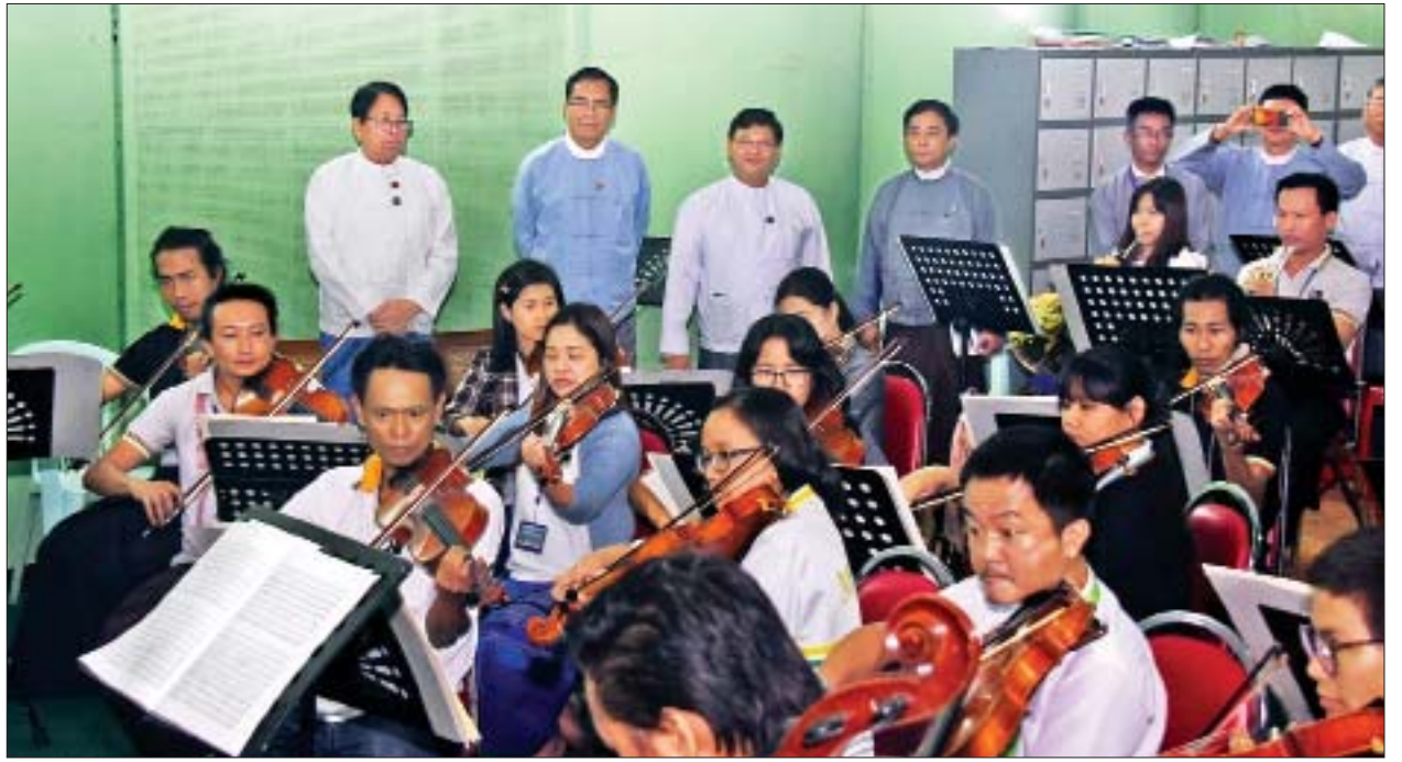
ပြည်ထောင်စုဝန်ကြီး ဒေါက်တာဖေမြင့်၊ ဒုတိယဝန်ကြီး ဦးအောင်လှထွန်းနှင့် တာဝန်ရှိသူများ မြန်မာ့အသံနှင့် ရုပ်မြင်သံကြား(ရန်ကုန်) ဝင်းအတွင်းရှိ စတူဒီယိုခန်းများကို ကြည့်ရှုစစ်ဆေးစဉ်။

ထို့နောက် ဌာနခွဲအလိုက် တက်ရောက်လာကြသည့် ဝန်ထမ်းများက လုပ်ငန်းခွင်အတွင်း ဆောင်ရွက်နေရသည့် အခက်အခဲများ၊ လိုအပ်ချက်များ၊ နည်းပညာအတွက် လိုအပ်သည်သင်တန်းများ ဖြည့်ဆည်းပေးရန်တင်ပြကြရာ အမြဲတမ်းအတွင်းဝန် ဦးမျိုးမြင့်မောင်နှင့် တာဝန်ရှိသူများက ပြန်လည်ရှင်းလင်း