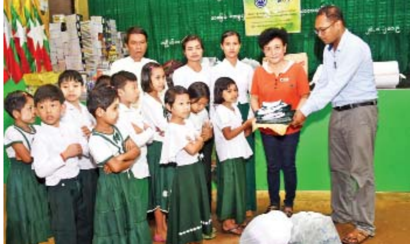
ရေဘေးသင့် ကျောင်းသား ကျောင်းသူများအား ကျောင်းဝတ်စုံများ ပေးအပ်လှူဒါန်းစဉ်။

မော်လမြိုင် စက်တင်ဘာ ၆ Myanmar China Mobile Association နှင့် မြန်မာ-တရုတ်ယဉ်ကျေးမှုအသင်းတို့ ပူးပေါင်း၍ မွန်ပြည်နယ် ကျိုက်မရောမြို့နယ်အတွင်းရှိ ရေဘေးသင့် မူလတန်းကျောင်းသား ကျောင်းသူများအတွက် ကျောင်းဝတ်စုံများနှင့် အထက်တန်းအဆင့် အထောက်အကူပြုစာအုပ်များ၊ မုန့်မျိုးစုံနှင့် အလှူငွေများ လှူဒါန်းပွဲကို စက်တင်ဘာ ၆ ရက် မွန်းတည့် ၁၂ နာရီက ကျိုက်မရောမြို့အခြေခံပညာအထက်တန်းကျောင်း ရေဘေးကယ်ဆယ်ရေးကွပ်ကဲရုံးခန်းမ၌ ကျင်းပသည်။