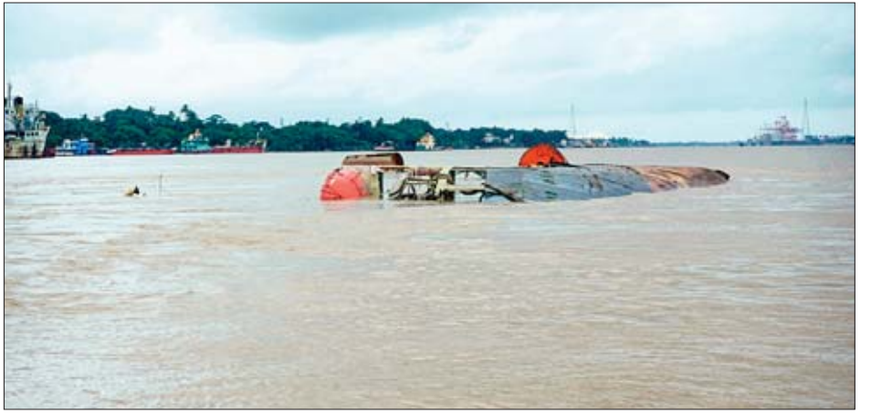
တွင် ချည်နှောင်ထားခဲ့ရာ အချိန်ကာလကြာရှည်စွာ တိမ်းစောင်းနှစ်မြုပ်ခဲ့ခြင်းဖြစ်ကြောင်း သိရသည်။ ထားခြင်းကြောင့် ဝမ်းဗိုက်အတွင်း ရေဝင်၍ လက်ဝဲဘက်သို့ သတင်းနှင့်ဓာတ်ပုံ-နိုင်လင်းကျော်(ဒလ)

MV HPA-AN သင်္ဘောသည် ယခင်က မြန်မာ့ ကြယ်ငါးပွင့်လုပ်ငန်းပိုင်သင်္ဘောဖြစ်ပြီး ၂၀၁၈ ခုနှစ်တွင် ရေယာဉ်ကြံ့ခိုင်မှုမရှိသဖြင့် ဖျက်သိမ်းခွင့်ကျခဲ့ရာ အဆိုပါရေယာဉ်အား လေလံတင်ရောင်းချခဲ့ကြောင်း သိရသည်။ ရေယာဉ်ကို သင်္ဘောဖျက်စက်ရုံတွင် ဖျက်ရန် အတွက် ရန်ကုန်မြစ်အတွင်း CCA (Country Crush Area)ရှိ မြန်မာ့ဆိပ်ကမ်းအာဏာပိုင် အရိန္ဒမာဘွဲ့