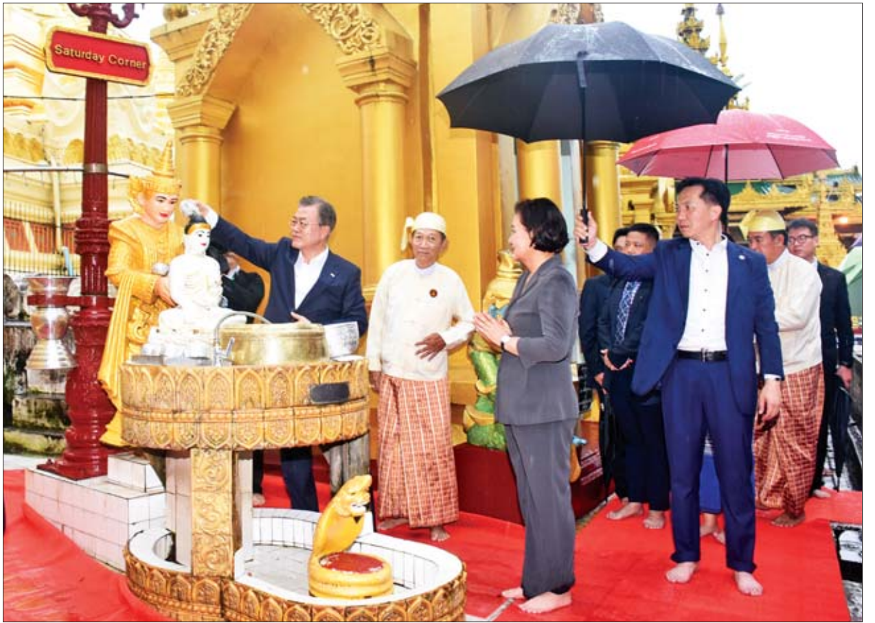
ကိုရီးယားသမ္မတနိုင်ငံ သမ္မတ မစ္စတာမွန်ဂျေအင်း၊ ရွှေတိဂုံစေတီတော် မွေးနေ့ မွေးနံ့ထောင်ရှိ ဗုဒ္ဓရုပ်ပွားတော်မြတ်အား ရေသပ္ပာယ်ပူဇော်စဉ်။

ထိုမှတစ်ဆင့် ကိုရီးယားသမ္မတနိုင်ငံ သမ္မတနှင့် ဇနီးတို့ ဦးဆောင်သော ချစ်ကြည်ရေး ကိုယ်စားလှယ်အဖွဲ့သည် ရွှေတိဂုံစေတီတော်သို့ သွားရောက်