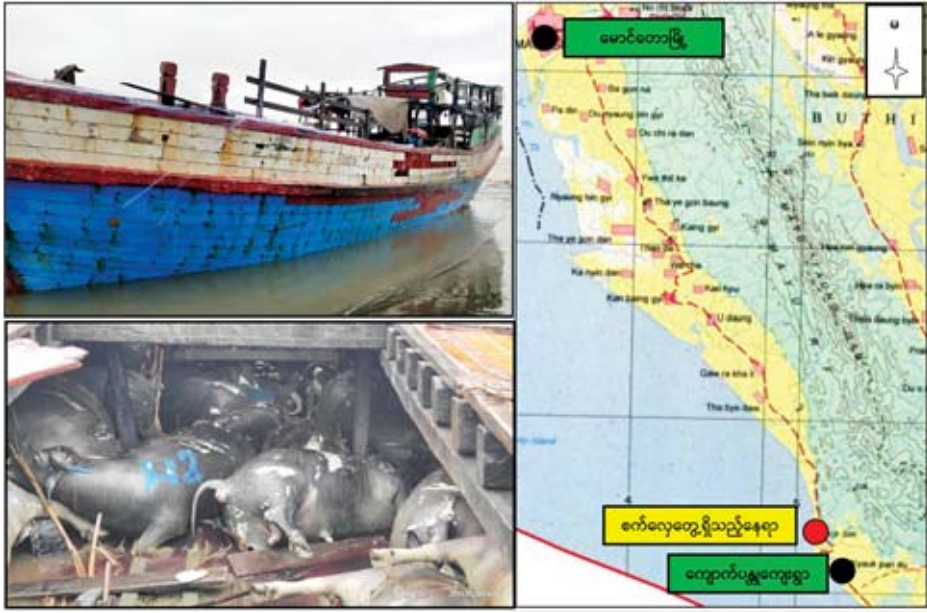
စက်လှေတွေ့ရှိသည့်နေရာနှင့် သေဆုံးပုပ်ပွနေသည့် ကျွဲ၊ နွားများကို တွေ့ရစဉ်။

နေပြည်တော် စက်တင်ဘာ ၄ မောင်တောမြို့နယ် ကျောက်ပန္နက်ကျေးရွာအနောက်ဘက် ပင်လယ်ကမ်းစပ်တွင် ယနေ့နံနက် ၈ နာရီက ပိုင်ရှင်မဲ့လှေတစ်စင်း တွေ့ရှိကြောင်း သတင်းအရ ရဲတပ်ဖွဲ့ဝင်များက သွားရောက်စစ်ဆေးရာ အလျားပေ ၆၀၊ အနံ ၁၈ ပေ၊ အမြင့်ပေ ၂၀၊ ရေစူး ၁၂ ပေခန့်ရှိ မြင်းကောင်ရေ ၁၈၀ အင်ဂျင်တပ်ဆင်ထားသော ဝါးလက်လှေတစ်စင်းအား ပိုင်ရှင်မဲ့တွေ့ရှိရကြောင်း၊ အဆိုပါလှေမှာ ဝဲဘက်နှင့် ယာဘက် ပျဉ်ကာများကွဲအက်၍ ခါးကျိုးကာ ရေများစိမ့်ဝင်နေကြောင်းနှင့် လှေပေါ်၌ သေဆုံးပုပ်ပွနေသည့် ကျွဲ၊ နွား အကောင် ၅၀ ခန့်အား တွေ့ရှိရ၍ စုံစမ်းစစ်ဆေးလျက်ရှိကြောင်း မြန်မာနိုင်ငံရဲတပ်ဖွဲ့မှ သတင်းရရှိသည်။