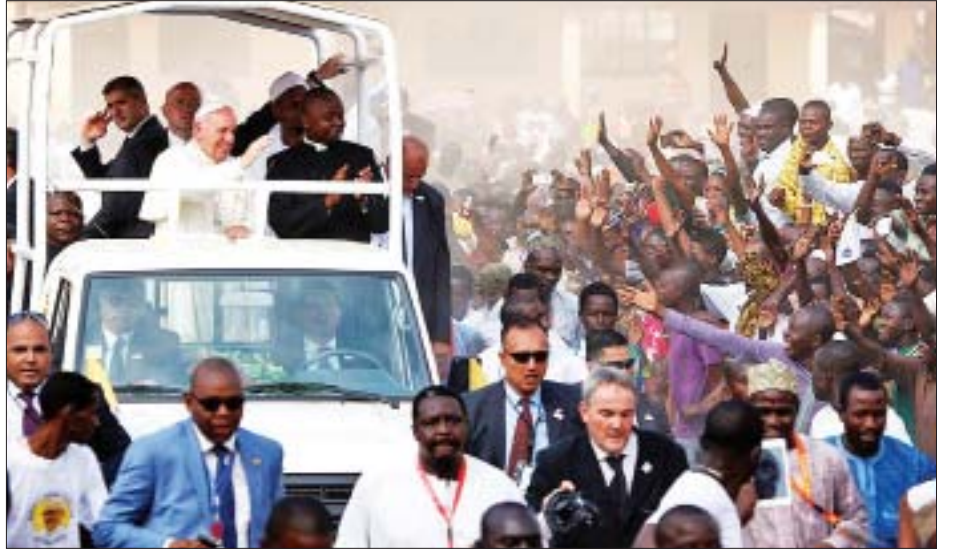
မာဒါဂါစကာကျွန်းနိုင်ငံနှင့် အိမ်နီးချင်းမောရီသျှန်နိုင်ငံ သို့လည်း သွားရောက်မည်ဖြစ်သည်။

ပုပ်ရဟန်းမင်းကြီးသည် အာဖရိကတိုက်အရှေ့ဘက် ကမ်းလွန်တွင် တည်ရှိသည့် အိန္ဒိယသမုဒ္ဒရာအတွင်းရှိ