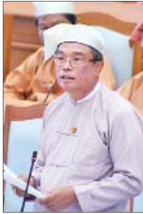
ဒုတိယအကြိမ် ပူးပေါင်းကော်မတီဝင်