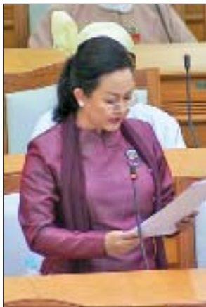
ဒုတိယအကြိမ် ပူးပေါင်းကော်မတီဝင်