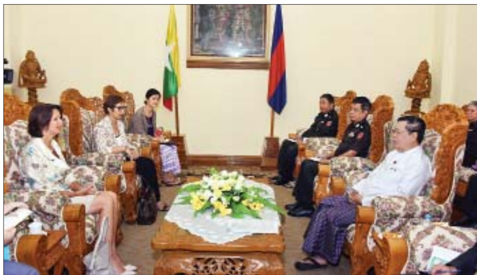
နေပြည်တော် စက်တင်ဘာ ၄ အလုပ်သမား၊ လူဝင်မှုကြီးကြပ်ရေးနှင့် ပြည်သူ့အင်အားဝန်ကြီးဌာန ပြည်ထောင်စုဝန်ကြီး ဦးသိန်းဆွေသည် ကုလသမဂ္ဂအတွင်းရေးမှူးချုပ်၏ မြန်မာနိုင်ငံဆိုင်ရာ