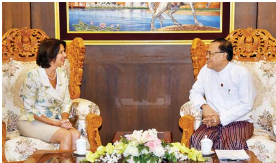
ခြိမ်းခြောက်တားဆီးနေမှုကြောင့် ဖြစ်ကြောင်း၊ နှစ်နိုင်ငံ အကြား သဘောတူညီချက်နှင့်အညီ သတ်မှတ်ပုံစံများကို နေရပ်ပြန်လိုသူများအား ဖြန့်ဝေဖြည့်စွက်ပေးပို့ရေး လုပ်ထုံးလုပ်နည်းများကို လိုက်နာမှုမရှိခြင်းမှာလည်း

နေပြည်တော် စက်တင်ဘာ ၄ အပြည်ပြည်ဆိုင်ရာ ပူးပေါင်းဆောင်ရွက်ရေးဝန်ကြီးဌာန ပြည်ထောင်စုဝန်ကြီး ဦးကျော်တင်သည် ကုလသမဂ္ဂ အတွင်းရေးမှူးချုပ်၏ မြန်မာနိုင်ငံဆိုင်ရာ အထူး ကိုယ်စားလှယ် Ms. Christine Schraner Burgener အား ယနေ့မနက် ၁ နာရီတွင် နေပြည်တော်ရှိ နိုင်ငံခြား ရေးဝန်ကြီးဌာန၌ လက်ခံတွေ့ဆုံသည်။ (ယာပုံ) ယင်းသို့တွေ့ဆုံစဉ် မြန်မာနိုင်ငံ၏ နောက်ဆုံးဖြစ်ပေါ် တိုးတက်မှုအခြေအနေများနှင့် ရခိုင်ပြည်နယ်မှ နေရပ် စွန့်ခွာသူများအား ပြန်လည်ပို့ဆောင်ရေးတွင် ကြုံတွေ့ နေရသော အတားအဆီးများအား ဖယ်ရှားနိုင်မည့် နည်းလမ်းများနှင့်ပတ်သက်၍ အမြင်ချင်းဖလှယ်ခဲ့ကြ သည်။