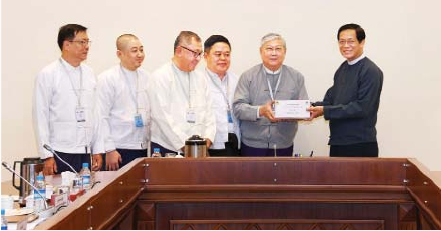
ဒုတိယသမ္မတ ဦးဟင်နရီဗန်ထီးယူ လမ်းနှင့်တံတား B.O.T လုပ်ငန်းရှင်များအသင်းမှ ကိုယ်စားလှယ်များက ရေဘေးသင့်ပြည်သူများအား ကယ်ဆယ်ရေးနှင့် ပြန်လည်ထူထောင်ရေးလုပ်ငန်းများအတွက် အလှူငွေများကို လက်ခံရယူစဉ်။

နေပြည်တော် စက်တင်ဘာ ၄ ရေဘေးသင့်ပြည်သူများအား ကယ်ဆယ်ရေးနှင့် ပြန်လည်ထူထောင်ရေးလုပ်ငန်းများအတွက် လမ်းနှင့် တံတား B.O.T လုပ်ငန်းရှင်များအသင်းမှ အလှူငွေ ပေးအပ်ပွဲအခမ်းအနားကို ယနေ့နံနက် ၁၁ နာရီတွင် နေပြည်တော်ရှိ နိုင်ငံတော်သမ္မတအိမ်တော် ဒုတိယ သမ္မတဦးစီးရုံးအစည်းအဝေးခန်းမ၌ ကျင်းပရာ အမျိုးသား သဘာဝဘေးအန္တရာယ်ဆိုင်ရာ စီမံခန့်ခွဲမှုကော်မတီဥက္ကဋ္ဌ ဒုတိယသမ္မတ ဦးဟင်နရီဗန်ထီးယူ တက်ရောက်အမှာ စကားပြောကြားသည်။