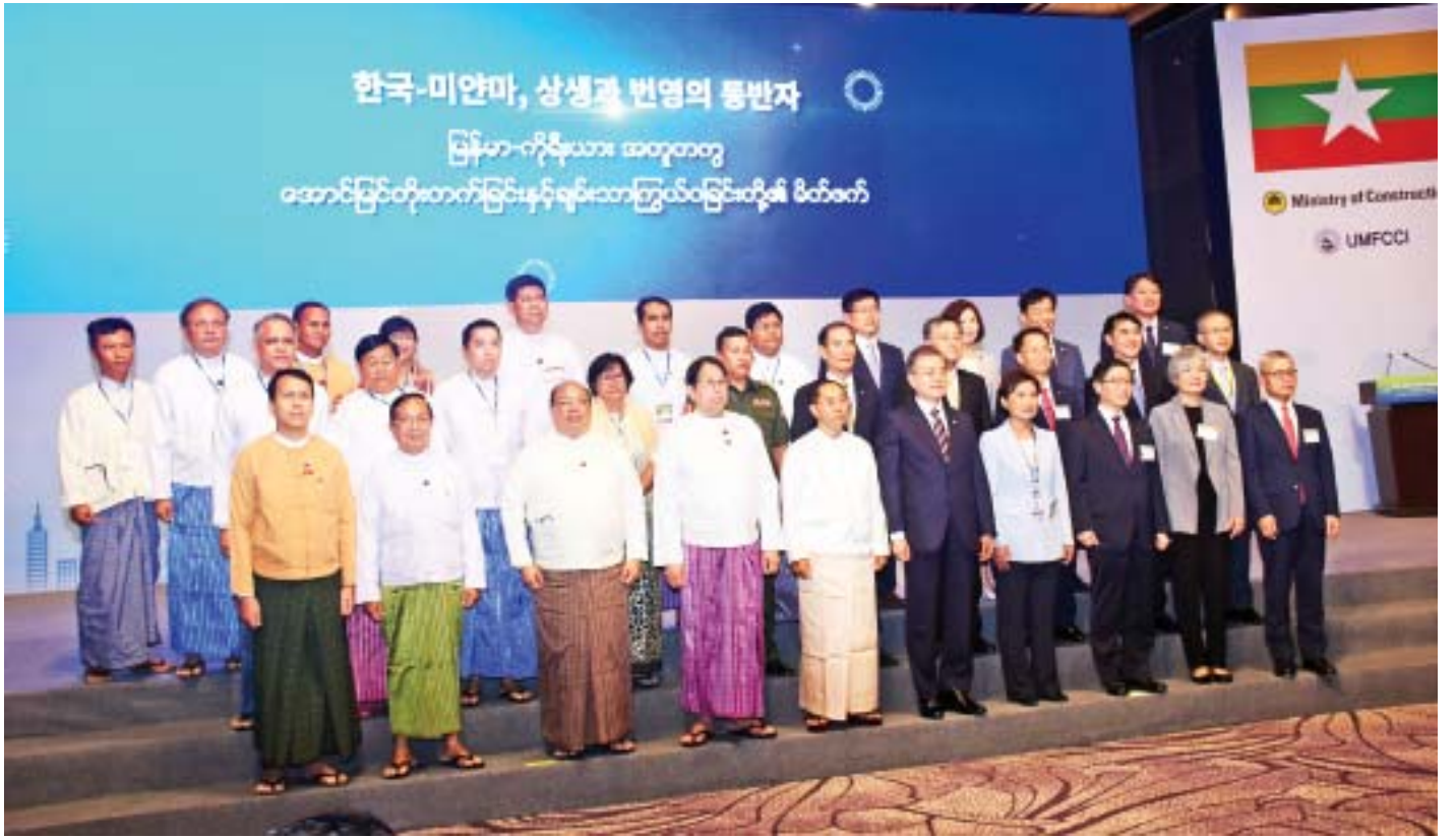
ကိုရီးယားသမ္မတနိုင်ငံ သမ္မတ မစ္စတာ မွန်ဂျေအင်း၊ ဒုတိယသမ္မတ ဦးမြင့်ဆွေ၊ ပြည်ထောင်စုဝန်ကြီးများနှင့် နှစ်ဖက်ကိုယ်စားလှယ်များ၊ မြန်မာ-ကိုရီးယား စီးပွားရေးပူးပေါင်းမှု စက်မှုဇုန် စတင်တည်ထောင်ခြင်း အခမ်းအနားတွင် စုပေါင်းမှတ်တမ်းတင်ဓာတ်ပုံရိုက်စဉ်။

ကိုရီးယား-မြန်မာ စီးပွားရေးပူးပေါင်းဆောင်ရွက်ရေး စက်မှုဇုန်စတင်ရေးအတွက် မြန်မာနိုင်ငံမှ ဆောက်လုပ်ရေး ဝန်ကြီးဌာနနှင့် ကိုရီးယားနိုင်ငံမှ မြေနှင့် အိုးအိမ်လုပ်ငန်း အဖွဲ့တို့၏ ကြိုးစားအားထုတ်မှုများအတွက် ကျေးဇူးတင်ရှိပါကြောင်းကို ပြောကြားလိုပါကြောင်း၊ မြန်မာနိုင်ငံသည် တရုတ်၊ အိန္ဒိယနှင့် အာဆီယံမှ စားသုံးသူ ၃ ဒသမ ၄ ဘီလီယံနှင့် ချိတ်ဆက်ပေးမည့် hub ဆုံချက်နေရာ