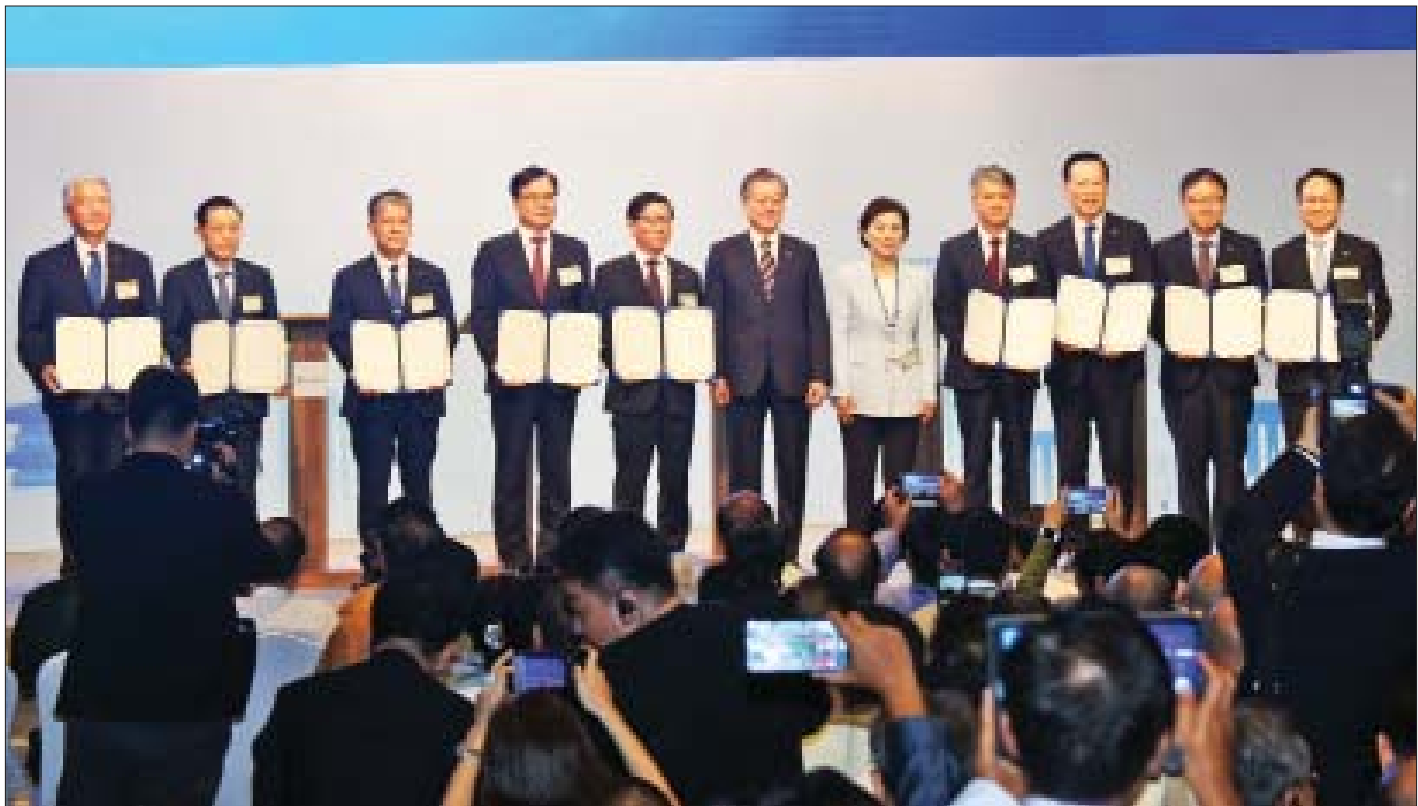
ကိုရီးယားသမ္မတနိုင်ငံ သမ္မတ မစ္စတာ မွန်ဂျေအင်း၊ မြန်မာနိုင်ငံတွင် ရင်းနှီးမြှုပ်နှံမှုကြမ္မာကို ကိုရီးယားသမ္မတနိုင်ငံမှ ကုမ္ပဏီ ကိုးခုတို့အကြား အပြန်အလှန်နားလည်မှု စာချုပ်လွှာလက်မှတ်ရေးထိုးကြပြီး စုပေါင်းမှတ်တမ်းတင်ဓာတ်ပုံရိုက်စဉ်။

ဖြစ်ပါကြောင်း၊ လူဦးရေ ၅၃ သန်းရှိပြီး အဆိုပါ လူဦးရေ၏ တစ်ဝက်က အသက် ၃၀ အောက် လူငယ်များဖြစ်သောကြောင့် မြန်မာနိုင်ငံသည် ငယ်ရွယ်ပြီး သွက်လက်သော နိုင်ငံဖြစ်ပါကြောင်း။