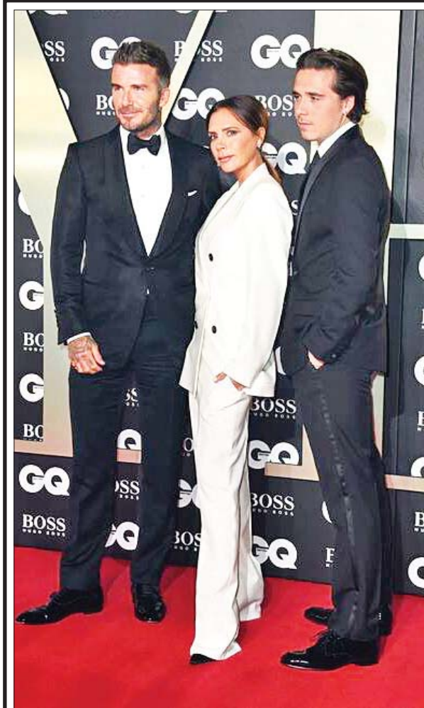
ယခုနှစ်အတွက် “ 2019 British GQ” ရဲ့ တစ်နှစ်တာအမျိုးသား ဆုပေးပွဲအခမ်းအနားကို တက်ရောက်လာတဲ့ ဒေးဗစ်ဘက်ခမ်း၊ ဗစ်တိုးရီး ယားဘက်ခမ်းနဲ့ ဘရူတ်ခ်လင်းဘက်ခမ်း (ဝဲမှယာ)။

ဂိုဟေဆန်းရဲ့ တရားရေးကိစ္စတွေကို ကိုယ်စားဆောင်ရွက်ပေးနေတဲ့ ဥပဒေအကျိုးဆောင်ကုမ္ပဏီက လက်ရှိမှာ ဂိုဟေဆန်းနဲ့ပတ်သက်ပြီး တရားရေး အရ ရင်ဆိုင်ရမယ့်ကိစ္စတွေမရှိသေးဘူးလို့လည်း ပြောကြားခဲ့ပါတယ်။