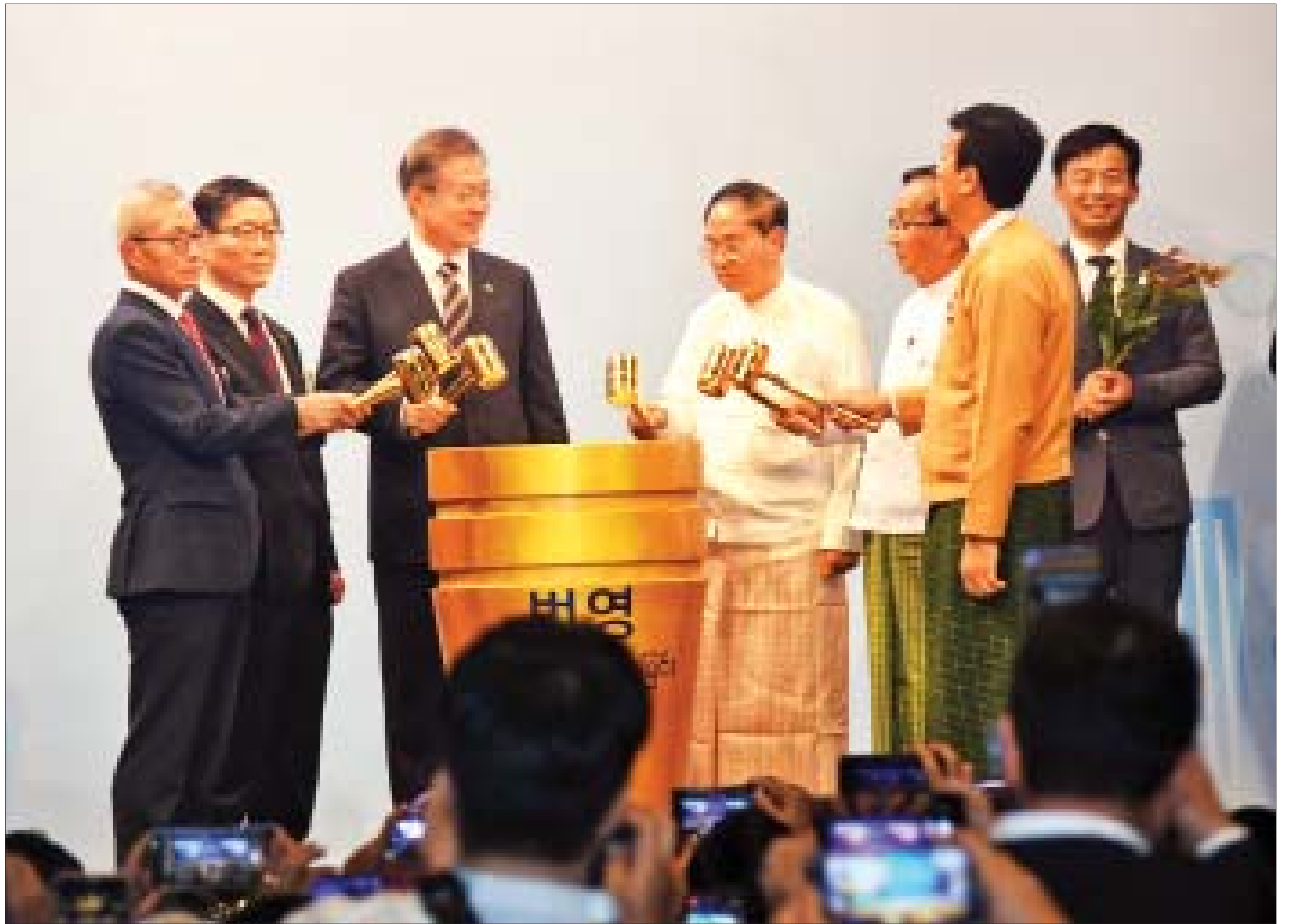
ကိုရီးယားသမ္မတနိုင်ငံ သမ္မတ မစ္စတာ မွန်ဂျေအင်း၊ ဒုတိယသမ္မတ ဦးမြင့်ဆွေ ပြည်ထောင်စုဝန်ကြီး ဦးဟန်ဇော်၊ ရန်ကုန်တိုင်းဒေသကြီး ဝန်ကြီးချုပ် ဦးမြိုးမင်းသိန်းတို့က မြန်မာ-ကိုရီးယား စီးပွားရေးပူးပေါင်းမှု စက်မှုဇုန်တည်ထောင်ခြင်း အထိမ်းအမှတ်အဖြစ် ပန္နက်တင်ပေးကြစဉ်။

၁၉၇၅ ခုနှစ် မြန်မာ-ကိုရီးယား နှစ်နိုင်ငံသံတမန်ဆက်ဆံရေး စတင်ချိန်မှစပြီး နှစ်နိုင်ငံ အပြန်အလှန်ခရီးစဉ်များနှင့် စီးပွားရေးကဏ္ဍများတွင် ပူးပေါင်းဆောင်ရွက်မှုများ မှတစ်ဆင့် နှစ်နိုင်ငံအကြား ဆက်ဆံရေးဆိုင်ရာလာခဲ့ပါကြောင်း၊ ယနေ့စတင်သည့် မြန်မာ-ကိုရီးယား စီးပွားရေးပူးပေါင်းဆောင်ရွက်ရေး စက်မှုဇုန်သည် မိတ်ဆွေဖြစ်သည့် ကိုရီးယားသမ္မတနိုင်ငံနှင့် ပူးပေါင်းဆောင်ရွက်မှုတွင် မှတ်တိုင်တစ်ရပ် ထပ်မံထူထောင်နိုင်မည်ဖြစ်သကဲ့သို့ ကိုရီးယားသမ္မတနိုင်ငံက ရင်းနှီးမြှုပ်နှံမှုများကို မြန်မာနိုင်ငံသို့ ပိုမိုဖိတ်ခေါ်နိုင်မည်ဖြစ်ပြီး နှစ်နိုင်ငံအကြား