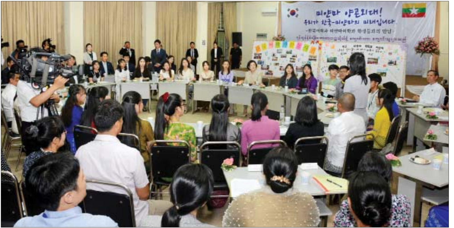
ကိုရီးယားသမ္မတနိုင်ငံ သမ္မတ မစ္စတာ မွန်ဂျေအင်း၏ဇနီး မစ္စမိ ကင်မ်ဂျောင်းဆုအား ကိုရီးယားဘာသာသင်တန်း တက်ရောက်နေကြသည့် ကျောင်းသား ကျောင်းသူများက မြန်မာ-ကိုရီးယား ဘာသာရပ်ဆိုင်ရာ သင်ကြားသင်ယူမှုအတွေ့အကြုံများကို ရှင်းလင်းပြောကြားစဉ်။

ရန်ကုန် စက်တင်ဘာ ၄ မြန်မာနိုင်ငံ၌ တရားဝင်ချစ်ကြည်ရေး ခရီးရောက်ရှိနေသည့် ကိုရီးယား သမ္မတနိုင်ငံ သမ္မတ မစ္စတာ မွန်ဂျေအင်း၏ဇနီး မစ္စမိ ကင်မ်ဂျောင်း ဆုသည် ယနေ့ မွန်းလွဲ ၂ နာရီတွင် ရန်ကုန်မြို့၊ ကမာရွတ်မြို့နယ် တက္ကသိုလ်ရိပ်သာလမ်းရှိ ရန်ကုန် နိုင်ငံခြားဘာသာတက္ကသိုလ်သို့ သွား ရောက်ပြီး ကိုရီးယားဘာသာသင်တန်း တက်ရောက်နေကြသည့် ကျောင်းသား ကျောင်းသူများနှင့် တွေ့ဆုံသည်။