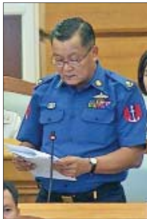
ဒုတိယအကြိမ် ပူးပေါင်းကော်မတီဝင်

နိုင်ငံဖြစ်သည်အတွက် နိုင်ငံ၏ GDP ကို အဓိက အထောက်အပံ့ပြုမည့် ဆန်၊ စပါး၊ လယ်ယာထွက်ကုန်များအတွက် သယ်ယူပို့ဆောင်ရေး အဆင်ပြေချောမွေ့စေမည့် ကျေးလက်လမ်းများအား ဦးစားပေးဆောင်ရွက်ရမည် ဖြစ်ပါကြောင်း၊ ထို့ကြောင့် ၂၀၃၀ ပြည့်နှစ်တွင် ကျေးလက်လမ်းအားလုံး၏ (၈၀)ရာခိုင်နှုန်းသည် ရာသီမရွေး သွားလာနိုင်သည့်လမ်းများအဖြစ် မဟာဗျူဟာချမှတ်ခဲ့ပါကြောင်း၊ မဟာဗျူဟာအတိုင်း အကောင်အထည်ဖော်ရန်အတွက် ADB အနေဖြင့် ယခုအချိန်ကစ၍ ကျေးလက်လမ်းများ ဆောင်ရွက်ရန် ချေးငွေစတင်ပေးခြင်း ဖြစ်ပါကြောင်း၊ ဒီဇင်ဘာလမတိုင်မီ စာချုပ်ချုပ်ဆိုနိုင်ပါက Grant အနေဖြင့် အမေရိကန်ဒေါ်လာ (၅ ဒသမ ၈) သန်းရရှိမည်ဖြစ်ပြီး ချေးငွေတန်ဖိုးသည် အမေရိကန်ဒေါ်လာ (၄၅ ဒသမ ၄) သန်းသို့ လျော့ကျသွားမည် ဖြစ်ပါကြောင်း။