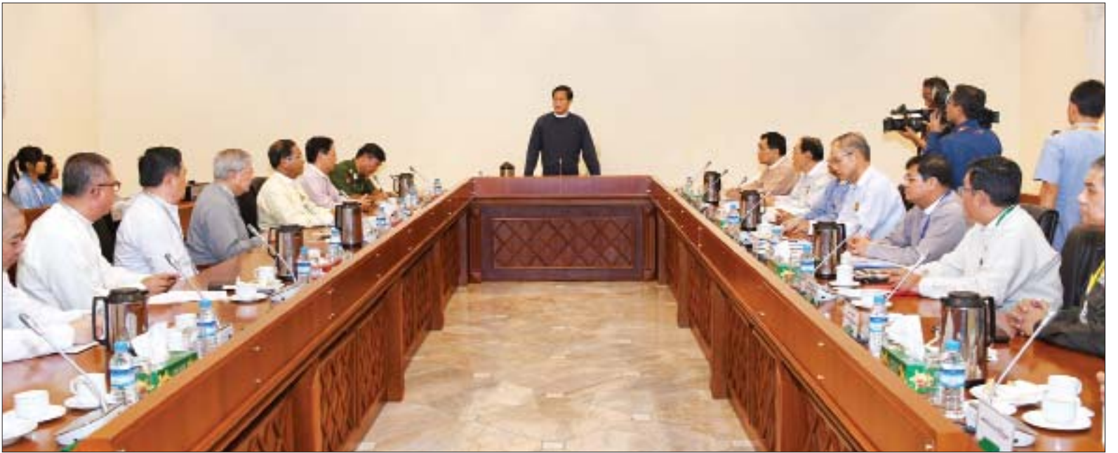
ဒုတိယသမ္မတ ဦးဟင်နရီဗန်ထီးယူ ရေဘေးသင့်ပြည်သူများအား ကယ်ဆယ်ရေးနှင့် ပြန်လည်ထူထောင်ရေးလုပ်ငန်းများအတွက် လမ်းနှင့် တံတား B.O.T လုပ်ငန်းရှင်များအသင်းမှ လှူဒါန်းသည့် အလှူငွေပေးအပ်ပွဲအခမ်းအနားတွင် အမှာစကားပြောကြားစဉ်။

ယခုနှစ် မိုးဦးကျတွင် မိုးသည်းထန်စွာ ရွာသွန်းခြင်းကြောင့် ရေကြီးခြင်းနှင့် မြေပြိုခြင်းဘေးများ ကြုံတွေ့ခံစားခဲ့ရသည့် ပြည်သူများအတွက် ပြန်လည်ထူထောင်ရေးလုပ်ငန်းများ ဆောင်ရွက်နိုင်ရန် လမ်းနှင့် တံတား B.O.T လုပ်ငန်းရှင်များအသင်းမှ အလှူငွေ ပေးအပ်လှူဒါန်းလာသည့် အတွက် သဘာဝဘေးဒဏ် ခံစား