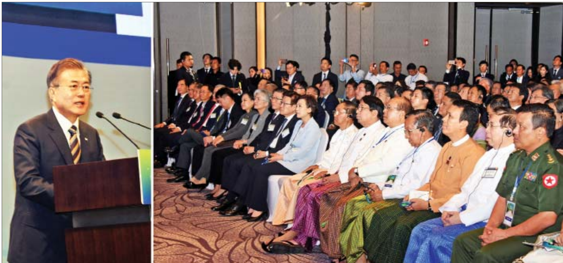
ကိုရီးယားသမ္မတနိုင်ငံ သမ္မတ မစ္စတာ မွန်ဂျေအင်း၊ မြန်မာ-ကိုရီးယား စီးပွားရေးပူးပေါင်းမှုစက်မှုဇုန် စတင်တည်ထောင်ခြင်းနှင့် မြန်မာ-ကိုရီးယား စီးပွားရေးဖိုရမ်တွင် မိန့်ခွန်းပြောကြားစဉ်နှင့် ဒုတိယသမ္မတ ဦးမြင့်ဆွေ၊ ပြည်ထောင်စုဝန်ကြီးများ၊ ရန်ကုန်တိုင်းဒေသကြီး ဝန်ကြီးချုပ်၊ နှစ်ဖက်ကိုယ်စားလှယ်များနှင့် တာဝန်ရှိသူများ၊ မြန်မာနှင့်ကိုရီးယား စီးပွားရေးလုပ်ငန်းရှင်များ တက်ရောက်ကြစဉ်။