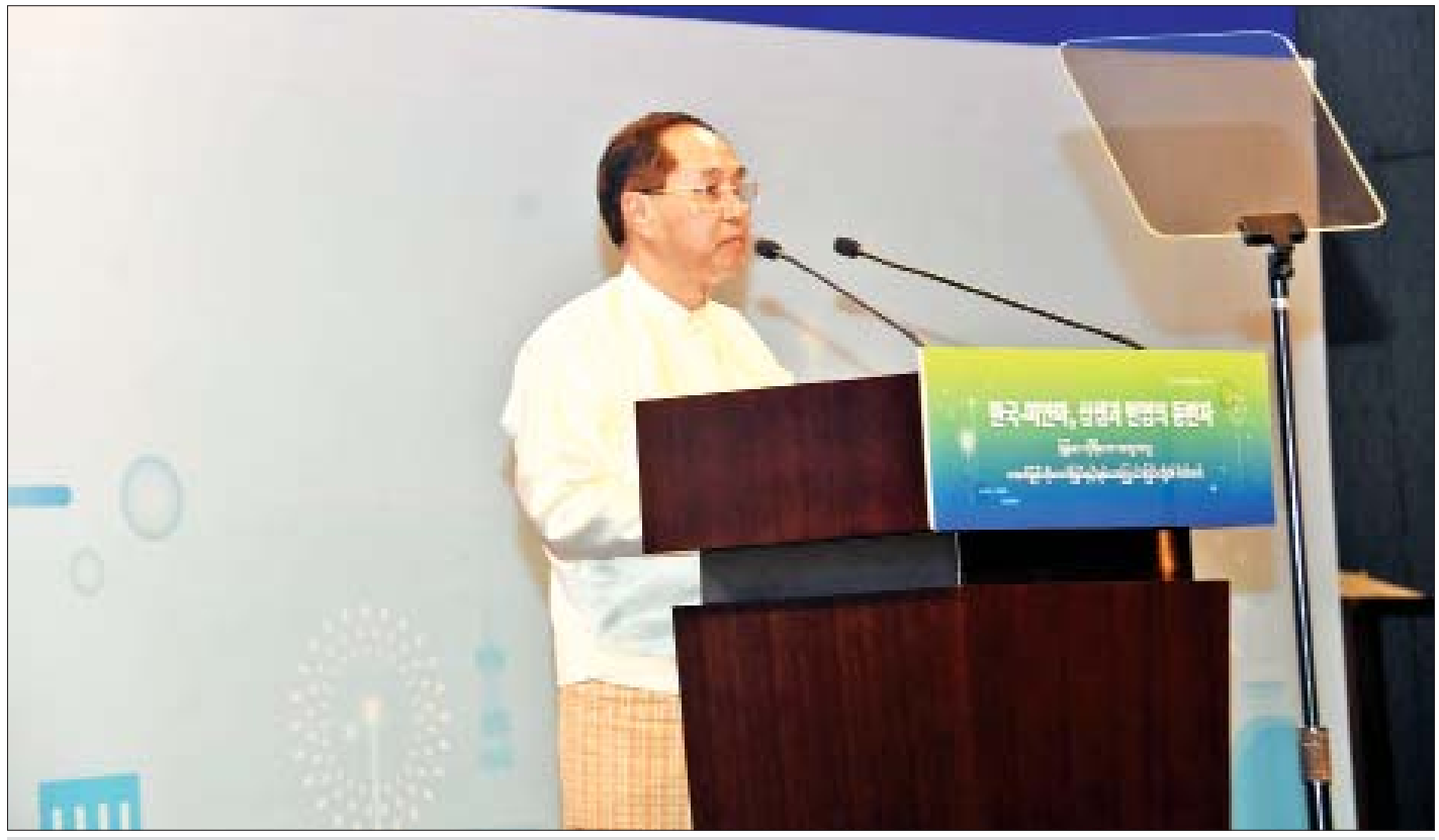
ဒုတိယသမ္မတ ဦးမြင့်ဆွေ မြန်မာ-ကိုရီးယား စီးပွားရေးပူးပေါင်းမှု စက်မှုဇုန်တည်ထောင်ခြင်းနှင့် မြန်မာ-ကိုရီးယား စီးပွားရေးဖိုရမ်တွင် မိန့်ခွန်းပြောကြားစဉ်။

မိမိတို့အနေဖြင့် သဘာဝပတ်ဝန်းကျင်နှင့် လူမှုပတ်ဝန်းကျင်ကို ထိခိုက်မှုမရှိစေဘဲ နိုင်ငံတော်နှင့် နိုင်ငံသားများကို အကျိုးရှိစေမည့် တာဝန်ယူမှုရှိသော ရင်းနှီးမြှုပ်နှံမှုလုပ်ငန်းများ ဖွံ့ဖြိုးတိုးတက်လာစေရန် ရည်ရွယ်ပြီး ရင်းနှီးမြှုပ်နှံမှုဆိုင်ရာ အဆိုပြုချက်များကို စိစစ်အတည်ပြုရာတွင် သဘာဝပတ်ဝန်းကျင်နှင့် လူမှုပတ်ဝန်းကျင်ထိန်းသိမ်းပြီး တာဝန်ယူမှုရှိသည့် စီးပွားရေးလုပ်ငန်းများကို ဦးစားပေးလျက်ရှိပါကြောင်း၊ ကိုရီးယားသမ္မတနိုင်ငံ၏ ရင်းနှီးမြှုပ်နှံမှုများသည် မြန်မာနိုင်ငံ၏