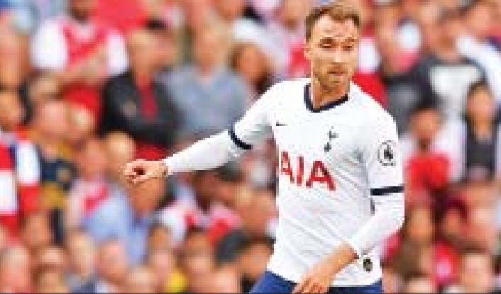
ငွေကြယ် - ရေးသားသည်

ကွင်းလယ်ကစားသမား အဲရစ်ဆင်အနေနဲ့ အပြောင်းအရွှေ့ကိစ္စကို သဘောတူညီခဲ့မယ် ဆိုရင် မန်ယူအသင်းက ပြောင်းရွှေ့ကြေး ပေါင်သန်း ၇၀ အောက် သုံးစွဲသွားမယ်လို့လည်း ဆိုပါတယ်။ အဲရစ်ဆင်ဟာ စပါးအသင်းနဲ့ အာဆင်နယ်အသင်းတို့ ထိပ်တိုက်တွေ့ဆုံခဲ့တဲ့ မြောက်လန်ဒန်ဒါဘီပွဲမှာလည်း စပါးအသင်းအတွက် တစ်ဂိုးသွင်းယူပေးခဲ့သူဖြစ်ပါတယ်။