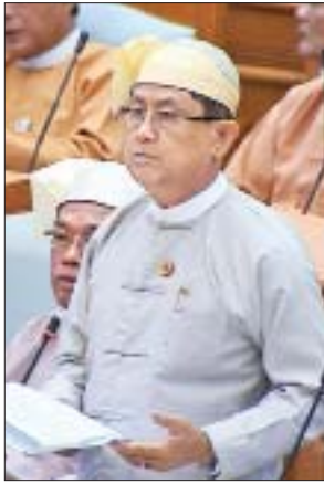
ဒုတိယအကြိမ် ပူးပေါင်းကော်မတီဝင်

ဒုတိယအကြိမ် ပူးပေါင်းကော်မတီဝင်က မိမိတို့နိုင်ငံသည် လယ်ယာစိုက်ပျိုးရေး