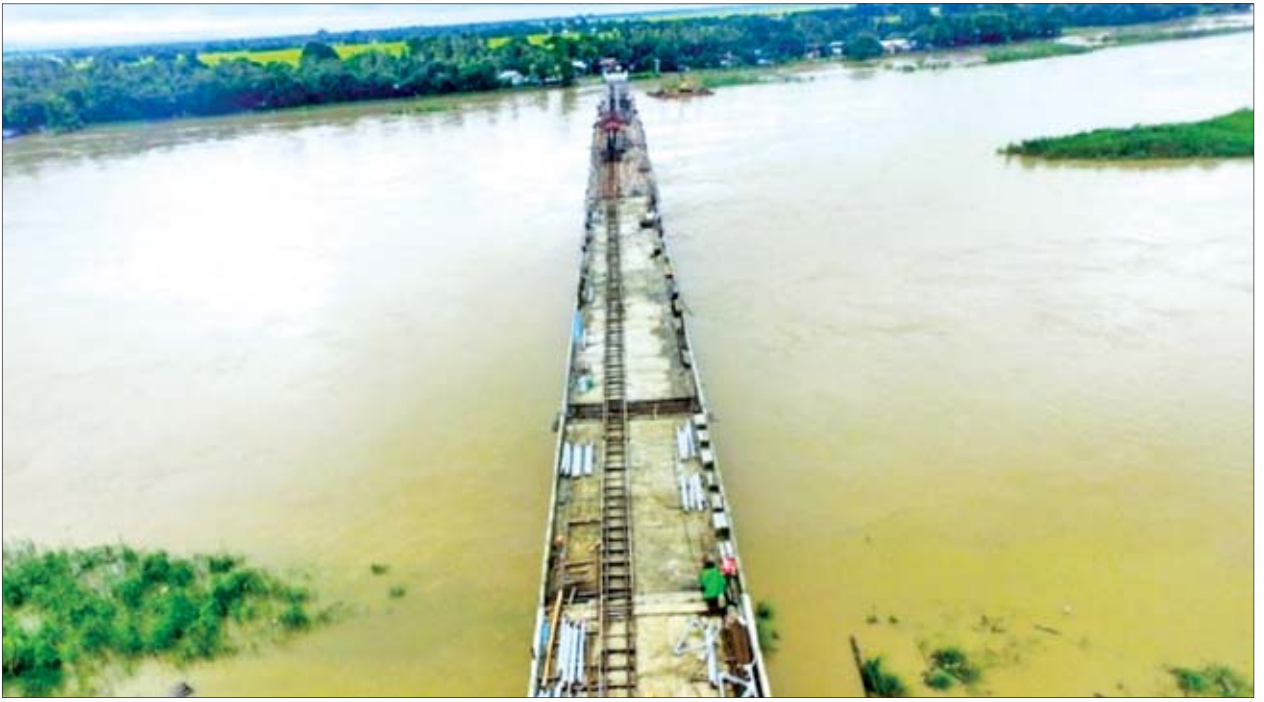
စစ်တောင်းမြစ်ကူးတံတား(မြို့စို)တည်ဆောက်နေမှုကို တွေ့ရစဉ်။

စစ်တောင်းမြစ်ကူးတံတား(မြို့စို)မှာ အရှည်ပေ ၁၂၀၀ ရှိပြီး လူသွားလမ်းအကျယ် တစ်ဖက်လျှင် သုံးပေစီနှင့် ယာဉ်သွားလမ်းအကျယ် ၂၄ ပေ၊ စုစုပေါင်းတံတားအကျယ် ပေ ၃၀ ရှိသော သံကူကွန်ကရစ်တံတား ဖြစ်သည်။ တံတားခန်းဖွင့် ဖွဲ့စည်းပုံအရ ခန်းဖွင့်အရှည်ပေ ၆၀ လေးခန်းနှင့် စာမျက်နှာ ၁၂ ကော်လံ ၁ သို့ ၀