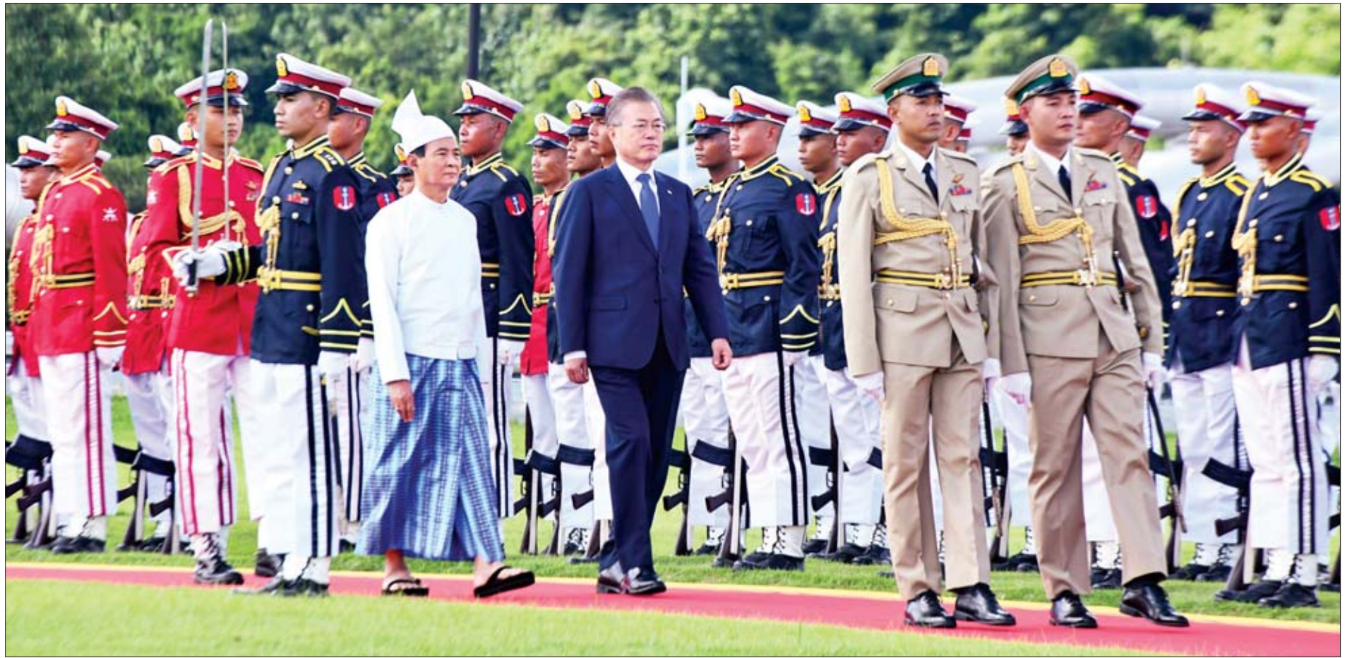
နိုင်ငံတော်သမ္မတ ဦးဝင်းမြင့်နှင့် ကိုရီးယားသမ္မတနိုင်ငံ သမ္မတ မစ္စတာ မွန်ဂျေအင်းတို့ ဂုဏ်ပြုတပ်ဖွဲ့ကို စစ်ဆေးကြစဉ်။