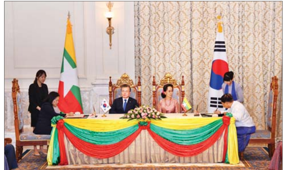
နိုင်ငံတော်၏အတိုင်ပင်ခံပုဂ္ဂိုလ် ဒေါ်အောင်ဆန်းစုကြည်နှင့် ကိုရီးယားသမ္မတနိုင်ငံ သမ္မတ မစ္စတာ မွန်ဂျေအင်းတို့ ရှေ့မှောက်၌ ပြည်ထောင်စုဝန်ကြီး ဒေါက်တာသန်းမြင့်နှင့် ကိုရီးယားသမ္မတနိုင်ငံ ကုန်သွယ်ရေးဝန်ကြီး Ms. Yoo Myung-hee တို့ နားလည်မှုစာချုပ်လွှာများကို လက်မှတ်ရေးထိုးကြစဉ်။

ရင်းနှီးမြှုပ်နှံမှု ပြုလုပ်ရာတွင် ပိုမိုလွယ်ကူချောမွေ့စေရန် အတွက် ရန်ကုန်မြို့တွင် သတင်းအချက်အလက်စင်တာ တစ်ခု တည်ထောင်သွားရေး၊ သဘာဝပတ်ဝန်းကျင်နှင့် ဇီဝမျိုးစုံမျိုးကွဲ ထိန်းသိမ်းစောင့်ရှောက်ရေးဆိုင်ရာ ပူးပေါင်းဆောင်ရွက်ရေး၊ ခရီးသွားလုပ်ငန်း တိုးမြှင့်နိုင်ရေး အတွက် ၂၀၁၈ ခုနှစ် အောက်တိုဘာ ၁ ရက်က ဝီဇာ ကင်းလွတ်ခွင့်ပြုခဲ့ပြီးနောက်ပိုင်း ကိုရီးယားနိုင်ငံမှ ခရီးသွားဧည့်သည်များ သိသာစွာ တိုးမြှင့်လာသည့်အတွက် ကိုရီးယားခရီးသွားများအတွက် ဝီဇာကင်းလွတ်ခွင့်ကို