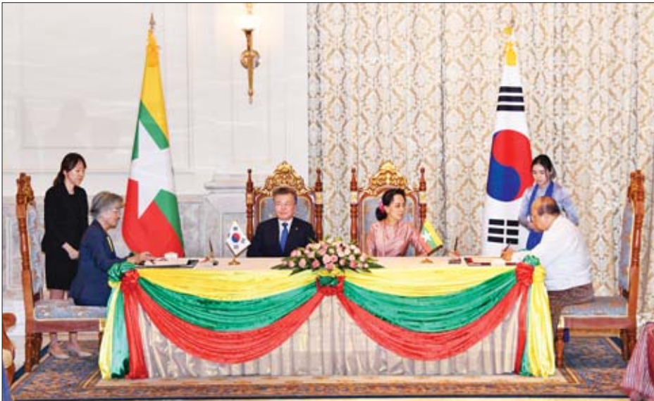
နိုင်ငံတော်၏အတိုင်ပင်ခံပုဂ္ဂိုလ် ဒေါ်အောင်ဆန်းစုကြည်နှင့် ကိုရီးယားသမ္မတနိုင်ငံ သမ္မတ မစ္စတာ မွန်ဂျေအင်းတို့ ရှေ့မှောက်၌ ပြည်ထောင်စုဝန်ကြီး ဦးသောင်းထွန်းနှင့် ကိုရီးယားသမ္မတနိုင်ငံ နိုင်ငံခြားရေးဝန်ကြီး Ms. Kang Kyung-wha တို့ ချေးငွေဆိုင်ရာ မူဘောင်သဘောတူညီချက်ကို လက်မှတ်ရေးထိုးကြစဉ်။

အတွက် ချေးငွေဆိုင်ရာမူဘောင်သဘောတူညီချက်ကို ရင်းနှီးမြှုပ်နှံမှုနှင့် နိုင်ငံခြားစီးပွားဆက်သွယ်ရေးဝန်ကြီး ဌာန ပြည်ထောင်စုဝန်ကြီး ဦးသောင်းထွန်းနှင့် ကိုရီးယား သမ္မတနိုင်ငံ နိုင်ငံခြားရေးဝန်ကြီး Ms. Kang Kyung-wha တို့ကလည်းကောင်း၊ ကုန်သွယ်ရေးနှင့် စက်မှုဆိုင်ရာ ပူးပေါင်းဆောင်ရွက်ရေး နားလည်မှုစာချုပ်လွှာနှင့် ကိုရီးယားနိုင်ငံမှ မြန်မာနိုင်ငံ၌ လာရောက်ရင်းနှီးမြှုပ်နှံမှု ပြုလုပ်ရာတွင် ပိုမိုလွယ်ကူချောမွေ့စေရန်အတွက် ရန်ကုန် မြို့တွင် သတင်းအချက်အလက်စင်တာတစ်ခု တည်ထောင် ရေးဆိုင်ရာ နားလည်မှုစာချုပ်လွှာကို စီးပွားရေးနှင့် ကူးသန်းရောင်းဝယ်ရေးဝန်ကြီးဌာန ပြည်ထောင်စုဝန်ကြီး ဒေါက်တာသန်းမြင့်နှင့် ကိုရီးယားသမ္မတနိုင်ငံ ကုန်သွယ် ရေးဝန်ကြီး Ms. Yoo Myung-hee တို့ကလည်းကောင်း၊ လက်မှတ်ရေးထိုးကြပြီး အပြန်အလှန်လဲလှယ်ကြသည်။