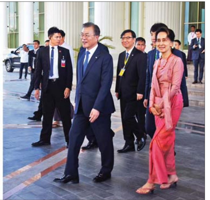
နိုင်ငံတော်၏အတိုင်ပင်ခံပုဂ္ဂိုလ် ဒေါ်အောင်ဆန်းစုကြည်နှင့် ကိုရီးယားသမ္မတနိုင်ငံသမ္မတ မစ္စတာ မွန်ဂျေအင်းတို့ ကိုရီးယားသမ္မတနိုင်ငံမှ ပညာရေးဝန်ကြီးဌာနသို့ လှူဒါန်းသည့် ကျောင်းကားများကို ကြည့်ရှုကြစဉ်။