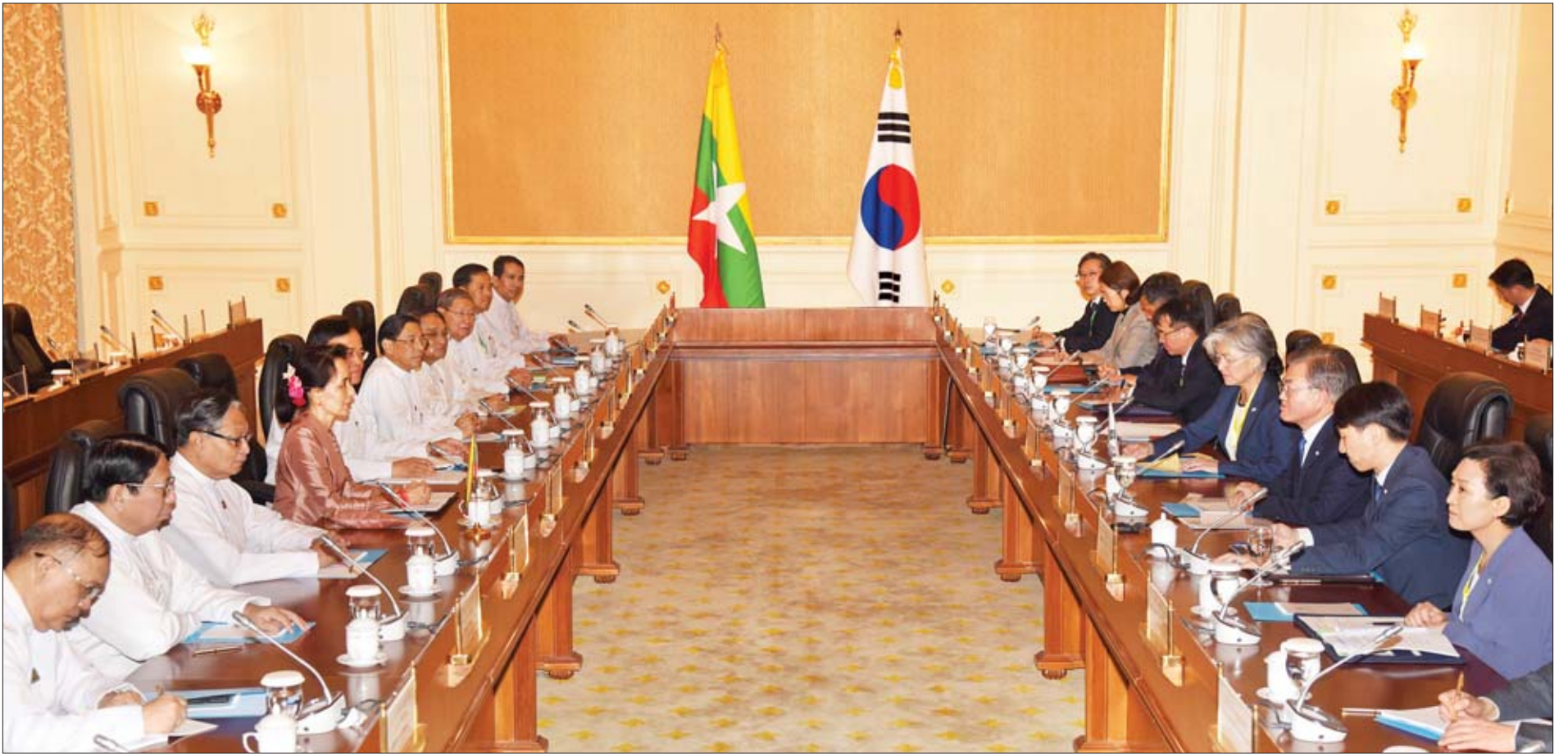
နိုင်ငံတော်၏အတိုင်ပင်ခံပုဂ္ဂိုလ် ဒေါ်အောင်ဆန်းစုကြည်နှင့် ကိုရီးယားသမ္မတနိုင်ငံ သမ္မတ မစ္စတာ မွန်ဂျေအင်းတို့ မြန်မာ-ကိုရီးယား နှစ်နိုင်ငံတွေ့ဆုံဆွေးနွေးပွဲသို့ တက်ရောက်ဆွေးနွေးကြစဉ်။

နိုင်ငံတော်၏အတိုင်ပင်ခံပုဂ္ဂိုလ်မှ ကျင်းပရာ နိုင်ငံတော်၏အတိုင်ပင်ခံပုဂ္ဂိုလ် ဒေါ်အောင်ဆန်းစုကြည်နှင့် ကိုရီးယားသမ္မတနိုင်ငံ သမ္မတ မစ္စတာ မွန်ဂျေအင်းတို့ တက်ရောက်ဆွေးနွေးကြသည်။ တက်ကြွစွာအထောက်အကူပြု နှစ်နိုင်ငံတွေ့ဆုံဆွေးနွေးပွဲတွင် နှစ်နိုင်ငံပြည်သူ အချင်းချင်း ထိတွေ့ဆက်ဆံမှု ပိုမိုတိုးမြှင့်ရေး၊ နှစ်နိုင်ငံ အကြား ယဉ်ကျေးမှုကဏ္ဍ၊ ပညာရေးကဏ္ဍ၊ ကုန်သွယ်မှု ကဏ္ဍ၊ ရင်းနှီးမြှုပ်နှံမှုကဏ္ဍ၊ အခြေခံအဆောက်အအုံ၊ စွမ်းအင်၊ ငွေကြေးနှင့် ဘဏ္ဍာရေးကဏ္ဍများတွင် ပိုမို ပူးပေါင်းဆောင်ရွက်သွားရေး၊ မြန်မာနိုင်ငံ၏ ကျေးလက် ဒေသဖွံ့ဖြိုးရေးအတွက် လယ်ယာကဏ္ဍတွင် အတွေ့အကြုံ နှင့် နည်းပညာများဖလှယ်ခြင်းဖြင့် ဆက်လက်အကူအညီ ပေးအပ်ရေး၊ ကိုရီးယားနိုင်ငံမှ မြန်မာနိုင်ငံတွင် လာရောက်