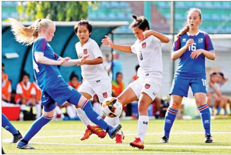
မြန်မာယူ-၁၅ အမျိုးသမီးအသင်းနှင့် အိုက်စလန်အသင်းတို့ ယှဉ်ပြိုင်ကစားကြစဉ်။