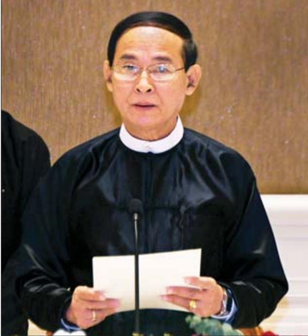
နိုင်ငံတော်သမ္မတ ဦးဝင်းမြင့် မိန့်ခွန်းပြောကြားစဉ်။

ယခုခရီးစဉ်သည် အဆွေတော်အနေဖြင့် မြန်မာနိုင်ငံကို လာရောက်သည့် ပထမဦးဆုံး ခရီးစဉ်ဖြစ်သကဲ့သို့ ကိုရီးယားနိုင်ငံမှ ၂၀၁၂ ခုနှစ်နောက်ပိုင်း ပထမဆုံးလာရောက်သည့် နိုင်ငံတော်အဆင့် ခရီးစဉ်ဖြစ်သည်အတွက် မြန်မာ-ကိုရီးယား နှစ်နိုင်ငံဆက်ဆံရေးအတွက် သမိုင်းမှတ်တမ်းဝင်တစ်ခုလည်း ဖြစ်ပါကြောင်း၊ ထို့အပြင် အဆွေတော်၏ ယခုချစ်ကြည်ရေးခရီးစဉ်သည် မြန်မာနိုင်ငံနှင့် ကိုရီးယားသမ္မတနိုင်ငံအကြား ရှိရင်းစွဲ ချစ်ကြည်ရင်းနှီးမှုကို ပိုမိုခိုင်မာလာစေရန် အထောက်အကူပြုမည်ဟု ယုံကြည်ပါကြောင်း။