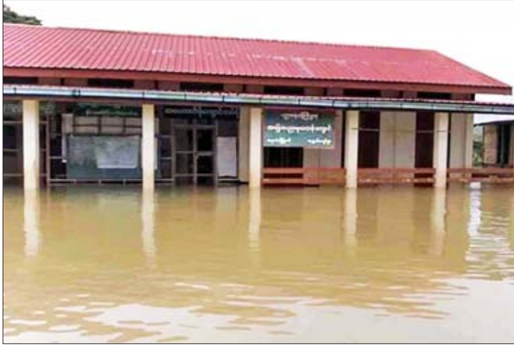
လေးကျောင်းနှင့် စက်တင်ဘာ ၃ ရက်တွင် နှစ်ကျောင်း စုစုပေါင်း အခြေခံပညာကျောင်း ပေါင်း ၁၇ ကျောင်းကို အဆိုပါကျောင်း များ၏ ကျောင်းဝင်းအတွင်းနှင့် ကျောင်းသွား လမ်းများတွင် မြစ်ရေဝင်နေခြင်း၊ လမ်းပန်း ဆက်သွယ်ရေး ခက်ခဲမှုများကြောင့်

တနင်္သာရီ စက်တင်ဘာ ၃ တနင်္သာရီတိုင်းဒေသကြီး တနင်္သာရီမြစ်နယ် အတွင်း ဩဂုတ် ၂၇ ရက်မှစ၍ (ဒုတိယ အကြိမ်) စိုးရိမ်ရေမှတ် ၁၇ ပေအထက် ကျော်လွန်ကာ စက်တင်ဘာ ၃ ရက် နံနက် ၆ နာရီတိုင်းတာချက်အရ ပေ ၂၀ နှင့် ၆ လက်မအထိ မြစ်ရေထပ်တက်နေမှုကြောင့် စက်တင်ဘာ ၃ ရက် နံနက်ပိုင်းက ခြောက်မိုင်ကျေးရွာ မူလတန်း (လွန်) ကျောင်းနှင့် ပဝထိန်ကျေးရွာ အမက ကျောင်းနှစ်ကျောင်းကို ထပ်မံပိတ်ထားရ ပြီး စုစုပေါင်း ၁၇ ကျောင်း ယာယီပိတ်ထား ရကြောင်း သိရသည်။