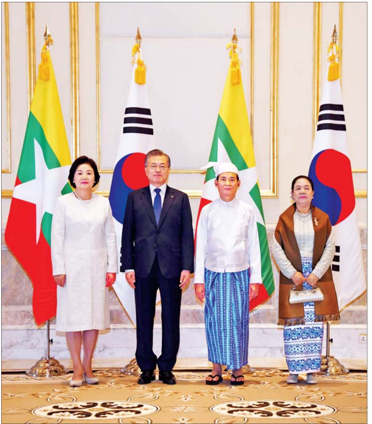
နိုင်ငံတော်သမ္မတ ဦးဝင်းမြင့်နှင့်ဇနီး ဒေါ်ချိုချို၊ ကိုရီးယားသမ္မတနိုင်ငံ သမ္မတ မစ္စတာ မွန်ဂျေအင်းနှင့် ဇနီး မစ္စစ် ကင်မ်ဂျောင်းဆုတို မှတ်တမ်းတင် ဓာတ်ပုံရိုက်စဉ်။