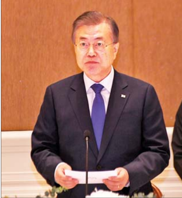
ကိုရီးယားသမ္မတနိုင်ငံ သမ္မတ မစ္စတာ မွန်ဂျေအင်း မိန့်ခွန်းပြောကြားစဉ်။

တူညီသည့် အတွေ့အကြုံများရှိခဲ့ကြသည်အတွက် ယင်းအတွေ့အကြုံများက နှစ်နိုင်ငံ ပိုမိုနီးစပ်မှုရှိစေခဲ့ပါကြောင်း။