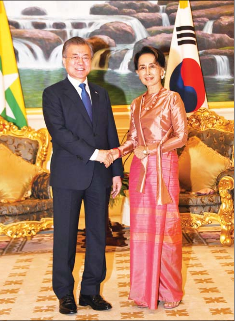
နိုင်ငံတော်သမ္မတ ဦးဝင်းမြင့် ကိုရီးယားသမ္မတနိုင်ငံ သမ္မတ မစ္စတာ မွန်ဂျေအင်းအား ရင်းရင်းနှီးနှီးနှုတ်ဆက်စဉ်။