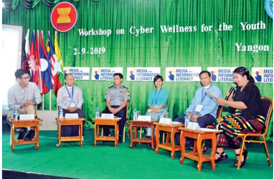
လူငယ်များအတွက် ဆိုက်ဘာအသိပညာပေးဆိုင်ရာ အလုပ်ရုံဆွေးနွေးပွဲ ကျင်းပစဉ်။

သံကြားက ဦးဆောင်ကျင်းပခြင်း ဖြစ်သည်။ အလုပ်ရုံ ဆွေးနွေးပွဲတွင် ပြည်ထောင်စုဝန်ကြီး ဒေါက်တာ ဖေမြင့်က ကမ္ဘာတစ်ဝန်းတွင် ဆိုက်ဘာရာဇဝတ်မှုများ၊ ဆိုက်ဘာ ခြိမ်းခြောက်မှုများ တိုးတက်များပြား လာသည်ကို အားလုံးအသိပင် ဖြစ်ပါ ကြောင်း၊ မြန်မာနိုင်ငံမှ ကျောင်းသား ကျောင်းသူ လူငယ်လူရွယ်များအနေ