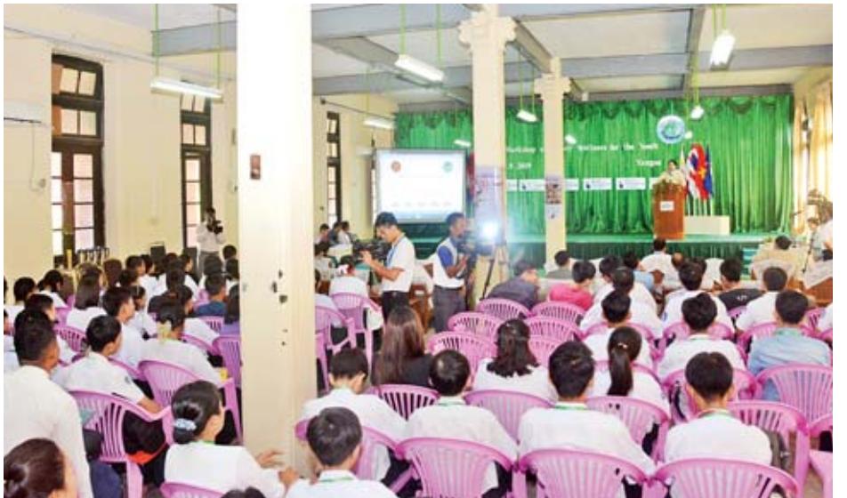
ပြည်ထောင်စုဝန်ကြီး ဒေါက်တာဖေမြင့် လူငယ်များအတွက် ဆိုက်ဘာအသိပညာပေးဆိုင်ရာ အလုပ်ရုံဆွေးနွေး ပွဲတွင် အမှာစကားပြောကြားစဉ်။

ယနေ့တွင် ဆက်သွယ်ရေးကဏ္ဍ များ များစွာဖွံ့ဖြိုးတိုးတက်လာပြီ ဖြစ်သကဲ့သို့ တစ်ကမ္ဘာလုံး ဖြန့်ကြက် ဆက်သွယ်နိုင်ပြီး IT ကဏ္ဍ အပါအဝင် ဖြစ်သည့် အင်ဂျင်နီယာ၊ အင်တာနက် ဝန်ဆောင်မှုများနှင့် Cyberspace နည်းပညာအား များစွာအသုံးပြုနေ ကြပြီဖြစ်ပါကြောင်း၊ နည်းပညာများ၊ ပစ္စည်းကိရိယာများကို အသုံးပြု၍ Cyberspace ဝေဖန် မိမိအယူအဆ များကို အမျိုးမျိုးအဖုံဖုံ ဖြန့်ချိရသည့် အပြင် ကွန်ပျူတာ၊ အင်ဂျင်နီယာ၊ IT တို့ကို အသုံးပြု၍ Cyberspace မှ တစ်ဆင့် နိုင်ငံရေး၊ စီးပွားရေး၊ လူမှုရေး ကိစ္စမျိုးစုံကို လှုပ်ရှားဆောင်ရွက်နေ ကြပြီ ဖြစ်ပါကြောင်း၊ ယင်းလှုပ်ရှား ဆောင်ရွက်မှုများတွင် လူငယ်များ အနေဖြင့် IT နည်းပညာအပေါ် ပိုမို