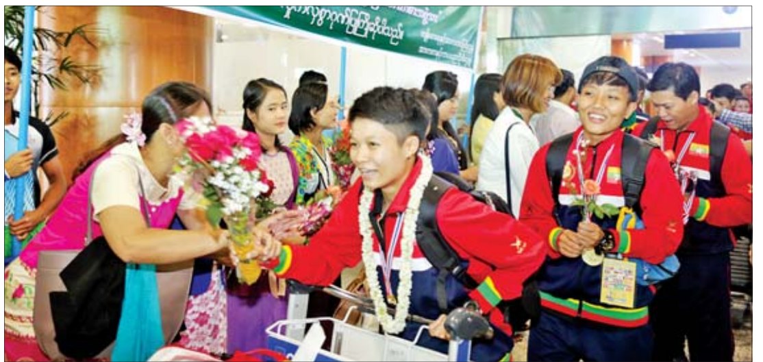
အောင်ပွဲရ မြန်မာပိုက်ကျော်ခြင်းအားကစားအဖွဲ့အား ရန်ကုန်အပြည်ပြည်ဆိုင်ရာလေဆိပ်၌ ကြိုဆိုနှုတ်ဆက်ကြစဉ်။

ရန်ကုန် စက်တင်ဘာ ၂ ထိုင်းနိုင်ငံ ဗန်ကောက်မြို့တွင် ဩဂုတ် ၂၅ ရက်မှ စက်တင်ဘာ ၁ ရက်အထိ ထိုင်းဘုရင့်ဖလား ကမ္ဘာ့ချန်ပီယံရှစ် ပိုက်ကျော်ခြင်းပြိုင်ပွဲကို ကျင်းပခဲ့ရာ နိုင်ငံပေါင်း ၃၆ နိုင်ငံမှ ဝင်ရောက်ယှဉ်ပြိုင်ခဲ့ပြီး မြန်မာအသင်းက ရွှေတံဆိပ် နှစ်ခု၊ ငွေတံဆိပ် တစ်ခုနှင့် ကြေးတံဆိပ် တစ်ခု ဆွတ်ခူးရရှိခဲ့သည်။ ပြိုင်ပွဲများအပြီးတွင် အမျိုးသား နှစ်ယောက်တွင် မြန်မာအသင်းက ပထမ၊ တောင်ကိုရီးယားအသင်းက ဒုတိယနှင့် မလေးရှားအသင်းနှင့် အင်ဒိုနီးရှားအသင်းတို့က ပူးတွဲ စာမျက်နှာ ၁၁ ကော်လံ ၄ သို့