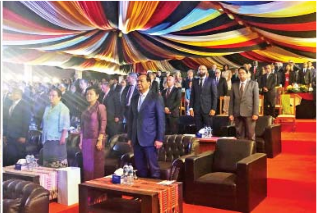
ပြည်ထောင်စုဝန်ကြီး ဒေါက်တာဖေမြင့် တီမောလက်စ်တေနိုင်ငံ၏ ပြည်လုံးကျွတ်ဆန္ဒခံယူပွဲ နှစ်(၂၀)ပြည့် အထိမ်းအမှတ်အခမ်းအနား တက်ရောက်စဉ်။