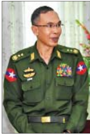
ပြည်ထောင်စုဝန်ကြီး ဒုတိယဗိုလ်ချုပ်ကြီး စိန်ဝင်း