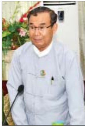
ပြည်ထောင်စုဝန်ကြီး ဦးအုန်းဝင်း