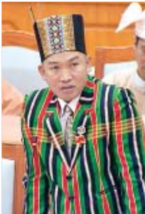
ချင်းပြည်နယ် မဲဆန္ဒနယ်အမှတ်(၁၀)မှ ဦးလားလ်မင်းထန်

လွှာတွင် သုံးငွေများကို မှန်ကန်စွာ စိစစ်လျှော့ချဖြတ်တောက်ရန် အရေးကြီးသကဲ့သို့ မိမိတို့စိစစ်ရသည့် ဝန်ကြီးဌာန၊ ဦးစီးဌာနများ၏ ရငွေအပိုင်းကိုလည်း ဆွေးနွေးညှိနှိုင်းပြီး တိုးမြှင့်လျာထားနိုင်ပါက လျာထားရန်ပါရှိပါကြောင်း၊ ထို့ကြောင့် ပြည်တွင်းအခွန်များဦးစီးဌာန၏ အခွန်ရငွေအဖြစ် မိုတိုင်းဟန်း ဆက်များအပေါ် ကုန်သွယ်လုပ်ငန်းခွန် ငါးရာခိုင်နှုန်း တိုးတက်ကောက်ခံရရှိနိုင်ခဲ့သကဲ့သို့ ဆက်လက်၍ အလားတူ အခြားကုန်စည်များနှင့် စပ်လျဉ်းသည့် ရသင့်ရထိုက်သည့် အခွန်အခများ အပြည့်အဝရရှိနိုင်ရေးကို ကြိုးစားဆောင်ရွက်ကြရမည်ဖြစ်ပါကြောင်း၊ နိုင်ငံတော်ဘဏ္ဍာငွေ လေလွင့်ဆုံးရှုံးမှုမရှိစေရေး၊ ဘဏ္ဍာရေးစည်းမျဉ်းစည်းကမ်းနှင့်အညီဖြစ်စေရေး၊ ရသင့်ရထိုက်သည့် အခွန်ငွေများ အပြည့်အဝရရှိရေးတို့ကို မိမိတို့လွှတ်တော်မှ မှန်မှန်ကန်ကန်ထိန်းကျောင်း တည်မတ်နိုင်မှသာ နိုင်ငံနှင့် ပြည်သူ့အတွက် အကျိုးရှိထိရောက်သည့် ဘတ်ဂျက်စီမံခန့်ခွဲမှုကို ဖော်ဆောင်နိုင်မည်ဖြစ်ပါကြောင်း ဆွေးနွေးသည်။