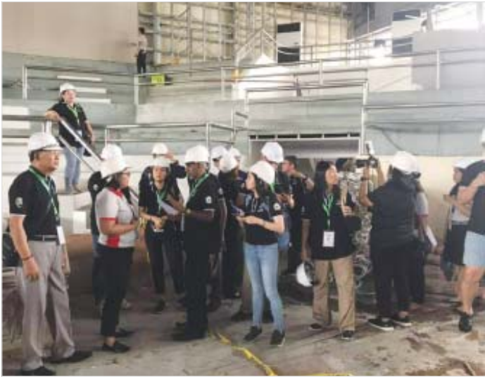
ဖိလစ်ပိုင်နိုင်ငံတွင်ကျင်းပမည့် မသန်စွမ်းအားကစားပြိုင်ပွဲအတွက် တည်ဆောက် နေသော အားကစားရုံကြီးကို တွေ့ရစဉ်။