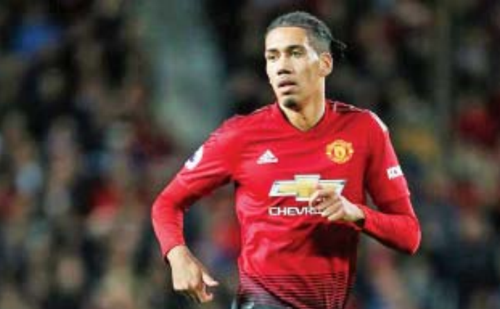
ငွေကြယ် - စုစည်းသည်

ရိုးမားအသင်းက စမောလင်းကို တစ်ရာသီအငှားစာချုပ်နဲ့ ပေါင်သုံးသန်း (ယူရို ၂ ဒသမ ၇ သန်း) ပေးပြီး ခေါ်ယူဖို့လည်းပြင်ဆင်နေတယ်လို့ သိရပါတယ်။ အငှားစာချုပ်နဲ့ ခေါ်ယူနိုင်ခဲ့မယ့်ဆိုရင် ရိုးမားအသင်းအနေနဲ့ ရာသီကုန်မှာ အမြဲတမ်းစာချုပ်နဲ့ ခေါ်ယူခွင့်လည်း ရရှိမှာဖြစ်တယ်လို့ဆိုပါတယ်။ စမောလင်းကို အေစီမီလန်အသင်းနဲ့ ဖီအိုရင်တီးနား အသင်းတို့ကလည်း ခေါ်ယူဖို့စိတ်ဝင်စားလျက်ရှိပါတယ်။