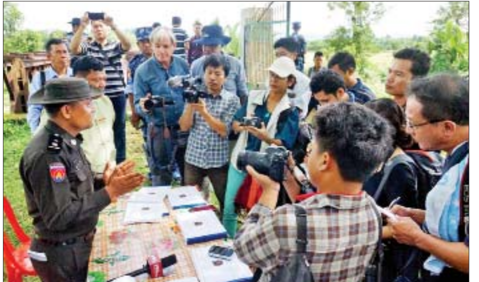
တောင်ပြုလက်ဝဲ ပြန်လည်လက်ခံရေးစခန်းတွင် မီဒီယာသမားများ သတင်းရယူနေကြစဉ်။