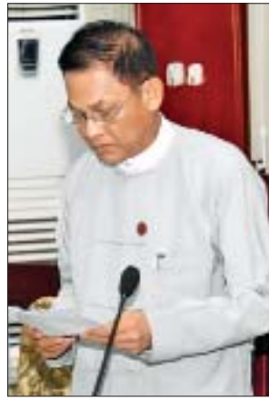
ပြည်ထောင်စုရှေ့နေချုပ် ဦးထွန်းထွန်းဦး

* ကျော့စုံမှ အစည်းအဝေးသို့ မြန်မာနိုင်ငံပိုင်ဂြိုဟ်တုစနစ် တည်ထောင်ရေးလုပ်ငန်းကော်မတီဥက္ကဋ္ဌ ပြည်ထောင်စု ဝန်ကြီး ဦးသန့်စင်မောင်၊ ဦးဆောင်ကော်မတီဝင် ပြည်ထောင်စုဝန်ကြီးများဖြစ်ကြသည့် ဒုတိယဗိုလ်ချုပ်ကြီး ကျော်ဆွေ၊ ဒုတိယဗိုလ်ချုပ်ကြီး စိန်ဝင်း၊ ဦးအုန်းဝင်း၊ ဦးစိုးဝင်းနှင့် ပြည်ထောင်စုရှေ့နေချုပ် ဦးထွန်းထွန်းဦး၊ ဒုတိယဝန်ကြီးများဖြစ်ကြသည့် ဗိုလ်ချုပ်အောင်သူ၊ ဦးအောင်လှထွန်း၊ ဦးသာဦး၊ ဦးဝင်းမော်ထွန်း၊ ဆပ်ကော်မတီ(၄)ခုမှ ဥက္ကဋ္ဌများနှင့် တာဝန်ရှိပုဂ္ဂိုလ်များ၊ အမြဲတမ်းအတွင်းဝန်များ၊ ညွှန်ကြားရေးမှူးချုပ်များ၊ ဌာနဆိုင်ရာအကြီးအကဲများနှင့် တာဝန်ရှိသူများ တက်ရောက်ကြသည်။