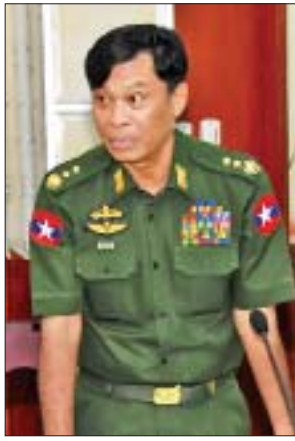
ပြည်ထောင်စုဝန်ကြီး ဒုတိယဗိုလ်ချုပ်ကြီး ကျော်ဆွေ