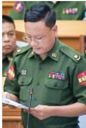
တပ်မတော်သား ပြည်သူ့လွှတ်တော်ကိုယ်စားလှယ် ဗိုလ်မှူးထင်လင်းဦး

၂၀၁၉-၂၀၂၀ ဘဏ္ဍာနှစ် အမျိုးသားစီမံကိန်းဥပဒေကြမ်းတွင် National Education Strategics Plan (NESP) ကို အကောင်အထည်ဖော်ရန် လုပ်ငန်းစဉ် ၁၀၅ ချက်ဖော်ပြထားသော်လည်း နှစ်အလိုက် တိုးတက်မှုရလဒ် လျာထားချက် ရာခိုင်နှုန်းများကို ဖော်ပြထားခြင်းမရှိသည့်အတွက် ကိုယ်စားလှယ်များနှင့်ပြည်သူများ လေ့လာသိရှိနိုင်ရန် ရှင်းလင်းတင်ပြရန် လိုအပ်ပါကြောင်း၊ ထို့ပြင် လျှပ်စစ်မီးနှင့် ဓာတ်အားများအတွက် ပညာရေးဝန်ကြီးဌာန၏ တင်ပြတောင်းခံမှုထက် စိစစ်ချက်တွင် ငွေကျပ် ၂၄ သန်း လျော့နည်းနေသည်ကို တွေ့ရှိရပါကြောင်း၊ လျော့နည်းရရှိသည့်ဌာနများ၊ ကျောင်းများအနေဖြင့် ဓာတ်အားမ လုံလောက်မည်ကို စိုးရိမ်၍ Educational Performance Activities ပိုင်းတွင် လျှပ်စစ်မီးအသုံးပြုမှုများကို လျှော့ချချွေတာလာကြပါက NESP ရလဒ်များကို ထိခိုက်မှု ရှိ မရှိ တွက်ဆရန်လိုအပ်ကြောင်း၊ ဓာတ်အား ခန့်မှန်းထားတိုးမြှင့်ရမည့် မူဝါဒနှင့် NESP အကြား မူဝါဒပိုင်းဆိုင်ရာ ပွတ်တိုက်မှုမဖြစ်ရန် လိုအပ်မည်ဖြစ်ပါကြောင်း ဆွေးနွေးသည်။