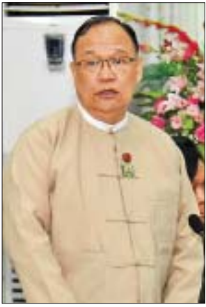
ပြည်ထောင်စုဝန်ကြီး ဦးသန့်စင်မောင်