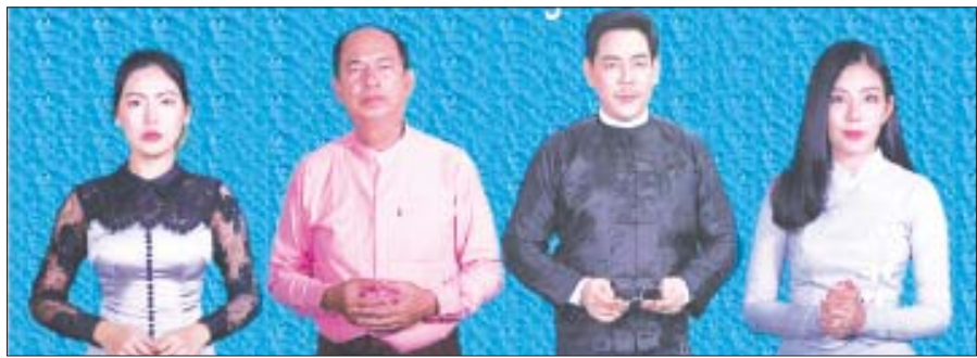
ဤအပြုအမူမျိုး ပြုလုပ်သင့်ပါသလား (ရုပ်ပြဇာတ်လမ်းတို)တွင်ပါဝင်သော ဇာတ်ဆောင်များ။

ထုတ်လွှင့်ခဲ့သောဇာတ်လမ်းများ အသိပညာပေးခြင်းနှင့်စပ်လျဉ်း၍ အဂတိလိုက်စား မှုတိုက်ဖျက်ရေးကော်မရှင်မှ အောက်ပါအသိပညာ ပေးအစီအစဉ်များကို ၂၀၁၆-၂၀၁၉ ခုနှစ်များအတွင်း မြန်မာ့အသံနှင့် ရုပ်မြင်သံကြားမှ ထုတ်လွှင့်ပေးခဲ့ပါ သည်- စဉ် အသိပညာပေးအစီအစဉ်များ ၁။ မှန်မှန်ကန်ကန်မျှမျှတတ (ရုပ်ပြသီချင်း) ၂။ ကိုယ်ကျင့်တရားအလေးထား (ရုပ်ပြသီချင်း)