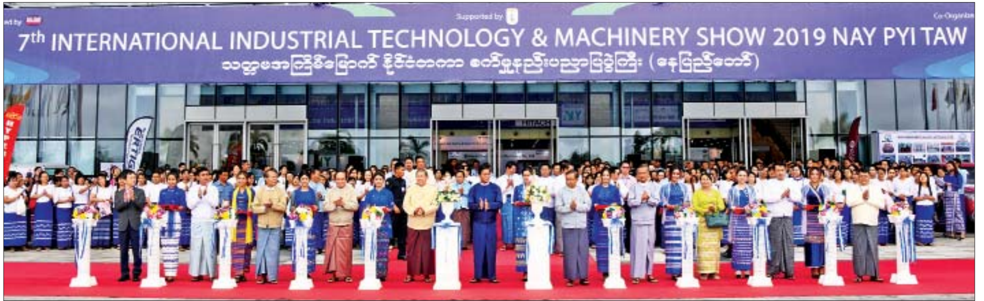
ဒုတိယသမ္မတ ဦးဟင်နရီဗန်ထီးယူ၊ ပြည်ထောင်စုဝန်ကြီးများဖြစ်ကြသည့် ဦးအုန်းဝင်း၊ ဦးစိုးဝင်း၊ ဒေါက်တာမြင့်ထွေး၊ ဦးအုန်းမောင်၊ နေပြည်တော်ကောင်စီဥက္ကဋ္ဌ ဒေါက်တာမျိုးအောင်နှင့် တာဝန်ရှိသူများ သတ္တမအကြိမ်မြောက် နိုင်ငံတကာစက်မှုနည်းပညာပြပွဲအား ဖဲကြိုးဖြတ်ဖွင့်လှစ်ပေးစဉ်။

* ဒုတိယသမ္မတမှ ပြည်ထောင်စုဝန်ကြီး ဦးစိုးဝင်း၊ ကျန်းမာရေးနှင့် အားကစားဝန်ကြီးဌာန ပြည်ထောင်စုဝန်ကြီး ဒေါက်တာမြင့်ထွေး၊ ဟိုတယ်နှင့်ခရီးသွားလာရေးဝန်ကြီးဌာန ပြည်ထောင်စုဝန်ကြီး ဦးအုန်းမောင်၊ နေပြည်တော်ကောင်စီဥက္ကဋ္ဌ ဒေါက်တာမျိုးအောင်၊ စက်မှုဝန်ကြီးဌာနအောက်ရှိ ဦးစီးဌာနနှင့် လုပ်ငန်းများမှ ဌာနဆိုင်ရာအကြီးအကဲများ၊ ပြည်တွင်း ပြည်ပ ကုမ္ပဏီများမှ ကိုယ်စားလှယ်များ၊ ဖိတ်ကြားထားသူများနှင့် တာဝန်ရှိသူများ တက်ရောက်ကြသည်။ ဖွင့်လှစ် ရှေးဦးစွာ ဒုတိယသမ္မတ ဦးဟင်နရီဗန်ထီးယူ၊ ပြည်ထောင်စုဝန်ကြီးများ ဖြစ်ကြသည့် ဦးအုန်းဝင်း၊ ဦးစိုးဝင်း၊ ဒေါက်တာမြင့်ထွေး၊ ဦးအုန်းမောင်၊ နေပြည်တော်ကောင်စီဥက္ကဋ္ဌ ဒေါက်တာမျိုးအောင်၊ Myanmar Engineering Society ဒုတိယဥက္ကဋ္ဌ ဒေါ်ခင်စန္ဒာထွန်း၊ Hitachi Soe Electric & Machinery Co.,Ltd Managing Director Mr. Hayashi