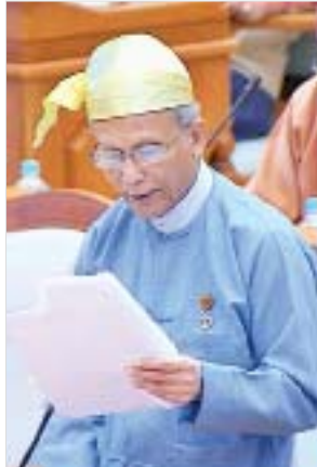
မြန်မာနိုင်ငံတော်ဗဟိုဘဏ် ဒုတိယဥက္ကဋ္ဌ ဦးစိုးသိန်း

အစည်းအဝေးတွင် ၂၀၁၆-၂၀၁၇ဘဏ္ဍာနှစ်နှင့် ၂၀၁၇-၂၀၁၈ဘဏ္ဍာနှစ်များအတွက် ငွေကြေးမူဝါဒအကောင်အထည်ဖော်ဆောင်ရွက်ချက် အစီရင်ခံစာနှင့် ငွေကြေးရေးရာတည်ငြိမ်မှုအခြေအနေ အစီရင်ခံစာတို့နှင့်စပ်လျဉ်း၍ မြန်မာနိုင်ငံတော်ဗဟိုဘဏ် ဒုတိယဥက္ကဋ္ဌ ဦးစိုးသိန်းက လွှတ်တော်သို့ ရှင်းလင်းတင်ပြရာတွင် မြန်မာနိုင်ငံတော် ဗဟိုဘဏ်သည် မြန်မာနိုင်ငံတော် ဗဟိုဘဏ်ဥပဒေအခန်း(၆) ပုဒ်မ ၄၀(က) အရ ငွေကြေးမူဝါဒကို ချမှတ်အကောင်အထည်ဖော် ဆောင်ရွက်လျက်ရှိပါကြောင်း၊ မြန်မာနိုင်ငံတော်ဗဟိုဘဏ်၏ ငွေကြေးမူဝါဒရည်မှန်းချက်မှာ ပြည်တွင်းဈေးနှုန်းတည်ငြိမ်မှု ရရှိစေရန်နှင့် ထိန်းသိမ်းရန်ဖြစ်ပါကြောင်း၊ မြန်မာနိုင်ငံတော် ဗဟိုဘဏ်သည် စီးပွားရေးစနစ်တွင် သင့်လျော်သော ငွေကြေးပမာဏရှိနေစေရန်နှင့် ဈေးနှုန်းများတည်ငြိမ်မှုရှိစေမည့် စီးပွားရေးတိုးတက်မှုကိုရရှိစေရန် သီးသန့်ငွေကြေးပမာဏကို ဦးတည်သတ်မှတ်ထားရှိသည့် ငွေကြေးမူဝါဒအမူဝါဒကို ချမှတ်ဆောင်ရွက်လျက်ရှိပါကြောင်း။