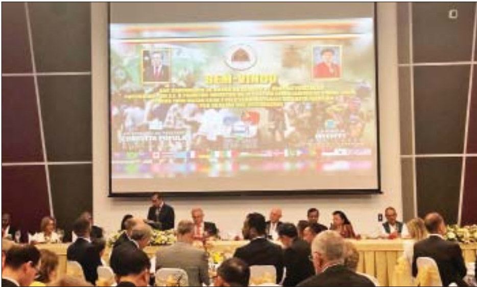
တီမောလက်စတေးနိုင်ငံ ဝန်ကြီးချုပ် Mr.Taur Matan Ruak နှင့်ဇနီးတို့က တည်ခင်းဧည့်ခံသည့် နေ့လယ်စာ စားပွဲတွင် ဝန်ကြီးချုပ်က အမှာစကားပြောကြားစဉ်။

တာမီတော်လှ ဩဂုတ် ၃၀ ပြန်ကြားရေးဝန်ကြီးဌာန ပြည်ထောင်စု ဝန်ကြီး ဒေါက်တာဖေမြင့်သည် တီမောလက်စတေးနိုင်ငံ၏ ပြည်လုံး ကျွတ် ဆန္ဒခံယူပွဲ နှစ်(၂၀) ပြည့် အထိမ်းအမှတ် အခမ်းအနားသို့ တက်ရောက်လာသူများနှင့်အတူ ယနေ့ နံနက်ပိုင်းက တီမော လက်စတေးကျင်းပမှုကို တက်ရောက် လေ့လာကြသည်။