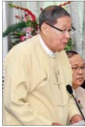
ပြည်ထောင်စုဝန်ကြီး ဦးစိုးဝင်း