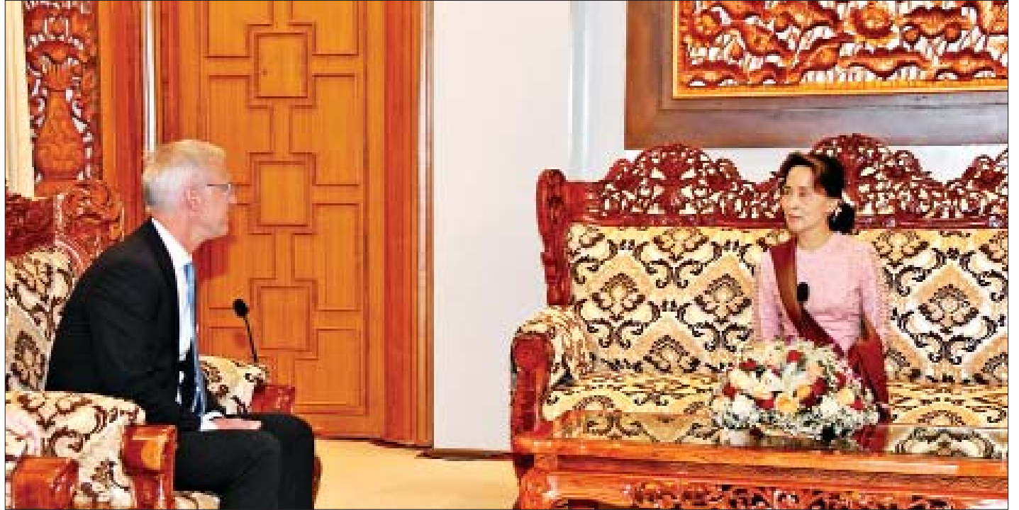
နိုင်ငံတော်၏အတိုင်ပင်ခံပုဂ္ဂိုလ် ဒေါ်အောင်ဆန်းစုကြည် နော်ဝေနိုင်ငံ SN Power ကုမ္ပဏီ၏ ဘုတ်အဖွဲ့ဥက္ကဋ္ဌ Mr. Oystein Oyehaug အား လက်ခံတွေ့ဆုံစဉ်။