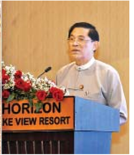
ပြည်ထောင်စုဝန်ကြီး ဦးမင်းသူ ပြည်ထောင်စုအစိုးရအဖွဲ့ရုံးဝန်ကြီးဌာန အထွေထွေအုပ်ချုပ်ရေးဦးစီးဌာန၏ အထွေထွေအုပ်ချုပ်ရေးပြုပြင်ပြောင်းလဲရေးမူဘောင်ဆိုင်ရာ အလုပ်ရုံဆွေးနွေးပွဲ ဖွင့်ပွဲအခမ်းအနားတွင် အမှာစကားပြောကြားစဉ်။

အကောင်အထည်ဖော် ဆောင်ရွက်ကြရမည့် အထွေထွေ အုပ်ချုပ်ရေးဦးစီးဌာန အဆင့်ဆင့်သော ဝန်ထမ်းများ၏ အခန်းကဏ္ဍသည် အရေးပါသည့် ကဏ္ဍတစ်ခုအဖြစ် ခိုင်ခိုင်မာမာ ပါဝင်လျက်ရှိပါကြောင်း၊ မည်သည့်လုပ်ငန်းမျိုးမဆို အောင်မြင်အောင် ဆောင်ရွက်ကြရမည့်အခါ တွင် ပါဝင်ပတ်သက်သူအားလုံး လုပ်ငန်းစဉ်အဆင့်ဆင့် ကို ကျေညက်စွာ နားလည်သဘောပေါက်မှသာ လက်တွေ့ အကောင်အထည်ဖော် ဆောင်ရွက်ရမည်ဖြစ်ပါ ကြောင်း၊ ထို့ကြောင့် အထွေထွေအုပ်ချုပ်ရေးဦးစီးဌာန ပြုပြင်ပြောင်းလဲရေးမူဘောင်(မူကြမ်း)တွင် ပါဝင်သည့် လုပ်ငန်းနယ်ပယ်အလိုက် အသေးစိတ်ဆောင်ရွက်မည့် လုပ်ငန်းစဉ်များကို ပါဝင်ဆောင်ရွက်သူအားလုံး သိရှိနားလည်နိုင်မည်၊ လက်တွေ့အကောင်အထည်ဖော်မည့် လုပ်ငန်းများကို အထောက်အကူပြုနိုင်မည့် အသေးစိတ် လုပ်ငန်းစဉ်များကို ရေးဆွဲဖော်ထုတ်နိုင်ရေး အတွက် ရည်ရွယ်ပြီး ဒုတိယအကြိမ် အလုပ်ရုံဆွေးနွေးပွဲ ကို ကျင်းပရခြင်းဖြစ်ပါကြောင်း။