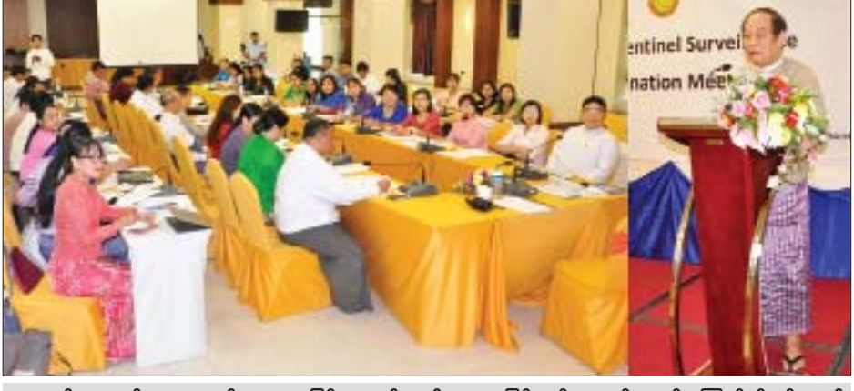
တုပ်ကွေးဆန်သော ရောဂါလက္ခဏာဖြစ်ပွားမှုနှင့် လတ်တလောပြင်းထန် အသက်ရှူလမ်းကြောင်း ပိုးဝင်ရောဂါဖြစ်ပွားမှု စောင့်ကြပ်ကြည့်ရှုရေးလုပ်ငန်းအစည်းအဝေးတွင် ပြည်ထောင်စုဝန်ကြီး ဒေါက်တာမြင့်ထွေး အမှာစကားပြောကြားစဉ်။

ရောဂါဖြစ်ပွားမှု စောင့်ကြပ်ကြည့်ရှုမှုလုပ်ငန်းများတွင် ပုဂ္ဂလိကဆေးရုံ၊ ဆေးခန်းနှင့် အထွေထွေရောဂါကုဆရာဝန်များ၏ အခန်းကဏ္ဍသည် အရေးကြီးသဖြင့် ပိုမိုပါဝင်ဆောင်ရွက်နိုင်အောင် လုပ်ဆောင်သွားရ