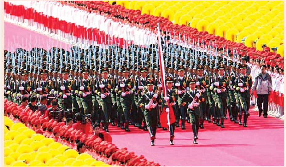
၂၀၁၈ ခုနှစ်တွင် ကျင်းပခဲ့သည့် တရုတ်နိုင်ငံ၏ စစ်ရေးပြအခမ်းအနားမြင်ကွင်း။