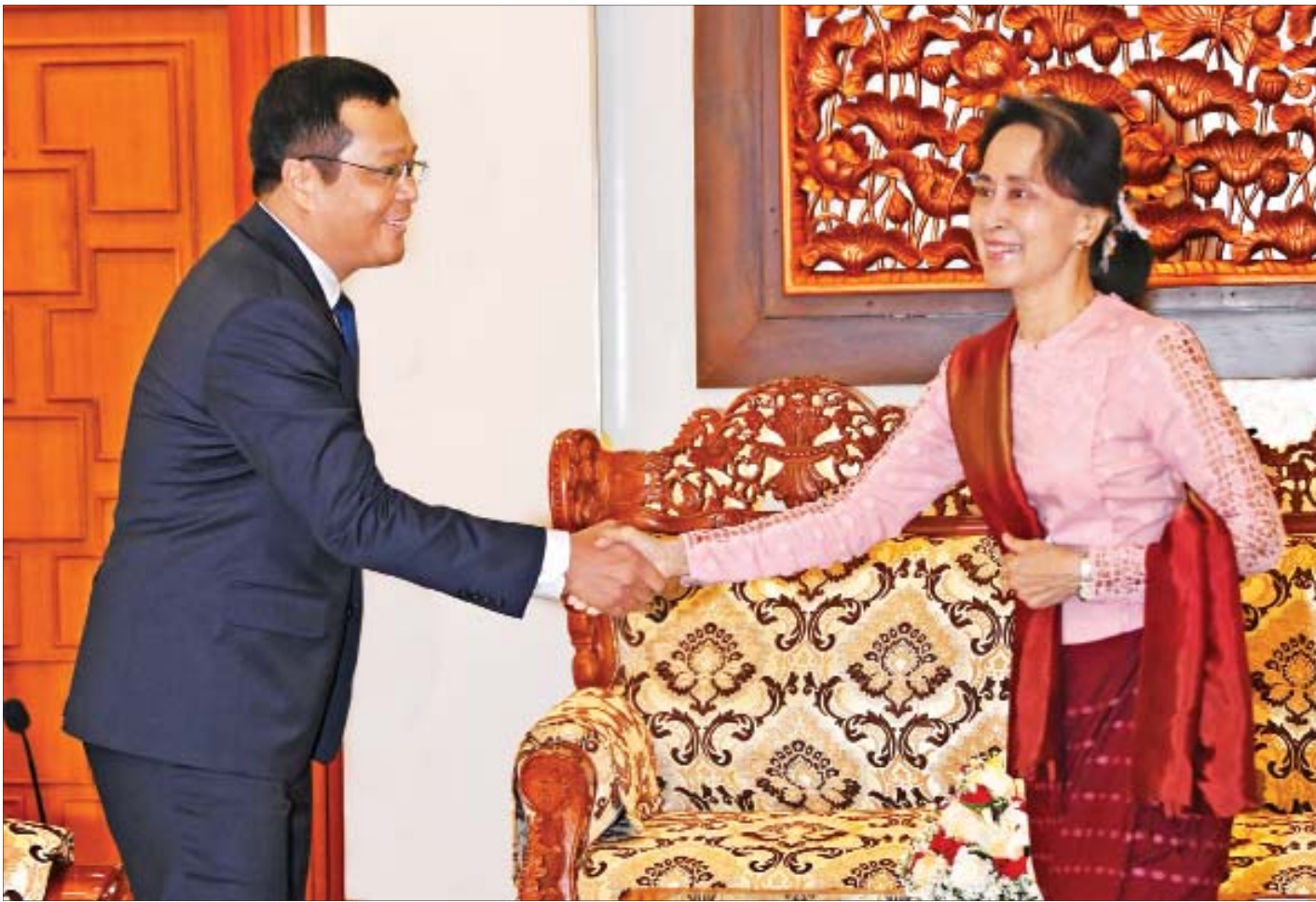
နိုင်ငံတော်၏အတိုင်ပင်ခံပုဂ္ဂိုလ် ဒေါ်အောင်ဆန်းစုကြည် မြန်မာနိုင်ငံဆိုင်ရာ ကမ္ဘောဒီးယားနိုင်ငံ သံအမတ်ကြီး Mr. Sok Chea အား ရင်းရင်းနှီးနှီးနှုတ်ဆက်စဉ်။