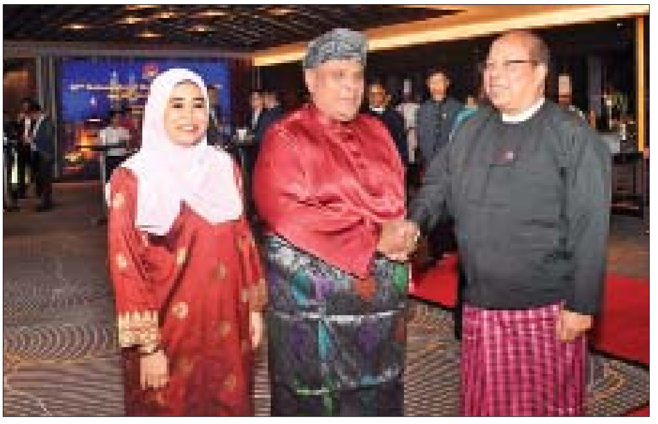
သံအမတ်ကြီးက ညစာစားပွဲဖြင့် တည်ခင်းဧည့်ခံသည်။ အဆိုပါအခမ်းအနားသို့ ရန်ကုန်တိုင်းဒေသကြီး ဝန်ကြီးချုပ် ဦးမြိုးမင်းသိန်းနှင့် ဇနီး၊ ကာကွယ်ရေးဦးစီးချုပ်ရုံး(ကြည်း)မှ ဒုတိယဗိုလ်ချုပ်ကြီးမင်းနောင်နှင့် ဇနီး၊ တပ်မတော်အရာရှိကြီးများ၊ ရန်ကုန်မြို့ရှိ နိုင်ငံခြားသံရုံးများမှ သံအမတ်ကြီးများ၊ သံရုံး ယာယီတာဝန်ခံများ၊ ကုလသမဂ္ဂဆိုင်ရာ ဌာနကော်ယံစားလှယ်များနှင့် ဖိတ်ကြားထားသူများ တက်ရောက်ကြသည်။ သတင်းစဉ်

ထို့နောက် ညွှန်ပွဲသို့ တက်ရောက်လာကြသူများအား