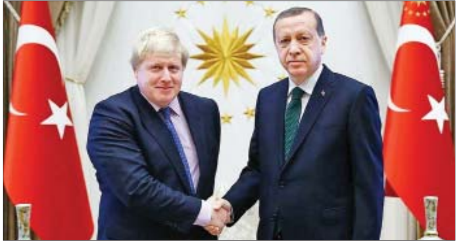
ဗြိတိန်ဝန်ကြီးချုပ် ဘောရစ်ဝွန်ဆင် နိုင်ငံခြားရေးဝန်ကြီးအဖြစ် ထမ်းရွက်စဉ် တူရကီသမ္မတ အာဒိုဂန်နှင့် အန်ကာရာမြို့ သမ္မတအိမ်တော်၌ တွေ့ဆုံစဉ်။