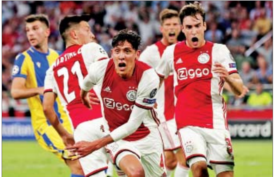
အေဂျက်အသင်းဟာ ပြီးခဲ့တဲ့ ဘောလုံးရာသီက ဆီမီးဖိုင်နယ်အဆင့်မှာ စပါးအသင်းကို ရှုံးနိမ့်ခဲ့တာ ဖြစ်ပါတယ်။ အေဂျက်အသင်းနဲ့အတူ ဘရုဂျက်အသင်းနဲ့ဆလားဗီယာပရက် အဆင့်ကို တက်လှမ်းခွင့်ရရှိခဲ့ပါတယ်။

အေဂျက်အသင်းဟာ ပြီးခဲ့တဲ့ ရာသီက ချန်ပီယံလိဂ်ဆီမီးဖိုင်နယ်အဆင့်ကို တက်လှမ်းခဲ့တဲ့အသင်းဖြစ်ပြီး ချန်ပီယံလိဂ်ခြေစစ်ပွဲ play-off ပထမအကျော့ပွဲစဉ်မှာ အေပိုးနီကိုးရှားအသင်းနဲ့ ဆိုက်ပရပ်မှာ ဂိုးမရှိသရေရလဒ်သာ ထွက်ပေါ်ခဲ့တာဖြစ်ပါတယ်။ အခု ဒုတိယအကျော့မှာတော့ အေဂျက်အသင်းက ပွဲကစားချိန် ၄၃ မိနစ်မှာ သွင်းယူခဲ့တဲ့ အယ်လ်ဗာရက်ဇ်ရဲ့ သွင်းဂိုးနဲ့ မိနစ် ၈၀ မှာ သွင်းယူခဲ့တဲ့ တာအစ်ရဲ့သွင်းဂိုးတွေကြောင့် နှစ်ဂိုးပြတ်နဲ့ အနိုင်ရရှိခဲ့တာ ဖြစ်ပါတယ်။