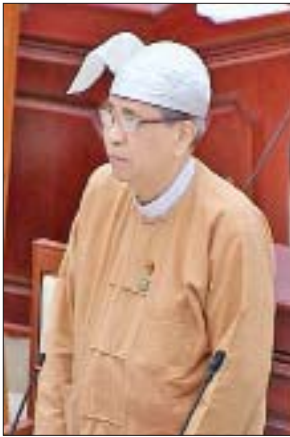
ဒုတိယဝန်ကြီး ဦးကျော်မျိုး