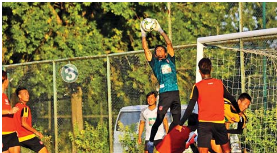
တရုတ်နိုင်ငံတွင် လေ့ကျင့်နေသည့် မြန်မာ့လက်ရွေးစင်အသင်းကို တွေ့ရစဉ်။

၂၀၂၂ ကမ္ဘာ့ဖလားနှင့် ၂၀၂၃ အာရှဖလား ဒုတိယအဆင့်ခြေစစ်ပွဲအတွက် လေ့ကျင့်ပြင်ဆင်နေသည့် မြန်မာ့လက်ရွေးစင်အသင်းနှင့် တရုတ်လက်ရွေးစင် အသင်းသည် ခြေစစ်ပွဲအကြိုပြင်ဆင်မှုအဖြစ် ဩဂုတ် ၃၀ ရက် မြန်မာစံတော်ချိန် ညနေ ၄ နာရီတွင် တရုတ်နိုင်ငံ၌ ခြေစမ်းပွဲယှဉ်ပြိုင်ကစားမည်ဖြစ်သည်။