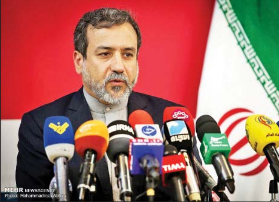
အီရန်ဒုတိယနိုင်ငံခြားရေးဝန်ကြီး အဘတ်စ်အာရာချီ