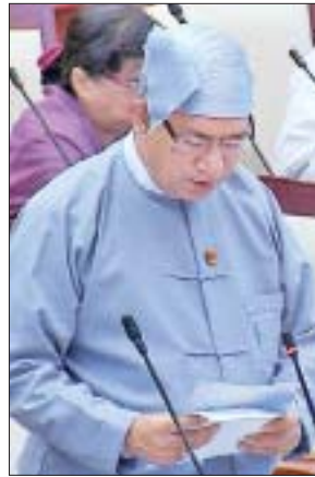
ဒုတိယဝန်ကြီး ဒေါက်တာရဲမြင့်ဆွေ