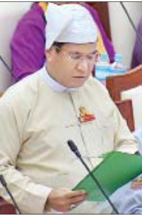
ဒုတိယဝန်ကြီး ဦးတင်မြင့်

ဆက်လက်၍ ဝန်းသို့မဆန္ဒနယ်မှ ဦးနေစိုးအောင်က အဆိုအား လက်ခံဆွေးနွေးနိုင်ရန် ထောက်ခံတင်ပြသည်။ ထို့နောက် ပြည်သူ့လွှတ်တော်ဥက္ကဋ္ဌ ဦးတီခွန်မြတ်က ယင်းအဆိုနှင့်စပ်လျဉ်း၍ အဆိုအကြံပြုရယူရာ လွှတ်တော်က သဘောတူသဖြင့် အဆိုအား လက်ခံဆွေးနွေးရန် ဆုံးဖြတ်ကြောင်း ကြေညာသည်။