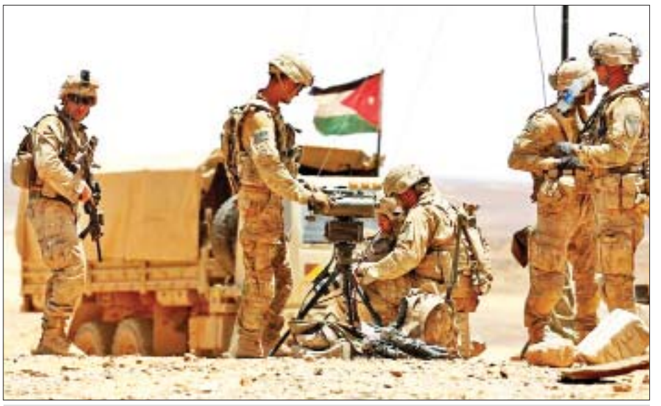
၂၀၁၇ ခုနှစ် မေလက ဂျော်ဒန်နိုင်ငံမြို့တော် အမန်၏တောင်ဘက်ရှိ မာအန်းဒေသတွင် ပြုလုပ်သည့် “စိတ်ထက်သန်သောခြင်္သေ့” စစ်ရေးလေ့ကျင့်မှုတွင်ပါဝင်သည့် အမေရိကန်တပ်ဖွဲ့ဝင်များကို တွေ့ရစဉ်။

နှင့် ပူးပေါင်းဆောင်ရွက်မှုအတွက် အထောက်အကူပြုမည် ဖြစ်ကြောင်း ၎င်းက ထပ်မံပြောကြားသည်။ ဆက်လက်၍ အမေရိကန်ဗိုလ်ချုပ် ဘရက်ဒလီ အေဆွန်ဆန်က ယခုကဲ့သို့ ကြီးမားသော စစ်ရေးလေ့ကျင့်မှုပြုလုပ်ခြင်းသည် ရှုပ်ထွေးသော ပတ်ဝန်းကျင်၌ တာဝန်ထမ်းဆောင်လျက်ရှိသော နှစ်နိုင်ငံတပ်ဖွဲ့များအကြား ပူးပေါင်းဆောင်ရွက်မှု အဆင်သင့်မှုနှင့် တုံ့ပြန်မှုထိန်းသိမ်းရေးအတွက် မိမိတို့၏ ကတိကဝတ်ပြုမှုများကို လက်တွေ့ပြသခြင်းပင်ဖြစ်ကြောင်း ထည့်သွင်းပြောကြားသည်။ အဆိုပါစစ်ရေးလေ့ကျင့်မှု၌ ပါဝင်သည့် နိုင်ငံ ၃၀ ထဲတွင် ပြင်သစ်၊ ဗြိတိန်၊ ဩစတြေးလျ၊ ဩစတြီးယား၊ ဘယ်လ်ဂျီယံ၊ နယ်သာလန်၊ ဂျပန်၊ ကနေဒါ၊ ကူဝိတ်၊ လက်ဘနွန်၊ ကင်ညာ၊ စပိန်၊ ဂျာမနီနှင့် တာဂျီကစ္စတန် နိုင်ငံတို့လည်း ပါဝင်ကြောင်း သိရသည်။ အဆိုပါ စစ်ရေးလေ့ကျင့်မှုသည် နိုင်ငံစုံစစ်ရေးလေ့ကျင့်မှုတစ်ခုဖြစ်ပြီး ဂျော်ဒန်နိုင်ငံက မိတ်ဖက်နိုင်ငံများနှင့် စစ်ဘက်ဆိုင်ရာ ကျွမ်းကျင်မှုဖလှယ်ရန် အိမ်ရှင်အဖြစ် လက်ခံကျင်းပခဲ့ခြင်းဖြစ်သည်။ ကိုးကား-ဆင်ဟွာ ဘာသာပြန်- ဂျေတီ