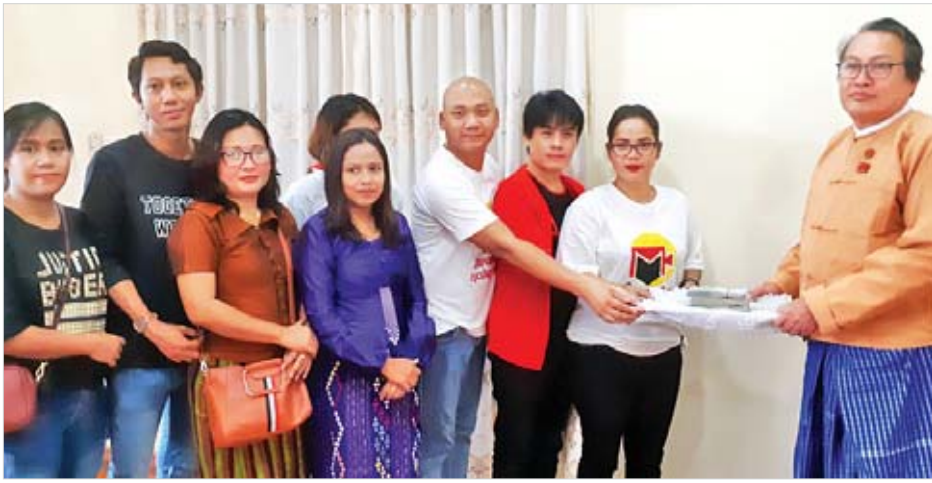
မီဒီယာပရဟိတအသင်းက ဩဂုတ် ၂၅ ရက်တွင် မွန်ပြည်နယ် ဝန်ကြီးချုပ် ဒေါက်တာအေးထံမှ မွန်ပြည်နယ်ရေးဘေး ပြန်လည်ထူထောင်ရေး လုပ်ငန်းများအတွက် အလှူငွေကျပ် သိန်း ၃၀ ပေးအပ်စဉ်။ (မီဒီယာပရဟိတအသင်းသည် အနုပညာရှင်များ၊ စေတနာရှင်ပြည်သူများ ပါဝင်လှူဒါန်းကြသည့်အလှူငွေနှင့် ထောက်ပံ့ရေးပစ္စည်းများကို ဩဂုတ် ၂၄ ရက်နှင့် ၂၅ ရက်က ကျိုက်မရောမြို့နယ် ငါးပြေမကျေးရွာ၊ ဦးလေးကျေးရွာ အပါအဝင် ရေဘေးသင့်ကျေးရွာ ခုနစ်ရွာကို သွားရောက်လှူဒါန်းခဲ့ကြောင်း သိရသည်။) ရွှေအင်းသားခင်မောင်ဝင်း