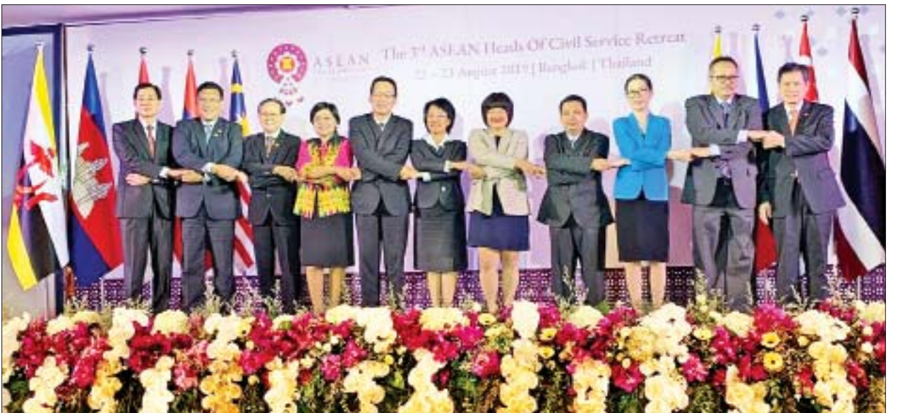
ပြည်ထောင်စုရာထူးဝန်အဖွဲ့ဥက္ကဋ္ဌ ဦးဝင်းသိမ်း ထိုင်းနိုင်ငံ ဝန်ကောက်မြို့တွင် ဩဂုတ် ၂၂ ရက်မှ ၂၃ ရက်အထိကျင်းပသည့် တတိယအကြိမ်မြောက် အာဆီယံနိုင်ငံဝန်ထမ်းအဖွဲ့အစည်းအကြီးအကဲများအစည်းအဝေးသို့ တက်ရောက်စဉ်။ သတင်းစဉ်(သတင်းဖော်ပြပြီး)

ဒုတိယအကြိမ် ပြည်ထောင်စုလွှတ်တော် (၁၃)ကြိမ်မြောက် ပုံမှန် အစည်းအဝေး (၁၇) ရက်မြောက်နေ့ကို ဩဂုတ် ၂၈ ရက်တွင် ဆက်လက် ကျင်းပသွားမည်ဖြစ်ကြောင်း သိရသည်။ အောင်ရဲသွင်၊ အေးအေးသန်း