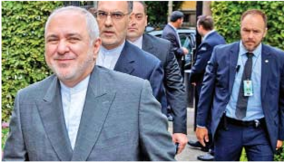
အီရန်နိုင်ငံခြားရေးဝန်ကြီး ဗိုဟာမက် ဂျာဗင်ဇာဒ်က ပြင်သစ် သမ္မတ မက်ခရူန်၊ ပြင်သစ်နိုင်ငံခြားရေးဝန်ကြီး ဂျင်းယုတ် လီဒရိန်းအပါအဝင် ဗြိတိန်နှင့် ဂျာမနီတာဝန်ရှိသူများကို တွေ့ဆုံခဲ့ပြီးနောက် အီရန်နိုင်ငံ၏ နှုတ်ခမ်းအစည်းအဝေး နှင့်ပတ်သက်ပြီး နိုင်ငံခြားရေးဝန်ကြီး ယုတ်ဇာဒ်ကို ပြန်လည်ရရှိရန် ကြိုးပမ်းခြင်းမှာ လွယ်ကူသောကိစ္စ တစ်ခုမဟုတ်သော်လည်း ဆက်လက်ကြိုးပမ်းသွားမည် ဖြစ်ကြောင်း သူ၏ တွစ်တာစာမျက်နှာတွင် ရေးသား

အီရန်နိုင်ငံခြားရေးဝန်ကြီး ဗိုဟာမက် ဂျာဗင်ဇာဒ်က ပြင်သစ်နိုင်ငံတွင် ကျင်းပလျက်ရှိသည့် ဂျီ-၇ ထိပ်သီး အစည်းအဝေးသို့ ရုတ်တရက်သွားရောက်ခဲ့ကြောင်း ယနေ့ သတင်းများအရ သိရသည်။