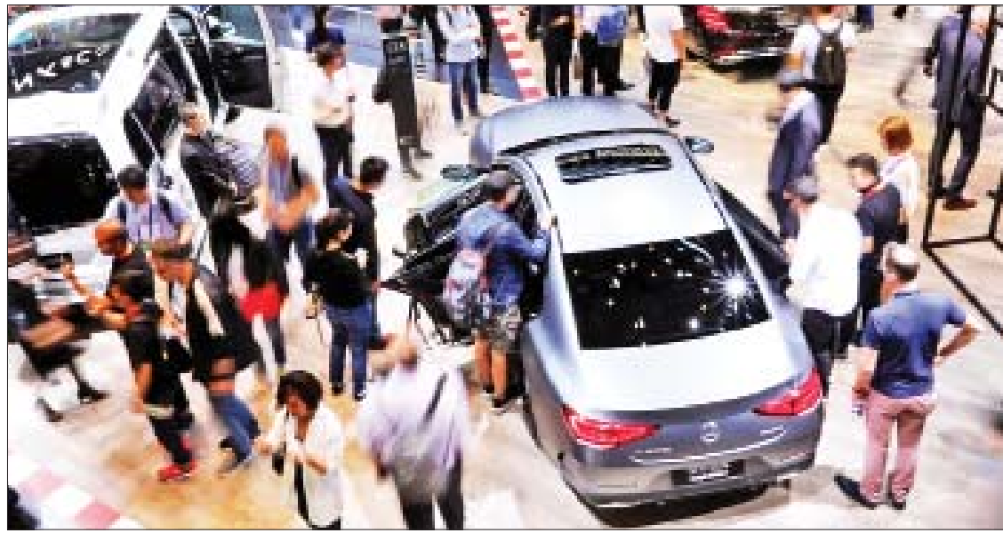
ပေကျင်းမြို့တွင် မေလက ပြုလုပ်သည့် ကားပြပွဲသို့ လာရောက်ကြည့်ရှုလေ့လာသူများကို တွေ့ရစဉ်။