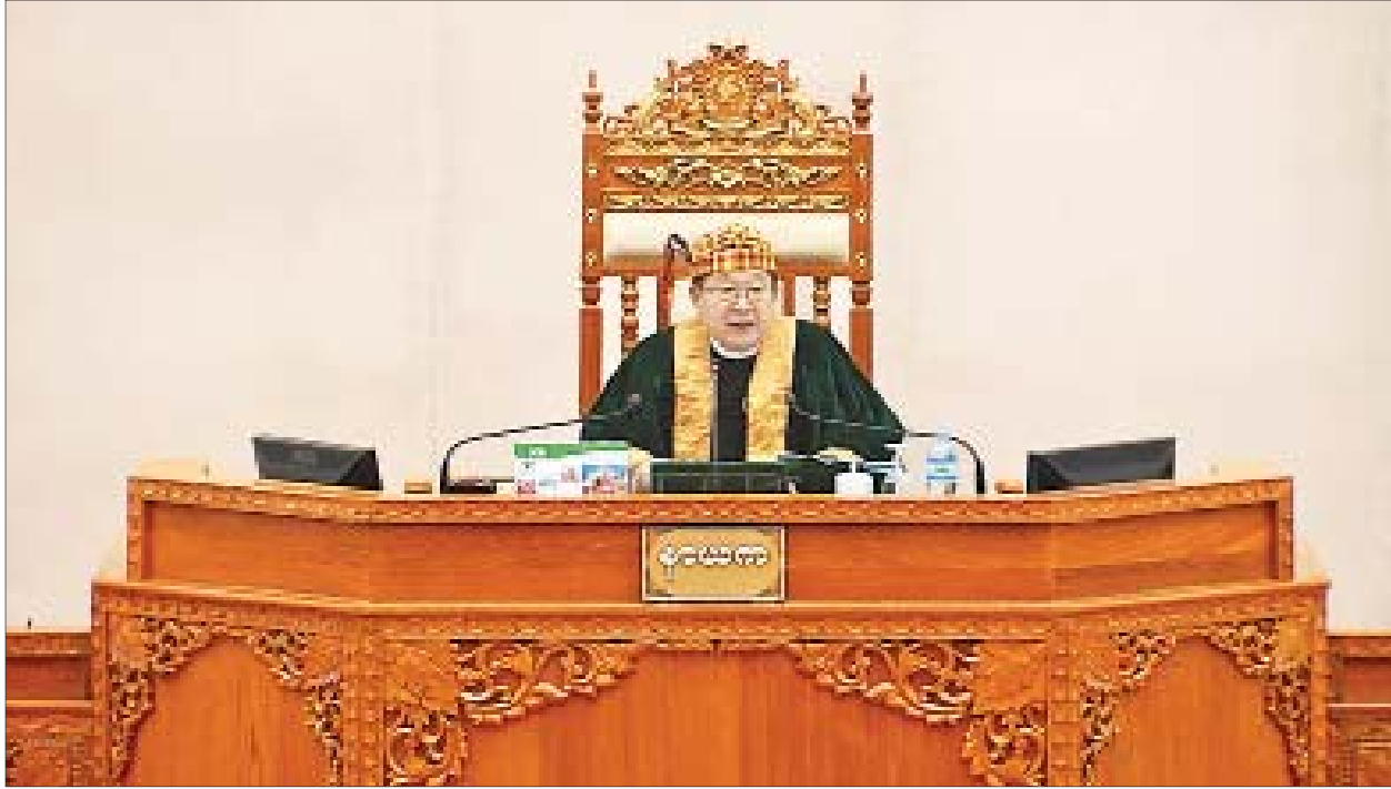
ပြည်ထောင်စုလွှတ်တော်နာယက ဦးတီခွန်မြတ်