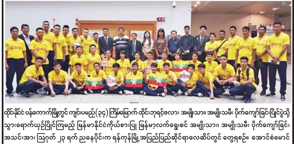
ထိုင်းနိုင်ငံ ဝန်ကောက်မြို့တွင် ကျင်းပမည့် (၃၄) ကြိမ်မြောက် ထိုင်းဘုရင့်ဖလား အမျိုးသား၊ အမျိုးသမီး ပိုက်ကျော်ခြင်းပြိုင်ပွဲသို့ သွားရောက်ယှဉ်ပြိုင်ကြမည့် မြန်မာနိုင်ငံကိုယ်စားပြု မြန်မာလက်ရွေးစင် အမျိုးသား၊ အမျိုးသမီး ပိုက်ကျော်ခြင်း အသင်းအား ဩဂုတ် ၂၃ ရက် ညနေပိုင်းက ရန်ကုန်မြို့အပြည်ပြည်ဆိုင်ရာလေဆိပ်တွင် တွေ့ရစဉ်။ အောင်စံမောင်