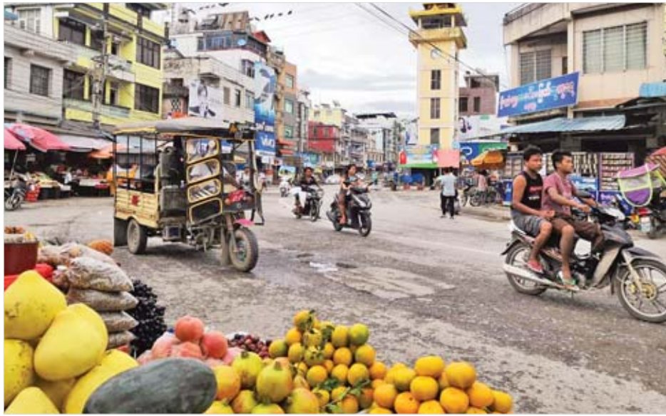
ယာယီရပ်နားထားသည်မှာ ကိုးရက်ကြာမြင့်နေပြီဖြစ်သည့်။ ခရီးသည်ယာဉ်လိုင်းများကို မူဆယ်မြို့(၁၀၅) မိုင်ဝက်မှ လုံခြုံရေးအခြေအနေအရ ပြေးဆွဲခွင့်မပြုခဲ့

မူဆယ် ဩဂုတ် ၂၃ ရှမ်းပြည်နယ်(မြောက်ပိုင်း) မူဆယ်မြို့တွင် ပြည်သူလူထုများ ဈေးသည်ဈေးဝယ်များ၊ မော်တော်ယာဉ်များ၊ ဆိုင်ကယ်များဖြင့် သာယာအေးချမ်းစည်ကားလျက်ရှိသည်။