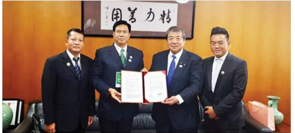
နေ့စဉ်အတွင်း Tokyo 2019 Congress သို့ တက်ရောက်လျက်ရှိသော အာရှဂျူဒိုအဖွဲ့ချုပ်နှင့် နိုင်ငံတကာ ဂျူဒိုအဖွဲ့ချုပ် ဥက္ကဋ္ဌများကို သီးခြားစီတွေ့ဆုံပြီး မြန်မာ့ဂျူဒိုအားကစား ဖွံ့ဖြိုးတိုးတက်ရေး ပြန်ပွားစေရေးနှင့် မျိုးဆက်

တည်ထောင်ခဲ့ပြီး ခါးစည်း DAN အဆင့် (၅)ရှိသော အားကစားသမား ငါးဦးသာရှိခဲ့သည်။ အဆိုပါ ခါးစည်းအဆင့် DAN ကို ဂျပန်နိုင်ငံ၏ ကိုဒိုကန် ဂျူဒိုတက္ကသိုလ်မှ ကိုယ်စားလှယ်အဖွဲ့များ မြန်မာနိုင်ငံသို့ လာရောက်သည့် အချိန်မှသာရယူနိုင်ခြင်း ဖြစ်သောကြောင့် အချို့သော ဂျူဒိုအားကစားသမားများသည် အသက်အရွယ် ကြီးရင့်မှသာလျှင် DAN အဆင့် သတ်မှတ်ခြင်းခံခဲ့ကြရသည်။ ယခုလို မြန်မာနိုင်ငံ ဂျူဒိုအဖွဲ့ချုပ်က နှစ်နိုင်ငံ သဘောတူစာချုပ်ချုပ်ဆိုနိုင်ခြင်းကြောင့် မြန်မာနိုင်ငံ ဂျူဒိုအဖွဲ့ချုပ်၏ ဂုဏ်သိက္ခာကိုလည်း မြှင့်တင်နိုင်ခဲ့သလို မျိုးဆက်သစ် ဂျူဒိုအားကစားသမားများ၏ အနာဂတ်အတွက်လည်း များစွာအထောက်အကူ ဖြစ်စေခဲ့ကြောင်းကို မြန်မာနိုင်ငံ ဂျူဒိုအဖွဲ့ချုပ်မှ ခါးစည်း DAN အဆင့်(၅)ရှိသော ဂျူဒိုအားကစားသမားတစ်ဦး၏ ပြောကြားချက်အရ သိရသည်။ မြန်မာနိုင်ငံကိုယ်စားပြု မြန်မာနိုင်ငံဂျူဒိုအဖွဲ့ချုပ် ဥက္ကဋ္ဌနှင့် တာဝန်ရှိသူများသည် ဂျပန်နိုင်ငံသို့ ရောက်ရှိ