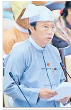
ဒုတိယဝန်ကြီး ဦးလှကျော်