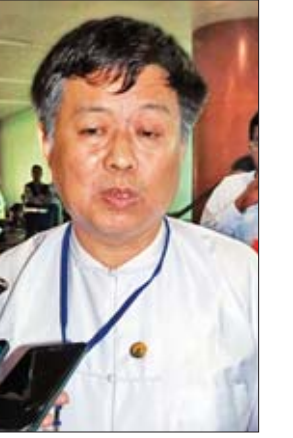
ဦးနှိုင်း

ရတာတွေ မရှိပါဘူး။ တပ်မတော်ကနေ အကူအညီတွေ အများကြီးရခဲ့ပါတယ်။ အခုတော့ ဘေးကင်းစွာနဲ့ ပြန်ရောက်ခဲ့ပါပြီ။ Mrs. Chou Wei Kuo (ဥက္ကဋ္ဌ) Go and Love Foundation ကျွန်မတို့ ရောက်နေတဲ့အချိန် ပဋိပက္ခတွေနဲ့ ကြုံနေတဲ့အတွက် အပြင်မထွက်တော့ဘဲ K.K Guest House ထဲမှာပဲ နေခဲ့ပါတယ်။ K.K Guest House ကလည်း ကူညီစောင့်ရှောက်ပေးပါတယ်။ မနေ့ညကတော့ ဝေါက်ကွဲတဲ့အသံတွေနဲ့ သေနတ်သံတွေ ကြားခဲ့ရပါတယ်။ တပ်မတော်ဘက်က တာဝန်ရှိအရာရှိတစ်ယောက်ကလည်း ကျွန်မတို့ကို အပြင်မှာထက်စာရင် ဟိုတယ်ထဲမှာနေတာက ပိုပြီးဘေးကင်းလုံခြုံနိုင်တဲ့အတွက် ဟိုတယ်မှာပဲနေဖို့ ပြောပါတယ်။ ဒီလိုပဲ လူဝင်မှုကြီးကြပ်ရေးအပါအဝင် သက်ဆိုင်ရာ တာဝန်ရှိတဲ့သူတွေက စိတ်မပူဖို့နဲ့ အကောင်းဆုံးကြိုးစားပေးနေတဲ့အကြောင်း လာရောက်ပြောပြပေးကြပါတယ်။ ဒီလိုတွေ ကြုံခဲ့ရပေမယ့် ကြောက်လန့်မနေအောင် အားလုံးက ပိုင်းဝန်းကူညီပေးကြပါတယ်။ ဒီလို