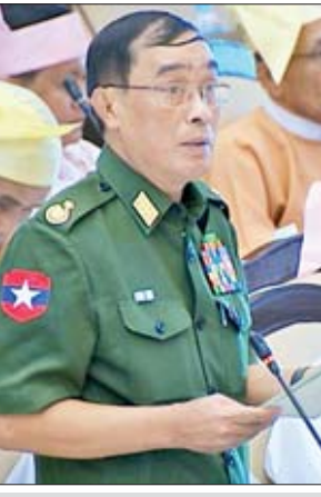
ဒုတိယဝန်ကြီး ဦးလှကျော်

အလားတူ ချင်းပြည်နယ် မဲဆန္ဒနယ်အမှတ်(၁၀)မှ ဦးလားလ်မင်းထန်၏ ချင်းပြည်နယ်၊ မတူပီမြို့မှ လိုင်လင်းပီမြို့သို့ ဆက်သွယ်ထားသော မတူပီ-လိုင်လင်းပီလမ်းပိုင်းတွင် ဆက်လက်ဖောက်လုပ်ရန် ကျန်ရှိနေသော တန်ကူးဆုံဆင်း-တင်နမ်း-အာရု ၂၆ မိုင်အား လာမည့်ဘဏ္ဍာရေးနှစ်တွင် ဖောက်လုပ်ပေးရန် အစီအစဉ်ရှိ၊ မရှိ မေးခွန်းနှင့် ချင်းပြည်နယ် မဲဆန္ဒနယ်အမှတ်(၁၁)မှ ဦးဝေတင်၏ ချင်းပြည်နယ်၊ ပလက်ဝမြို့နယ်၊ ရှင်းလက်ဝကျေးရွာအုပ်စု၊ ဆင်အိုးဝကျေးရွာအုပ်စုနှင့် ပတိန်တလန်ကျေးရွာအုပ်စုတို့ကြား ဖောက်လုပ်ထားသော မြေသားလမ်းအား ကျောက်ချောလမ်းအဖြစ် အဆင့်မြှင့်တင်ပေးရန် အစီအစဉ် ရှိ၊ မရှိ မေးခွန်းနှင့်စပ်လျဉ်း၍ နယ်စပ်ရေးရာဝန်ကြီးဌာန ဒုတိယဝန်ကြီး ဦးလှကျော်က လည်းကောင်း၊ စစ်ကိုင်းတိုင်းဒေသကြီး မဲဆန္ဒနယ် အမှတ်(၄) မှ ဦးလှဦး၏ စစ်ကိုင်းတိုင်းဒေသကြီး၊ မုံရွာခရိုင်၊ အရာတော်မြို့နယ်ရှိ ကျေးရွာများအတွက် သဖန်းဆိပ်(ကင်းတားဆည်)မှ လွတ်ပေးသော လက်ကားမြောင်းကြီးသည် ၁၄ နှစ်ကြာသည်အထိ မြောင်းရေမလှသောကြောင့် မည်သို့ကူညီဆောင်ရွက်ပေးမည်ကို သိရှိလိုခြင်း မေးခွန်းနှင့် စစ်ကိုင်းတိုင်းဒေသကြီး မဲဆန္ဒနယ်အမှတ်(၉) မှ ဦးမောင်မောင်လတ်၏ စစ်ကိုင်းတိုင်းဒေသကြီး၊ တမူးခရိုင်၊ ခမ်းပါတ်မြို့၊ အမှတ်(၁)ရပ်ကွက်အတွက် စိမ့်စမ်းရေ သွယ်ယူပေးနိုင်ခြင်း ရှိ၊ မရှိ သိရှိလိုခြင်း မေးခွန်းတို့နှင့်