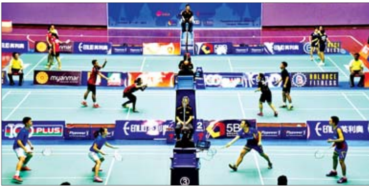
၂၀၁၇ ခုနှစ်တွင် မြန်မာနိုင်ငံက အိမ်ရှင်အဖြစ် လက်ခံကျင်းပခဲ့သည့် အာရှလူငယ် ကြက်တောင်ရိုက်ပြိုင်ပွဲကို တွေ့ရစဉ်။

ရန်ကုန် ဩဂုတ် ၂၂ မြန်မာနိုင်ငံက အိမ်ရှင်အဖြစ် လက်ခံကျင်းပ မည့် International Series ကြက်တောင် ရိုက်ပြိုင်ပွဲတွင် ကြက်တောင်အားကစားသမား ၁၄၀ ကျော် ဝင်ရောက်ယှဉ်ပြိုင်မည်ဖြစ်သည်။ ယင်းပြိုင်ပွဲကို စက်တင်ဘာ ၁၀ ရက်မှ ၁၅ ရက်အထိ ရန်ကုန်မြို့ရှိ အမျိုးသားကြက်တောင် အားကစားခန်းမ၌ ကျင်းပမည်ဖြစ်သည်။ International Series ကြက်တောင် ရိုက်ပြိုင်ပွဲမှာ ကမ္ဘာကြက်တောင်အဖွဲ့ချုပ်က ကြီးပွားကျင်းပလျက်ရှိသည့် ပြိုင်ပွဲများအနက် စာမျက်နှာ ၁၀ ကော်လံ ၁ သို့ *