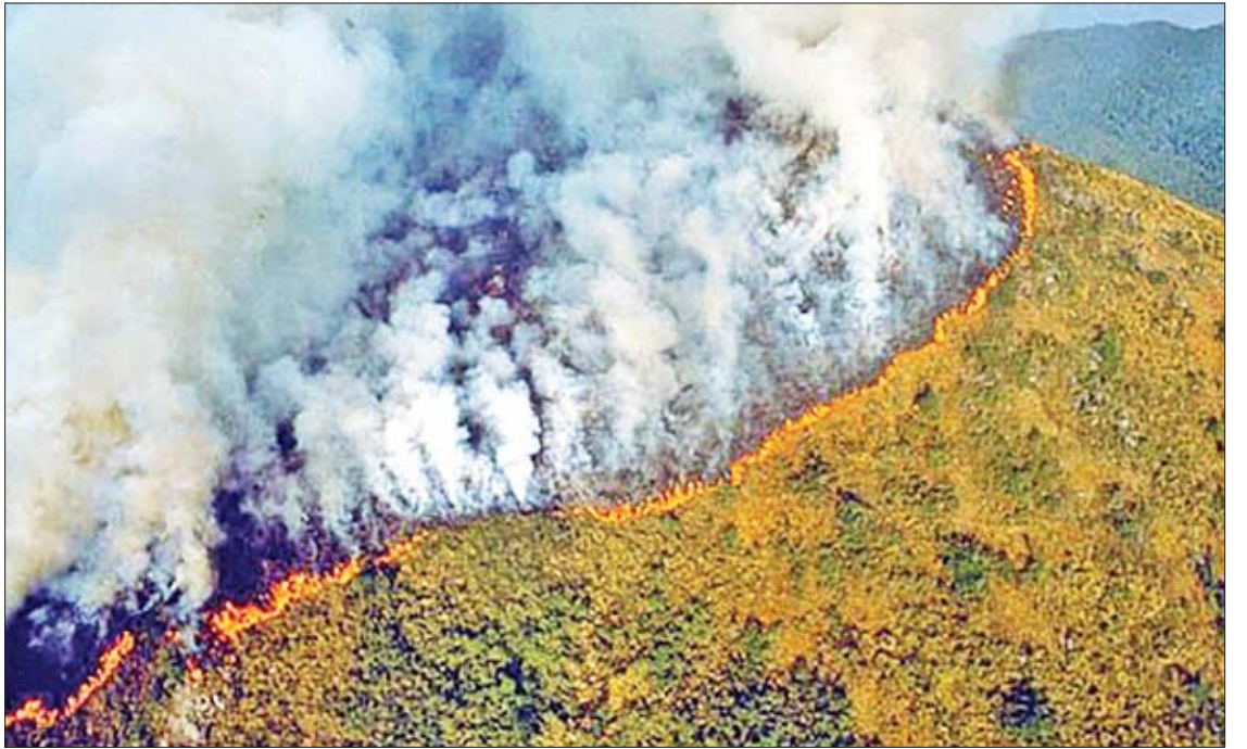
ထိုစဉ်အတွင်း အမေရိကန်အာကာသအေဂျင်စီ(နာဆာ)က ဂြိုဟ်တုမှ ရိုက်ကူးထားသည့် အမေဇုံနီမိုးသစ်တော၏ ဓာတ်ပုံများကို တွစ်တာစာမျက်နှာ၌ ဖော်ပြခဲ့သည်။ ဩဂုတ် ၂၀ ရက်တွင် ဖော်ပြခဲ့သည့် ဖော်ပြချက်အရ ဘရာဇီးနိုင်ငံ၏ ပြည်နယ်အချို့တွင် အဖြူရောင်မီးခိုးများ ပျံ့နှံ့နေသည်ကို မြင်တွေ့ရသည်။ ကိုးကား-အင်န်အိတ်ချ်ကေ ဘာသာပြန်-ဇော်ဝင်း

နိုင်ငံတကာ အသိုက်အဝန်းက ဘရာဇီး သမ္မတဘော်လ်ဆိုနာရီအား မိုးသစ်တောများ ကာကွယ်ရေးအတွက် တုံ့ပြန်ဆောင်ရွက်မှုများ လုပ်ဆောင်ရန် တိုက်တွန်းမှုများ ပြုနေသော်လည်း ၎င်းက အမျိုးသားအာကာသသုတေသနအဖွဲ့အကြီးအကဲကို မှားယွင်းသည့် အချက်အလက်များ ထုတ်ပြန်သည်ဟု စွပ်စွဲကာ ရာထူးမှ ထုတ်ပယ်ခဲ့သည်။