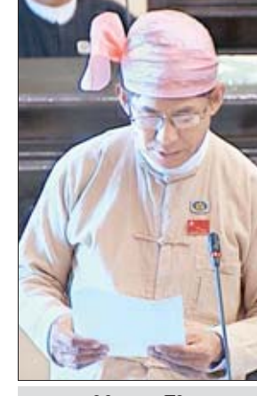
မန္တလေးတိုင်းဒေသကြီး မဲဆန္ဒနယ် အမှတ်(၆)မှ ဒေါက်တာဦးကြွယ်ကြွယ်

စပ်လျဉ်း၍ စိုက်ပျိုးရေး၊ မွေးမြူရေးနှင့် ဆည်မြောင်းဝန်ကြီးဌာန ဒုတိယဝန်ကြီး ဦးလှကျော်ကလည်းကောင်း ပြန်လည်ရှင်းလင်းဖြေကြားခဲ့ကြသည်။