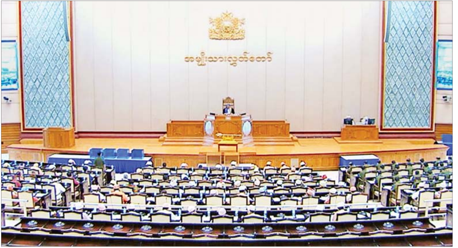
ဒုတိယအကြိမ် အမျိုးသားလွှတ်တော် (၁၃)ကြိမ်မြောက် ပုံမှန်အစည်းအဝေး ၁၃ ရက်မြောက်နေ့ ကျင်းပစဉ်။

နေပြည်တော် ဩဂုတ် ၂၂ ဆည်မြောင်းနှင့် ရေအသုံးချမှုစီမံခန့်ခွဲရေး ဦးစီးဌာနနှင့် ရေအားလျှပ်စစ်အကောင်အထည် ဖော်ရေးဦးစီးဌာနတို့အနေဖြင့် တည်ဆောက် ထိန်းသိမ်းထားသည့် ရေလှောင်တံများကို လက်ရှိပြောင်းလဲလာသည့် သဘာဝ၏ ဖြစ်စဉ်များနှင့်အညီ ပြန်လည်စိစစ်သုံးသပ်ပြီး နောင်ရေရှည်ကြံ့ခိုင်မှုနှင့် ဘေးကင်းလုံခြုံမှု အတွက် ဌာနမှ သတ်မှတ်ပြဋ္ဌာန်းထားသည့် လုပ်ထုံးလုပ်နည်းများနှင့်အညီ အထူးအလေး ထား စီမံဆောင်ရွက်လျက်ရှိကြောင်း စိုက်ပျိုးရေး၊ မွေးမြူရေးနှင့် ဆည်မြောင်း ဝန်ကြီးဌာန ဒုတိယဝန်ကြီး ဦးလှကျော်က ရှင်းလင်းဖြေကြားသည်။ ယနေ့ကျင်းပသည့် ဒုတိယအကြိမ် အမျိုးသားလွှတ်တော် (၁၃)ကြိမ်မြောက်ပုံမှန် အစည်းအဝေး ၁၃ ရက်မြောက်နေ့တွင် မန္တလေးတိုင်းဒေသကြီး မဲဆန္ဒနယ် အမှတ် (၂)မှ ဦးထွန်းထွန်းဦး၏ ဆည်မြောင်းနှင့် ရေအသုံးချမှု စီမံခန့်ခွဲရေးဦးစီးဌာနနှင့် ရေအားလျှပ်စစ်အကောင်အထည်ဖော်ရေး ဦးစီးဌာနတို့မှ ထိန်းသိမ်းစောင့်ရှောက်လျက် ရှိသော တံတားများကို အန္တရာယ်ကင်း လုံခြုံ စိတ်ချရစေရေး မည်ကဲ့သို့ စနစ်တကျ စာမျက်နှာ ၄ ကော်လံ ၁ သို့ *