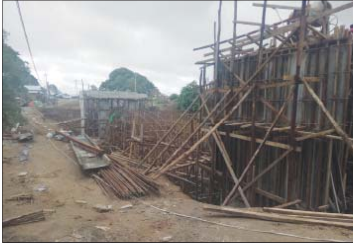
ခင်း တည်ဆောက်သွားမှာပါ။ အခုတော့ နှစ်လမ်းသွား တည်ဆောက်သွားမှာပါ” ကြမ်းခင်းနိုင်တဲ့အဆင့် ရောက်နေပါပြီ။ ဟု ဆောက်လုပ်ရေးတာဝန်ရှိသူတစ်ဦးက တံတားဟောင်းကိုလည်းမဖျက်သေးဘဲ ရှင်းပြသည်။ အောင်မြင်(ပန်းတောင်း)

ပန်းတောင်း ဩဂုတ် ၂၂ ပဲခူးတိုင်းဒေသကြီး ပန်းတောင်းမြို့နယ် ပန်းတောင်း-တောင်ကုတ် အဝေးပြေး လမ်းမကြီး၏ ပန်းတောင်းမြို့အဝင် ဒီးဒုတ် ချောင်းကူးဆက်သွယ်ရေးတံတား တည် ဆောက်လျက်ရှိရာ ၇၅ ရာခိုင်နှုန်းခန့်ပြီးစီး နေပြီဖြစ်ကြောင်း သိရသည်။ အဆိုပါတံတားမှာ အလျား ၁၂၄ ပေ၊ ယာဉ်သွားလမ်းအကျယ် ၂၄ ပေရှိကာ ယခင်တံတားဟောင်းအနီးတွင် တည် ဆောက်လျက်ရှိသည်။ “တံတားအဟောင်းဘေးမှာ တည် ဆောက်ရတာမို့ ရေလယ်တိုင်စိုက်ထူခြင်း မပြုတော့ဘဲ ကမ်းနှစ်ဖက်ကို အမာခံယူ ပြီး ကုန်းတံတား တည်ဆောက်မှာပါ။ အဲဒီပုံစံမှာတိုင်စိုက်ပြီး ကွန်ကရစ်ကြမ်း