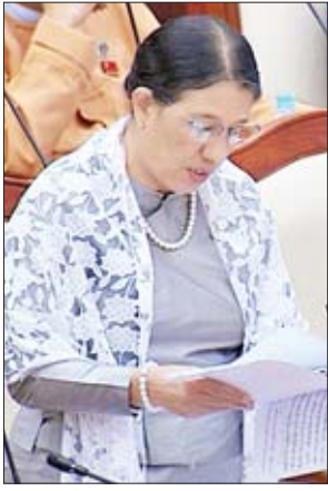
ဒုတိယဝန်ကြီး ဒေါက်တာမြလေးစိန်