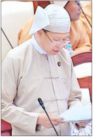
ပြည်ထောင်စုဝန်ကြီး ဒေါက်တာမျိုးသိမ်းကြီး