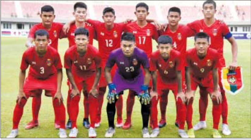
မန္တလေး၌ကျင်းပသည့် လေးနိုင်ငံဖိတ်ခေါ်ပြိုင်ပွဲ ယှဉ်ပြိုင်ခဲ့သည့် မြန်မာအသင်း။

ရန်ကုန် ဒြဂုတ် ၂၂ ၂၀၂၀ အာရှ ယူ-၁၆ ခြေစစ်ပွဲအတွက် လေ့ကျင့်ပြိုင်ဆင်နေသည့် မြန်မာ ယူ-၁၅ အသင်းသည် ဝီယက်နမ် ယူ-၁၅ ဖိတ်ခေါ်ပြိုင်ပွဲတွင် ဝင်ရောက်ယှဉ်ပြိုင်မည်ဖြစ်သည်။ ယင်းပြိုင်ပွဲကို ဒြဂုတ် ၂၆ ရက်မှ ၃၀ ရက်အထိ ဝီယက်နမ်နိုင်ငံ၌ ကျင်းပမည်ဖြစ်သည်။ ဝီယက်နမ် ယူ-၁၅ ဖိတ်ခေါ်ပြိုင်ပွဲတွင် အိမ်ရှင်ဝီယက်နမ် အသင်းအပါအဝင် ဥရောပမှ ရုရှားအသင်း၊ အာရှမှ တောင်ကိုရီးယားနှင့် မြန်မာအသင်းတို့ ယှဉ်ပြိုင်မည်ဖြစ်သည်။ ပြိုင်ပွဲကို လေးသင်းပတ်လည်စနစ်ဖြင့် ကျင်းပမည်ဖြစ်ပြီး အုပ်စုပွဲစဉ်များအဖြစ် ဒြဂုတ် ၂၆ ရက်တွင် မြန်မာနှင့် ဝီယက်နမ်၊ ရုရှားနှင့် တောင်ကိုရီးယား၊ ဒြဂုတ် ၂၈ ရက်တွင် မြန်မာနှင့် တောင်ကိုရီးယား၊ ဝီယက်နမ်နှင့် ရုရှား၊ ဒြဂုတ် ၃၀ ရက်တွင် မြန်မာနှင့် ရုရှား၊ ဝီယက်နမ်နှင့် တောင်ကိုရီးယားအသင်းတို့