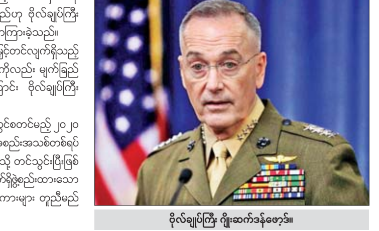
ဗိုလ်ချုပ်ကြီး ဂျိုးဆက်ဒန်ဖော့ဒ်။

ကိုးကား-အင်န်အိတ်ချ်ကေ၊ ဘာသာပြန်- အောင်ကျော်ကျော်