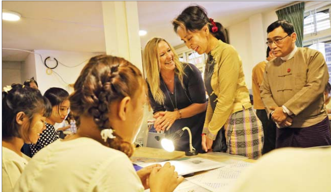
နိုင်ငံတော်၏အတိုင်ပင်ခံပုဂ္ဂိုလ် ဒေါ်အောင်ဆန်းစုကြည် ဒေင်မြန်မာပရဟိတအဖွဲ့မှ အမျိုးသမီးများ၏ အသက်မွေးဝမ်းကျောင်းလုပ်ငန်းများ ဆောင်ရွက်နေမှုကို ကြည့်ရှုအားပေးစဉ်။