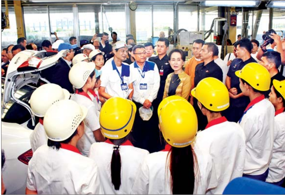
နိုင်ငံတော်၏အတိုင်ပင်ခံပုဂ္ဂိုလ် ဒေါ်အောင်ဆန်းစုကြည် Suzuki Thilawa Motor Co., Ltd. စက်ရုံမှ ဝန်ထမ်းများအား ရင်းရင်းနှီးနှီး တွေ့ဆုံစဉ်။

ဆက်ဆံရာတွင်လည်းကောင်း Cooperation သည် အရေးကြီးပါကြောင်း။