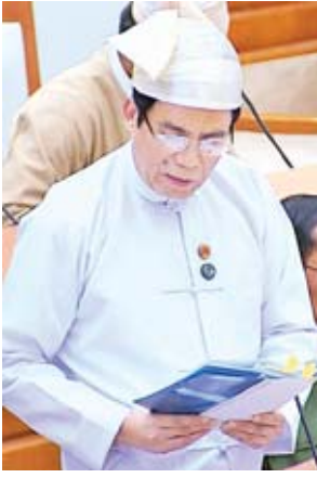
ဒုတိယဝန်ကြီး ဦးအောင်လှထွန်း

ပြည်ထောင်စုလွှတ်တော်နာယကက ၂၀၁၉-၂၀၂၀ ဘဏ္ဍာရေးနှစ် အမျိုးသားစီမံကိန်း ဥပဒေကြမ်းနှင့် ပြည်ထောင်စု၏ ဘဏ္ဍာငွေအရအသုံးဆိုင်ရာဥပဒေကြမ်းနှင့်စပ်လျဉ်း၍ မူနှင့် အခြေခံသဘောဆွေးနွေးခြင်းနှင့် စီမံကိန်းလုပ်ငန်းများ၊ ဘတ်ဂျက်ရငွေသုံးငွေများအပါအဝင် ဥပဒေပိုင်းဆိုင်ရာ ပြင်ဆင်ချက်အဆို တင်သွင်းဆွေးနွေးခြင်းကို ၂၀၁၉ ခုနှစ် ဩဂုတ် ၂၈ ရက်တွင် ဆောင်ရွက်ရန်လျာထားပါကြောင်း၊ ဘဏ္ဍာငွေအရအသုံးဆိုင်ရာဥပဒေကြမ်းတွင် တောင်းခံထားသည့် ငွေလုံးငွေရင်းအသုံးစရိတ်များသည် အမျိုးသားစီမံကိန်းဥပဒေကြမ်း၏ နောက်ဆက်တွဲတွင်ပါရှိသည့် စီမံကိန်းလုပ်ငန်းများ တန်ဖိုးဖြစ်သည့်အတွက် ဘတ်ဂျက်၏ ငွေလုံးငွေရင်းအသုံးစရိတ် လျှော့ချမှု