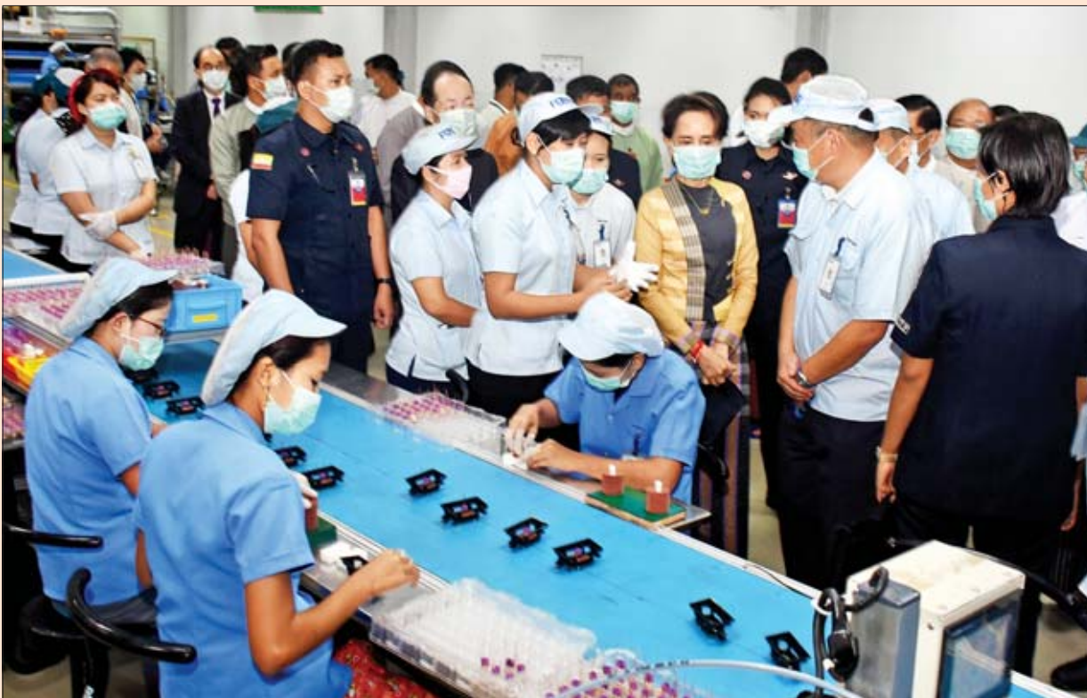
နိုင်ငံတော်၏အတိုင်ပင်ခံပုဂ္ဂိုလ် ဒေါ်အောင်ဆန်းစုကြည် သီလဝါအထူးစီးပွားရေးဇုန် (အေ)အတွင်းရှိ Foster Electric Thilawa Co., Ltd. စက်ရုံမှ ကုန်ပစ္စည်းများ ထုတ်လုပ်နေမှုကို ကြည့်ရှုစဉ်။