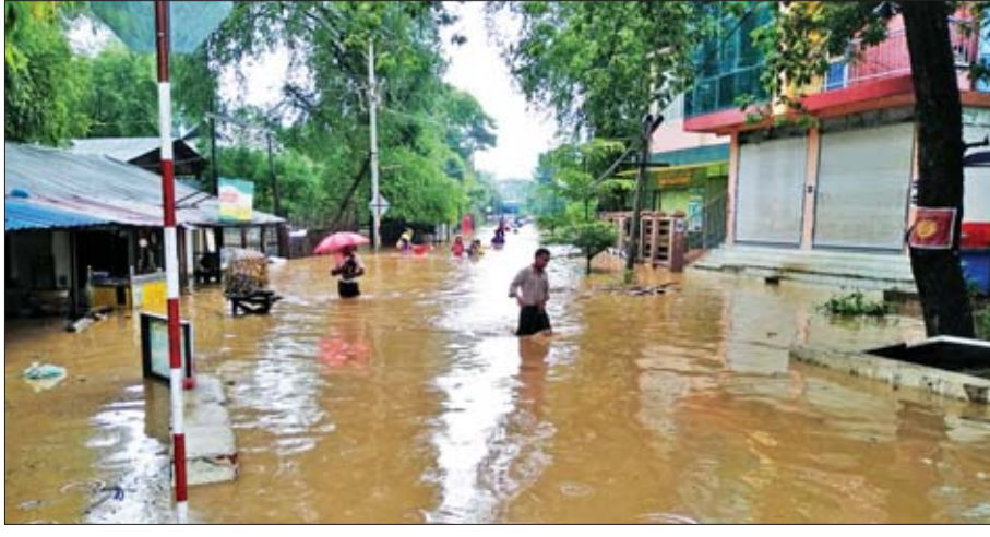
ချောင်းဦး(ပြန်/ဆက်)

ရေကျော်နေ၍ ယာဉ်ကြီး၊ ယာဉ်ငယ် များ၊ ဖြတ်သန်းသွားလာနေမှုကို ခေတ္တရပ်နားထားခဲ့ရပြီး နံနက် ၁၀ နာရီ မိနစ် ၂၀ တွင် ရေကျသွား ၍ မော်တော်ယာဉ်များ ဖြတ်သန်း သွားလာနိုင်ခဲ့ကြောင်း သိရ သည်။