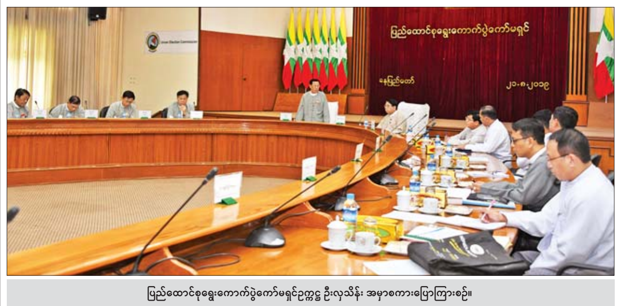
ပြည်ထောင်စုရွေးကောက်ပွဲကော်မရှင်ဥက္ကဋ္ဌ ဦးလှသိန်း အမှာစကားပြောကြားစဉ်။

နေပြည်တော် ဩဂုတ် ၂၀ ၂၀၂၀ ပြည့်နှစ် အထွေထွေရွေးကောက်ပွဲအတွက် ပြန်ကြားရေးဝန်ကြီးဌာနက ဆောင်ရွက်မည့် အချက်အလက်များ ရှင်းလင်းဆွေးနွေးပွဲအခမ်းအနားကို ယနေ့ နံနက် ၁၀ နာရီတွင် နေပြည်တော်ရှိ ပြည်ထောင်စုရွေးကောက်ပွဲကော်မရှင်ရုံး အစည်းအဝေးခန်းမ၌ ကျင်းပသည်။