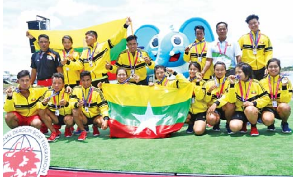
(၁၄)ကြိမ်မြောက် ကမ္ဘာ့နဂါးလှေချန်ပီယံရှစ်ပြိုင်ပွဲ ပထမနေ့ ပွဲစဉ်များအပြီးတွင် မြန်မာအသင်း အောင်ပွဲစဉ်။

မြန်မာအသင်းသည် ၉ မိနစ် ၂၇ ဒသမ ၉၈၀ စက္ကန့်ဖြင့် ပထမဆု ရရှိခြင်းဖြစ်ပြီး ကနေဒါအသင်းက ၉ မိနစ် ၃၂ ဒသမ ၈၄၀ စက္ကန့်ဖြင့် ဒုတိယ၊ ဩစတြေးလျအသင်းက ၉ မိနစ် ၅၀ ဒသမ ၂၂၀ စက္ကန့်ဖြင့် တတိယ ရရှိခဲ့သည်။ ဒုတိယပွဲအဖြစ် နံနက် ၁၀ နာရီ ၆ မိနစ်တွင် ဆက်လက်ယှဉ်ပြိုင်ခဲ့ သော အမျိုးသား၊ အမျိုးသမီး Premier (Mixed) မီတာ (၂၀၀၀) ပွဲစဉ်၌ မြန်မာအသင်းမှာ စတုတ္ထ နေရာဖြင့်သာ ကျေနပ်ခဲ့ရသည်။ ယင်းပွဲစဉ်၌ ပထမ အီတလီ၊ ဒုတိယ ထိုင်း၊ တတိယ ကနေဒါအသင်းတို့က ရရှိခဲ့သည်။ မွန်းလွဲ ၁ နာရီ ၁၈ မိနစ်တွင် ယှဉ်ပြိုင်သော အသက် ၂၄ နှစ် အောက် အမျိုးသမီး မီတာ (၂၀၀၀) ပွဲစဉ်၌ မြန်မာအသင်းက ဒုတိယ မြောက် ရွှေနံ့ဆိပ် ရယူနိုင်ခဲ့သည်။ စာမျက်နှာ ၁၁ ကော်လံ ၁ သို့ ◆