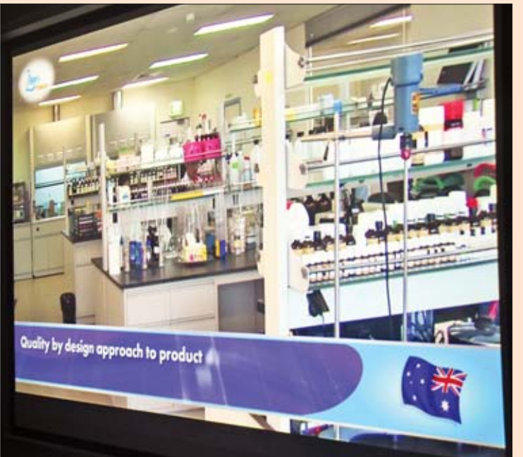
နိုင်ငံတော်၏အတိုင်ပင်ခံပုဂ္ဂိုလ် ဒေါ်အောင်ဆန်းစုကြည် Zifam Pyrex Myanmar Co., Ltd. စက်ရုံတွင် ကုန်ပစ္စည်းများ ထုတ်လုပ်နေမှုကို ကြည့်ရှုစဉ်။