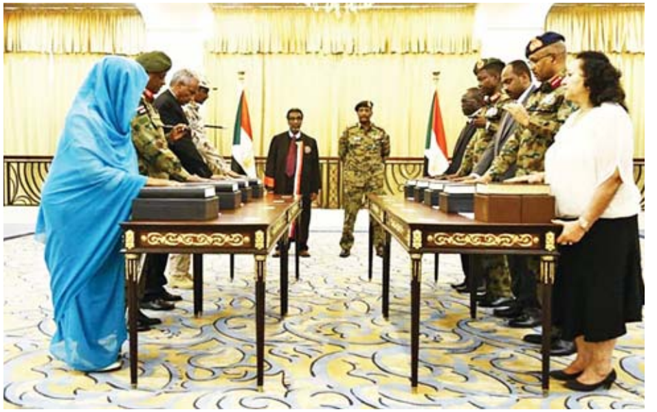
ကို မကြာမီအချိန်တွင် ဖျက်သိမ်းရန် အမိန့်တစ်ရပ် ထုတ်ပြန်ကြေညာမည်ဖြစ်သည်။ ဆူဒန်အသွင်ကူးပြောင်းရေး စစ်ကောင်စီသည် သမ္မတဟောင်း အယ်ဘာရှာ သမ္မတရာထူးမှ နုတ်ထွက်ခဲ့သည် ဖြစ်ပြီး ၁၁ ရက်မှစပြီး နိုင်ငံအရေးကိစ္စရပ်များကို တာဝန်ယူဆောင်ရွက်လျက်ရှိ သည်။

ဆူဒန် အချုပ်အခြာအာဏာပိုင် ကောင်စီတစ်ရပ်ကို ဖွဲ့စည်းခဲ့ပြီးနောက် ဆူဒန်အသွင်ကူးပြောင်းရေး စစ်ကောင်စီ