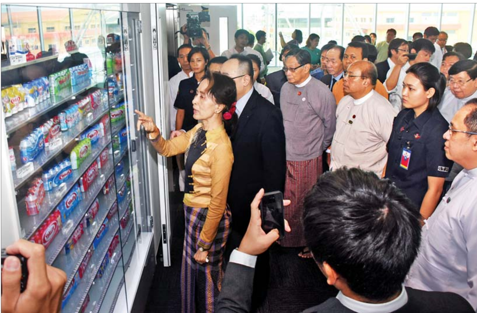
နိုင်ငံတော်၏အတိုင်ပင်ခံပုဂ္ဂိုလ် ဒေါ်အောင်ဆန်းစုကြည် Yakult Myanmar Co., Ltd. စက်ရုံမှ ထုတ်လုပ်ထားသည့် ကုန်ပစ္စည်းများကို ကြည့်ရှုစဉ်။

ရန်ကုန် ဩဂုတ် ၂၁ နိုင်ငံတော်၏ အတိုင်ပင်ခံပုဂ္ဂိုလ် ဒေါ်အောင်ဆန်းစုကြည် သည် ပြည်ထောင်စုဝန်ကြီးများ ဖြစ်ကြသည့် ဦးကျော်တင့်ဆွေ၊ ဦးမင်းသူ၊ ဦးသောင်းထွန်း၊ ရန်ကုန်တိုင်းဒေသကြီးဝန်ကြီးချုပ် ဦးမြိုးမင်းသိန်းနှင့် တာဝန်ရှိသူများနှင့်အတူ ယနေ့နံနက်ပိုင်းတွင် ရန်ကုန်တိုင်းဒေသကြီး သန်လျင်မြို့နယ်ရှိ သီလဝါအထူးစီးပွားရေးဇုန်သို့ သွားရောက်ကာ စီမံကိန်းလုပ်ငန်းများ ဆောင်ရွက်နေမှုအခြေအနေကို ကြည့်ရှုစစ်ဆေးသည်။