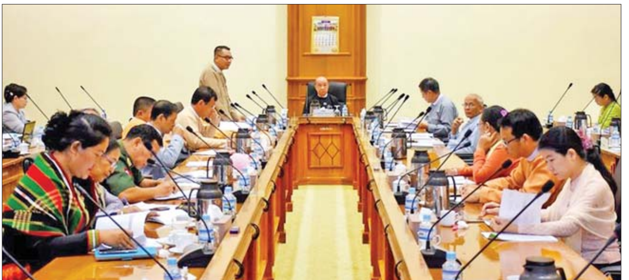
ရင်းနှီးမြုပ်နှံမှုနှင့် နိုင်ငံခြားစီးပွားဆက်သွယ်ရေးဝန်ကြီးဌာန၊ ပြည်ထောင်စု ရှေ့နေချုပ်ရုံး၊ မြန်မာနိုင်ငံ ကုန်သည်များနှင့် စက်မှုလက်မှုလုပ်ငန်းရှင်များ

အစည်းအဝေးသို့ ပြည်ထောင်စုလွှတ်တော် ဒုတိယနာယက ဥပဒေကြမ်းပူးပေါင်းကော်မတီနှင့် ပြည်သူ့ငွေစာရင်းပူးပေါင်းကော်မတီဥက္ကဋ္ဌ ဦးထွန်းအောင်(ခ) ဦးထွန်းထွန်းဟိန်၊ စီးပွားရေးနှင့်ကူးသန်းရောင်းဝယ်ရေးဝန်ကြီးဌာန ဒုတိယဝန်ကြီး ဦးအောင်ထူး၊ စီမံကိန်းနှင့် ဘဏ္ဍာရေးဝန်ကြီးဌာန ဒုတိယဝန်ကြီး ဦးမောင်မောင်ဝင်း၊ မြန်မာနိုင်ငံတော်ဗဟိုဘဏ် ဒုတိယဥက္ကဋ္ဌ ဦးစိုးသိန်း၊ ဥပဒေကြမ်းပူးပေါင်းကော်မတီ ဒုတိယဥက္ကဋ္ဌများ၊ အတွင်းရေးမှူး၊ တွဲဖက်အတွင်းရေးမှူးနှင့် ကော်မတီဝင်များ၊ ပြည်သူ့ငွေစာရင်းပူးပေါင်းကော်မတီဒုတိယဥက္ကဋ္ဌ၊ အတွင်းရေးမှူးနှင့် ကော်မတီဝင်များ၊ ပြည်သူ့လွှတ်တော်ဘဏ်များနှင့် ငွေကြေးဆိုင်ရာဖွံ့ဖြိုးတိုးတက်ရေးကော်မတီ၊ စီးပွားရေးနှင့် ကူးသန်းရောင်းဝယ်ရေးဝန်ကြီးဌာန၊ စီမံကိန်းနှင့် ဘဏ္ဍာရေးဝန်ကြီးဌာန၊