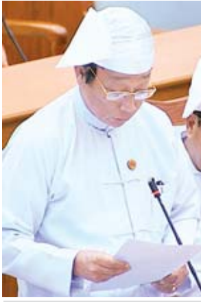
ဒုတိယဝန်ကြီး ဦးလှကျော်