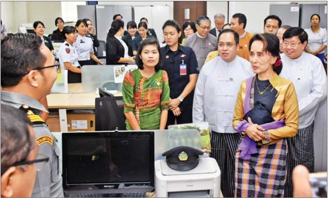
နိုင်ငံတော်၏အတိုင်ပင်ခံပုဂ္ဂိုလ် ဒေါ်အောင်ဆန်းစုကြည် သီလဝါအထူးစီးပွားရေးဇုန်ရှိ ဝန်ထမ်းများအား ရင်းရင်းနှီးနှီး နှုတ်ဆက်စဉ်။

စုပေါင်းမှတ်တမ်းတင်ဓာတ်ပုံရိုက်ဆက်လက်၍ နိုင်ငံတော်၏အတိုင်ပင်ခံပုဂ္ဂိုလ်သည် တာဝန်ရှိသူများနှင့်အတူ One Stop Service Center(OSSC)သို့ သွားရောက်၍ လုပ်ငန်းများဆောင်ရွက်နေမှု