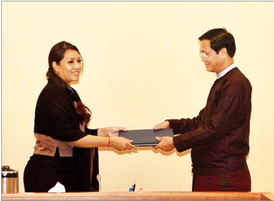
ဒုတိယသမ္မတ ဦးဟင်နရီဝန်ထီးယူထံ Tint Tint Myanmar Group of Companies ဥက္ကဋ္ဌ ဒေါ်တင့်တင့်လွင်က ရေယာဉ်ဆိုင်ရာစာရွက်စာတမ်းများကို လွှဲပြောင်းပေးအပ်စဉ်။

မိုးသည်ထန်စွာ ရွာသွန်းခြင်းကြောင့် ရေကြီးခြင်းနှင့် မြေပြိုခြင်းဘေးအန္တရာယ်များ ကြုံတွေ့နေရချိန်တွင် နယ်လှည့်ကျန်းမာရေး ကူညီစောင့်ရှောက်မှုပေးနိုင်ရေးအတွက် ရေယာဉ်တစ်စင်းလှူဒါန်းသည့်အတွက် ကူညီ