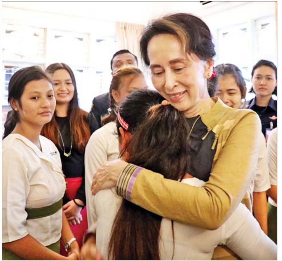
နိုင်ငံတော်၏အတိုင်ပင်ခံပုဂ္ဂိုလ် ဒေါ်အောင်ဆန်းစုကြည် ဒေင်မြန်မာပရဟိတအဖွဲ့မှ စောင့်ရှောက်ခံအမျိုးသမီးငယ်တစ်ဦးအား နွေးထွေးစွာ တွေ့ဆုံအားပေးစဉ်။