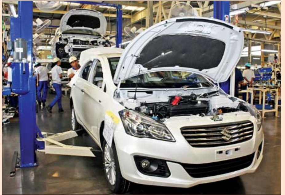
နိုင်ငံတော်၏အတိုင်ပင်ခံပုဂ္ဂိုလ် ဒေါ်အောင်ဆန်းစုကြည် Suzuki Thilawa Motor Co., Ltd. စက်ရုံတွင် ကားများတပ်ဆင်ထုတ်လုပ်နေသည်ကို ကြည့်ရှုစဉ်။