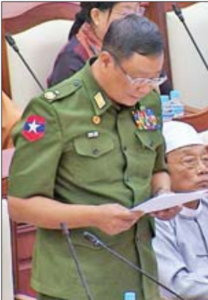
ဒုတိယဝန်ကြီး ဗိုလ်ချုပ်အောင်သူ