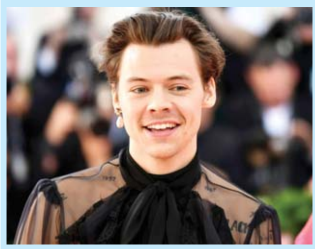
အေးပြည့်- စုစည်းသည်

ကျော်ကြားတဲ့ အမေရိကန်ပေါ့ပွဲတစ်ဦးဖြစ်သူ ဒေမီလက်ဗားတိုးဟာ လတ်တလောမှာ ကျရောက်ခဲ့တဲ့ သူ့ရဲ့ မွေးနေ့မှာတော့ အခြားသော ပေါ့ပွဲကြယ်ပွင့်တစ်ဦးဖြစ်သူ အရီရန်နာ ဂရန်းဒ်ရဲ့ ဖျော်ဖြေပွဲကို သွားရောက်အားပေးခဲ့တာ တွေ့ရပါတယ်။ ဖျော်ဖြေပွဲမှာ အပေါင်း အသင်းတွေနဲ့ကစားခဲ့တဲ့ ပုံရိပ်တွေကို ဒေမီလက်ဗားတိုးက သူ့ရဲ့အင်စတာဂရမ်စာမျက်နှာ ပေါ်မှာဖော်ပြခဲ့ကြောင်း အီးအွန်လိုင်းဒေါ့ကွန်းရဲ့ ရေးသားဖော်ပြချက်တွေအရ သိရပါတယ်။ ဒေမီလက်ဗားတိုးဟာ ဩဂုတ် ၂၀ ရက်မှာ ၂၇ နှစ်ပြည့်မြောက်ခဲ့တာ ဖြစ်ပါတယ်။ ဒီလို မွေးနေ့မှာ အရီရန်နာဂရန်းဒ်ရဲ့ ဖျော်ဖြေပွဲကို တက်ရောက်လာတဲ့ ဒေမီလက်ဗားတိုးကို အရီရန်နာဂရန်းဒ်နဲ့ အခြားသော သူငယ်ချင်းတွေက ဖျော်ဖြေပွဲမစတင်မီမှာ အံ့ဩဖွယ် မွေးနေ့ပွဲလေးကို ဖန်တီးပေးခဲ့ပြီး မွေးနေ့ဆုတောင်းတွေ ပြောကြားပေးခဲ့ကြတာ အတူကစား ခဲ့ကြကြောင်းလည်း သိရပါတယ်။