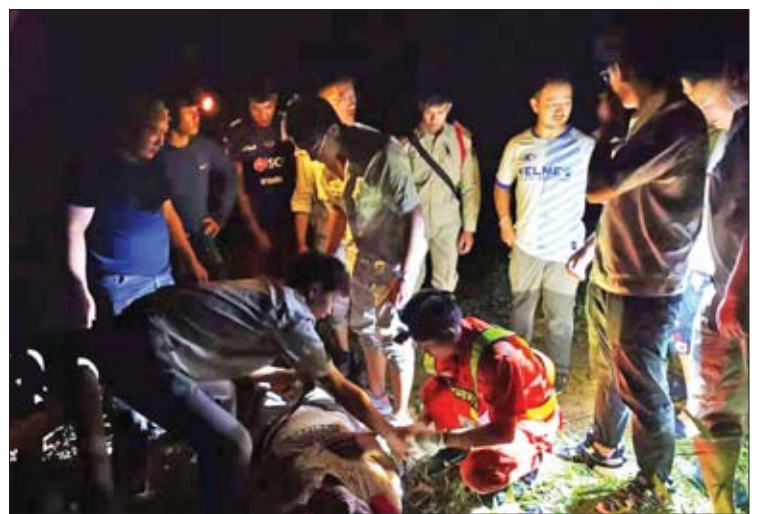
သိရသည်။ အဆိုပါ တရုတ်ဆေးဘက်ဆိုင်ရာအသင်း သည် လာအိုနိုင်ငံ၌ ပြုလုပ်လျက်ရှိသော "Peace Train-2019" ဟု အမည်ပေးထား သည့် တရုတ်-လာအိုလူသားချင်းစာနာမှု ဆိုင်ရာနှင့် ဆေးဘက်ဆိုင်ရာပူးတွဲကယ်ဆယ် ရေးလေ့ကျင့်မှုတွင် ပါဝင်တက်ရောက်နေကြ သူများဖြစ်ကြောင်း သိရသည်။ ကိုးကား - ဆင်ဟွာ ဘာသာပြန် - ဂျေတီ

သည်။ လာအိုနိုင်ငံဆိုင်ရာ တရုတ်သံရုံးနှင့် လွန်ပရာဘန်မြို့အခြေစိုက် တရုတ် ကောင်စစ်ဝန်ရုံးမှ ဝန်ထမ်းများသည် ကူညီ ကယ်ဆယ်ရေးလုပ်ငန်းများ လုပ်ဆောင်ရန် အတွက် အခင်းဖြစ်ပွားသည့်နေရာသို့ ရောက်ရှိခဲ့ကြသည်။ ထို့အတူ တရုတ်ပြည်သူ့လွတ်မြောက် ရေးတပ်မတော်မှ Z-8G အမျိုးအစား ကယ်ဆယ်ရေးရဟတ်ယာဉ်တစ်စင်းသည် ကူညီကယ်ဆယ်ရေးလုပ်ငန်းများ လုပ်ဆောင် ရန်အတွက် တရုတ်ဆေးဘက်အသင်းနှင့် လာအိုဆရာဝန်များကို တင်ဆောင်ပြီး လွန်ပရာဘန်မြို့သို့ ပို့ဆောင်ပေးခဲ့ကြောင်း