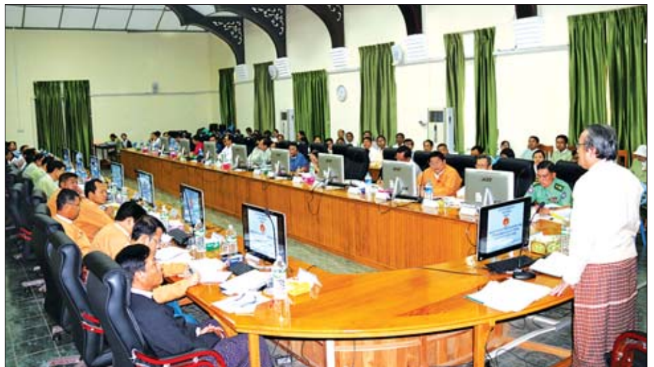
ရေကြီးရေလျှံမှုကြောင့် ပျက်စီးဆုံးရှုံးမှုများနှင့်စပ်လျဉ်း၍ အစည်းအဝေးကျင်းပ