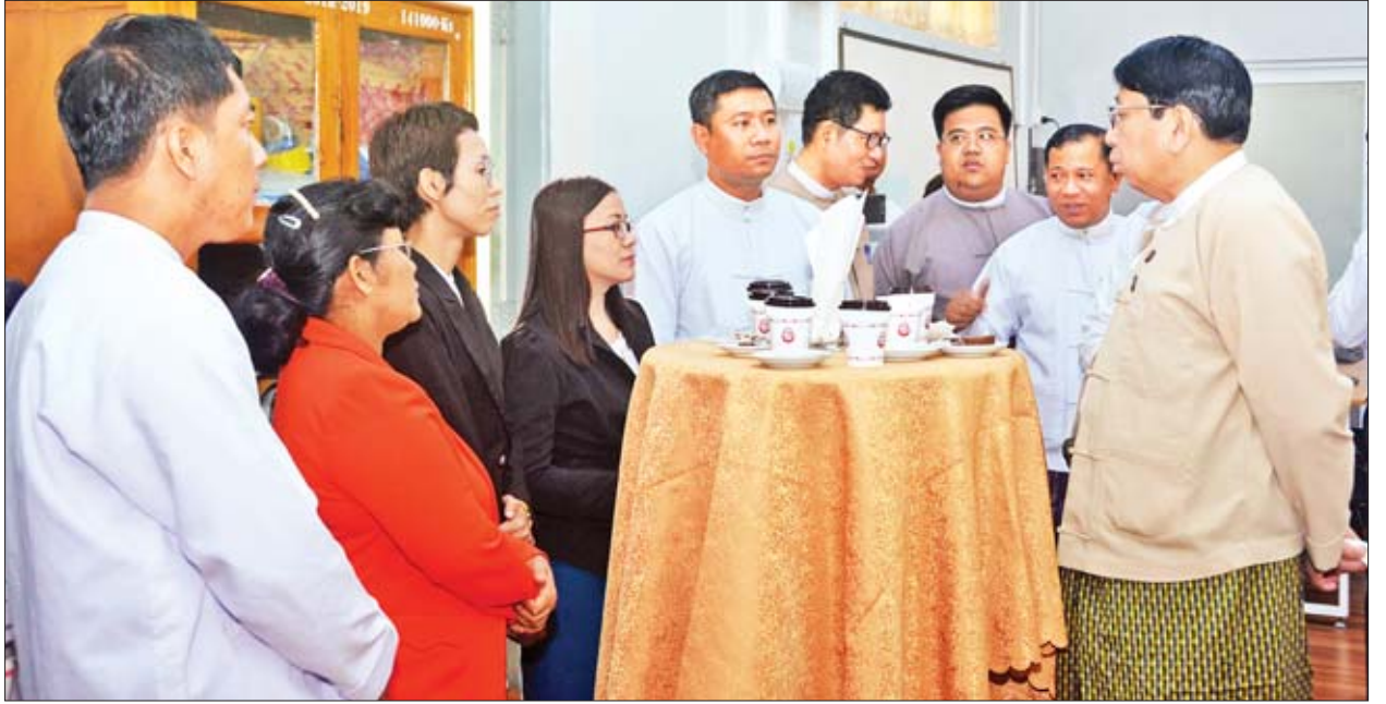
တို့မှ ပြည်တွင်း၊ ပြည်ပသတင်းများကို အချိန်နှင့်တစ်ပြေးညီ ထုတ်လွှင့်ဖော်ပြမှု လျက်ရှိရာ ယခုအခါ လူမှုမီဒီယာတစ်ခုဖြစ်သော ဖေ့စ်ဘွတ်တွင် ကြည့်ရှုသူ ဖြင့် ပြည်သူတို့၏ သတင်းသိရှိပိုင်ခွင့်အပေါ် ဖြည့်ဆည်းဆောင်ရွက်ပေး ၁ ဒေမ ၄ သန်းကျော်ရှိကြောင်း သိရသည်။ သတင်းစဉ်

MOI Website ကို ပြန်ကြားရေးဝန်ကြီးဌာန ပြန်ကြားရေးနှင့် ပြည်သူ့ဆက်ဆံရေးဦးစီးဌာနရှိ သုတေသနနှင့် သတင်းအချက်အလက်ဌာနခွဲအနေဖြင့် Webportal, Social Media(Facebook, Viber, Twitter)