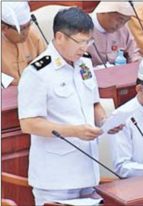
ဒုတိယဝန်ကြီး ဗိုလ်ချုပ်မြင့်နွယ်

သို့ပါ၍ နိုင်ငံတော်မှ ၂၀၁၉ ခုနှစ် ဧပြီနှင့် မေလတို့တွင် အကျဉ်းထောင် အသီးသီး၌ ပြစ်ဒဏ်ကျခံနေသော အကျဉ်းသား အကျဉ်းသူ စုစုပေါင်း ၂၃၀၁၉ ဦးကို စည်းကမ်းသတ်မှတ်ချက်မထားဘဲ လွတ်ငြိမ်းသက်သာခွင့်(၃)ကြိမ်ဖြင့် ပြစ်ဒဏ်လွတ်ငြိမ်းခွင့်ပြုခဲ့ပါကြောင်း၊ ထိုသို့ ပြစ်ဒဏ်လွတ်ငြိမ်းသက်သာခွင့် ပေးခဲ့သည့် အသက် ၈၀ နှစ်နှင့်အထက်၊ အသက် ၇၅ နှစ်မှ ၈၀ နှစ်အောက်ရှိ သည့် အကျဉ်းသား အကျဉ်းသူများ၊ နာတာရှည်ကျန်းမာရေးမကောင်းသည့် အကျဉ်းသား အကျဉ်းသူများ၊ နိုင်ငံခြားသား အကျဉ်းသား အကျဉ်းသူများ၊ လူငယ်အကျဉ်းသား အကျဉ်းသူများ၊ မတရားအသင်း ၁၇ (၁)၊ ၁၇(၂)နှင့် အခြားတွဲ၊ မူးယစ်မှုများ၊ တပ်မတော်အက်ပုဒ်မဖြင့် ပြစ်ဒဏ်ကျခံလျက်ရှိသည့်