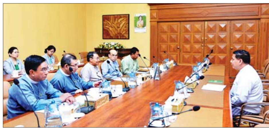
လုပ်ငန်းစီမံကိန်း၊ သုတေသနလုပ်ငန်း ပူးပေါင်းဆောင်ရွက်မှု၊ တိုးတက်မှုအခြေအနေ၊ ဆက်လက်ဆောင်ရွက်လိုသည်လုပ်ငန်း၊ နှစ်နိုင်ငံဝန်ကြီးဌာနအကြား ပတ်ဝန်းကျင်ထိန်းသိမ်းရေး၊ လေထုအရည်အသွေး

နေပြည်တော် ဩဂုတ် ၂၀ သယံဇာတနှင့် သဘာဝပတ်ဝန်းကျင်ထိန်းသိမ်းရေး ဝန်ကြီးဌာန ပြည်ထောင်စုဝန်ကြီး ဦးအုန်းဝင်းသည် ဂျပန်နိုင်ငံဆိုင်ရာ မြန်မာသံအမတ်ကြီးအဖြစ် ခန့်အပ်ပြီး ဖြစ်သော ဦးမြင့်သူအား ယနေ့နံနက် ၁၁ နာရီတွင် ရုံးအမှတ်(၂၈) ပြည်ထောင်စုဝန်ကြီးရုံး ဧည့်ခန်းမ၌ လက်ခံတွေ့ဆုံသည်။ ပူးပေါင်းဆောင်ရွက် တွေ့ဆုံစဉ် ဂျပန်အပြည်ပြည်ဆိုင်ရာ ပူးပေါင်းဆောင်ရွက်ရေးအေဂျင်စီ (JICA) အပါအဝင် ဂျပန်နိုင်ငံရှိ သတ္တု၊ ပတ်ဝန်းကျင်နှင့် သစ်တောကဏ္ဍဆိုင်ရာအဖွဲ့အစည်းများ၊ အမျိုးသားပြတိုက်၊ တက္ကသိုလ်၊ ရုက္ခဗေဒဥယျာဉ်၊ တိရစ္ဆာန်ဥယျာဉ်များ၊ ဂျပန်နိုင်ငံအခြေစိုက် အပြည်ပြည်ဆိုင်ရာ အဖွဲ့အစည်းများနှင့်ပူးပေါင်း၍