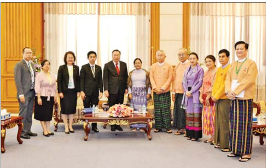
ဒေါက်တာသန်းဝင်းနှင့် ပြည်သူ့လွှတ်တော်ကိုယ်စားလှယ် ဒေါ်ပြုံးကေသီနိုင်၊ ဦးဘိုဘိုဦး၊ အမျိုးသားလွှတ်တော် ကိုယ်စားလှယ် ဦးမောင်မောင်လတ်၊ ဒေါ်နော်လှလှစိုး၊

တွေ့ဆုံပွဲသို့ ပြည်သူ့လွှတ်တော် နိုင်ငံတကာ ဆက်ဆံရေးကော်မတီဥက္ကဋ္ဌ ဦးဇော်သိန်း၊ အမျိုးသား လွှတ်တော် နိုင်ငံတကာဆက်ဆံရေးကော်မတီဥက္ကဋ္ဌ