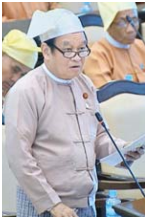
ပြည်ထောင်စုဝန်ကြီး ဒေါက်တာမြင့်ထွေး

ဆက်လက်၍ မန္တလေးတိုင်းဒေသကြီး မဲဆန္ဒနယ်အမှတ်(၇)မှ ဦးကျော်တုတ်၏ ကမ္ဘာတစ်ဝန်း တိုးပွားလာသော ဝက်သက်ရောဂါကို မြန်မာ