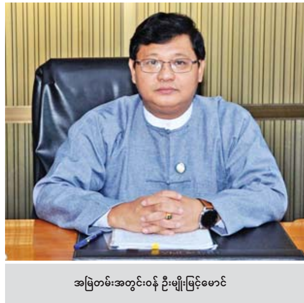
အမြဲတမ်းအတွင်းဝန် ဦးမျိုးမြင့်မောင်

ဖြေ။ ။ ပြင်ဆင်ရာမှာ ပထမတစ်ချက်ကတော့ အရင်လိုနောက်ကျဒဏ်ကြေးကို တစ်လတစ်ရာခိုင်နှုန်း ပုံသေသတ်မှတ်ဘဲ ပထမလ တစ်ရာခိုင်နှုန်း၊ ဒုတိယလ ထပ်တိုး ၁ ဒသမ ၅ ရာခိုင်နှုန်း၊ တတိယလထပ်တိုး နှစ်ရာခိုင်နှုန်း စသဖြင့်တိုးပြီး ယခင်လက ဒဏ်ကြေးနဲ့ ပေါင်းပြီးဆောင်ရတဲ့ ဒဏ်ကြေး တိုးစနစ် ပြင်ဆင်ခဲ့ခြင်းဖြစ်ပါတယ်။ ပြောရရင် -