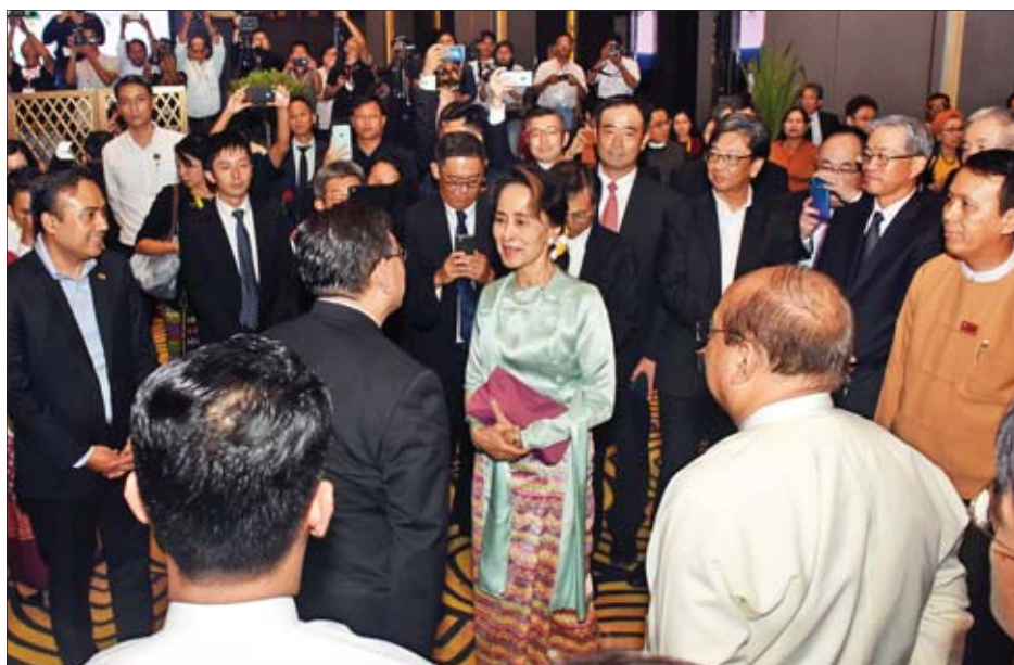
နိုင်ငံတော်၏အတိုင်ပင်ခံပုဂ္ဂိုလ် ဒေါ်အောင်ဆန်းစုကြည် မြန်မာ- ဂျပန်- အမေရိကန် ရင်းနှီးမြှုပ်နှံမှုဖိုရမ်သို့ တက်ရောက်လာကြသူများအား ရင်းရင်းနှီးနှီးနှုတ်ဆက်စဉ်။