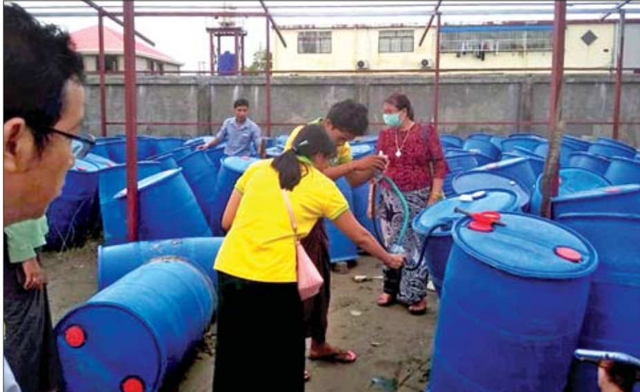
ထုပ်ပိုး၊ ဖြန့်ဖြူးရောင်းချ ဆောင်ရွက်လုပ်ကိုင်ခွင့်မရှိ ကြောင်းနှင့် ပိုးသတ်ဆေးပုဒ်မ (၄၄)အရ တရားစွဲဆိုသော ပြစ်မှုများကို ရဲအရေးယူပိုင်ခွင့်ရှိသော အမှုအဖြစ် သတ်မှတ်ထားကြောင်း သိရသည်။ သတင်းစဉ်

ပိုးသတ်ဆေးဥပဒေပုဒ်မ ၃၁ အရ မည်သူမျှမှတ်ပုံ တင်အဖွဲ့၏ ခွင့်ပြုချက်မရဘဲ ပိုးသတ်ဆေး သို့မဟုတ် အဆိပ်ရှိပစ္စည်းများကို တင်သွင်းခြင်း၊ တင်ပို့ခြင်းမပြုလုပ် ရဟု တားမြစ်ထားကာ ပိုးသတ်ဆေးဥပဒေပုဒ်မ ၃၂ အရ မည်သူမျှလိုင်စင်မရှိဘဲ ပြည်ပမှတင်သွင်းလာသော အဆိပ်ရှိပစ္စည်းကို ပိုးသတ်ဆေးအဖြစ် ဖော်စပ်ရောင်းချ သည့်လုပ်ငန်း၊ ပြည်ပမှတင်သွင်းလာသော ပိုးသတ်ဆေး ကို ပြန်လည်ထုတ်ပိုးရောင်းချသည့်လုပ်ငန်း၊ ပိုးသတ်ဆေး ကို လက်လီလက်ကား ရောင်းချသည့်လုပ်ငန်းနှင့် ပိုးသတ် မိုင်းတိုက်ခြင်းလုပ်ငန်းမပြုလုပ်ရဟု တားမြစ်ထားပြီး ပိုးသတ်ဆေးမှတ်ပုံတင်အဖွဲ့၏ စိစစ်ခွင့်ပြုချက်မရှိဘဲ ပိုးသတ်ဆေးများတင်သွင်း၊ ဖော်စပ်ထုတ်လုပ်၊ ပြန်လည်