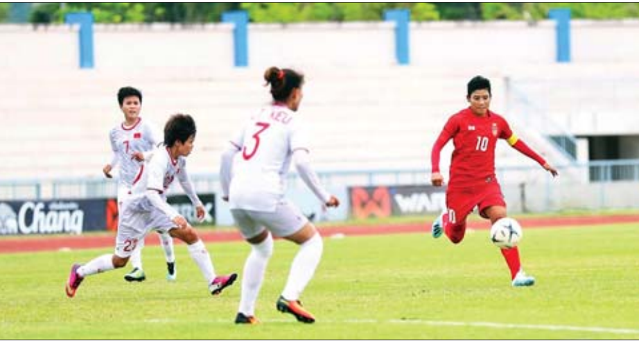
မြန်မာအမျိုးသမီးအသင်းနှင့် ဝီယက်နမ်အမျိုးသမီးအသင်းတို့ ယှဉ်ပြိုင်ကစားကြစဉ်။

ရန်ကုန် ဩဂုတ် ၂၀ မန္တလေး-လားရှိုး-မုဆယ် ပြည်ထောင်စုလမ်းမကြီးနှင့် မုဆယ်-ရွှေလီ၊ ချင်းရွှေဟော်-မိန်းတိန် နယ်စပ်ကုန်သွယ်ရေးစခန်းသွားကားလမ်းပေါ်မှ ဩဂုတ် ၁၅ ရက်က မိုင်းခွဲ ခံလိုက်ရသည့် ဂုတ်တွင်းတံတားကို ဆောက်လုပ်ရေးဝန်ကြီးဌာနက ၅ ရက်နှင့် အပြီးတည်ဆောက်လိုက်ပြီး ယနေ့မွန်းလွဲ ၁ နာရီတွင် အိမ်စီးကားငယ်များကို ယာယီဘေလီတံတားပေါ်မှ ဖြတ်သန်းမောင်းနှင်ခွင့်ပြုလိုက်ပြီဖြစ်သည်။ အဆိုပါဘေလီတံတားမှာ အလျားပေ ၂၀၀ ရှိပြီး သုံးလွှာတစ်ထပ် နှစ်လမ်းသွား တံတားဖြစ်သည်။ တံတားပစ္စည်းများကို ရန်ကုန်မှ အမြန်သယ်ယူပြီး ကရိန်းစက်ကြီး များ အသုံးပြု၍ ဆောက်လုပ်ရေးဝန်ကြီးဌာန တံတားဦးစီးဌာနမှ အင်ဂျင်နီယာနှင့် အင်ဂျင်နီယာချုပ်များရုံးချုပ်မှ စာမျက်နှာ ၁၁ ကော်လံ ၁ သို့ >>>