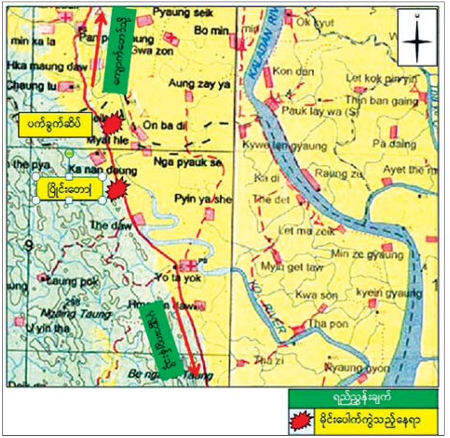
ရည်ညွှန်းချက် မိုင်းပေါက်ကွဲသည့်နေရာ