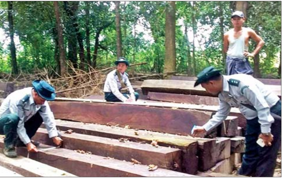
နေပြည်တော် ဩဂုတ် ၂၀ ထွက်ပစ္စည်းများ ရှာဖွေဖမ်းဆီးရေးအား ပြည်သူပူးပေါင်း ပါဝင်မှုဖြင့် လူထုအခြေပြုစောင့်ကြပ်ကြည့်ရှုသတင်းပို့

စနစ်အပါအဝင် နည်းလမ်းမျိုးစုံဖြင့် ဆောင်ရွက်လျက်ရှိရာ ဩဂုတ် ၆ ရက်မှ ၁၂ ရက်အထိ သစ်တောဝန်ထမ်းများ၊ မြန်မာနိုင်ငံရဲတပ်ဖွဲ့ဝင်များနှင့် အုပ်ချုပ်ရေးအဖွဲ့ဝင်များ ပါဝင်သော ပူးပေါင်းအဖွဲ့သည် တန့်ဆည်မြို့နယ် တန့်ဆည်-အင်္ဂပူလမ်းတွင် သရီးကရောင်းခြောက်ဘီး ယာဉ်တစ်စီးပေါ်မှ တမလန်းခွဲသား ဆိုက်စုံ ၁ ဒဿမ ၅၃၆၀ တန်နှင့် အတူ ပြစ်မှုကျူးလွန်သူတစ်ဦးကို ဖမ်းဆီးရမိခဲ့ ကြောင်း သိရသည်။