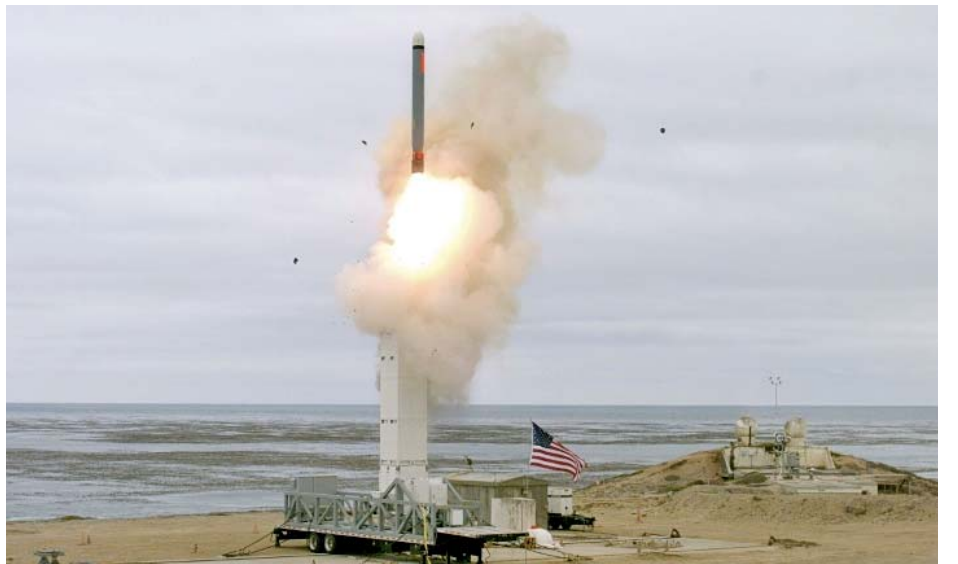
အမေရိကန်၏ ဒုံးကျည်စမ်းသပ်ခြင်းသည် ကာကွယ်ရေးကဏ္ဍအင်အားပြိုင်ဆိုင်မှုများနှင့် ထိပ်တိုက်ရင်ဆိုင်တွေ့မှုများကို ပိုမိုအားပေးရာရောက်သည်ဟု တရုတ်နိုင်ငံခြားရေးဝန်ကြီးဌာန ပြောရေးဆိုခွင့်ရှိသူ ဂျန်ရှောင်က ဆိုသည်။ ထို့ပြင် နိုင်ငံတကာနှင့် ဒေသတွင်းနိုင်ငံများ၏ အခြေအနေများအပေါ် ဆိုးရွားသော အကျိုးသက်ရောက်မှု

ထို့ပြင် အမေရိကန်က ယခုတာလတ်ပစ်ဒုံးကျည်ကို စမ်းသပ်ပစ်လွှတ်ခဲ့ခြင်းကြောင့် နှစ်နိုင်ငံချုပ်ဆိုထားသည့် အိုင်အင်အန်အက်စ် စာချုပ်သက်တမ်းမကုန်ဆုံးမီ အချိန်ကတည်းက ၎င်းအနေဖြင့် ဒုံးကျည်ဖွံ့ဖြိုးရေးလုပ်ငန်းစဉ်များကို ဆက်လက်လုပ်ဆောင်လျက်ရှိသည်မှာ သိသာထင်ရှားစေပါကြောင်း ရုရှားဒုတိယနိုင်ငံခြားရေးဝန်ကြီးဆာဂျီ ရေတ်ကော့ဗ်က ဆိုသည်။