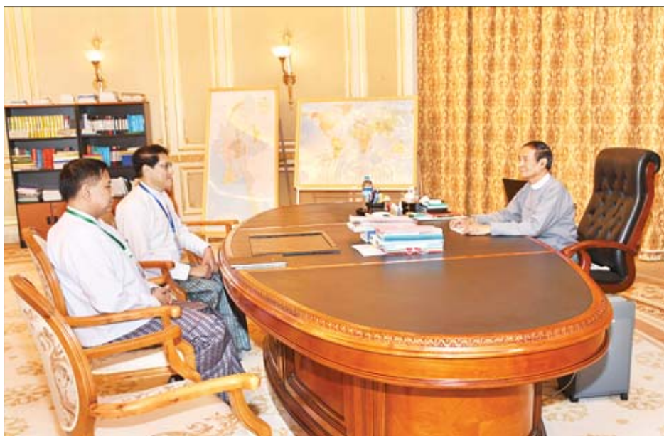
နိုင်ငံတော်သမ္မတ ဦးဝင်းမြင့် တရုတ်ပြည်သူ့သမ္မတနိုင်ငံဆိုင်ရာ မြန်မာသံအမတ်ကြီးအဖြစ် တာဝန်ထမ်းဆောင်မည့် ဦးမျိုးသန့်ဖေနှင့် ဂျပန်နိုင်ငံဆိုင်ရာ မြန်မာသံအမတ်ကြီးအဖြစ် တာဝန်ထမ်းဆောင်မည့် ဦးမြင့်သူတို့အား လမ်းညွှန် မှာကြားစဉ်။