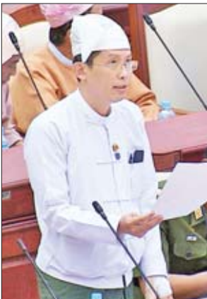
ဒုတိယဝန်ကြီး ဒေါက်တာထွန်းနိုင်