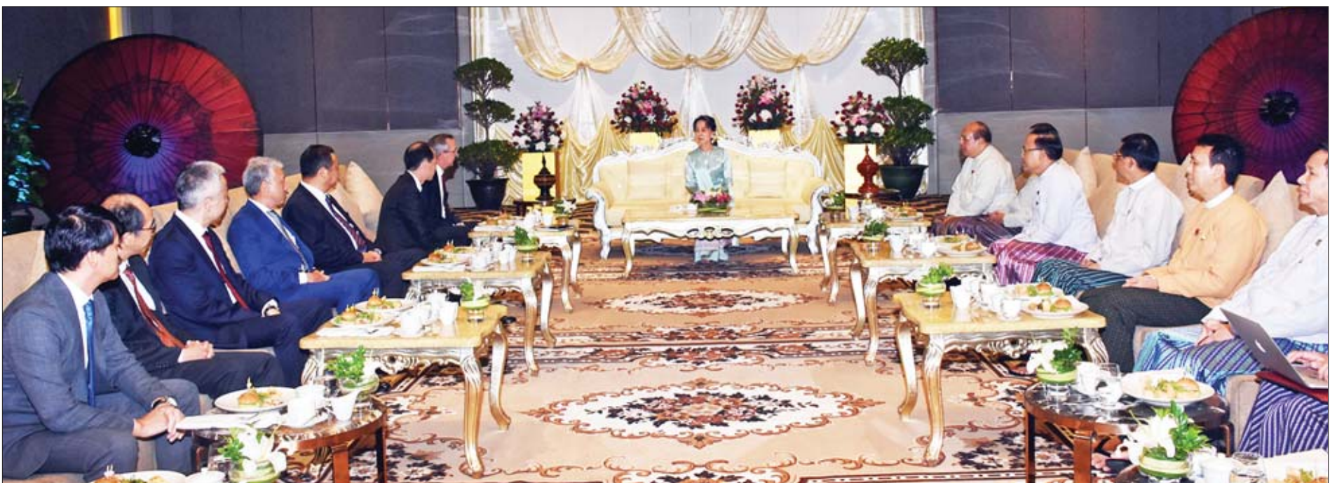
နိုင်ငံတော်၏အတိုင်ပင်ခံပုဂ္ဂိုလ် ဒေါ်အောင်ဆန်းစုကြည် ဂျပန်နိုင်ငံနှင့် အမေရိကန်နိုင်ငံတို့မှ သံအမတ်ကြီးများ၊ သံရုံးများမှကိုယ်စားလှယ်များ၊ မြန်မာနိုင်ငံကုန်သည်များနှင့် စက်မှုလက်မှုလုပ်ငန်းရှင်များအသင်းချုပ်မှ ကိုယ်စားလှယ်များ၊ JICA နှင့် JETRO တို့မှ ကိုယ်စားလှယ်များ၊ ဂျပန်နှင့် အမေရိကန် စီးပွားရေးလုပ်ငန်းရှင်များနှင့် တွေ့ဆုံ၍ မြန်မာနိုင်ငံရှိ ၎င်းတို့၏ ရင်းနှီးမြုပ်နှံမှုဆိုင်ရာ အတွေ့အကြုံများကို ရင်းနှီးပွင့်လင်းစွာ မေးမြန်းစဉ်။