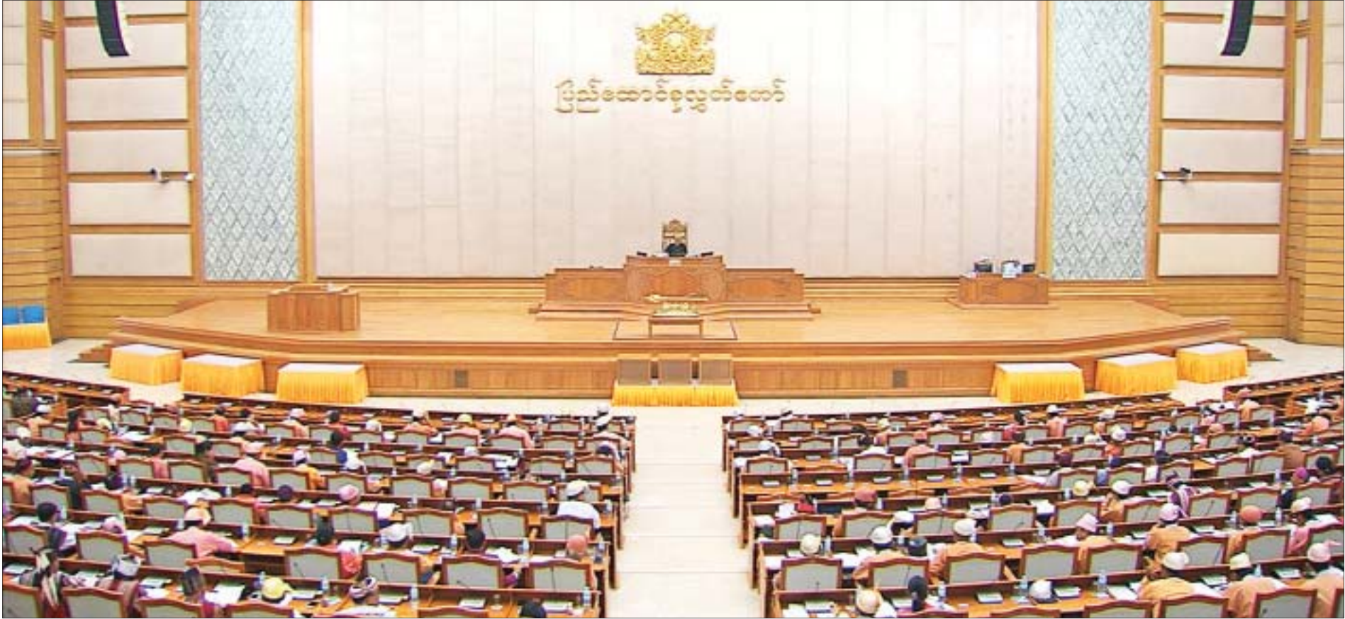
ဒုတိယအကြိမ် ပြည်ထောင်စုလွှတ်တော် (၁၃)ကြိမ်မြောက် ပုံမှန်အစည်းအဝေး ၁၃ ရက်မြောက်နေ့ ကျင်းပစဉ်။

နေပြည်တော် ဩဂုတ် ၁၉ ဒုတိယအကြိမ် ပြည်ထောင်စုလွှတ်တော် (၁၃)ကြိမ်မြောက် ပုံမှန်အစည်းအဝေး ၁၃ ရက်မြောက်နေ့ကို ယနေ့နံနက်ပိုင်းတွင် ကျင်းပရာ အမျိုးသားပညာရေး မူဝါဒကော်မရှင်၏ ခြောက်လတာကာလ လုပ်ငန်းများဆောင်ရွက်ခဲ့မှု အစီရင်ခံစာအပါအဝင် လွှတ်တော်ကိုယ်စားလှယ်များ၏ ဆွေးနွေး