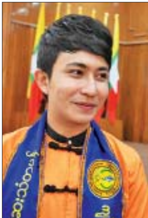
သူရိယ (သရုပ်ဆောင်)