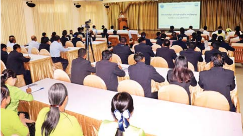
စစ်ဆေးရေးအရာရှိများ လုပ်ငန်းကျွမ်းကျင်မှုဆိုင်ရာ အလုပ်ရုံဆွေးနွေးပွဲ အမှတ်စဉ် (၁ / ၂၀၁၉) ဖွင့်ပွဲကို ယနေ့ နံနက် ၉ နာရီခွဲတွင် စီးပွားရေးနှင့် ကူးသန်းရောင်းဝယ်ရေး ဝန်ကြီးဌာန စားသုံးသူရေးရာဦးစီးဌာန သင်တန်းခန်းမ ၌ ကျင်းပသည်။

အကာအကွယ်ပေးနိုင်ရန် ရည်ရွယ် အလုပ်ရုံဆွေးနွေးပွဲတွင် ဒုတိယဝန်ကြီး ဦးအောင်ထူး က ယနေ့အလုပ်ရုံဆွေးနွေးပွဲ ကျင်းပခြင်း၏ ရည်ရွယ်ချက်မှာ စားသုံးသူအကာအကွယ်ပေးရေးလုပ်ငန်းများ ဆောင်ရွက်ရာတွင် စားသုံးသူအကာအကွယ်ပေးရေး ဥပဒေအဟောင်းအရ ဌာနစုံပါဝင်သော အဖွဲ့ဖြင့် ဆောင်ရွက်ခဲ့သော်လည်း ၂၀၁၉ ခုနှစ် မတ် ၁၅ ရက်တွင် ပြင်ဆင်ပြဋ္ဌာန်းခဲ့သော ဥပဒေအသစ်အရ စားသုံးသူရေးရာ ဦးစီးဌာနမှ အရာထမ်း၊ အမှုထမ်းများအား စစ်ဆေးရေး အရာရှိများအဖြစ် တာဝန်ပေးအပ်ထားသည့်အတွက် စစ်ဆေးရေးအရာရှိများအနေဖြင့် ကုန်စည်နှင့် ဝန်ဆောင်မှု များအပေါ် စစ်ဆေးသည့်အခါ နည်းစနစ်ကျနစွာဖြင့် စစ်ဆေးနိုင်ရန်၊ ပညာပေးခြင်းလုပ်ငန်းများ၊ တိုင်ကြားမှု ကိစ္စ၊ အခြားဆက်စပ်ဌာနများက အကူအညီတောင်းခံ ဆောင်ရွက်လုပ်ကိုင်သည့်အခါများတွင် စနစ်တကျဖြင့် ဆောင်ရွက်နိုင်စေရန်နှင့် စားသုံးသူပြည်သူများကို ဥပဒေပြဋ္ဌာန်းချက်ပါအတိုင်း ထိထိရောက်ရောက် အကာအကွယ်ပေးနိုင်ရန် ရည်ရွယ်ဖွင့်လှစ်ခြင်းဖြစ်ပါ ကြောင်း၊ ဥပဒေအရ ပြည်တွင်းထုတ်ကုန်များနှင့် ပြည်ပက