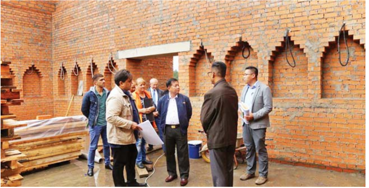
ညပိုင်းတွင် တပ်မတော်ကာကွယ်ရေးဦးစီးချုပ်သည် စစ်သံရုံးမှ အရာရှိ၊ စစ်သည်၊ မိသားစုဝင်များနှင့် သင်တန်းသား အရာရှိများအား အမှတ်တရလက်ဆောင်ပစ္စည်းများ ပေးအပ်ခဲ့ကြောင်း တပ်မတော်ကာကွယ်ရေးဦးစီးချုပ်ရုံး၏ သတင်းထုတ်ပြန်ချက်အရ သိရသည်။ သတင်းစဉ်

ရုရှားဖက်ဒရေရှင်းနိုင်ငံတွင် ကျင်းပပြုလုပ်ခဲ့သော International Army Games-2019 ပိတ်ပွဲ အခမ်းအနားသို့ တက်ရောက်ခဲ့သည့် တပ်မတော် ကာကွယ်ရေးဦးစီးချုပ် ဝိုင်းချုပ်မှူးကြီးမင်းအောင်လှိုင် ဦးဆောင်သော မြန်မာ့တပ်မတော် ကိုယ်စားလှယ်အဖွဲ့သည် ဩဂုတ် ၁၈ ရက် ညနေပိုင်းတွင် မော်စကိုမြို့အနောက်ဘက် ကာလူးဂါမြို့အနီးရှိ ကမ္ဘာ့ရွာ ယဉ်ကျေးမှုပေါင်းစုံ ပြတိုက်ပန်းခြံသို့ သွားရောက်ကြည့်ရှုလေ့လာကြသည်။