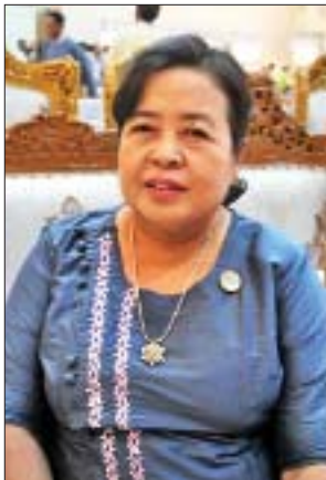
ဒေါ်ကြူကြူ