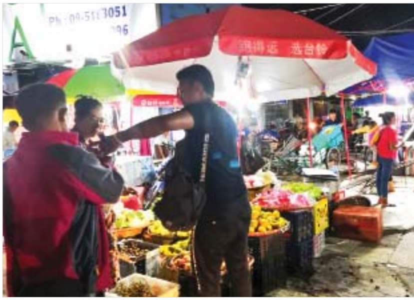
ဩဂုတ် ၁၉ ရက် ညပိုင်းက မူဆယ်မြို့ ဒေသခံပြည်သူများ ညဈေး၌ အေးချမ်းစွာ သွားလာဝယ်ယူနေကြသည်ကို တွေ့ရစဉ်။

တင်ဆက်မှုများ၊ အဖျော်ယမကာ ဖျော်စပ်ခြင်းဆိုင်ရာ တင်ဆက်မှုများနှင့်အတူ တိုင်းရင်းသားလူမျိုးများ၏ ရိုးရာအကအလှများဖြင့် ဖျော်ဖြေခဲ့ကြောင်း သိရသည်။ သတင်းစဉ်