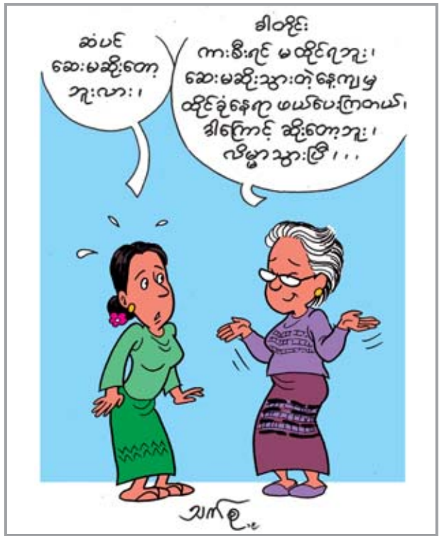
ဇာနည်မောင်

အကြံပြုစေချင် “ရန်ကုန်ရဲ့ ဘတ်စ်ကားမှတ်တိုင်ဘေးနားမှာ ခေတ်မီမီနီနဲ့ မှန်လုံခန်း လေးတွေ လုပ်ပေးမယ်။ ဆိုင်ခန်းသေးသေးလေးတွေကို စနစ်တကျပုံစံမျိုးနဲ့ ထားပြီးတော့ လူမှုရေးအဖွဲ့အစည်းတွေကို ပေးမယ်လို့တော့ ပြောထား တယ်။ ကြက်ခြေနီ၊ ကင်းထောက်နဲ့ မသန်စွမ်းအဖွဲ့တွေကို ပေးဖို့လျာထားတယ်။ ဒါပေမယ့် ဘယ်သူတွေကိုလည်း ပေးသင့်တယ်ဆိုတာ အကြံပြုစေချင်ပါ တယ်” ဟု မြို့တော်ဝန်က ပြောသည်။ အဆိုပါဆိုင်ခန်းများတွင် ဆေးလိပ်၊ ကွမ်းယာနှင့် အရက်သေစာများ ရောင်းချခြင်းကို ခွင့်မပြုကြောင်း၊ ငွေဖြည့်ကတ်များ Prepaid ကတ်များ