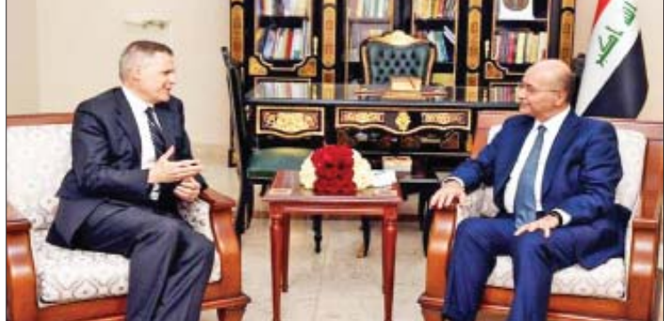
အီရတ်သမ္မတ ဘာဟမ်ဆာလီနှင့် အီရတ်နိုင်ငံဆိုင်ရာ အမေရိကန်သံအမတ်ကြီး မက်သီးယူးတူးလာတို့ တွေ့ဆုံစဉ်။

ဘဂ္ဒဒ် ဩဂုတ် ၁၉ အီရတ်သမ္မတသည် အီရတ်နိုင်ငံဆိုင်ရာ အမေရိကန်နှင့် အီရန်သံအမတ်ကြီးတို့အား ဩဂုတ် ၁၈ ရက်က သီးခြားစီ လက်ခံတွေ့ဆုံ ခဲ့ရာ ဆွေးနွေးညှိနှိုင်းခြင်းမှတစ်ဆင့် ဒေသတွင်း တင်းမာမှုများ လျော့ချရန် လိုအပ်မှုကို အလေး အနက် ဆွေးနွေးခဲ့ကြောင်း သိရသည်။ အီရတ်သမ္မတ ဘာဟမ်ဆာလီသည် အီရတ်နိုင်ငံဆိုင်ရာ အမေရိကန်သံအမတ်ကြီး မက်သီးယူးတူးလာနှင့် တွေ့ဆုံဆွေးနွေးစဉ် နယ်ပယ်ပေါင်းစုံ၌ နှစ်နိုင်ငံအကြား ဆက်ဆံရေး မြှင့်တင်ရေးဆိုင်ရာ နည်းလမ်းများကို အလေးထားဆွေးနွေးခဲ့ကြကြောင်း သမ္မတရုံး မှ သတင်းထုတ်ပြန်ချက်အရသိရသည်။ ထို့အပြင် အီရတ်သမ္မတနှင့် အမေရိကန် သံအမတ်ကြီးတို့သည် ဒေသဆိုင်ရာနှင့်