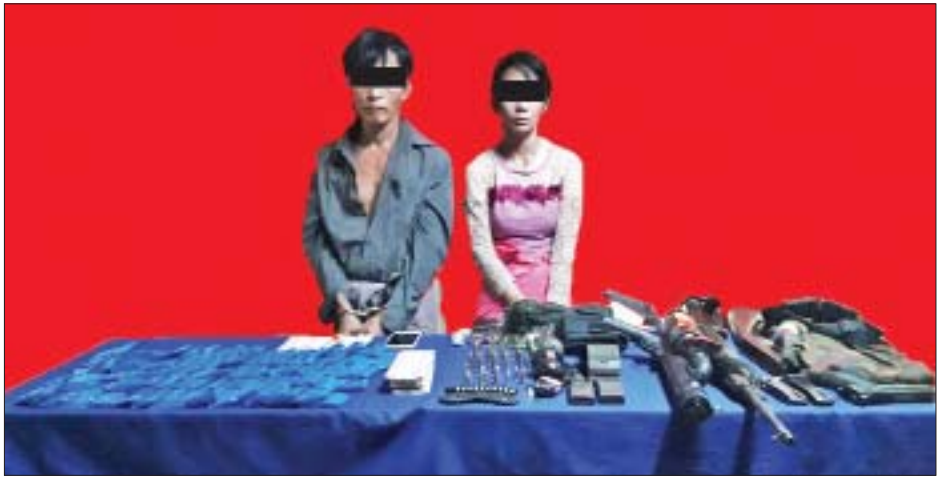
အစိုး(ခ)အကျော်နှင့် မငွေကြည်တို့ကို သိမ်းဆည်းရမိသည့် စိတ်ကြွေးသွပ်ဆေးပြားများ၊ လက်နက်၊ ခဲယမ်းများနှင့်အတူ တွေ့ရစဉ်။

ထိုအတူ ယင်းနေ့မွန်းလွဲ ၂ နာရီက မူးယစ်တပ်ဖွဲ့ (၂၅)တောင်ကြီးမှ တပ်ဖွဲ့ဝင်များပါဝင်သော ပူးပေါင်းအဖွဲ့သည် တောင်ကြီးမြို့နယ် ကွန်လုံကျေးရွာအုပ်စု ရေပူကျေးရွာအနီး ရွှေညောင်-ရပ်စောက် ကားလမ်းတွင် အောင်နိုင်ဝင်း မောင်းနှင်ပြီး ချိုချိုမာ(ခ)ချိုမာ လိုက်ပါလာသည့် ဆိုင်ကယ်ကို ရပ်တန့်ရှာဖွေရာ စိတ်ကြွ ရှေးသွပ်ဆေးပြား ၄၀၀၀ နှင့် လက်ကိုင်ဖုန်းတစ်လုံးတို့ကို သိမ်းဆည်းရမိခဲ့သဖြင့် ၎င်းတို့အား မူးယစ်ဆေးဝါးနှင့် စိတ်ကိုပြောင်းလဲစေသော ဆေးဝါးများဆိုင်ရာ ဥပဒေအရ အရေးယူထားကြောင်း သိရသည်။ ရဲဖြန့်ကြား