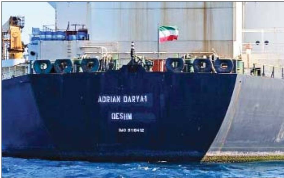
လက်တုံ့ပြန်သည့်အနေဖြင့် ဖမ်းဆီးခဲ့သည်။

အီရန်ရေနံတင်သင်္ဘောအား ဖမ်းဆီးခဲ့ပြီးနောက် ရက်သတ္တနှစ်ပတ်အကြာတွင် အီရန်တော်လှန်ရေး တပ်ဖွဲ့က ဗြိတိန်ရေနံတင်သင်္ဘော စတီးနာအင်မ်ပီယိုအား