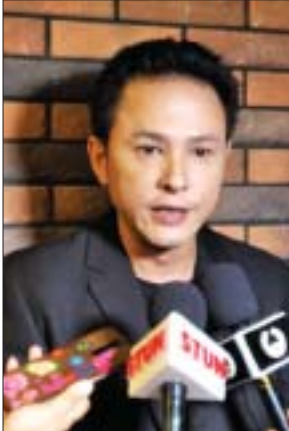
မင်းမော်ကွန်း

ရိုက်ကူးထား ကျားကျားကြိုက်ကြိုက် ရုပ်ရှင်ကို Half & Half ရုပ်ရှင်ထုတ်လုပ်ရေးက ရိုက်ကူးထားပြီး ဇာတ်ညွှန်း ဒီဇိုက်အောင်၊ ဇာတ်လမ်းနှင့်ဒါရိုက်တာ ပြည်ဟိန်းသီဟ၊ ဝါရင့်သရုပ်ဆောင် များဖြစ်သည့် အကယ်ဒမီ