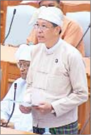
ပြည်ထောင်စုဝန်ကြီး ဒေါက်တာမျိုးသိမ်းကြီး