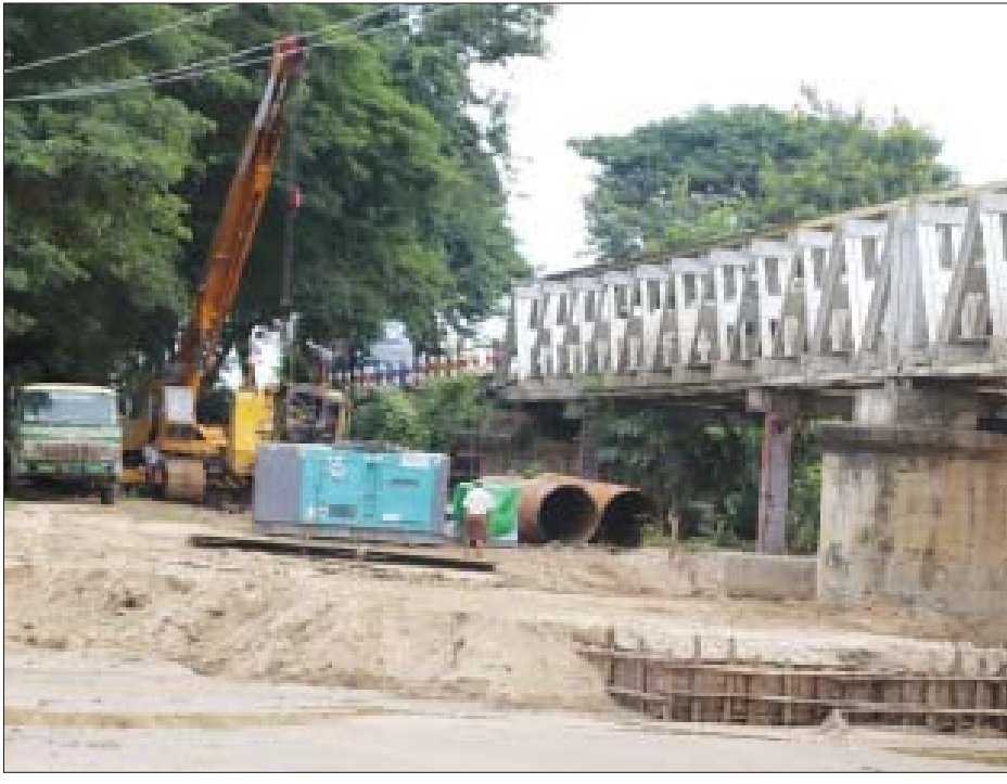
သိန်းလွင်(အောင်လံ)

အောင်လံ ဩဂုတ် ၁၉ အောင်လံမြို့နယ် မိုးကောင်းကျေးရွာ အနီး ရန်ကုန်-ပြည်-မကွေးဆက် သွယ်ရာ ပြည်လမ်းမပေါ်ရှိ ကြေးနီ ချောင်းတံတားမှ ချောင်းရေတိုက် စားမှုကြောင့် ရေစီးနှင့်မြေပျက်စီးသွား သော တံတားအလယ်ခန်းဖွင့်ရှိ RC ဒေါက်တိုင်အား ယခုအခါတွင် တံတားအထူးအဖွဲ့တည်ဆောက်ရေး (၃)က ပြင်ဆင်လျက်ရှိရာ သက်ဆိုင်ရာ ဌာနများမှလည်း သတ်မှတ်ထား သော တန် ၂၀ အောက်ယာဉ်များကို သာ ဖြတ်သန်းသွားလာခွင့်ပြုထား ကြောင်းနှင့် တန်ပိုယာဉ်များ ဖြတ်သန်း သွားလာမှု မရှိစေရေးအတွက် ၂၄ နာရီအချိန်ပြည့်စောင့်ကြပ်စစ်ဆေး လျက်ရှိကြောင်း လမ်းဦးစီးဌာနမှ သိရ သည်။