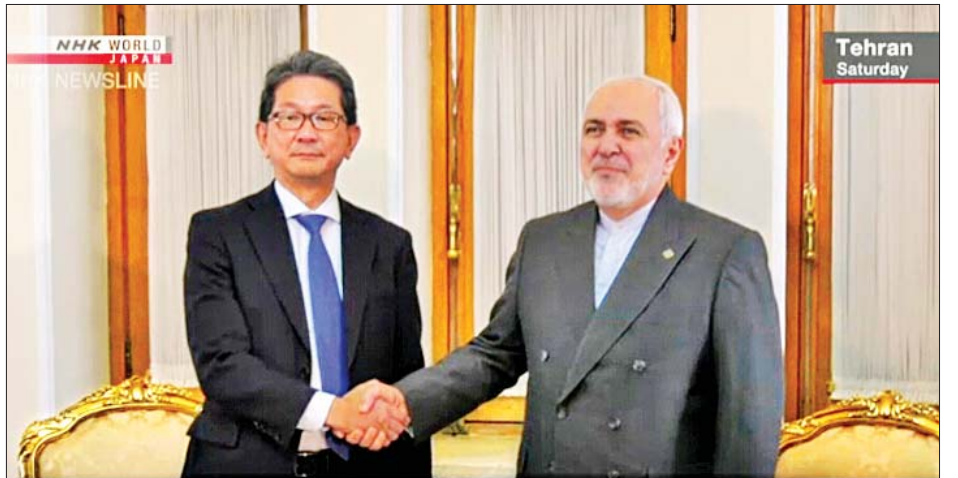
ဂျပန်ဒုတိယနိုင်ငံခြားရေးဝန်ကြီး တာကီယို မိုရိုနှင့် အီရန်နိုင်ငံခြားရေးဝန်ကြီး ဂျာပက်ဇာရစ်စ်တို့ တွေ့ဆုံစဉ်။

ကိုးကား-အင်န်အိတ်ချ်ကျော့ ဘာသာပြန်-အောင်ကျော်ကျော်