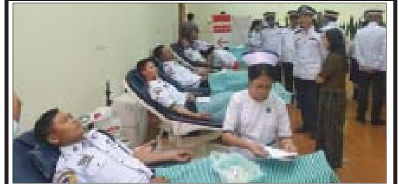
(၅၅) နှစ်မြောက် မြန်မာနိုင်ငံရဲတပ်ဖွဲ့နေ့ကို ဂုဏ်ပြုကြိုဆိုသောအားဖြင့် အမှတ်(၂)ယာဉ်ထိန်းရဲတပ်ဖွဲ့ခွဲမှ အရာရှိများနှင့် အခြားအဆင့်တပ်ဖွဲ့ဝင်အား ၆၂ ဦးတို့ ဩဂုတ် ၁၅ ရက် နံနက်ပိုင်းက ရန်ကုန်ပြည်သူ့ဆေးရုံကြီး အမျိုးသားသွေးလှူဌာနတွင် သွေးလှူဒါန်းစဉ်ကို ရိုက်ကူး