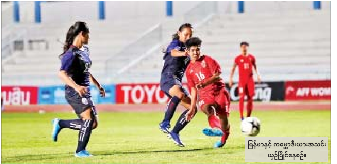
မြန်မာနှင့် ကမ္ဘောဒီးယားအသင်း ယှဉ်ပြိုင်နေစဉ်။