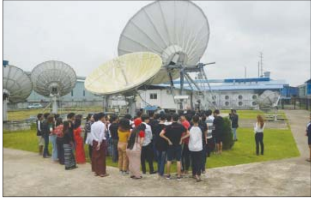
ရန်ကုန် ဩဂုတ် ၁၈

နည်းပညာကျောင်းများတွင် ပညာသင်ကြားနေသော ကျောင်းသား ကျောင်း