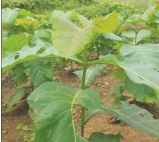
မုံရွာ ဩဂုတ် ၁၈