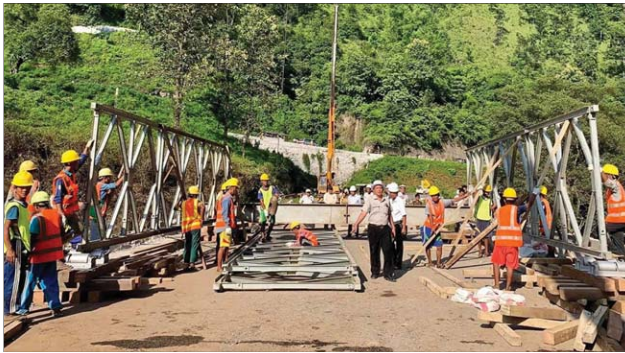
ဂုတ်တွင်းတံတားနေရာတွင် ဆောက်လုပ်ရေးဝန်ကြီးဌာနက ယာယီဘေလီတံတား တည်ဆောက်လျက်ရှိစဉ်။

ရန်ကုန် ဩဂုတ် ၁၈ ဩဂုတ် ၁၅ ရက်က မိုင်းခွဲဖျက်ဆီးခြင်းခံရသော မန္တလေး-လားရှိုး-မူဆယ် နယ်စပ်ကုန်သွယ်ရေးကားလမ်း မိုင်တိုင်အမှတ် (၈၃/၇ နှင့် ၈၄) ကြား ပြင်ဦးလွင်-နောင်ချိုအပိုင်းရှိ ဂုတ်တွင်းတံတားကို ဘေလီတံတားဖြင့် ယာယီ အစားထိုးတည်ဆောက်ခြင်းအား ရှမ်းပြည်နယ်အစိုးရအဖွဲ့နှင့် ဆောက်လုပ်ရေး ဝန်ကြီးဌာနတို့က တည်ဆောက်လျက်ရှိသည်။