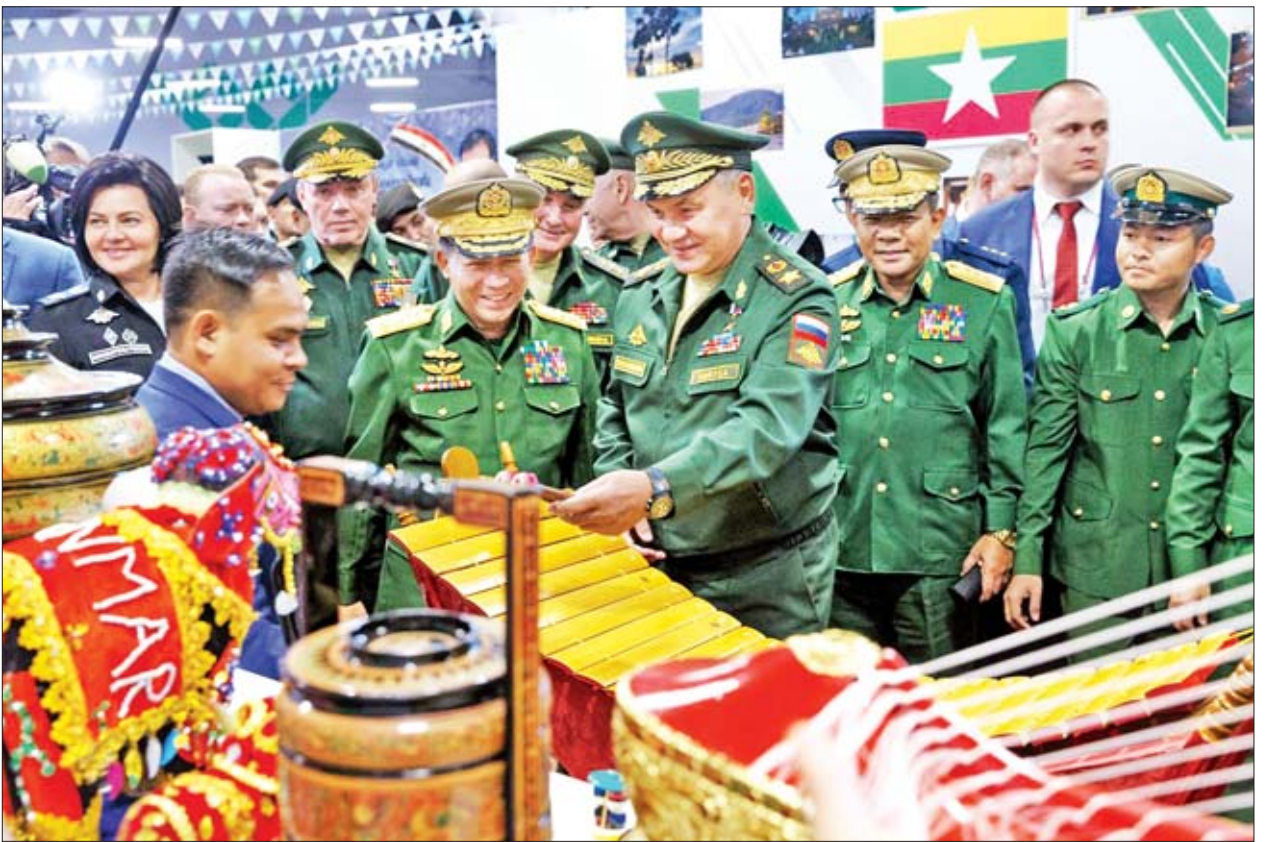
တပ်မတော်ကာကွယ်ရေးဦးစီးချုပ် ဗိုလ်ချုပ်မှူးကြီး မင်းအောင်လှိုင် ရုရှားဗက်ဒရေရှင်းနိုင်ငံ ကာကွယ်ရေးဝန်ကြီး Army General Sergei Shoigu အား မြန်မာနိုင်ငံဆိုင်ရာ ပြခန်းနှင့်ပတ်သက်၍ ရှင်းလင်းပြသစဉ်။

အဆိုပါပြိုင်ပွဲတွင် နိုင်ငံပေါင်း ၃၉ နိုင်ငံ ပါဝင်ယှဉ်ပြိုင်ခဲ့ကြပြီး စစ်မြေပြင် စွမ်းရည် ပြိုင်ပွဲ ၃ ဟု ဖျိုးပါဝင်ကာ ရုရှားနိုင်ငံအပါအဝင် ၁၀ နိုင်ငံ၌ ပြိုင်ပွဲများ ပြုလုပ်ခဲ့ခြင်းဖြစ်သည်။ မြန်မာ့တပ်မတော်အနေဖြင့် ဒုတိယအကြိမ်အဖြစ်