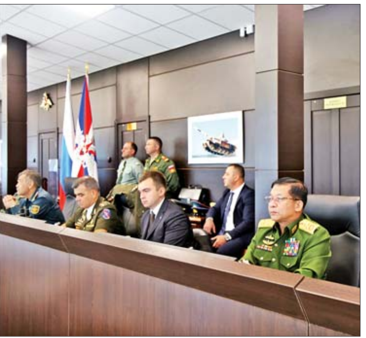
တပ်မတော်ကာကွယ်ရေးဦးစီးချုပ် ဗိုလ်ချုပ်မှူးကြီး မင်းအောင်လှိုင် တင့်ကားမောင်းနှင်ပစ်ခတ်ခြင်းပြိုင်ပွဲတွင် တင့်ကားတပ်ဖွဲ့ဝင်များ၏ ယှဉ်ပြိုင်နေမှုကို ကြည့်ရှုအားပေးစဉ်။

ခင်းကျင်းပြသ ရှေးဦးစွာ တပ်မတော်ကာကွယ်ရေးဦးစီးချုပ် ဗိုလ်ချုပ်မှူးကြီး မင်းအောင်လှိုင်နှင့်အဖွဲ့သည် Patriot Part တွင် ခင်းကျင်းပြသထားသည့် House of Friendship ပြခန်းများမှ မြန်မာနိုင်ငံဆိုင်ရာ ပြခန်းသို့ စာမျက်နှာ ၃ ကော်လံ ၁ သို့