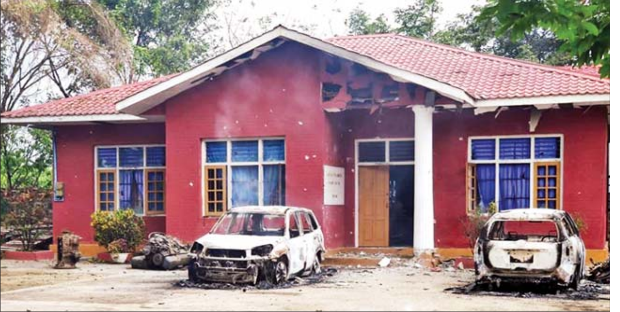
နောင်ချိုမြို့အထွက် အေးရှားဝေါလ်တိုးဂိတ်ရှိ မူးယစ်ဆေးဝါးစစ်ဆေးရေးဂိတ်အား AA၊ TNLA၊ MNDAA လက်နက်ကိုင်အဖွဲ့များက ဝင်ရောက် စီးနင်းတိုက်ခိုက်ပြီး မော်တော်ယာဉ်များအား မီးရှို့ဖျက်ဆီးခဲ့မှုကို တွေ့ရစဉ်။

လည်းကောင်း၊ နောင်ချိုမြို့နယ်ရှိ ဂုတ်တွင်းရဲကင်းစခန်း၊ ကျောက်မဲ သို့အထွက် နောင်ချိုတိုးတက်နှင့် နယ်မြေခံ တပ်ရင်းဌာနချုပ်အား နံနက် ၅ နာရီခွဲခန့်တွင် AA၊ TNLA၊ MNDAA လက်နက်ကိုင် အဖွဲ့များကတစ်ချိန်တည်း တစ်ပြိုင် တည်း နှောင့်ယှက်ပစ်ခတ်ခဲ့သဖြင့် တပ်မတော်က ပြန်လည်ပစ်ခတ် တိုက်ခိုက်ခဲ့ရကြောင်း။ ဖြစ်စဉ်ဖြစ်လျှင်ဖြစ်ချင်း တပ်မတော် စစ်ကြောင်းများက ဂုတ်တွင်းရဲကင်း စခန်း၊ နောင်ချိုတိုးတက်နှင့် အေးရှားဝေါလ်တိုးဂိတ်တို့အား စစ်ကူ များ သွားရောက်ပူးပေါင်းခဲ့ပြီး ဆက်လက် နယ်မြေရှင်းလင်းစဉ် တပ်မတော်နည်းပညာတက္ကသိုလ်၏ အရှေ့ဘက် ပြင်ဦးလွင်-လားရှိုး ကားလမ်း၏ အရှေ့ဘက်ခြမ်းရှိ တောင်ကုန်းပေါ်မှ ဘက်ထရီအို၊ ဝါယာကြိုးများနှင့် ချိတ်ဆက်ထား