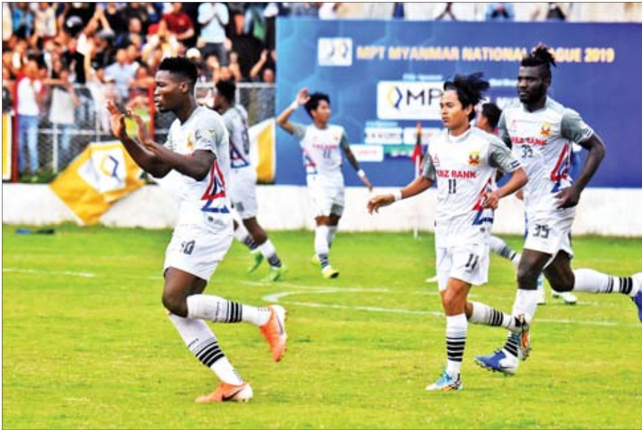
ဇယားထိပ်ဆုံးမှ ဦးဆောင်နေသည့် ရှမ်းယူနိုက်တက်အသင်း။

ပွဲစဉ် (၂၁) အဖြစ် ဩဂုတ် ၁၇ ရက်တွင် သုဝဏ္ဏကွင်း၌ အုအသင်း နှင့် စစ်ကိုင်းအသင်း၊ မော်လမြိုင် ကွင်း၌ Southern အသင်းနှင့် ရန်ကုန်အသင်း၊ ဩဂုတ် ၁၈ ရက်တွင် တောင်ကြီးကွင်း၌ ရှမ်းယူနိုက်တက် အသင်းနှင့် မကွေးအသင်း၊ သုဝဏ္ဏ ကွင်း၌ Chinland အသင်းနှင့် ရခိုင်အသင်း၊ ပဲခူး Grand Royal ကွင်း၌ ဟံသာဝတီအသင်းနှင့်ဧရာဝတီ အသင်း၊ ဩဂုတ် ၂၀ ရက်တွင် စာမျက်နှာ ၇ ကော်လံ ၄ သို့ ၀