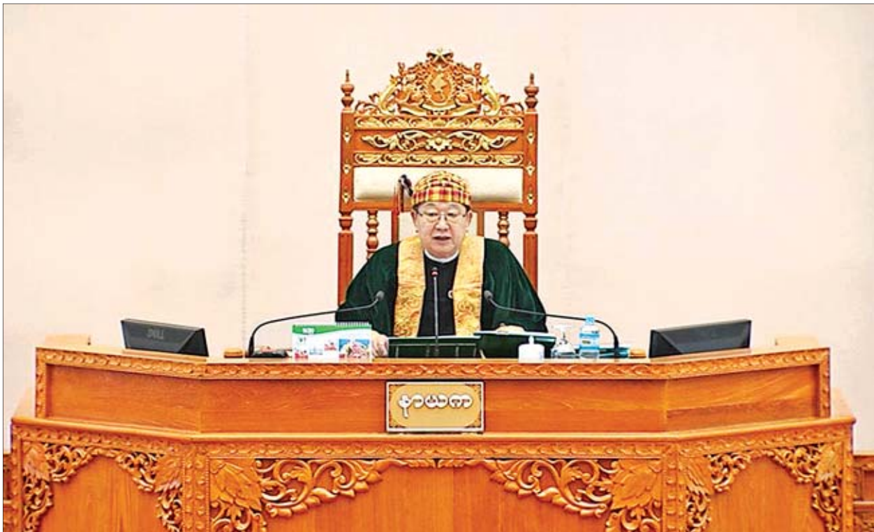
ပြည်ထောင်စုလွှတ်တော်နာယက ဦးတီခွန်မြတ်။

လွှတ်တော်သို့ တင်သွင်းလာသည့် ပြည်ထောင်စုစာရင်းစစ်ချုပ်၏ အစီရင်ခံစာသည် ပြည်ထောင်စုအစိုးရအဖွဲ့အစည်းများ၏ နှစ်အလိုက် ဆောင်ရွက်ချက်အသေးစိတ်များ၊ အားနည်းချက်၊ အားသာချက်များ၊ တိုက်တွန်းအကြံပြုချက်များ၊ သဘောထားမှတ်ချက်များ ပြည့်ပြည့်စုံစုံပါရှိသည်အတွက် ကြိုဆိုလိုက်သည် အစီရင်ခံစာတစ်စောင်ဖြစ်ပါကြောင်း၊ နောင်တင်သွင်းမည့် အစီရင်ခံစာများတွင် စာမျက်နှာ ၃ ကော်လံ ၁ သို့ *