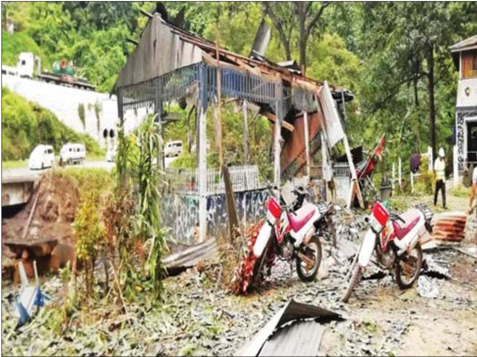
နောင်ချိုမြို့နယ် ဂုတ်တွင်းတံတား လုံခြုံရေးရဲကင်းအား AA၊ TNLA၊ MNDAA လက်နက်ကိုင်အဖွဲ့များ က လက်နက်ကြီး၊ လက်နက်ငယ်များဖြင့် ပစ်ခတ်တိုက်ခိုက်မှုကြောင့် ပျက်စီးနေမှုကို တွေ့ရစဉ်။

သည့် Type 63 ၁၀၇ မီလီမီတာ အမျိုးအစားဒုံးသီး ခြောက်လုံး၊ ရှော့တိုက်ဒုံးများပစ်ခတ်ရန် AA၊ TNLA၊ MNDAA လက်နက်ကိုင် အဖွဲ့များက အသင့်ပြုလုပ်ထားသည့် နေရာများနှင့် ဘက်ထရီအိုးတစ်လုံး တို့ကို တွေ့ရှိရကြောင်း။ နောင်ချို မူးယစ်ဆေးဝါးစစ်ဆေး ရေးဂိတ်နှင့် ဂုတ်တွင်းရဲကင်းစခန်း နေရာများတွင် တပ်မတော် စစ်ကြောင်းများနှင့် ထိတွေ့တိုက်ခိုက် မှုများ ဖြစ်ပွားခဲ့ကြောင်း။ ဒဏ်ရာရရှိသူများအနက် အပြစ်မဲ့ အရပ်သားပြည်သူ ငါးဦးနှင့် ရဲတပ်ဖွဲ့ဝင် တစ်ဦးတို့အား ပြင်ဦးလွင် ပြည်သူ့ဆေးရုံသို့ ပို့ဆောင်ကုသပေး လျက်ရှိကြောင်း သိရသည်။ ယခုဖြစ်စဉ်မှာ ဇူလိုင် ၂၅ ရက်တွင် ကွတ်ခိုင်မြို့နယ် ရှောက်ဟော်ကျေးရွာ အရှေ့တောင်ဘက် ချောင်းဆုံနေရာ တစ်ဝိုက် မူးယစ်ဆေးဝါးစုစုပေါင်း တန်ဖိုးငွေကျပ် ၁၆ ဘီလီယံကျော်နှင့်