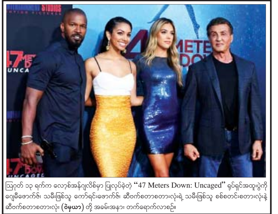
ဩဂုတ် ၁၃ ရက်က လော့စ်အန်ဂျလိစ်မှာ ပြုလုပ်ခဲ့တဲ့ “47 Meters Down: Uncaged” ရုပ်ရှင်အထူးပွဲကို ဂျေမီဖောက်ဇ်၊ သမီးဖြစ်သူ ကော်ရင်ဖောက်ဇ်၊ ဆီဗက်စတာစတားလုံးရဲ့ သမီးဖြစ်သူ စစ်စတင်းစတားလုံးနဲ့ ဆီဗက်စတာစတားလုံး (ဝဲမှယာ) တို့ အခမ်းအနား တက်ရောက်လာစဉ်။

လည်း သိရပါတယ်။ သြဂုတ် ၇ ရက်မှာ ခရစ်စတယ်ဟာ Urbanlike မဂ္ဂဇင်းအတွက် ဓာတ်ပုံကို ရိုက်ကူးပေးခဲ့ပြီး အင်တာဗျူးတွေလည်း ဖြေကြားခဲ့တာ ဖြစ်ပါတယ်။ အဆိုပါအင်တာဗျူးမှာ ခရစ်စတယ်က “တစ်ကိုယ်တော်တေးသံရှင်တစ်ဦးအနေနဲ့ ကျွန်မဘာတွေလုပ်ဆောင်ပြသင့်လဲဆိုတာ ကျွန်မ တော်တော်လေး တွေးဖြစ်ခဲ့ပါတယ်။ ကျွန်မလုပ်ချင်တာတွေအများကြီးပဲ။ ဒါပေမယ့် ဘာကို လုပ်ရမယ်ဆိုတာ သေချာမသိပါဘူး။ ကျွန်မအနေနဲ့ သီချင်းဆိုတာ၊ ကတာတွေကို နောက်ထပ်မလုပ်ချင်တော့ဘူး။ ဒါတွေကို ကျွန်မအနေနဲ့ F(x) မှာ ရှိခဲ့စဉ်က လုပ်ဆောင်ခဲ့ပြီးပါပြီ” လို့ ပြောကြားခဲ့ပါတယ်။