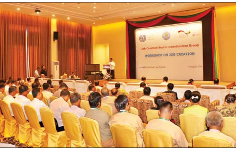
ဖော်ဆောင်ခွင့်ရရှိသည့် အလုပ်အကိုင်ဖန်တီးပေးနိုင်မှုကဏ္ဍဆိုင်ရာ ပေါင်းစပ်ညှိနှိုင်းရေးအဖွဲ့၏ ကဏ္ဍအလိုက် အဖွဲ့ခွဲများအနေဖြင့် ရှေ့ဆက်ဆောင်ရွက်ရမည့် လုပ်ငန်းစဉ်များ ချမှတ်နိုင်ရန်နှင့် ကဏ္ဍအလိုက် အဖွဲ့ခွဲများက အလုပ်အကိုင်ဖန်တီးပေးနိုင်ရေးကို အထောက်အကူပြုမည့် ဦးစားပေးရွေးချယ်ထားသည့် စီမံကိန်းအဆိုပြုလွှာများ ဖော်ထုတ်ပြီး ဖွံ့ဖြိုးမှုအကူအညီများ ရယူဆောင်ရွက်နိုင်ရန် ရည်ရွယ်၍ ကျင်းပခြင်းဖြစ်ကြောင်း။ အလုပ်အကိုင်အခွင့်အလမ်းများ ဖော်ဆောင်အလုပ်အကိုင်အခွင့်အလမ်းများ ဖော်ဆောင်ခြင်းသည် နိုင်ငံ၏စီးပွားရေးကဏ္ဍ ဖွံ့ဖြိုးတိုးတက်လာစေရန် အဓိကကျသော အခန်းကဏ္ဍတစ်ခု ဖြစ်ပါကြောင်း၊ မြန်မာနိုင်ငံအနေဖြင့် လက်ရှိအချိန်အခါတွင် စိန်ခေါ်မှုများစွာကို ကြုံတွေ့နေရသော်လည်း ဖွံ့ဖြိုးတိုးတက်ရန်

နေပြည်တော် ဩဂုတ် ၁၅ စီးပွားရေးနှင့် ကူးသန်းရောင်းဝယ်ရေးဝန်ကြီးဌာန၊ အပြည်ပြည်ဆိုင်ရာ အလုပ်သမားရေးရာအဖွဲ့ (International Labour Organization-ILO) နှင့် ဂျာမနီပူးပေါင်းဆောင်ရွက်မှု (German Cooperation) တို့ပူးပေါင်း၍ အလုပ်အကိုင် ဖန်တီးပေးနိုင်မှုကဏ္ဍဆိုင်ရာ ပေါင်းစပ်ညှိနှိုင်းရေးအဖွဲ့ (Job Creation Sector Coordination Group-JCSCG) အလုပ်ရုံဆွေးနွေးပွဲအခမ်းအနားကို ယနေ့နံနက် ၉ နာရီခွဲက နေပြည်တော်ရှိ Park Royal Hotel ၌ ကျင်းပသည်။