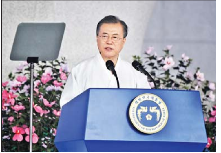
တွေ့ဆုံဆွေးနွေးရေး စားပွဲပိုင်းသို့ နိုင်ငံသို့ တိုက်တွန်းခဲ့သည်။ ပြန်လည်လာရောက်ရန်လည်း တောင်ကိုရီးယားသမ္မတ မွန်းဂျေအင်းက မြောက်ကိုရီးယား

နိုင်ငံကြား နျူကလီးယားလက်နက် ဖျက်သိမ်းရေးဆွေးနွေးမှုများမှာ ရပ်တန့်ခဲ့သော် လည်း မြောက်ကိုရီးယားခေါင်းဆောင် ကင်ဂျုံအန်နှင့် အမေရိကန်သမ္မတ ဒေါ်နယ် ထရန်ကြား ပြီးခဲ့သောဇွန်လအတွင်း ကိုရီးယား နှစ်နိုင်ငံကြားရှိ အပစ်အခတ်ရပ်စဲရေးကျော့စွာ ပန်မွန်ဂျီ၌ တွေ့ဆုံပြီးနောက် နှစ်နိုင်ငံကြား အဆင့်မြင့်တာဝန်ရှိသူအဆင့် တွေ့ဆုံဆွေးနွေး မှုကို မကြာမီ ပြန်လည်စတင်မည်ဖြစ်သည်။ မြောက်ကိုရီးယားနှင့် အမေရိကန်နိုင်ငံကြား အဆင့်မြင့် တာဝန်ရှိသူအဆင့် စေ့စပ်ညှိနှိုင်း မှုများ ပြန်လည်စတင်ရန် အချိန်ကျရောက်ပြီ ဖြစ်ကြောင်း မွန်းဂျေအင်းက ပြောသည်။