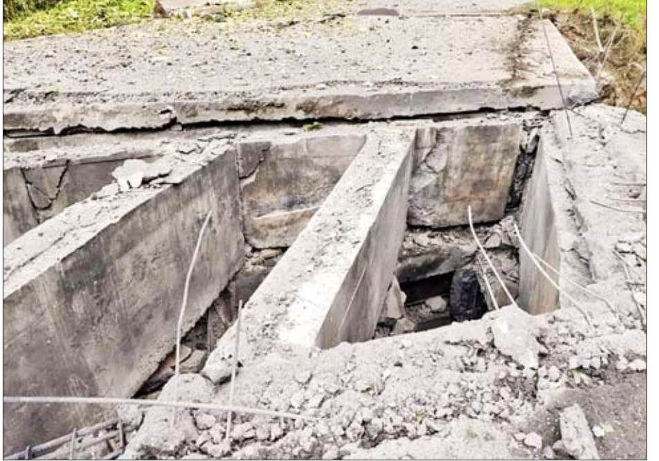
နောင်ချိုမြို့နယ် ဂုတ်တွင်းတံတားအား AA၊ TNLA၊ MNDAA လက်နက်ကိုင်အဖွဲ့များက မိုင်းခွဲဖျက်ဆီးထားမှုကို တွေ့ရစဉ်။