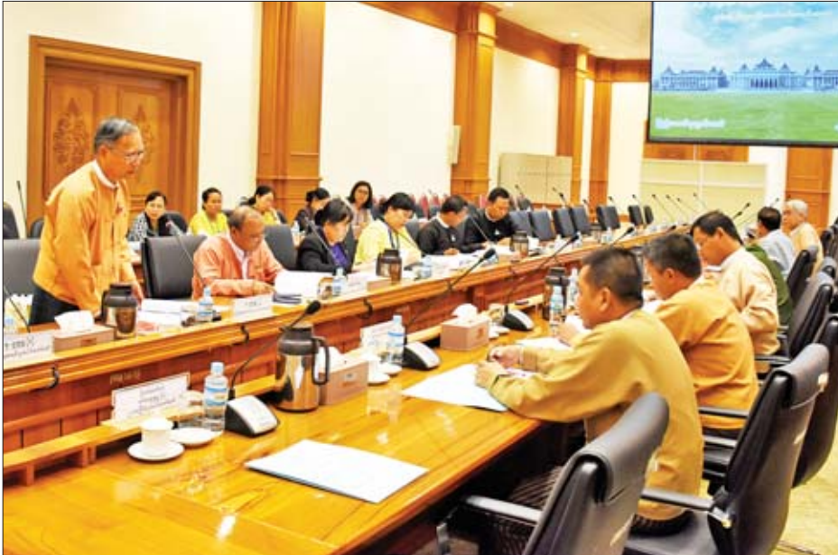
ပူးပေါင်းကော်မတီဒုတိယဥက္ကဋ္ဌများ၊ ငွေစာရင်း ပူးပေါင်းကော်မတီဒုတိယဥက္ကဋ္ဌ၊ အတွင်းရေးမှူး၊ တွဲဖက်အတွင်းရေးမှူးနှင့် ကော်မတီဝင်များ၊ ပြည်သူ့ရေးရာဌာနမှ ပြည်ထောင်စုလွှတ်တော်ရုံးတို့မှ တာဝန်ရှိသူများ တက်ရောက်ခဲ့ကြသည်။ သတင်းစဉ်

နေပြည်တော် ဩဂုတ် ၁၅ ပြည်ထောင်စုလွှတ်တော် ဥပဒေကြမ်း ပူးပေါင်းကော်မတီသည် ပြည်ထောင်စုအစိုးရအဖွဲ့က ပေးပို့လာသော ၂၀၁၉-၂၀၂၀ ဘဏ္ဍာနှစ် ပြည်ထောင်စု၏ ဘဏ္ဍာငွေအရ အသုံးဆိုင်ရာ ဥပဒေကြမ်း၊ ၂၀၁၉-၂၀၂၀ ဘဏ္ဍာနှစ်၊ အမျိုးသားစီမံကိန်းဥပဒေကြမ်းတို့နှင့် စပ်လျဉ်းသည့် အစည်းအဝေးကို ယနေ့မနန်းလွဲ ၂ နာရီတွင် ပြည်ထောင်စုလွှတ်တော် D ဆောင် ဒုတိယထပ် အစည်းအဝေးခန်းမ၌ ကျင်းပသည်။