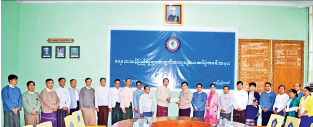
ရေဘေးဒဏ်ခံရသည့်ဒေသများအတွက် ထောက်ပံ့မှုများ ဆောင်ရွက်ရာတွင် အသုံးပြုနိုင်ရန်အတွက် လူမှုဝန်ထမ်း၊ ကယ်ဆယ်ရေးနှင့် ပြန်လည်နေရာချထားရေးဝန်ကြီးဌာနသို့ အလှူငွေများ လာရောက်လှူဒါန်းလျက်ရှိသည်။

နေပြည်တော် ဩဂုတ် ၁၅ မြန်မာနိုင်ငံအတွင်း ရေဘေးဒဏ်ခံရသည့်ဒေသများအတွက် ထောက်ပံ့မှုများ ဆောင်ရွက်ရာတွင် အသုံးပြုနိုင်ရန်အတွက် လူမှုဝန်ထမ်း၊ ကယ်ဆယ်ရေးနှင့် ပြန်လည်နေရာချထားရေးဝန်ကြီးဌာနသို့ အလှူငွေများ လာရောက်လှူဒါန်းလျက်ရှိသည်။ ထိုကဲ့သို့ လာရောက်လှူဒါန်းကြရာတွင် ယနေ့နံနက်ပိုင်းက ပညာရေးဝန်ကြီးဌာန ပြည်ထောင်စုဝန်ကြီး ဒေါက်တာမျိုးသိမ်းကြီးနှင့် ဝန်ထမ်းမိသားစုများက အလှူငွေကျပ် သိန်း ၃၀၊ GBG Industry Co.,Ltd. က အလှူငွေကျပ် သိန်း ၃၀၊ မြန်မာပိတောက်ကုမ္ပဏီနှင့် ဝန်ထမ်းမိသားစုတို့က အလှူငွေကျပ် သိန်း ၁၅၀ ကို ပေးလှူဒါန်းကြရာ ပြည်ထောင်စုဝန်ကြီး ဒေါက်တာဝင်းမြတ်အေးက လက်ခံရယူပြီး ဂုဏ်ပြုမှတ်တမ်းလွှာများ ပြန်လည်ပေးအပ်ခဲ့ကြောင်း သိရသည်။ သတင်းစဉ်