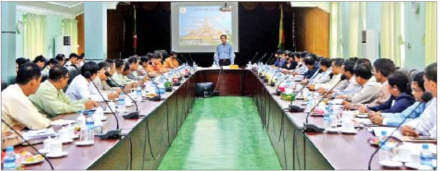
ဒုတိယသမ္မတ ဦးဟင်နရီပန်ထီးယူ ပဲခူးမြို့ ပဲခူးတိုင်းဒေသကြီးအစိုးရအဖွဲ့မှူး တော်ဝင်ဟံသာအစည်းအဝေးခန်းမတွင် ပြုလုပ်သည့် ပဲခူးတိုင်းဒေသကြီး သဘာဝဘေးအန္တရာယ်ဆိုင်ရာ စီမံခန့်ခွဲမှုအဖွဲ့အစည်းအစည်းအဝေးတွင် အမှာစကားပြောကြားစဉ်။

အစည်းအဝေးတွင် ဒုတိယသမ္မတက ရာသီဥတုပြောင်းလဲဖောက်ပြန်မှုဒဏ်ကို ကမ္ဘာ့အခြားနိုင်ငံများနည်းတူ မြန်မာနိုင်ငံသည်လည်း ခံစားနေရပါကြောင်း၊ မိုးလေဝသပညာရှင်များ၏ ခန့်မှန်းချက်အရ ယခုနှစ်တွင် မြန်မာနိုင်ငံ၌ မုတ်သုံအဝင် နောက်ကျ၍ အထွက်စေ့မည်ဟု သိရပါကြောင်း၊ ထို့ကြောင့် နှစ်စဉ်ရွာသွန်းသည့် မိုးရေချိန်ပမာဏ ပြောင်းလဲမှုမရှိသော်လည်း မိုးရွာသွန်းချိန်ကာလ တိုတောင်းမည်ဖြစ်၍ ရုတ်တရက် ရေကြီးရေလျှံမှုများ ကြုံတွေ့ရနိုင်သဖြင့် ဆည်တစ်ခုခု၏ ကြံ့ခိုင်ရေးကို ယခင်ထက်ပိုမိုဂရုစိုက်ရန်လိုအပ်ပါကြောင်း၊ ဆည်များသို့ ရေဝင်ရောက်မှုအပိုင်းတွင် ယခင်နှစ်ကာလတူထက် ယခုနှစ်တွင်များစွာ လျော့နည်းလျက် ရှိသည်ကို တွေ့ရှိရသဖြင့် ဆည်ရေကို အလေအလွင့်မရှိဘဲ ထိရောက်အကျိုးရှိစွာ စနစ်တကျ အသုံးပြုရန်လိုအပ်ပါကြောင်း၊ ဆည်မြောင်းဆိုင်ရာဝန်ထမ်းများသာမက ရေကိုအသုံးပြုနေသည့် တောင်သူများပါ သိရှိလိုက်နာစေရေး ပညာပေးဆောင်ရွက်သွားရန် လိုအပ်ပါကြောင်း၊ ရာသီဥတုပြုပြင်ပြောင်းလဲမှုဒဏ်ကို အကာကွယ်ပေးနိုင်မည့် သစ်ပင်သစ်တောများ မပြုန်းတီးစေရေး ထိန်းသိမ်းစောင့်ရှောက်သကဲ့သို့ သစ်ပင်စိုက်ပျိုးမှုကို စီမံချက်ချမှတ် အလေးထား