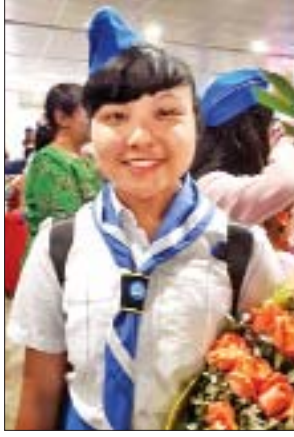
မရွန်းလဲ့ရတနာနေမျိုး

(၁၇)ကြိမ်မြောက် အပြည်ပြည်ဆိုင်ရာ ကင်းထောက်အမျိုးသမီးငယ်များ စခန်းချပွဲကို မိမိတို့တိုင်းပြည်နဲ့ ဝေးကွာတဲ့ ရေခြားမြေခြားသွားပြီး မြန်မာကင်းထောက်အမျိုးသမီးကိုယ်စားလှယ်များ ကျန်းကျန်းမာမာ ပြန်ရောက်လာကြတာ တွေ့ရလို့ အထူးဝမ်းသာပါတယ်။ သွားရောက်တဲ့ ကင်းထောက်ညီအစ်မတွေ စည်းစည်းလုံးလုံး ညီညီညွတ်ညွတ် ပျော်ပျော်ရွှင်ရွှင်နဲ့ စခန်းချပွဲမှာ နိုင်ငံတကာ ကင်းထောက်အမျိုးသမီးများနဲ့ မြန်မာအမျိုးသမီးရဲ့ဂုဏ်သိက္ခာကို ထင်ရှားစွာ ဖော်ဆောင်နိုင်ခဲ့တာကို သိရလို့ ဝမ်းမြောက်ရပါတယ်။ မိမိတို့အချင်းချင်းသာမက ဂျပန်၊ ကိုရီးယား၊ မလေးရှား စတဲ့ နိုင်ငံများက ကင်းထောက်အမျိုးသမီးများနဲ့ ကင်းထောက်ကျင့်ဝတ်အတိုင်း ချစ်ခင်ရင်းနှီးပျော်ရွှင်စွာ အမိန့်နာခံ စည်းကမ်းတကျ ပူးပေါင်းလုပ်ရှားနိုင်ခဲ့မှုကို ကျေနပ်မိပါတယ်။ အင်္ဂလိပ်၊ ဂျပန်၊ ကိုရီးယား ဘာသာစကားတတ်တဲ့သူတွေ မိမိတို့ မြန်မာကင်းထောက်အမျိုးသမီးတွေမှာ ပါဝင်လို့ ပိုမိုရင်းနှီးစွာ ဆက်ဆံနိုင်ခဲ့ကြတာဟာလည်း ကောင်းတဲ့အခွင့်အရေး ရခဲ့ပါတယ်။ အခုလို ကိုရီးယားနိုင်ငံမှာ နိုင်ငံတကာကင်းထောက်အမျိုးသမီးများနဲ့အတူ မြန်မာနိုင်ငံရဲ့ဂုဏ်ကို ဖော်ဆောင်လှုပ်ရှားနိုင်ခဲ့တဲ့ မြန်မာကင်းထောက်အမျိုးသမီးကိုယ်စားလှယ်အဖွဲ့ကို ဒုတိယကင်းထောက်ချုပ်အနေနဲ့ ကျေးဇူးတင်ဂုဏ်ပြုချီးကျူးပါတယ်။