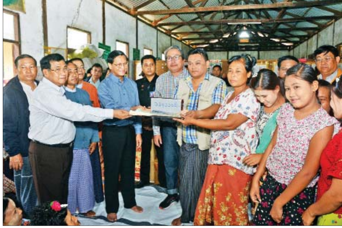
ဒုတိယသမ္မတ ဦးဟင်နရီဗန်ထီးယူနှင့်အဖွဲ့ ကျိုက်မရောမြို့အမှတ်(၃) အခြေခံပညာ အလယ်တန်းကျောင်း(ခွဲ)တွင် ယာယီဖွင့်လှစ်ထားသည့် ကယ်ဆယ်ရေးစခန်း၌ ရေဘေးသင့်ပြည်သူများအတွက် ထောက်ပံ့ငွေများ ပေးအပ်စဉ်။

ယင်းနောက် အမျိုးသားသဘာဝဘေး အန္တရာယ်ဆိုင်ရာ စီမံခန့်ခွဲမှုကော်မတီက ပေးအပ်သည့် ဂုဏ်ပြုမှတ်တမ်းလွှာကို ဒုတိယ ဝန်ကြီး ဦးစိုးအောင်က မြန်မာနိုင်ငံ ဆန်စပါး အသင်းချုပ်ဥက္ကဋ္ဌနှင့် တာဝန်ရှိသူများထံ ပေးအပ်ပြီး ဝန်ကြီးချုပ်က ကျေးဇူးတင်စကား ပြောကြားသည်။