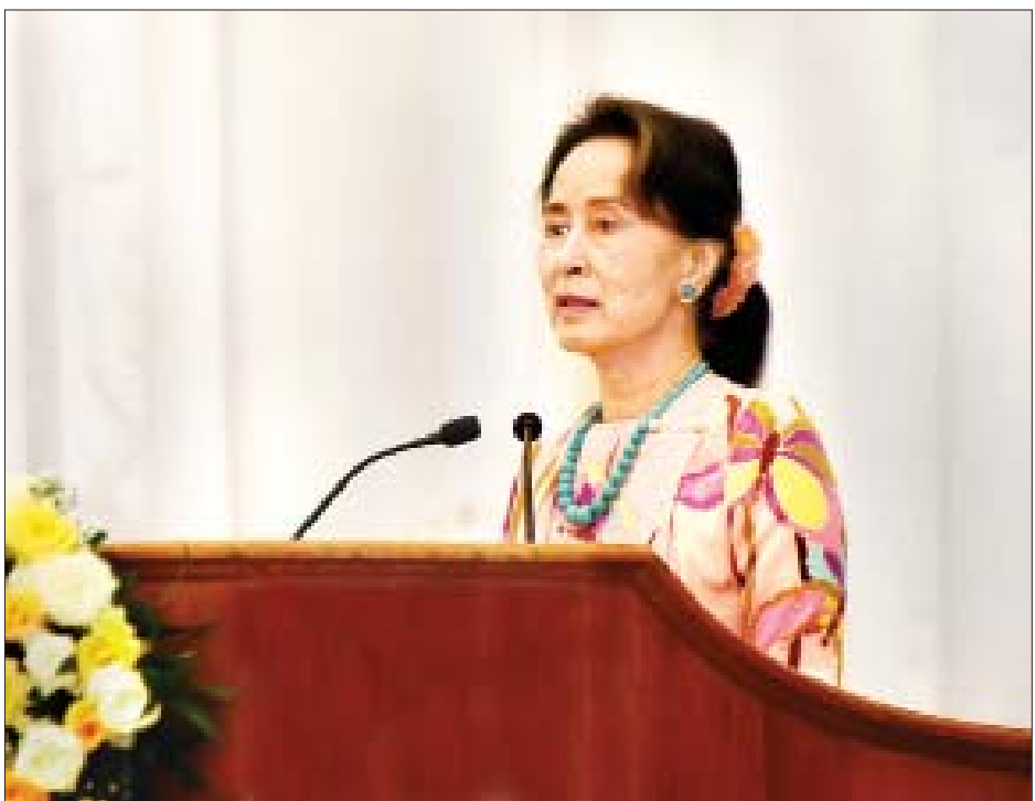
နိုင်ငံတော်၏အတိုင်ပင်ခံပုဂ္ဂိုလ် ဒေါ်အောင်ဆန်းစုကြည် အပြည်ပြည်ဆိုင်ရာလူငယ်များနေ့ အခမ်းအနားတွင် အမှာစကားပြောကြားစဉ်။

အခမ်းအနားတွင် နိုင်ငံတော်၏အတိုင်ပင်ခံပုဂ္ဂိုလ်က “ဒီနေ့ဟာ လူငယ်များအတွက်သာမကဘဲ ကျွန်ုပ်တို့ရဲ့ ပညာရေးစနစ်တစ်ခုလုံးအတွက် ကျင်းပတဲ့ အခမ်းအနားပဲ ဖြစ်ပါတယ်။ ဒီနေ့ကျင်းပတဲ့ အပြည်ပြည်ဆိုင်ရာ လူငယ် များနေ့ရဲ့ ဆောင်ပုဒ်ဟာ လူငယ်တွေပါဝင်ပြီး ပညာရေး စနစ်ကိုပြုပြင်ပြောင်းလဲခြင်းပဲဖြစ်ပါတယ်။ ဒီဆောင်ပုဒ်ကို ကြည့်လိုက်တဲ့အခါ စာမျက်နှာ ၃ ကော်လံ ၁ သို့ ❖