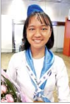
မသက်ယွန်းစံ