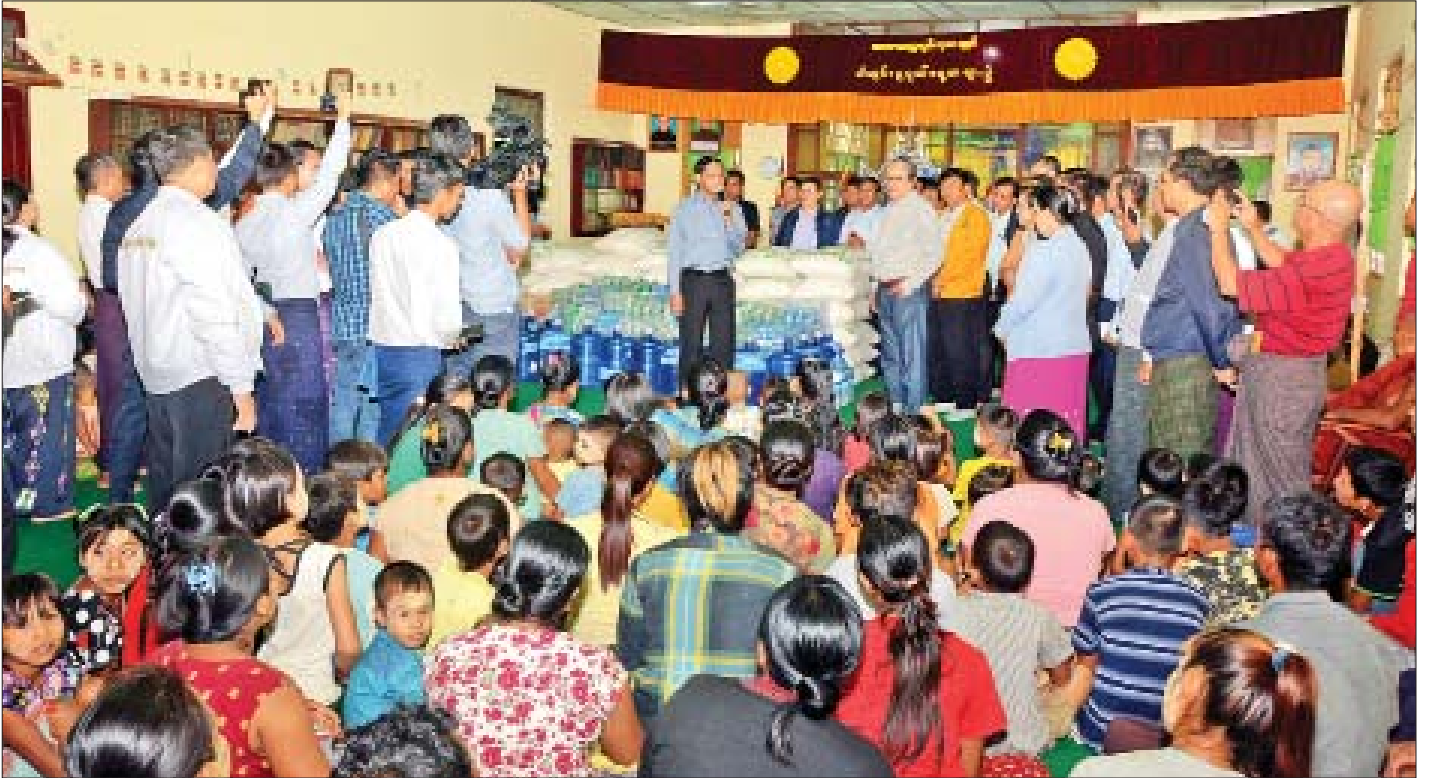
ဒုတိယသမ္မတ ဦးဟင်နရီပန်ထီးယူ ကျိုက်မရောမြို့၊ ရသေ့ကျောင်း၌ ယာယီဗွင့်လှစ်ထားသည့် ကယ်ဆယ်ရေးစခန်းတွင် ရေဘေးသင့်ပြည်သူများအား အားပေးစကား ပြောကြားစဉ်။

ပေးအပ်လှူဒါန်းပွဲအခမ်းအနားသို့ မွန်ပြည်နယ် ဝန်ကြီးချုပ် ဒေါက်တာအေးဖဲ၊ ဒုတိယဝန်ကြီးများဖြစ်ကြ သည့် ဗိုလ်ချုပ်မြင့်နွယ်၊ ဦးတင်မြင့်၊ ဦးလှကျော်၊ ဦးစိုးအောင်နှင့် ဌာနဆိုင်ရာတာဝန်ရှိသူများ၊ မြန်မာနိုင်ငံ ဆန်စပါးအသင်းချုပ်ဥက္ကဋ္ဌ ဦးရဲမင်းအောင်နှင့် ညီနောင် အသင်းများမှ တာဝန်ရှိသူများ တက်ရောက်ကြသည်။ စာမျက်နှာ ၅ ကော်လံ ၁ သို့ ❖