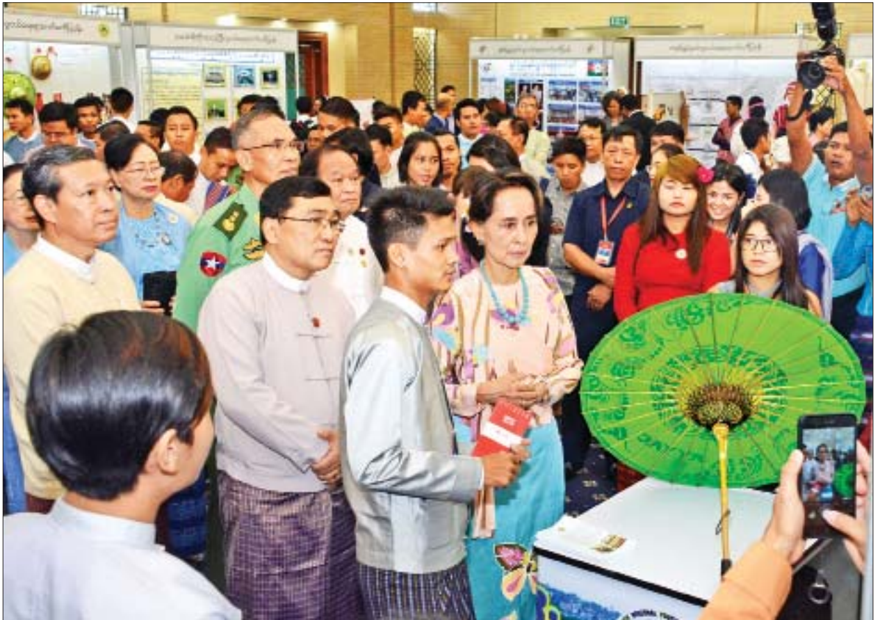
နိုင်ငံတော်၏အတိုင်ပင်ခံပုဂ္ဂိုလ် ဒေါ်အောင်ဆန်းစုကြည် အပြည်ပြည်ဆိုင်ရာ လူငယ်များနေ့ အထိမ်းအမှတ်အဖြစ် ခန်းမအတွင်းပြသထားသည့် တိုင်းဒေသကြီးနှင့် ပြည်နယ်လူငယ်ရေးရာကော်မတီများ၏ ပြခန်းများ၊ လူငယ်နှင့်ခရီးသွားပြခန်းနှင့် တိုင်းရင်းသားရိုးရာယဉ်ကျေးမှုပြခန်းတို့အား လိုက်လံ ကြည့်ရှုအားပေးစဉ်။

“ဒါကြောင့်မို့ ကျွန်ုပ်တို့ရဲ့ ပညာရေးစနစ်ဟာ ဉာဏ်ပညာ အမြော်အမြင် ရှိစေဖို့ ဦးတည်တဲ့စွမ်းရည်ရှိဖို့အများကြီး အရေးကြီးပါတယ်။ ပညာသင်တဲ့နေရာ