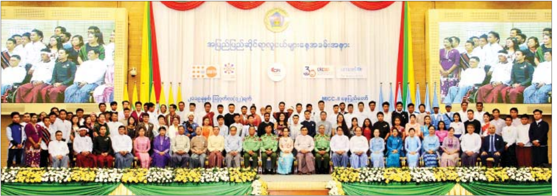
နိုင်ငံတော်၏အတိုင်ပင်ခံပုဂ္ဂိုလ် ဒေါ်အောင်ဆန်းစုကြည် ပြည်ထောင်စုဝန်ကြီးများ၊ နေပြည်တော်ကောင်စီဥက္ကဋ္ဌနှင့် တာဝန်ရှိသူများ၊ မြန်မာနိုင်ငံလူငယ်ရေးရာကော်မတီ၊ နေပြည်တော်၊ တိုင်းဒေသကြီးနှင့် ပြည်နယ်လူငယ်ရေးရာကော်မတီများမှ လူငယ်တာဝန်ခံများ၊ ကော်မတီဝင်များနှင့် စုပေါင်းမှတ်တမ်းတင်ဓာတ်ပုံရိုက်စဉ်။