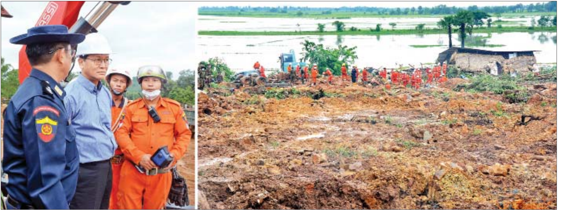
ဒုတိယသမ္မတ ဦးဟင်နရီပန်ထီးယူ မြေပြိုကျမှုဖြစ်ပွားခဲ့သည့် ပေါင်မြို့နယ် သဲဖြူကုန်းကျေးရွာတွင် စက်ယန္တရားများဖြင့် ရှာဖွေကယ်ဆယ်ရေးလုပ်ငန်းများ ဆောင်ရွက်နေမှုကို ကြည့်ရှုစဉ်။