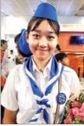
မဆောင်းဟေမာန်ပြေငြိမ်း