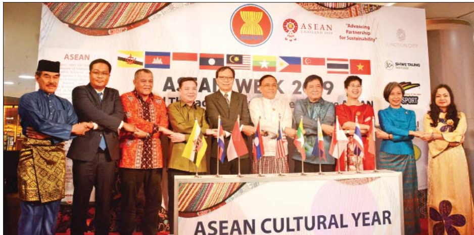
အပြည်ပြည်ဆိုင်ရာပူးပေါင်းဆောင်ရွက်ရေးဝန်ကြီးဌာန ပြည်ထောင်စုဝန်ကြီး ဦးကျော်တင်နှင့် မြန်မာနိုင်ငံရဲ့ အာဆီယံသံအမတ်ကြီးများ စုပေါင်းမှတ်တမ်းတင်ဓာတ်ပုံရိုက်ကြစဉ်။