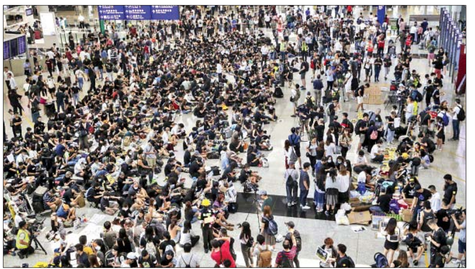
သတိပေးချက်ထုတ်ပြန်ထားပြီး လေဆိပ်ရှိ ကားရပ်နားရာ အာဏာပိုင်များက အကြံပြုထားကြောင်း သိရသည်။ ကိုးကား-အေအက်မ်ပီ ဘာသာပြန်-အောင်ဇော်လင်း

လိုက်ကြောင်း လေဆိပ်အာဏာပိုင်အဖွဲ့၏ ကြေညာချက်တွင် ဖော်ပြသည်။ ဒီမိုကရေစီထောက်ခံဆန္ဒပြသူ အများအပြားသည် “ဟောင်ကောင်သည် လုံခြုံမှု မရှိ”၊ “ရဲတပ်ဖွဲ့ ရှက်ပြီး လဲသေဖို့ ကောင်းတယ်” ဟု ဖော်ပြထားသည့် ဆိုင်းဘုတ်များကို ဆောင်ရွက်၍ လေဆိပ်အတွင်းသို့ အလုံးအရင်းဖြင့် ဝင်ရောက်ခဲ့ပြီးနောက် လေကြောင်းခရီးစဉ်များဖျက်သိမ်းသည့် ကြေညာချက် ထွက်ပေါ်လာခဲ့ခြင်းဖြစ်သည်။ ယနေ့ လေဆိပ်တွင် ကန့်ကွက်ဆန္ဒပြမှုများကြောင့် ဟောင်ကောင်လေဆိပ်ရှိ လေကြောင်းကုမ္ပဏီများ ဆိုးဆိုးရွားရွား နှောင့်ယှက်ခံခဲ့ရကြောင်း ယင်းကြေညာချက်တွင် ဖော်ပြသည်။ လေဆိပ်သို့သွားရာလမ်းသည် ပိတ်ဆို့နေကြောင်း