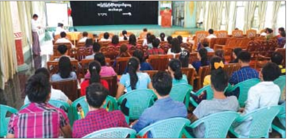
တစ်ခန်းရပ်ပြဇာတ်ဖြင့် တင်ဆက်ပြသသည်။ ဆက်လက်၍ လူငယ်များက အပြောင်းအလဲအတွက် ဦးဆောင်လှုပ်ရှားနေသောလူငယ်များ၏ ဘဝအတွေ့အကြုံများအကြောင်း၊ ဒေသအတွင်း လုပ်ဆောင်လျက်ရှိသော လူငယ်စွမ်းရည်မြှင့်တင်ရေး အစီအစဉ်များအကြောင်း ဆွေးနွေးပြောကြားကြပြီး ထားဝယ်ရေးအဖွဲ့ရွက်အကနှင့် တေးဂီတသီချင်းများဖြင့် ဖျော်ဖြေတင်ဆက်သည်။ ထားဝယ် (ပြန်/ဆက်)