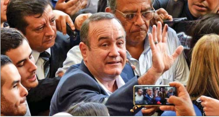
သမ္မတ ဂျီရာမာတီအား ရာထူးတာဝန်များကို ပွင့်လင်း မြင်သာစွာဖြင့် လွှဲပြောင်းပေးအပ်သွားမည်ဟု ကတိပြု ခဲ့သည်။ ဂြိုဟ်မာလာနိုင်ငံအား ဖြတ်ကျော်ကာ ဝါရှင်တန်သို့ နိုင်ငံရေးခိုလှုံခွင့်တောင်းခံသော ဟွန်ဒူးရပ်စ်နှင့် ဆယ်ဗာဒိုရန်

ဂြိုဟ်မာလာစီးတီး ဩဂုတ် ၁၂ ဂြိုဟ်မာလာနိုင်ငံသမ္မတ ရွေးကောက်ပွဲတွင် ကွန်ဆာ ပေးတစ် အလီဂျန်ဒရို ဂျီရာမာတီက ယခင်သမ္မတကတော် ဟောင်း ဆန်ဒရာတော်ရက်စ်အား မဲအပြတ်အသတ်ဖြင့် အနိုင်ရရှိခဲ့ကြောင်း ရွေးကောက်ပွဲအဖွဲ့က ယနေ့ ပြောကြားခဲ့သည်။