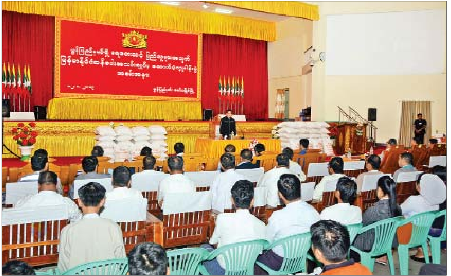
ဒုတိယသမ္မတ ဦးဟင်နရီဗန်ထီးယူ မွန်ပြည်နယ် ရေဘေးသင့်ပြည်သူများအတွက် မြန်မာနိုင်ငံ ဆန်စပါးအသင်းချုပ်မှ ထောက်ပံ့လှူဒါန်းပွဲအခမ်းအနားတွင် အမှာစကားပြောကြားစဉ်။

ဆက်လက်၍ ငွေကျပ် သိန်း ၂၀၀ နှင့် ဓာတ်မြေဩဇာအိတ် ၃၇၀ ကို ပေးအပ် လှူဒါန်းရာ မွန်ပြည်နယ်ဝန်ကြီးချုပ်နှင့် ဒုတိယဝန်ကြီး ဦးစိုးအောင်တို့က လက်ခံရယူ သည်။