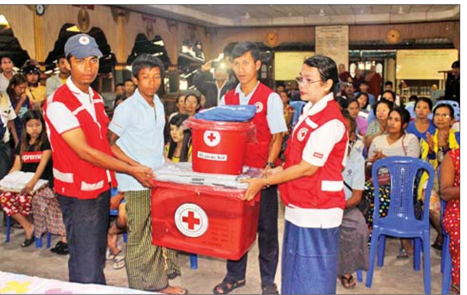
အိမ်ဆောက်ပစ္စည်း၊ မိသားစုသုံး အမျိုးသမီးသုံးပစ္စည်း၊ ခြောက်စုံ ကြောင်း သိရသည်။ ပစ္စည်း၊ တစ်ကိုယ်ရေသုံးပစ္စည်း၊ သွားရောက်ထောက်ပံ့ပေးအပ်ခဲ့ကြ နိုင်ထူး ( မြိတ် ပြန်/ဆက်)

အမျိုးသမီးသုံးပစ္စည်း တစ်စုံစီ ထောက်ပံ့ပေးအပ်ခဲ့ကြပြီး ကမ်းရိုး တန်းဒေသ တိုင်းစစ်ဌာနချုပ်က ထမင်းဘူး၊ ခေါက်ဆွဲခြောက်၊ လက်ဖက်ရည်ထုပ်၊ ရေသန့်တို့ကို တာဝန်ရှိသူများက ထောက်ပံ့ပေးအပ် ခဲ့ကြသည်။ အလားတူ တောင်မြေပြို၍ နေအိမ် ပျက်စီးခဲ့သည့် ပြင်းငယ်ကျေးရွာ ရှိ နေအိမ်ခြောက်လုံးအတွက် ဘေး အန္တရာယ်ဆိုင်ရာ စီမံခန့်ခွဲမှုဦးစီးဌာန က ထောက်ပံ့သည့် ကယ်ဆယ်ရေး ပစ္စည်း ၁၅ မျိုး၊ ခြောက်စုံ အိမ်ဆောက် ပစ္စည်းဖိုး ထောက်ပံ့ငွေကျပ် ကိုးသိန်း၊ ပြောင်းရွှေ့နေထိုင်သူ အားလုံးအတွက် ဆန်ဖိုးထောက်ပံ့ငွေ ကျပ် ၂၆၀၄၀၀ နှင့် မြန်မာနိုင်ငံ ကြက်ခြေနီအသင်းက ထောက်ပံ့သည့်