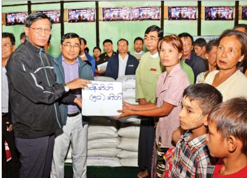
ဒုတိယသမ္မတ ဦးဟင်နရီပန်ထီးယူ ရေးမြို့ပြည်သူ့အားကစားရုံ၌ ဖွင့်လှစ်ထားသည့် ယာယီကယ်ဆယ်ရေးစခန်းရှိ ရေဘေးသင့်ပြည်သူများအတွက် ဆန်အိတ်များ ထောက်ပံ့ပေးအပ်စဉ်။