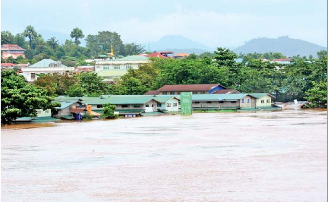
ဒုတိယသမ္မတ ဦးဟင်နရီပန်ထီးယူနှင့်အဖွဲ့ ရေးမြစ် ကမ်းနားတစ်လျှောက် လူနေအိမ်နှင့် အဆောက်အအုံများ ရေကြီးနစ်မြုပ်နေမှုကို ကြည့်ရှုစဉ်။