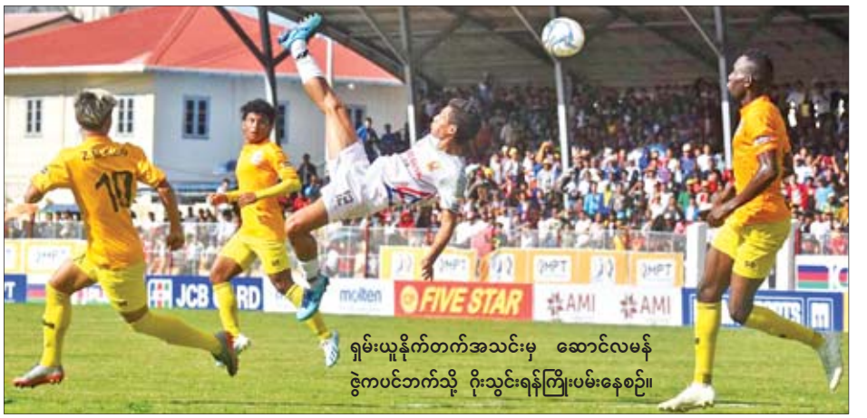
ရှမ်းယူနိုက်တက်အသင်းမှ ဆောင်လမန် ဇွဲကပင်ဘက်သို့ ဂိုးသွင်းရန်ကြိုးပမ်းနေစဉ်။