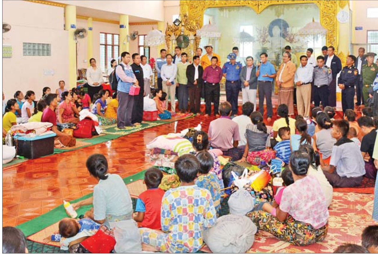
ဒုတိယသမ္မတ ဦးဟင်နရီပန်ထီးယူ ရေးမြို့ရှိ အနန္တဇီနတပလ္လင်နှစ်ဆူ စေတီတော်အရိယာသစ္စာဓမ္မာရုံ၌ ယာယီဖွင့်လှစ်ထားသည့် ကယ်ဆယ်ရေးစခန်းရှိ ရေဘေးသင့်ပြည်သူများအား အားပေးစကားပြောကြားစဉ်။

ငွေများနှင့် လူတစ်ဦးလျှင် တစ်ပတ်စာ ဆန်ရိက္ခာ၊ ခေါက်ဆွဲခြောက်ထုပ်များနှင့် ငါးသေတ္တာဘူးများ ထောက်ပံ့ပေးအပ်၍ မန္တလေးမဟာစည်ရိပ်သာဝင်းအတွင်းမှ ရေးမြစ်ကမ်းနားတစ်လျှောက် လူနေအိမ်နှင့် အဆောက်အအုံများ ရေကြီးနှစ်မြုပ်နေမှုကို ကြည့်ရှုသည်။