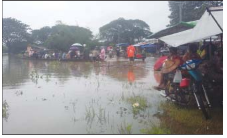
လမ်း၊ တံတားရေကျော်နှစ်မြုပ်ခြင်းကြောင့် ပြည်သူများမှာ စက်လှေများဖြင့် အခကြေး မော်တော်ကားများ ဖြတ်သန်းသွားလာမှု ငွေပေးကာ ခက်ခဲစွာသွားလာနေကြောင်း ပြတ်တောက်ခဲ့ပြီး ဆိုင်ကယ်နှင့် ခရီးသွား သိရသည်။ ကိုမျိုး(ဖေမြေ)

ကရင်ပြည်နယ် ကော့ကရိတ်ခရိုင် ကြာအင်း ဆိပ်ကြီးမြို့တွင် ဩဂုတ် ၁ ရက်မှစတင်ကာ မိုးသည်းထန်စွာ အဆက်မပြတ်ရွာသွန်းမှု ကြောင့် ဖိမြစ်ရေလျှံကာ တံတားနှင့် ကားလမ်းများ ရေကျော်နှစ်မြုပ်ခြင်းကြောင့် လမ်းခရီးသွားလာရေး ခက်ခဲလျက်ရှိ ကြောင်း သိရသည်။ အဆိုပါ လမ်း၊ တံတားများ ရေကျော် နှစ်မြုပ်မှုကြောင့် ကြာအင်းဆိပ်ကြီးဘုရား သုံးဆူ ကားလမ်းပေါ်ရှိ ချောင်းဝတံတား ရေကျော်နှစ်မြုပ်ခြင်း၊ ကြာအင်းဆိပ်ကြီး မုဒုံ-မော်လမြိုင်ကားလမ်းပေါ်ရှိ သံပုရာ ကျေးရွာ အောက်သယ်နန်းချောင်း လမ်း၊ တံတားရေကျော်ခြင်း၊ ကော့ကမာကျေးရွာ