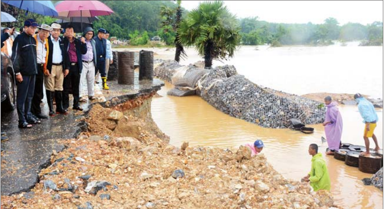
ဒုတိယသမ္မတ ဦးဟင်နရီပန်ထီးယူနှင့်အဖွဲ့ မော်လမြိုင်-သံဖြူဇရပ်-ရေး ကားလမ်း လမ်းပိုင်းပျက်စီးနေမှုအား ပြင်ဆင်ဆောင်ရွက်နေမှုအခြေအနေများကို ကြည့်ရှုစစ်ဆေးစဉ်။

ယင်းနောက် ဒုတိယသမ္မတနှင့်အဖွဲ့သည် ရေးမြို့ မန္တလေးမဟာစည်ရိပ်သာတွင် ယာယီဖွင့်လှစ်ထားသည့် ကယ်ဆယ်ရေးစခန်းသို့ သွားရောက်ကာ ရေဘေးသင့် ပြည်သူများနှင့် တွေ့ဆုံအားပေးစကားပြောကြားပြီး ထောက်ပံ့