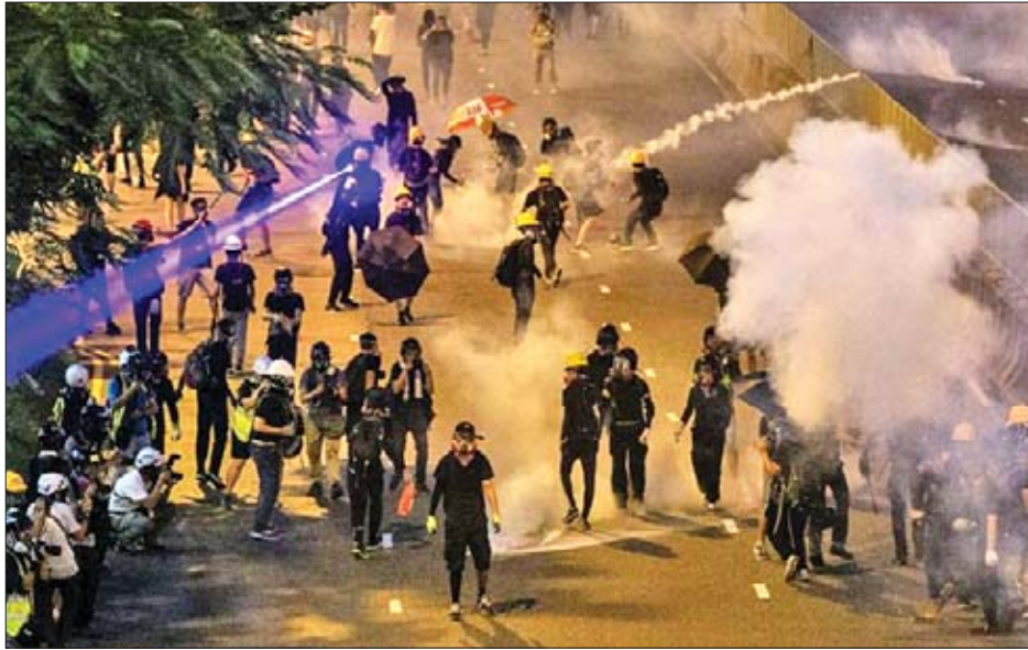
ကာရီလမ်နှင့်တွေ့ဆုံကာ မကြာသေးမီက ဖြစ်ပွားခဲ့သည့် အဓိကရုဏ်းများနှင့်ပတ်သက်ပြီး လွတ်လပ်သော စုံစမ်းစစ်ဆေးမှုများ ပြုလုပ်ရန် လိုအပ်သည်ဟု ပြောကြားခဲ့သည်။ ဩဂုတ် ၁၀ ရက်တွင် တရုတ်နိုင်ငံခြားရေးဝန်ကြီးဌာန ပြောရေးဆိုခွင့်ရှိသူ ဟွာချွန်ယင်က ဗြိတိန်နိုင်ငံအနေဖြင့်

ဩဂုတ် ၉ ရက်က ဗြိတိန်နိုင်ငံခြားရေးဝန်ကြီး ဒိုမီနစ် ရက်ဘ်က ဟောင်ကောင်ဆန္ဒထုတ်ဖော်သူ ခေါင်းဆောင်