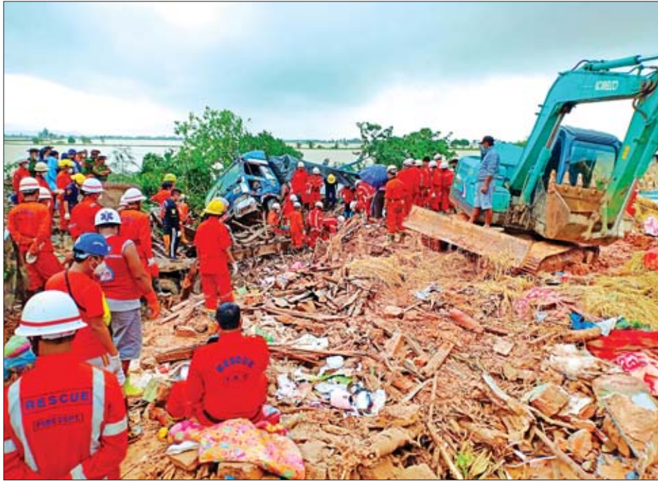
နိုင်တဲ့အနေအထားရှိခဲ့ပါတယ်။ အခုဆိုရင် ရှာဖွေ ကယ်ဆယ်ရေးအပိုင်ကို အဖွဲ့လိုက်နေရာချထားတဲ့ အခါကျ တော့ ပိုအဆင်ပြေသွားကြတာပေါ့” ဟု ၎င်းက ပြောသည်။ မြန်မာနိုင်ငံမီးသတ်တပ်ဖွဲ့(ဗဟို)ဌာနချုပ်မှ ခေတ်မီ စက်ကိရိယာပစ္စည်းအစုံအလင်ပါရှိသည့် ကားနှင့် မီးသတ် တပ်ဖွဲ့ဝင်များ၊ အထူးတပ်ဖွဲ့ဝင် ၁၂ ဦး၊ တပ်မတော်သားများ၊ လူမှုကူညီကယ်ဆယ်ရေးအသင်းများက သေဆုံးသူအလောင်း များ ရှိ မရှိ ခေတ်မီစက်ကိရိယာများဖြင့် ရှာဖွေနေကြောင်း

“ဒီနေ့ ည ၇ နာရီအထိဆိုရင် သေဆုံးသူအလောင်း ၅၃ လောင်းကို ရှာဖွေတွေ့ရှိခဲ့ပါတယ်။ အသက်ရှင်လျက် ဆိုလို မနေ့ညက ဆိတ်တစ်ကောင်နဲ့ နွားတစ်ကောင်တွေ တာပါ။ နောက်တစ်ခုက ဒေသခံတွေ လာပူးပေါင်းစေချင် တယ်။ ဘာဖြစ်လို့လဲဆိုတော့ ဒီနေရာမှာ ဘယ်သူရှိလဲ၊ ဘယ်သူနေထိုင်လဲ၊ ဘယ်လောက်ရှိလဲ အဲဒါတွေသိရင် ရှာဖွေရတာ ပိုအဆင်ပြေတာပေါ့။ သေဆုံးသူအလောင်း တွေလို့ရှိရင် ခက်ခက်ခဲခဲနဲ့ သေချာထုတ်ယူနေရတဲ့ အနေ အထား ရှိနေပါတယ်။ စဖြစ်တဲ့နေ့ကဆိုရင် အသက်ရှင် လျက် ကယ်ထုတ်နိုင်ခဲ့တဲ့ ၂၈ ဦးမြောက် အမျိုးသားတစ်ဦး ဆိုရင် ပရိဘောဂကားထဲမှာညပ်နေတယ်။ သူတို့မိသားစု က ကားစီးလာတယ်။ အမေတစ်ယောက်၊ သမီး တစ်ယောက်ကို ကယ်ထုတ်နိုင်တယ်။ အဲဒီအခါကိုကြီးကို မနက် ၈ နာရီ ကနေ ကယ်ထုတ်လိုက်တာ ညနေ ၆ နာရီ လောက်မှာမှ အသက်ရှင်လျက်နဲ့ ခက်ခက်ခဲခဲကယ်ထုတ်