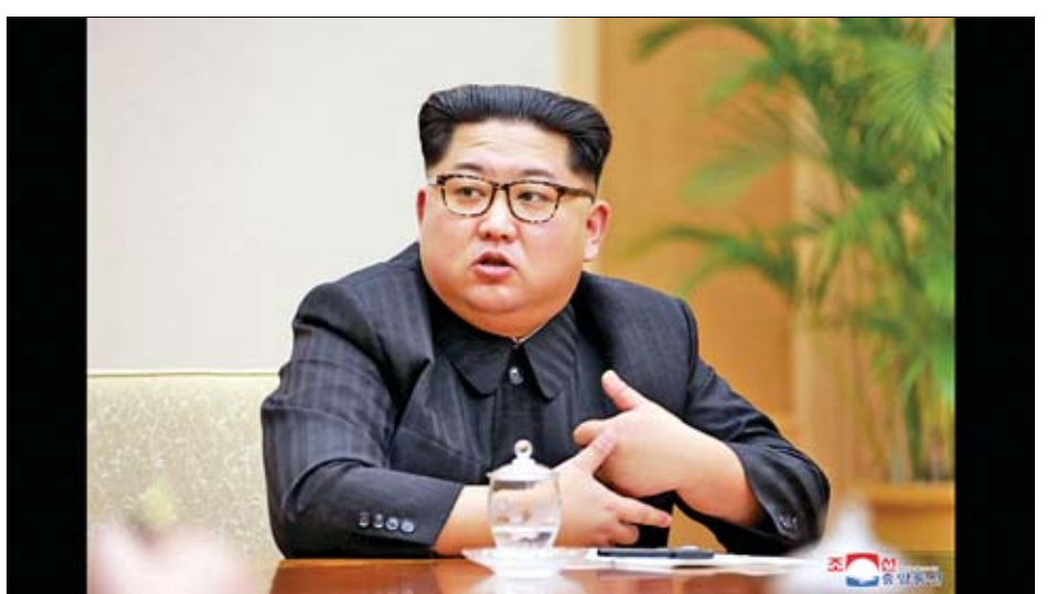
အဆုံးသတ်သောအခါ ၎င်း၏ ခုံးကျည် စမ်းသပ်မှုများကို တောင်ကိုရီးယားနှင့် အိတ်ဖွင့်စာထဲတွင် ဖော်ပြထားသည်ဟု ထရန်က တွစ်တာစာမျက်နှာပေါ်တွင် ရေးသားဖော်ပြထားကြောင်း သိရသည်။

ထို့ပြင် မြောက်ကိုရီးယားခေါင်းဆောင်သည် တာတိုပစ်ခုံးကျည်များ စမ်းသပ်မှုများနှင့်ပတ်သက်၍ သာမန်တောင်းပန်မှုတစ်ခု ပြုလုပ်ခဲ့ပြီး အမေရိကန်နှင့် တောင်ကိုရီးယားတို့၏ လက်ရှိပူးတွဲ စစ်ရေးလေ့ကျင့်မှု