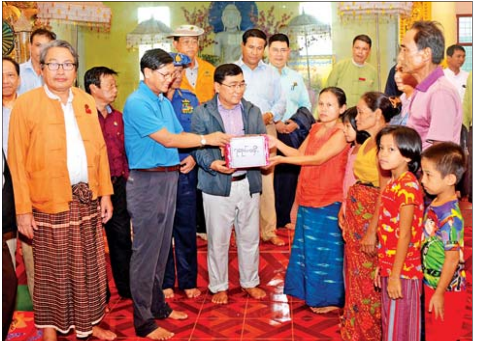
ဒုတိယသမ္မတ ဦးဟင်နရီပန်ထီးယူ ရေးမြို့ရှိ အနန္တဇီနတပလ္လင်နှစ်ဆူ စေတီတော်အရိယာသစ္စာဓမ္မာရုံ၌ ယာယီဖွင့်လှစ်ထားသည့် ကယ်ဆယ်ရေးစခန်းရှိ ရေဘေးသင့်ပြည်သူများအတွက် ထောက်ပံ့ငွေများ ပေးအပ်စဉ်။