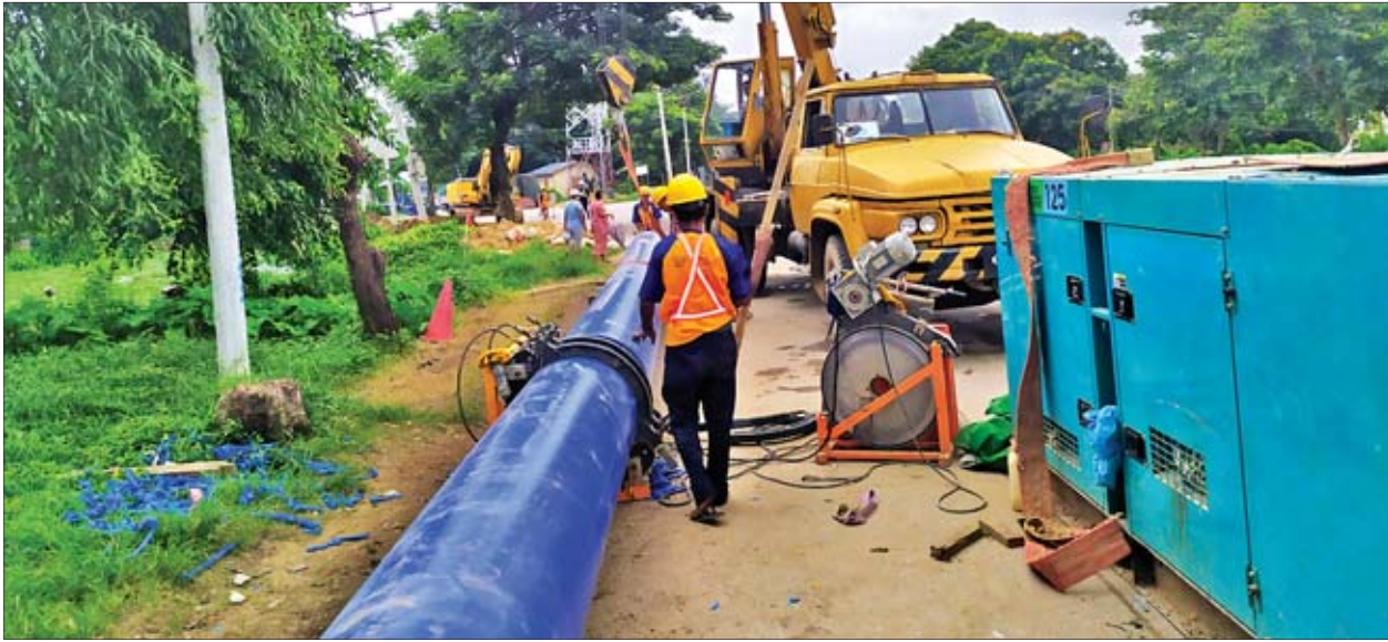
သာကေတမြို့နယ်နှင့် ဒေါပုံမြို့နယ်တို့သို့ ရေတိုးချဲ့ပေးဝေနိုင်ရေး ပိုက်လိုင်းများသွယ်တန်းခြင်းလုပ်ငန်းဆောင်ရွက်နေသည်ကို တွေ့ရစဉ်။