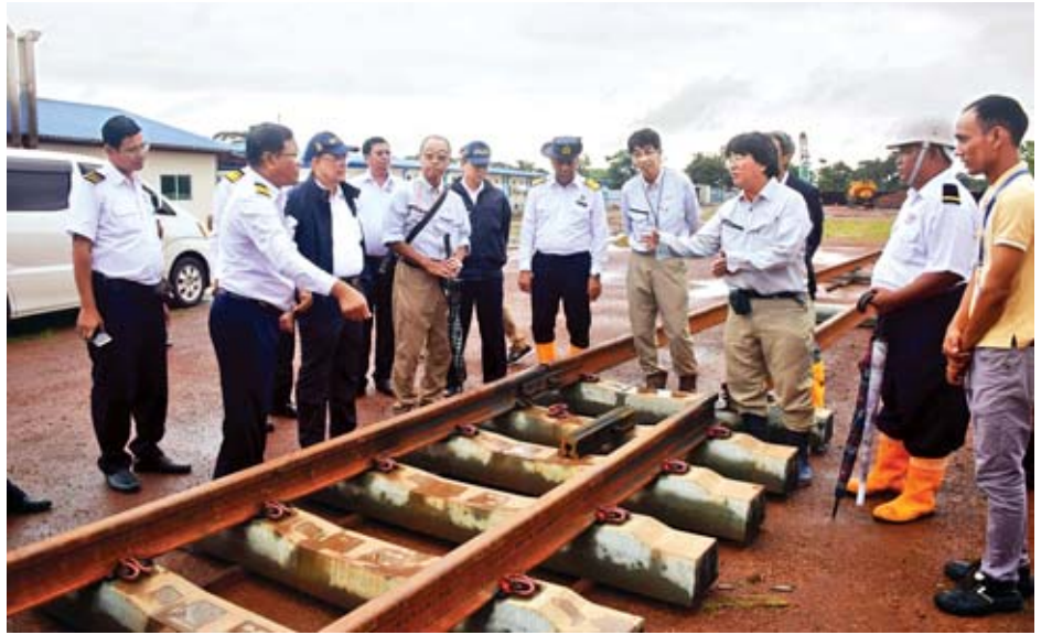
ကဒုတ်၊ ပဲခူး၊ ဒါးပိန်ဘူတာများနှင့် ရထားလမ်း ကြည့်ရှုစစ်ဆေးသည်။ တစ်လျှောက် ပြုပြင်ဆောင်ရွက်ထားရှိမှုများကို