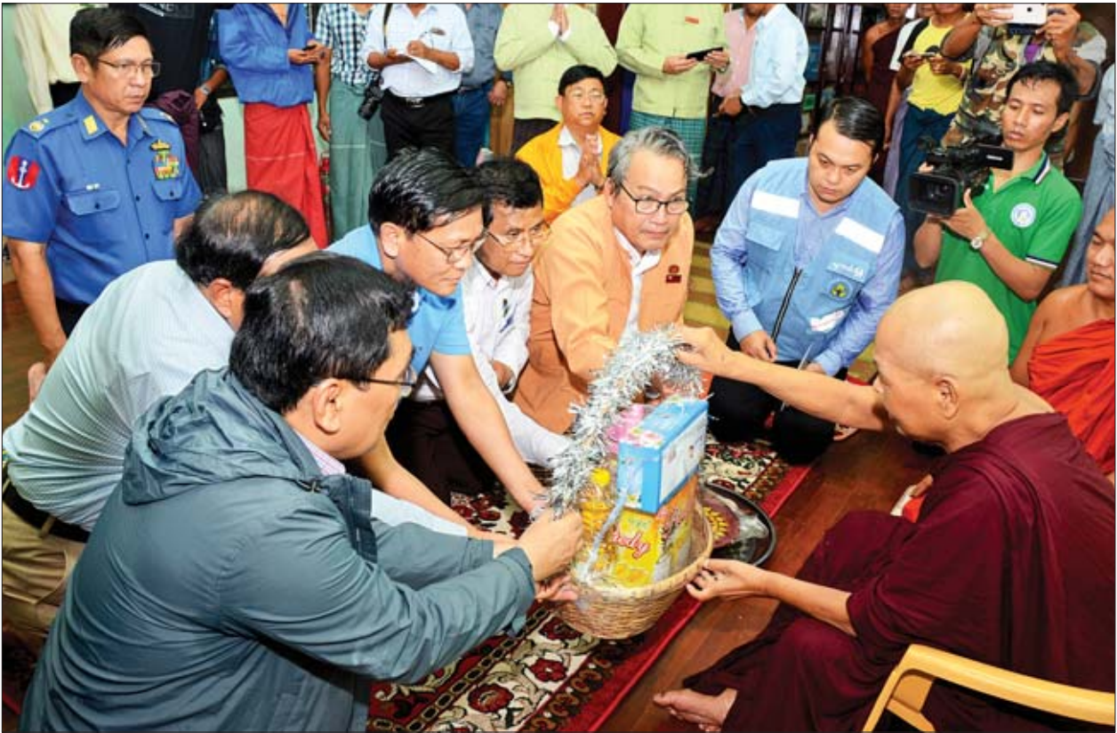
ဒုတိယသမ္မတ ဦးဟင်နရီပန်ထီးယူနှင့်အဖွဲ့ ရေးမြို့၊ မန္တလေးမဟာစည်ရိပ်သာကျောင်းတိုက်ဆရာတော် ဘဒ္ဒန္တ သုဒ္ဓရအား ဝတ္ထုငွေနှင့် လှူဖွယ်ပစ္စည်းများ ဆက်ကပ်လှူဒါန်းစဉ်။

အစည်းအဝေးတွင် ဒုတိယသမ္မတက သဘာဝဘေးစီမံခန့်ခွဲမှုကော်မတီ များကို ဖွဲ့စည်းထားရာတွင် လုပ်ငန်းတာဝန်အတိုင်း လက်တွေ့ကျကျ ထိထိ ရောက်ရောက် အကောင်အထည်ဖော် ဆောင်ရွက်နိုင်ရန် လိုအပ်ပါကြောင်း၊ ရာသီဥတုဖောက်ပြန်ပြောင်းလဲမှုသည် မြန်မာနိုင်ငံတွင်သာမက တစ်ကမ္ဘာလုံး တွင် ဆိုးဆိုးရွားရွား ခံစားနေကြရသည်ဖြစ်ရာ ကြိုတင်ပြင်ဆင်မှု အားကောင်းရန် လိုအပ်ပါကြောင်း၊ ဇာတ်တိုက်လေ့ကျင့်မှုများပြုလုပ်ခြင်းဖြင့် ထိခိုက်ဆုံးရှုံးမှု နည်းနိုင်သည်ကို ပြည်သူများ သိရှိပြီး ဝိုင်းဝန်းပူးပေါင်းဆောင်ရွက်ရန် လိုအပ်ပါ ကြောင်း၊ ရှာဖွေကယ်ဆယ်ရေးနှင့် ကူညီကယ်ဆယ်ရေးလုပ်ငန်းများအတွက် လိုအပ်သော ပစ္စည်းကိရိယာများနှင့် ယာဉ်ယန္တရားများကို ပိုမိုဖြည့်ဆည်း နိုင်ရေး ဆောင်ရွက်သွားမည်ဖြစ်ကြောင်း၊ ရေပြန်ကျပါကလည်း ပြန်လည် ထူထောင်ရေးလုပ်ငန်းများကို အင်တိုက်အားတိုက် ဆက်လက်ဆောင်ရွက်နိုင် ရေးကြိုတင်စီမံထားရန် လိုအပ်ပါကြောင်း၊ ရေကြီးနစ်မြုပ်မှုကြောင့် စိုက်ပျိုးရေး အတွက် ထိခိုက်ဆုံးရှုံးမှုများကို ပြန်လည်ကုစားနိုင်ရေးအတွက် လိုအပ်သည့် မျိုးစပါးများကို ကြိုတင်စုဆောင်းထားရန် လိုအပ်ပါကြောင်း၊ ဆက်သွယ်ရေး ကွန်ရက်နှင့် လမ်း၊ တံတား ပျက်စီးမှုများကိုလည်း အမြန်ဆုံးပြန်လည်ပြင်ဆင် သွားရန် လိုအပ်ပါကြောင်း ပြောကြားသည်။