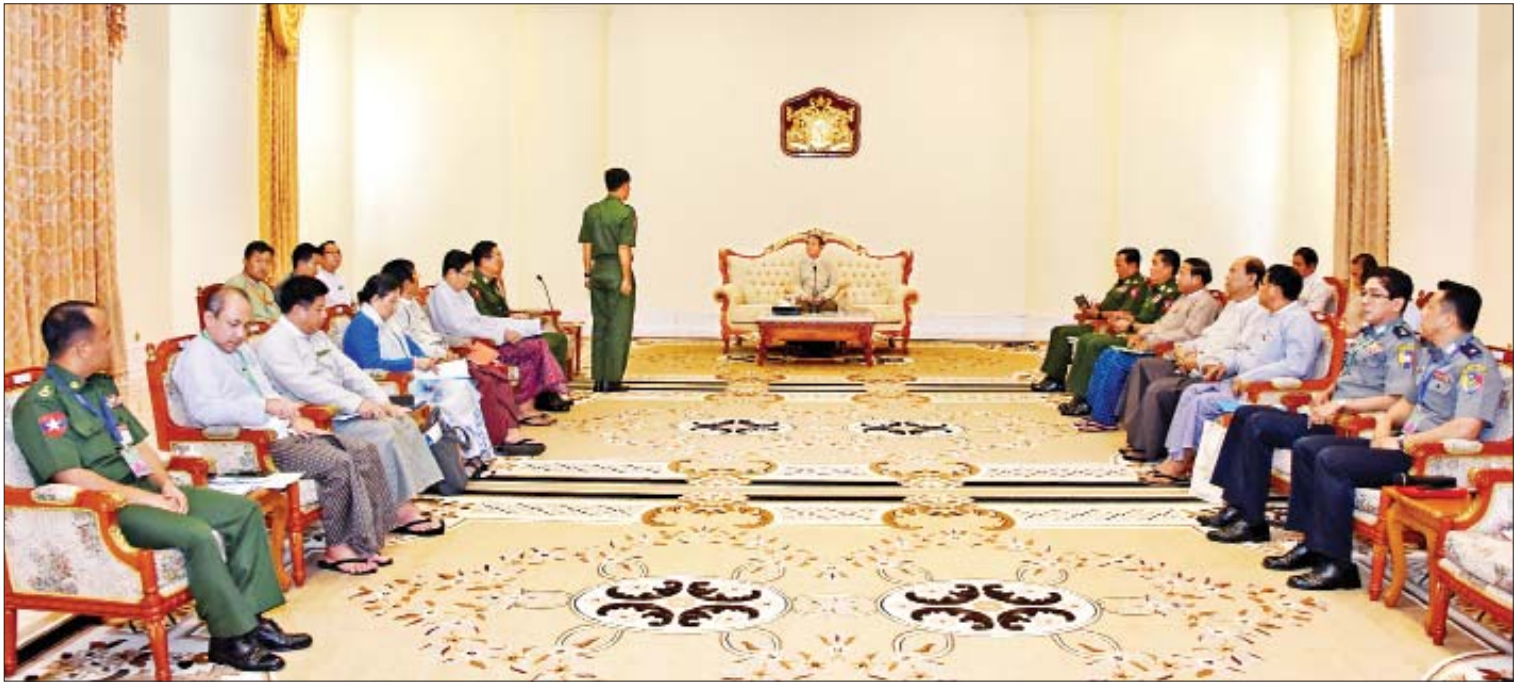
နိုင်ငံတော်သမ္မတ ဦးဝင်းမြင့်အား မူးယစ်ဆေးဝါးနှင့် စိတ်ကိုပြောင်းလဲစေသောဆေးဝါးများအန္တရာယ် တားဆီးကာကွယ်ရေးဗဟိုအဖွဲ့ဥက္ကဋ္ဌ ပြည်ထဲရေးဝန်ကြီးဌာန ပြည်ထောင်စုဝန်ကြီး ဒုတိယဗိုလ်ချုပ်ကြီးကျော်ဆွေက လုပ်ငန်းဆောင်ရွက်မှုအခြေအနေများကို ရှင်းလင်းတင်ပြစဉ်။

၂၀၁၈ ခုနှစ်မှ ၂၀၁၉ ခုနှစ် ဇူလိုင်လအထိ မူးယစ်ဆေးဝါးနှင့် ထိန်းချုပ်စာတုပစ္စည်းများ ဖမ်းဆီးရမိမှုအခြေအနေ၊ မူးယစ်ဆေးဝါး ထုတ်လုပ်သည့် စခန်းများ သိမ်းဆည်းရမိမှု အခြေအနေ၊ လက်နက်ခဲယမ်း ပါဝင်သော မူးယစ်ဆေးဝါး ဖမ်းဆီးရမိမှုအခြေအနေ၊ ပင်လယ်ပြင် ဖမ်းဆီးရမိမှုအခြေအနေ၊ ပင်လယ်ပြင်သို့ မူးယစ်ဆေးဝါးသယ်ဆောင် ရာလမ်းကြောင်းအခြေအနေ၊ မူးယစ်ဆေးဝါး သယ်ဆောင်ရာ လမ်းကြောင်းပြောင်းလဲလာ မှုအခြေအနေ၊ မူးယစ်ဆေးဝါးနှင့် စိတ်ကို ပြောင်းလဲစေသောဆေးဝါးများ အန္တရာယ် တားဆီးကာကွယ်ရေးဗဟိုအဖွဲ့ ရန်ပုံငွေရရှိ ရေး ဆောင်ရွက်မှုအခြေအနေ၊ ထိန်းချုပ်စာတု ပစ္စည်းစာရင်းတွင် ထည့်သွင်းရန် စီစဉ်ထား သည့် စာတုပစ္စည်းများ၊ မူးယစ်ဆေးဝါး ဥပဒေနှင့် နည်းဥပဒေပြင်ဆင်ခြင်း၊ လူမှု ဝန်ထမ်း၊ ကယ်ဆယ်ရေးနှင့် ပြန်လည်နေရာ ချထားရေးဝန်ကြီးဌာနသို့ လူငယ်များပြုစု ပျိုးထောင်ရေးစခန်းများ လွှဲပြောင်းပေးအပ်မှု အခြေအနေ၊ ကျောင်းသားလူငယ်များအား မူးယစ်ဆေးဝါးအန္တရာယ် အသိပညာပေး ဟောပြောမှုများ၊ နိုင်ငံတော်အစိုးရ၏ ရန်ပုံငွေ ဖြင့် ဆောင်ရွက်လျက်ရှိသည့် အစားထိုးဖွံ့ဖြိုး ရေးစီမံကိန်းဆောင်ရွက်မှု အခြေအနေတို့ကို ရှင်းလင်းတင်ပြသည်။ ဆက်လက်၍ မူးယစ်ဆေးဝါးနှင့် စိတ်ကို ပြောင်းလဲစေသော ဆေးဝါးများအန္တရာယ် တားဆီးကာကွယ်ရေးဗဟိုအဖွဲ့ တွဲဖက် အတွင်းရေးမှူး ရဲမှူးချုပ်ဝင်းနိုင်က မူးယစ် ဆေးဝါး တားဆီးနှိမ်နင်းရေးလုပ်ငန်းများ ဆောင်ရွက်နေမှုအခြေအနေနှင့် တွေ့ကြုံရ သည့် အခက်အခဲများကို ရှင်းလင်းတင်ပြသည်။