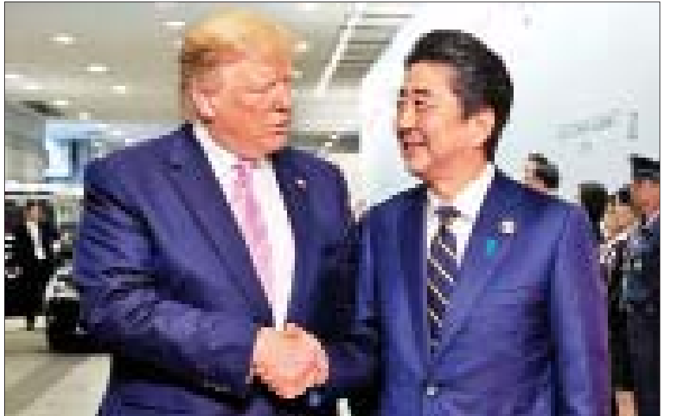
သည်ဟု ဂျပန်စီးပွားရေးဖွံ့ဖြိုးတိုးတက်မှုဆိုင်ရာ ဝန်ကြီး မိုတိုနိုက ဆိုသည်။

ဂျပန်နိုင်ငံအနေဖြင့် မော်တော်ကားဆက်စပ်ပစ္စည်း များ၊ စိုက်ပျိုးရေးထုတ်ကုန်များနှင့်ပတ်သက်ပြီး တင်ပို့ရာတွင် အလျော့ပေးမှု အခြောက်အမြားလုပ်ဆောင်ပေးရမည်ကို စိုးရိမ်ပူပန်မှုများ ရှိနေသည်။ သို့သော် ဩဂုတ်လ အစော ပိုင်းက အမေရိကန် ကုန်သွယ်ရေးဆိုင်ရာ ကိုယ်စားလှယ် ရောဘတ် လိုက်သီလာနှင့် တွေ့ဆုံဆွေးနွေးခဲ့ပြီးနောက် ဝါရှင်တန်ဘက်မှ အလျော့အတင်းပြုလုပ်ပေးနိုင်ဖွယ်ရှိ