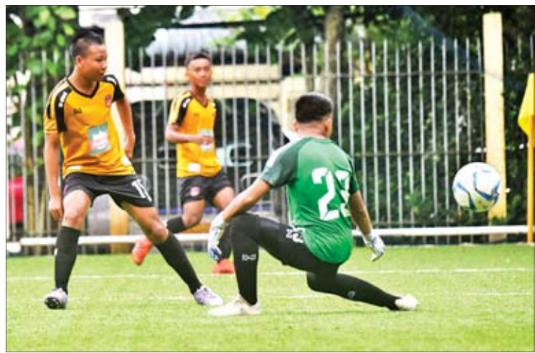
မြန်မာ ယူ-၁၅ အသင်း လေ့ကျင့်နေစဉ်။