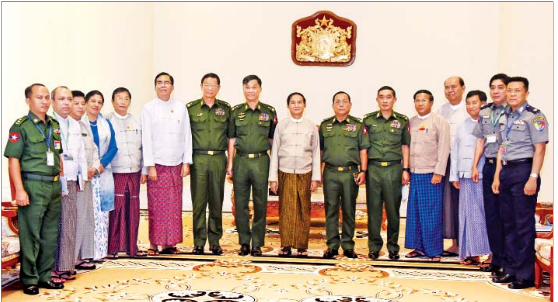
နိုင်ငံတော်သမ္မတ ဦးဝင်းမြင့် မူးယစ်ဆေးဝါးနှင့်စိတ်ကိုပြောင်းလဲစေသောဆေးဝါးများအန္တရာယ် တားဆီးကာကွယ်ရေးဗဟိုအဖွဲ့ ဥက္ကဋ္ဌ ပြည်ထဲရေးဝန်ကြီးဌာန ပြည်ထောင်စုဝန်ကြီး ဒုတိယဗိုလ်ချုပ်ကြီးကျော်ဆွေ၊ ဒုတိယဥက္ကဋ္ဌ နယ်စပ်ရေးရာဝန်ကြီးဌာန ပြည်ထောင်စုဝန်ကြီး ဒုတိယဗိုလ်ချုပ်ကြီးရဲအောင်နှင့် အဖွဲ့ဝင်များနှင့်အတူ စုပေါင်းမှတ်တမ်းတင်ဓာတ်ပုံရိုက်စဉ်။