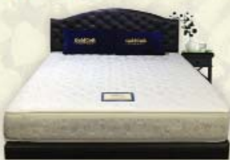
Model - Lavender Classic - Limited Stock - usual : 388,000-Ks NOW : 288000 Ks