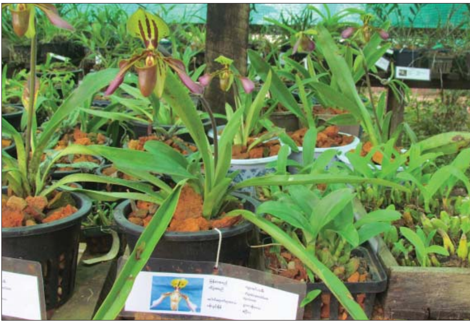
ကျားမင်းသမီးသစ်ခွ

မရောက်မီ ပန်နန်းဒင်နှင့် နောင်မွန်ကြား၌ UNESCO တွင် မှတ်တမ်းမတင်နိုင်သေးသည့် သဘာဝပေါက်ပင် များ၊ အင်းဆက်ပိုးမွှားများ၊ ငှက်များ၊ သဘာဝတောရိုင်း တိရစ္ဆာန်များရှိနေခြင်းကြောင့် ထိန်းသိမ်းကာကွယ်ရန် အလွန်အရေးကြီးပေသည်။