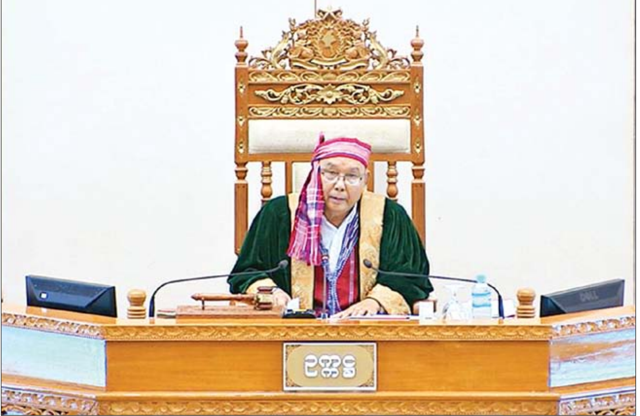
အမျိုးသားလွှတ်တော်ဥက္ကဋ္ဌ မန်းဝင်းခိုင်သန်း

အစည်းအဝေးတွင် တနင်္သာရီတိုင်းဒေသကြီး မဲဆန္ဒနယ် အမှတ်(၉)မှ ဦးကင်းရှိန်၏ တနင်္သာရီတိုင်းဒေသကြီးအတွင်းရှိ မြို့နယ် (၇)မြို့နယ်ရှိ အိမ်မွေး ဇီဝဇီဝများ မွေးမြူသူများကို နိုင်ငံတော်အစိုးရမှ မည်သည့်လတွင် စာချုပ်ချုပ်ဆိုပြီး မည်သည့်နှစ်တွင် အခွန်ငွေ စတင်ကောက်ယူမည်ကို သိရှိလိုခြင်း မေးခွန်းနှင့် ကရင်ပြည်နယ်မဲဆန္ဒနယ် အမှတ်(၁)မှ ဦးစောမိုးမြင့်(ခ) ဆင်မြူရယ်၏ မကြာခဏ ပေါက်ကွဲမှုဖြစ်ပေါ်လျက်ရှိပြီး လူအသေ အပျောက်ရှိသော မြေအောက်သတ္တုတွင်းလုပ်ကွက်များနှင့်စပ်လျဉ်း၍ သိရှိလိုသည့် မေးခွန်းတို့နှင့်စပ်လျဉ်း၍ သယံဇာတနှင့် သဘာဝပတ်ဝန်းကျင် ထိန်းသိမ်းရေးဝန်ကြီးဌာန ဒုတိယဝန်ကြီး ဒေါက်တာခဲမြင့်ဆွေက တနင်္သာရီ တိုင်းဒေသကြီးအတွင်းရှိ ဒေသခံပြည်သူများသည် ဝင်ငွေရရှိရန်နှင့် နိုင်ငံတော် အတွက် အခွန်ငွေများရရှိရန် ရည်ရွယ်၍ အိမ်မွေးငှက်သိုက်ထုတ်လုပ်ခြင်း လုပ်ငန်းကို စာချုပ်ချုပ်ဆို၍ လုပ်ထုံးလုပ်နည်းနှင့်အညီ ခွင့်ပြုဆောင်ရွက်လျက် ရှိပါကြောင်း၊ အိမ်မွေးငှက်သိုက်လုပ်ငန်းရှင်နှင့် တနင်္သာရီတိုင်းဒေသကြီး သစ်တောဦးစီးဌာန ညွှန်ကြားရေးမှူးတို့ စာချုပ်ချုပ်ဆို၍ အိမ်မွေးငှက်သိုက် လုပ်ငန်းကို ဆောင်ရွက်ခွင့်ပြုပါကြောင်း၊ နှစ်ဦးသဘာဝစာချုပ် ချုပ်ဆိုပြီးသည့် ငှက်သိုက်အိမ်များတွင် ငှက်သိုက်စွဲကပ်ထွက်ရှိသည့် ငှက်သိုက်အိမ်၊ ငှက်သိုက် အနည်းအကျဉ်းသာ စွဲကပ်သည် ငှက်သိုက်အိမ်နှင့် ဇီဝဇီဝများ လာရောက် သော်လည်း ငှက်သိုက်စွဲကပ်မှု မရှိသေးသည့် ငှက်သိုက်အိမ်တို့အသီးသီးရှိရာ စာချုပ်ချုပ်ဆိုပြီးပါက ငှက်သိုက်ထွက်ရှိမှုအပေါ် ဒေသပေါက်ဈေး၏ ၁၀ ရာခိုင်နှုန်းနှင့် အခွန်တော်ငွေ စတင်ကောက်ခံပါကြောင်း၊ ၂၅ ရာခိုင်နှုန်း အခွန် တော်ငွေကောက်ခံမှုမရှိပါကြောင်း၊ စာမျက်နှာ ၅ ကော်လံ ၁ သို့ *