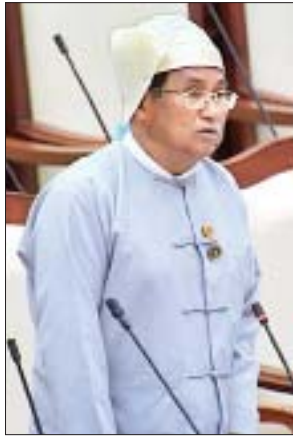
ဒုတိယဝန်ကြီး ဦးစိုးအောင်

မကူးစက်တတ်သောရောဂါများ ကာကွယ်တားဆီးရမည့်ကိစ္စရပ်များမှာ အခွန်အခများ တိုးမြှင့်ကောက်ခံခြင်း၊ ဌာနအသီးသီးက ပြဋ္ဌာန်းထားသည့် ဥပဒေ၊ နည်းဥပဒေများအတိုင်း လိုက်နာအောင် ဆောင်ရွက်ပေးခြင်း၊ ထိရောက်စွာ အရေးယူဆောင်ရွက်ခြင်းတို့သည် အရေးကြီးပါကြောင်း၊ အထူး