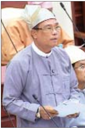
ဒုတိယဝန်ကြီး ဦးကျော်လင်း

မိုင်းရယ်-နားဝါလမ်းသည် အရှည် ၁၂ မိုင်ရှိ မြေသားလမ်းဖြစ်ပြီး ၂၀၁၈-၂၀၁၉ ဘဏ္ဍာရေးနှစ်တွင် ကျောက်လမ်း ၂ မိုင် ဆောင်ရွက်ခဲ့ပါကြောင်း၊ ၂၀၁၉-၂၀၂၀ ဘဏ္ဍာရေးနှစ် ပြည်ထောင်စုရန်ပုံငွေတွင် ကျောက်လမ်း ၃ မိုင် ၄ ဖာလုံနှင့် Box Culvert သုံးစင်းဆောင်ရွက်ရန် ထည့်သွင်းလျာထားပြီး ရန်ပုံငွေခွဲဝေရရှိမှုအပေါ်မူတည်၍ အကောင်အထည်ဖော် ဆောင်ရွက်ပေးသွားမည်ဖြစ်ပါကြောင်း။