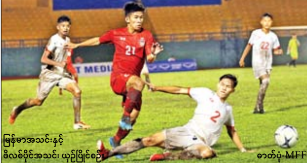
မြန်မာအသင်းနှင့် ဖိလစ်ပိုင်အသင်း ယှဉ်ပြိုင်စဉ်

မြန်မာအသင်း အမှားအယွင်းမရှိ နိုင်ငံပွဲဆက်နေပြီး ဂိုးပြတ်နိုင်ပွဲ ထပ်မံရယူ နိုင်ခဲ့သည်။ မြန်မာအသင်းသည် အကောင်းဆုံးပုံစံမရသေးသော်လည်း နှစ်ပွဲဆက် နိုင်ပွဲရယူနိုင်ခဲ့ခြင်းဖြစ်သည်။ မြန်မာအသင်းအနေဖြင့် နှစ်ပွဲကစား ခုနစ်ဂိုးသွင်းယူထားနိုင်သော်လည်း စာမျက်နှာ ၅ ကော်လံ ၁ သို့ ❖