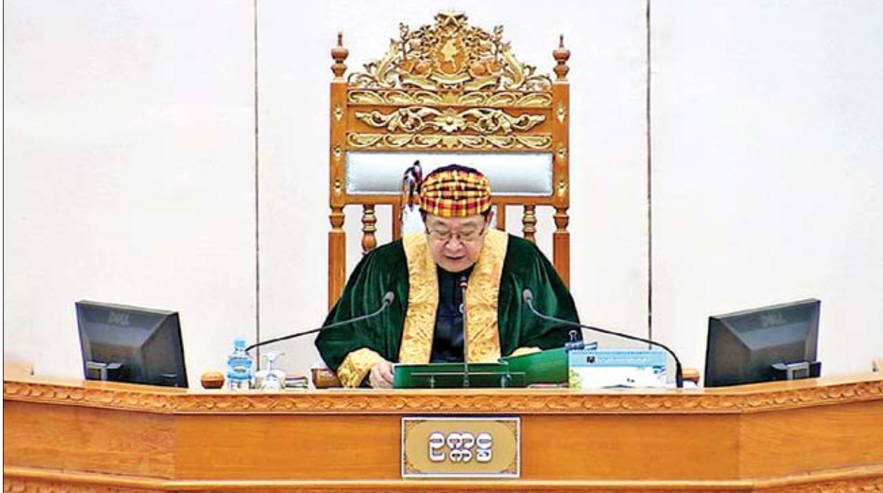
ပြည်သူ့လွှတ်တော်ဥက္ကဋ္ဌ ဦးတီခွန်မြတ်

နေပြည်တော် ဩဂုတ် ၈ ဒုတိယအကြိမ် ပြည်သူ့လွှတ်တော်(၁၃)ကြိမ်မြောက် ပုံမှန်အစည်းအဝေး နဝမနေ့ကို ယနေ့နံနက် ၁၀ နာရီတွင် နေပြည်တော်ရှိ လွှတ်တော်အဆောက် အအုံ ပြည်သူ့လွှတ်တော်အစည်းအဝေးခန်းမ၌ ကျင်းပသည်။ အစည်းအဝေးတွင် လေရိုးမဲဆန္ဒနယ်မှ ဦးကျော်ဌေး၏ “စစ်ကိုင်းတိုင်း ဒေသကြီးအစိုးရအဖွဲ့နှင့် နာဂကိုယ်ပိုင်အုပ်ချုပ်ခွင့်ရဒေသ အစိုးရအဖွဲ့တို့မှ ဒေသဖွံ့ဖြိုးရေးလုပ်ငန်းများ တင်ဒါခေါ်ယူခြင်း၊ စိစစ်ထုတ်ပြန်ပေးခြင်းများ ဆောင်ရွက်ရာတွင် အတယ်ကြောင့် နှောင့်နှေးကြန့်ကြာနေသည်ကို သိလိုခြင်း” မေးခွန်းနှင့်စပ်လျဉ်း၍ ဆောက်လုပ်ရေးဝန်ကြီးဌာန ဒုတိယဝန်ကြီး ဦးကျော်လင်းက စစ်ကိုင်းတိုင်းဒေသကြီး နာဂကိုယ်ပိုင်အုပ်ချုပ်ခွင့်ရဒေသ အတွင်း၌ ဝန်ကြီးဌာနများ၏ ခွင့်ပြုရန်ပုံငွေဖြင့် အကောင်အထည်ဖော်ဆောင်ရွက်သည့် ဒေသဖွံ့ဖြိုးရေးလုပ်ငန်းများကို တင်ဒါခေါ်ယူရာတွင် သက်ဆိုင်ရာ ပြည်ထောင်စုဝန်ကြီးဌာနများ၊ သက်ဆိုင်ရာဌာန တိုင်းဒေသကြီးရုံးများနှင့် နာဂကိုယ်ပိုင်အုပ်ချုပ်ခွင့်ရဒေသ ဦးစီးအဖွဲ့တို့တွင် နိုင်ငံတော်သမ္မတရုံး၏ (၁/၂၀၁၇) တင်ဒါစည်းမျဉ်းစည်းကမ်း၊ ညွှန်ကြားချက်များနှင့်အညီ တင်ဒါခေါ်ယူဆောင်ရွက်လျက်ရှိကြောင်း။ တင်ဒါ လုပ်ထုံးလုပ်နည်းများနှင့်အညီ ပွင့်လင်းမြင်သာမှုရှိစေရန် တင်ဒါစည်းကမ်းချက်များ၊ ဖွင့်ဖောက်စစ်ဆေးမည့် အစီအစဉ် အမှတ်ပေးစည်းမျဉ်းများ၊ ကြမ်းခင်းဈေးသတ်မှတ်ပုံစံများအား အတည်ပြုခြင်း၊ သက်ဆိုင်ရာဌာနများသို့ ညွှန်ကြားချက်များ ထုတ်ပြန်ခြင်း စသည့်လုပ်ငန်းများ အဆင့်ဆင့်ဆောင်ရွက် ရခြင်းတို့ကြောင့် စာမျက်နှာ ၄ ကော်လံ ၁ သို့ ၂