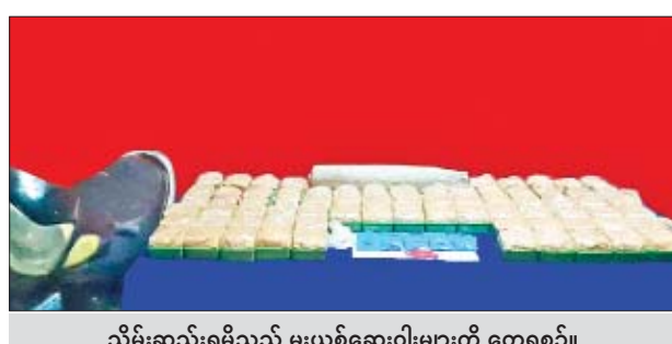
သိမ်းဆည်းရမိသည့် မူးယစ်ဆေးဝါးများကို တွေ့ရစဉ်။