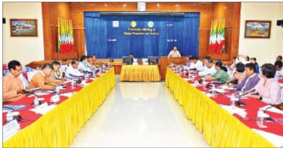
ပြည်ထောင်စုဝန်ကြီး ဒေါက်တာမြင့်ထွေး ခွေးရူးပြန်ရောဂါ ကာကွယ်ထိန်းချုပ်ရေးအတွက် နီးနွယ်ဆက်စပ် အဖွဲ့အစည်းများပါဝင်သည့် ညှိနှိုင်းအစည်းအဝေးတွင် အမှာစကားပြောကြားစဉ်။

ဆက်လက်၍ လူများတွင် ခွေးရူးပြန်ရောဂါကူးစက်ဖြစ်ပွားမှု ပပျောက်ရေးမဟာဗျူဟာနှင့်ပတ်သက်၍ ရှေ့ဆက်ဆောင်ရွက်မည့်လုပ်ငန်းများကို တက်ရောက်လာကြသူများက ပိုင်းဝန်းဆွေးနွေးအကြံပြုမှုများ ဆောင်ရွက်ခဲ့ကြကြောင်း သိရသည်။ သတင်းစဉ်