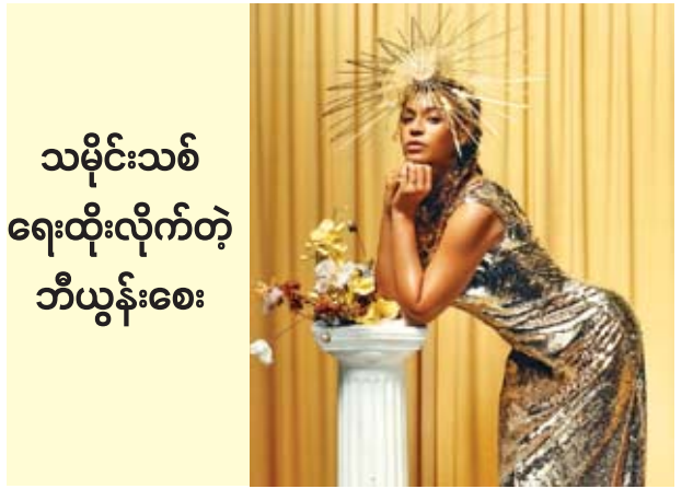
သမိုင်းသစ် ရေးထိုးလိုက်တဲ့ ဘီယွန်းစေး

ကျော်ကြားတဲ့ အမေရိကန်ပေါ့ပီပွင့်ဟာ သူ့ရဲ့တေးသီချင်းသစ်ကို ပြီးခဲ့တဲ့ အင်္ဂါနေ့က လူမှုကွန်ရက်မီဒီယာပေါ်မှာ စမ်းသပ်ထုတ်လွှင့်ခဲ့ပြီး ဩဂုတ် ၈ ရက်မှာတော့ ဟောလိဝုဒ်မှာပြုလုပ်ခဲ့တဲ့ “Capitol Congress” အခမ်းအနားကို တက်ရောက်ခဲ့ကြောင်း မေးလ်အွန်လိုင်းဒေါ့ကွန်းရဲ့ ရေးသားဖော်ပြချက်တွေအရ သိရပါတယ်။ နှစ်စဉ်ကျင်းပမြဲဖြစ်တဲ့ တေးဂီတနဲ့ပတ်သက်ပြီး အခမ်းအနားတစ်ခုဖြစ်တဲ့ “Capitol Congress” ကို ဩဂုတ် ၈ ရက်မှာ ပြုလုပ်ခဲ့ရာမှာတော့ ကျော်ကြားတဲ့ တေးသံရှင်တွေများစွာ တက်ရောက်ခဲ့တာကိုလည်း တွေ့ရပါတယ်။ ယခုနှစ်အခမ်းအနားဟာ (၆) ကြိမ်မြောက်ပြုလုပ်တဲ့ အခမ်းအနားဖြစ်ပြီး ဒီအခမ်းအနားမှာ တေးသီချင်းသစ်တွေကို ကြိုထုတ်လွှင့်မှုတွေ ပြုလုပ်ခဲ့သလို တေးဂီတနဲ့ပတ်သက်တဲ့ အစီအစဉ်သစ်တွေကို မိတ်ဆက်ခဲ့တယ်လို့လည်း သိရပါတယ်။ ဒီအခမ်းအနားကို ကတ်တီပါရီက နွေရာသီနဲ့လိုက်ဖက်တဲ့ ဖက်ရှင်မျိုး ဝတ်ဆင်တက်ရောက်ခဲ့တာကိုလည်း တွေ့ရပါတယ်။ ပန်းပွင့်ဒီဇိုင်းနဲ့ ဂါဝန်ရှည်ကိုဝတ်ဆင်ခဲ့ပြီး မျက်နှာကိုလည်း ပန်းရောင်ခြယ်သထားတာကိုလည်း တွေ့ရပါတယ်။ ပြီးခဲ့တဲ့ သီတင်းပတ်အတွင်းမှာ ၂၀၁၃ ခုနှစ်အတွင်း ထုတ်လွှင့်ခဲ့တဲ့ ကတ်တီပါရီရဲ့ တေးသီချင်း “Dark Horse” ဟာ ရက်ပဲတေးသီချင်းတစ်ပုဒ်ရဲ့ သံစဉ်ပိုင်းဆိုင်ရာကို ကူးချခဲ့တာဖြစ်ကြောင်း တရားရုံးကဆုံးဖြတ်ခဲ့တာကြောင့် ပေါ့ပီပွင့်ဟာဒဏ်ငွေတွေလည်း ပေးဆောင်ခဲ့ကြောင်း သိရပါတယ်။