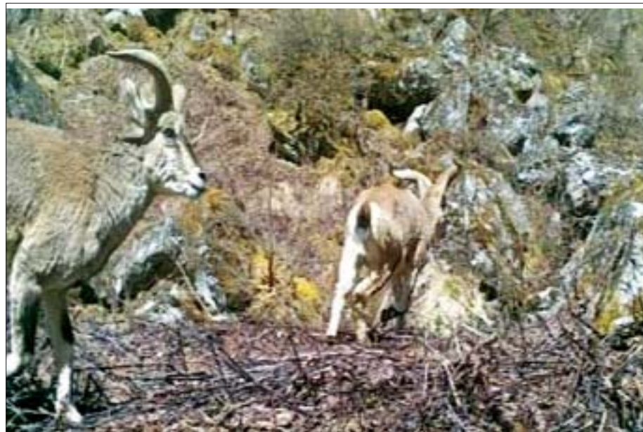
ရေခဲတောင်ဆိတ်

ပူတာအိုပတ်ဝန်းကျင်တွင်ရှိသည့် ပူတာအိုအစ ပူတောင်းကဟု ထင်ရှားကျော်ကြားခဲ့သည့် ပူတောင်း ကျေးရွာ၊ ရာဇဝင်ထဲက ကျောက်ဖြစ်သွားသည် ကျောက် နဂါး၊ ကောင်းမှုလုံစေတီတော်နှင့် ကြိုးတံတား၊ မလိခမြစ်ပေါ်တွင် တည်ဆောက်ထားသည့် မလိခ မြစ်ကူးတံတား၊ မုလာရီးဒီကြိုးတံတား၊ မလိခမြစ် အတွင်းတည်ရှိသည့် နတ်ကျွန်း စသည့်အထင်ကရ နေရာများကိုလည်း သွားရောက်လည်ပတ်နိုင်ပါကြောင်း တင်ပြအပ်ပါသည်။ ။