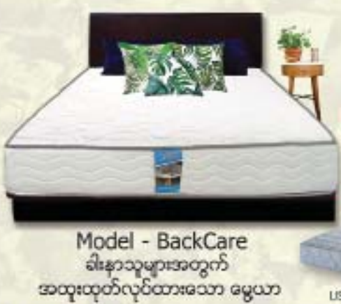
Model - BackCare မီးနာသုများအတွက် အထူးထုတ်လုပ်ထားသော မွေယာ